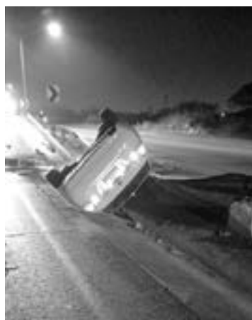
VOLCÓ OTRO corralón en el Corredor Urbano.

La volcadura de un automóvil dejó como saldo a una persona y daños materiales estimados en mas de 85 mil pesos. El lesionado, fue trasladado al área de urgencia de un hospital de la ciudad, en donde quedó internado. De acuerdo con el diagnostico preliminar, se sospecha que el herido presentaba contusiones severas. El accidente se registró aproxima-