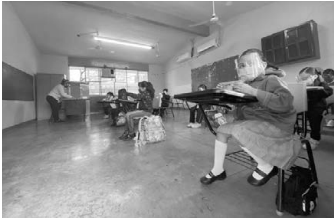
ESCUELAS DE DIFERENTES niveles regresaron a la actividad.

“Yo considero que debe de andar en un 70 por ciento los alumnos que ya deben de estar en clases presenciales de casi 1 millones de alumnos de todos los niveles”, aseguró Elizondo Salazar.