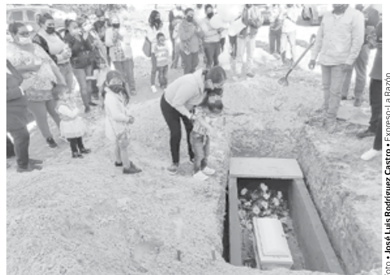
HOY SE presentará la madre ante la Fiscalía.

La abuela, fue la encargada de denunciar ante la opinión pública los hechos registrados durante días anteriores, cuando manifestó afectaciones en su salud que podían relacionarse con el posible nacimiento de la pequeña bebe.