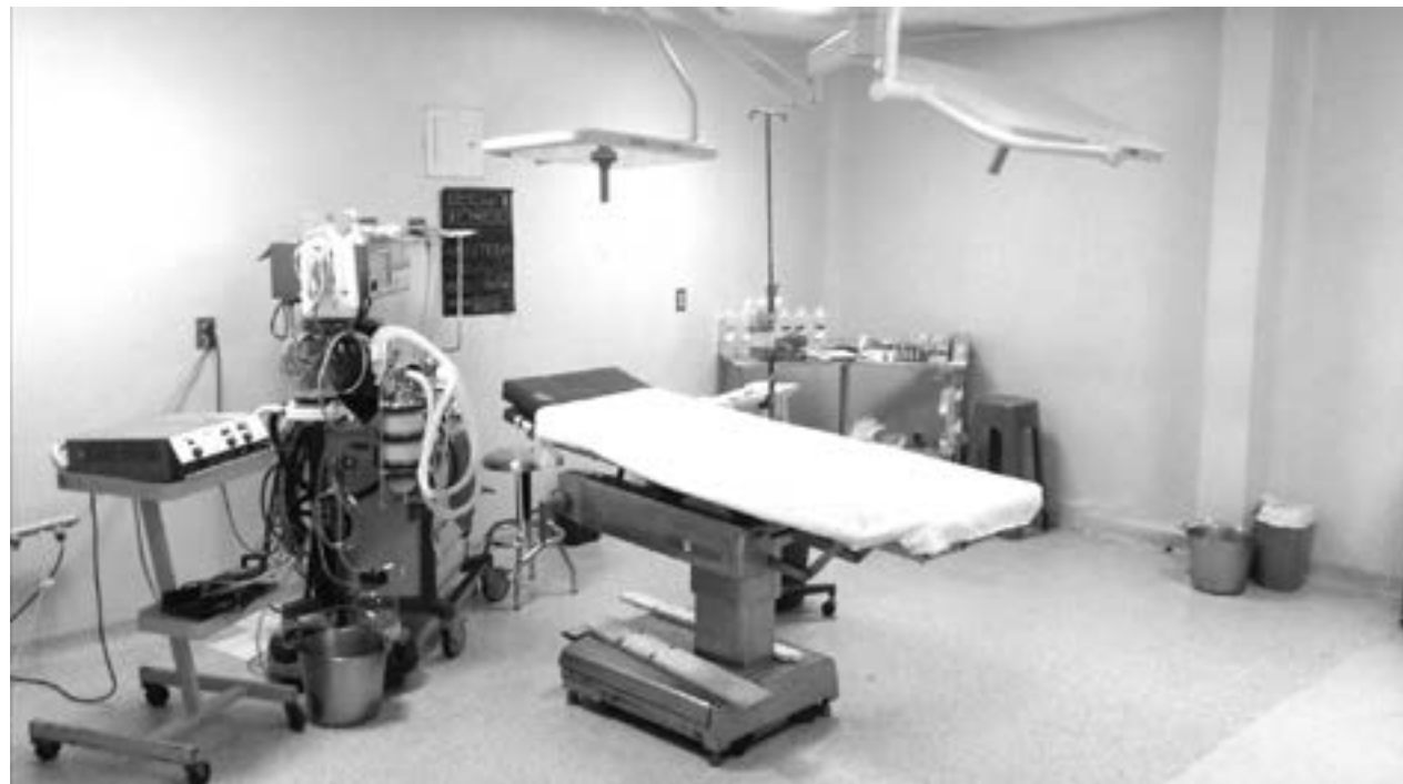
EL HOSPITAL se quedó sin energía eléctrica.

“Puede ser que haya una mayor conciencia que reconocer a un hijo,