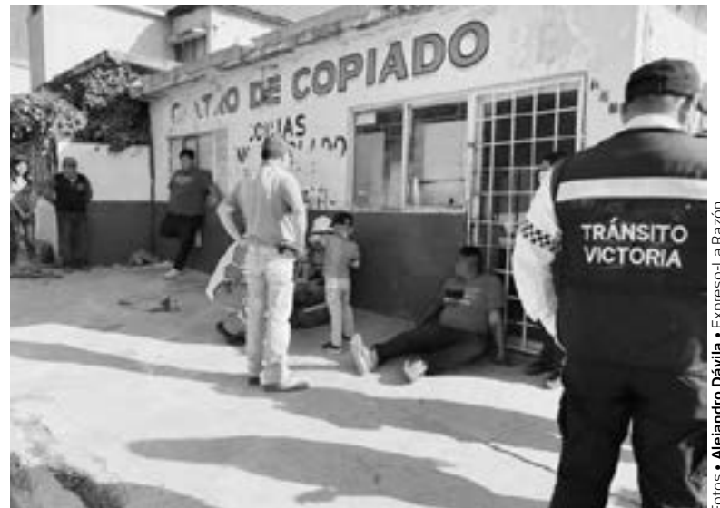
CORRIERON con suerte: solo sufrieron golpes leves

A través de los datos recabados, se pudo establecer que los heridos iban a bordo de una mo-