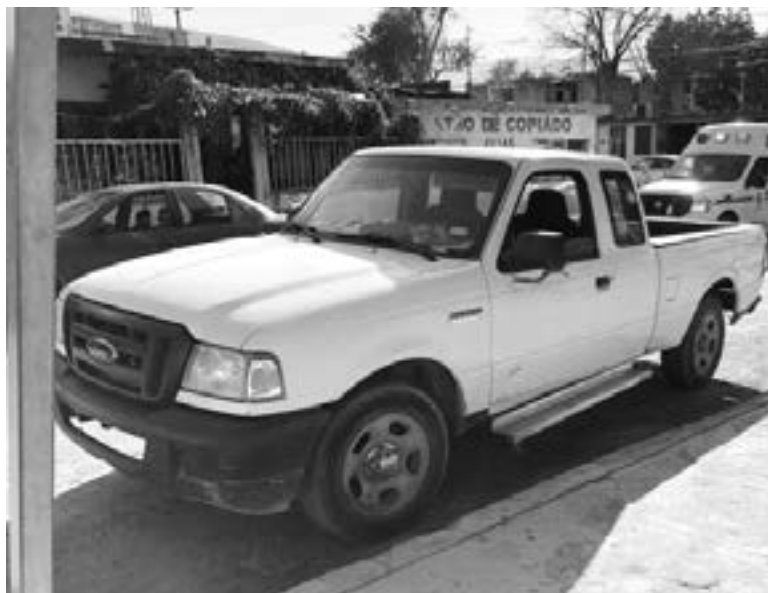
LA CAMIONETA hacía maniobras de reversa

Los hechos se registraron a las 4 de la tarde, sobre la calle Asentamientos Humanos y