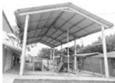
EN MALAS condiciones la techumbre del kínder.

“La escuela tiene casi 40 años, la mufa se cayó y se reparó con el pago de las cuotas, pero hay que construir un muro y el dinero no alcanzó, se hizo de manera provisional y los cables ahí están”.