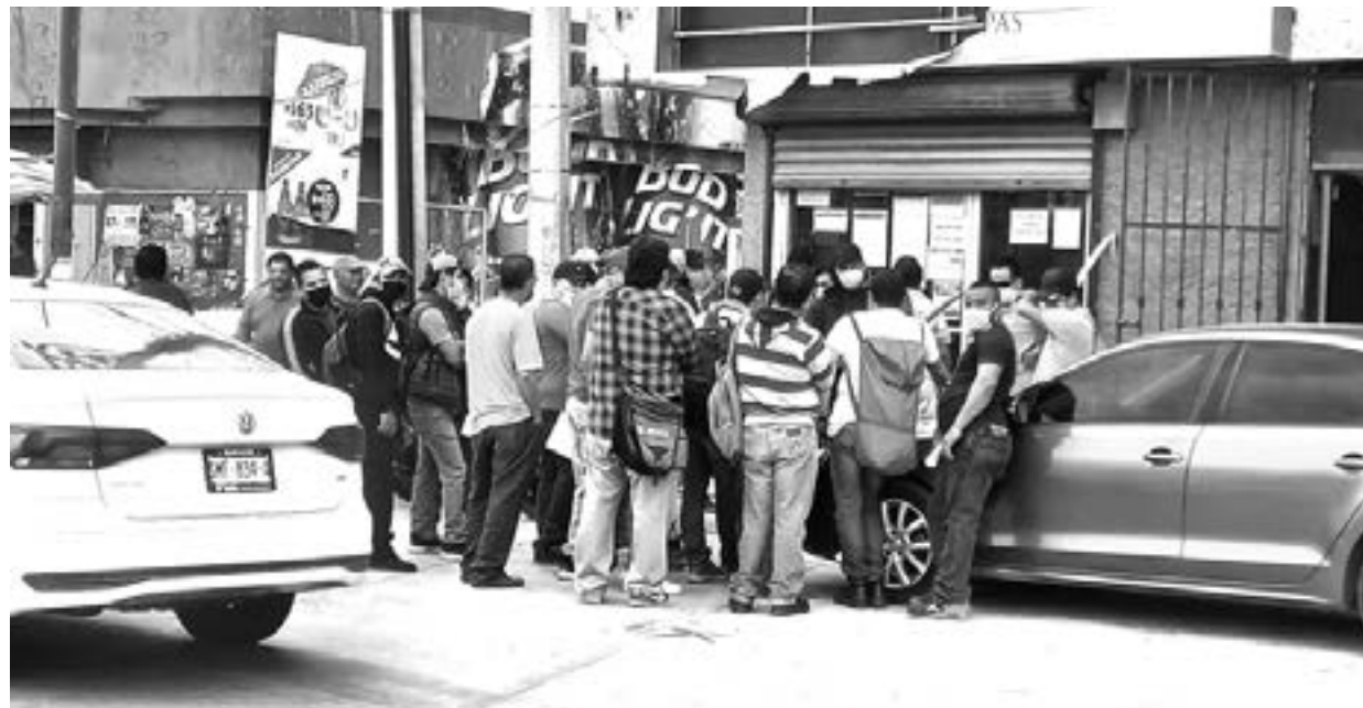
OBREROS ESPERABAN para ser entrevistados por personal de Techint.