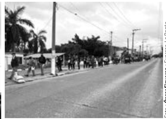
EN TAMPICO se hicieron largas filas en las sedes de vacunación.