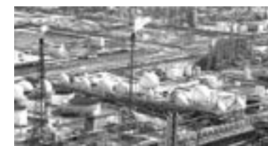
DEER PARK registró en 2020 una deuda de 1,223.2 millones de dólares.

Reveló que desde la Canaco se invita a los empresarios a no descuidar los filtros de seguridad, “tenemos que seguir cuidando que la recuperación económica se dé y que la situación de la pandemia no genere más estragos”.