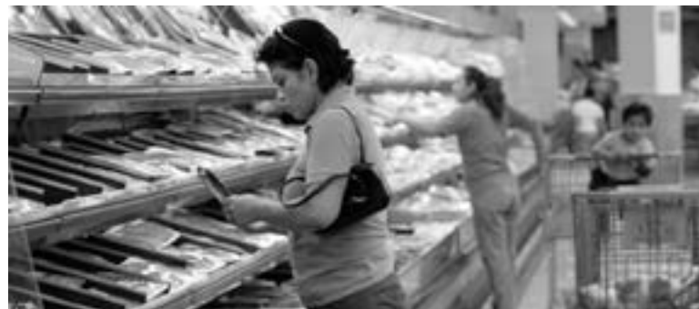
ACONSEJAN a México imponer IVA a medicinas y alimentos.

Sin embargo, aclara en el estudio, incluso si va acompañada de transferencias hacia los hogares de los deciles de ingresos más bajos, conlleva importantes retos de economía po-