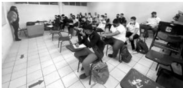
SE APLICARON las medidas sanitarias necesarias.

Expuso que son 600 mil inscritos en básica (preescolar, primaria y secundaria) y casi 400 mil en media superior y superior en planteles públicos y colegios.