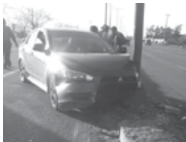
LA UNIDAD terminó impactada en un poste de alumbrado público.

Unidades de las diversas corporaciones acudieron para sumarse en las labores de rescate.