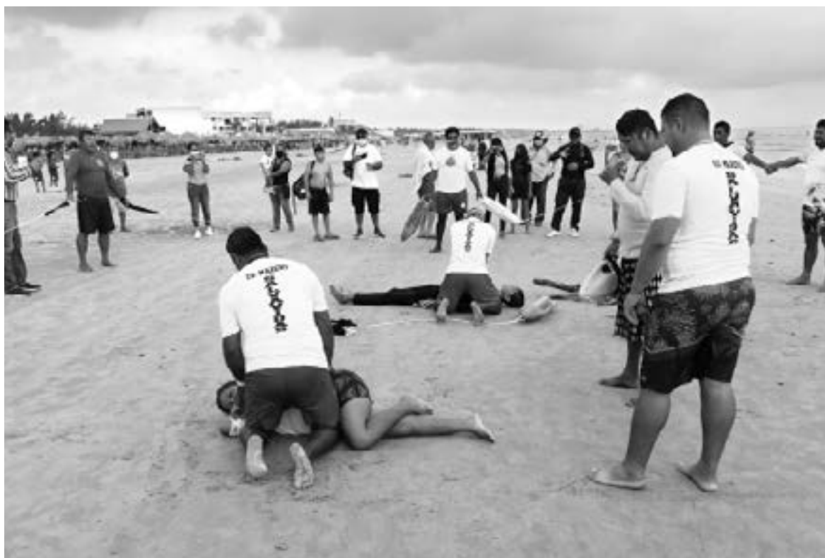
SE HAN REALIZADO 400 rescates en Playa Miramar.