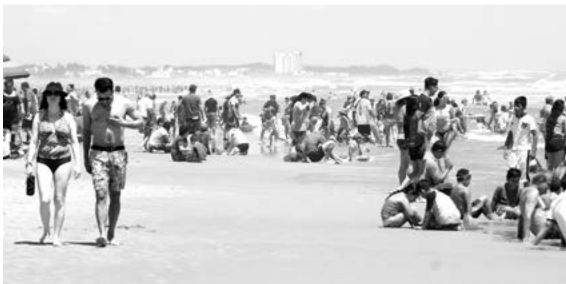
EMPRESARIOS ya esperan la llegada de turistas.

“Es la tercera temporada buena para nosotros aquí en la zona, a nosotros como prestadores de servicio ya se acaba el 14 de Febrero y la gente está preparando, invirtiendo o reparado hoteles