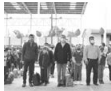
EL ALCALDE de Tampico dio la bienvenida en el inicio de las clases presenciales.

rrios, señaló que tras casi dos años de aislamiento social y de clases de