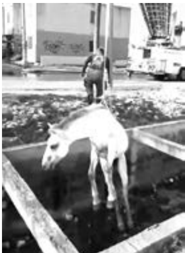
BOMBEROS REALIZARON maniobras para poder rescatar al caballo en Los Prados.

Posteriormente con el apoyo de esta grúa levantaron en vilo al animal sacándolo del dren pluvial donde se encontraba para ponerlo en tierra firme.