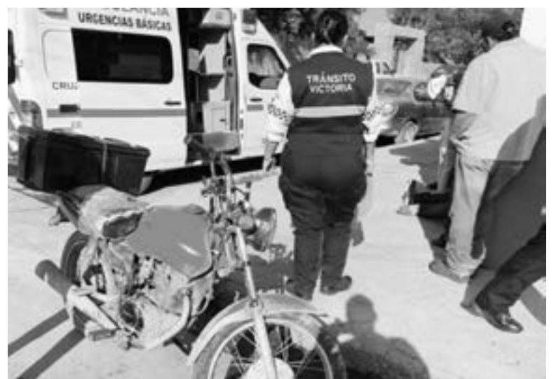
LA CAMIONETA hacía maniobras de reversa

3 VEHÍCULOS SE INVOLUCRAN EN ESTE PERCANCE VIAL