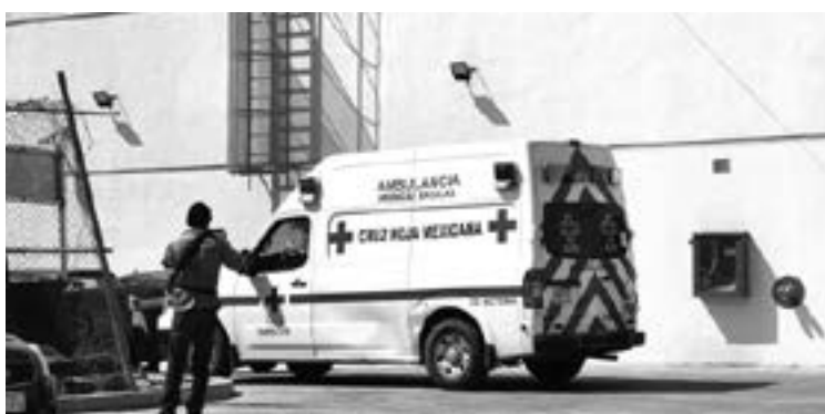
PARAMÉDICOS de la Cruz Roja acudieron a darle los primeros auxilios

Paramédicos de la Cruz Roja le brindaron los primeros auxilios, a la empleada de una tienda departamental, que resultó lesio-