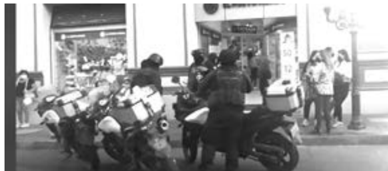
AL SITIO llegaron elementos policiacos.

Por fortuna el hecho no pasó a mayores y pudo ser controlado por los elementos policiacos.