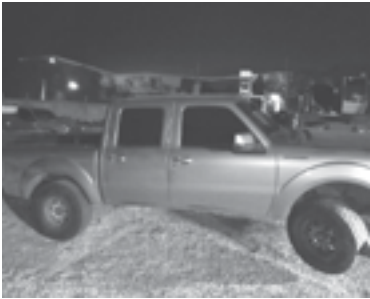
LA UNIDAD fue trasladada por una grúa.