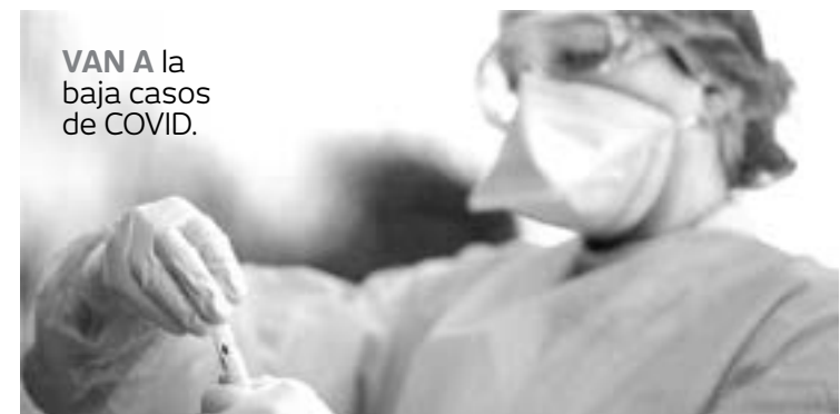
VAN A la baja casos de COVID.

como de accesorios de telefonía MOBO que también optaron por cerrar, algo similar ocurrió con la cadena de restaurantes piper peter Pizza, siendo algunos de los casos más sonados que se tuvieron en la frontera.