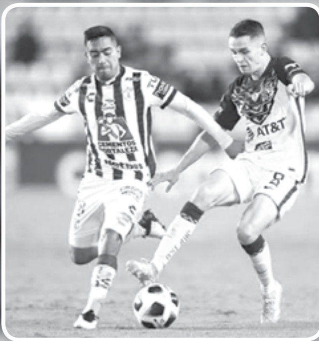
LAS ÁGUILAS del América no logran despuntar.