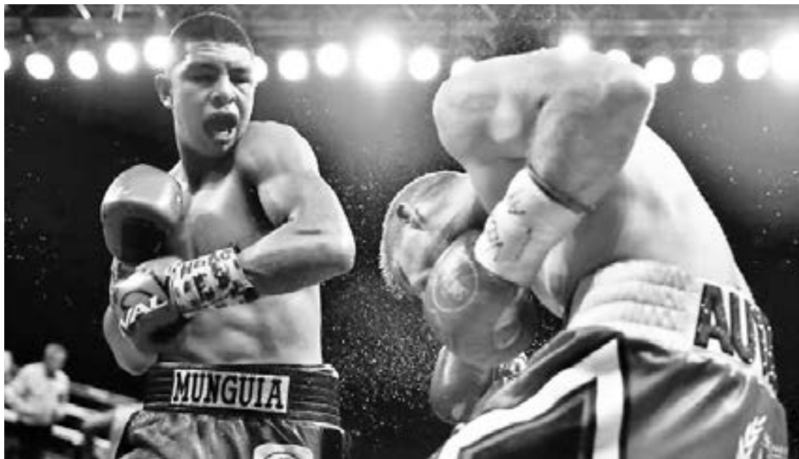
EL BOXEADOR volvió a su tierra natal.