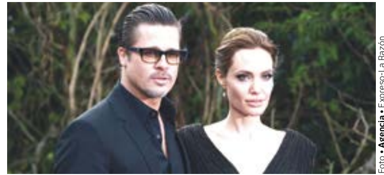
BRAD PITT y Angelina Jolie

La finca Miraval está en la localidad de Correns, en la región de Provenza-Alpes-Costa Azul, al suroeste de Francia y en ella hay