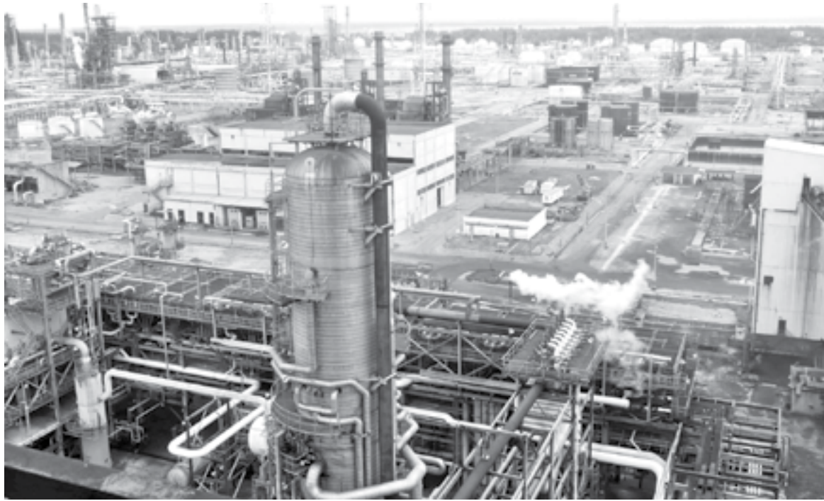
LAS OBRAS en la Refinería Madero, bajo la lupa de la ASF.