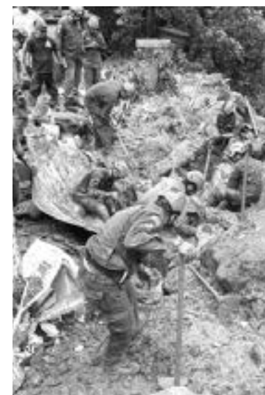
RESCATISTAS CONTINÚAN recuperando cuerpos tras inundaciones en Brasil

Las fuentes de la cadena británica apuntan que la monarca ha recibido la pauta completa de la vacuna contra el coronavirus más una dosis de refuerzo.