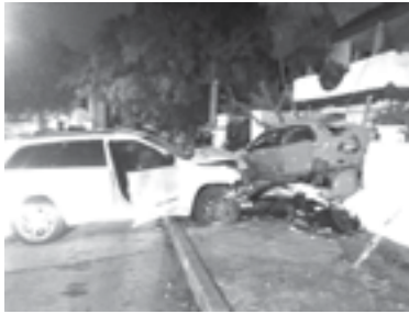
TRAS EL FUERTE IMPACTO la unidad quedó dentro del domicilio.