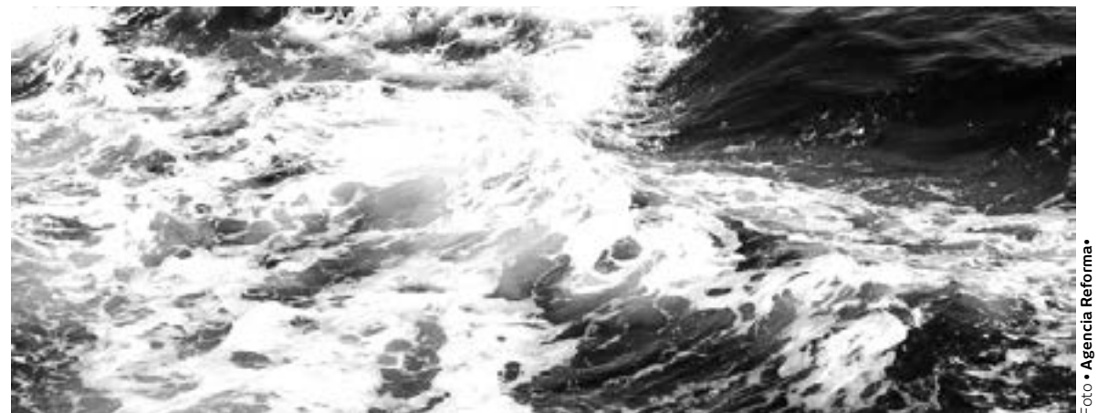
ANUNCIA TEXAS plan para desalinizar agua del mar para consumo en ese Estado y plantea que se sumen Tamaulipas y Nuevo León

El Plan Hídrico 2050 elaborado por el Fondo de Agua Metropolitano ya contempla la posibilidad de una planta desalinizadora en el mediano o largo plazo, pero en Matamoros.