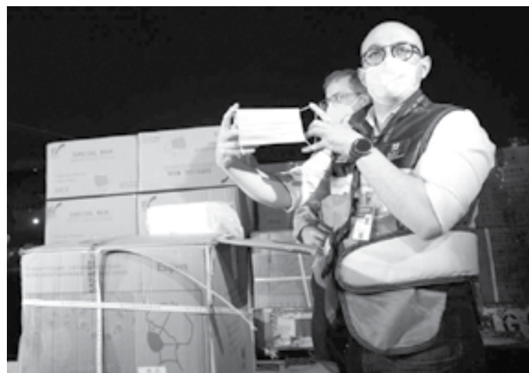
COMPRA DE materiales, aparatos y manejo de vacunas muestran anomalías.

El Instituto de Salud para el Bienestar (Insabi), indicó, no acreditó la entrega de un millón 50 mil mascarillas KN95 con un costo de 40.5 millones de pesos y está pendiente la aclaración mil 600.3 millones de pesos destinados a la compra de 2 mil 250 ventiladores, debido a que no proporcionó la documentacion justificativa y comprobatoria de su adquisición, recepción y distribución a las unidades médicas.