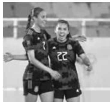
LA TITULAR confía en sus jugadoras.

“Debemos ver nuestro modelo de juego como referente sin importar el rival”.