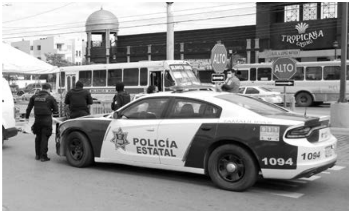
REFORZARÁN VIGILANCIA en colonias con más robos a negocios y casas.

“Se han estado atacando todo, sobretodo el robo a negocio, el robo a casa habitación que ya se están atendiendo, se están corrigiendo y en esa medida estaremos avanzando de manera eficiente”,