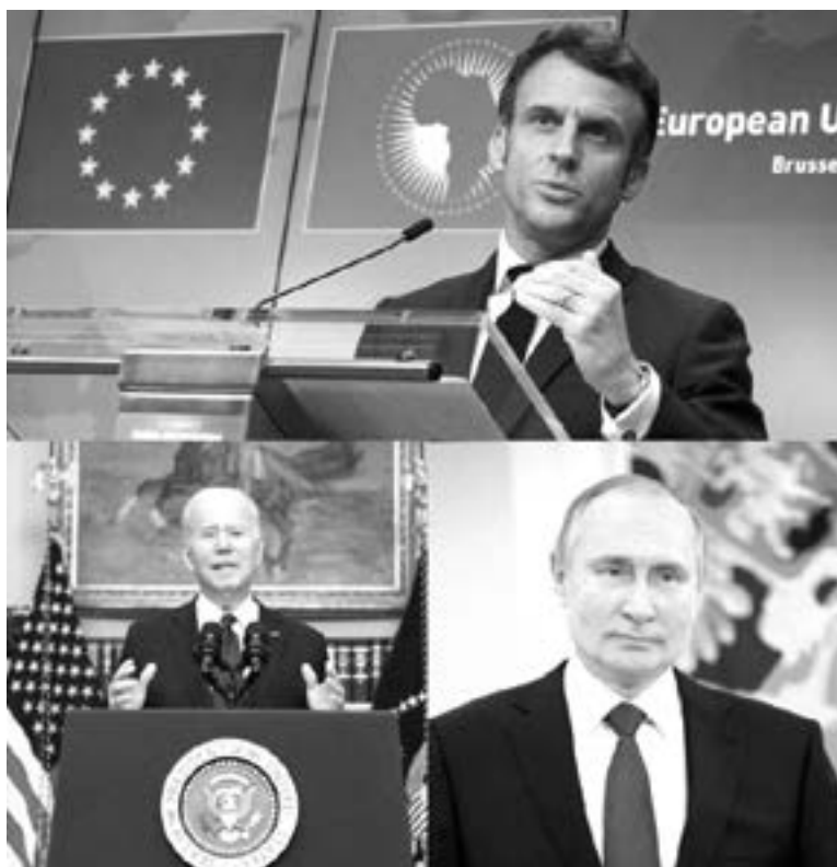
LA REUNIÓN fue propuesta por Macron

Los países occidentales liderados por Estados Unidos acusan a Rusia de apostar más de 150.000