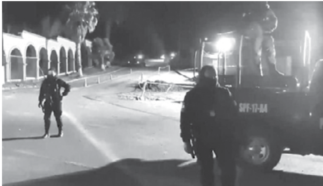
ZACATECAS VIVE momentos de mucha violencia

López Obrador agregó que visitará esa región de Guerrero cada tres meses, a partir de mayo, durante tres fines de semana seguidos para alcanzar a recorrer los 23 municipios.