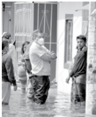
EL CAMBIO CLIMÁTICO aumenta los riesgos en varios estados

"Se estima que, en 2020-2021, se materializaron riesgos que podrían obstaculizar el cumplimiento de los compromisos contraídos por el Estado mexicano en la Agenda Internacional de Cambio Climático (AICC), con mayores limitaciones presupuestarias por las posibles reasignaciones de gasto y nuevas prio-