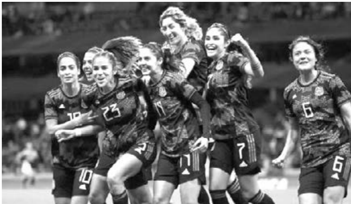
LA TITULAR de la selección Mexicana femenil aplaudió los logros de las jugadoras.

“Siento mucho orgullo de mis jugadoras, de ver el compromiso partido con partido. Aún queda mucho por mejorar, pero es importante iniciar esta fase de eliminatoria con dos triunfos”