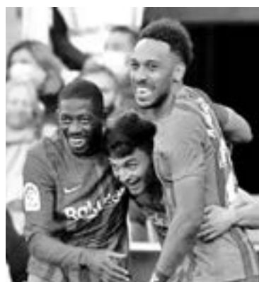
AUBAMEYANG colocó un gran gol.

1 Héctor Herrera se uniría a las filas de los futbolistas mexicanos que juegan en la MLS.