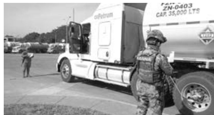
REFORZARÁN VIGILANCIA en instalaciones de Pemex en Ciudad Madero.

Como parte del convenio de colaboración, desde el 2019 personal de la Secretaría de Marina está a cargo de la Terminal de Almacenamiento y Despacho (TAD) de Madero, del área en donde se hace el llenado de los combustibles a las pipas, también tienen presencia en los accesos a la Refinería Francis-