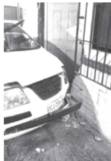
FUERTES DAÑOS sufrió la unidad.

Nissan March habilitado como taxi. Ambos vehículos se desplaza-