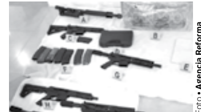
LA ACUSACIÓN es por tráfico de armas

Las autoridades mexicanas entregaron en extradición a “El Pichi” a sus contrapartes estadounidenses en el Aeropuerto Internacional de la Ciudad de México.