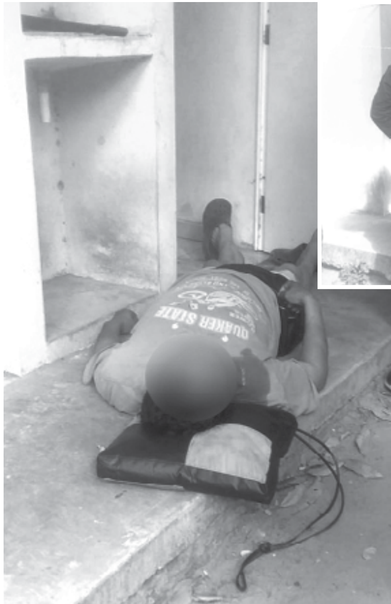
EL HOMBRE sufría un fuerte cuadro de ansiedad.

Momentos antes, se había levantado de su cama para