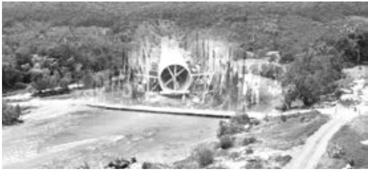
VAN REGIOS con todo, por proyecto de extraer agua del Río Pánuco, para llevarla al vecino Estado