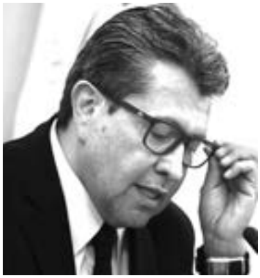
RICARDO MONREAL, líder de la bancada de Morena.