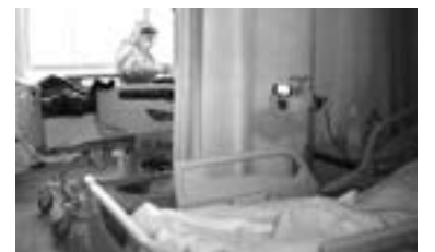
LA DEMANDA de camas va en aumento

cano del Seguro Social (IMSS) son los que se encuentran más saturados, incluso con ocupación del 100 por ciento con semáforo rojo.