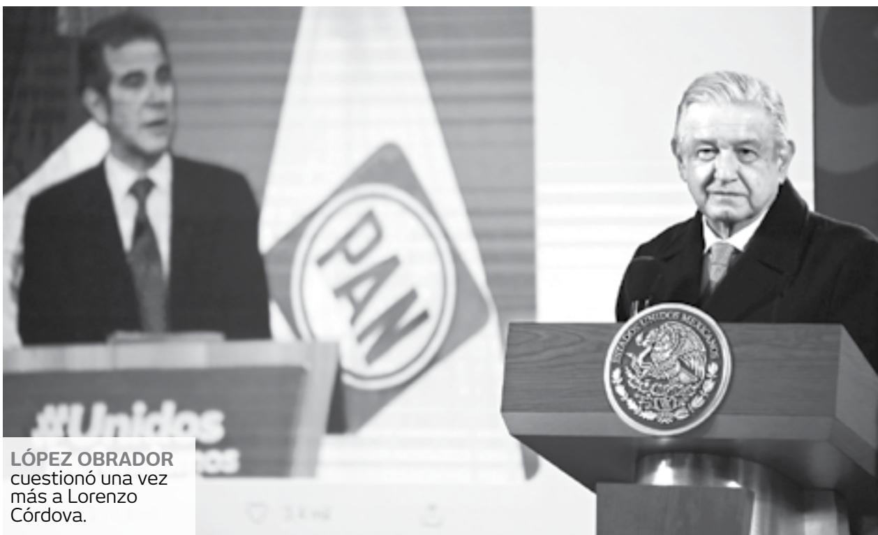
LÓPEZ OBRADOR cuestionó una vez más a Lorenzo Córdova.

“Ha habido fuerzas políticas que en el pasado me han invitado; ayer mismo me reuní con la bancada del PAN, hace unos periodos legislativos me reuní con la bancada del PT, de Morena me invitaron y desinvitaron después”