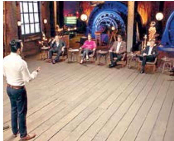
LOS ALUMNOS presentaron una simulación del programa Shark Tank.