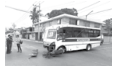
EL CONDUCTOR del micro omitió el alto.

desplazaba por la calle Olmos y al momento de arribar a esa intersección, el operador ignoró un señalamiento de alto, siguiendo su camino y provocando que el motorista, mismo que iba por la Escandón, se impactara contra el costado izquierdo de la unidad del transporte público y la ventanilla del chofer.