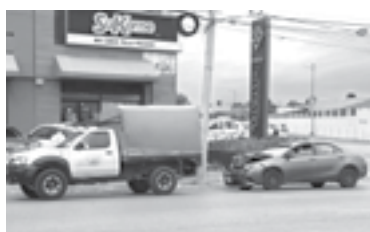
EL CHOQUE se suscitó en el distribuidor vial de Tancol.

Ambas unidades circulaban de norte a sur y cuando bajaban ese