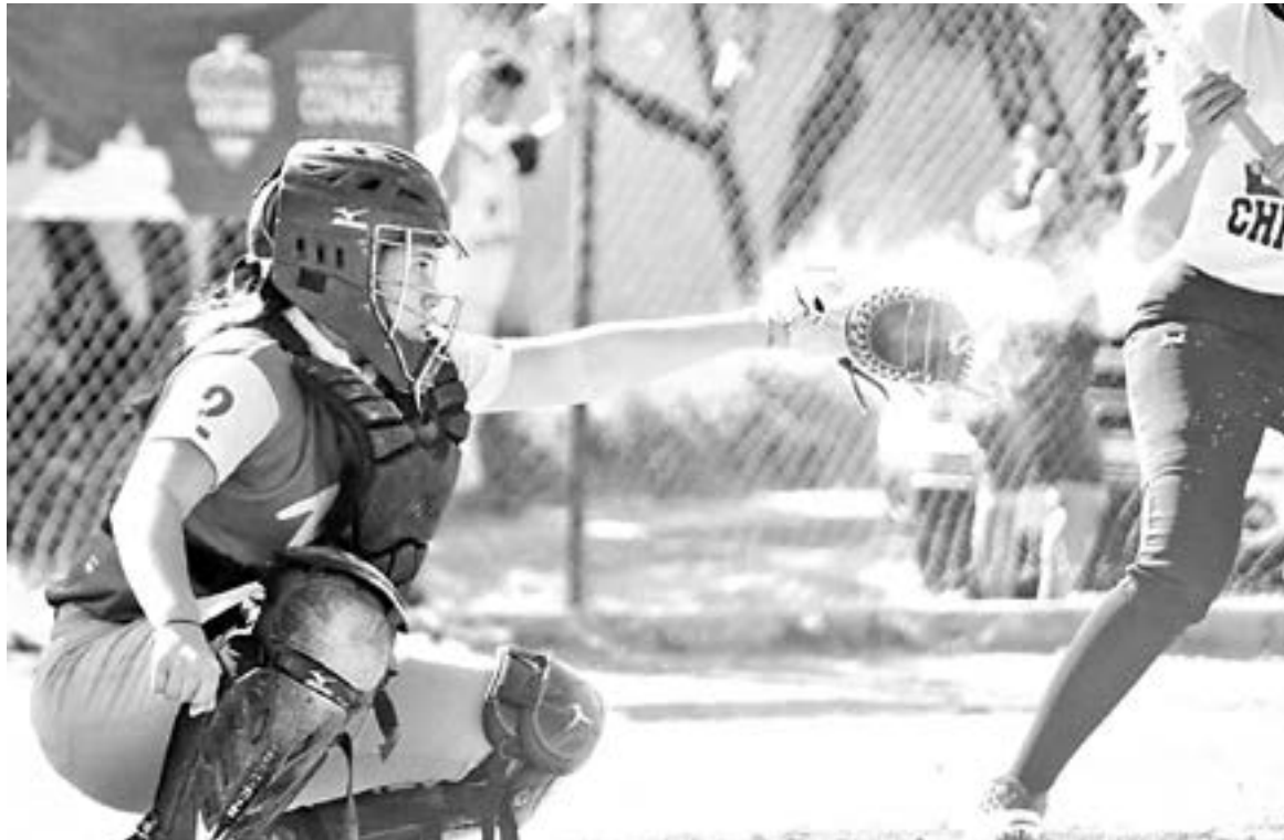
LOS EQUIPOS de Tamaulipas serán formados a través de visorias.

El día sábado 5 de febrero, se realizará el trabajo de captación de talentos en la Ciudad de Reynosa. En el Polideportivo Reynosa a las 9:00 am. Iniciarán las disciplinas de fútbol asociación, básquetbol y voleibol, mientras que en las mismas instalaciones a las 11:00 am. Iniciará la disciplina de handball. Este mismo día pero en el Estadio Adolfo López Mateos iniciarán las visorias para la disciplina de béisbol a las 9:00 am. Finalmente, en esta misma ciudad pero el día sábado 19 de febrero, se llevarán a cabo las visorias para la disciplina de softbol a las 9:00 am, en el