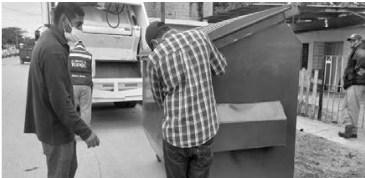
REALIZAN UN estudio para verificar cuántos contenedores por colonia se colocarán.

instalar ,pero de entrada les digo que en todos los fraccionamientos habrá un contenedor”, explicó.