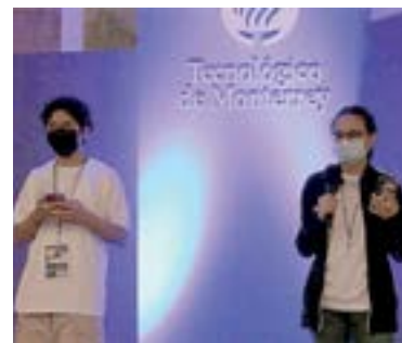
LOS CHICOS realizaron diferentes actividades.

rar el grupo fue una gran labor, la cual lo llevó a experimentar diferentes estrategias de liderazgo y a aprender de sus errores. Con el comienzo de las clases en modalidad