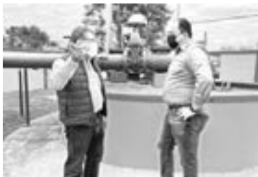
PROGRESA COMAPA en labores de saneamiento.

Estos cuerpos de agua ubicados en el sector La Florida de la Zona Centro, fueron construidos hace más de 60 años y reciben aguas negras de más del doble de su capacidad, encontrándose muy cerca de la bocatoma de la laguna de Champayán.