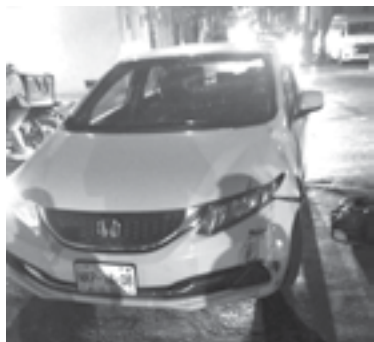
EL HECHO vial se registró en la avenida Ayuntamiento.

Acudieron al lugar elementos de Tránsito para intervenir y tomar conocimiento de lo sucedido.