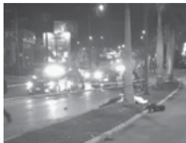
TIRADO EN EL PISO quedó el hombre.

El mortal accidente ocurrió los primeros minutos del viernes