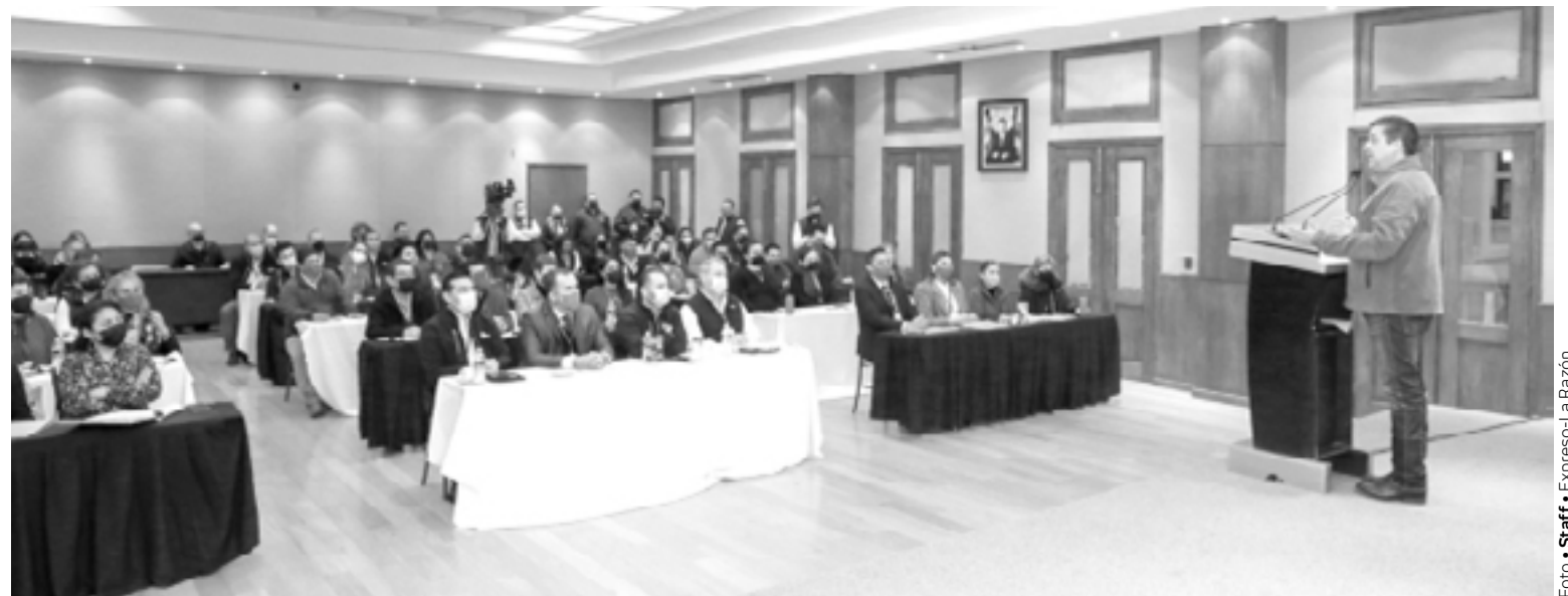
PARTICIPA EL GOBERNADOR en la quinta Reunión de Directores de Turismo Municipales 2022