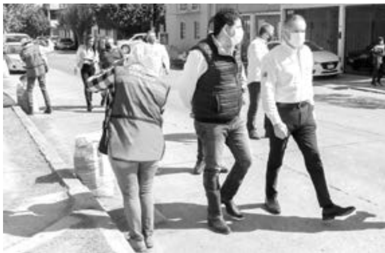
LA ADMINISTRACIÓN maderense continúa con el rescate del cuerpo lagunario y la limpieza de drenes pluviales.

tensificando las acciones de limpieza, a través de las cuadrillas de Servicios Públicos que se encuentran desplegadas por la ciudad.