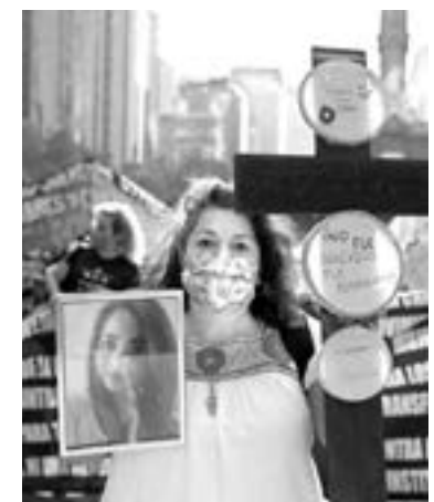
SE INCREMENTARON los delitos contra las mujeres

De manera particular en el delito de feminicidio, el estudio señala que de enero de 2015 a diciembre 2021, la tendencia nacional es de un incremento del 134.5 por ciento en los 7 años, con un total de 5 mil 519 delitos de feminicidio.