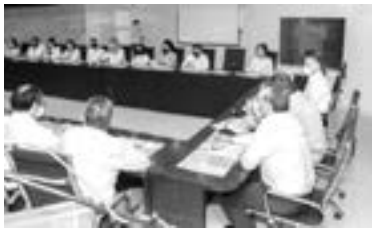
REGIDORES han salido positivos al Covid-19.