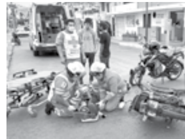
PARAMÉDICOS de la Cruz Roja atendieron al lesionado.

desplazaba por la calle Olmos y al momento de arribar a esa intersección, el operador ignoró un señalamiento de alto, siguiendo su camino y provocando que el motorista, mismo que iba por la Escandón, se impactara contra el costado izquierdo de la unidad del transporte público y la ventanilla del chofer.