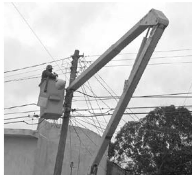
MUCHAS DE LAS LÁMPARAS fueron dañadas a propósito

lámparas que se están instalando, son tipo LED de 70 watts que tienen una garantía extensa.