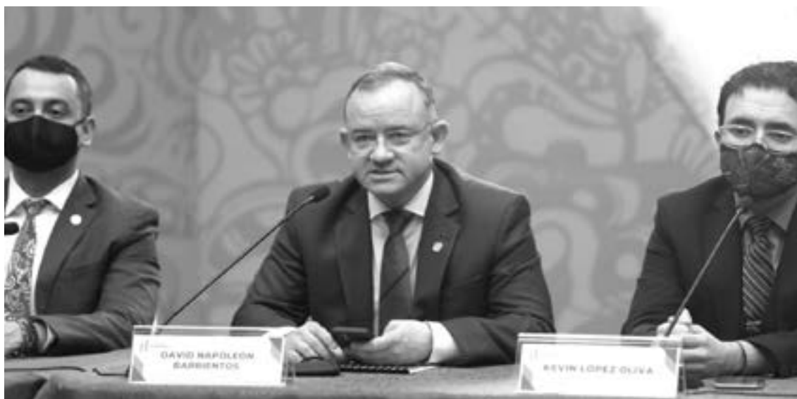
EL GOBIERNO de Guatemala informó sobre las detenciones.

El 22 de enero fueron localizados los cuerpos de 19 personas, en una brecha de Camargo, cerca de los límites con Nuevo León, 15 fueron encontrados en la caja de