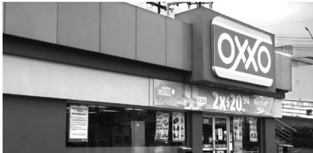
PLEITO ENTRE CFE y OXXO.

Desde Palacio Nacional, Reyes acusó a las empresas privadas de difundir “propaganda negra” en contra de la CFE, para generar la percepción de que se produce energía sucia y cara.