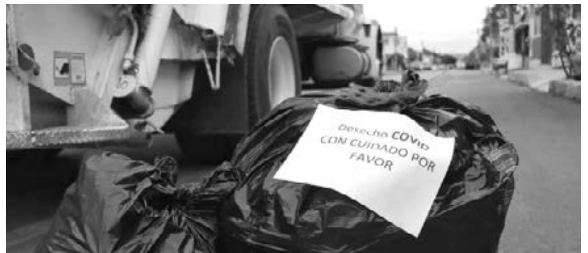
ADVIERTEN CON RECADOS sobre la basura Covid a recolectores

TRABAJADORES DE SERVICIOS PÚBLICOS AGRADECEN A LA CIUDADANÍA QUE LOS ALERTE PARA EVITAR QUE SIGAN PROPAGÁNDOSE LOS CONTAGIOS ENTRE EL PERSONAL DE LIMPIA PÚBLICA