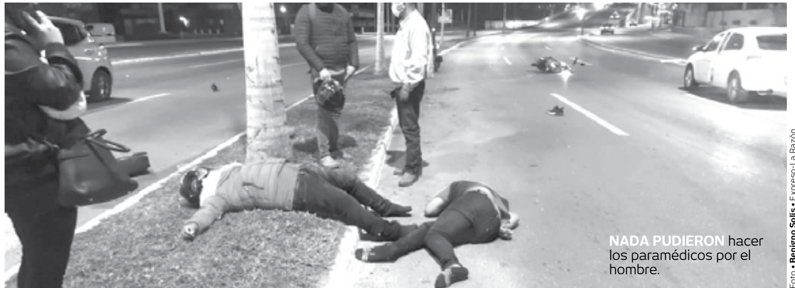
NADA PUDIERON hacer los paramédicos por el hombre.