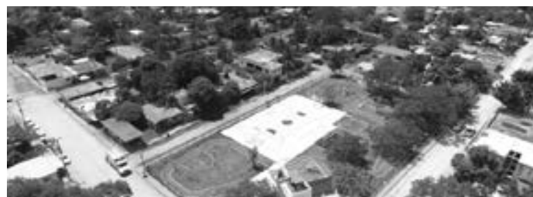
UN PARTICULAR ocupa el área ubicada a lado del Centro de Salud en la colonia Emilio Portes Gil.