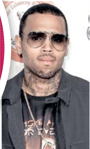
BROWN ENFRENTA fuertes acusaciones