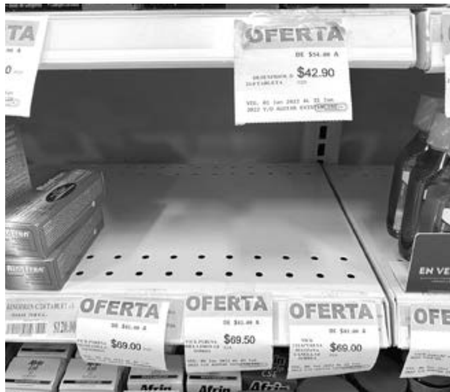
LAS FARMACIAS tienen muchos faltantes.

Diversas cadenas de farmacias están emitiendo comunicados para informar a la población en general sobre la falta de medicamentos, explicando que se deriva de la situación mundial que se vive a nivel global por la pandemia.