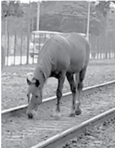
ES COMÚN VER CABALLOS deambular en la zona.