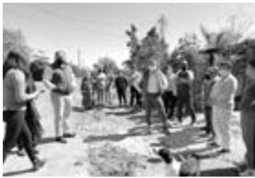
COMAPA ALTAMIRA trabaja en el proyecto de una nueva planta tratadora.