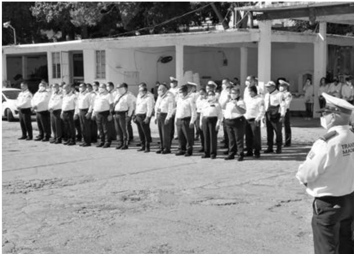
AUMENTARÁN SALARIO de los tránsitos de Madero.

“Estamos esperando el nuevo presupuesto del 2022 que llega en febrero, vamos a ver cuánto nos llega y si llega bien, vamos a ver de qué manera podemos incrementar el salario a los mejores agentes, haber de qué manera se