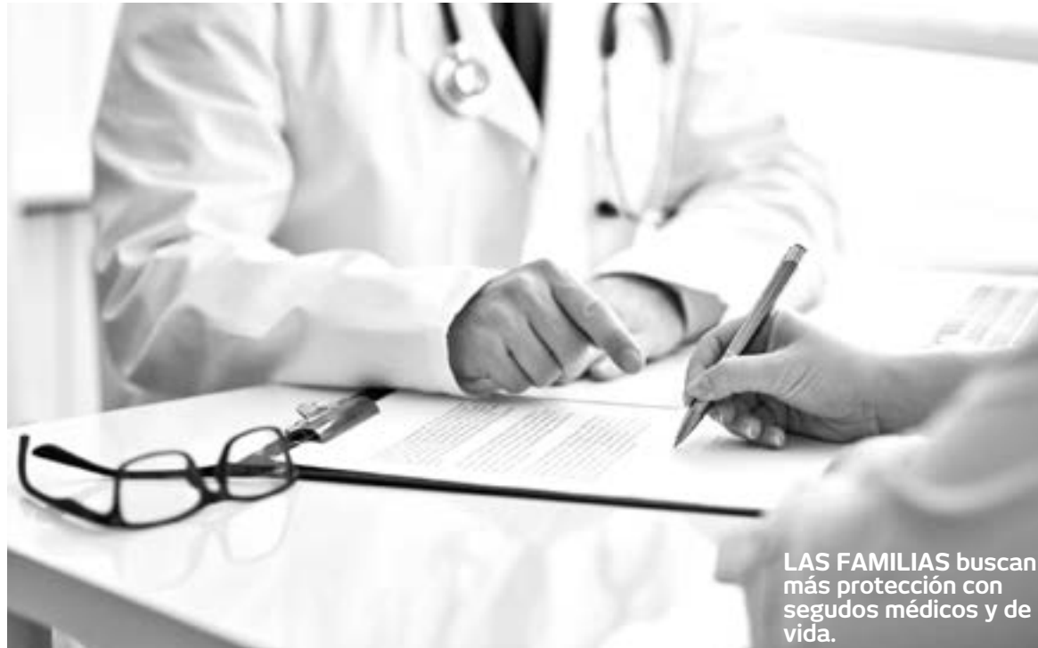
LAS FAMILIAS buscan más protección con seguros médicos y de vida.