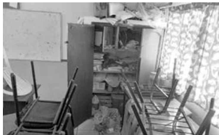
ES EL segundo robo a un plantel educativo en menos de un mes.

"El robo fue reportado el fin de semana y lo que se nos informó que fue el cableado, por lo cual la escuela se encuentra sin energía eléc-