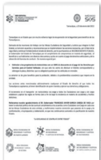
LA CARTA de reconocimiento de las Mesas de Seguridad de la entidad.

A través de un comunicado público, las Mesas Ciudadanas de Seguridad y Justicia de Nuevo Laredo, Reynosa, Matamoros, Ciudad Victoria, Mante, Tampico, Madero y Altamira, reconocieron las acciones empeñadas en ayudará a subsanar la problemática que impera en la entidad, mantener la identificación de quién transita por las redes carreteras y ejercer derechos y obligaciones.