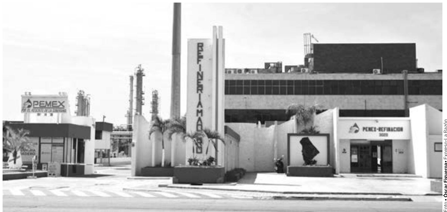
LA REFINERÍA Madero es la de menor producción a nivel nacional.