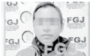
EL HOMBRE fue procesado por abuso sexual agravado.

Estaba ubicado a un costado de la avenida Monterrey, casi esquina con calle Francisco Villa, entre las colonias José López Portillo y Enrique Cárdenas González.