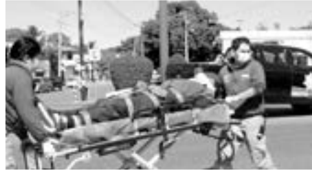
EL HOMBRE fue auxiliado por paramédicos de la Cruz Roja.

Por más de 30 minutos, el flujo de vehículos se vio interrumpido por las maniobras para retirar la camioneta y atender al lesionado.