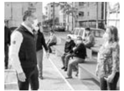
EL ALCALDE acudió a la colonia Arboledas.

Reconoció que el incremento salarial dependerá del presupuesto que llegue al ayuntamiento el próximo mes. “para el 5 de febrero sabremos qué presupuesto nos llega para el 2022 y con base en eso podremos ver qué incremento se les da a los tránsitos”.