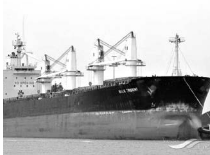
LA EMBARCACIÓN PANAMEÑA quedó fondeada en el puerto de Altamira, hasta que los tripulantes se recuperen.

Fue el 21 de enero cuando las autoridades cuarentenaron la embarcación Bulk Trident de