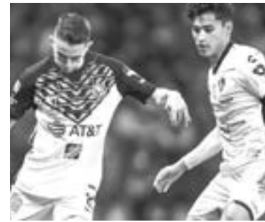
EL AMÉRICA no mostró nada diferente a lo que ha ofreciendo en sus últimos partidos.

André-Pierre Gignac, quien no había aparecido en el encuentro fue el encargado de cobrar la pena máxima con un potente disparo pegado al palo derecho de Talavera para de esa forma llevarse los tres puntos a la Sultana del Norte.