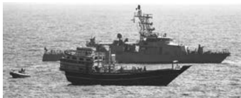
LA QUINTA Flota patrulla el golfo Pérsico