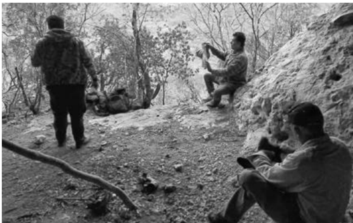
DETECTAN más vestigios históricos en la Sierra Madre

lizada en la Sierra Madre y en su interior hallamos posibles afiladores, pinturas prehispánicas y evidencia de antiguos antepasados"