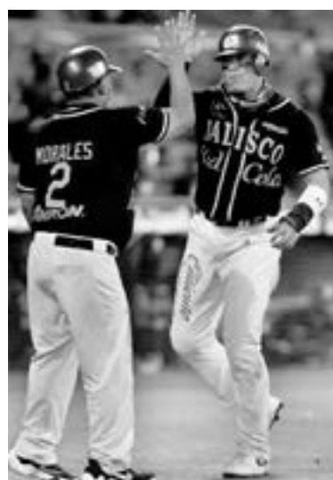
CHARROS venció a los Tomateros 8-1.

El manacorí accedió en 45 ocasiones a los cuartos de final de las 63 participaciones en Grand Slam desde que se convirtió en profesional en 2001.