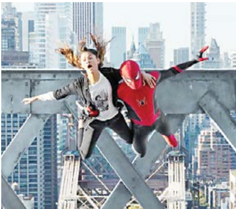
SPIDERMAN sigue liderando las taquillas.