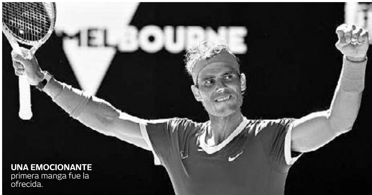
UNA EMOCIONANTE primera manga fue la ofrecida.

NADAL IGUALÓ EN EL SET A NEWCOMBE CON 14 PUNTOS