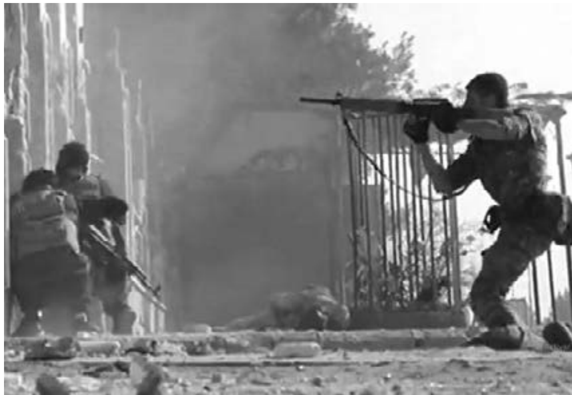
FUERZAS KURDAS mantienen cercada una cárcel controlada por el Estado Islámico

En las imágenes se pueden ver una veintena de cuerpos del personal de seguridad de la cárcel, pero no se ha podido verificar si están vivos o muertos, según las fuentes de la red de activistas del Observatorio Sirio para los Derechos Humanos, que ha proporcionado también el balance. En otras grabaciones, los guardias de la prisión apresados por los yihadistas dan sus nombres y fecha de nacimiento. El paradero de decenas de miembros de ambos bandos continúa aún siendo desconocido, por lo que el Observatorio Sirio ha estimado que el número real de víctimas mortales será previsiblemente mayor.