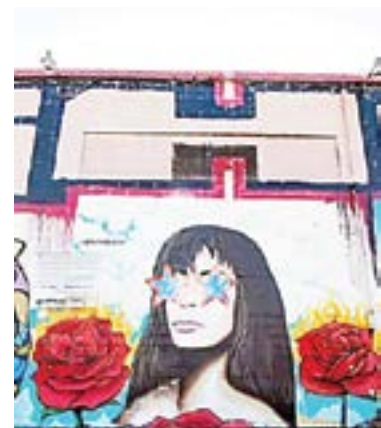
EL CANTANTE compartió la foto de Selena.

Las cinco siguientes de las 10 más vistas fueron: - The 355 (1,6 millones de dólares) - American Underdog (1,2 millones) - The King's Daughter (750.000) - Amor Sin Barreras (698.000) - Licorice Pizza (683.000).