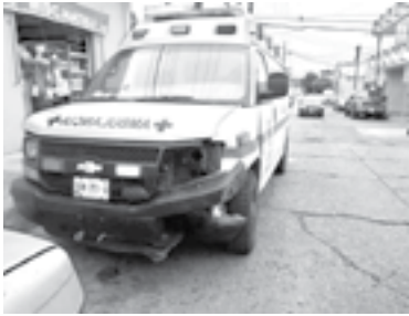
EL CONDUCTOR del Ford y una mujer resultaron heridos.