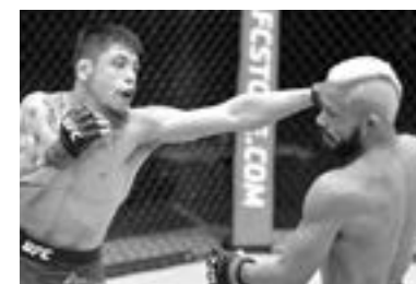
MORENO tenía el cinturón de peso mosca de la UFC.

Moreno se convirtió entonces en el primer peleador nacido en México en lograr un título del campeonato UFC (The Ultimate Fighting Championship). La pelea del sábado era su primera defensa del cinturón.