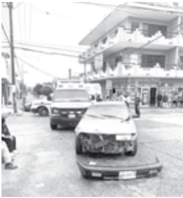
EL AUTO impactó a la ambulancia.