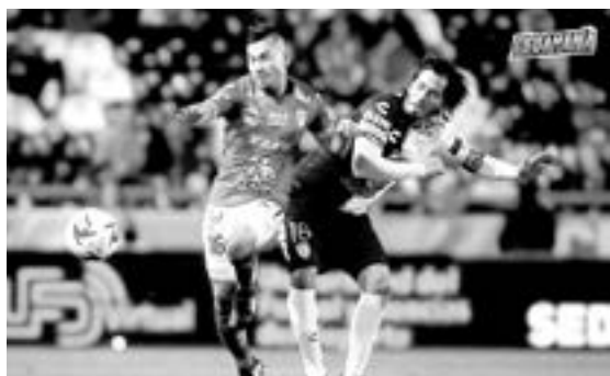
EL LEÓN se llevó tres puntos en casa.

León, Guanajuato.-El Club León se llevó sus primeros tres puntos en casa y en el torneo, la escuadra dirigida por Ariel Holan suma cinco unidades, mientras que los Tuzos suman su primera derrota.