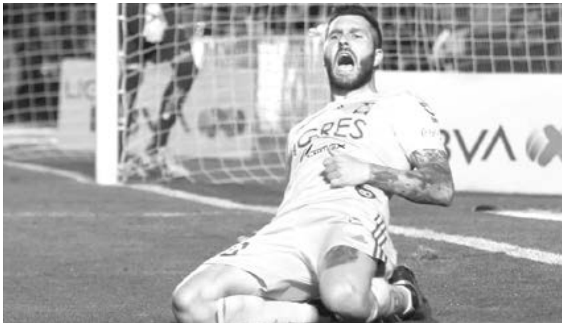
LOS TIGRES obtuvieron el triunfo en el estadio Olímpico.

Tras este emocionante arranque, Pumas y Tigres se enfrascaron en una encarnizada batalla por la posesión de la pelota, la cuál pasó de un