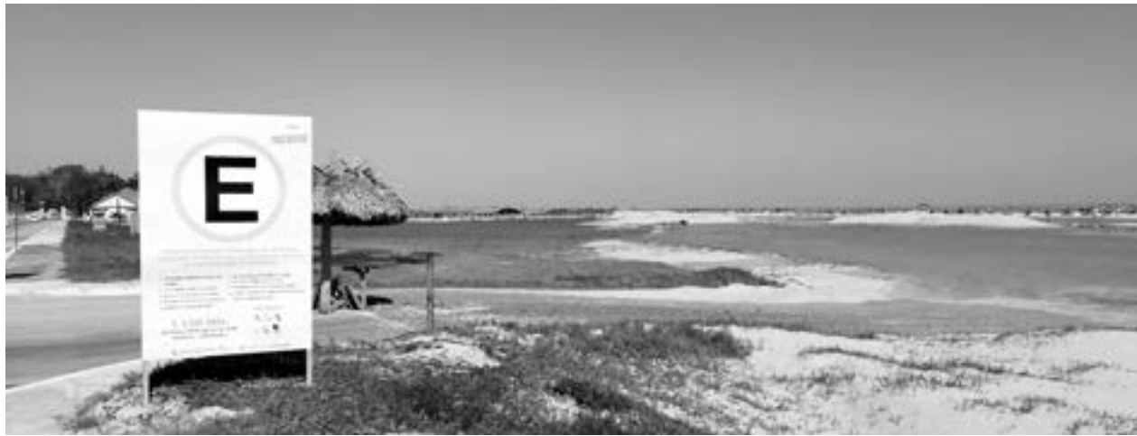
PROPONEN INVERSIONES sustentables y que generen empleos permanentes.