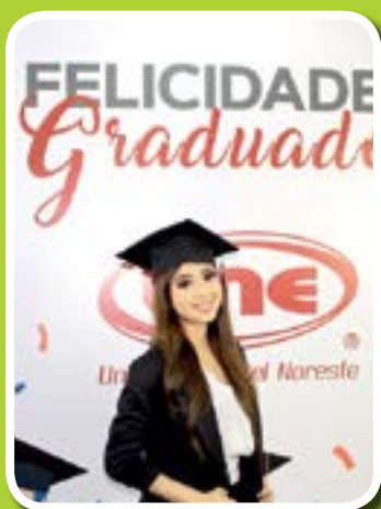
SE PREMIARON a los mejores promedios durante su carrera.