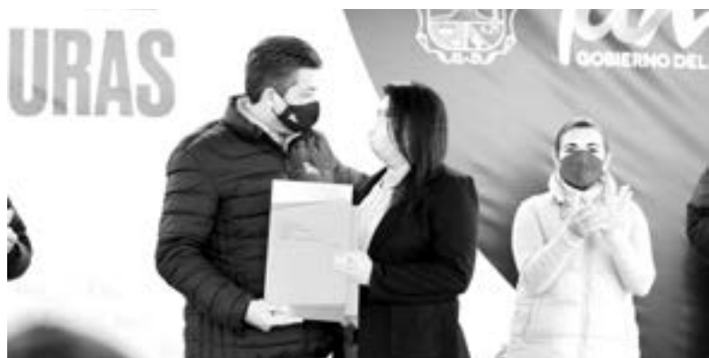
EL GOBERNADOR, Francisco García Cabeza de Vaca, realizó la entrega de 6 mil escrituras

La legisladora de Morena, Magaly Deandar Robinson, presentó la iniciativa en la que señaló lo sucedido el pasado 18 de enero, cuando en "una decisión arbitraria, unilateral e imparcial que de manera autorita-