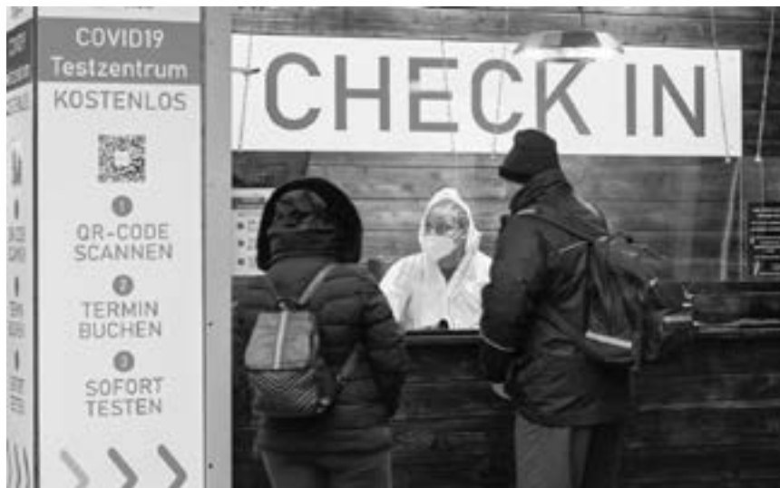
AEROPUERTOS, ESCUELAS y empresas paralizadas por contagios

Estas cifras se basan en los números comunicados a diario por las autoridades sanitarias de cada país. Una parte importante de los casos menos graves o asintomáticos sigue sin detectarse, a pesar de la intensificación de las pruebas en muchos países. Además, las políticas de testeo difieren de un país a otro.