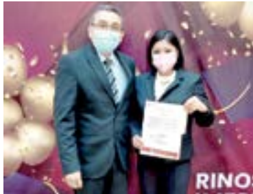
INSTANTES EN QUE RECIBEN sus documentos de acreditación.