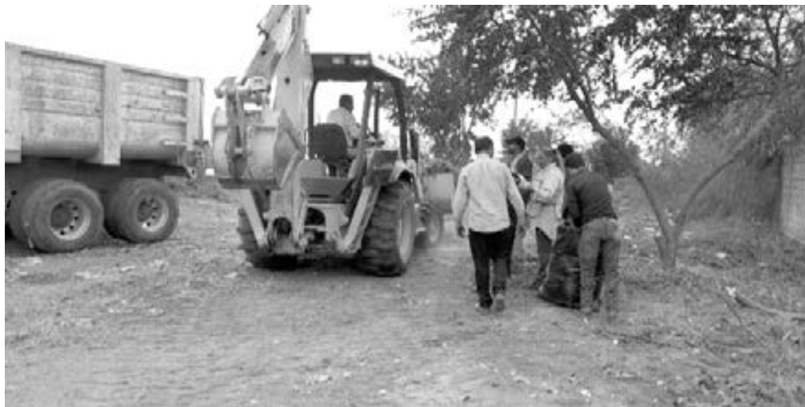
SE REALIZARON las labores de limpieza en el terreno.

Indicando 'Tenemos identificados a tres prestadores de servicios que en un triciclo, un remolque y una carreta con burros que cobran a vecinos del área por recoger la basura, el problema es que la van a