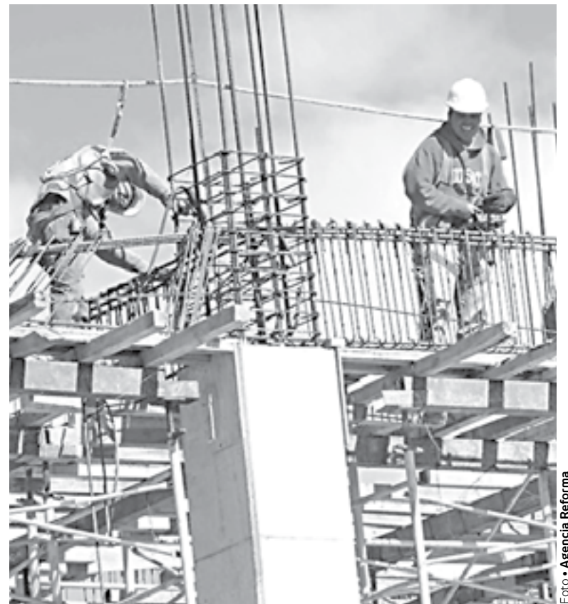
EN LA zona se han detenido alguno proyectos de obra.

alzas más duras en los materiales, lo que retrasará la reactivación de obras. “(Cada indio de año) por lo general cuando se da un desaceler de la parte económica o un incremento muy importante de los materiales de construcción, la reactivación se viene dando entre marzo y abril, ahora el pronóstico es reservado, consideramos que quienes tenemos clientes con cierta intension de ejecutar obra, estaríamos hablando de mayo, lo que es sobretodo obra de construcción de cierto tamaño, amplitud o construcción de casas desde cero”.