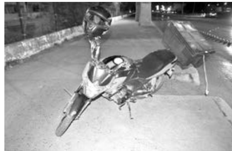
AL NO respetar el alto, la moto lo embistió

Transito Local acudió a tomar conocimiento