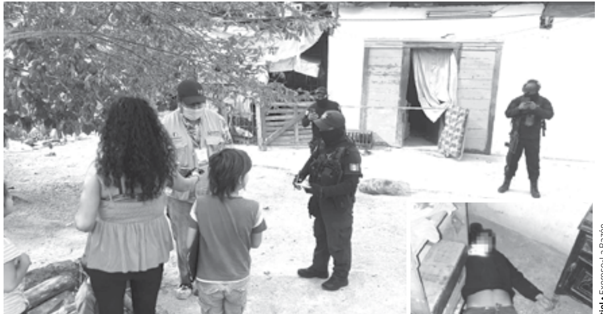
FAMILIARES DESCUBRIERON el cuerpo de la mujer.

LA MUJER DE 35 AÑOS ATÓ UNA SOGA A UNA VIGA DE SU CASA PARA ASÍ TERMINAR CON SU EXISTENCIA, FUE ENCONTRADA POR SU FAMILIA