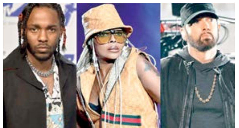
EMINEM, DR. Dre y Snoop Dogg, serán parte del evento.

ven las piezas para después ir mostrando de uno a uno a los artistas que actuarán empezando por Eminem quien está creando versos con su alterego Slim Shady la ritmo de "Rap God", a él le sigue Snoop Dogg que aparece en su auto a la vez que suena "The next episode" (tema que comparte con Dr. Free).