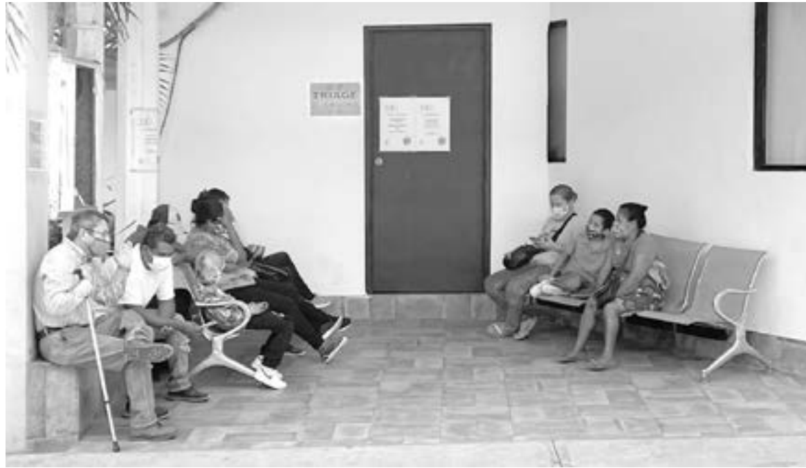
PACIENTES SOSPECHOSOS de Covid.19 son atendidos en la clínica del DIF.

días, sospechosos, porque todos los que vienen aquí son sospechosos hasta que se les