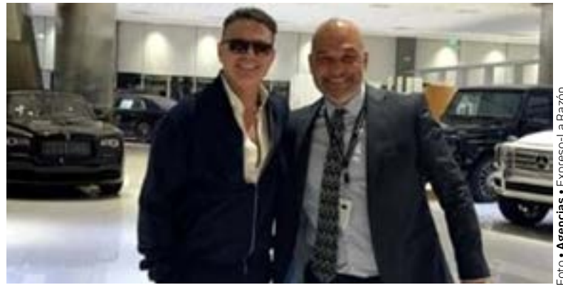
CIRCULA EN REDES la imagen de Luis Miguel.