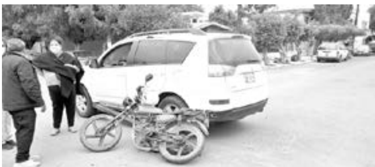
SE FUE a estrellar en un costado de la camioneta