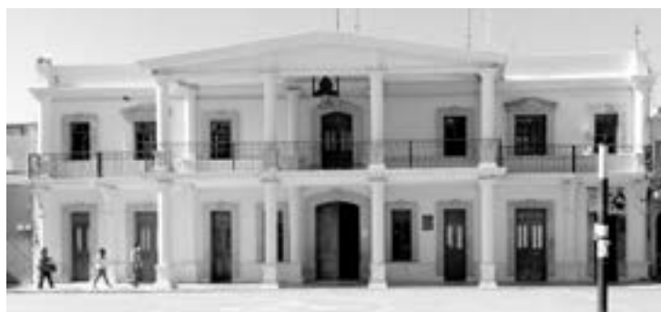
EL MUNICIPIO se prepara para celebrar su quinto centenario.

Pueblo Viejo.-Este año el municipio de Pánuco cumplirá 5 siglos de historia, lo que derivará en un festejo magno,