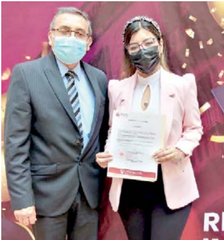
FELICES DE ACREDITAR sus exámenes profesionales.

plan todas sus metas y propósitos en un próximo futuro.