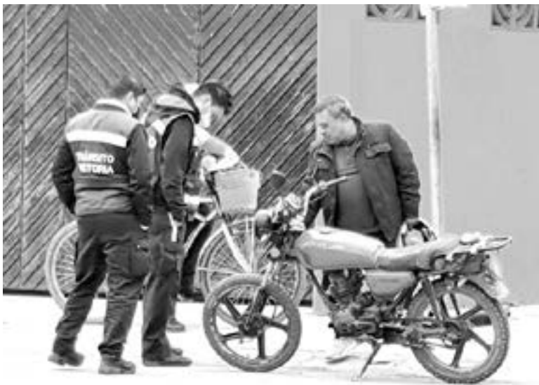
EL MOTOCICLISTA se desplazaba con preferencia de paso

50 AÑOS ES LA EDAD ESTIMADA DEL MOTO- CICLISTA ACCIDENTADO