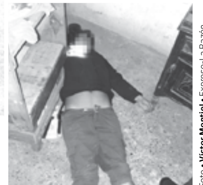
LA MUJER padecía de crisis nerviosas.

Elementos de la Policía municipal fueron los primeros responsables y encargados de acordar el lugar para la preservación de indicios, posteriormente llegaron personal de la dirección general de servicios periciales