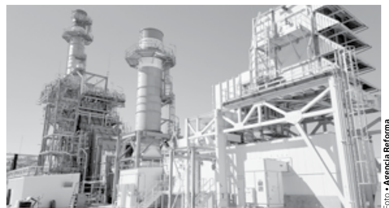
EN LOS amparos está involucrada una planta de Altamira

Mientras los amparos no sean admitidos, no será posible que se conceda una suspensión para mantener el estatus de las plantas de Iberdrola, que operan desde 1998, la de Altamira, y 2002, la de Pesquería.