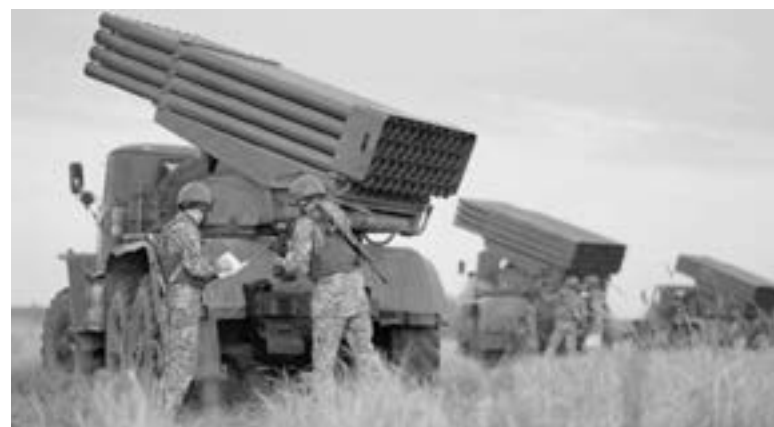
UN CONFLICTO que escala.