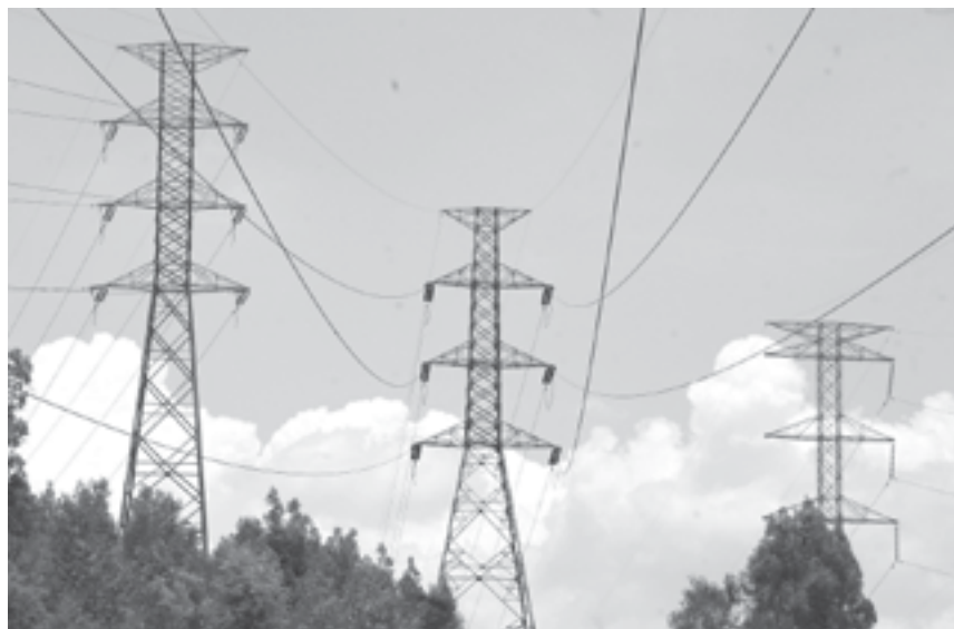
DETIENEN INVERSIÓN... y ganancias...

http://indicadorpolitico.mx indicadorpolitico@gmail.com Canal YouTube: Indicador Político