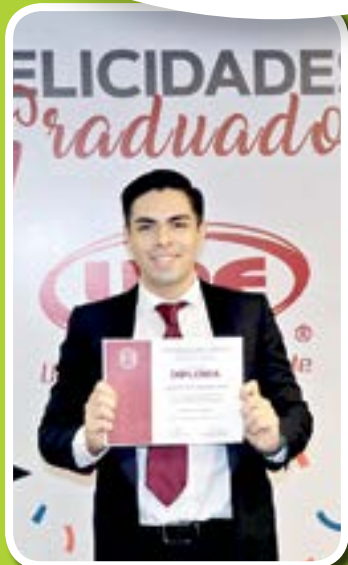
FELICES DE recibir sus certificados.