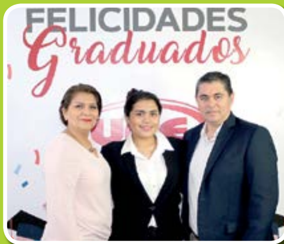
LOS ALUMNOS estuvieron acompañados por sus familiares.