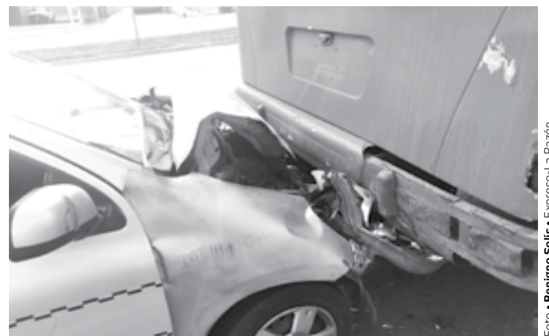
LA UNIDAD quedó proyectada tras el autobús.

Ambos se desplazaban de sur a norte y al llegar a ese punto, el bus se detuvo para que bajaran pasajeros, lo cual tomó por sorpresa a la conductora del Nissan que no al-