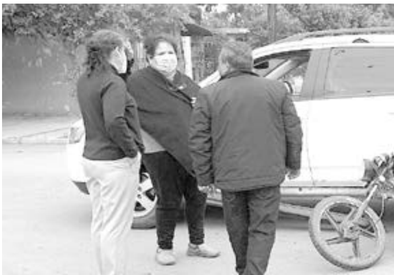
INVOLUCRADOS DIALOGAN en el lugar de los hechos