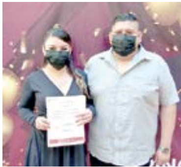
ACOMPAÑADOS POR sus familiares recibieron sus documentos.