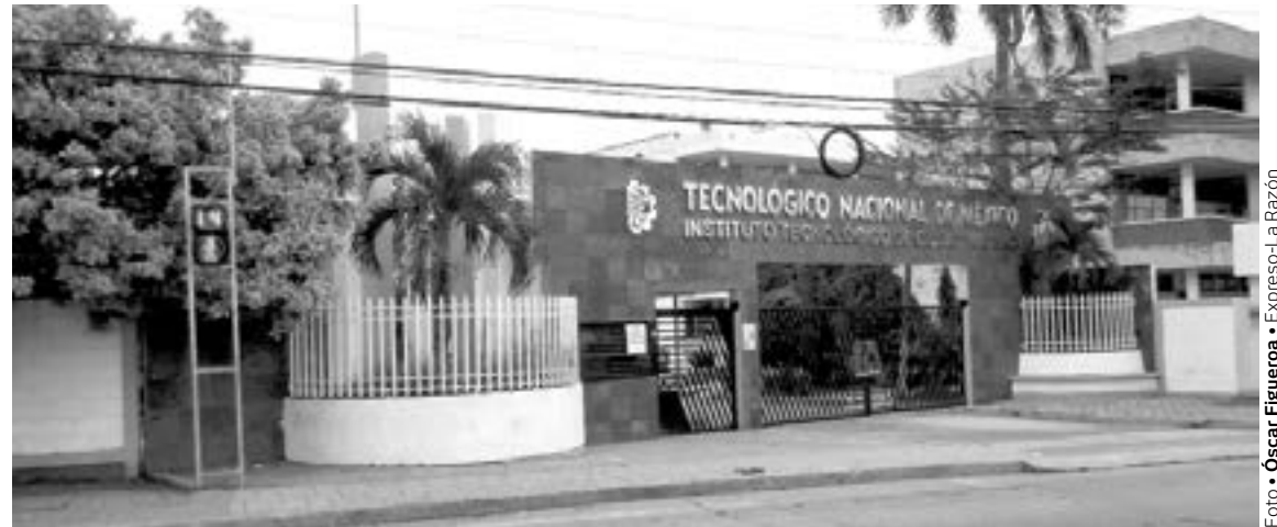
ALUMNOS INTENTARON hackear al sistema del Tecnológico Madero.

Se han hecho convocatorias para realizar manifestaciones afuera de la institución, incluso para este jueves estaba programada una, pero por temor a represalias han sido suspendidas.