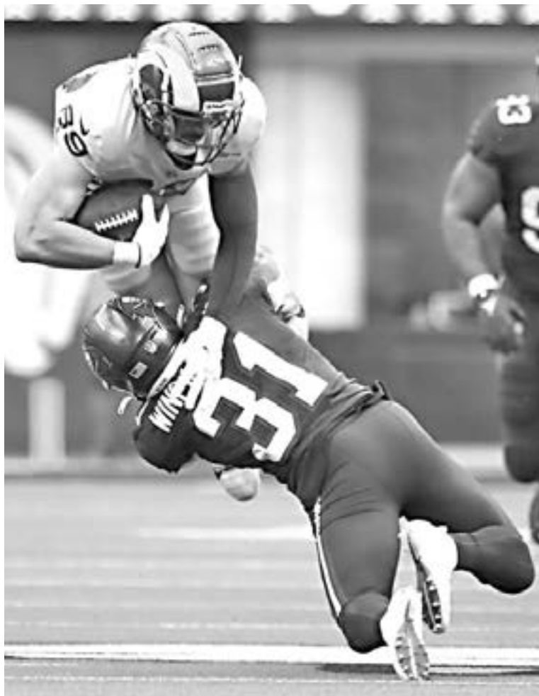
RAMS Y TAMPA BAY darán un buen partido.

A qué debemos estar atentos: En el enfrentamiento de la temporada regular, una victoria de los Rams por 34-24 en la Semana 3, los Rams lanzaron 22 pases y corrieron el balón 10 veces mientras construían una ventaja y luego volaron el juego con un pase de touchdown de 75 yardas en el primer minuto del tercer cuarto. Digamos que las cosas han cambiado un poco desde entonces.