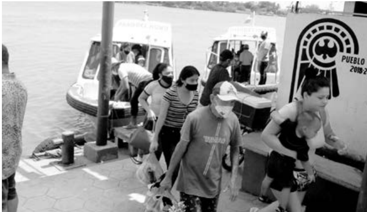
LOS OPERADORES buscan aplicar fuertes medidas sanitarias.

Indicó que ya platicado también con los taxistas de la rampa del paso del humo y ellos también han mostrado preocupación de que se puedan reducir también el número de pasajeros en los vehículos lo cual sería