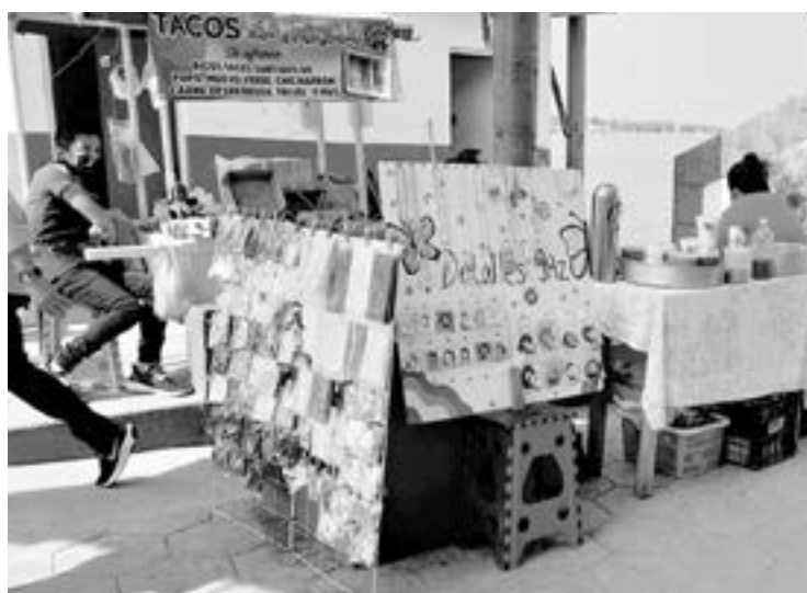
EL COMERCIO ambulante es una de las primeras alternativas al perder el trabajo.

“La situación está muy complicada yo conozco mucha gente a quién le da algo y se de amigos familiares y otros vecinos que están desempleados que no tienen trabajo y sus esposas les preparan algún producto para vender y ellas mismas también parten a Tampico