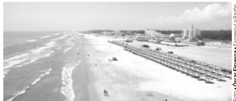
NO SE HAN APLAZADO inversiones por Ómicron en Madero.

"Si hay la presencia de dolor de garganta, tos y demás síntomas, estamos frente a la presencia de coronavirus, hace obvia a la prueba y se le exhorta al paciente para que se mantenga aislado una semana aproximadamente y que tome el medicamento que le hayan recetado", concluyó.