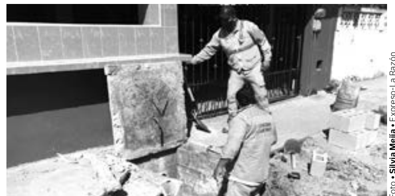
MEJORA EL SISTEMA DE DRENAJE y alcantarillado en la zona de Monte Alto.