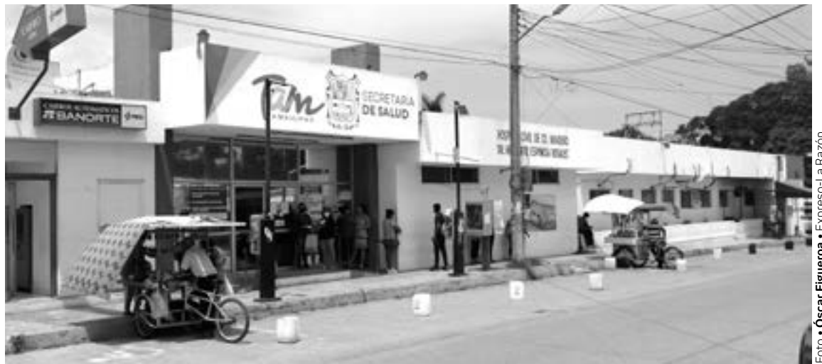
SERÁN RACIONADAS las pruebas COVID en hospitales públicos.

Confía que se controle el aumento de contagios por la variante Ómicron para que no se frene nuevamente la economía y se suspenda la llegada de negocios y construcciones como sucedió en el 2020, aunque dijo, en esta ocasión el pa-