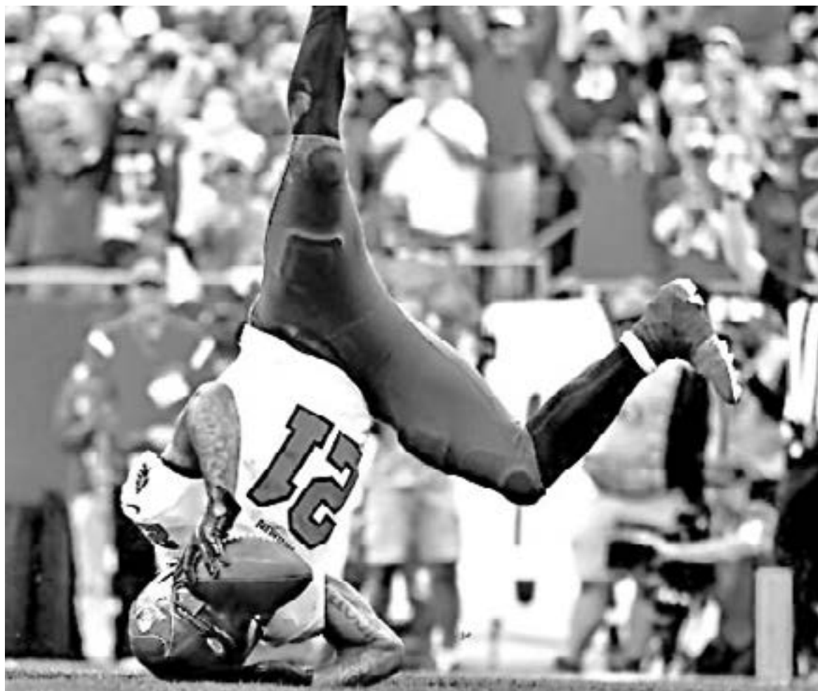
SE ESPERAN juegos de gran nivel.