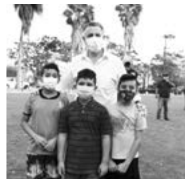
EL ALCALDE impulsa un programa de rescate de espacios públicos.