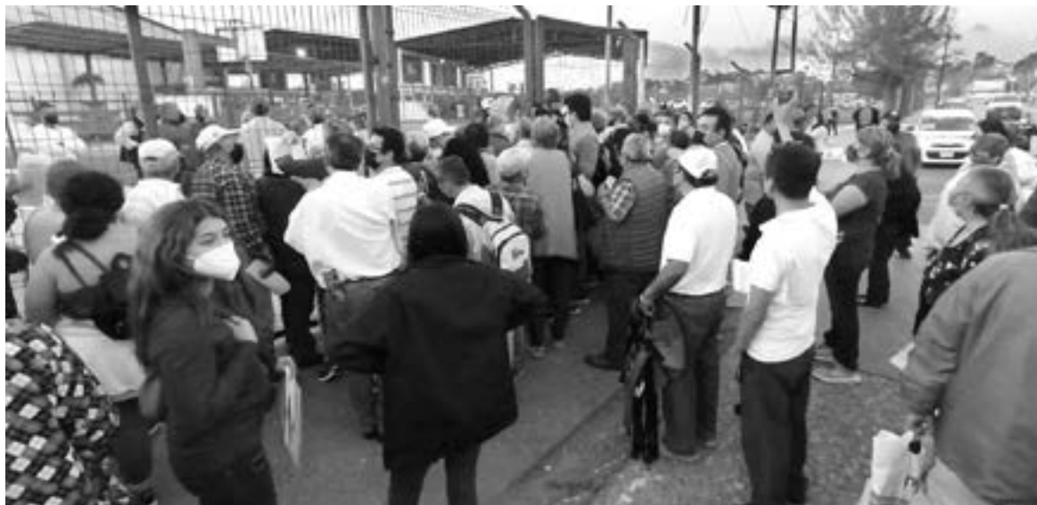
CIENTOS DE PERSONAS de formaron en los módulos de atención.

Los ciudadanos se mostraron molestos y calificaron como pésima la organización del Gobierno Federal para la aplicación de las dosis de refuerzo y a rezagados en una mis-