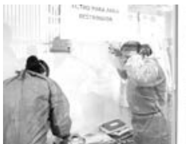
PICO DE CONTAGIOS de Covid, en la cima.

En el récord de casos, la ciudad de Matamoros se mantiene en el primer lugar con casi una tercera parte de los contagios, al notificar 498, seguido de Altamira que reportó 204, Tampico 185, Victoria 153, Nuevo Laredo 107, Madero 91, Mante 84 y