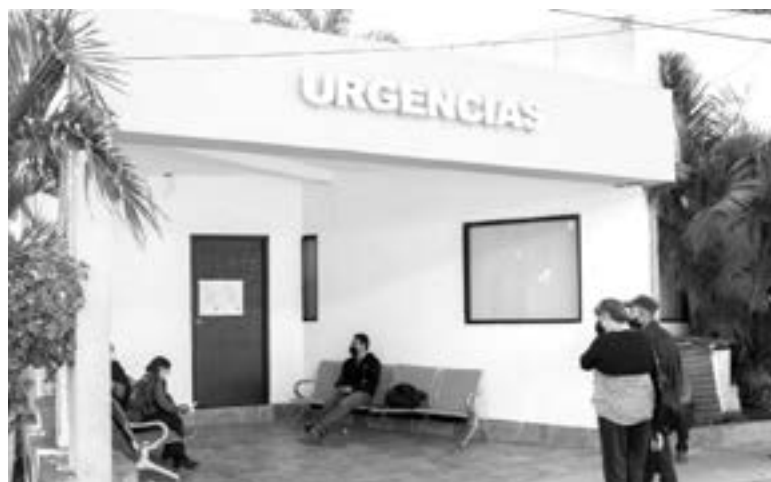
LA CLÍNICA DIF ALTAMIRA está abierta las 24 horas para atención al público.

En dos turnos de 7 am a 3 pm y de 3 pm a 11 pm se atiende a pacientes sospechosos de Covid