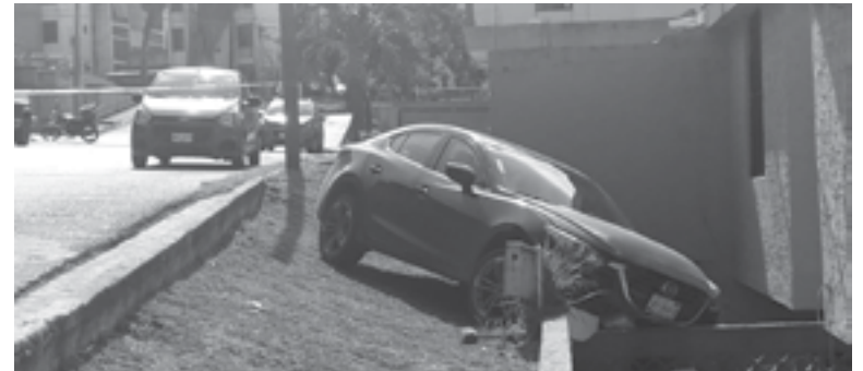
EL AUTOMÓVIL estuvo a punto de provocar un accidente.

El carro estaba estacionado en la calle Zapoteca y al parecer, su conductor no aplicó adecuadamente el freno por lo que la unidad comenzó a moverse hacia abajo por esa pendiente para luego salirse del camino y terminar a un costado de la calle.