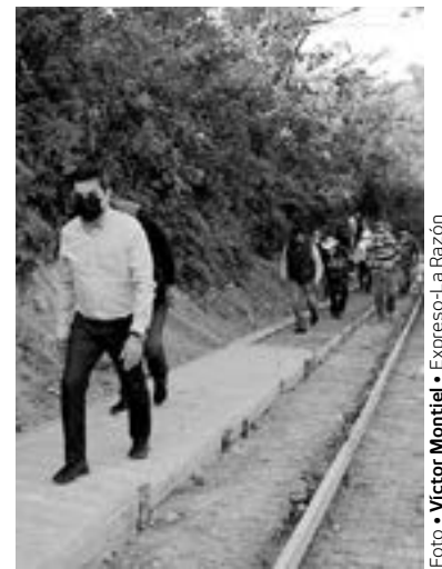
SE REALIZÓ la supervisión de la obra.

Manifestó que algunos otros también han salido a buscar trabajo en otras ciudades, sin embargo para los obreros ahorita la situación está muy complicada nivel nacional con muchos regresan a dedicarse a actividades muy modestas para poder sobrevivir.