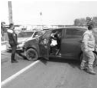
LA BOLSA de aire del vehículo se abrió tras el impacto.

no resultó lesionado por la activación de la bolsa de aire.