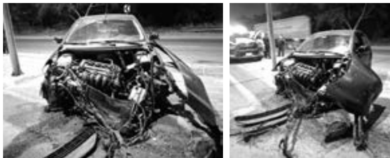
COMPLETAMENTE DESTROZADO quedó el vehículo tras el accidente.