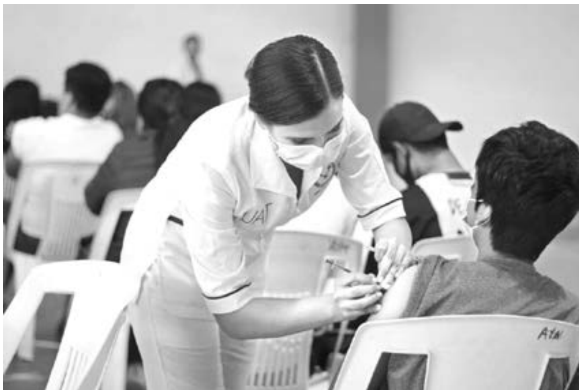
EN LA CONTRATACIÓN DE PERSONAL se pide el certificado de vacunación anticovid.

La distribuidora se localiza en la colonia Enrique Cárdenas González de Tampico, cuenta con una plantilla laboral superior a las 50 personas y tiene presencia en la zona conurbada, norte de Veracruz y en