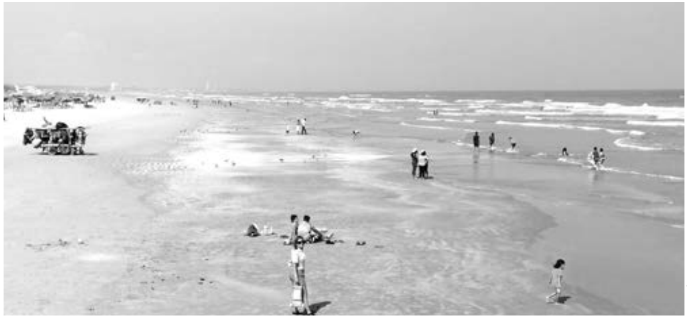
DISMINUYÓ LA AFLUENCIA de visitantes a Playa Miramar.

“Somos un Gobierno de palabra, respondemos a los maderenses con hechos. Agradezco la