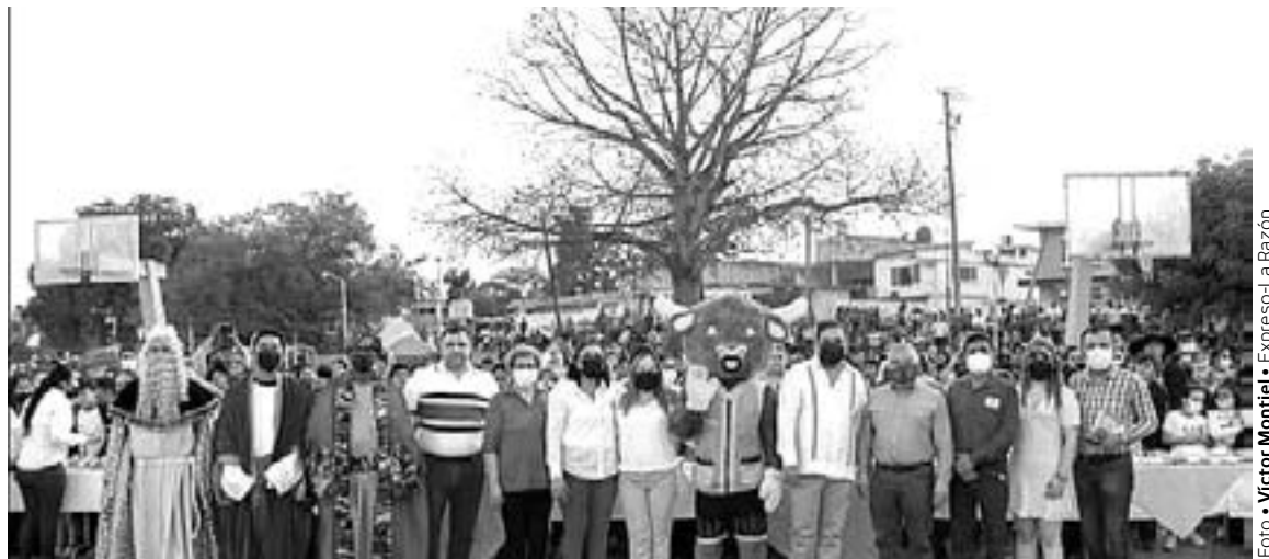
DURANTE EL EVENTO se contó con la presencia de los Reyes Magos.