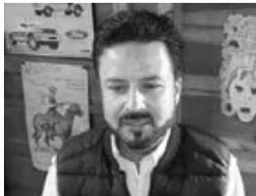
DUPUTADO LUIS Fernando Cervantes Cruz.

P ueblo Viejo.- El diputado local por el distrito 01 Luis Fernando Cervantes Cruz, pidió a las nuevas autoridades municipales ser rigurosas con el proceso de la entrega recepción y denunciar cualquier tipo de irregularidad.