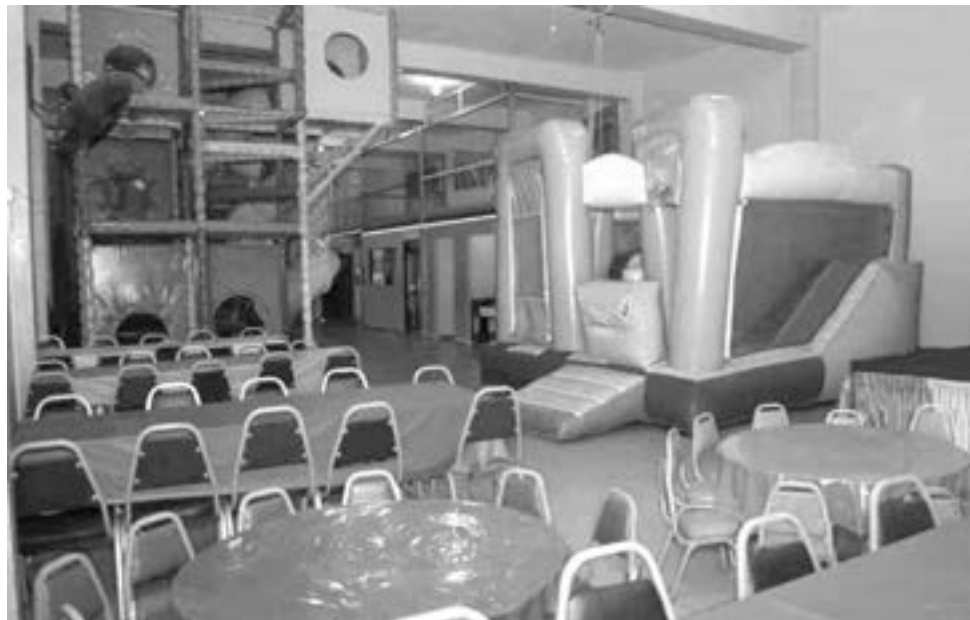
POR NUEVAS restricciones salones de fiestas solo tendrán servicio de caravanas.