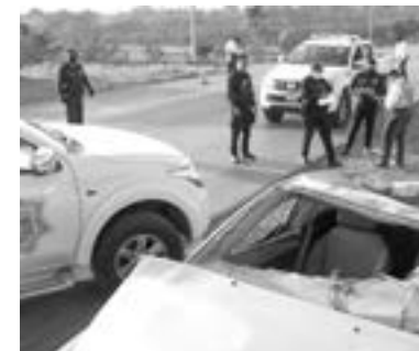
EL PROGRAMA busca prevenir accidentes viales.