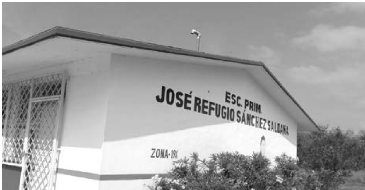
LA ESCUELA Primaria 'José Refugio Sánchez' fue visitada por los amantes de lo ajeno.