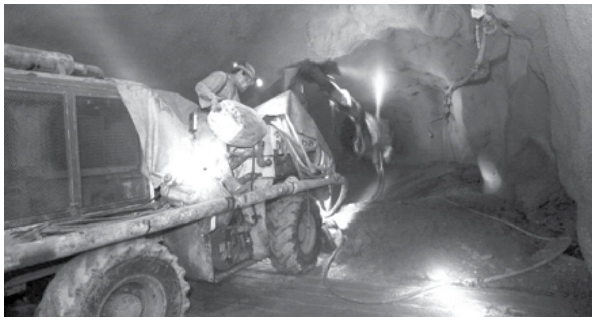
PEGA a minería la falta de concesiones