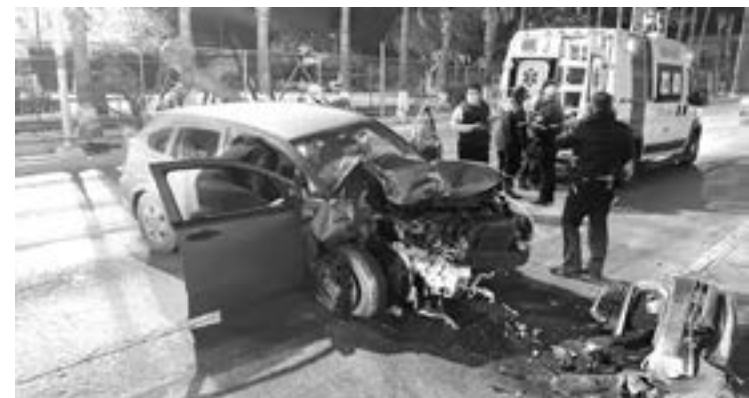
LA UNIDAD quedó completamente inservible.

personas resultaron lesionadas en este accidente