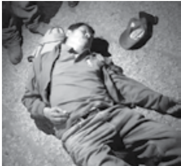
EL HOMBRE quedó tirado sobre el pavimento con fuertes golpes.