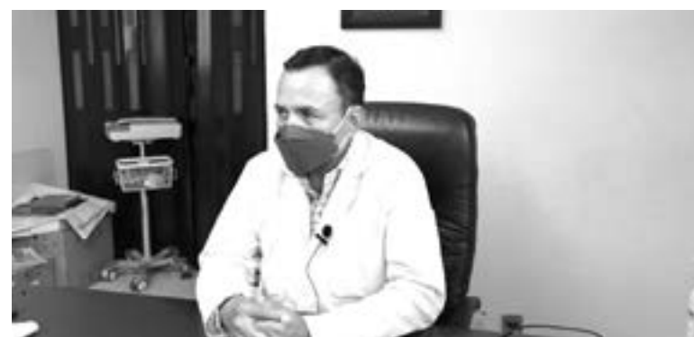
ASEGURA DIRECTOR del Hospital Civil que las vacunas han ayudado.

Indicó que han acudido pacientes con escurrimiento nasal, dolor de cabeza, pero afortunadamente no han ameritado un internamien-