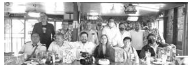
LA PRESIDENTA disfrutó con periodistas de la fuente.

enero se celebrara el día del periodista.