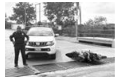
LA MOTOCICLETA quedó tirada sobre el pavimento.

Al sitio llegaron elementos de la delegación de Tránsito y Vialidad de Altamira, quienes tomaron conocimiento de los hechos para deslindar las responsabilidades y pedir la intervención de una grúa para trasladar la motocicleta que quedó bastante dañada.