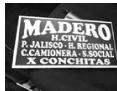
REGRESA MADERO TANCOL en carro de ruta.

Con base en datos de la Secretaría de Salud de Tamaulipas, en la urbe petrolera el 70 por ciento de la población tiene completo el esquema de vacunación y está previsto que en próximas semanas comience la aplicación de la tercera dosis para personas de la tercera edad.