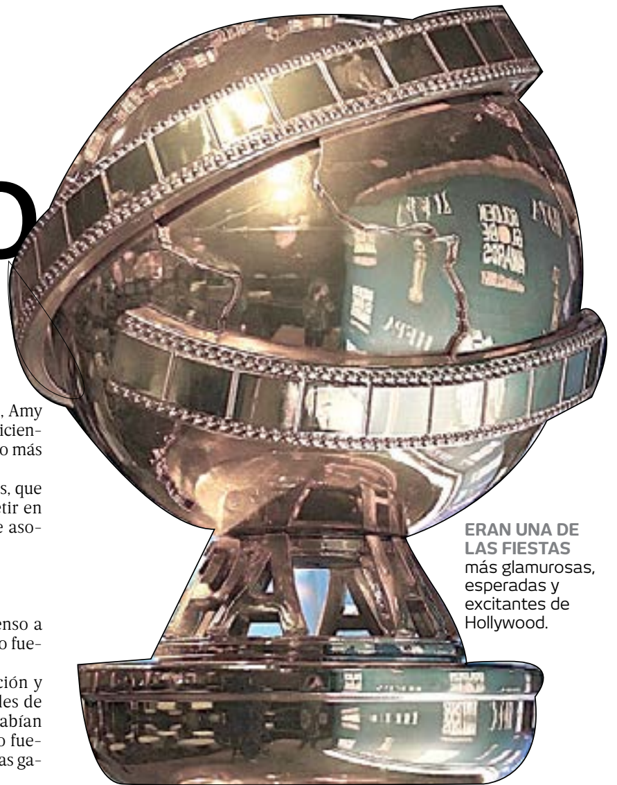
ERAN UNA DE LAS FIESTAS más glamurosas, esperadas y excitantes de Hollywood.

Las acusaciones de corrupción y comportamientos muy discutibles de los miembros de la HFPA se habían conocido durante años e incluso fueron motivo de chiste en las propias galas.