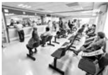
AUMENTA EL PAGO del predial por medio de la aplicación de celular.

El rezago que hay en el pago del impuesto predial en Madero asciende a 46 millones de pesos, ya que un promedio de 30 mil contribuyentes no cumplen en cubrir dicho impuesto.