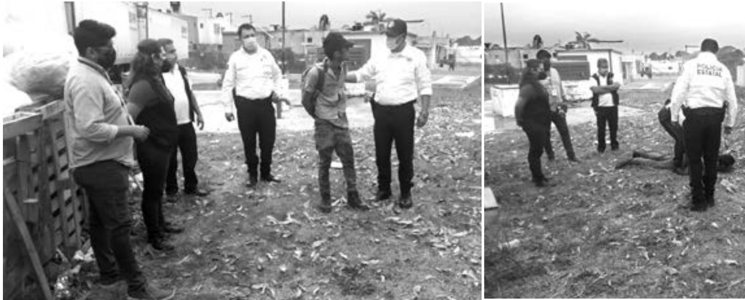
EL SUJETO fue detenido infraganti.