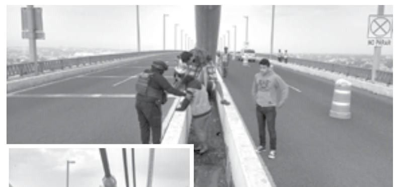
LOS POLICÍAS lograron convencerla de no atentar contra su vida.

Los policías lograron convencerla de no atentar contra su vida y fue así como se retiró del barrandal.