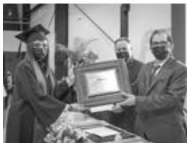
EL GIMNASIO Multidisciplinario UAT-Reynosa fue el recinto oficial de la entrega de cartas de pasante a estudiantes.

El Gimnasio Multidisciplinario UAT-Reynosa fue el recinto oficial de la entrega de cartas de pasante