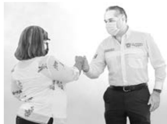
REFRENDA ALCALDE su respaldo a la ciudadanía.

por las colonias donde hace entrega de obra pública, es constante la solicitud y atención en materia de pavimentación, limpieza de canales, alumbrado público y mantenimiento de áreas verdes.