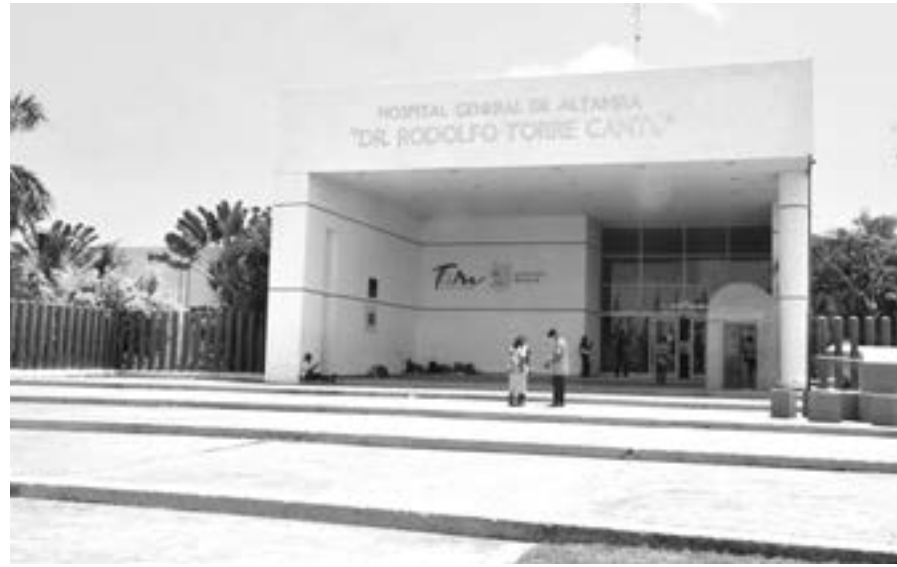
LAS SEDES de vacunación serán los hospitales Canseco, Civil y Torre Cantú.