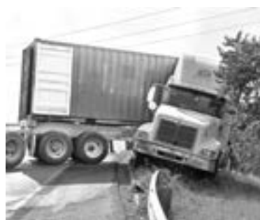
LA UNIDAD quedó recostada sobre un costado de la carretera.

cuando se presentó este accidente en el Boulevard Julio Moctezuma en el carril que procede del puerto de Altamira con destino a la