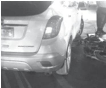
EL MOTOCICLISTA terminó en el pavimento.