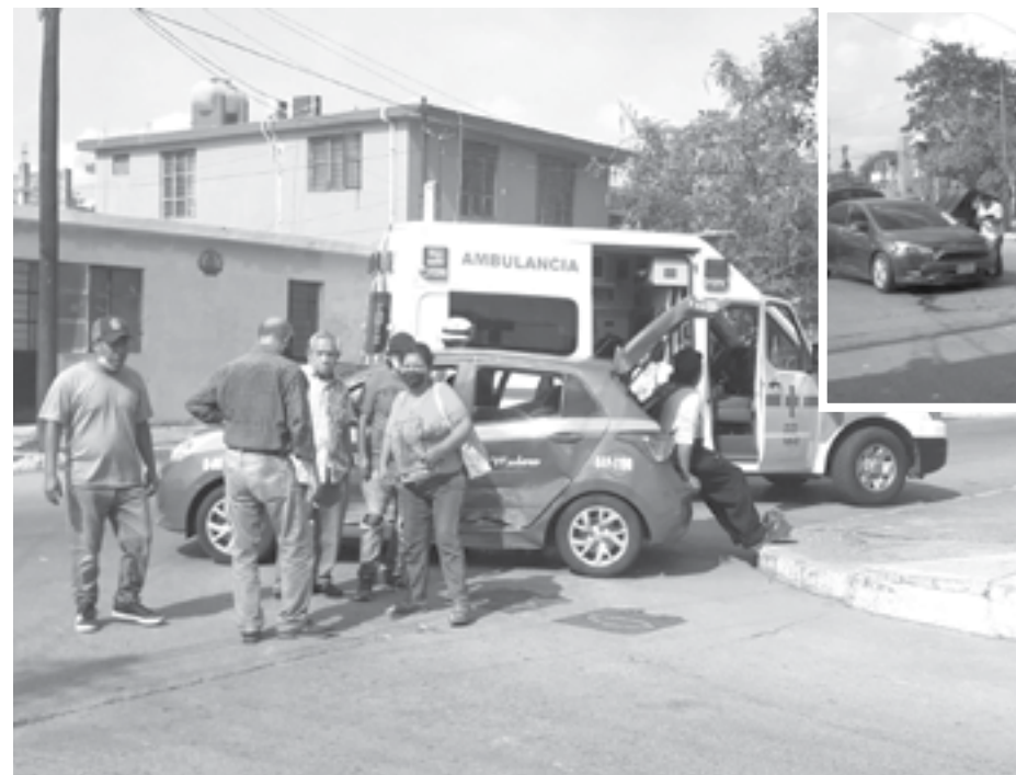
LOS DAÑOS materiales en ambas unidades fueron cuantiosos.

TRAS OMITIR UN ALTO UN VEHÍCULO PARTICULAR IMPACTÓ A UN CARRO DE RUTA SIENDO TAN FUERTE EL GOLPE QUE LOS TRIPULANTES RESULTARON LESIONADOS