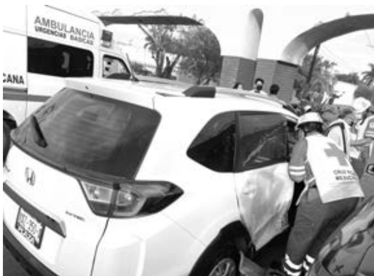
LA PAREJA de ancianos viajaba en una camioneta Honda.

El accidente se desarrolló, cuando la pareja viajaba en una camioneta Honda de modelo reciente con placas de Tamaulipas, y se desplazaba sobre los carriles