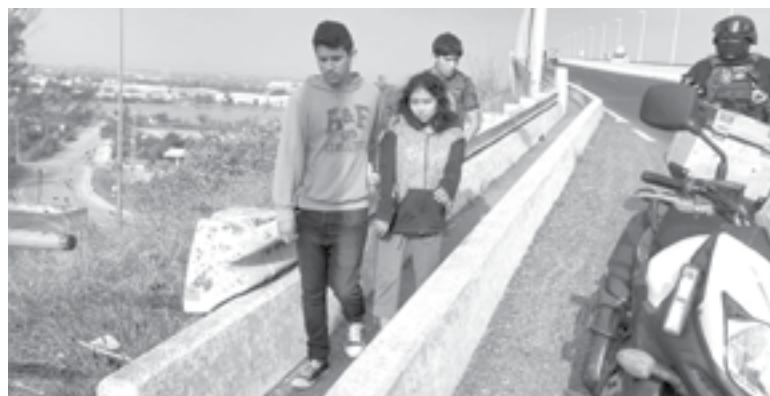
EL ESPOSO de la mujer se comprometió a hacerse cargo de su pareja.

CICLISTAS Y CONDUCTORES QUE TRANSITABAN POR EL PUENTE TAMPICO SEÑALARON A LAS AUTORIDADES QUE LA FÉMINA INTENTABA LANZARSE AL RÍO