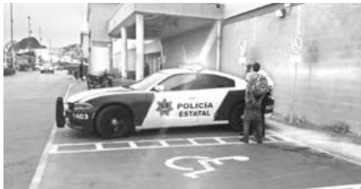
POLICÍAS ESTATALES realizaron la detención.