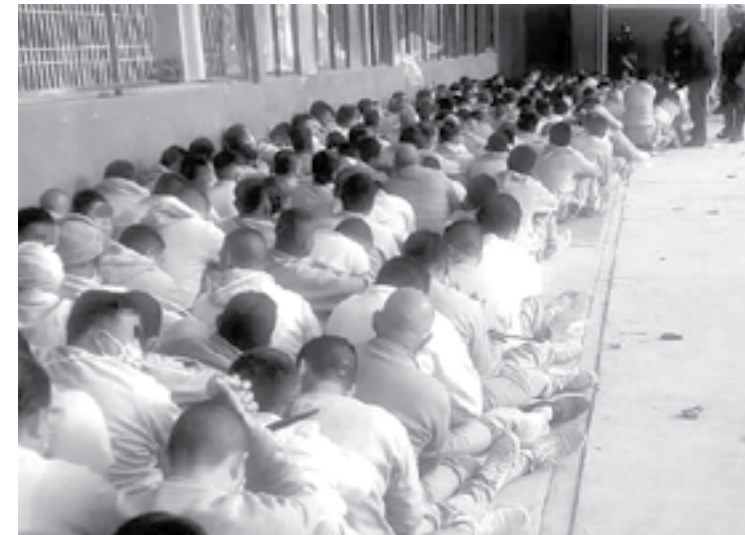
DETECTAN COGOBIERNO en penal de Nuevo León

"Ese corrimiento que se dio es lo que logró la contundencia (en 2018). No estoy de acuerdo con radicalizar".