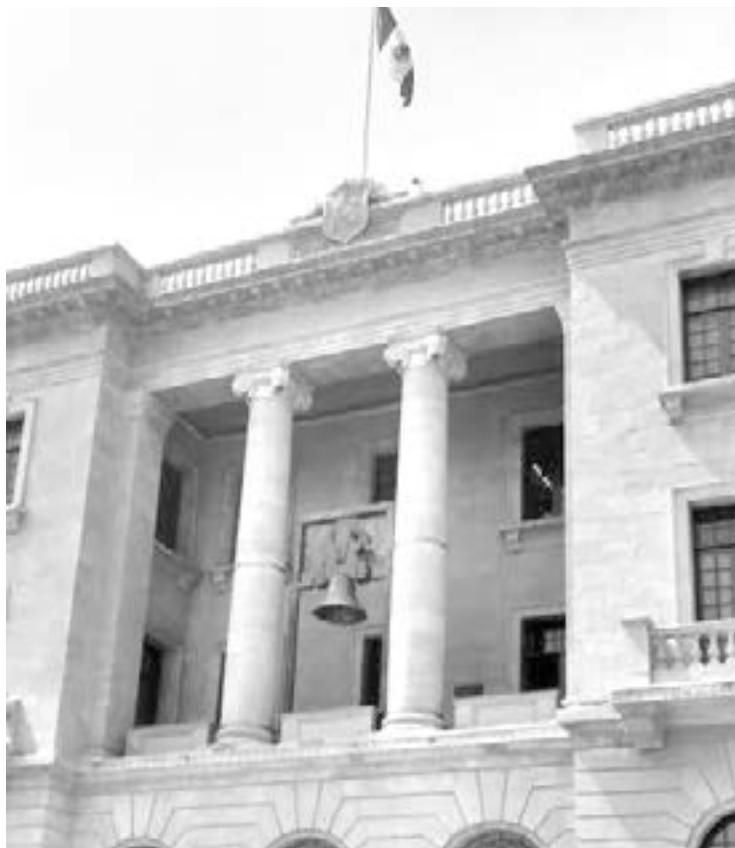
EN LOS ÚLTIMOS DÍAS reportaron 5 burócratas enfermos de Covid-19.

LOS TRABAJADORES ENFERMOS PERTENECEN A DIVERSAS ÁREAS DEL AYUNTAMIENTO Y SE ENCUENTRAN EN TRATAMIENTO AISLADOS EN SUS CASAS