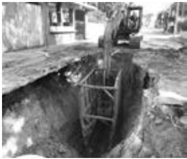
COMAPA ALTAMIRA optimiza funcionamiento de sistema de drenaje.