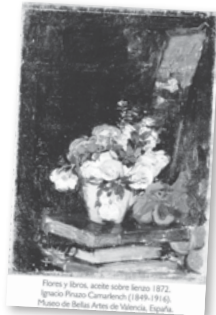
Flores y libros, aceite sobre lienzo 1872. Ignacio Pinazo Camarlench (1849-1916). Museo de Bellas Artes de Valencia, España.

En lo callado de la casa, el uno de enero y los días subsiguientes se avizoran cual libro en que empiezan a escribirse las primeras páginas. Los sueños se recomponen en mente y corazón, y los proyectos en los espacios. A la manera de Whitman se pueden observar las estrellas, se puede reflexionar en la clave de los universos y del futuro. Las