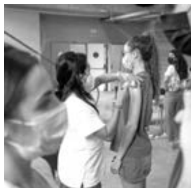
LOS ADOLESCENTES completan su dosis de vacunación.

Torres Mar señaló que además en esta zona no hay recorridos de la Policía Estatal Acreditada aunado a que la escuela no tiene barda lo cual hizo más fácil el ingreso de los ladrones.