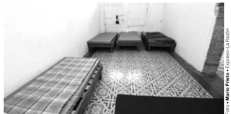
EL REFUGIO da atención a personas sin hogar.

Féres de Nader expuso que una vez que las personas en condición de vulnerabilidad ingresan al refugio temporal, se les proporciona