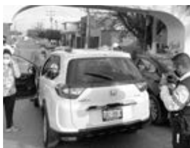
LOS DAÑOS materiales fueron elevados.