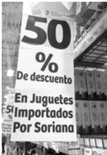
OFERTAN JUGUETES a bajo costo.