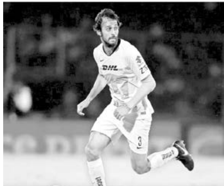
EL JUGADOR ha tenido un excelente año deportivo.