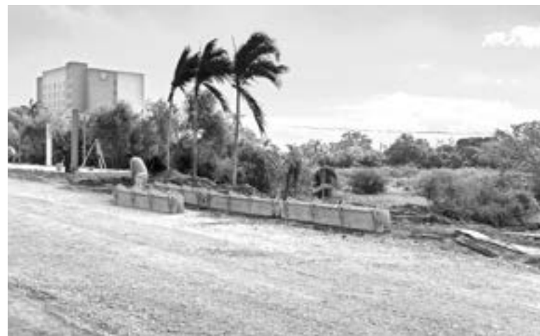
LA EMPRESA POSCO construye los paraderos en la avenida De la Industria.

Expresó que por ello le piden a las autoridades la instalación de estos topes que tienen como finalidad disminuir los riesgos de accidentes viales en este cruce carretero.