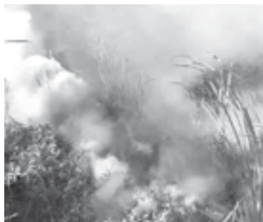
EL FUEGO consumió los neumáticos.