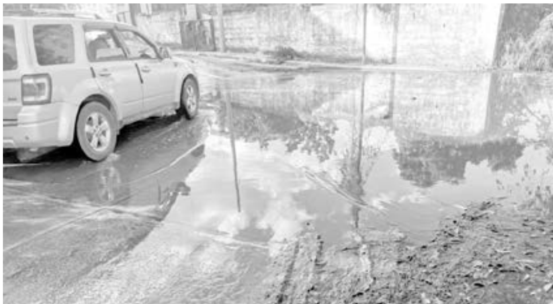
LOS ESCURRIMIENTOS se originan debido al colapso de una alcantarilla.