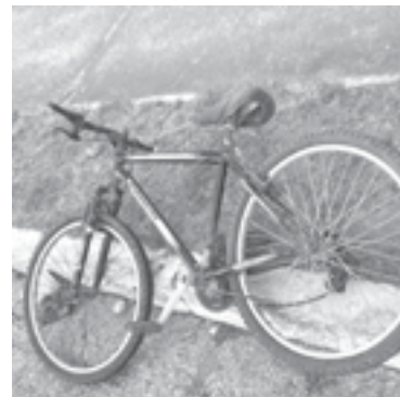
LA BICICLETA quedó tirada sobre la banqueta.