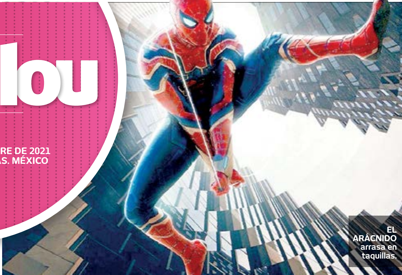
EL ARÁCNIDO arrasa en taquillas.

tualmente en HBO Max. A nivel mundial, ha recaudado 69.8 millones de dólares hasta la fecha.