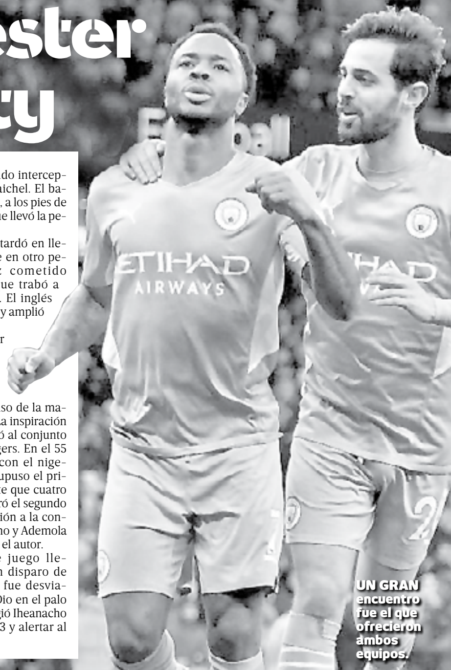
UN GRAN encuentro fue el que ofrecieron ambos equipos.

A la hora de juego llegó el tercero. Un disparo de Madisson lejano fue desviado por Ederson. Dio en el palo después y lo recogió Iheanacho para anotar el 4-3 y alertar al City.