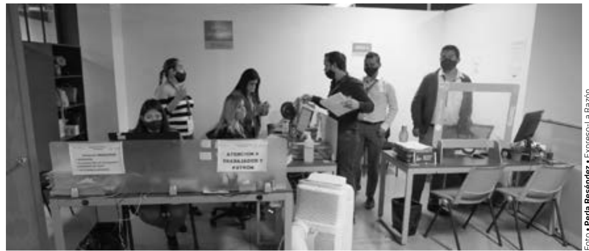
MUCHAS DE LAS QUEJAS están relacionadas con asuntos laborales.

EN EL 2021 SE INCREMENTARON LAS RECOMENDACIONES EMITIDAS POR LA CODHET CONTRA DIVERSAS AUTORIDADES, SOBRE TODO RELACIONADAS CON SEGURIDAD, TRABAJO Y EDUCACIÓN; LA MAYORÍA SE CUMPLIERON A MEDIAS