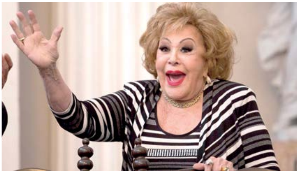
SILVIA PINAL, actriz, productora y presentadora de televisión.