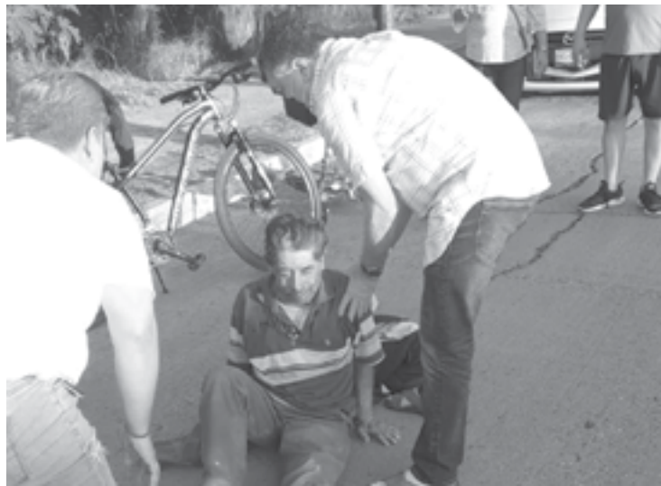
EL HOMBRE recibió apoyo de algunos transeúntes.

nera reciente se han limpiado por personal de servicios públicos del ayuntamiento de Altamira pero continuamente es usada como depósito de basura.