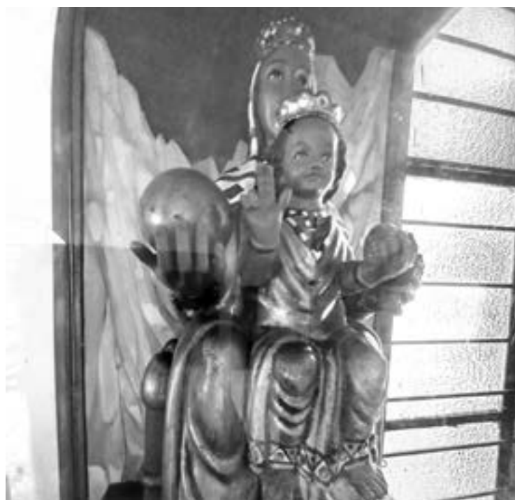
EN EL EJIDO MACLOVIO HERRERA se encuentra la capilla a la Virgen de Nuestra Señora de Montserrat.

ALTAMIRA ES DE LOS POCOS MUNICIPIOS QUE CUENTA CON UNA CAPILLA DEDICADA A LA VIRGEN MÁS FAMOSA DE ESPAÑA, NUESTRA SEÑORA DE MONTSERRAT