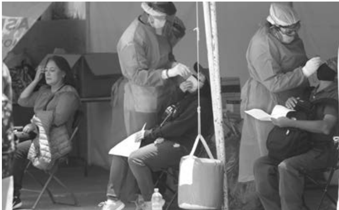
SIGUE AVANZANDO la nueva variante del virus