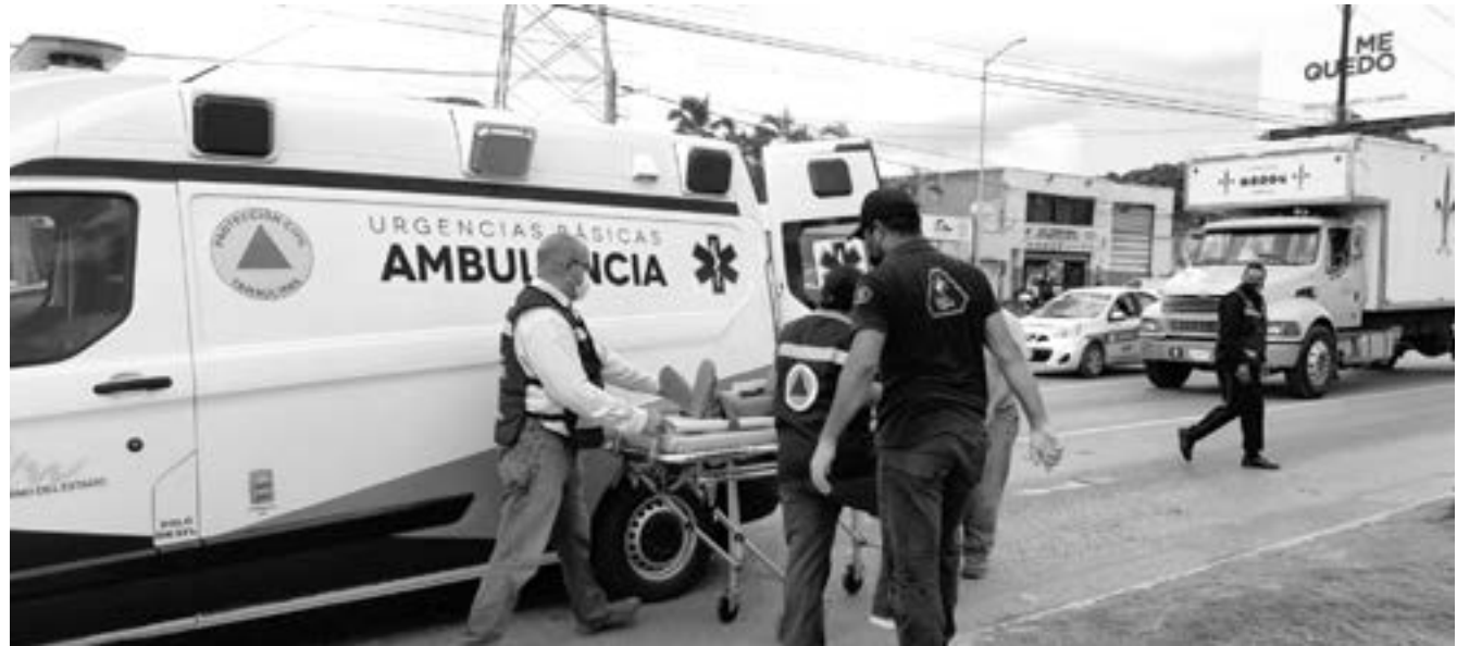
EL INCREMENTO en la movilidad urbana también ha aumentado el número de accidentes en el municipio.

Ante ello, la primera autoridad de esta ciudad y puerto acudió junto a su equipo de trabajo a la denominada Isla de la Esperanza, ubicada en las inmediaciones de la Laguna del Champayán, un montículo cuyo potencial turístico será aprovechado por la presente administración del ayuntamiento para ser integrado al máximo paseo turístico de la ciudad, y de esta manera abonar a la proyección de la misma e incentivar el desarrollo