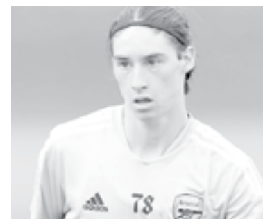
EL MEXICANO se encuentra listo para jugar con el equipo.

Albert Sambi, Calum Chambers y Pablo Mari han dado positivo por coronavirus por lo que el director técnico español no podrá contar con ellos y por ello echa mano de