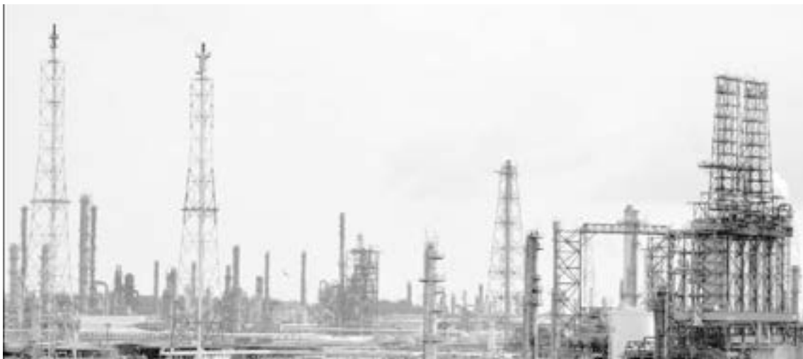
LA REFINERÍA MADERO fue la que menos produjo gasolina en noviembre.

En junio pasado reinició operaciones la planta Coque, una de las más importantes con que cuenta el procesador y empezó con una producción inicial de 22 mil barriles diarios, los cuales no se comparan con los 50 mil que producía cuando comenzó el funcionamiento en el 2002.