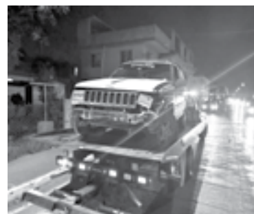
LA CAMIONETA fue remolcada por una grúa.

A través de la Central de Emergencias, fue emitido un llamado de auxilio un poco después