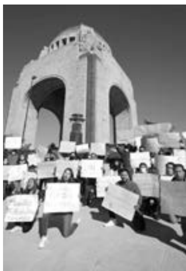
SE REUNIERON en el Monumento a la Revolución