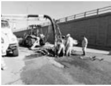
REALIZA COMAPA Altamira reparación permanente de infraestructura hidrosanitaria.