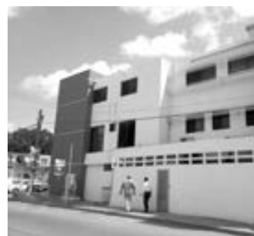
SE HAN ATENDIDO casos de influenza en la clínica del DIF Madero.

“Hay presencia en Reynosa y en Valle Hermoso —indicó—. Esto fue detectado en 2016. Hay estados que no tenían problemas de rabia; por ejemplo, Nuevo León, que a la fecha tiene catorce casos, y colinda con Tamaulipas”.