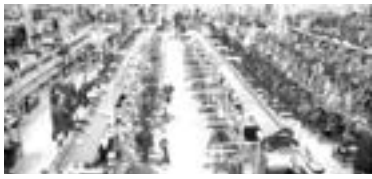
LA PANDEMIA siguió golpeando a la economía.