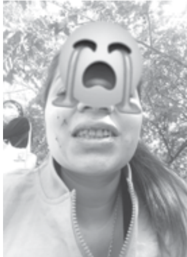
LA MUJER subió fotografías de los golpes recibidos.