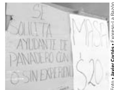
LAS CUATRO panaderías que hay en el municipio están en igualdad de condiciones.

vehículos particulares, de carga y de transporte público; por consecuencia el material tampoco resiste tanto.