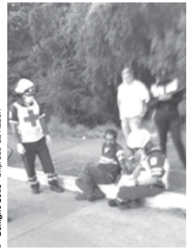
EL ADULTO mayor fue atendido por socorristas.