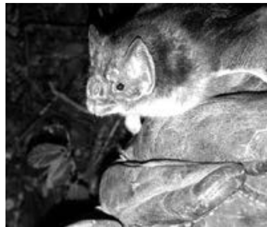
DESARROLLAN MODELO para conocer distribución del murciélago vampiro en Tamaulipas.