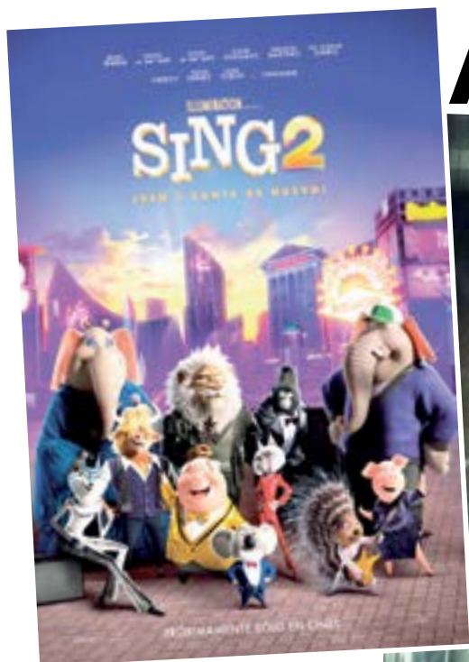
SING 2 no pudo desbancar al arácnido.

de la Fuerza por ser la tercera película más rápida en hacerlo.