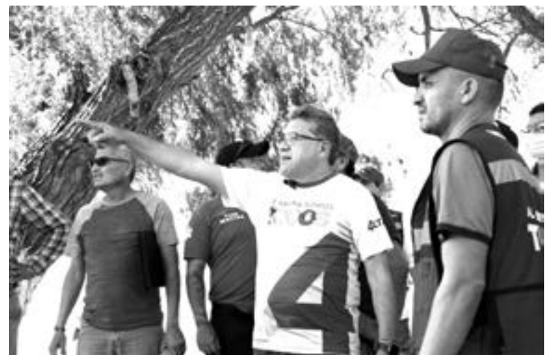
EL PRESIDENTE MUNICIPAL supervisó los trabajos que se realizan en la Isla de la Esperanza.

la media noche del 31 de diciembre, simbolizando así la luz de esperanza de un mejor 2022 para el municipio. Además, como parte de las mejoras en esta zona se realizó el retiro del exceso de lirio acuá-