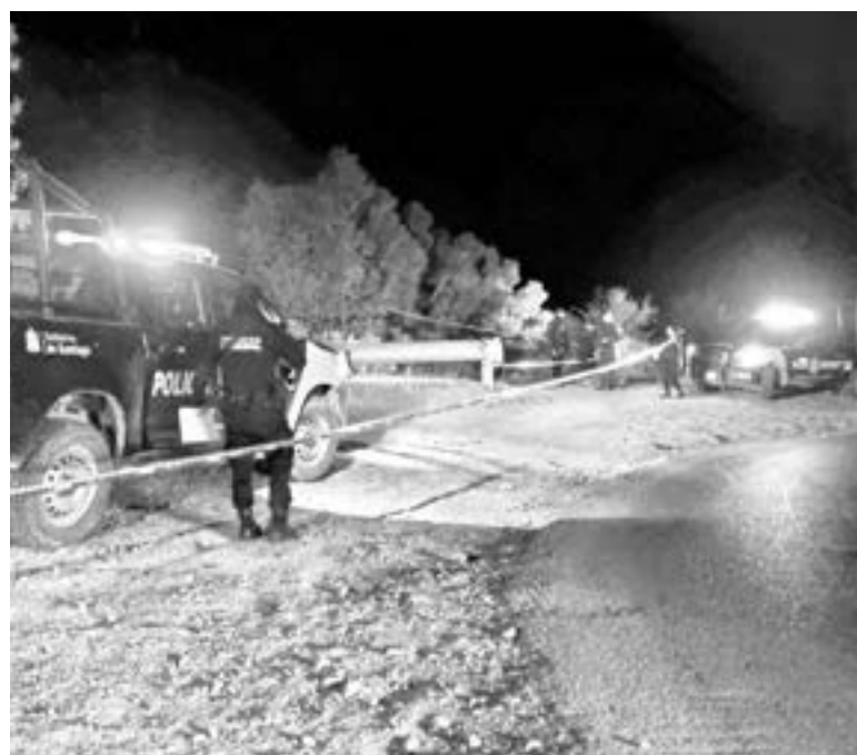
EL CUERPO estaba envuelto en plástico transparente

poco después de las 16:00 horas, al cruce de las Calles Pelicano y