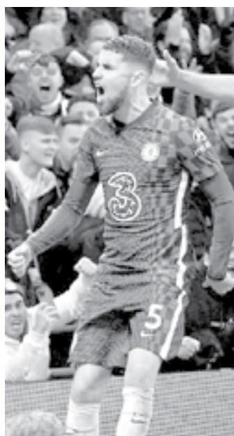
EL ENCUENTRO se disputó de gran forma.

Todo cambió, con la salida de Lukaku. Y en cuanto pudo, mar-