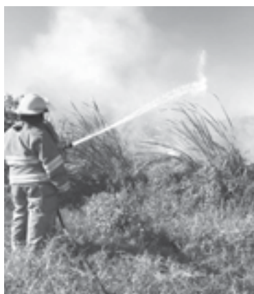
BOMBEROS lograron sofocar el incendio.