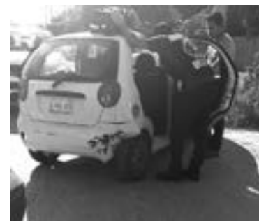
EL PASAJERO del Matiz resultó con molestias físicas.

Peritos viales se trasladaron al lugar de los hechos para intervenir a fin de determinar quien era el responsable en ese accidente.