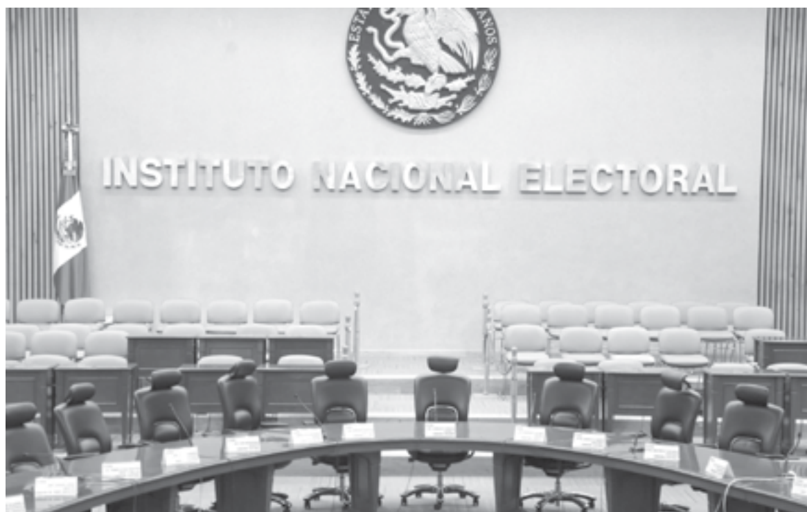
DENUNCIA BUSCA inhibir la independencia del instituto: INE

"Es muy preocupante que el Presidente de la Cámara de Diputados pretenda convertir un diferendo legal en una persecución penal, con denuncias ante la Fiscalía General de la República contra Consejeros y Consejeras que votaron a favor del acuerdo mencionado, así como contra el Secretario Ejecutivo, quien no vota