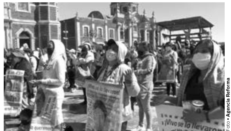
SE CELEBRÓ una misa en la Basílica por 87 meses del caso Iguala

La misa se ofreció en el exterior del templo mariano, con el Obispo en uno de los balcones del edificio con las imágenes de la Virgen María y San Juan Diego,