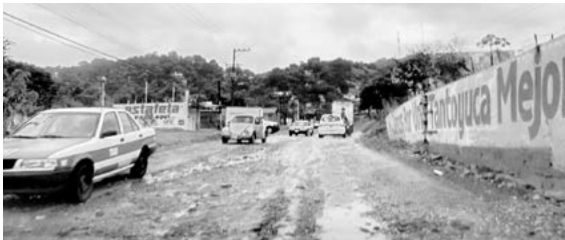
PIDEN SOLUCIÓN a construcción del paso desnivel.

A pesar de la rehabilitación que han realizado los gobiernos locales, en poco tiempo el material que utilizan se destruye, lo