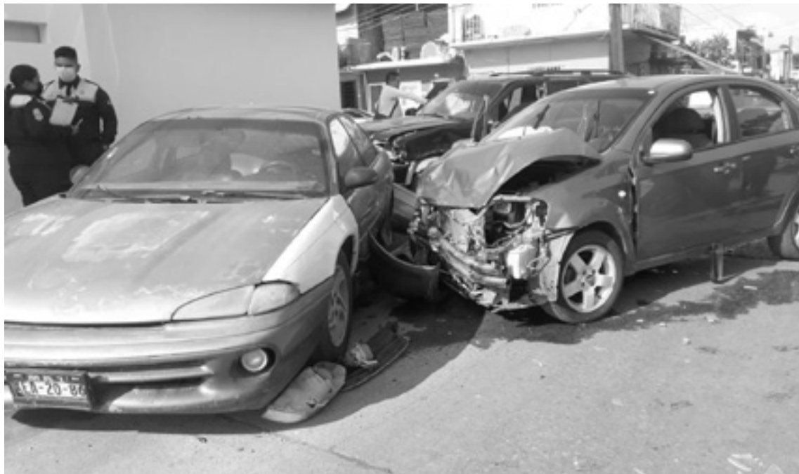
EL AUTO quedó completamente destrozado.