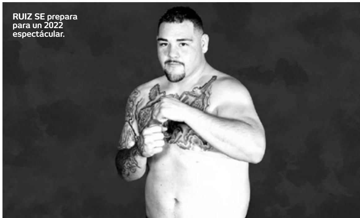
RUIZ SE prepara para un 2022 espectacular.

dad de México, hemos buscado un gran evento para nuestra capital”, añadió con respecto a una posible pelea Ruiz vs Wilder en la CdMx.