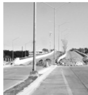
EL PUENTE tiene seis meses cerrado.