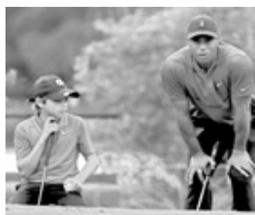
WOODS ESTUVÓ acompañado por su hijo.

En las últimas semanas, el ex número uno mundial ha reconocido que llegó a temer la amputación de su pierna después de que se es-