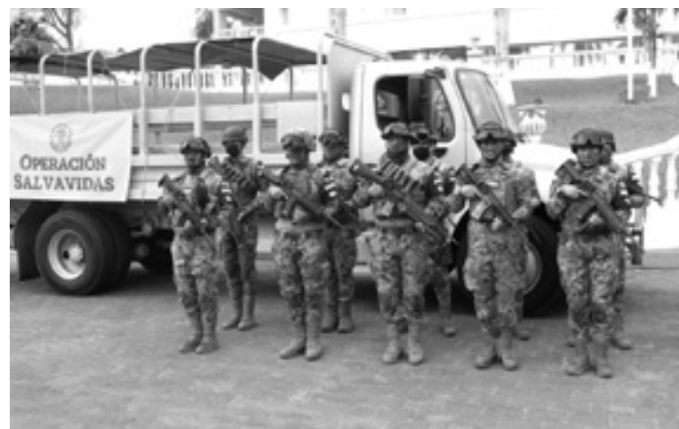
ELEMENTOS DE LA MARINA vigilarán Miramar.

Marítima ENSAR de Tampico, con el apoyo del personal de los Mandos Navales, los que estén preparados para acudir de manera oportuna al llamado de la ciudadanía; dotados con embarcaciones rápidas y personal altamente capacitado para realizar, en caso de ser necesario, acciones de rescate de personas que se encuentren en peligro de ahogamiento.