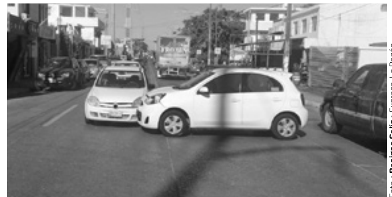
UN NISSAN MARCH blanco y un Chevy del mismo color colisionaron en ese transitado cruce.

Ambas unidades resultaron dañadas de la carrocería tras el impacto.