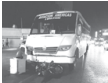
LA MOTOCICLETA quedó bajo la unidad de transporte.

nas que presenciaron el hecho auxiliaron al motorista que presentaba heridas sangrantes y lesiones en distintas partes del cuerpo.