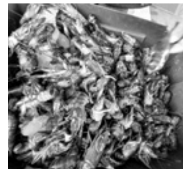
VENDEN LANGOSTINOS en 5 kilos por 100 pesos.

escasea llega un solo kilo a 100 ó hasta 120 pesos el kilo pero actualmente hay mucha producción como si fuera camarón.