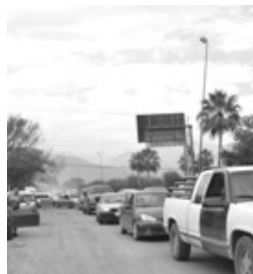
SE GENERÓ un intenso embotellamiento.

Primeramente un March fue golpeado por un Mazda y éste a su vez por un Jetta.