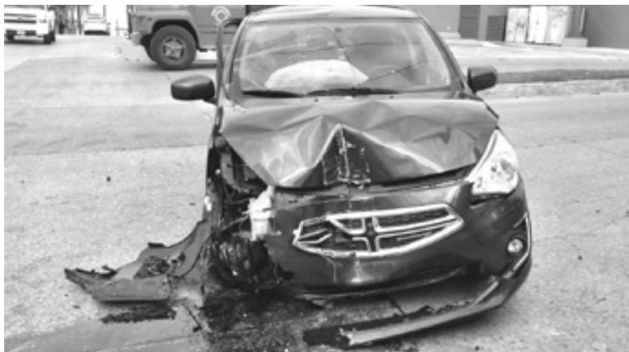
DESDE HACE UNA SEMANA aumentaron los accidentes de Tránsito en Altamira.