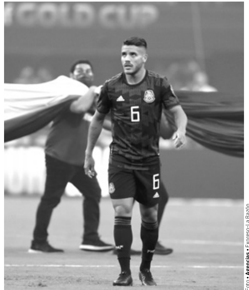
EL EQUIPO MEXICANO que ha mostrado interés por Jonathan es América.

ESPN también ha podido confirmar que el Houston Dynamo es el club que le ha hecho la mejor propuesta económica a Jona, al ofrecerle los mismos 2 millones USD para el 2022 en la MLS, si bien las fuentes dijeron a este medio que Dos Santos tiene claro que su gran objetivo el próximo año es formar parte de la Se-