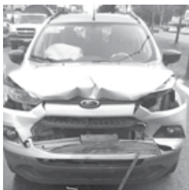
LAS UNIDADES quedaron detenidas a media calle.

Por esa zona, circulaban un Volkswagen Jetta gris, una Ford