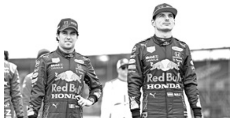
VERSTAPPEN DIJO que sin Pérez no lo hubiera sido lo mismo.

dó en asegurar que “sin él no sería campeón del mundo”, ya que además en otras carreras también lo apoyó para no quedar en desventaja ante Lewis.