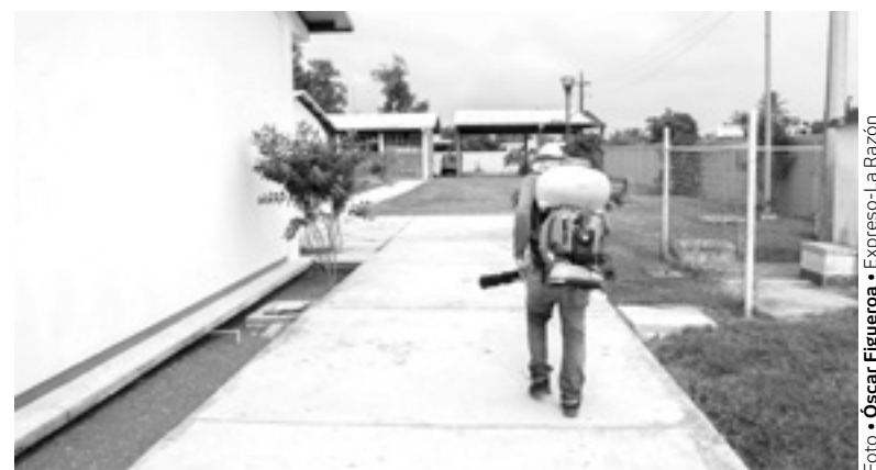
LIMPIAN Y FUMIGAN planteles educativos.