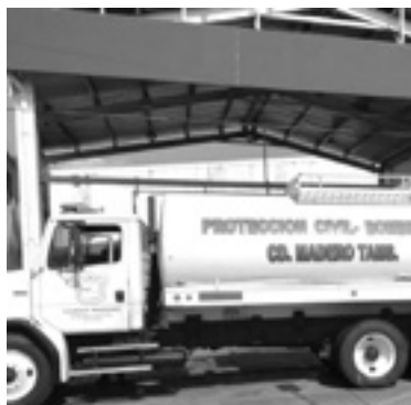
APOYARÁN A INDIGENTES cuando la baje a 5 grados.

Para resguardar a las personas en condición de calle se cuenta con 2 albergues, tales como: el área de capacitación de Protección Civil y el Auditorio Municipal, en donde se les proporcionará alimento.