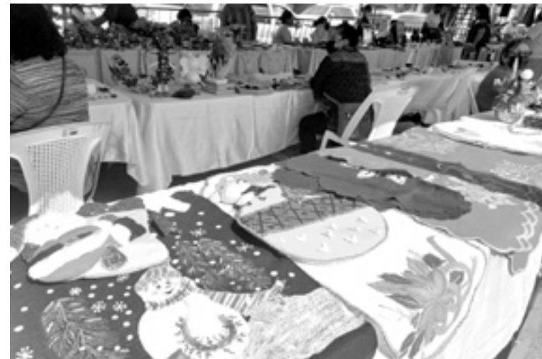
HUBO BUENAS VENTAS en la Expo Navidad.

El evento se realizó el viernes 17 y ayer sábado 18 de diciembre y donde se instalaron 123 locatarios que son originarios del municipio de Altamira.