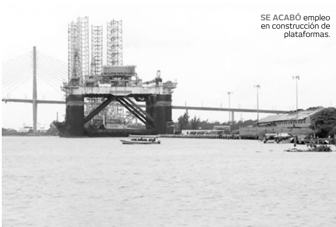
SE ACABÓ empleo en construcción de plataformas.