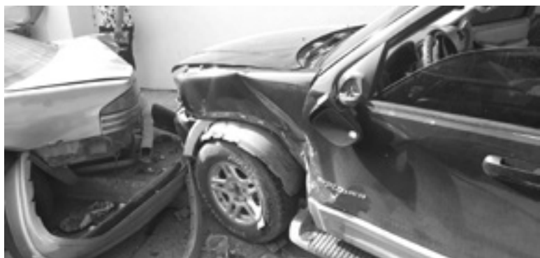
LA CAMIONETA quedó destruida tras el fuerte impacto.

La calle Canseco fue cerrada a la circulación mientras se efectuaba el peritaje correspondiente.