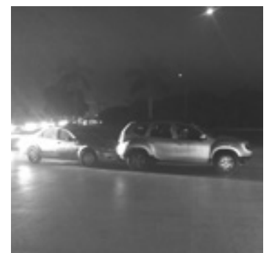
UN STRATUS y una Renault protagonizaron el choque.

Un Dodge Stratus gris y una Renault Duster del mismo color