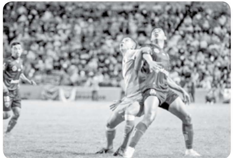
UN GRAN ENCUENTRO fue el que se disputó.