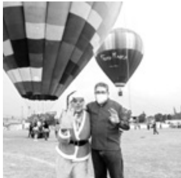
EL ALCALDE fungió como anfitrión del evento.

“Se estableció contacto con Protección Civil Estatal, municipal, Capitanía de Puerto, entre otros para monitorear el clima y prever cualquier incidente”, finalizó. De esta manera, concluyó la primera gran Navidad en Globo 2021, donde además la ciudadanía altamirense disfrutó de una estupenda muestra gastronómica, música de DJ en vivo, pirotecnia, mixología, entre otras amenidades, y con ello se abonó a la reconstrucción del tejido social de las familias a la par que se incentivó el turismo y el desarrollo económico de micro, pequeñas y medianas empresas gracias a la afluencia de visitantes.