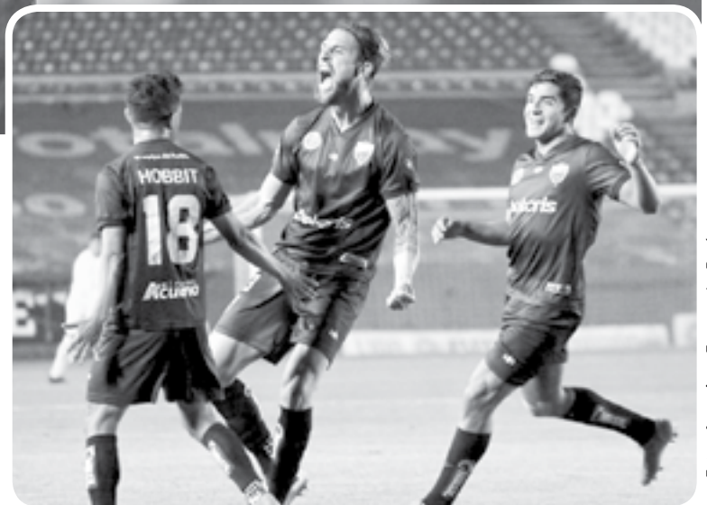
LOS POTROS anotaron 3 tantos a la Jaiba.

Finalmente, Atlante venció a Tampico Madero con marcador global de 3-0 y levantó su primer título en Liga Expansión Mx.