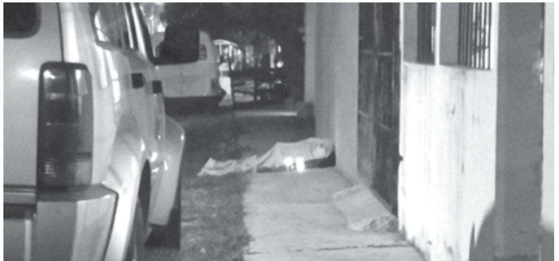
VECINOS COLOCARON veladoras junto al cuerpo del hombre.

Presuntamente, el Jetta bajó la velocidad al acercarse a un semáforo cuando de pronto fue impactada en la parte trasera por la camioneta roja que a su vez fue golpeada por detrás por la camioneta gris.