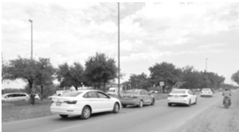
EL JETTA terminó involucrado en dos golpes.

Después de qué las partes dialogaron el responsable se retiró, sin embargo, el afectado al quedarse varado, otros automovilistas no se