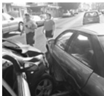
LOS PROPIETARIOS buscaron llegar a un acuerdo.