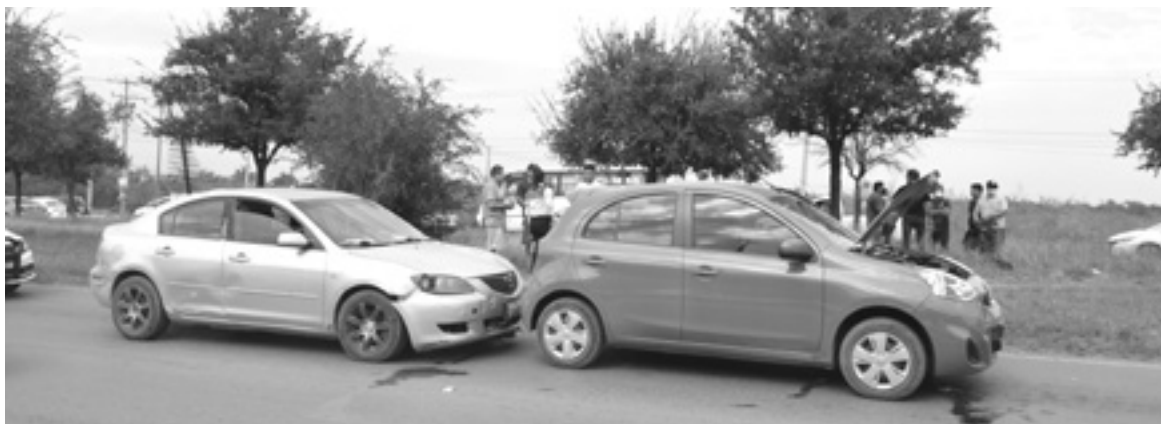
DOS DE LOS VEHÍCULOS participantes.

UN PERCANCE POSTERIOR Y UNA CARAMBOLA OCURRIERON LA TARDE DE AYER EN ESE LIBRAMIENTO, DEJANDO UN SALDO DE VARIOS MILES DE PESOS EN DAÑOS