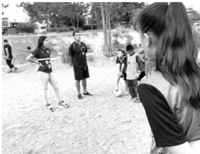
LA JUGADORA victorense contó su experiencia