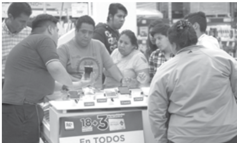
CON EL AUMENTO de las tasas de interés se incrementan beneficios de ahorro.

incrementarse, podrían ya no ser tan atractivas para las instituciones que venden bajo este esquema”, afirmó.