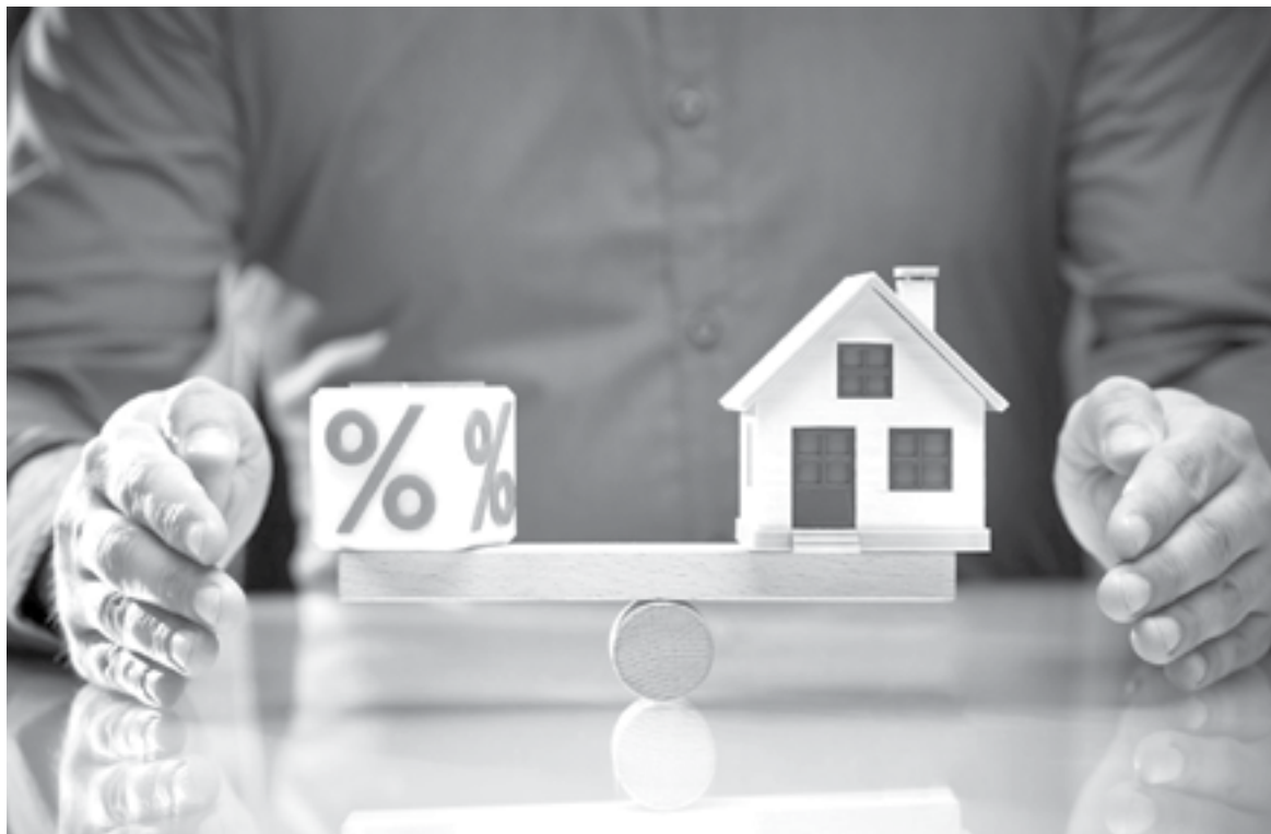
LA ECONOMÍA familiar sufrirá por el aumento en los costos de créditos.

“En los consumidores que tienen múltiples demandas de bienes tiene un impacto en cuanto al tipo de oferta, ahorita vemos muchas promociones de meses sin intereses, porque las tasas de interés son muy bajas, pero si llegan a subir veremos que estás promociones que hoy prevalecen en tiendas comerciales, pues podrían ir reduciéndose porque al