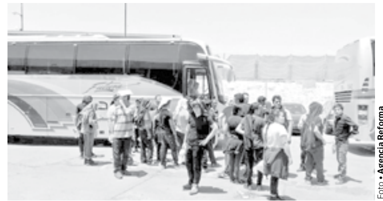
OTRO PROBLEMA más para México.

—Listo Profe, vamos a pedir la mano de su artista.