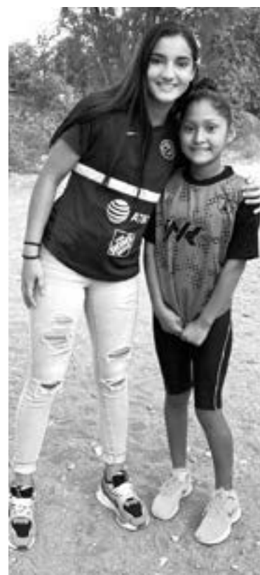
LAS NIÑAS del equipo fueron las más felices

Por su parte, el equipo agradeció la presencia de la jugadora quien al final se tomó fotografías y les prometió que pronto se echará una reta con ellos.