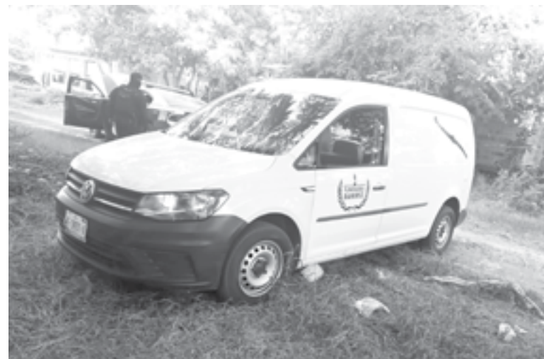
DE FORMA inmediata se dio aviso a las autoridades quienes acudieron al lugar.

autoridades policiacas quienes acudieron al lugar que de acuerdo