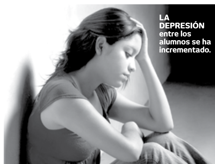
LA DEPRESIÓN entre los alumnos se ha incrementado.

Según la funcionaria estatal, esta situación se da por motivo de los fenómenos socioemocionales que trascendieron en las familias durante todos estos más de 20 meses de