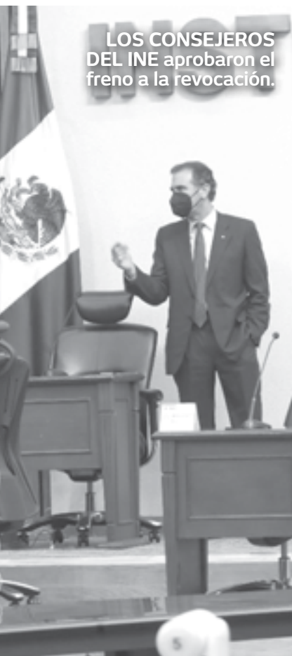
LOS CONSEJEROS DEL INE aprobaron el freno a la revocación.