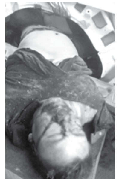
LOS CUERPOS no fueron identificados.

Trascendió que hasta el momento están en calidad de desconocidos, de la misma forma se des-