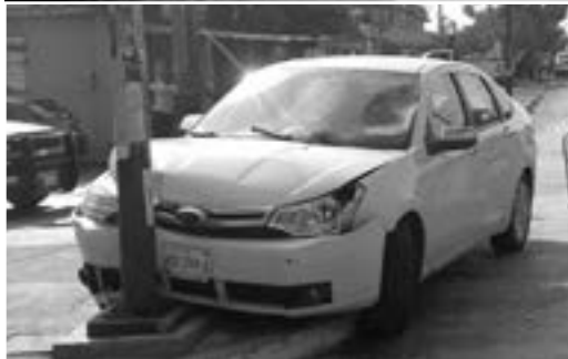
UNA GRAN mancha de sangre quedó sobre el asfalto.