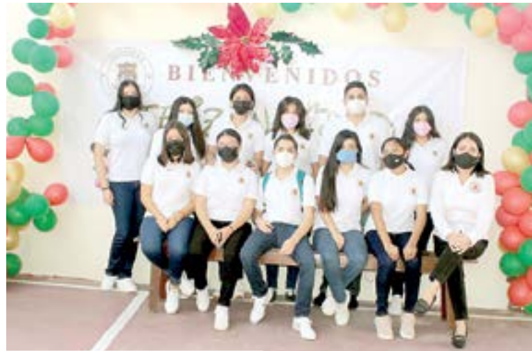
ALUMNOS DISFRUTARON de una grata convivencia.

Durante el festejo se pudo contar con la asistencia de los padres de familia quienes agradecieron todas las atenciones recibidas por parte del personal Docente y Administrativo quienes estuvieron pendiente de cada uno de los jóvenes durante el ciclo escolar.