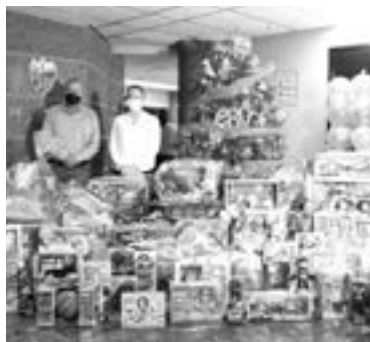
SINDICATO PETROLERO entregó juguetes al DIF Madero.

La niñez es el futuro de México y representan el compromiso para fortalecer las buenas costumbres y las tradiciones mexicanas que en todo momento ha impulsado la Sección Uno.