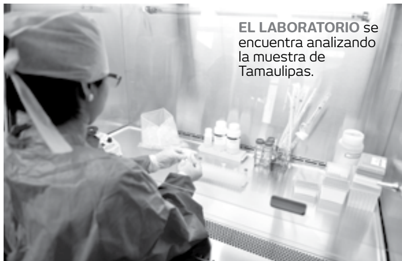
EL LABORATORIO se encuentra analizando la muestra de Tamaulipas.