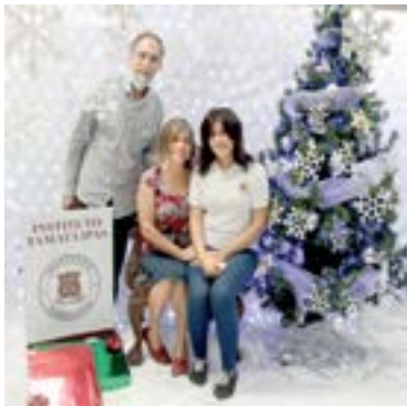
FUERON ACOMPAÑADOS por sus padres.