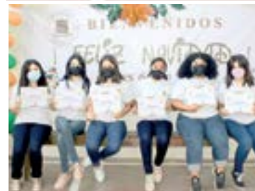
RECIBIERON DIPLOMAS de aprovechamiento por grupo.