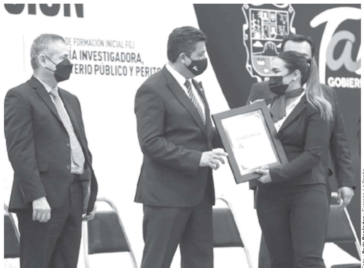
PRESIDE EL gobernador, graduación de egresados de la Universidad de Seguridad y Justicia de Tamaulipas

En la Universidad de Seguridad y Justicia de Tamaulipas, se han graduado a 2 mil 651 policías preventivos, 70 custodios penitenciar-