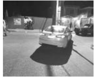
EL VEHÍCULO no cedió el paso al ciclista.

Se presentaron en el lugar de los hechos, elementos de Tránsito local para intervenir y deslindar responsabilidades.