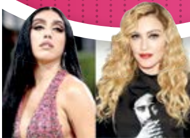
LOURDES APLAUDIÓ la decisión de Lana del Rey.