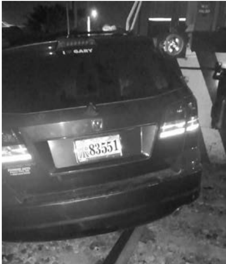
EN LOS ÚLTIMOS ACCIDENTES de Tránsito han intervenido personas en estado de ebriedad.

“Aquí en el municipio de acuerdo a la Ley de Ingresos tenemos las multas más bajas de la