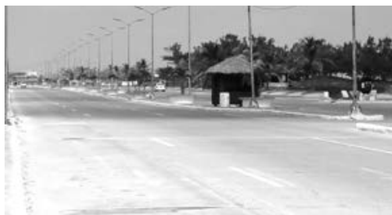
EL ACCIDENTE ocurrió el pasado fin de semana.