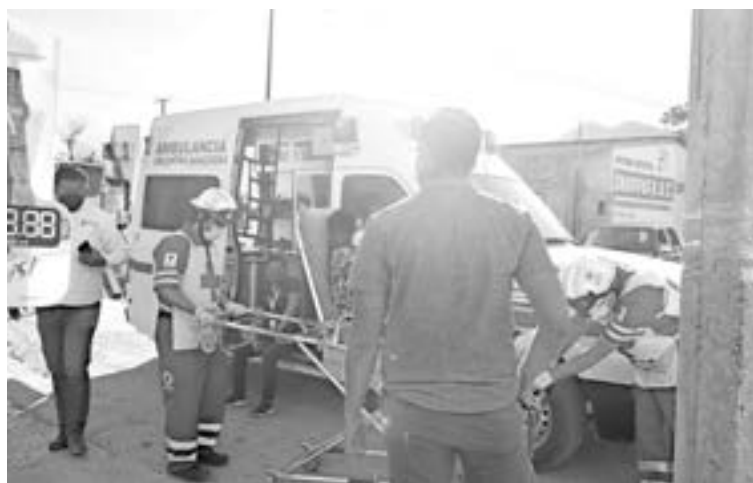
PARAMÉDICOS ATENDIERON a las dos empleadas heridas.

Dos empleadas de Gobierno resultaron lesionadas, una de las cuales tuvo que ser trasladada a un hospital de manera urgente, al sufrir una probable