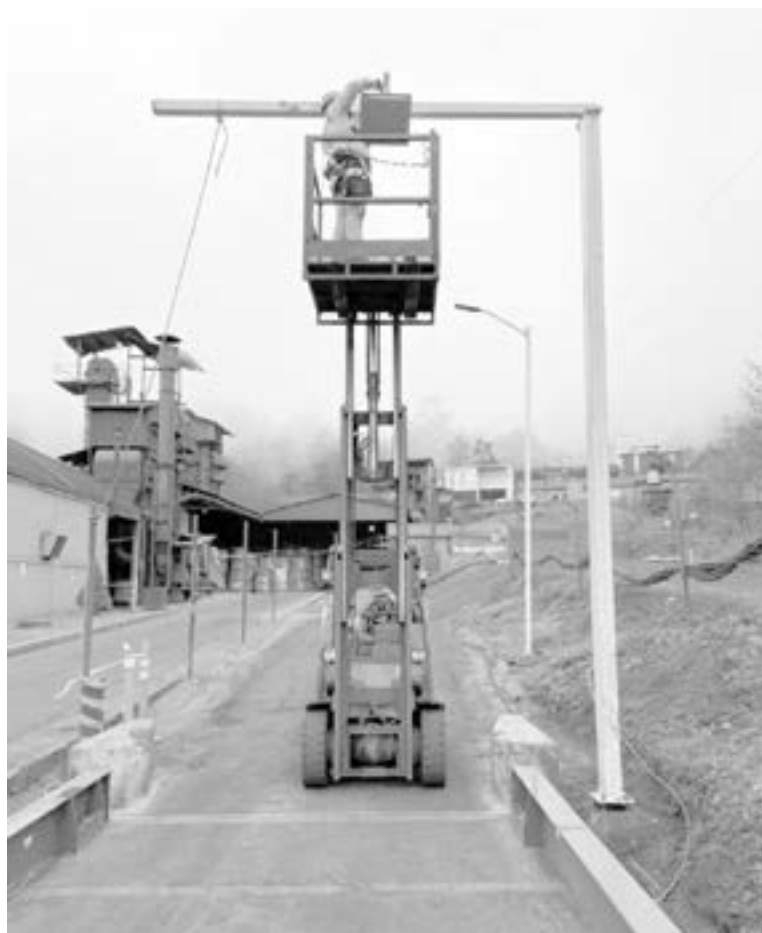
EN LA zona sur hay alta demanda de equipos de seguridad y vigilancia.

El empresario dijo que actualmente los equipos siguen teniendo una alta demanda y constantemente se actualizan, "antes con una lámpara podías 'cegar' la cámara y ahora tienen tecnología que les permite seguir grabado con claridad, los equipos viejos han queda-