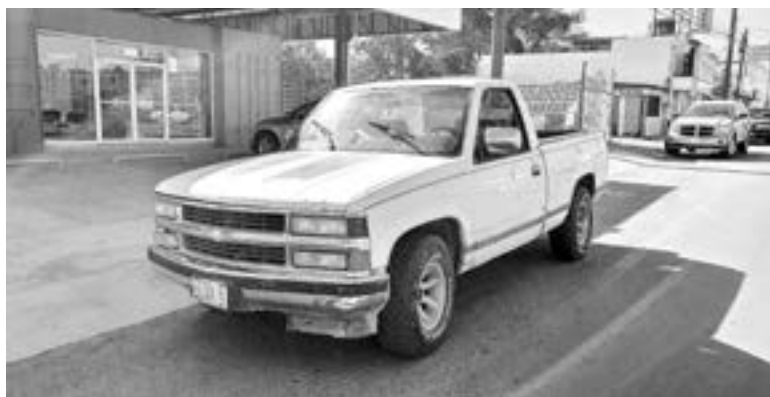
EL CHOFER de la troca omitió el alto en ese cruce.

Cabe señalar que la persona corrió con bastante suerte, ya que pese a las condiciones en que que-