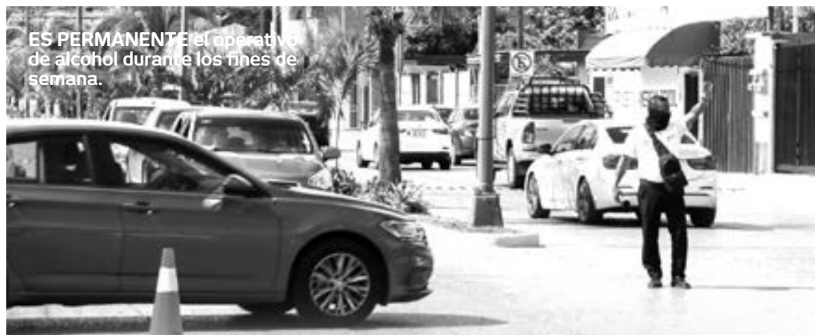
ES PERMANENTE el operativo de alcohol durante los fines de semana.