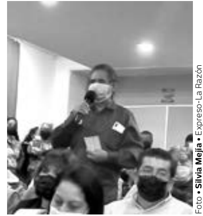
VECINOS NO SOPORTAN el olor y el hollín que emanan del crematorio.

Sobre el presupuesto para la rehabilitación y puesta en marcha de estos módulos, que se encuentran vandalizados sin servicios básicos como energía eléctrica, agua ni tampoco aire acondicionado, señaló que apenas está por definirse.