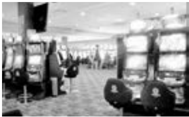
LA INSTALACIÓN de casinos se vería afectada, aseguran.