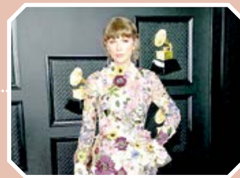
EL TEMA fue un éxito en el 2014.