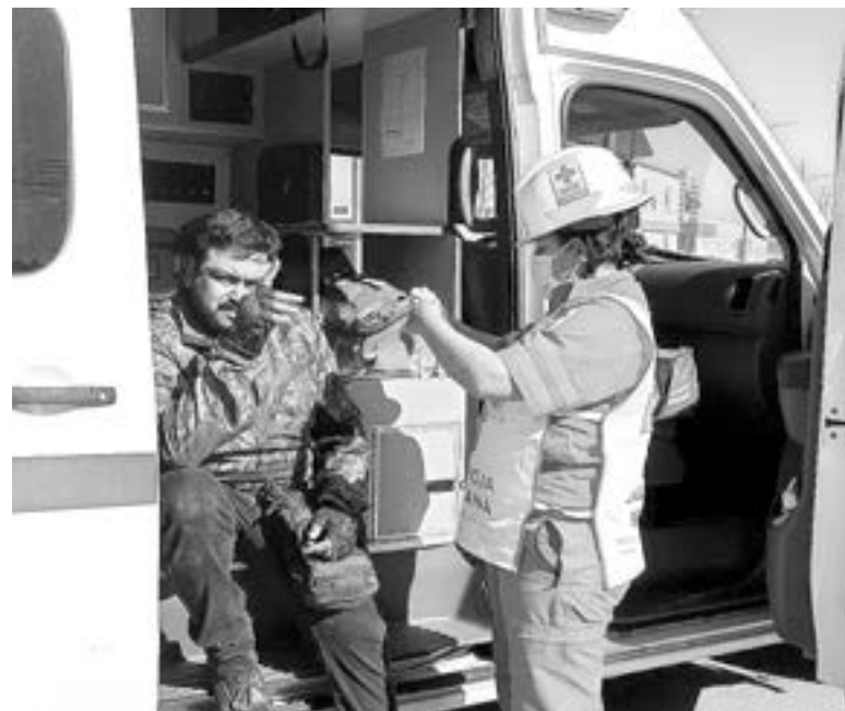
EL EMPLEADO motorizado solo sufrió algunos golpes leves.

que guiaba en sentido de oriente a poniente, sobre Carrera Torres. Al llegar al cruce con la ca-