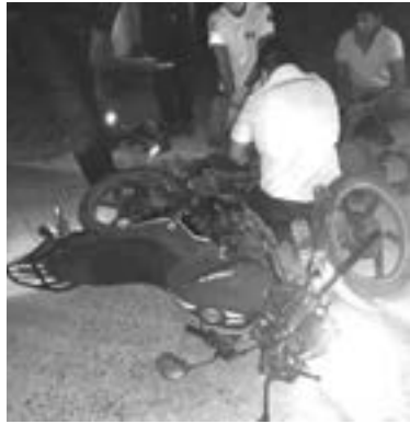
EL HOMBRE quedó tirado con fuertes dolores.