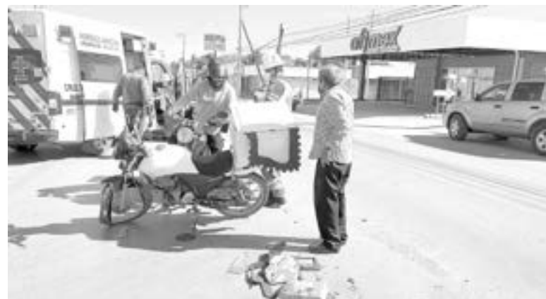
LA MOTOCICLETA quedó muy dañada tras el impacto.

30 AÑOS ES LA EDAD ESTIMADA DEL MOTOCICLISTA HERIDO