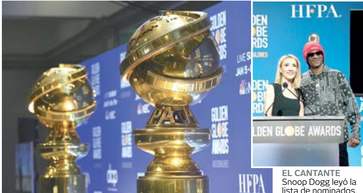
EL CANTANTE Snoop Dogg leyó la lista de nominados.