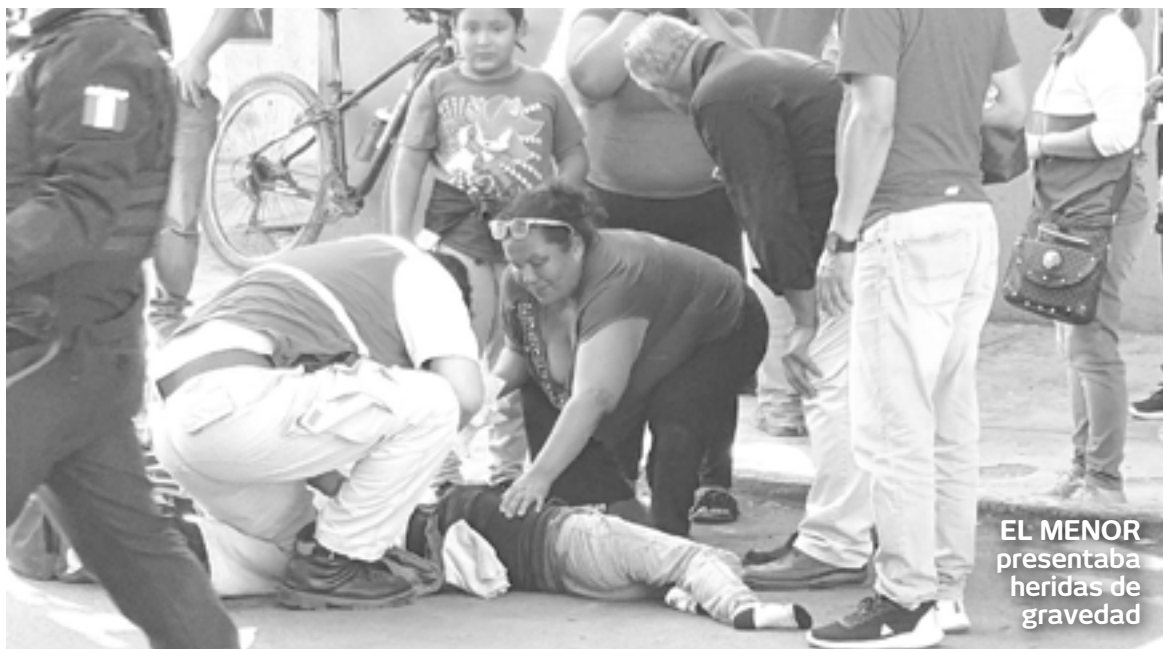
EL MENOR presentaba heridas de gravedad

Fueron instantes después que una ambulancia de protección Civil del estado pudo acceder hasta esta zona, que ya estaba bastante congestionada, con largas filas de vehículos que se quedaron atorados al quedar interrumpida la circulación.