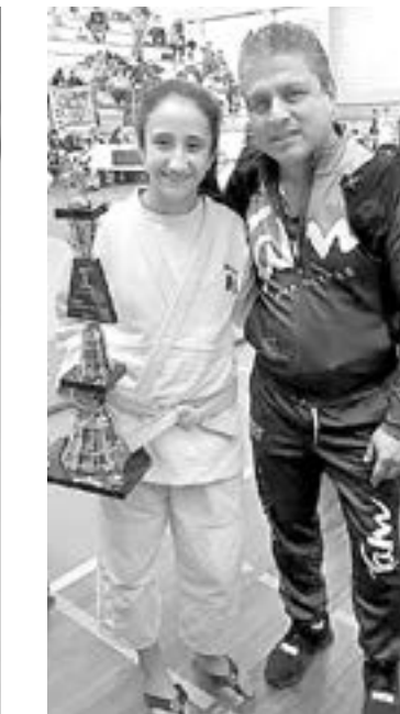
LA ORIGINARIA de Tampico busca un día estar en Juegos Olímpicos

de los Nacionales (Federación) y gracias a Dios participé también en internacionales”, expresó.