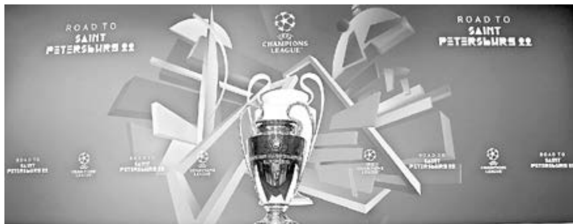
TRAS UN ERROR, se realizó dos veces el sorteo.

En principio, Cristiano Ronaldo y el United habían sido