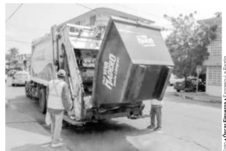
UNA DE LAS DEMANDAS más solicitadas de los maderenses es brindar un buen servicio de recolección.

Ante dicho escenario, enfatizó el edil maderense: “Seguimos redoblando esfuerzos, queremos una ciudad siempre limpia y digna para todos los maderenses, le pido a la ciudadanía que nos ayude evitando arrojar desechos en nuestros canales y vía pública, y sacar sus bolsas de basura debidamente cerradas, cuando pase la unidad recolectora”, concluyó el Presidente Municipal.