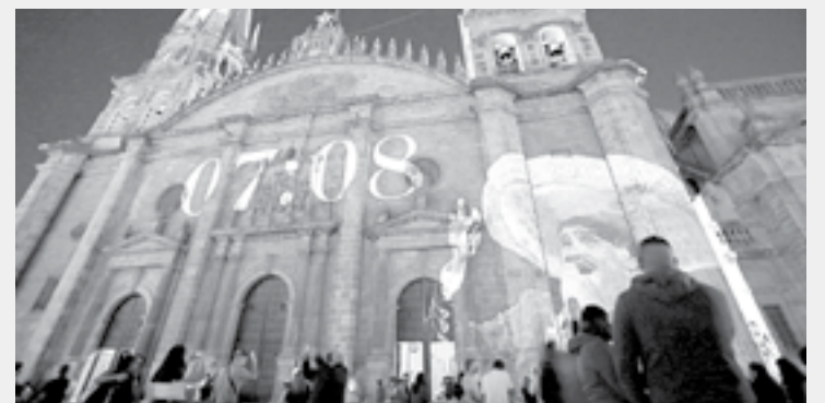
VICENTE FERNÁNDEZ construyó una importante estructura empresarial.

También, los ingresos constantes para sus herederos provienen de las regalías de sus materiales discográficos.