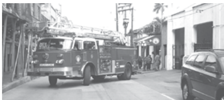
LOS BOMBEROS acudieron al lugar del siniestro.