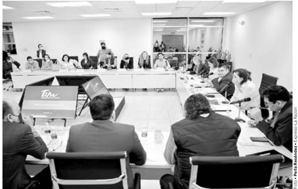
AYER SESIONÓ la Comisión de Presupuesto y hoy lo hará nuevamente.

El mismo contempla el cobro a los municipios de 90 veces el valor diario de la Unidad de Medida y Actualización (UMA) por cada evaluación