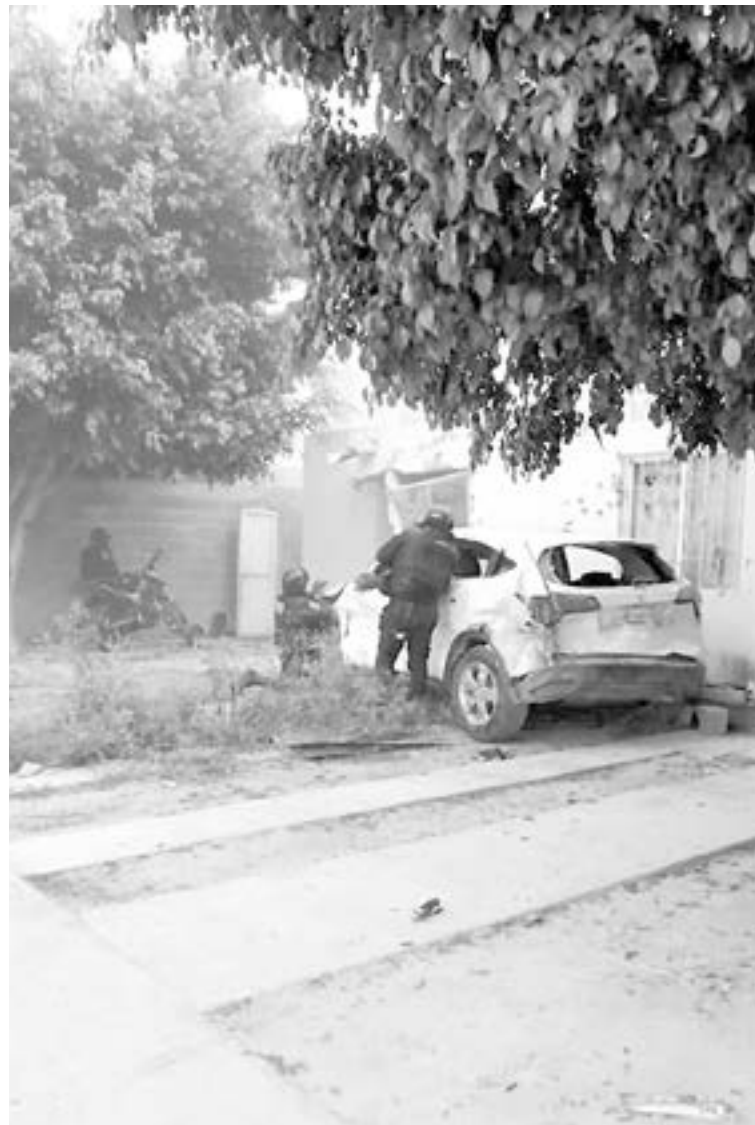
FUERON ABATIDOS tres presuntos delincuentes.

Tras ser cuestionado sobre el operativo, el Gobernador