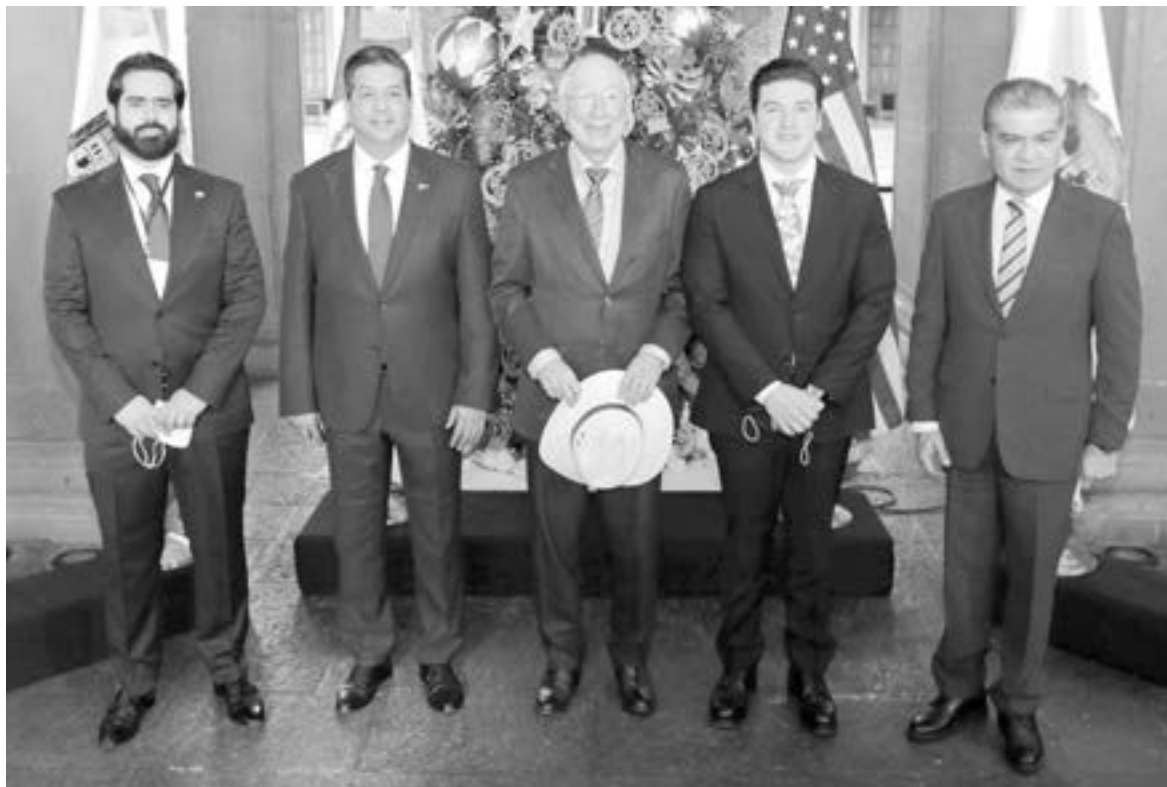
EL GOBERNADOR Francisco García Cabeza de Vaca, al participar en la reunión