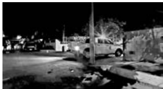
LA POLICÍA Investigadora realiza la búsqueda del presunto atacante.