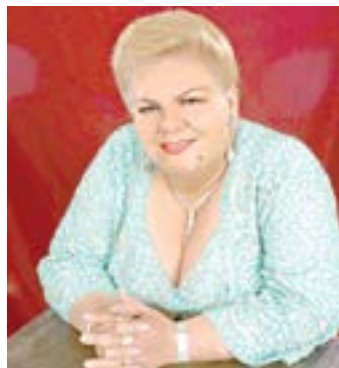
PAQUITA ASEGURÓ que se siente mucho mejor.

En una entrevista, la cual fue retomada por Ventaneando, Paquita la del Barrio habló sobre su estado de salud después de que se le viera llegar al aeropuerto de la Ciudad de México en silla de ruedas.