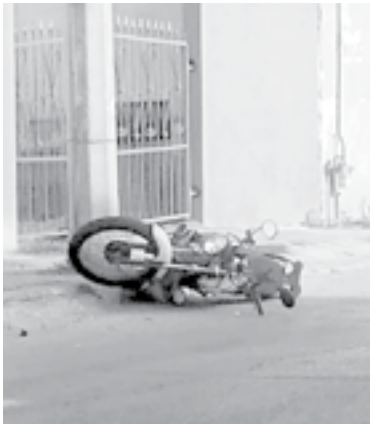
EL MOTOCICLISTA fue internado en el IMSS.