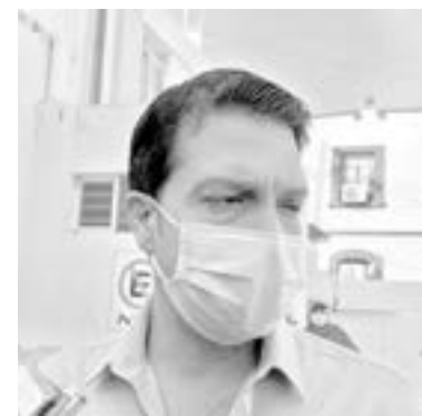
AMARRAN ALIANZA PAN-PRI y PRD para el 2022

“La alianza casi es un hecho, tengo yo entre jueves y viernes reunión en México, luego que he sostenido