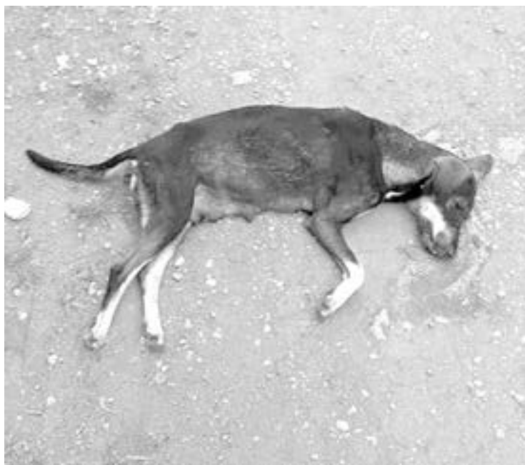
LOS ANIMALITOS domésticos han sido envenenados en un fraccionamiento de Tampico.

El funcionario, aclaró que este tipo de situaciones no se daban desde hace mucho tiempo, lo cual