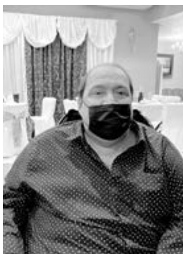
LOS FESTEJOS en alberca están acaparando los eventos.

“En los negocios de albercas en casas, la autoridad no tiene ningún control en estos lugares,