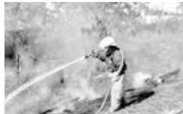
BOMBEROS DE TAMPICO apagaron el siniestro.

tarde de ayer, en las inmediaciones de la zona de bodegas y almacenes.