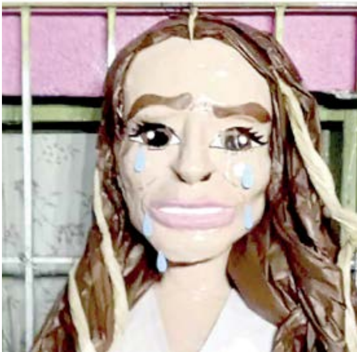
LA PIÑATA fue creada por 'Piñatería Ramírez'.