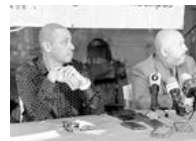
LA SOCIEDAD DE AUTORES Y COMPOSITORES demanda a negocio que no pagó uso de música.

“La semana pasada estuvimos con el fiscal, presenté la primera querrela de Tamaulipas, en un negocio de Tampico, no se puede decir el nombre porque entorpecería la investigación, se puede llegar al