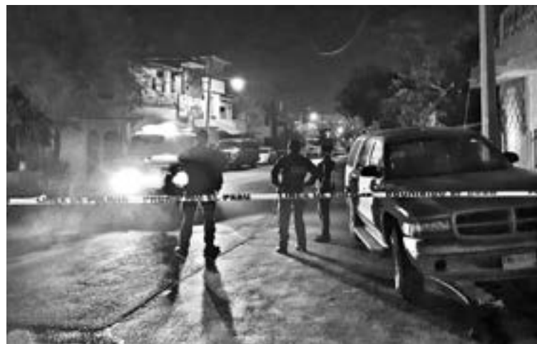
EL AHORA occiso se encontraba en este sitio tomando cerveza con otros hombres

Los hechos se registraron alrededor de las 22:00 horas frente a un domicilio ubicado sobre la calle San Pedro El Alto, muy