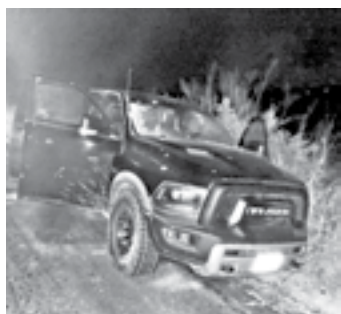
LOS HECHOS de violencia se registraron este martes.

Fue en ese sitio y dónde fue encontrada camioneta de la marca