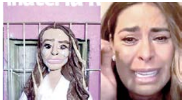
GALI INOCENTE es el nombre de la piñata.

desde hace semanas, por sus presuntos vínculos con Inés Gómez Mont y su esposo Víctor Manuel Álvarez Puga, quienes tienen una ficha roja de la Interpol y son buscados en 190 países por presunto lavado de dinero y defraudación fiscal.