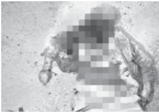
FUERTES LESIONES recibió uno de los protagonistas de la pelea.