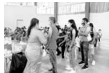
LOS JÓVENES asisten sin desayunar.

Recordó además a los ciudadanos que tomen precauciones ya que si van a hacer retiros bancarios o el cobro de alguna caja de ahorro aguinaldo no acudan solos a los cajeros en Tampico a fin de que no se expongan a delincuentes que arriban a la zona y operan en estos sitios.