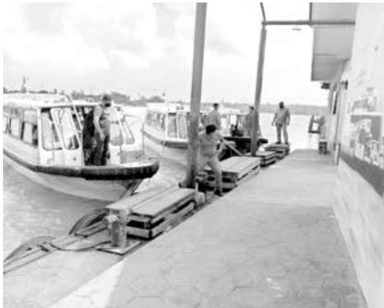
SE REALIZARÁN recorridos por los diversos pasos.

P ueblo Viejo.-Con el firme objetivo de frustrar robos u otro tipo de delitos en agravio pueblovejenses que acuden a Tampico a realizar sus compras, se intensificará la vigilancia en los ocho pasos de lanchas.