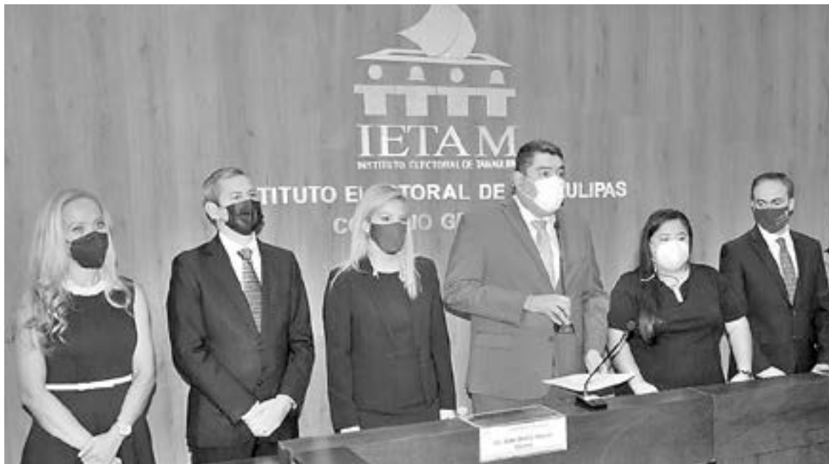
PAGAN MEGA sueldos a Consejeros del IETAM.