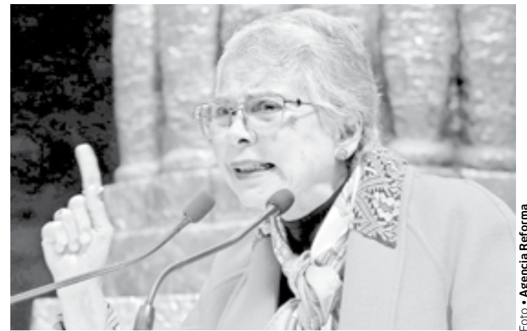
VÍCTIMA DE LA MISOGINIA, en un gobierno de izquierda