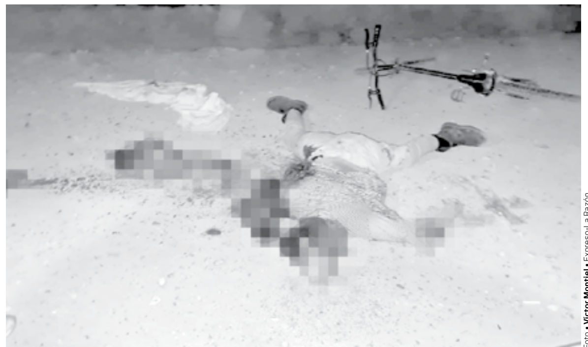
HORRIBLE MUERTE encontró el trabajador tras ser aplastado por un camión.