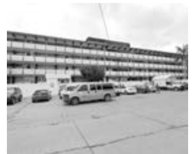
ASEGURAN que delincuentes ya respetan las escuelas.

“Somos trabajadores que día a día somos comprometidos, que cuidamos las instalaciones, le manifiesto a nuestro Director General de Petróleos Mexicanos que los trabajadores estamos comprometidos con Pemex y