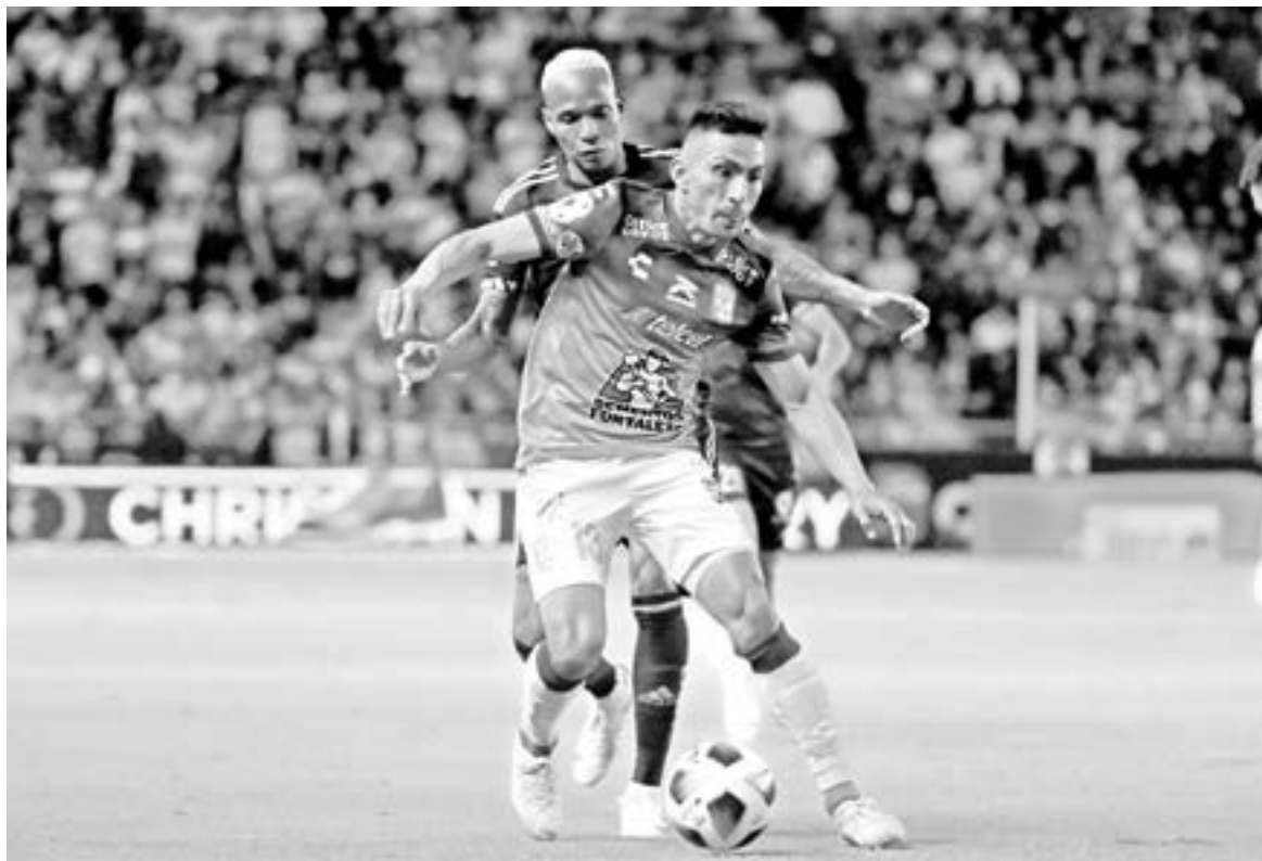
LOS ESMERALDAS llegan a su séptima final.

abordaje en busca del empate en el juego, y en una distracción defensiva leonesa el balón le quedó a Diego Reyes quien de volea metió el