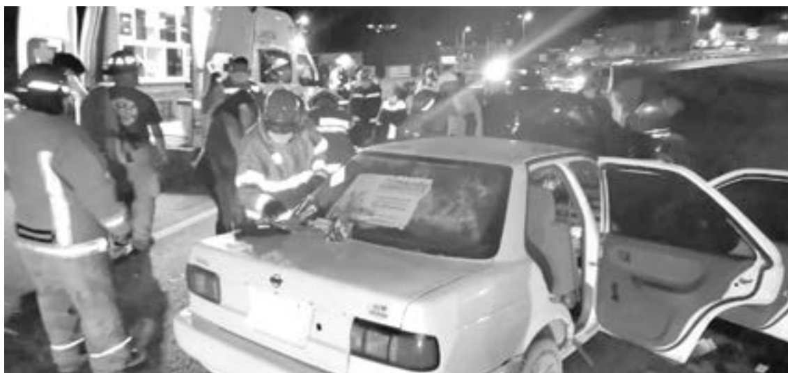
BOMBEROS, PARAMÉDICOS y Protección civil se dio cita en el lugar del accidente.

El carro, cuyo conductor presuntamente estaba bajo los influjos de bebidas alcohólicas, bajaba