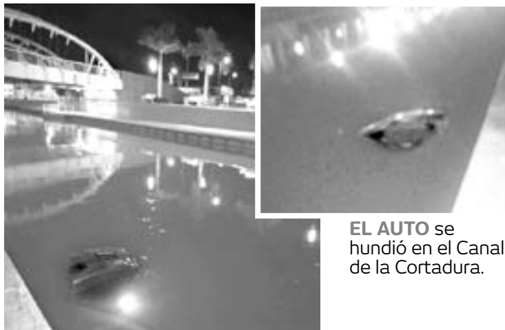
EL AUTO se hundió en el Canal de la Cortadura.

EL CONDUCTOR LOGRÓ SALIR DE LA UNIDAD TRAS CAER AL AGUA, LOS HECHOS SE REGISTRARON LA MADRUGADA DE ESTE DOMINGO