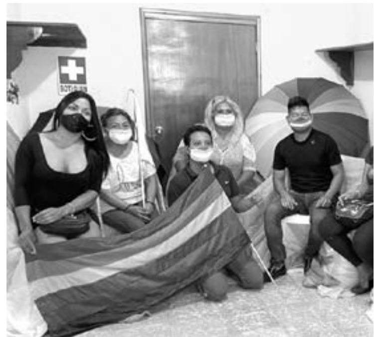
ASOCIACIONES DE GRUPOS LGBT y activistas piden que no se castigue el contagiar a alguien de SIDA/VIH.