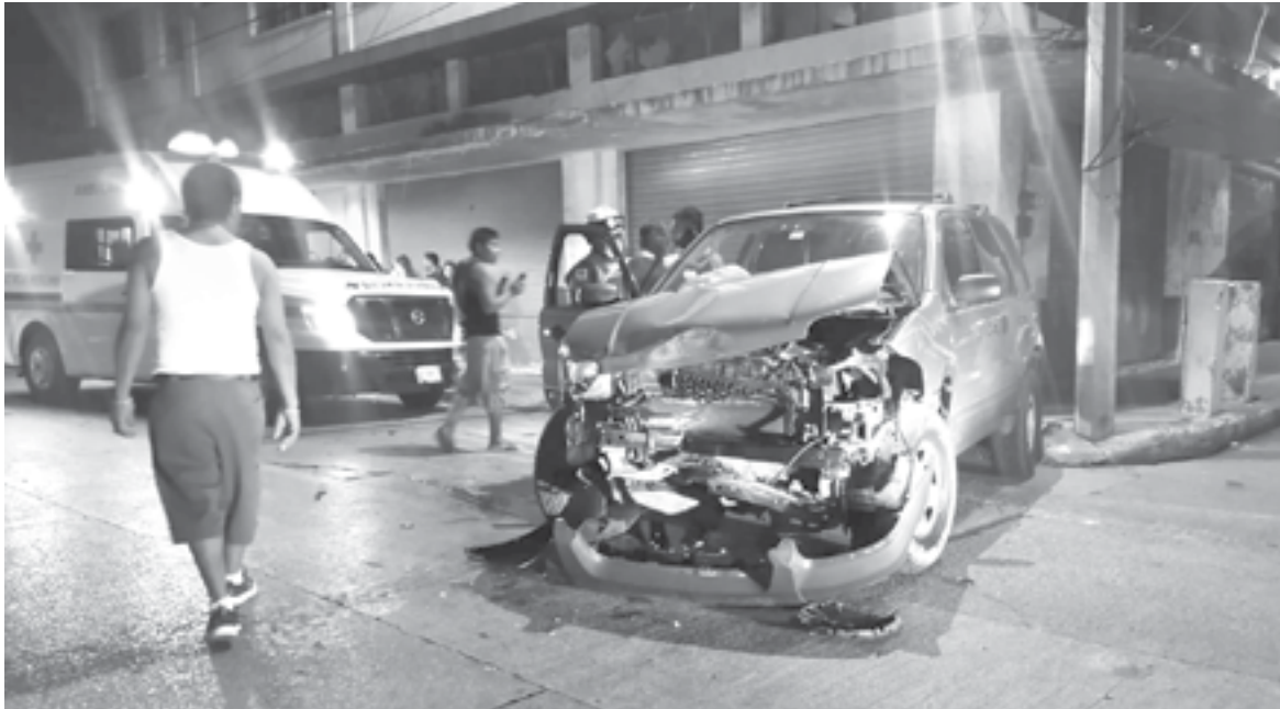
EL VEHÍCULO de transporte fue arrojado más de 10 metros del lugar de impacto.