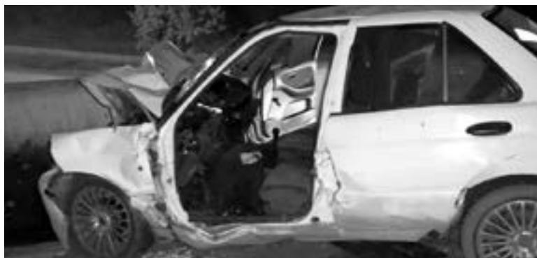
UNO DE los vehículos quedó completamente destrozado.