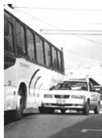
LOS VEHÍCULOS obstruyeron el tráfico.

Sin embargo, minutos después llegaron a un arreglo, moviéndose del sitio.