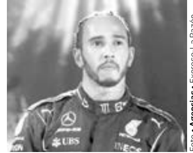
LEWIS FUE el campeón el GP de Arabia Saudita,

ACCIDENTADA JORNADA Fue una largada limpia, en la que Valtteri Bottas hizo una buena pared y evitó que Max Verstappen alcanzara a Lewis Hamilton por la punta.