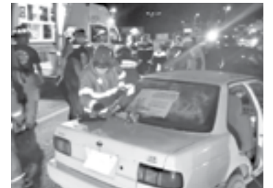
BOMBEROS Y Protección civil acudieron al accidente.

Elementos de Tránsito tomaron conocimiento del encontronazo para deslindar responsabilidades.