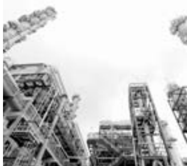
LA REFINERÍA recibirá $691 millones de inversión.