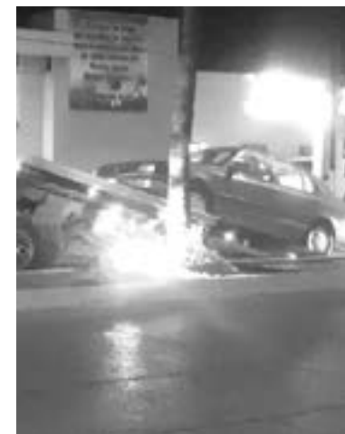
EL COCHE presentaba severos daños.

Personal de Protección Civil, bomberos y demás corporaciones intervinieron en el accidente en apoyo a los afectados.