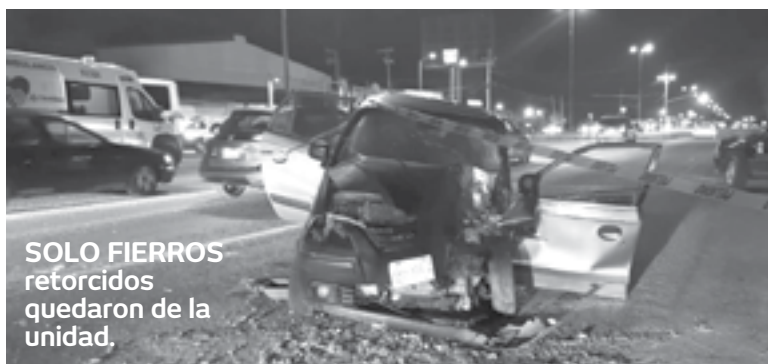
SOLO FIERROS retorcidos quedaron de la unidad.