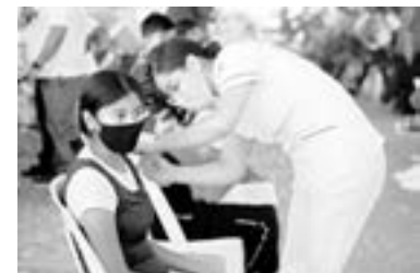
LA PRIMERA dosis de vacuna Pfizer fue aplicada a 34 mil 050 menores de edad.