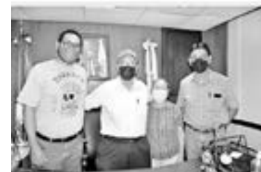
COMPARSA "PURA BRISA" agradece todo el apoyo.

Destacó que deberían de colocarse algún tipo de vallas o un cerco para evitar que curiosos caiga en estas zonas pantanosas; ya que de hacerlo difícilmente podrían salvarse por mano propia.