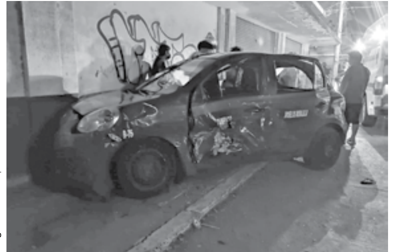
DESTROZADA QUEDÓ la camioneta tras el choque.

Lo anterior, provocó el choque contra el costado del automóvil de