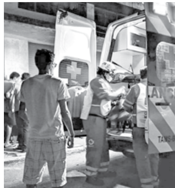
PARAMÉDICOS DE la Cruz Roja auxiliaron a los lesionados.