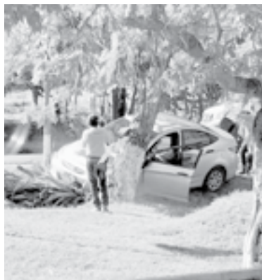
EL HOMBRE fue auxiliado por paramédicos.