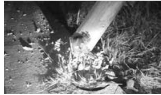
EL POSTE casi fue arrancado de su base tras el choque.

Tras el incidente se giró la orden de extraer la unidad del agua para llevarlo posteriormente al mesón municipal y realizar las indagatorias.