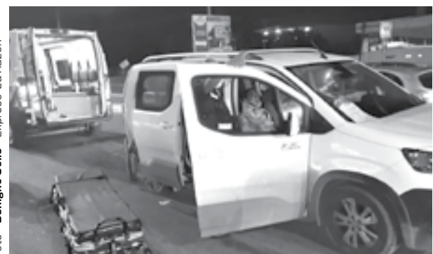
UNO DE los lesionados recibió atención médica en el lugar del percance.

dose complicadas maniobras para extraerlo y llevarlo de emergencia al Hospital General de Tampico Carlos Canseco, donde se reporta como grave su estado de salud.