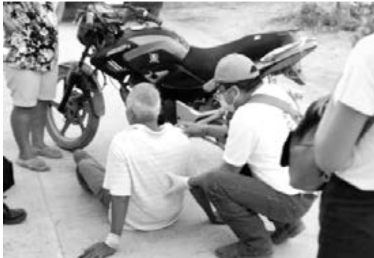
EL JOVEN motociclista se dio a la fuga.

EL JOVENCITO CIRCULABA A GRAN VELOCIDAD CON SU MOTOCICLETA Y EMBISTIÓ AL QUINCUAGENARIO PROVOCÁNDOLE SEVEROS GOLPES