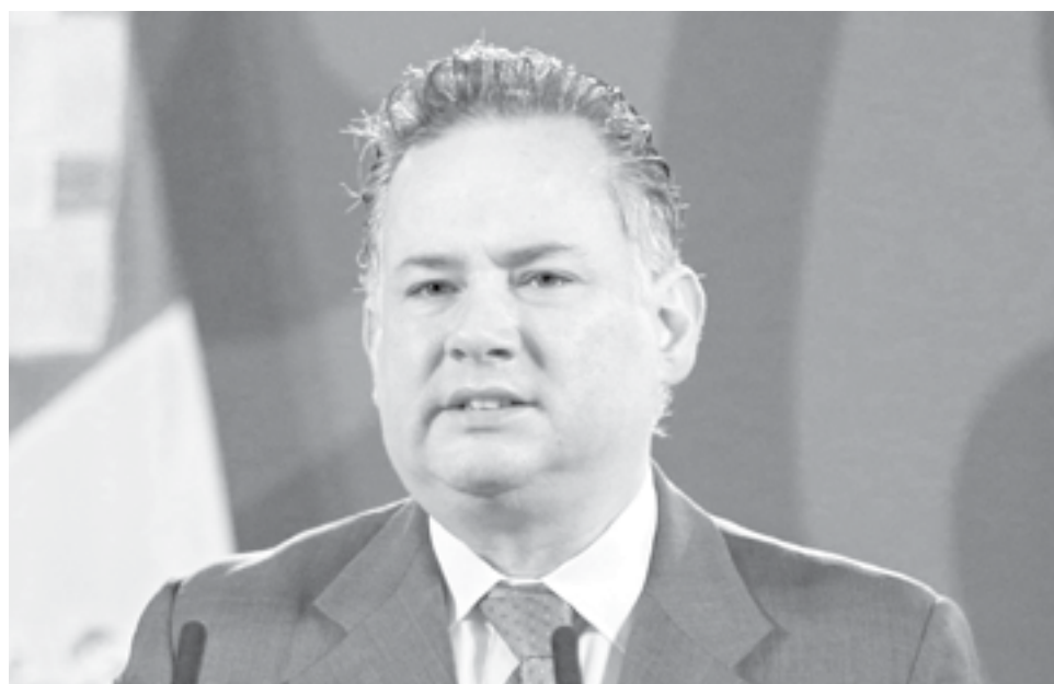
EL EX fiscal de la UIF, esta vez en la mira de las autoridades.

Santiago Nieto percibía en la UIF un sueldo neto 107 mil 358 pesos y antes de 2018 su situación no era holgada. En octubre de 2017, cuando fue despedido de la Fiscalía Especializada en Delitos Electorales