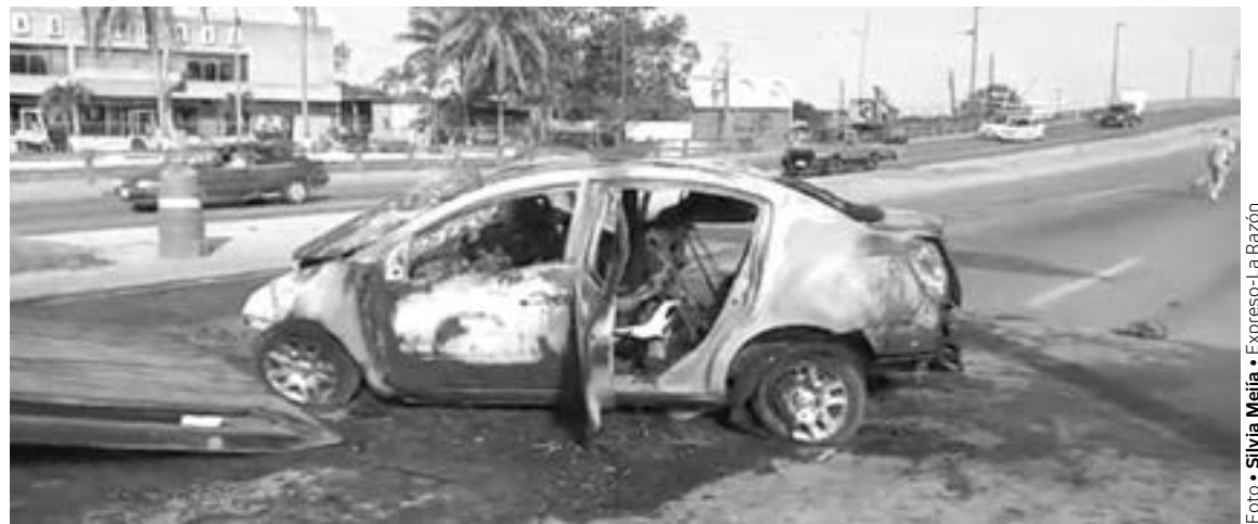
PIDE CRUZ ROJA manejar con precaución.

Durante este fin de semana tan solo en Altamira se registró una racha de choques que dejaron varias personas lesionadas.