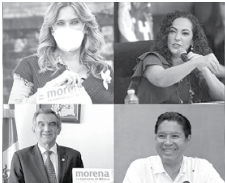
MORENA, YA está en tiempos de definición