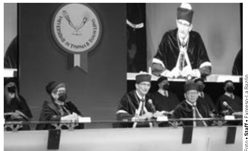
CON ESTE EVENTO el Rector clausuró la Asamblea Solemne de este homenaje, que en días anteriores encabezó en Ciudad Victoria y Reynosa.

En otra parte de la ceremonia, el Rector impuso la Medalla “Alfredo E. Gochicoa” a siete trabajadores sindicalizados que cumplieron veinticinco años de servicio ininterrumpido en la Universidad.