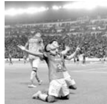
EL LEÓN logró darle la vuelta al encuentro.

huel tuvo más trabajo, por ahí se reclamaron manos que el central no marcó y ni el VAR rectificó. Cota tuvo menos trabajo, pero Gignac-