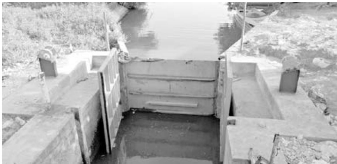
REGRESA HACIENDA proyecto del Camalote, para ajustes técnicos.

“El estado es el que está haciendo el trámite, para hacer algunas correcciones técnicas para poder entregarlo nuevamente a Hacienda”, indicó. La iniciativa privada ha estado muy al pendiente de este tema, para que se logre garantizar el abasto del vital líquido durante todo el año.