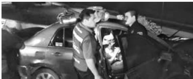
PARAMÉDICOS BRINDARON atención a los heridos.

el puente cuando de pronto el chofer se percató de la presencia de varias unidades sobre la avenida de la Industria.