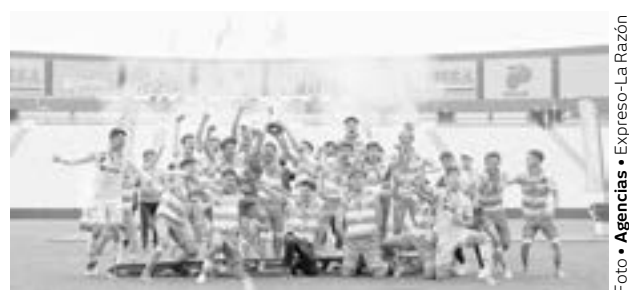
SANTOS LAGUNA obtuvo un nuevo título.

Hubo conatos de bronca, pasión desbordada, Tigres ya no se levantó y el mejor felino fue el León, quien va por su novena corona.