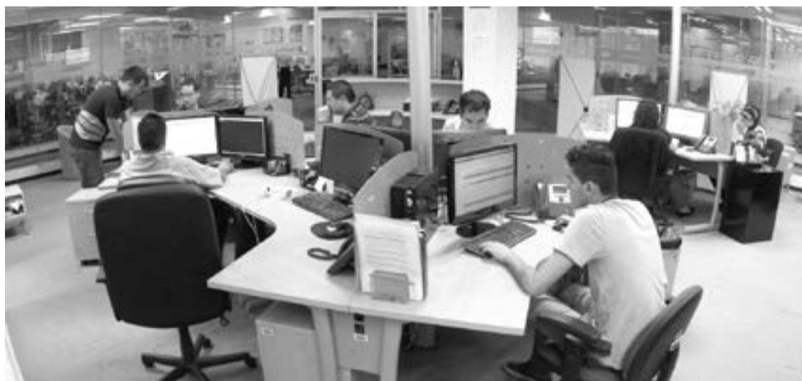
EMPRESAS DE TECNOLOGÍAS atrae a profesionistas del sur.

“Desarrolladores de software que están llevándose gente para el área de robótica y las telecomunicaciones, hoy las empresas están fortaleciendo las redes de telecomunicaciones y donde se está soportando ahora el poder económico de los países”