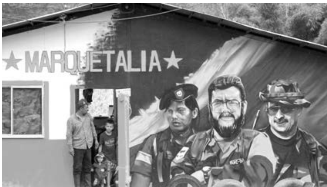
OTRO AVANCE en el proceso de paz para Colombia

El grupo está designado como un partido político, con escaños en la legislatura colombiana.