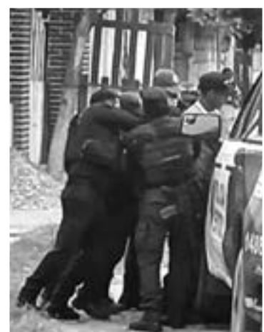
LA POLICIA detuvo al agresivo sujeto.

Los vecinos señalaron que el sujeto es muy agresivo y no es la primera vez que realiza destrozos en su casa.