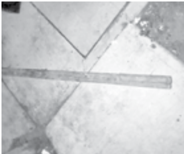
SE PRESUME que este fue el objeto con el que fue golpeado.