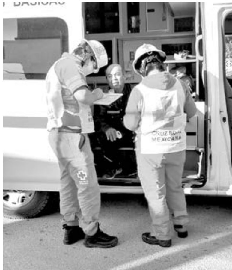
EL LESIONADO recibe atención.

El lesionado platicó al perito vial en turno que en el incidente, se desplazaba de sur a norte sobre la calle 21 a