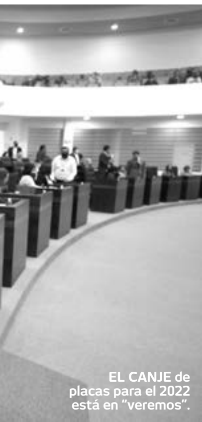
EL CANJE de placas para el 2022 está en "veremos".