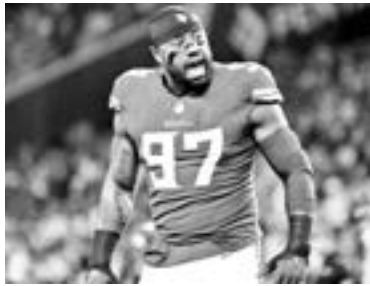
GRIFFEN PRESENTÓ problemas mentales en años anteriores.