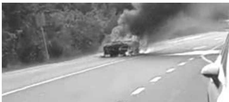
EL AUTO fue consumido por las llamas debido a un corto circuito.

En base a información proporcionada por el director de Protección Civil de esta localidad Eduardo Betancourt, las causas