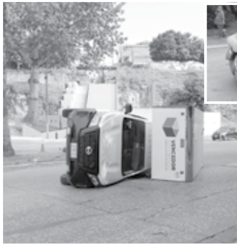
EL VEHÍCULO particular sufrió severos daños.

Elementos de Tránsito acudieron para tomar conocimiento del percance y deslindar responsabilidades.