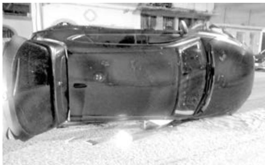
DAÑOS CUANTIOSOS provoca el norteamericano al chocar dos unidades y volcar la que conducía

sobre lo sucedido, por lo que solicitó el envío de una ambulancia.