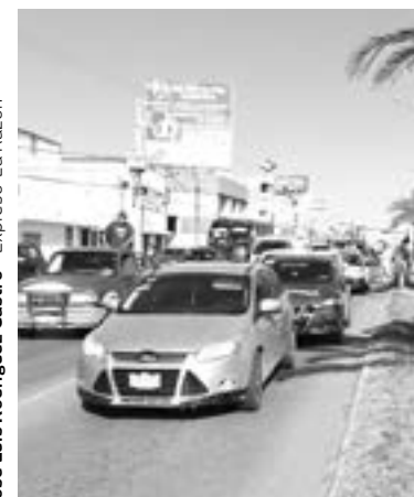
TRÁNSITO Y VIALIDAD acudió al lugar de los hechos.

EL ENCONTRONAZO se suscitó en la carretera Tampico- Mante.