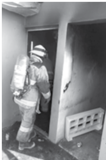
LOS MUEBLES fueron consumidos por el fuego.

En la última semana se han registrado varios incendios, desde el