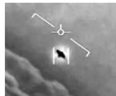
LA 'GUERRA de los Mundos', versión 2021...

Putin recibió la vacuna Sputnik V, de fabricación local, a mediados