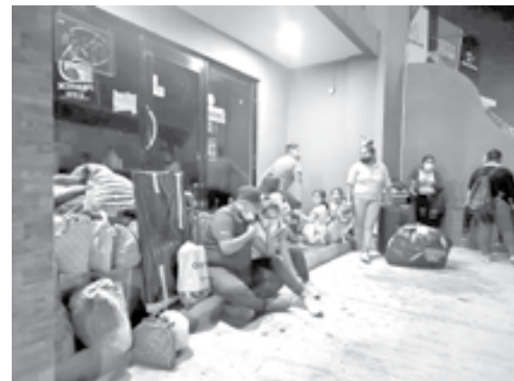
LOS PASAJEROS no contaban con dinero para comprar sus alimentos.