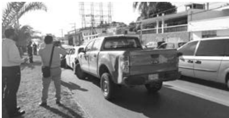
UN CAOS vial se registró en el lugar.

EL CONDUCTOR DE UNO DE LOS VEHÍCULOS IMPLICADOS DETUVO INTEMPESTIVAMENTE SU MARCHA OCACIONANDO EL ACCIDENTE EN LA CARRETERA TAMPICO- MANTE