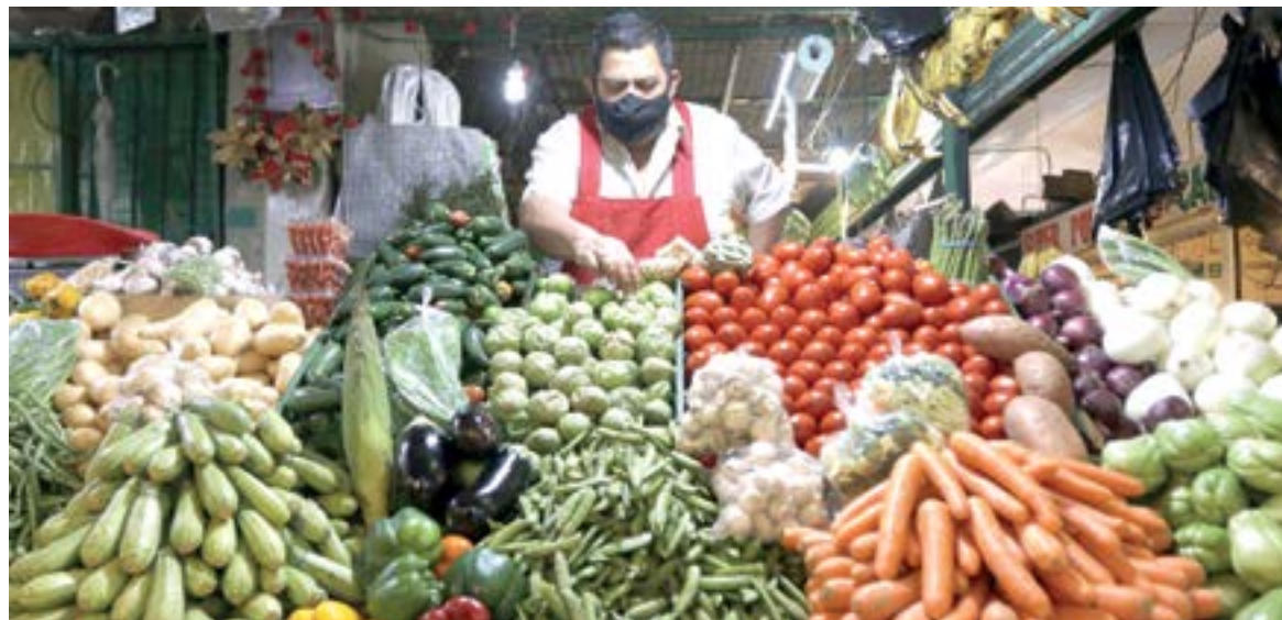
LOS PRODUCTOS básicos están al alza

Sin embargo, con el aumento al salario también se dio una es-