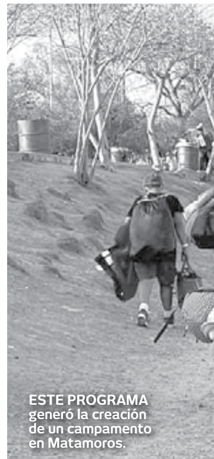
ESTE PROGRAMA generó la creación de un campamento en Matamoros.

Tras su llegada al poder en enero de 2021, el demócrata Biden