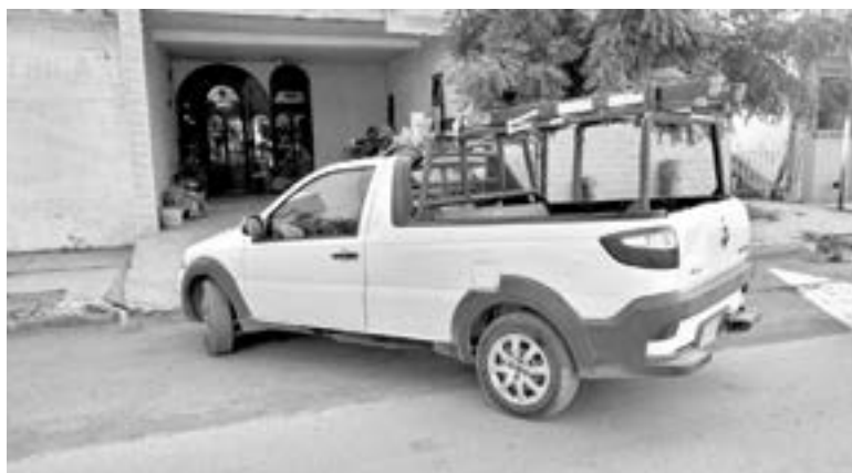
LOS VEHÍCULOS participantes.

Los oficiales de la dirección de tránsito, informaron que el percance ocurrió ayer a las 08:30 de la