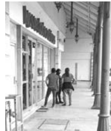
EMPLEADOS SUFRIERON gran susto.