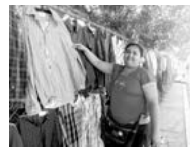
LAS COMERCIANTES de ropa esperan un repunte.