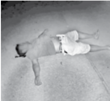
CON UN FUERTE golpe en la cabeza terminó el hombre.