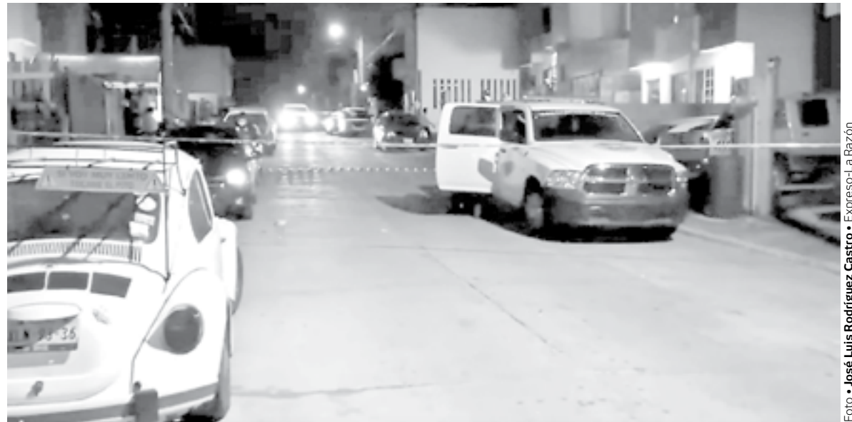
LA MUJER fue encontrada sin vida en su habitación.