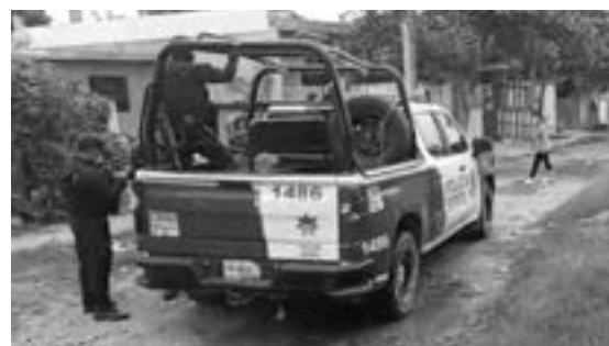
VECINOS DEL lugar llamaron a la Policía Estatal.

Los elementos de la Policía Estatal Acreditada se llevaron detenido al sujeto a bordo de la unidad