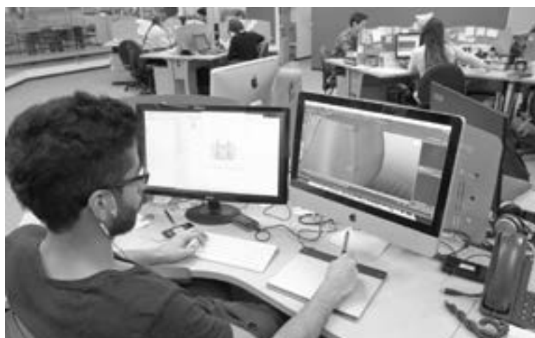
EN EL SUR crece el desarrollo de software.

LA INDUSTRIA DE DESARROLLO DE TECNOLOGÍAS NO HA DESPUNTADO EN LA REGIÓN PESE A QUE HAY PERSONAL CALIFICADO, QUE ESTÁ MIGRANDO A ESTADOS UNIDOS Y ASIA CONTRATADOS POR FIRMAS INTERNACIONALES