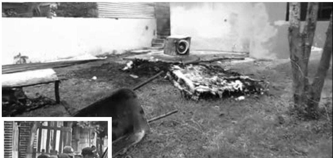
APARATOS ELECTRODOMÉSTICOS y muebles fueron quemados por el hombre.

Además de los destrozos que causó en su hogar el violento sujeto causó daños a una camioneta.