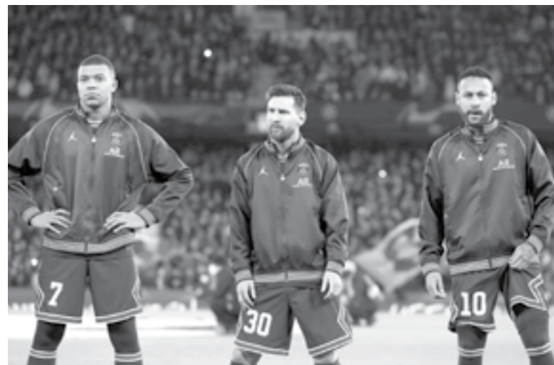
EL TRIDENTE de 'miedo' no pudo ganar en Manchester.

El Madrid lidera el grupo con 12 puntos en cinco partidos, dos más que el Inter de Milán, que venció por 2-0 al Shakhtar Donetsk.