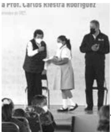
ENTREGARON UNIFORMES a estudiantes de nivel básico en zona conurbada.