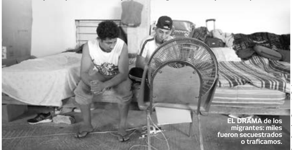
EL DRAMA de los migrantes: miles fueron secuestrados o traficados.

“Con base en testimonios de migrantes y de coordinadores de albergues, se sabe que el secuestro, extorsión e incluso desaparición de migrantes ha incrementado”, dijo Misael Hernández, investigador del Colegio de la Frontera Norte en Tamaulipas, uno de los estados con más secuestros de extranjeros, tras admitir que la cifra dada por la CNDH podría ser mayor.