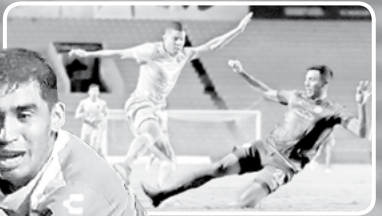
UN GRAN encuentro fue el brindado por la Jaiba.