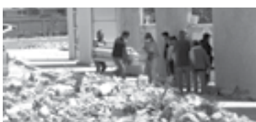
EN EL INVIERNO se volverían a disparar los casos.