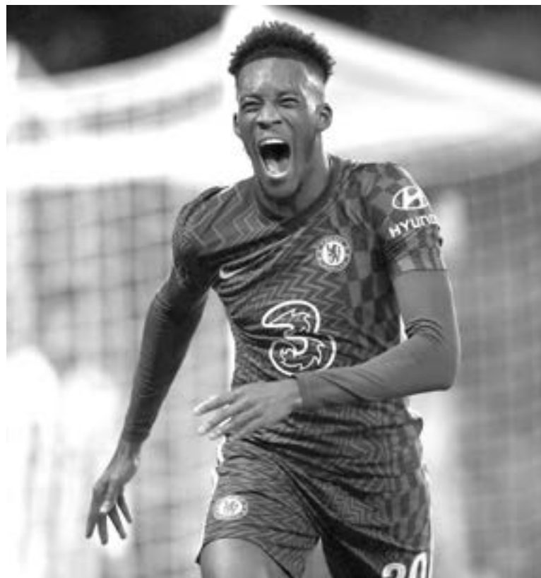
EL DÍA DE HOY podrían definirse más lugares en octavos.

El campeón defensor no dejó dudas y goleó a Juventus, que llegaba líder e invicto. Además de asegurar el pasaje, quedó a un paso de ganar su zona.