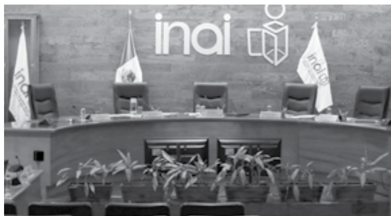
EL INAI rechazó el decreto publicado por la Presidencia.

Sin embargo, refirió que la determinación de pasar por alto los requisitos para autorizar una obra no están previstos en la ley, por lo que este decreto es impugnado.