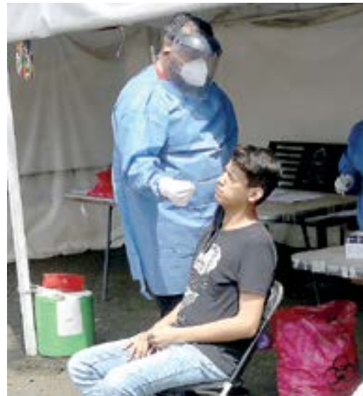
A LA BAJA, la detección de casos en Tamaulipas.

Sobre los nuevos contagios explicó que 13 fueron confirmados en el municipio de Altamira, nueve en Reynosa, nueve en Nuevo Laredo, nueve en Tampico, ocho en ciudad Madero, ocho en Abasolo, ocho en Mante, cuatro en Matamoros, seis en ciudad Victoria, tres