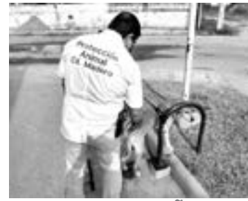
MALTRATAN DUEÑOS a sus animales sin alimento.

Reiteró que busca seguir trabajando en una gestión rectoral de puertas abiertas, con la realización de este tipo de foros que permitan el diálogo, recibir opiniones y buscar soluciones con la participación de la comunidad universitaria.