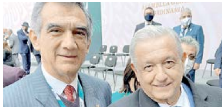
AMÉRICO VILLARREAL y el presidente López Obrador

Villarreal Anaya, al término de la Asamblea del Seguro Social, resaltó el trabajo del maestro Zoé Robledo, Director General del IMSS, quien durante la pandemia del Covid-19, dijo, fue ejemplo en la prestación de servicio a la derechohabiente y también a personas sin seguridad social que contrajeron la enfermedad. El Seguro Social, es una institución que se está transformando no solo en la prestación de los servicios y mejoras en su infraestructura, sino que está alcanzando logros en materia