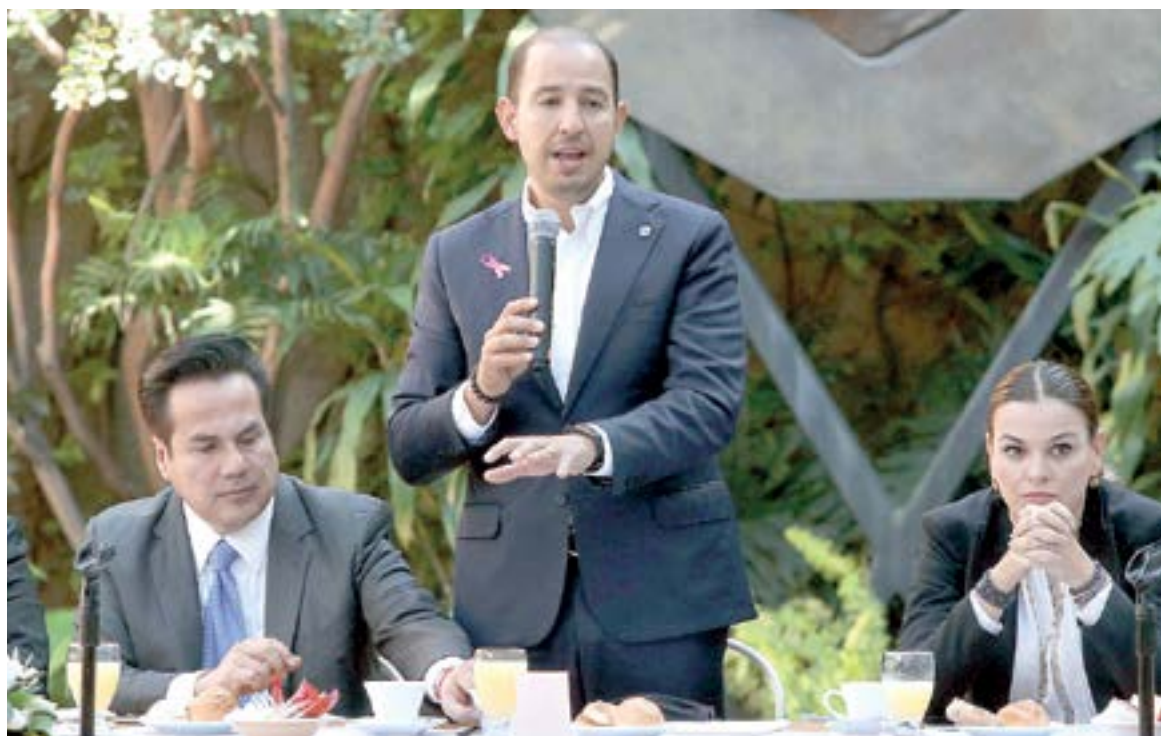
LAS DIRIGENCIAS nacionales siguen el diálogo para posibles alianzas

AL CONFIRMAR QUE EN OAXACA YA SE DESCARTÓ LA COALICIÓN CON EL PRI, MARKO ASEGURÓ QUE SIGUE EL DIÁLOGO CON PRI Y PRD PARA VER EL CASO DE LOS OTROS ESTADOS, INCLUIDO TAMAULIPAS