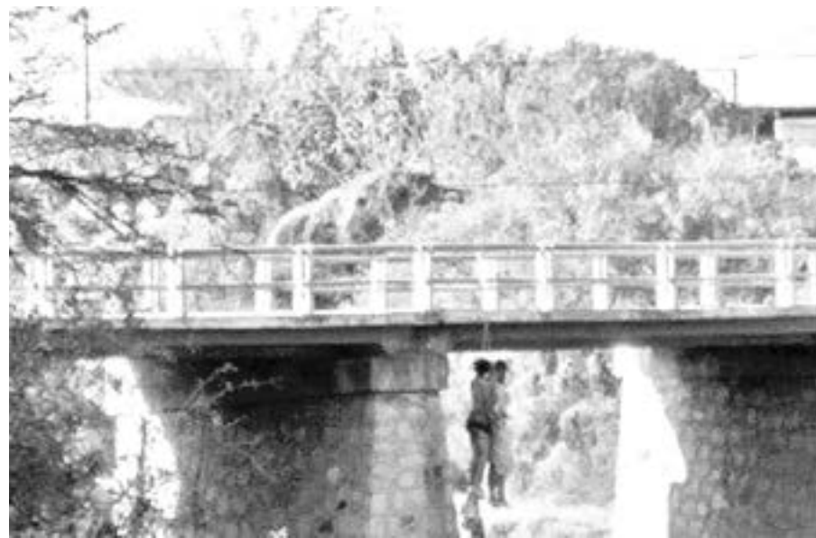
LA VIOLENCIA no cesa en Zacatecas.

De junio a la fecha se han reportado al menos ocho casos similares, en los que cuerpos de 36 civiles y policías asesinados, torturados y semidesnudos han sido dejados a la vista de automovilistas en vías federales que cruzan la capital del estado.