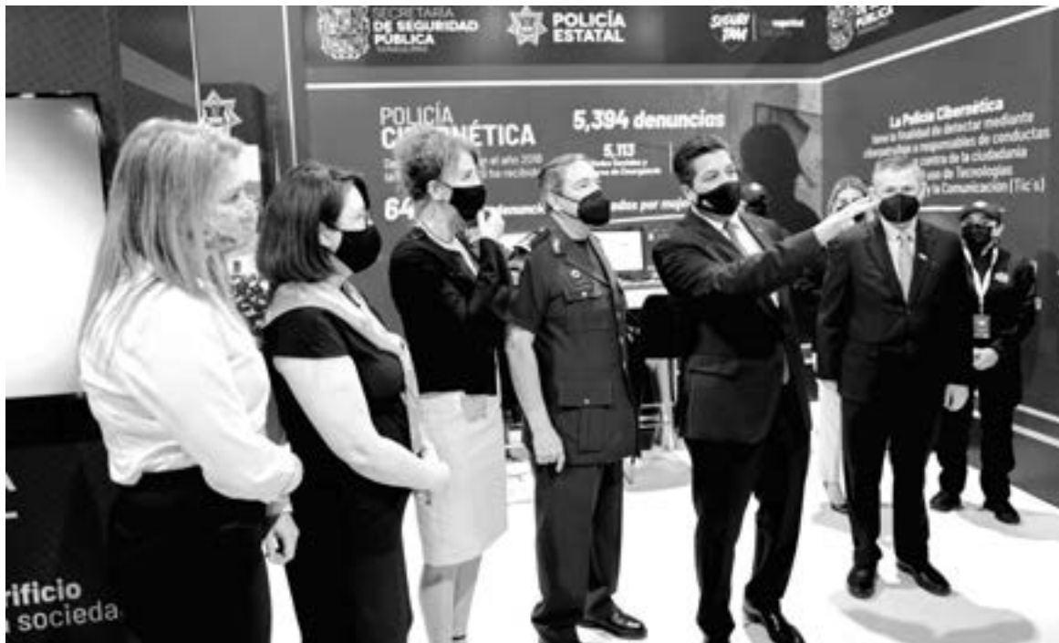
EL GOBERNADOR pone en Marcha el primer Congreso de Seguridad en Reynosa.

“Quiero señalar otros indicadores que van de la mano con las acciones que hemos llevado a cabo en materia de seguridad pública, ya lo mencioné el secretariado, ya ponen a Tamaulipas entre los 10 estados más seguros en nuestro país en el entendido de que faltan muchas cosas por hacer pero que en la medida que sigamos trabajando