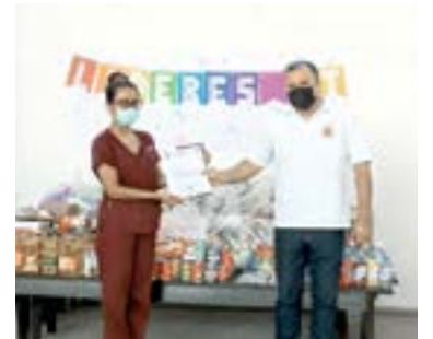
LA ASOCIACIÓN CENDAA es otra de las que fue favorecida con despensa

La Asociación CENDAA también recibió de manos de los alumnos de preparatoria