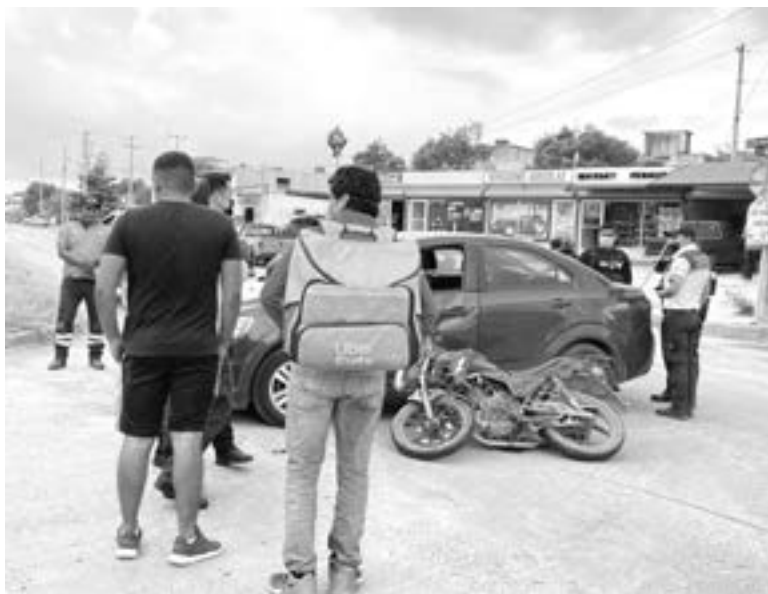
MAS LE hubiera valido hacerse responsable desde un principio

El accidente fue en el cruce de Carlos Adrián Avilés con Sara Peña de Camargo, y de acuerdo a datos recabados en el lugar de los hechos, todo trascendió cuando él ahora herido, manejaba una motocicleta en sentido de poniente a oriente por la calle Carlos Adrián Avilés, y