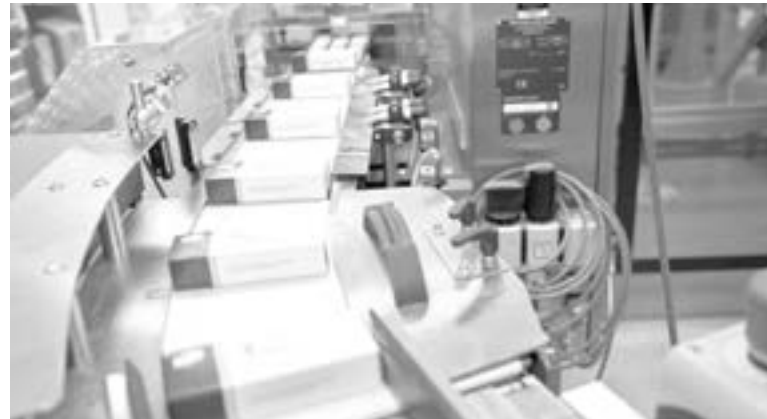
OTRA FORMA de combatir a la enfermedad

Pfizer indicó el jueves que el precio que el Gobierno estadounidense está pagando refleja el número elevado de ciclos de tratamiento adquiridos para 2022.