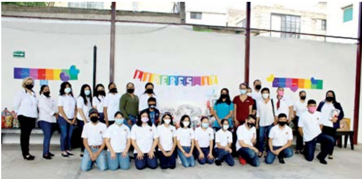
EL INSTITUTO TAMAULIPAS junto con el programa IT ayudo con la campaña de recolección de tapitas y despensa.