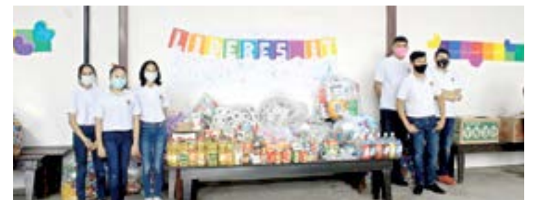
LA ASOCIACIÓN Ponte las Alas recibió de manos de los alumnos tapitas recolectadas

Al evento asistieron los directores de las diferentes divisiones, primaria, secundaria y preparatoria, así como personal docente y administrativo quienes pertenecer al programa IT que año con año realiza este tipo de eventos.