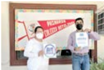
EL COLEGIO MOTOLINIA recibió el distintivo de Escuela Segura

se otorgó el distintivo de ESCUELA SEGURA por parte de COEPRIS ya que se logró cumplir con todos los lineamientos que se necesitaban para poder regresar a clases próximamente.