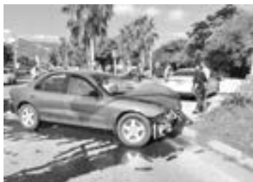
EL CONDUCTOR del Cavalier aceptó su responsabilidad

Cabe mencionar que afortunadamente no presentaba lesiones de gravedad, por lo que pu-