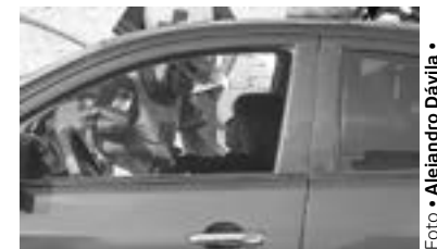
LA MUJER sufrió algunos golpes pero no fueron de gravedad.

Trascendió que ella viajaba en un automóvil Nissan Versa, que