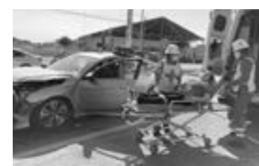
UNA MUJER resultó lesionada en el percance

en un vehículo Honda Civic, de modelo reciente y con placas de Tamaulipas, y la trayectoria que llevaban era de sur a norte por José Sulaimán.