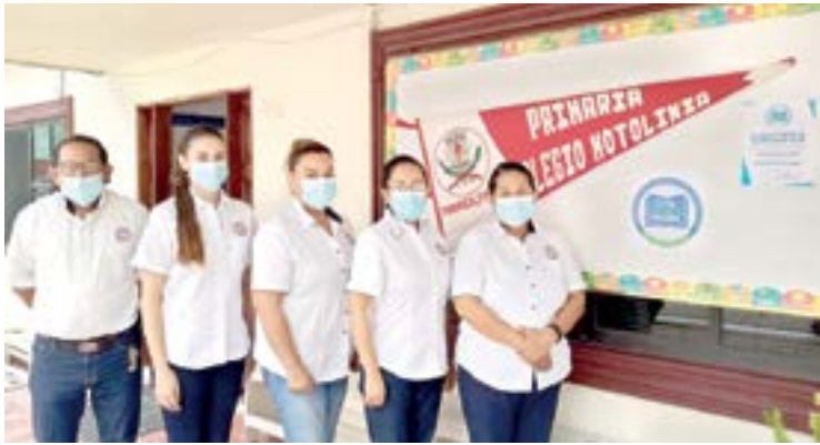
LAS MAESTRAS recibirán próximamente a los alumnos luego de una larga espera.