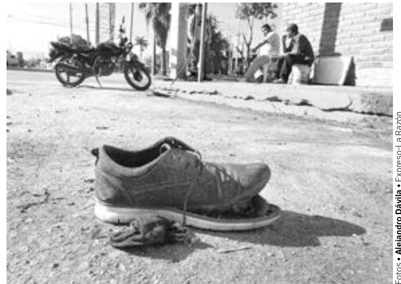
EN EL percance un zapato se le zafó

40 AÑOS ES LA EDAD ESTIMADA DEL CON- DUCTOR LESIONADO