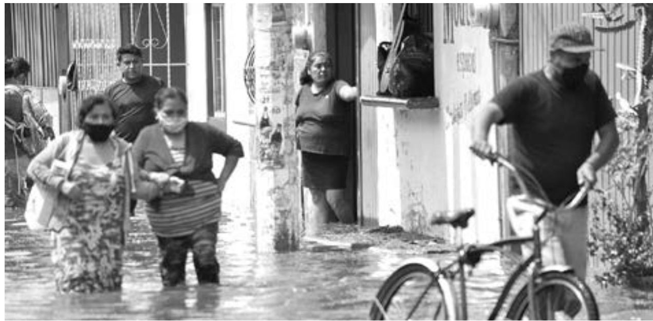
FALTA APOYO con más presupuesto para reparar el daño en comunidades.

“Este será cofinanciado entre el Instituto y su banco de preferencia. Bajo este esquema, la institución bancaria será la encargada de realizar el perfilamiento del acreditado y determinará el monto del financiamiento; del total del crédito, el Infonavit participará con el 30 por ciento con un tope de 325 UMAs (885 mil 446 pesos)”, dijo.