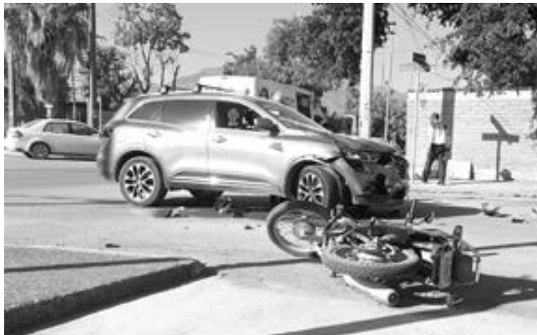
LA CAMIONETA no hizo alto y se fue contra la moto

colocado un vendaje en el pie izquierdo, ya que presentaba una herida la cual no le ameritó su traslado a un hospital.