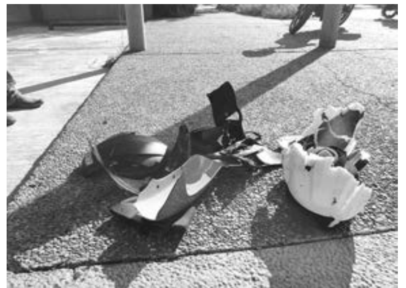
EL CASCO quedó hecho pedazos literalmente

los carriles de la transitada arteria, no efectuó el alto correspondiente.