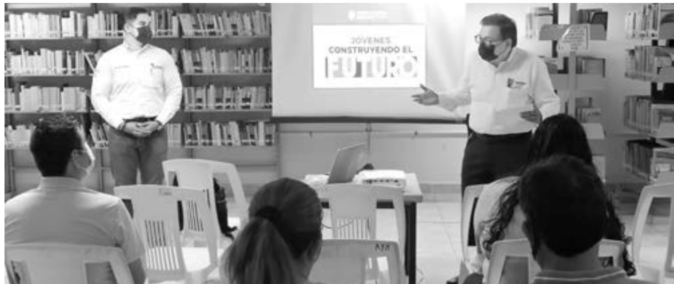
JÓVENES DEL SUR encuentran trabajo en el campo.