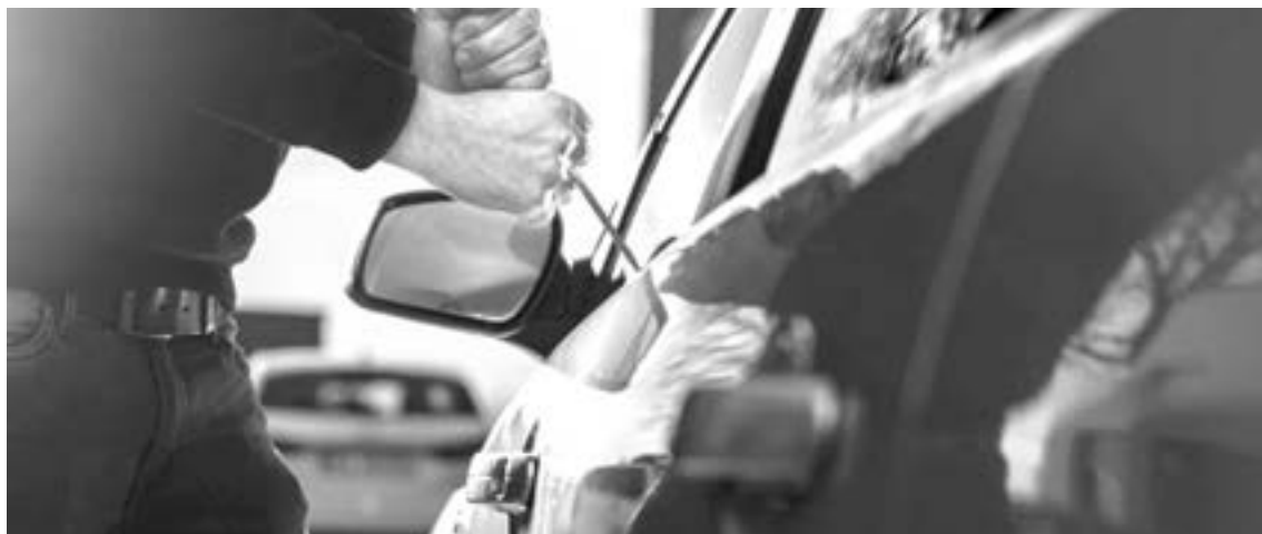
EL PASADO mes de octubre se robaron alrededor de 25 vehículos en la zona sur.

Este delito ha dejado de ser un "foco rojo" para cada una de las autoridades, cada vez son menos los automóviles que son arrebatados por los amantes de lo ajeno.