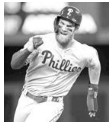
HARPER es de los mejores jugadores de la MLB

El jardinero derecho de 29 años se une a Mike Trout (3) y los dominicanos Albert Pujols (3) y Alex Rodríguez (2) como los únicos peloteros con múltiples estatuillas del