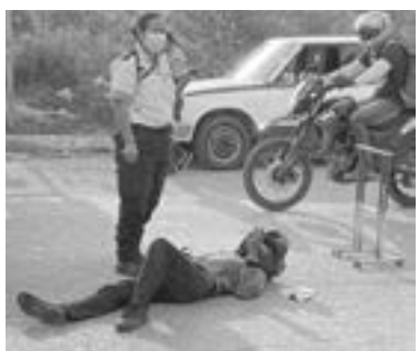
EL RESPONSABLE del golpe huyó del lugar

El accidente se registró este jueves por la tarde, en la avenida Carlos Adrián Avilés con Revolución, a la altura de la colonia