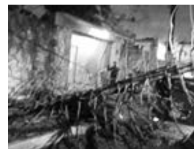
LA UNIDAD afectada se encontraba estacionada.

La circulación se vio interrumpida por varios minutos en lo que se realizaban las maniobras correspondientes de abanderamiento, atención de los heridos y el traslado de los vehículos.