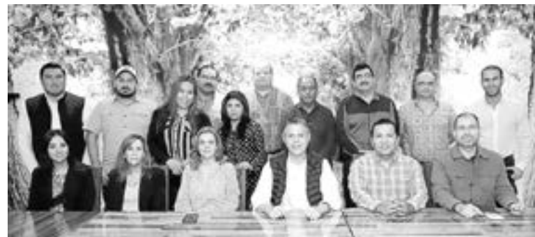
CONTINÚA PROMOCIÓN en Valle Hermoso y Río Bravo.

Mencionó que se deben de continuar realizando las inversiones necesarias para no estar retrocediendo.