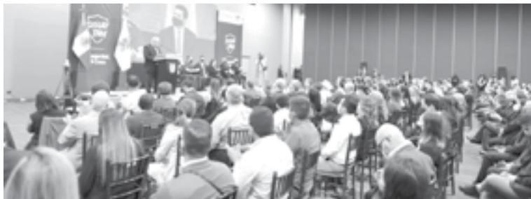
DESTACA EL gobernador trabajo realizado en materia de seguridad por César Verástegui Ostos

nosa el Centro General de Coordinación, Comando, Control, Comunicaciones, Computo e Inteligencia (C5).