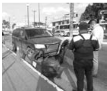
CON EL GOLPAZO, uno de los vehículos quedó dañado de la parte delantera.

En el hecho vial participaron una Chrysler Town and Country color guinda y una Chevrolet Blazer color blanco.