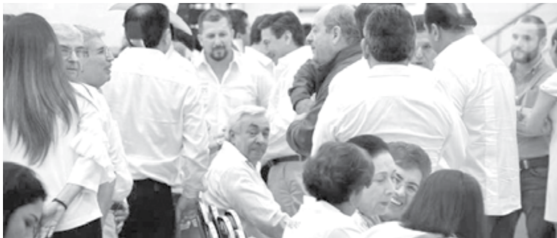
PRIISTAS LE apuestan a la Convención de Delegados para elegir candidato a gobernador