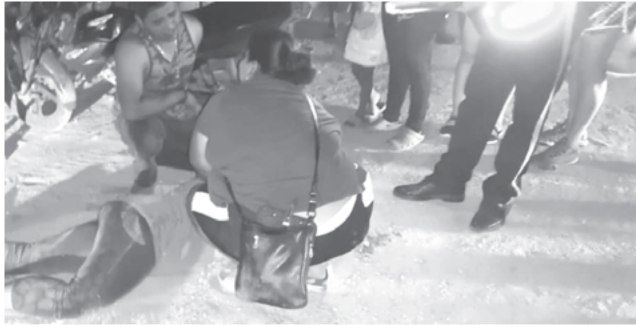
LA MUJER perdió la vida casi de manera instantánea.

Una persona resultó lesionada en el encontronazo.