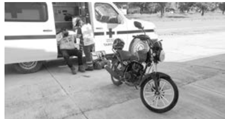
PARAMÉDICOS DE la Cruz Roja le brindaron los primeros auxilios

Los oficiales de tránsito local acudieron a tomar conocimiento de los hechos.