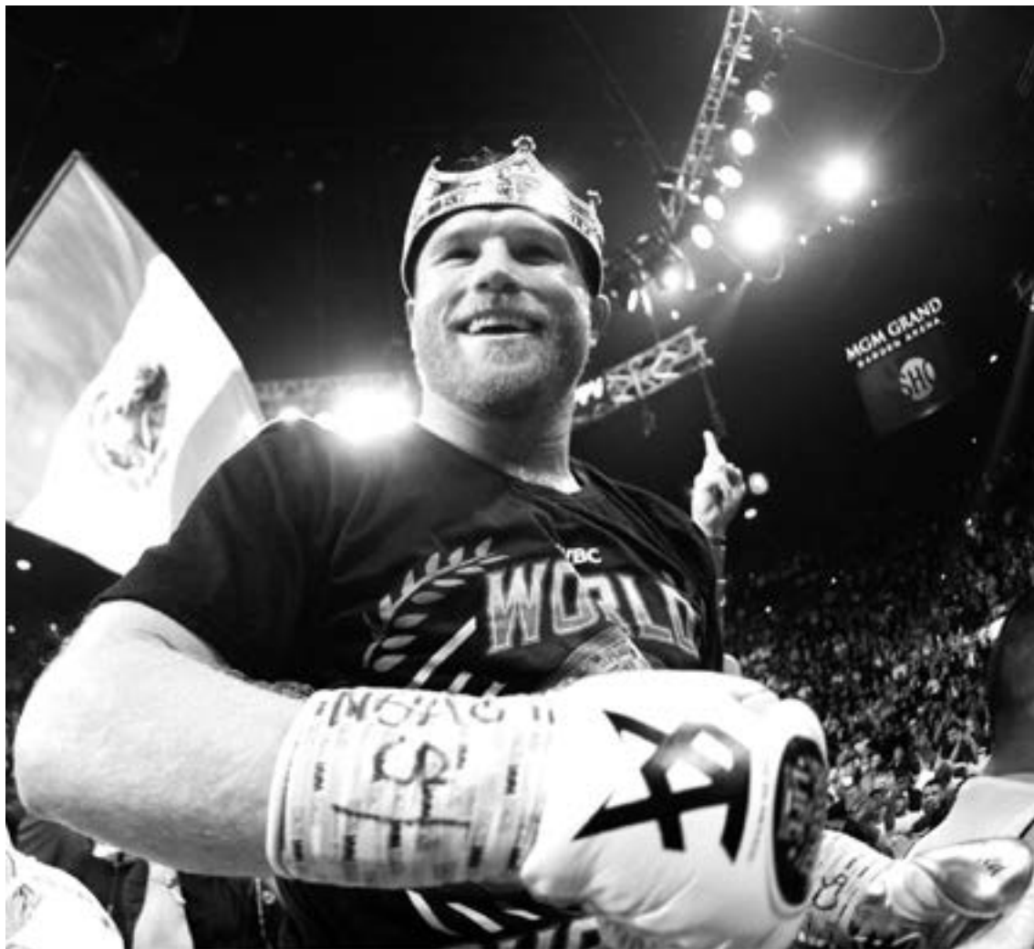
SAÚL ÁLVAREZ no dudó en pelear ante Makabu