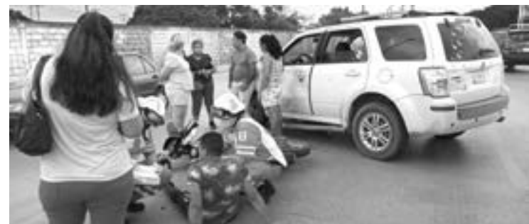
EL OPERADOR del vehículo de dos ruedas acabó en el suelo con una lesión en la pierna derecha.