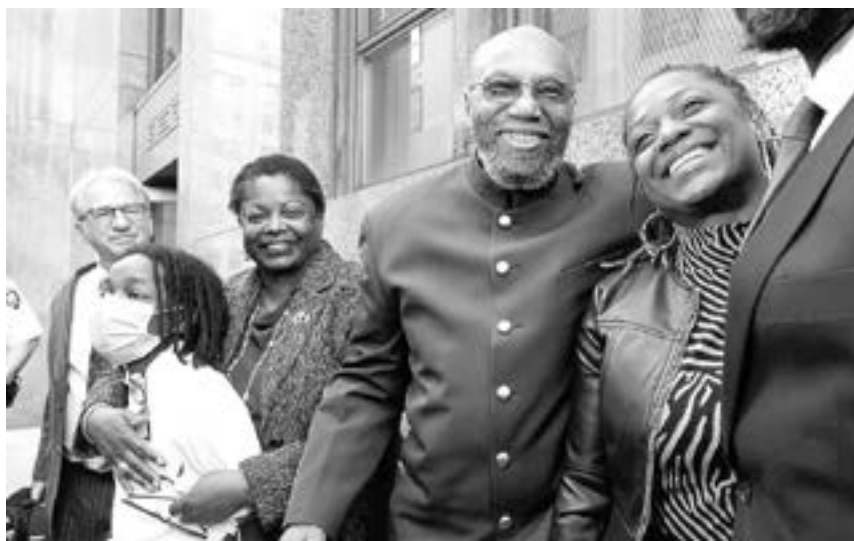
MALCOLM X junto a Martin Luther King Jr fue una figura emblemática en la lucha por los derechos civiles

"Lamento que este tribunal no pueda deshacer por completo las graves injusticias en este caso y devolverle los muchos años que perdió", dijo Ellen N. Biben, jueza de la Corte Suprema del Estado en Manhattan que presidió la