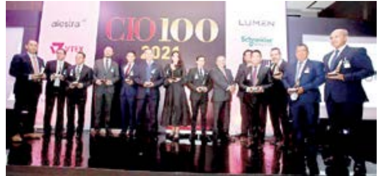
LA UNE continúa cosechando éxitos académicos.

Cabe resaltar que esta edición tuvo una cifra sin precedentes en la historia del premio, siendo más de 240 postulaciones de proyectos TI, que fueron recibidas en tiempo y forma, de las cuales, el Conse-