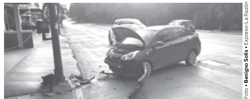
EN EL ENCONTRONAZO una persona resultó lesionada.

La primera unidad circulaba a gran velocidad y al momento de llegar a ese punto, se impactó con el poste de alumbrado público.