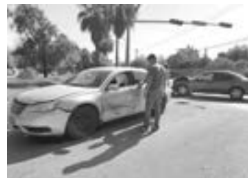
AMBOS CONDUCTORES resultaron solo con golpes leves

Detalló que guiaba su automóvil Chevrolet Cavalier, en sentido de poniente a oriente sobre