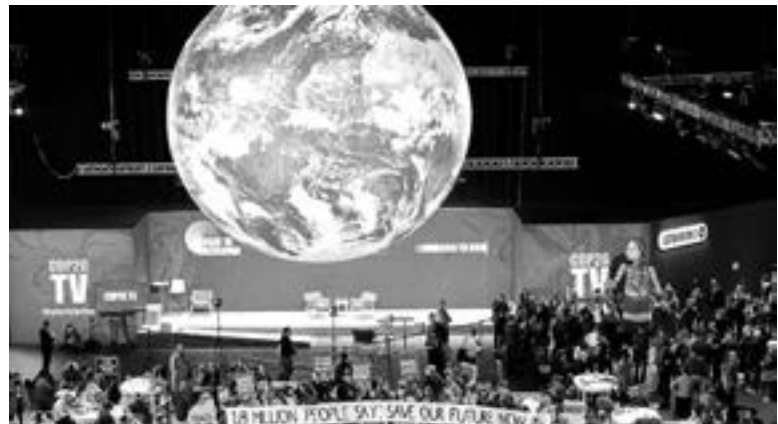
UN RETO para revertir el daño producto del Cambio Climático en todo el mundo

Este fijó en 2015 el objetivo de limitar el aumento de la temperatura global por debajo de +2