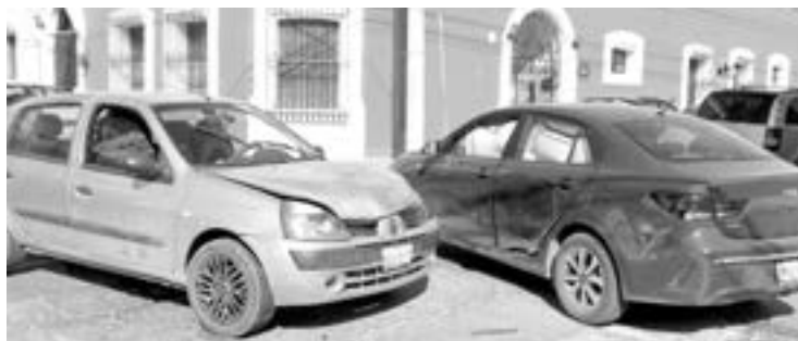
ASÍ QUEDARON las unidades participantes en el choque

En las investigaciones realizadas por oficiales se estableció que la responsable es la conductora del Kia cuando éste se desplazaba en sentido de sur a norte por la calle 18 por lo que al llegar