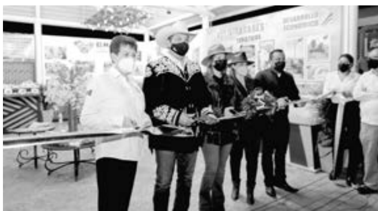
EL GOBERNADOR y su esposa inauguraron la Feria