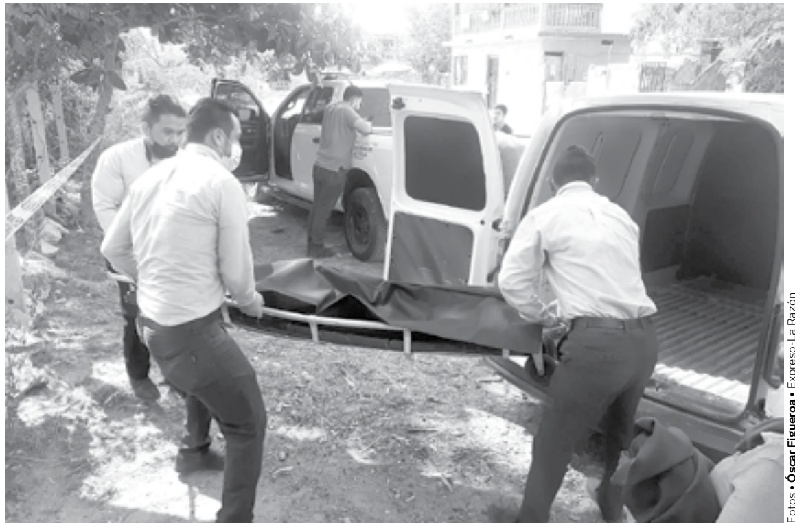
EL CUERPO fue llevado al Servicio Médico Forense.