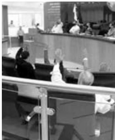
DIPUTADOS DE Baja California aprobaron la despenalización del aborto.

El pasado 29 de octubre, la mayoría de los diputados aprobaron la despenalización del aborto mediante reformas al Código Penal y leyes secundarias. Pese a que en septiembre, la Suprema Corte de Justicia de la Nación (SCJN) resolvió que los Estados carecen de competencia para definir el origen de la vida humana, una reforma a la Constitución del Estado, que en su artículo 7 habla de tutelar la concepción, fue imposible por no contar con los 17 votos necesarios.