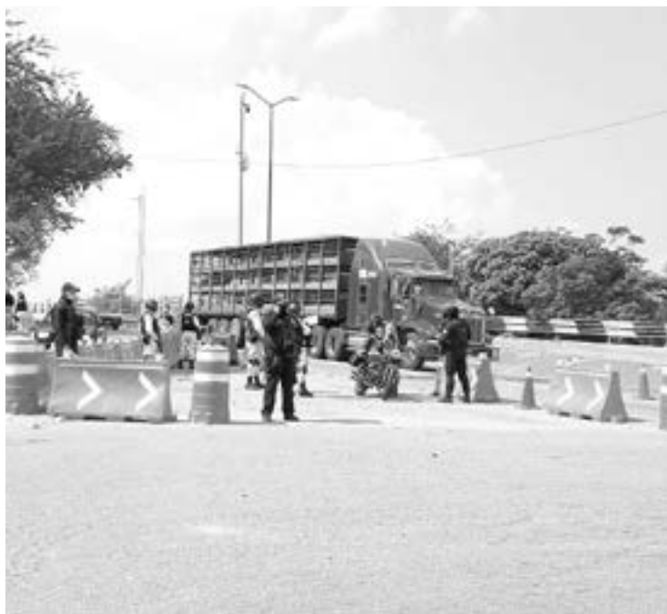
ELEMENTOS POLICIA COS vigilarán todo el día.