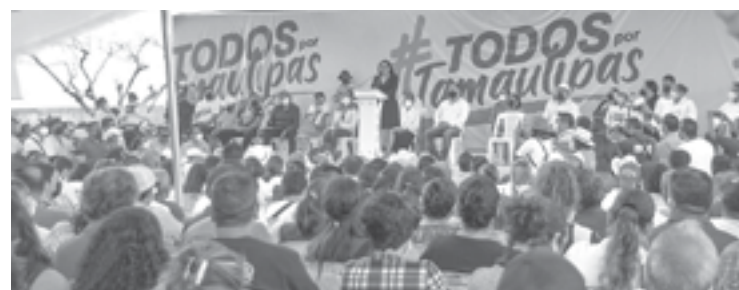
HOY SE reunirá en Victoria asociación Todos por Tamaulipas.

2022 en Tamaulipas. Cuentas conmigo para que junto con los panistas