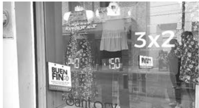
LAS VENTAS no han repuntado.

eludible de COMAPA Zona Tam de trabajar las veinticuatro horas del día los siete días de la semana en favor de la ciudadanía.