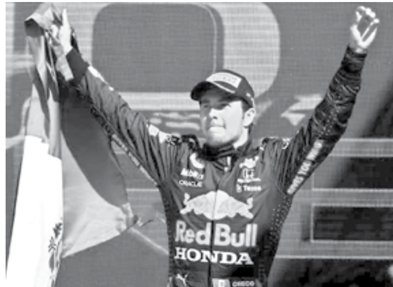
EL MEXICANO no le fue tan bien en Sprint de F1.

Gruden, quien originalmente entrenó a los Raiders desde 1998 hasta 2001, luego fue a Tampa Bay Buccaneers, con quienes venció a los Raiders en el Super Bowl XXXVII, estuvo con ESPN de 2009 a 2017. Regresó a los Raiders en 2018 en un Contrato de 10 años, con un valor de 100 millones de dólares.