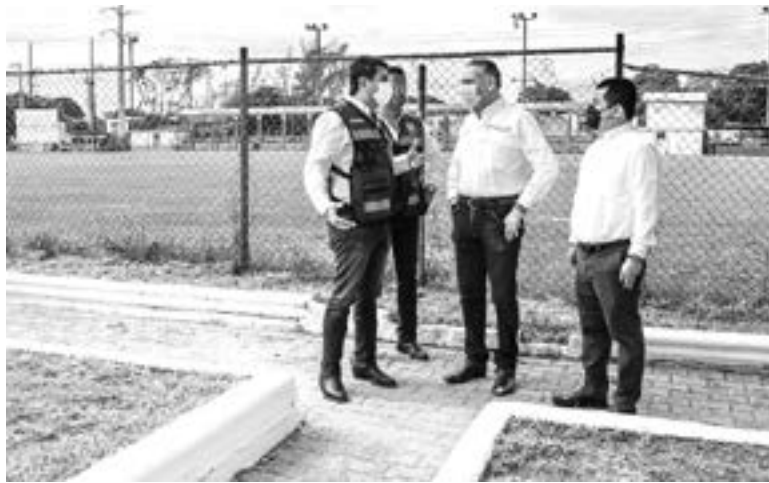
EL PRESIDENTE MUNICIPAL supervisa los trabajos.

Así también, el Presidente Municipal, dio arranque en el mes de octubre a un importante programa de limpieza, fumigación y sanitización de las más de 90 escuelas públicas en la urbe petrolera, para garantizar espacios seguros a estudiantes, maestros y padres de familia, una vez que las autoridades de Salud indiquen el regreso a clases.