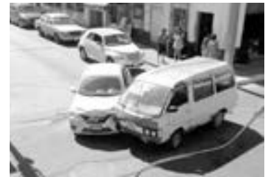
LAS UNIDADES sufrieron algunos daños materiales.

El operador del primer vehículo se desplazaba por la Matienzo y al arribar a ese cruce ignoró el señalamiento de alto por lo