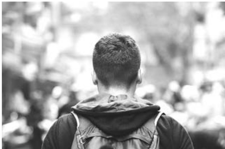
BUSCAN INTEGRARLOS a un programa federal.

Afirmó que habrá de continuar con las gestiones de todos los beneficios contractuales que corresponden, sin omitir el compromiso