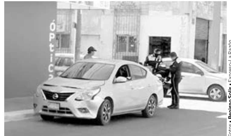
EL AUTOMÓVIL sufrió daños en el cofre.

Al sitio arribaron elementos de Tránsito para dialogar con los involucrados y verificar si llegarían a un acuerdo sobre la reparación de daños.