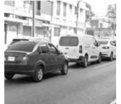
EL CHOQUE por alcance involucró a tres coches.