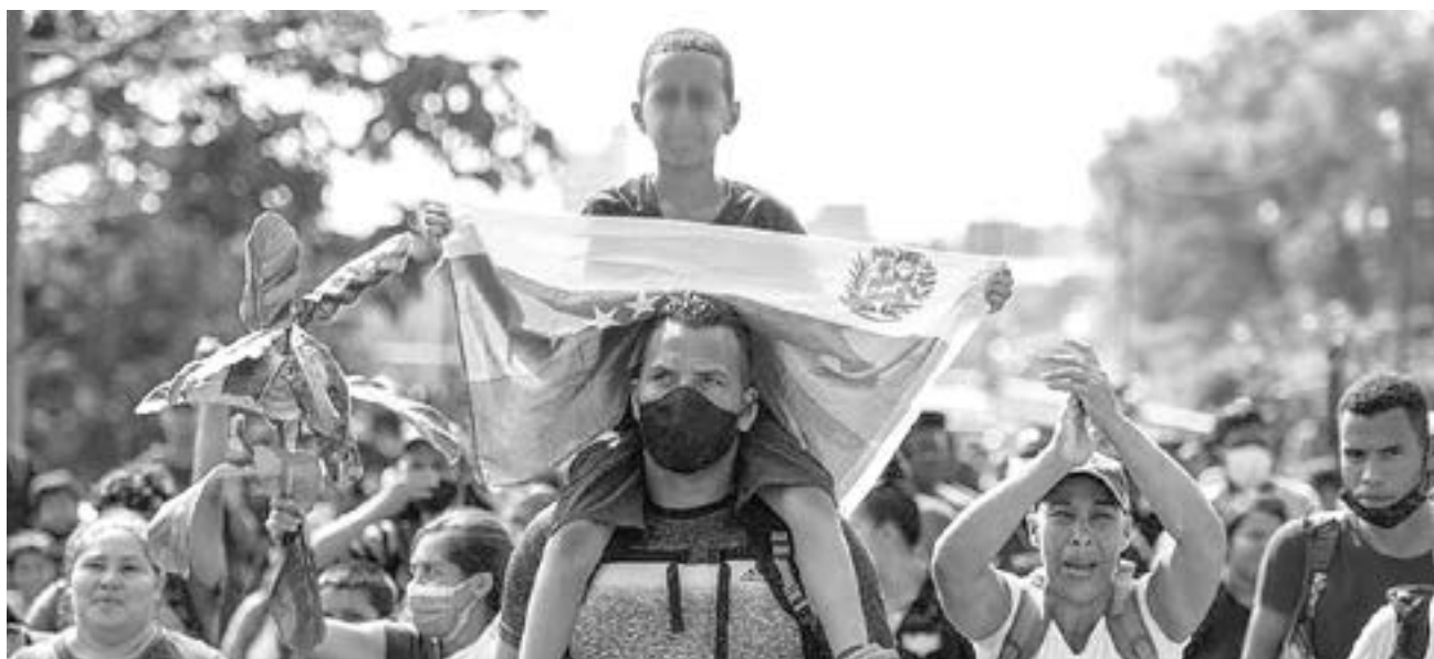
UNA MEDIDA para frenar la migración masiva de venezolanos