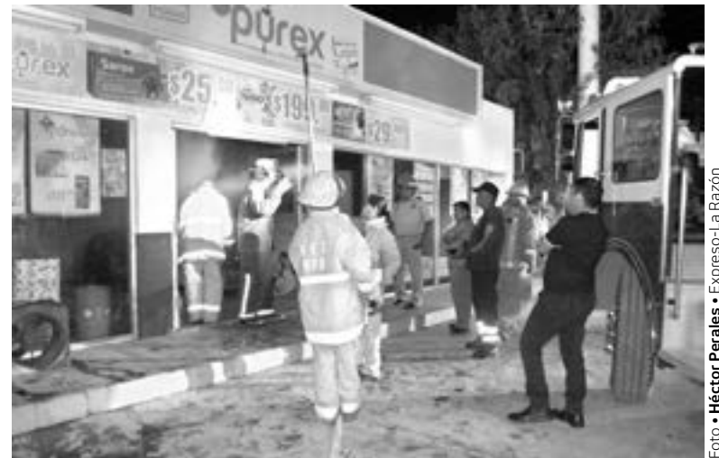
ESTIMAN QUE por sobrecalentamiento en un enfriador se originó el fuego

Los daños fueron de consideración ya que también toda la mercancía alcanzó el humo que despedía el fuego.