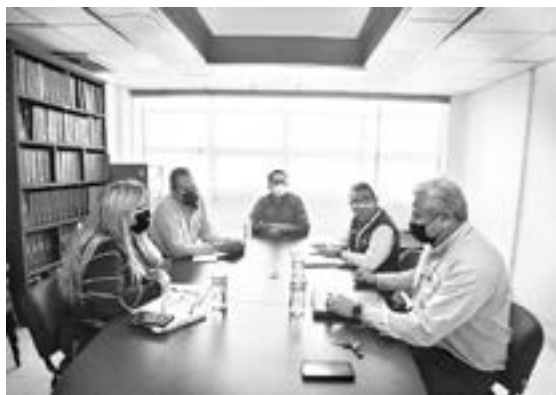
GERENTES DE área de Comapa se reunieron con Regidores.

el Gerente General ha realizado en el servicio del agua en la zona sur del estado.