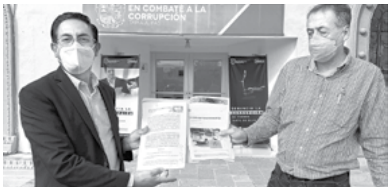
INTEGRANTES DEL PRD presentaron la denuncia ante la UIF.

Pidieron a la Unidad de Inteligencia Financiera del Estado (UIFE), se verifique el registro público de vehículos y de propiedades de Tamaulipas y de otros estados, donde tengan presencia esas empresas.