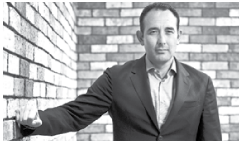
ROBERTO GIL fue invitado por Marko Cortés para participar en la elección de Tamaulipas.

dente @MarkoCortes, al nombrarme Delegado del CEN para la elección de