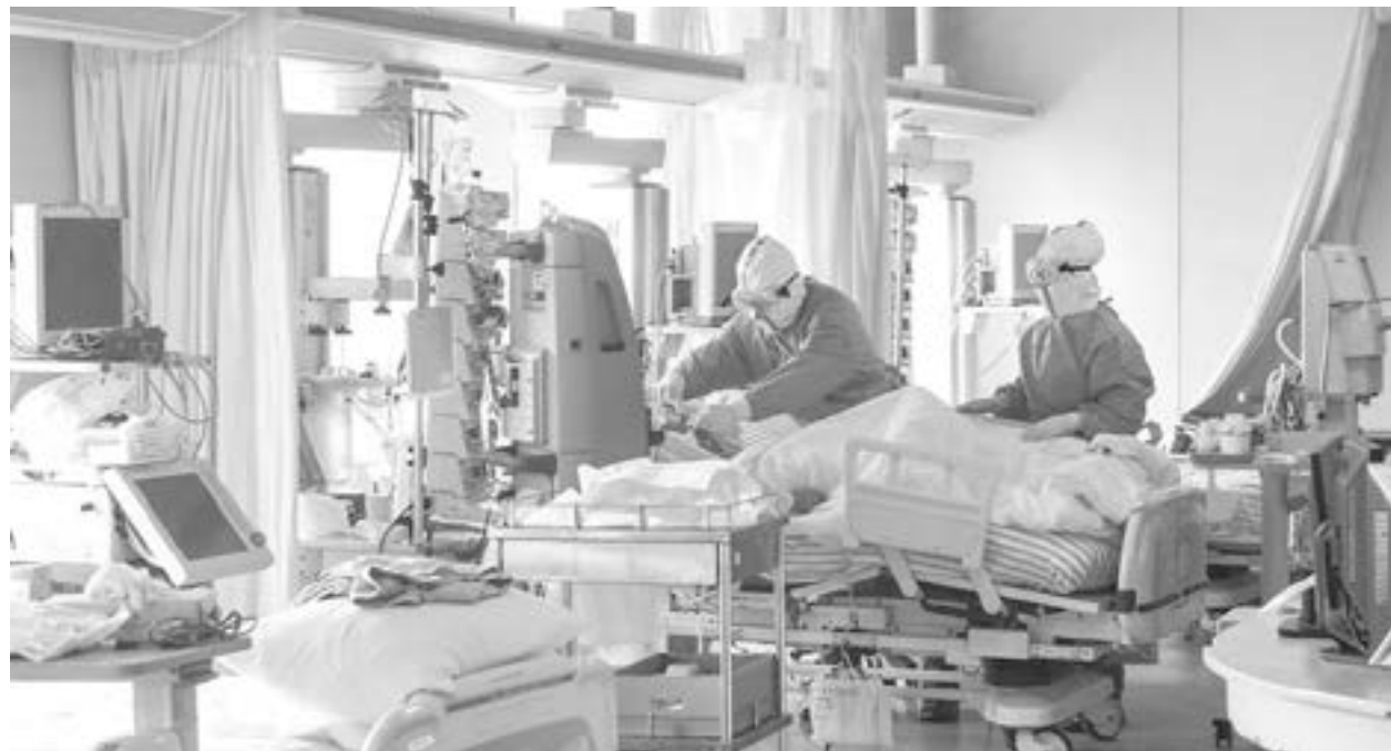
AUMENTA HOSPITALIZACIÓN en la zona sur.