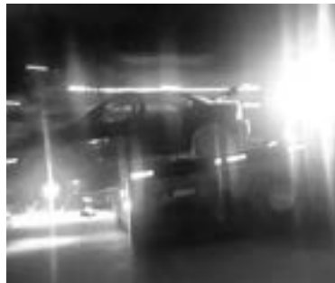
FUE TRASLADADO por una grúa al mesón municipal.

Los tripulantes del vehículo no ameritaron traslado al hospital y se retiraron del sitio por sus propios medios.