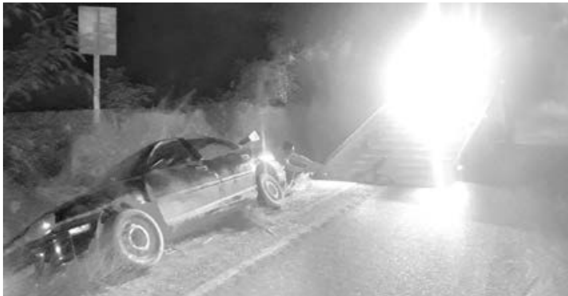
EL AUTO quedó a un costado de la carretera.

Al sitio llegaron elementos de Protección Civil de Altamira al