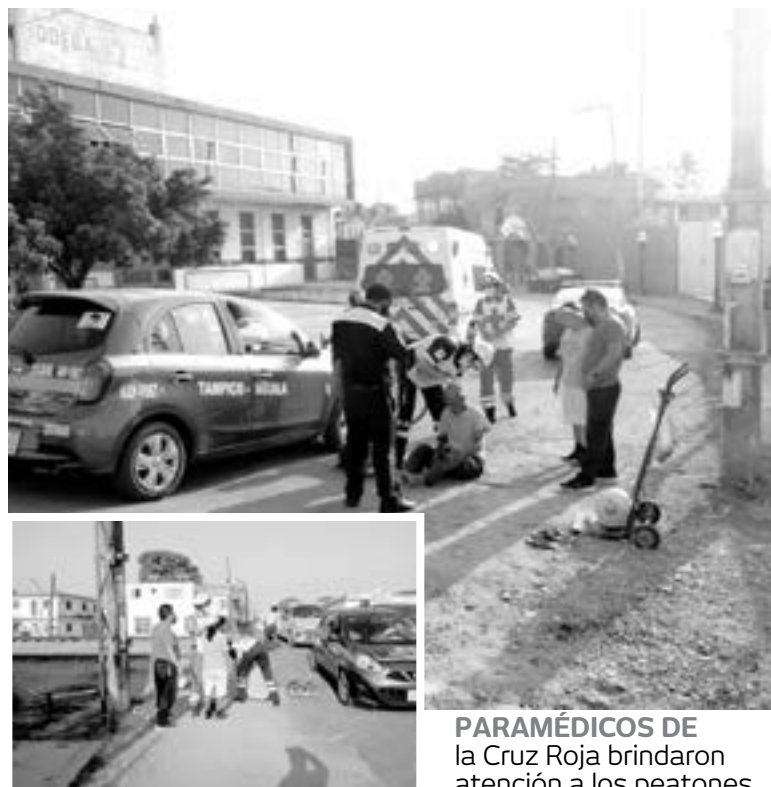
PARAMÉDICOS DE la Cruz Roja brindaron atención a los peatones.