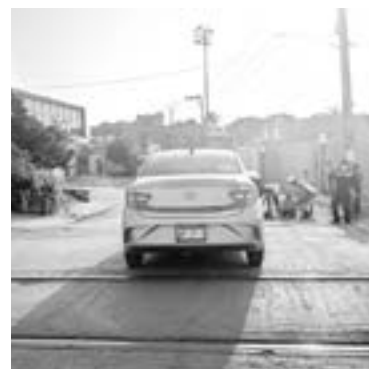
EL HOMBRE quedó tirado inconsciente por algunos minutos.

El percance ocurrió en avenida Monterrey y calle Emilio Carranza, en el límite de la Isleta Pérez con la