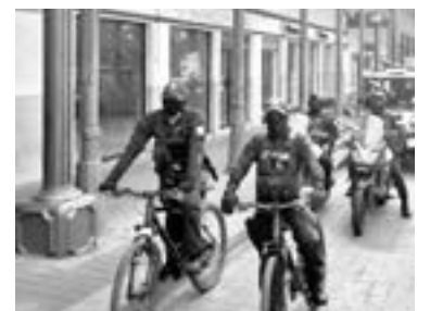
LOS ELEMENTOS tienen como objetivo salvaguardar la seguridad de la población.

Los elementos realizan la vigilancia respectiva en negocios