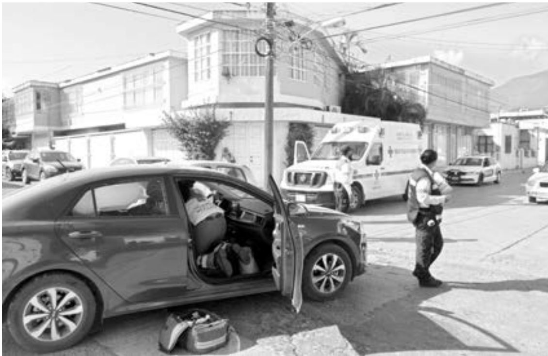
PERSONAL MÉDICO evalúa a una de las mujeres golpeadas