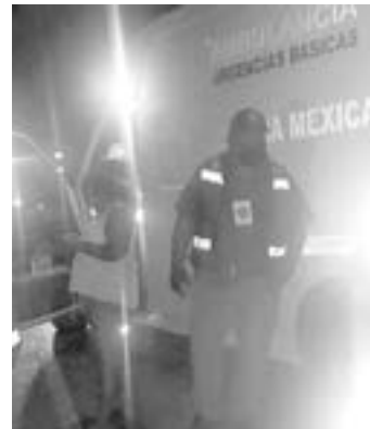
PARAMÉDICOS de la Cruz Roja atendieron a los pasajeros.

Mientras que la unidad fue retirada por una grúa para ser llevada al mesón municipal.