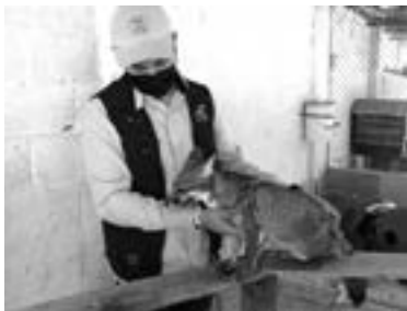
EL CENTRO recibe donación de alimentos.

“El gasto de mantenimiento es entre los 20 y 30 mil pesos, ejem-