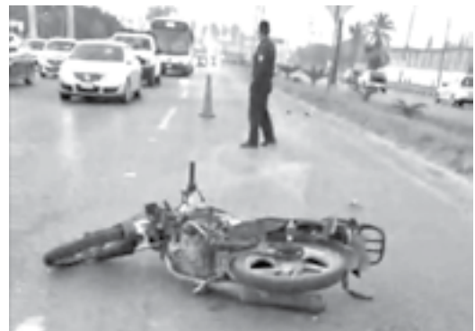
LA MOTOCICLETA quedó recostada sobre el costado derecho del carril.

Mientras que la unidad fue trasladada al Mesón municipal de Altamira.