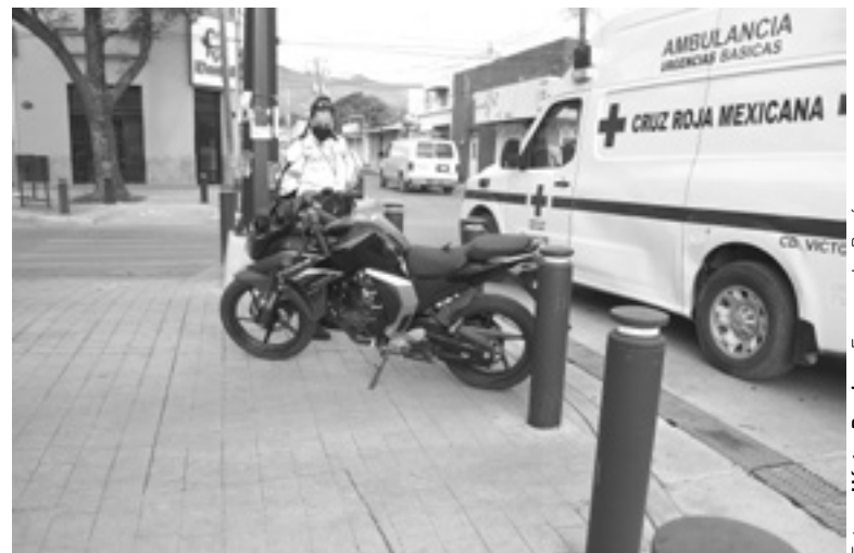
LA MOTOCICLETA que chocó contra el Monza.