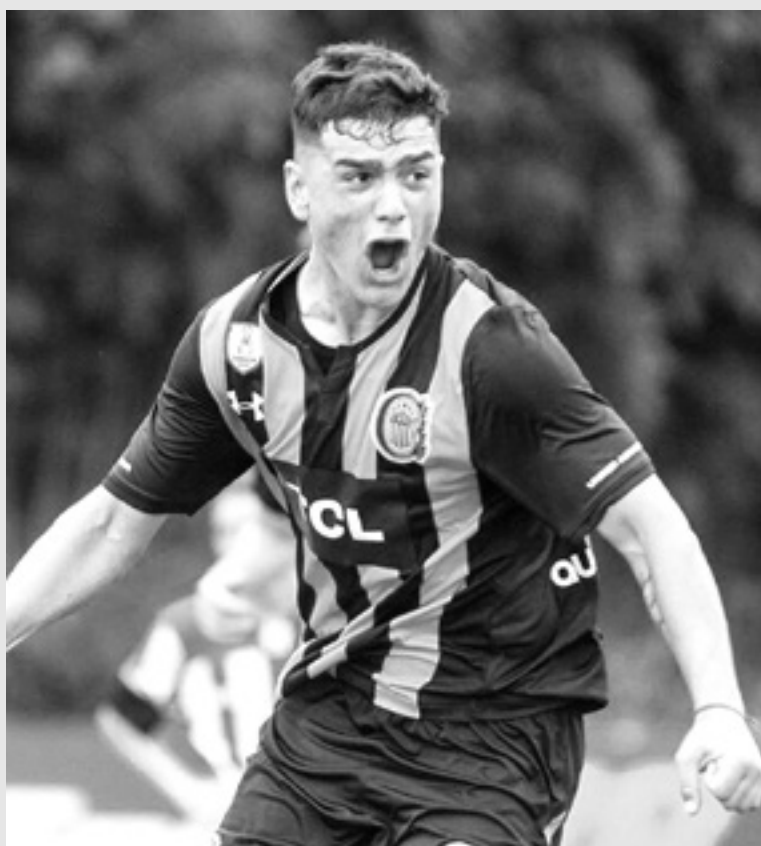
EL MEXICANO milita en el fútbol argentino.

Después de jugar en categorías infantiles en Sarmiento de Leones, club de la localidad