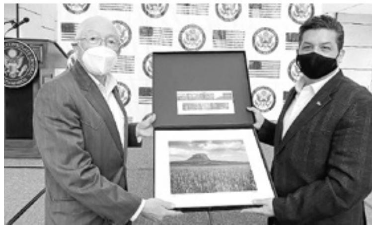
EL EMBAJADOR de EU y el Gobernador refrendaron el compromiso de impulsar a Tamaulipas.

En el encuentro de este lunes, el Embajador y el Gobernador, se intercambiaron presentes; por su parte el diplomático, hizo entrega del libro "Valley of the Dunes" referente a la reserva natural de las dunas de arena en el estado de Colorado, del cual es originario el Embajador y cuyo prólogo está escrito por