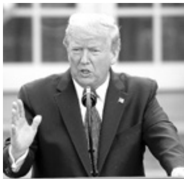
OTRO SEÑALAMIENTO para Trump

"Creo que si hubiéramos implementado mandatos de mascarillas,