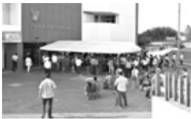
250 TRÁMITES de amparos para vacunarse.