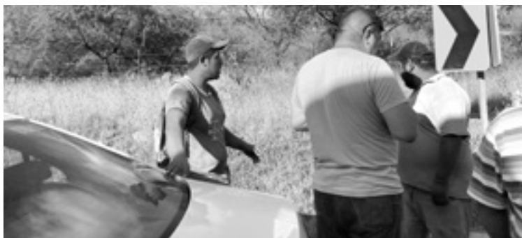
OCURRIÓ EN el kilómetro 20 de la carretera Rumbo Nuevo.

25 AÑOS ES LA EDAD ESTIMADA DEL CONDUCTOR ACCIDENTADO