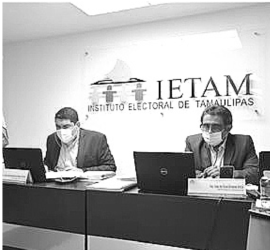
APRUEBA el IETAM en sesión modificaciones al calendario.

Ahora el periodo de precampaña para aspirantes comprenderá del 2 de enero al 10 de febrero; misma fecha que se estableció ahora para los aspirantes