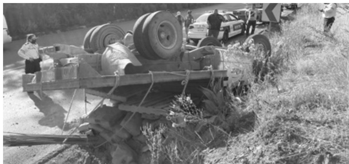
VISIBLEMENTE AFECTADO resultó el chofer del camión de reparto.

Tránsito local solicitó el apoyo de una grúa para poder colocar en posición normal la camioneta y remolcarlo al corralón.