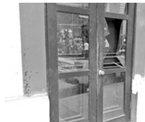
EL CRISTAL de la puerta quedó destruido.