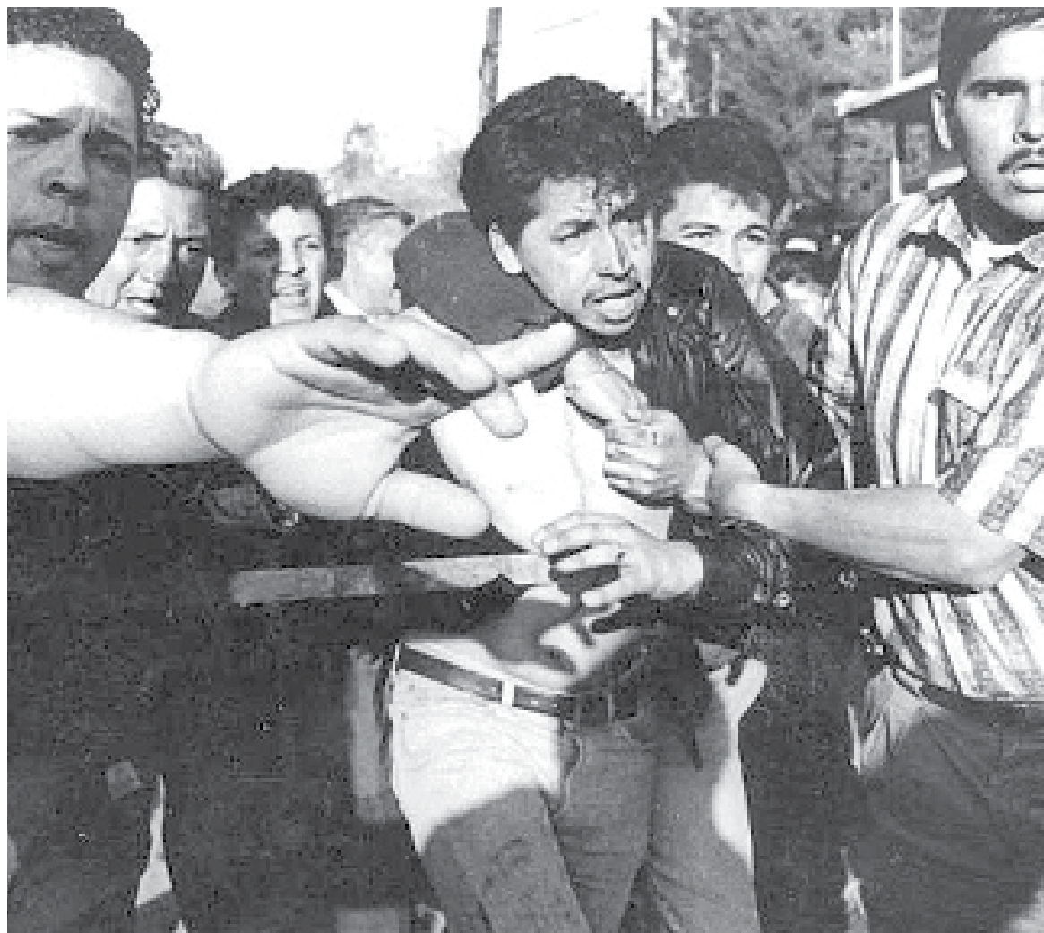
CNDH RECOMIENDA nueva investigación del caso Colosio; acusa que Aburto fue torturado.

“Además, estas nuevas diligencias se deberán abordar sin perjuicio y con perspectiva pro homine, aportar como prueba la propia recomendación y considerar las múltiples omisiones, ocul-