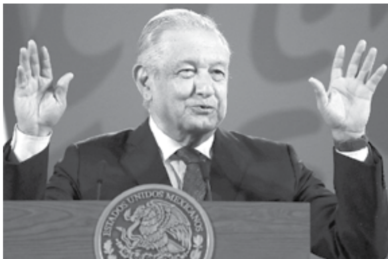
CORTE NO deja que 'fifís vayan a la cárcel': AMLO

"La mayoría de las personas sujetas a prisión preventiva oficiosa son de escasos recursos", escribió Zaldívar en su cuen-