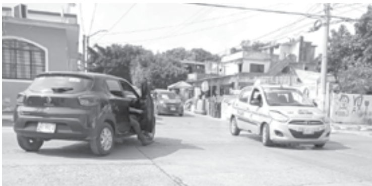
LAS UNIDADES involucradas son un Renault Kwid negro y un Hyundai i10 habilitado como taxi.

Finalmente, los involucrados decidieron llegar a un acuerdo benéfico para ambas partes.