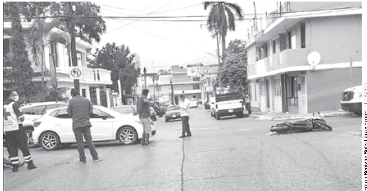
POR IGNORAR la señal de alto, se estampó con el automóvil.