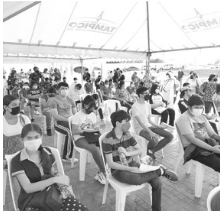
HABRÁ MÓDULOS en los 3 municipios de la zona.

“A los padres, que que nos ayuden con la documentación