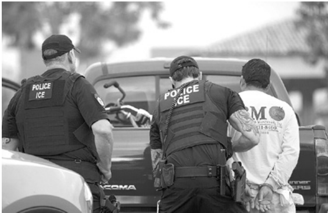
TRAS LOS ARRESTOS intensos con Trump, la calma...

Después de que Joe Biden asumió la Presidencia de Estados Unidos en enero, los arrestos de inmigrantes por parte del ICE en el interior del país cayeron drásticamente debido a las medidas impuestas por el mandatario, incluyendo la moratoria