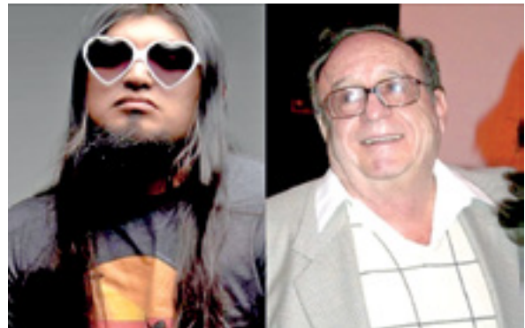
BALLARTA se lanzó contra Chespirito en TikTok.