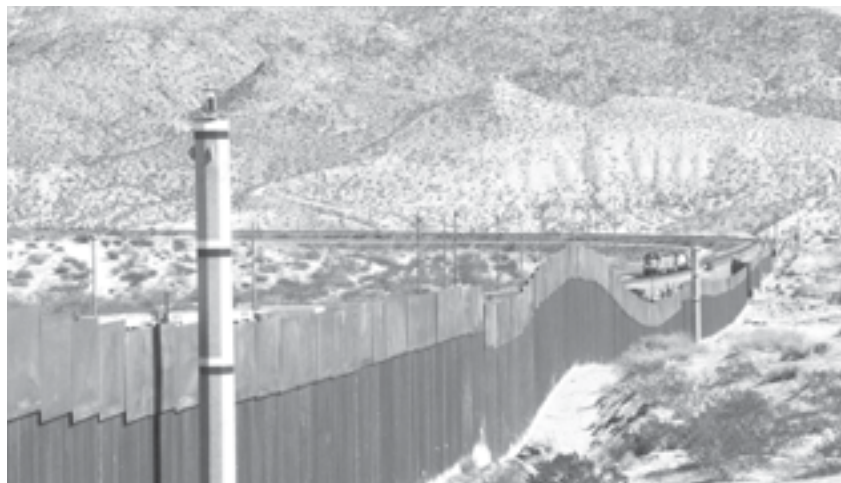
UNA PROPUESTA para combatir el cambio climático.

http://indicadorpolitico.mx indicadorpolitico@gmail.com Canal YouTube: Indicador Político