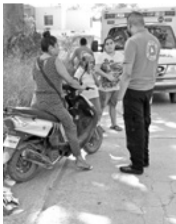
LAS LESIONES no ameritaron que fuera hospitalizada.

La mujer manejaba una motocicleta Italika color verde y al