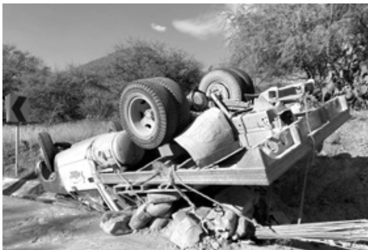
TODO EL peso de la camioneta recayó sobre la cabina y la aplastó.

Al momento del impacto, el joven reaccionó rápidamente a lanzarse hacia el asiento del copiloto, mientras que la camioneta golpeaba contra el pavimento y era aplastada del lado del vo-