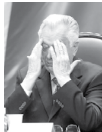
MANUEL BARTLETT, director de la CFE compareció ante diputados.

El diputado del Verde dijo que su bancada está en un momento de análisis, por lo que no puede adelantar una posición, pero consideró que no hace sentido