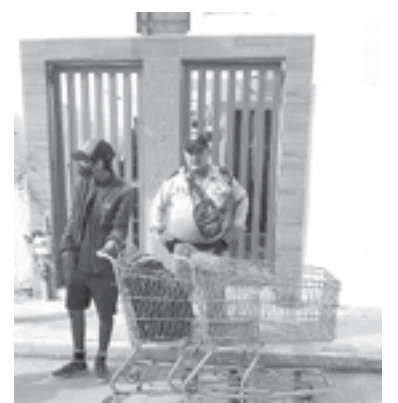
FUE SORPRENDIDO cuando se llevaba dos carros a su casa.

Los veladores le marcaron el alto, llegando al sitio elementos de la