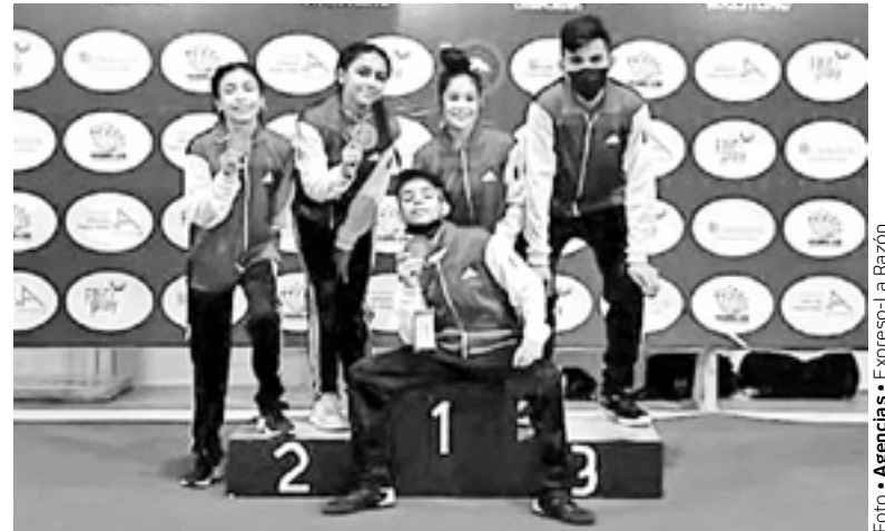
LOS TAMAULIPECOS tuvieron una buena participación.

letas juveniles en 25 disciplinas de tener un fogueo deportivo ante los mejores atletas del continente.