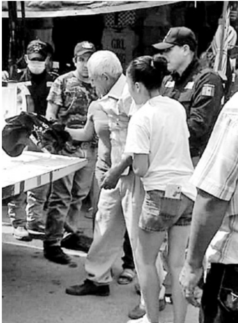
SEPTUAGENARIO TERMINA tirado con golpes en todo el cuerpo sobre la calle.

73 AÑOS DE EDAD TIENE EL ANCIANO QUE FUE DERRIBADO POR LA CAMIONETA.