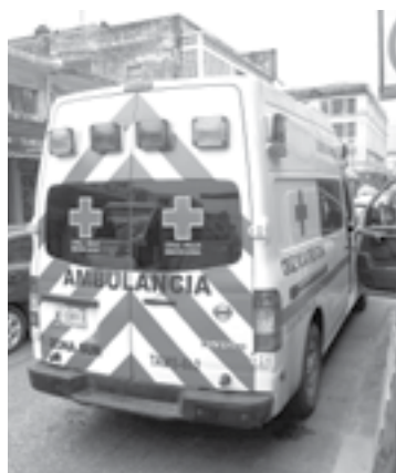
SE TROPEZÓ, cayó y se golpeó la cabeza.

para auxiliarlo mientras se pedía la presencia de paramédicos de Cruz Roja.