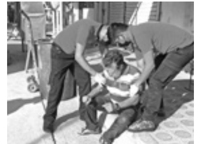
SE PRODUJO una herida en el rostro al caer desde su propia altura.