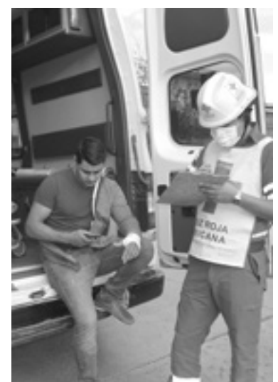
EL CONDUCTOR de la moto sufrió algunas lesiones leves.

Sobre la responsabilidad del percance, los elementos de tránsito in-