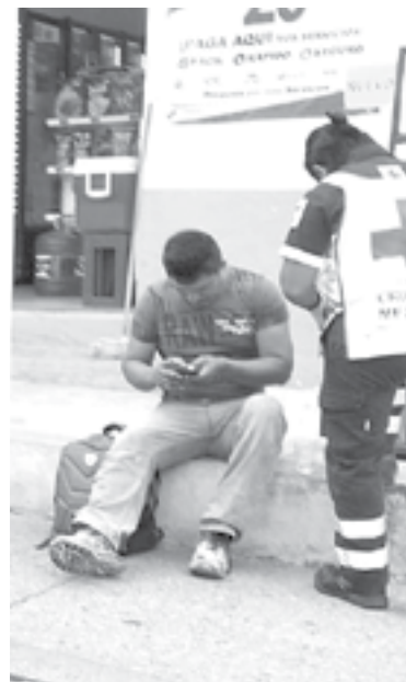
EL CONDUCTOR fue a dar al suelo tras impactarse en un costado de automóvil.

El operador del vehículo de dos ruedas había ignorado momentos