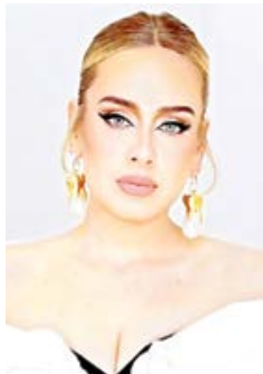
HABLARÁ sobre su nuevo álbum.

Han pasado solo tres días desde que la cantante británica lanzó su nuevo sencillo, "Easy on Me", y ya está en camino de pulverizar sus propios récords.