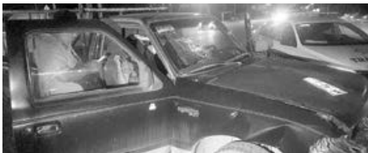
EL CONDUCTOR de la camioneta hizo caso omiso del alto.