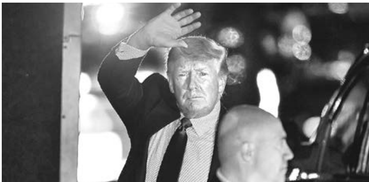
TRUMP CULPA a los manifestantes del altercado