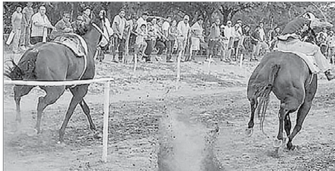
EN TRAGEDIA terminan los festejos de fundación de la colonia Agrícola Piloto.

VARIOS CIUDADANOS tuvieron que hacerse a un lado para evitar ser arrollados por el motociclista.