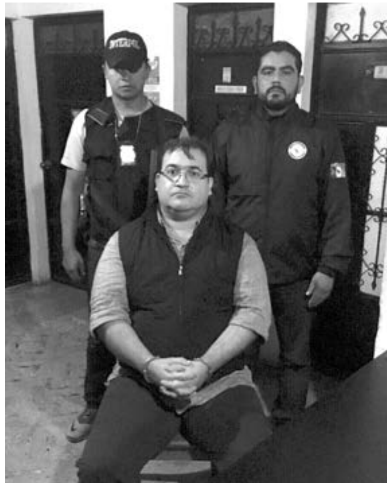
DUARTE, UN ejemplo de la corrupción en México.

La Ley Nacional de Ejecución Penal prevé la libertad condicional del sentenciado si además no ha sido sentenciado en otro juicio en forma definitiva y no tenga otro proceso que amerite prisión preventiva, además de haber tenido buena conducta durante la reclusión.