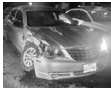
EL SEBRING llevaba preferencia en ese cruce.

11 DE LA NOCHE SE REPORTÓ EL INCIDENTE AL NÚMERO 911