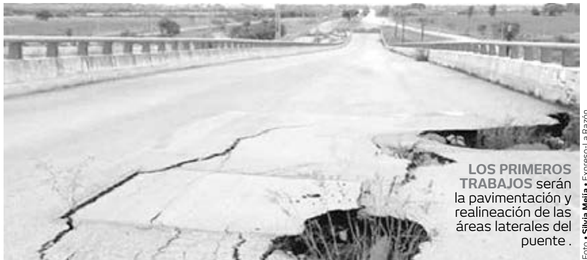
LOS PRIMEROS TRABAJOS serán la pavimentación y realineación de las áreas laterales del puente.

Concluyó el alcalde altamirense indicando que: “vamos a seguir estando en las calles, para escuchar las demandas de los ciudadanos, Altamira tiene prisa y vamos a corresponder con esta encomienda que tenemos”.