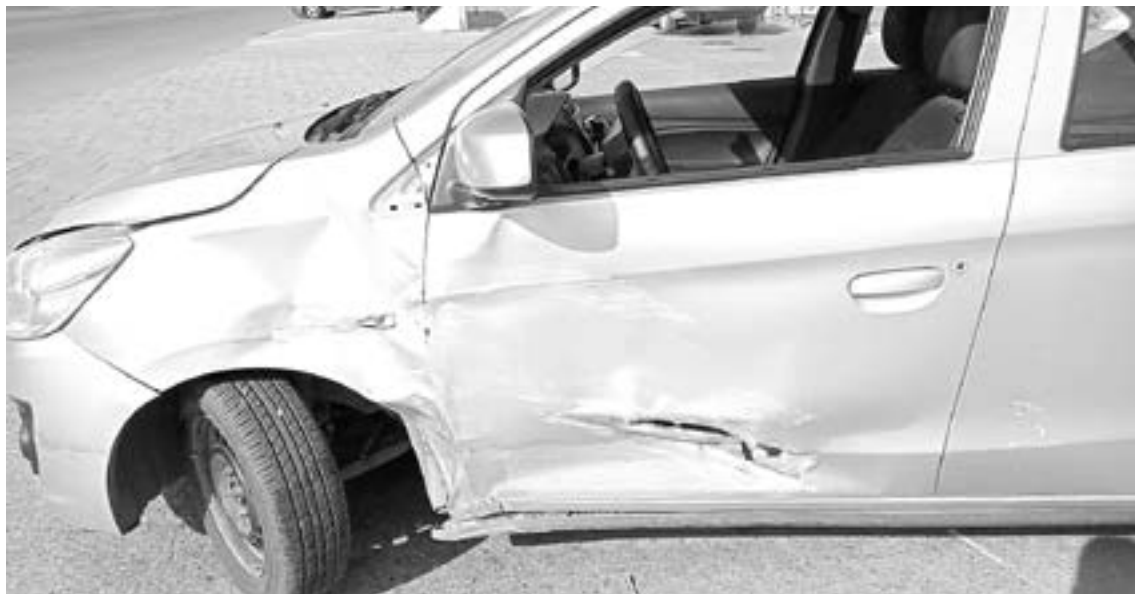
EL ATTITUDE color gris sufrió graves daños.

LA UNIDAD DEL TRANSPORTE PÚBLICO DIO VUELTA A LA DERECHA PARA TRATAR DE INCORPORARSE A LA CARRETERA, IMPACTANDO A UN VEHÍCULO QUE ESTABA ESTACIONADO