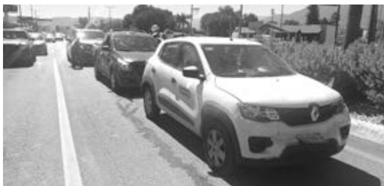
LOS CARROS se fueron chocando uno a uno.

Los primeros en llegar al sitio fueron agentes de tránsito, los cuales pidieron el arribo de una ambu-