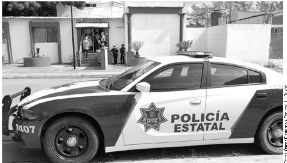
REGISTRA MADERO 164 robos hasta septiembre.

se encuentra la Unidad Nacional, Ampliación de la Unidad Nacional,