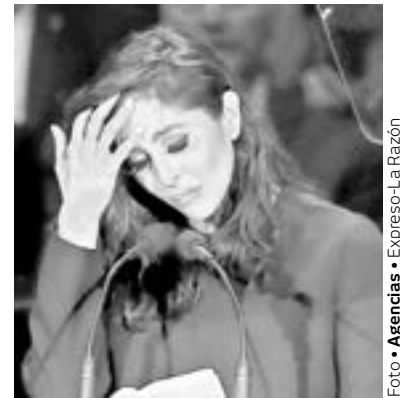
LA ESPOSA BRYANT, podría estar muy afectada psicológicamente.

do de Los Ángeles, interpuesta en 2020 por la vía civil, Bryant afirmó que las fotos del accidente de helicóptero fueron tomadas y compartidas por empleados de los departamentos de bomberos y sheriff locales sin fines profesionales.