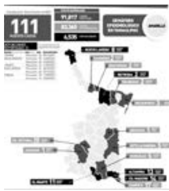
SIGUEN A LA BAJA, los nuevos casos de Covid-19.