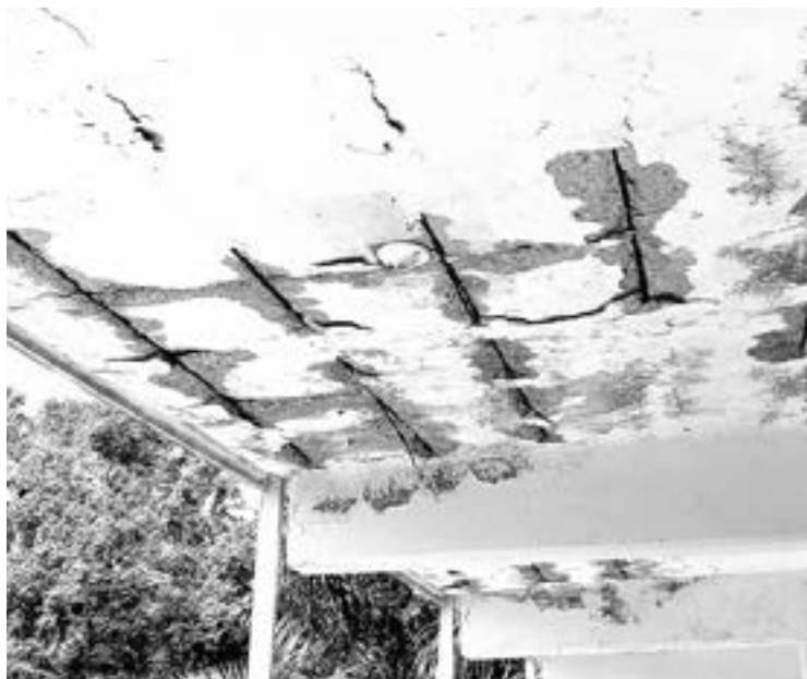
PADRES DE familia demandan apoyo para reconstruirlas.

Indicaron que con la pandemia la suspensión de clases presenciales ha permitido que las aulas no estén siendo ocupadas y que no haya movimiento de alumnos, sin embargo a normalizarse las clases el grave problema será que no tendrán los espacios didácticos para los menores.