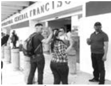
LOS POLICÍAS ESTATALES viajaron a Cancún