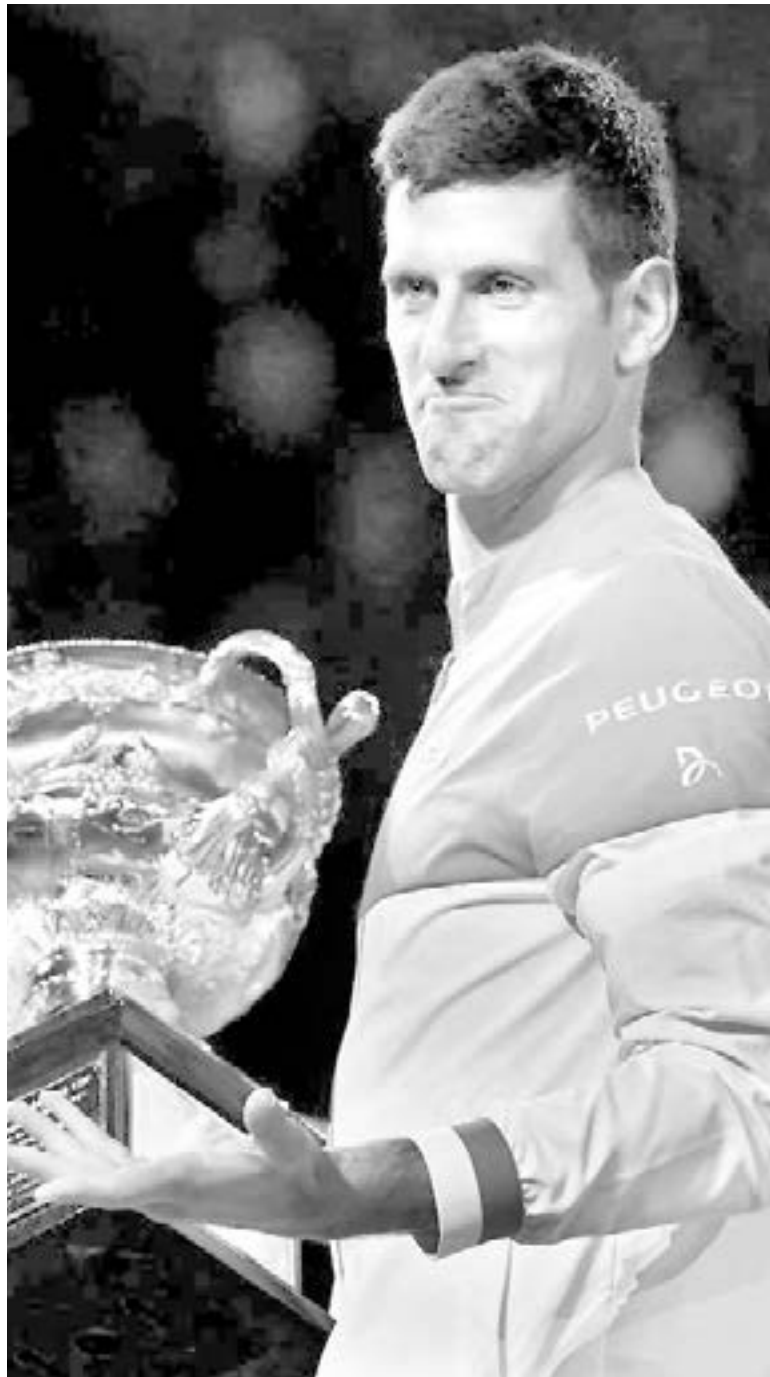
EL SERBIO pone en duda su participación en Australia 2022.