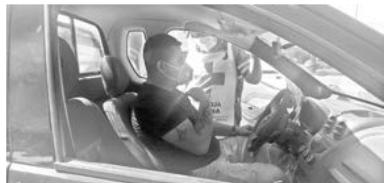
UNO DE los conductores resultó lesionado.

En el informe de tránsito, se detalló que el lesionado manejaba una camioneta Chevrolet Tornado que desplazaba de sur a norte sobre el bulevar Tamaulipas.