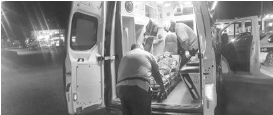
A LA señora se le colocó un vendaje y fue llevada a un hospital.

Quien permaneció en el lugar fue el esposo de la fémina, quien desde un principio aceptó su culpa