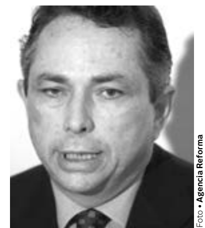
UN CASO con décadas de litigio

Ayer al mediodía el convenio fue dado a conocer como evento relevante al público inversionista en la Bolsa Mexicana de Valores, en un aviso con el cual la empresa anuncia que buscará monetizar sus nuevos activos. "Crédito Real anuncia que como resultado de sus acciones de cobro en relación con el crédito vencido dentro de su cartera de PyMEs, el viernes pasado su subsidiaria CREAL Arrendamiento S.A. de C.V. celebró con la