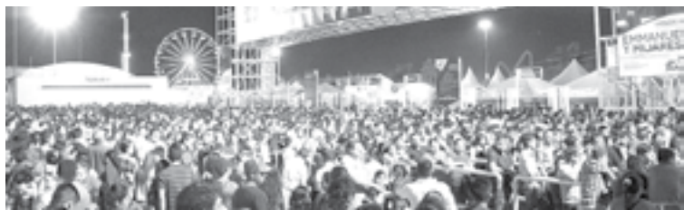
EN OCTUBRE y noviembre habrá Ferias en Tampico y Victoria