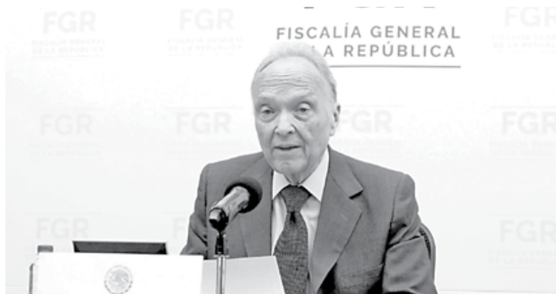
ALEJANDRO GERTZ, Fiscal General de la República