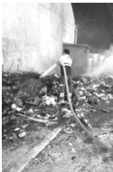
FUE NECESARIA la presencia de Bomberos.

Elementos de Bomberos y de Protección Civil Municipal acudieron al sitio donde sofocaron el fuego, así mismo, implementaron un cierre vehicular para evitar riesgos, afortunadamente no se reportaron personas lesionadas.