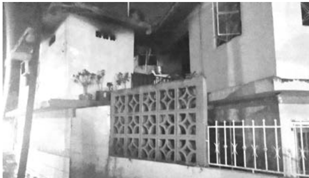
BOMBEROS DE TAMPICO lograron apagar el siniestro.