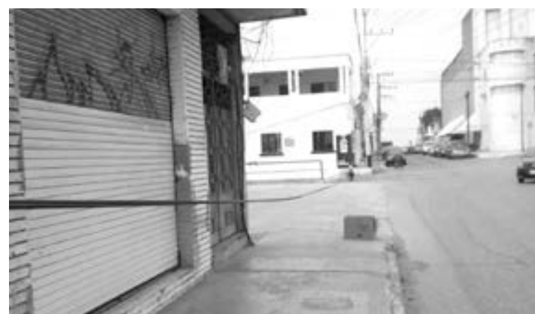
UN RIESGO para los peatones y vehículos representa el cable.

De esta manera, buscaban evitar que alguien lo tocara o que algún automovilista lo jalara bus-