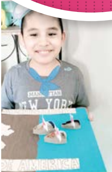
LOS CHICOS tuvieron una clase dedicada al 'Día de la Raza'.