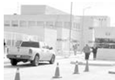
DOS SOSPECHOSOS fueron detenidos y trasladado ante las autoridades

Y a pesar que el jovencito les entregó sus cosas de valor le dispararon y lo hirieron.