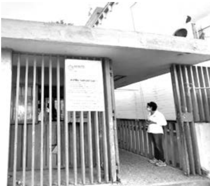
EL HOSPITAL está en malas condiciones.

“Hubo dos doctoras que están encargadas de la subdirección de normativa de salud que no venían en plan cómodo, decían que no querían dar batas a las enfermeras, que los cubrebocas los compramos