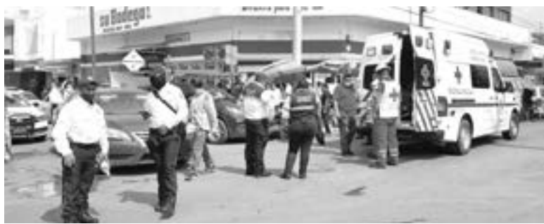
PERSONAL DE Cruz Roja, atendió la emergencia