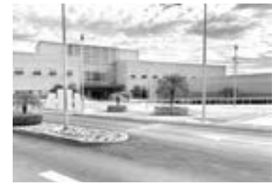
HOSPITAL REGIONAL de Alta Especialidad

Los datos señalan que en el 2018 ocurrieron 25 casos, mientras que en el 2017 se registraron 28, en el 2016 20, en el 2015 fueron 14 y el año con menos muertes maternas fue 2011 que reportó 12 casos.