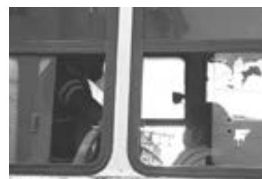
ALGUNOS PASAJEROS esperaron sobre la unidad a la Cruz Roja.

Participaron en el mismo una Ford Explorer Sport Trac color guinda con placas de la UCD y un micro Mercedes-Benz de la ruta Tampico Las Flores.