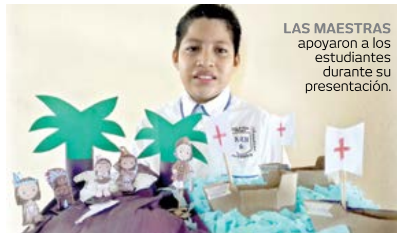
LAS MAESTRAS apoyaron a los estudiantes durante su presentación.