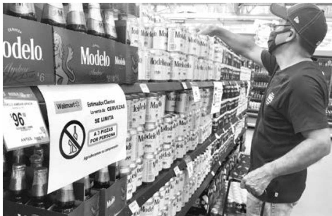
SE TERMINA la ley seca