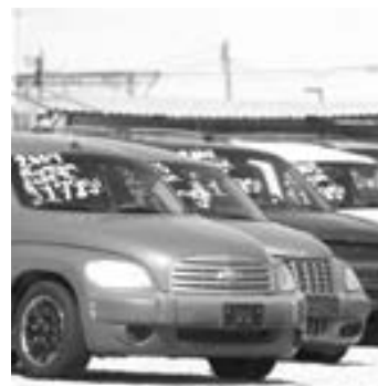
LOS AUTOS “chocolate” podrán regularizarse.

De igual forma, López Obrador reiteró que los recursos que sean recaudados por las autoridades estatales deberán estar destinados a