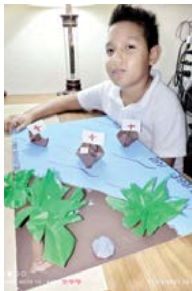
LOS PROYECTOS fueron realizados sobre esta fecha histórica.

Alumnos de sexto grado de primaria del Colegio Bilingüe Altamira Children's School presentaron una maqueta como proyecto del descubrimiento de América el pasado 12 de Octubre durante su clase vía