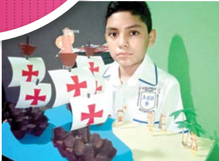
LOS PEQUEÑOS del colegio Children's School presentaron maquetas sobre el Descubrimiento de América.