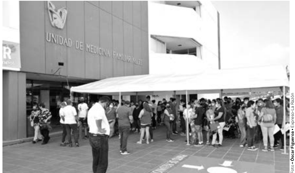
LA VACUNACIÓN se hizo en las instalaciones de la clínica 77 del IMSS Madero.

“Son 73 del paquete inicial que presentamos el 17 de septiembre y ya están saliendo, en la ocasión anterior fueron entre 10 u 11, más aparte estos 73 y unos más, me acaban de informar que el día 30 será el otro bloque de vacunas a los