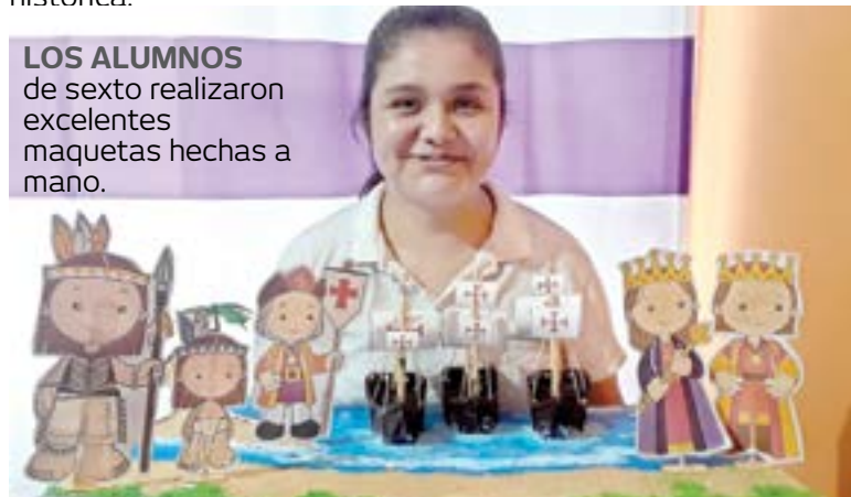
LOS ALUMNOS de sexto realizaron excelentes maquetas hechas a mano.

Durante la clase sus maestras les platicaron sobre la historia de donde surgió Cristóbal Colon, sus anécdotas, viajes, descubrimientos, cabe mencionar que los más pequeños también realizaron algunos videos apoyados por sus padres en el cual hablaban sobre una pequeña reseña de las 3 carabelas de españa.