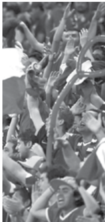
AFICIONADOS GRITARON e hicieron discriminación al rival

Según dio a conocer La Tercera, la federación fue multada con 45 mil francos suizos, equivalentes a 40 millones de pesos, por los actos discriminatorios de los fanáticos.