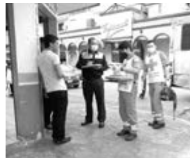
PARAMÉDICOS DE Cruz Roja brindaron atención a los implicados en el accidente.

La camioneta se desplazaba por la calle Díaz Mirón y al momento de arribar a esa intersección, no hizo el alto obligatorio por lo que al se-