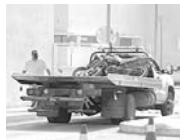
LA MOTO asegurada

La oficiales de la OUGI así como Policía Estatal se dieron a la tarea de buscar a los agresores ya que tienen conocimiento que huyeron hacia un punto conocido como "la quebradora" por lo que dentro de sus inspecciones hallaron a un par de sospechosos que coinciden con las características de los supuestos agresores.