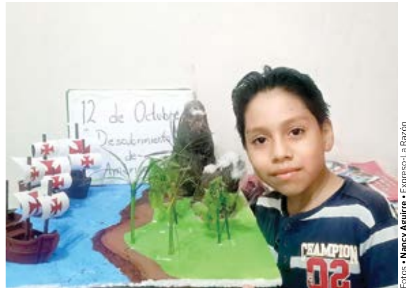
DURANTE LA CLASE los alumnos también presentaron algunos videos.