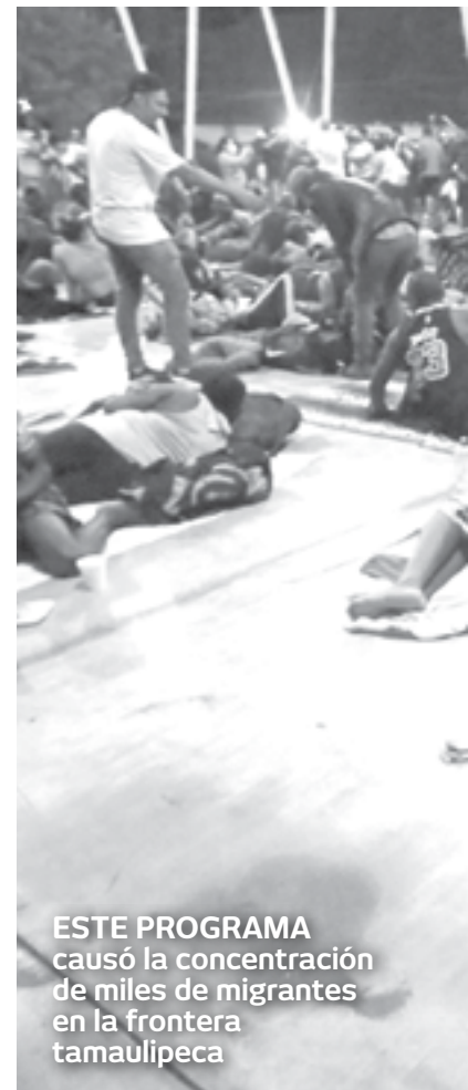
ESTE PROGRAMA causó la concentración de miles de migrantes en la frontera tamaulipeca

"México es una nación soberana que debe tomar una decisión independiente para aceptar el regreso de las personas de conformidad con cualquier reimplimentación del MPP. Esa decisión no se ha tomado", señaló el DHS.