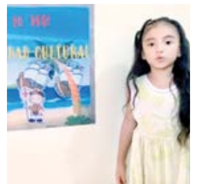
LOS MÁS PEQUEÑITOS también participaron con un video.