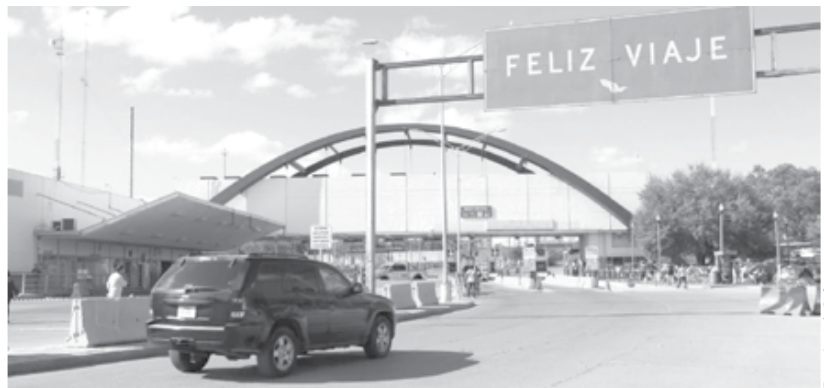
SE ABRIRÁN la frontera a los cruces terrestres