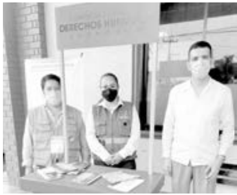
LOS MÓDULOS brindan atención y servicio cada 15 días.