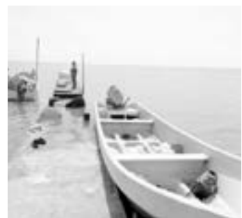
SOLICITARON A los pescadores no salir al mar.

“Por ello hacemos el exhorto a los Pescadores a que se abstengan de sa-