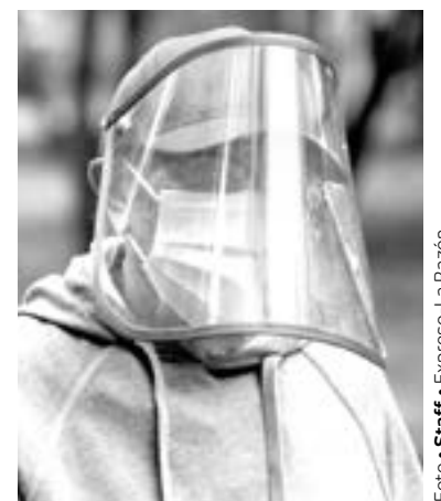
LA SECRETARÍA de Salud determinó que el estado está en el nivel mínimo de riesgo.