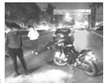
EL HOMBRE fue auxiliado por veladores de la zona.

cho vial. Se dio a conocer que el automóvil circulaba de norte a sur por el bulevar y una vez que llegó