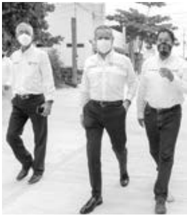
INAUGURAN de la pavimentación de la calle Cuauhtémoc en la Hipódromo.