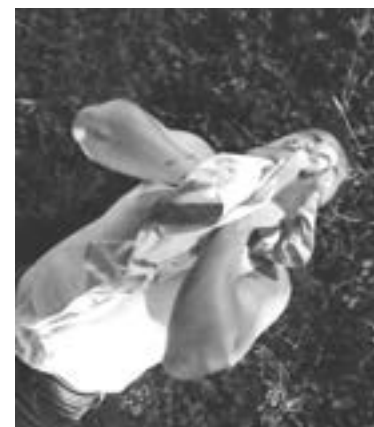
RECOSTADO EN el pasto quedó el sujeto.

Una motocicleta color negro y un Honda con placas del estado de Tamaulipas protagonizaron el he-