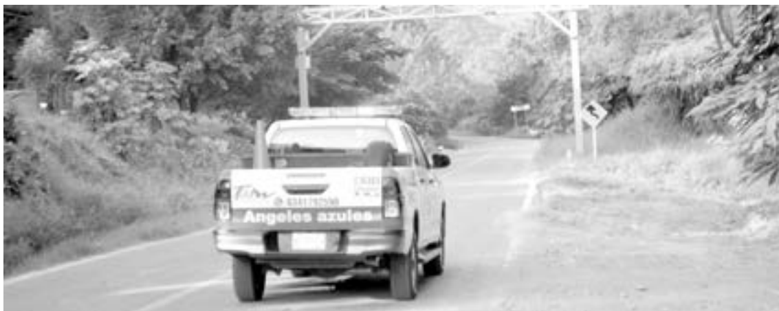
EL TRAMO donde se registró el asalto a mano armada

Quienes denunciaron a la profesora son madres de familia que tienen a sus hijos estudiando en dicho lugar. Por el momento la policía exhortó a la afectada a presentar la demanda y seguir con las pesquisas.