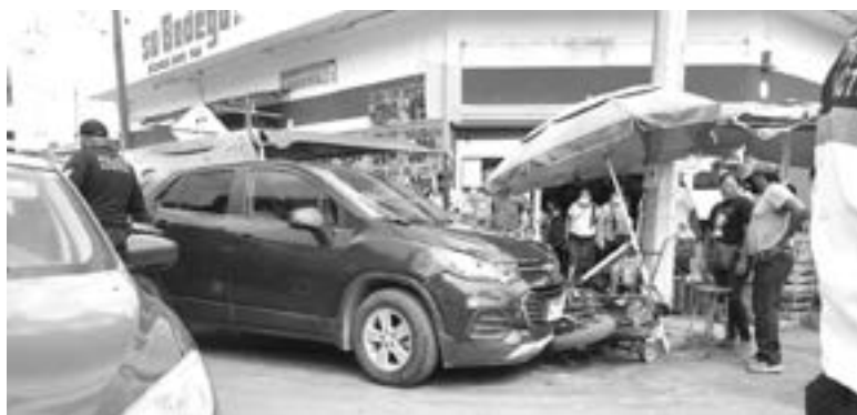
TUMBA MOTOCICLETA y afecta puesto de chicharrones

En las investigaciones realizadas por personal de tránsito local se estableció que el conductor circulaba de norte a sur sobre la calle seis y a la altura de la calle Matamoros se descompensó por lo que al llegar a la de Morelos perdió el conocimiento y primeramente le pegó a un vehículo Nissan tipo Sentra y al dar dar el volantazo se fue a su izquierda para estrellarse contra una motocicleta y un puesto de chicharrones. Éstos dos últimos fueron los que llevaron más los daños pero como el vehículo estaba asegurado el responsable llegó a un acuerdo con la parte afectada.