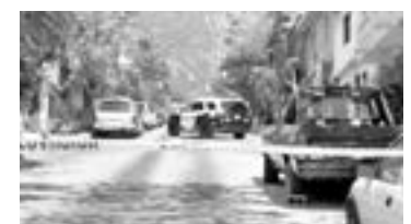
EL HALLAZGO fue reportado poco antes de las 20:00 horas.

El hallazgo fue reportado poco antes de las 20:00 horas de