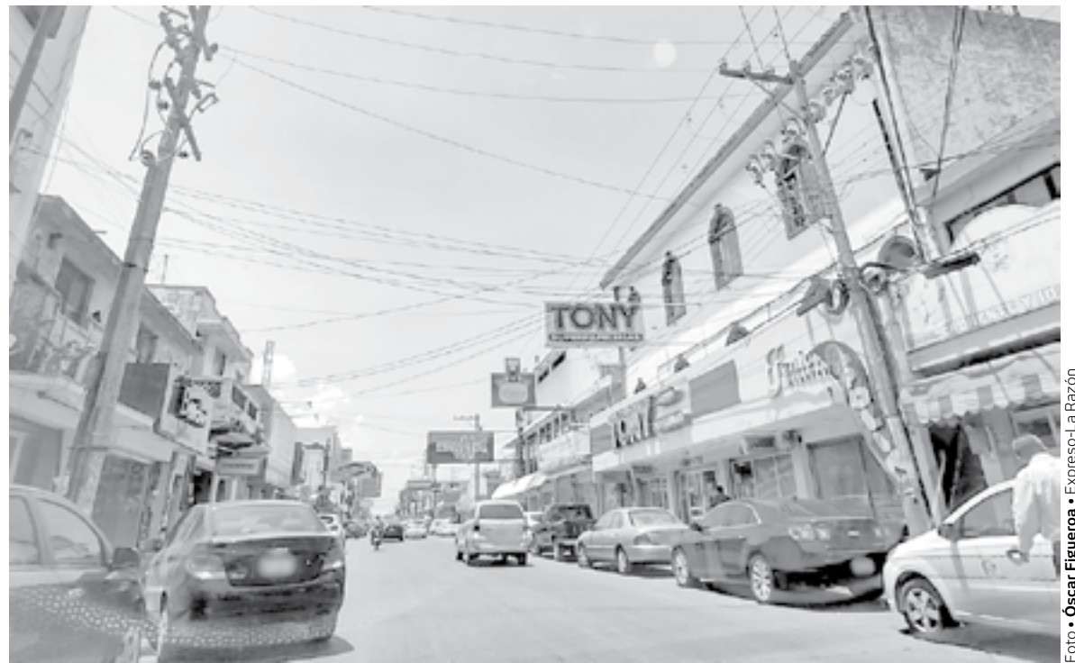
BAJA INCIDENCIA delictiva y llegan inversiones.

Las escolleras de Playa Miramar, son el hábitat de por lo menos 200 mapaches, divididos en cuatro manadas y el patronato es quien se encarga de llevarles comida y agua todos los días, además de que se han convertido en el ícono del paseo turístico.