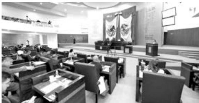
LA REFORMA será discutida en comisiones

Los panistas no quedaron conformes, pero la sesión había terminado. Abrazos y despedidas. La próxima semana seguirá el pleito.