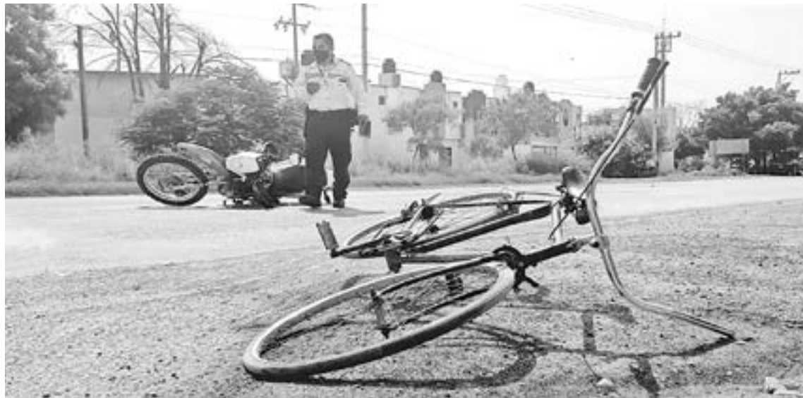
AMBAS UNIDADES quedaron tiradas en la Avenida.