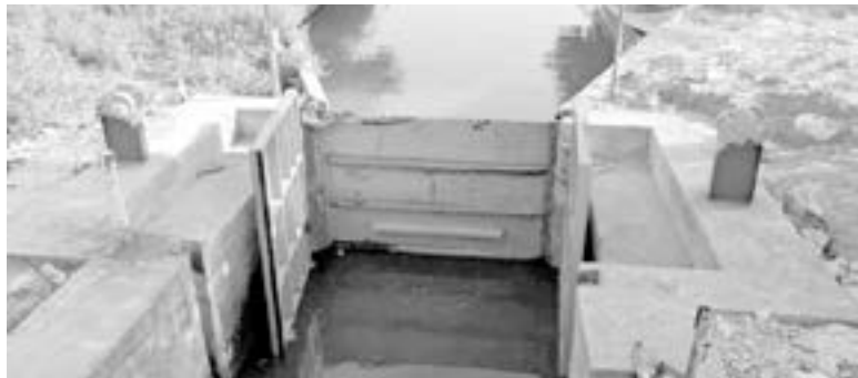
LA REHABILITACIÓN y reposición de compuertas del Dique de El Camalote fueron concluidos.

Dicha obra, comentó que están contemplados como parte de la fase 2.