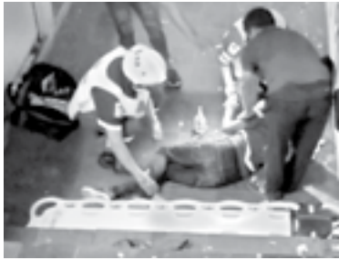
FAMILIARES REPORTARON que presenta lesiones que comprometen funciones vitales.