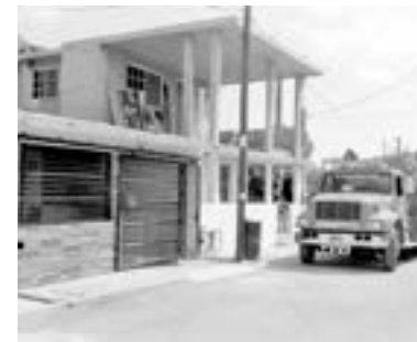
EL HOMBRE fue hallado sin conocimiento tras resbalar en el interior de su domicilio.

ponder, se comunicó a la Central de Emergencias.