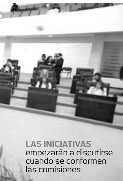
LAS INICIATIVAS empezarán a discutirse cuando se conformen las comisiones