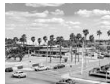
LOS NEGOCIOS de las ciudades fronterizas, al borde del colapso

Las cláusulas que están siendo consideradas no les brindarían de manera explícita a los inmigrantes beneficiados una vía para convertirse en residentes permanentes legales o en ciudadanos estadounidenses. Pero alrededor de un millón de ellos que tienen familiares cercanos en Estados Unidos podrían sacar provecho a los procedimientos existentes para obtener dicho estatus, dijo el activista.