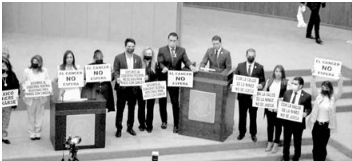
LAS BANCADAS del PAN y de Morena se enfrentaron desde sus curules.

Por el no, los 17 diputados de Morena y Pepe Braña del Partido del Trabajo.