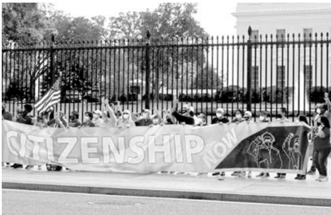
LA MEDIDA facilitaría la obtención de la residencia.

La propuesta demócrata más reciente se produce después de dos intentos fallidos previos por persuadir a la parlamentaria del Senado de que se permitiera añar