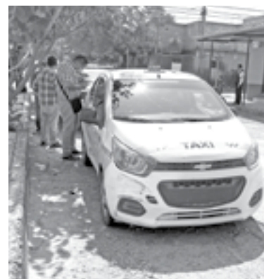
EL TAXI circulaba con preferencia de vía en ese punto.

Tránsito local también se presentó para tomar conocimiento de los hechos.