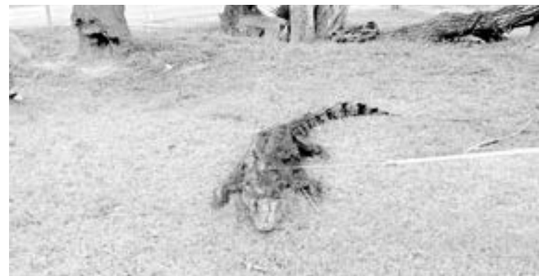
FUE INMOVILIZADO por Bomberos y capturado en los límites de Tampico y Altamira.

Luego de que fue sujetado, fue trasladado hasta el vehículo de emergencias, en donde quedó asegurado. Se sospecha que el saurio fue desplazado desde una laguna cercana, por un animal de mayores dimensiones.