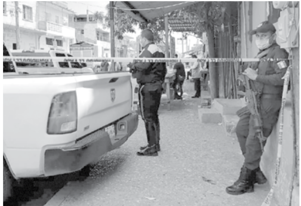
CON UN OPERATIVO POLICIACO se desalojó a los internos que había en el anexo de la colonia Cascajal.

La Fiscalía General de Justicia de Tamaulipas (FGJE) mantiene abierta una investigación por el fallecimiento de un interno, presuntamente en el Hospital