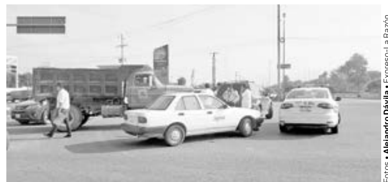
OCURRIÓ EN Naciones Unidas y Eje Vial

20 MIL PESOS EN DAÑOS SE GENERARON EN EL PERCANCE