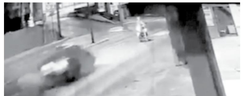
EN EL VIDEO se ve claramente cuando el motociclista fue embestido en la avenida Hidalgo, cerca de Ejército Mexicano.

El joven fue impactado aproximadamente a las 3 de la madrugada en la Avenida Hidalgo, en las inmediaciones de Ejército Mexicano, en Tampico.