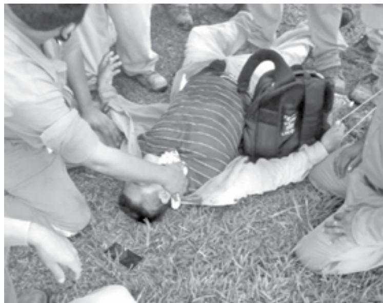
LA POLICÍA empieza a agredirnos, a insultarnos: obreros.

En su segundo día de paro laboral, trabajadores de ICA Fluor resultaron heridos tras enfrentarse contra elementos antimotines de la Secretaría de Seguridad y Protección Ciudadana estatal que resguardaban la refinería de Dos Bocas, en Tabasco.