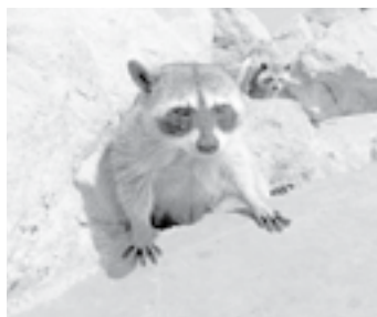
DOS MAPACHES fueron agredidos por un pescador.

Hasta el momento no se tiene identificado al responsable y por tal motivo, pidió el apoyo de la población para que tomen evidencias al momento de que sean testigos de una agresión, no tan sólo contra un mapache, sino cualquier animal, con