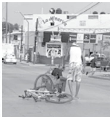
A CONSECUENCIA de la caída, el hombre presentaba laceraciones en la espalda y piernas y antebrazos.

Dirección de Tránsito y Vialidad, el percance se registró aproximadamente a la una de la tarde, en la intersección de la Avenida Monterrey y Avenida Adolfo López Mateos.