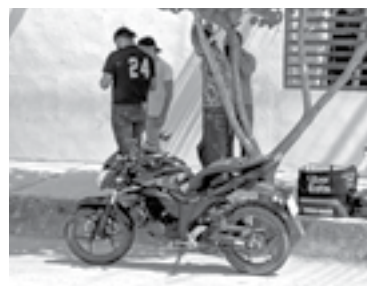
LOS INVOLUCRADOS intentaban llegar a un acuerdo en el sitio.

Empleados de aseguradoras acudieron al sitio para lograr un acuerdo entre ambas partes.