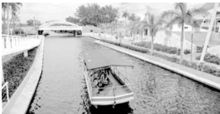
TAMPICO SE HA CONSOLIDADO como el destino más importante de Tamaulipas y de la región noreste.

“Seguimos trabajando en la transformación del municipio con mejores calles, más limpieza y alumbrado público; nuevas áreas recreativas y deportivas; y la modernización sistemática de todos nuestros servicios, para seguir consolidando a Tampico como una ciudad modelo a nivel nacional”