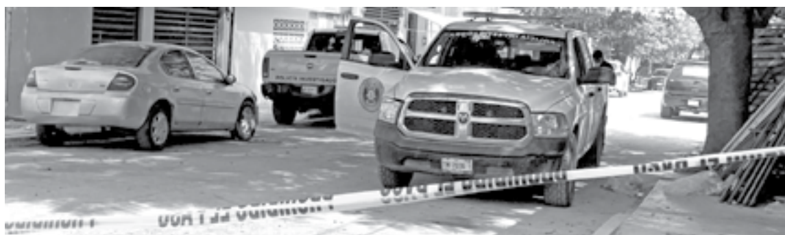
POLICÍAS INVESTIGADORES se presentaron en el lugar.

12 DEL MEDIODÍA SE REPORTÓ EL INCIDENTE AL NÚMERO 911