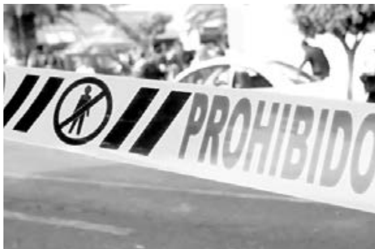
LA POLICÍA todavía no cuenta con pistas sobre los responsables.

Una vez concluidos los peritajes, la cabeza fue trasladada al anfiteatro de la Fiscalía de