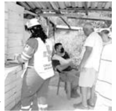
EL MOTOCICLISTA salió con la peor parte del percance.