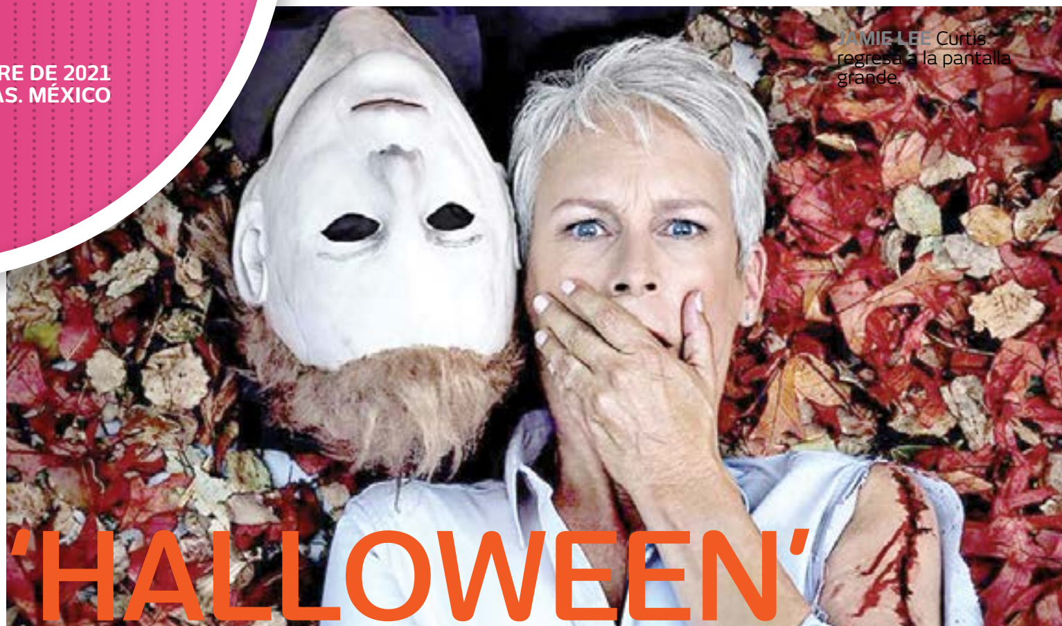
JAMIE LEE Curtis regresa a la pantalla grande.

EL YOUTUBER JUANPA ZURITA ES TODO UN "WHITEXICAN", ASÍ LO HAN CATALOGADO EN INTERNET EN UNA PÁGINA DE FACEBOOK DEDICADA A SEÑALAR EL ESTILO DE VIDA DE LA CLASE ALTA Y LAS COSAS ABSURDAS QUE EN OCASIONES HACEN.