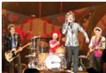
LA BANDA prometió no incluir en concierto el tema.

"Espero que podamos resucitar al bebé en su gloria en algún momento", dijo Richards, de 77 años.