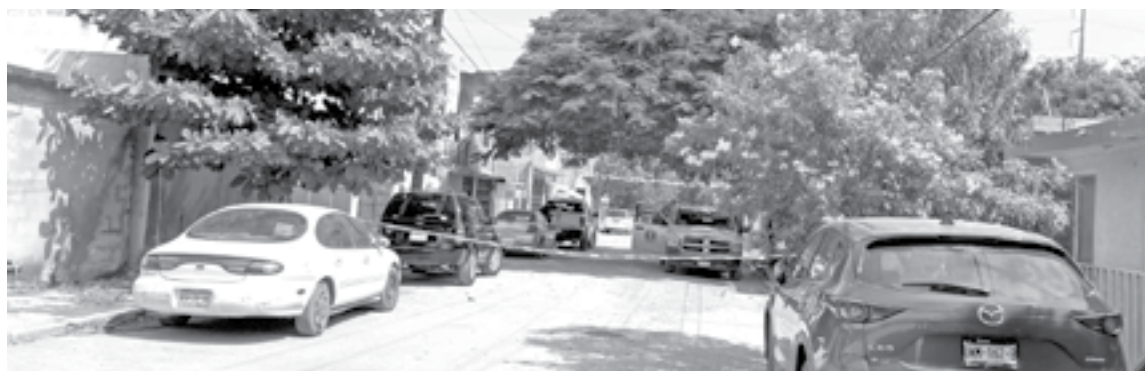
SE DESCONOCE quien o quienes hirieron al joven, el área fue acordonada