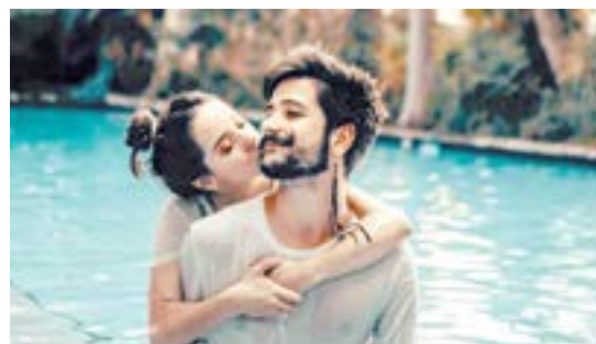
LA PAREJA anunció que esperan a su primer bebé.

A TRAVÉS DE SU NUEVO VIDEO MUSICAL, CAMILO Y EVA LUNA COMPARTIERON QUE ESTÁ EN CAMINO SU PRIMER HIJO