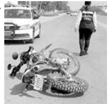
OCURRIÓ sobre la Avenida de la Unidad y calle De los Olivares.