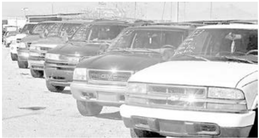
SE ESTIMA que son 400 mil las unidades americanas que circulan en la entidad.

te una gira de trabajo por la capital tamaulipeca, el mandatario entregó obras de pavimento con concreto hidráulico en la calle Arquitectos entre calle Bachilleres e Integración Familiar, de las colonias Bernardo Gutiérrez de Lara y Bertha del Avellano en una extensión de 2 mil 409 metros cuadrados, las cuales requirieron de una inversión de 2 millones 805 mil pesos.