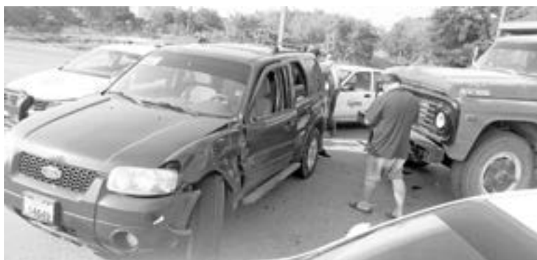
LA CAMIONETA Escape resultó con severos daños.

Eran las 16:30 horas cuando los automovilistas se comunicaron al 911, para informar sobre un pesado congestionamiento a causa de esta