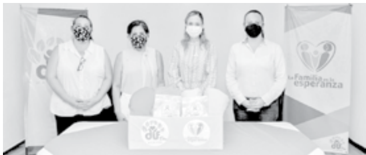
SE REALIZÓ la donación de tela para gorros oncológicos.

En este sentido, la primera dama en la urbe petrolera, manifestó que a través de la Clínica DIF de Ciudad Madero, se continúa ofreciendo servicios médicos de calidad a todas las familias, especialmente, a quienes se encuentran en situación de vulnerabilidad: “No hay nada más importante que la salud y la vida de los maderenses, por ello seguiré consolidando alianzas que permitan construir un mejor futuro para todos”.