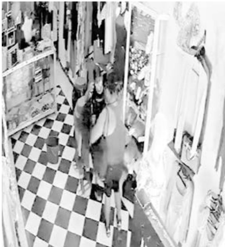
ADOPTAN PADRES como ‘modus operandi’ utilizar a sus hijos para robar.

“No tiene palabras para decir lo mal hecho que esta, es un hecho muy lamentable que los padres no tienen consideración, lamentable