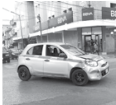
EL CARRO de ruta no se percató que venía el coche particular.

Las unidades fueron trasladadas al mesón de la ciudad, en tanto se desarrollan el deslinde de responsabilidades.