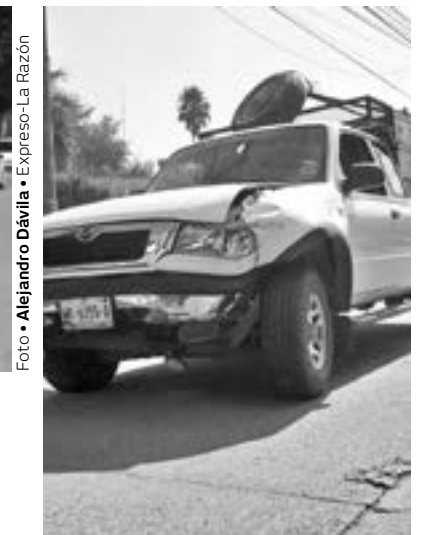
EL CHOQUE ocurrió en Avenida del Maestro y calle Ébano.

2 VEHÍCULOS SE INVOLUCRARON EN ESTE PERCANCE VIAL