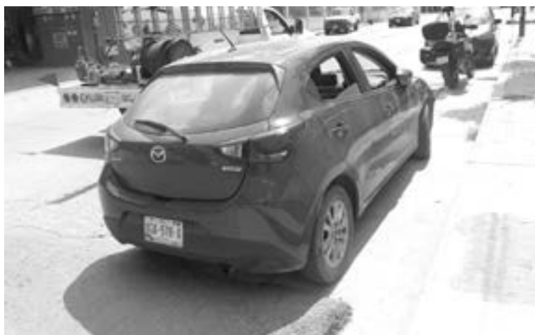
EL MOTOCICLISTA no hizo el alto respectivo y causó el percance.