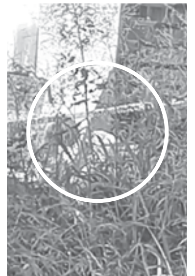
EL CUERPO quedó recargado sobre la parte posterior de un super.

Al sitio llegaron elementos de la Policía Estatal Acreditada para acordonar el área así como ele-