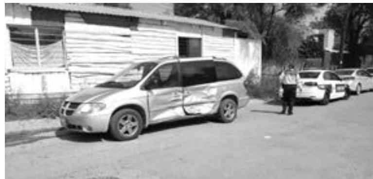
EL IMPACTO dejó un 'cráter' en el costado de la Caravan.

Por fortuna y pese a lo aparatoso del percance, no se reportaron personas lesionadas, solamente daños materiales que fueron estimados por encima de los 30 mil pesos.