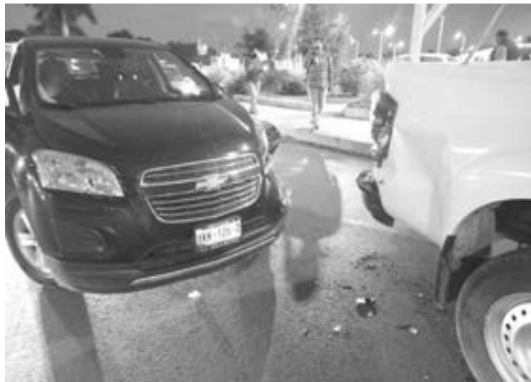
LA CAMIONETA Captiva pegó por detrás.