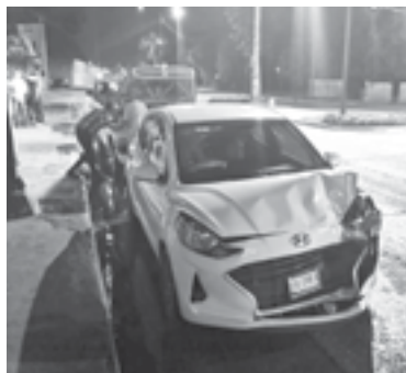
UNA FÉMINA que viajaba como pasajera en el carro blanco sufrió una crisis nerviosa.

Una Ford Explorer color verde con placas de Veracruz y un Hyundai blanco con matrícula de