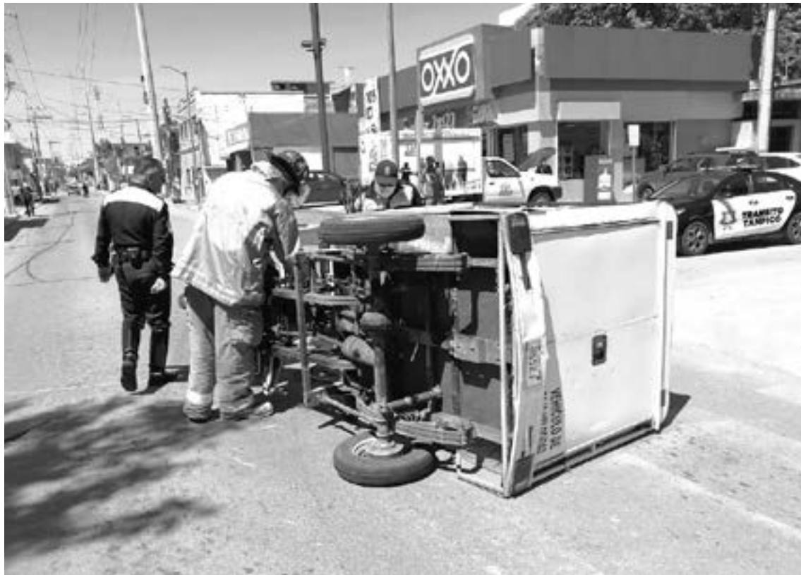
DESPUÉS DE CASI UNA SEMANA de penosa agonía, falleció el motociclista lesionado.

La moto de carga que manejaba circulaba por la calle Juárez y al momento de llegar a ese cruce, presuntamente no se detu-