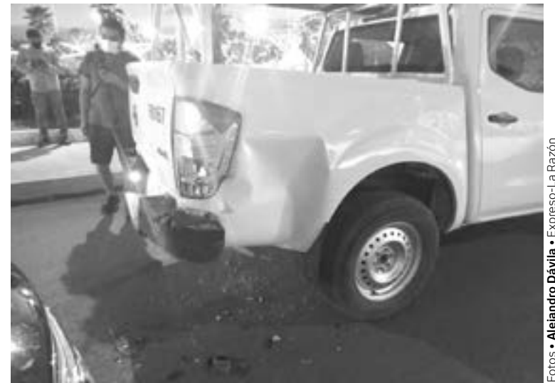
LOS DAÑOS ocasionados a la Nissan Frontier.