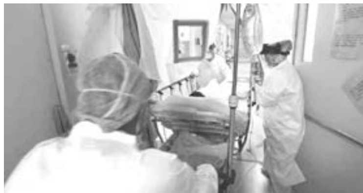
REGISTRAN AYER solo 106 contagios y 6 defunciones.

El semáforo epidemiológico se mantiene en amarillo en Tamaulipas destacando que hay siete municipios en color rojo, 10 en color naranja, ocho en amarillo y 17 en color verde.