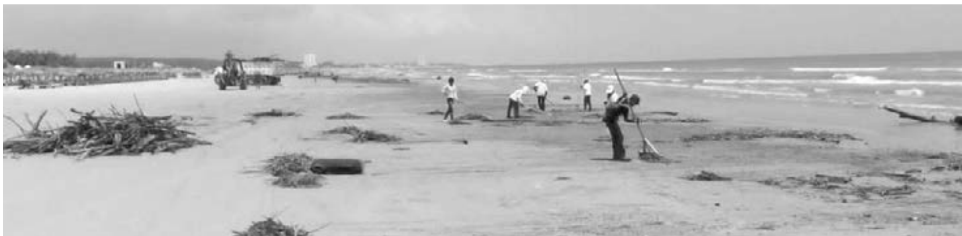
LOS PREDIOS en Miramar se encuentran entre Playa Paraíso y el Hotel Maeva.