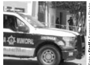
EL CUERPO sin vida del hombre mostraba marcados signos de violencia.

Una vez que se recuperaron los restos mortales, peritos de la Fiscalía General de Justicia de la Ciudad de México (FGJCDMX), ordenaron el levantamiento del cuerpo para trasladarlo a las instalaciones del Servicio Médico Forense, para realizar la necropsia de ley y conocer las razones por las que el hombre perdió la vida.