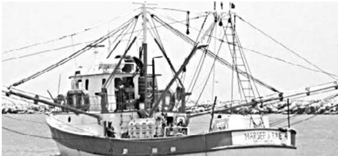
VA a pique el sector pesquero.

Esa producción tiene un valor comercial de 1 mil 617 millones