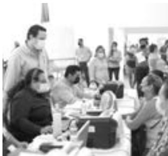
REALIZAN JORNADA en la Borreguera.