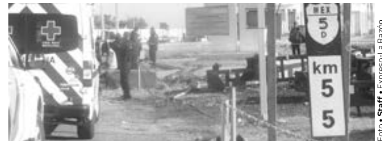
POR CELOS baleó y mató a su esposa; lo detienen.

garon un operativo y con apoyo de las cámaras de videovigilancia lograron capturar al presunto responsable, en la colonia Benito Juárez y después trasladado ante el Ministerio Público donde se definirá su situación jurídica en las próximas horas.