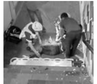
EL HOMBRE fue auxiliado por la Cruz Roja e internado en el hospital Canseco.

Autoridades competentes tomaron conocimiento del fallecimiento.