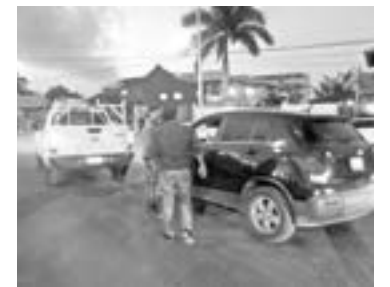
OCURRIÓ en el concurrido cruce del 16 Berriozábal.

ducía una camioneta tipo panel de la marca Chevrolet, la cual hacía desplazar de sur a norte sobre la calle 16.