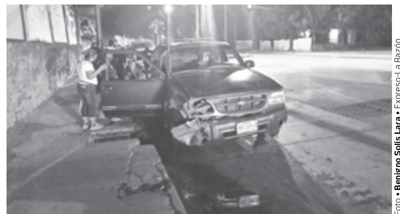
EL OPERADOR de la camioneta ignoró el señalamiento.

La camioneta se desplazaba de norte a sur por el bulevar y al llegar a ese cruce, el operador ignoró el alto que marcaba el semáforo por lo que trató de incorporarse a los carriles de sur a norte, impactán-