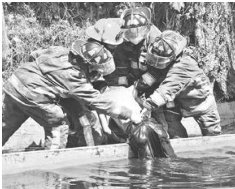
BOMBEROS RESCATAN cadáver que flotaba en canales de Xochimilco.

El hombre aparentemente se encontraba en estado de ebriedad, por lo que suponen cayó al canal y ya no pudo salir a flote, desafortunadamente ya nada pudieron hacer por él.