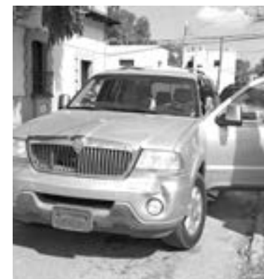
LA CAMIONETA Lincoln omitió el alto en ese cruce.