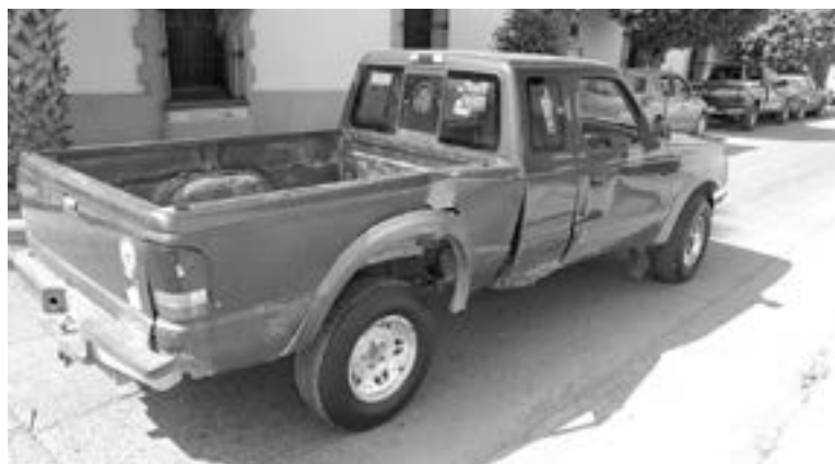
APARECE COMO vehículo afectado una Ford Ranger.

El hecho de que no se registrarán personas lesionadas, ayudó a que ambas partes hicieran un acuerdo en el lugar.