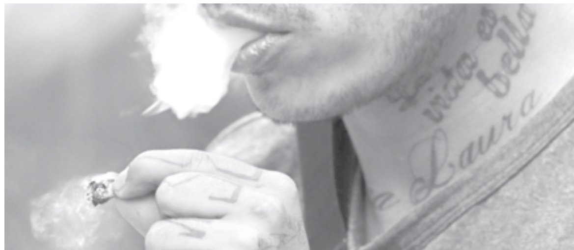
UN 21 por ciento de jóvenes elevó el uso de marihuana.