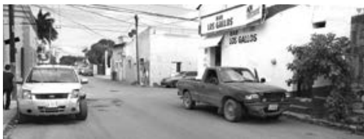
POR ENÉSIMA ocasión ocurre un percance como este.

El día de ayer uno más se sumó a la larga lista, afortunadamente no dejó personas lesionadas.