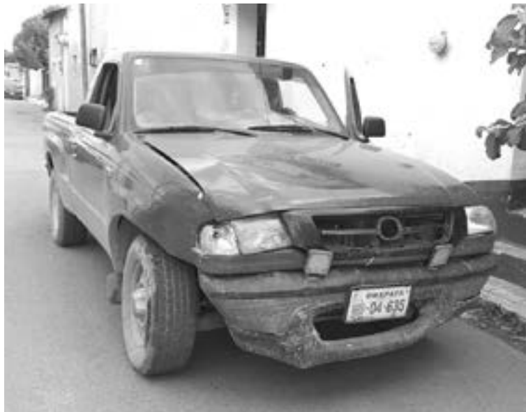
LA CAMIONETA Ford Ranger fue responsabilizada del percance.