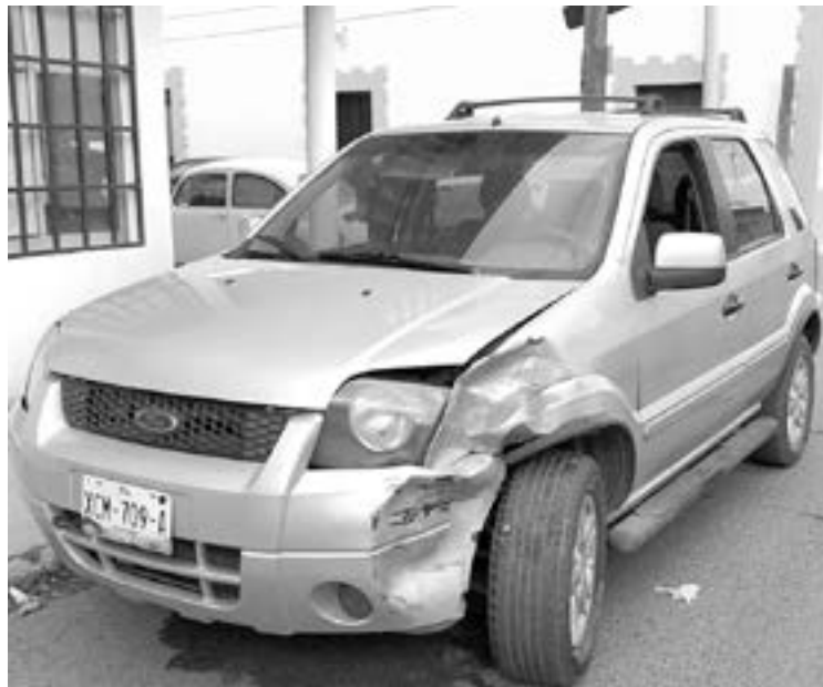
LA ECOSPORT circulaba con preferencia de paso.