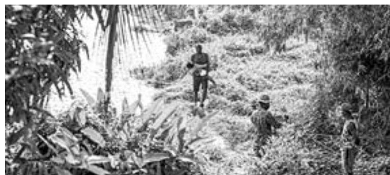
LOS MENORES son vulnerables al abuso sexual

Menores y adultos que realizan el trayecto de más de una semana deben enfrentarse a los rigores de la selva, que incluyen insectos, animales salvajes, falta de agua pota-