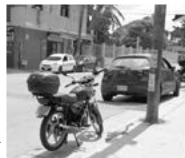
LAS DOS unidades involucradas en el accidente.