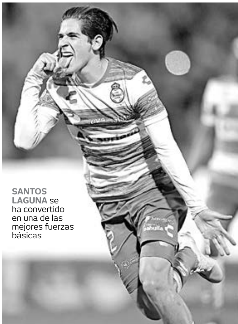
SANTOS LAGUNA se ha convertido en una de las mejores fuerzas básicas

“He comprobado que a los chicos de aquí les cuesta madurar rápidamente. En Uruguay, rápidamente se consolidan, su fortaleza mental es más importante quizás por las dificultades que viven en algunas instituciones, pero aquí (en México) tienen todas las comodidades, están muy arropados, muy protegidos y eso quizás les dé un bienestar que no les haga valorar realmente el alcance de las cosas”