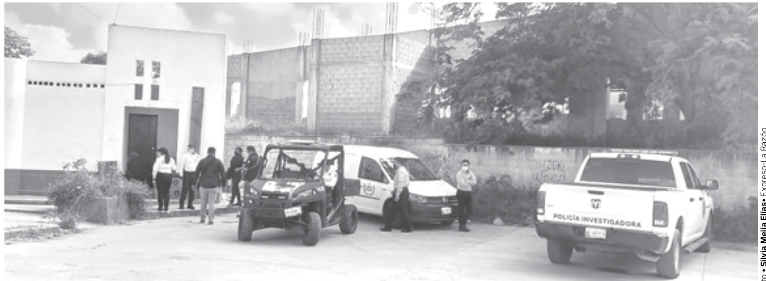
AUTORIDADES POLICIACAS tomaron conocimiento de los hechos.