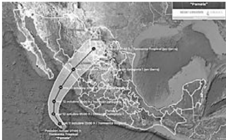
CONFÍAN QUE se rellenen la Presa Amistad y La Falcón con agua de ciclón Pamela.

Cabe citar que actualmente la presa “La Amistad” cuenta con apenas un 14 por ciento de su nivel, con un almacenamiento de 242.4 millones de metros cúbicos, mientras que la presa “Falcón”, registra apenas un 9 por ciento de su