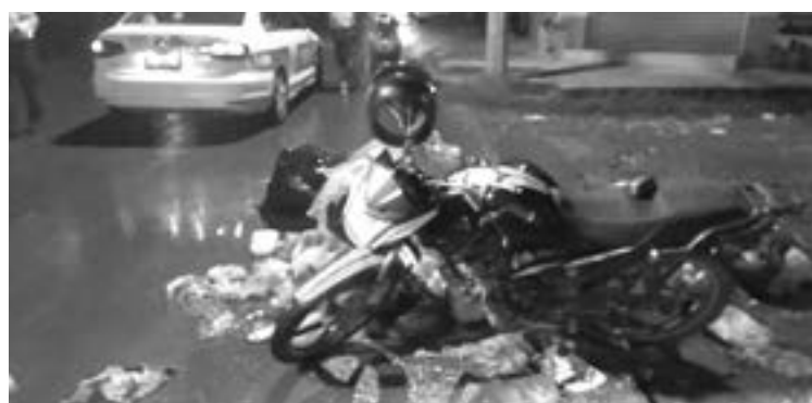
LA MOTO en que se desplazaban.

Fue a la avenida Ceferino Morales y calle Lazaro Cárdenas que los elementos de la Cruz Roja llegaron para atender a los dos jóvenes lesionados.