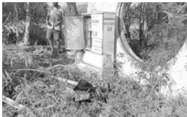
CHOCÓ CONTRA varios objetos fijos.