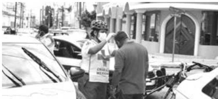
TRIPULANTES del coche afectado son auxiliados.

Desde la delegación de la Cruz Roja, se le pidió al equipo "Yanqui" se trasladara hasta ese cruce para