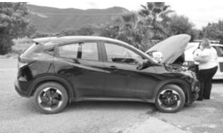
LA CAMIONETA afectada es una Honda de modelo reciente.

Información otorgada por las autoridades, se señala que la mujer