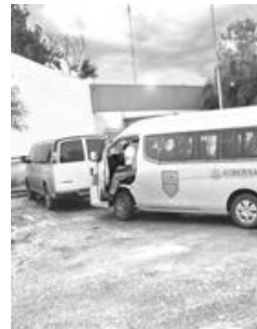
LOS MIGRANTES serían de origen centroamericano

El grupo de migrantes buscaba llegar a la frontera del estado, para solicitar a las autoridades de Estados Unidos, asilo humanitario en ese país, aunque al ser detenidos por personal del INM, tam-