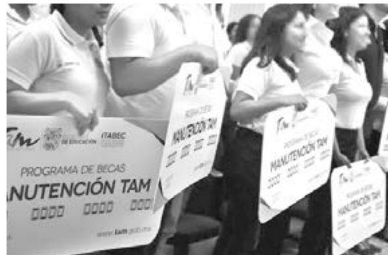
AÚN NO HAY FECHAS para el pago de becas a los estudiantes.

“No tengo contemplado ahorita estamos esperando alguna indicación al respecto y sacaremos la convocatoria de ser así”.