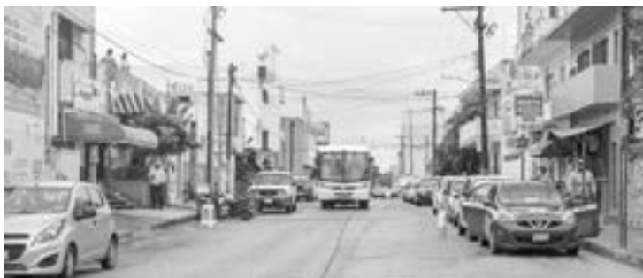
CAPACITARÁN A COMERCIOS en ventas por internet.

do muy beneficiados porque ahora venden más porque tienen las entregas a domicilio, porque están asociados a una empresa de reparto, eso es lo emergente que necesitamos hacer y algunas otras acciones que veamos de acción inme-