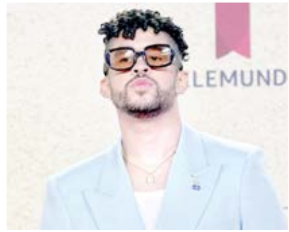
BAD BUNNY es señalado por el uso no autorizado de canciones.

La demanda busca una compensación por daños de hasta 150 mil dólares por infracción, la prohibición de la continua violación de derechos de autor de los "Playero Works" y el pago de las costas legales de los demandantes.