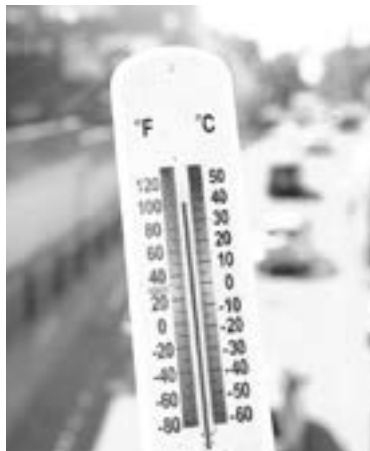
EL PLANETA se dirige a un punto sin retorno

En las últimas décadas, cientos de millones de personas se han trasladado de las zonas rurales a las ciudades, que ahora albergan a más de la mitad de la población mundial. En medio de superficies como el hormigón y el asfalto, que atrapan y concentran el calor, y poca vegetación, las temperatu-