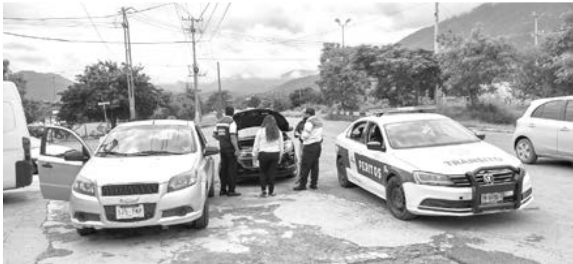
LOS HECHOS ocurrieron sobre el libramiento Emilio Portes Gil