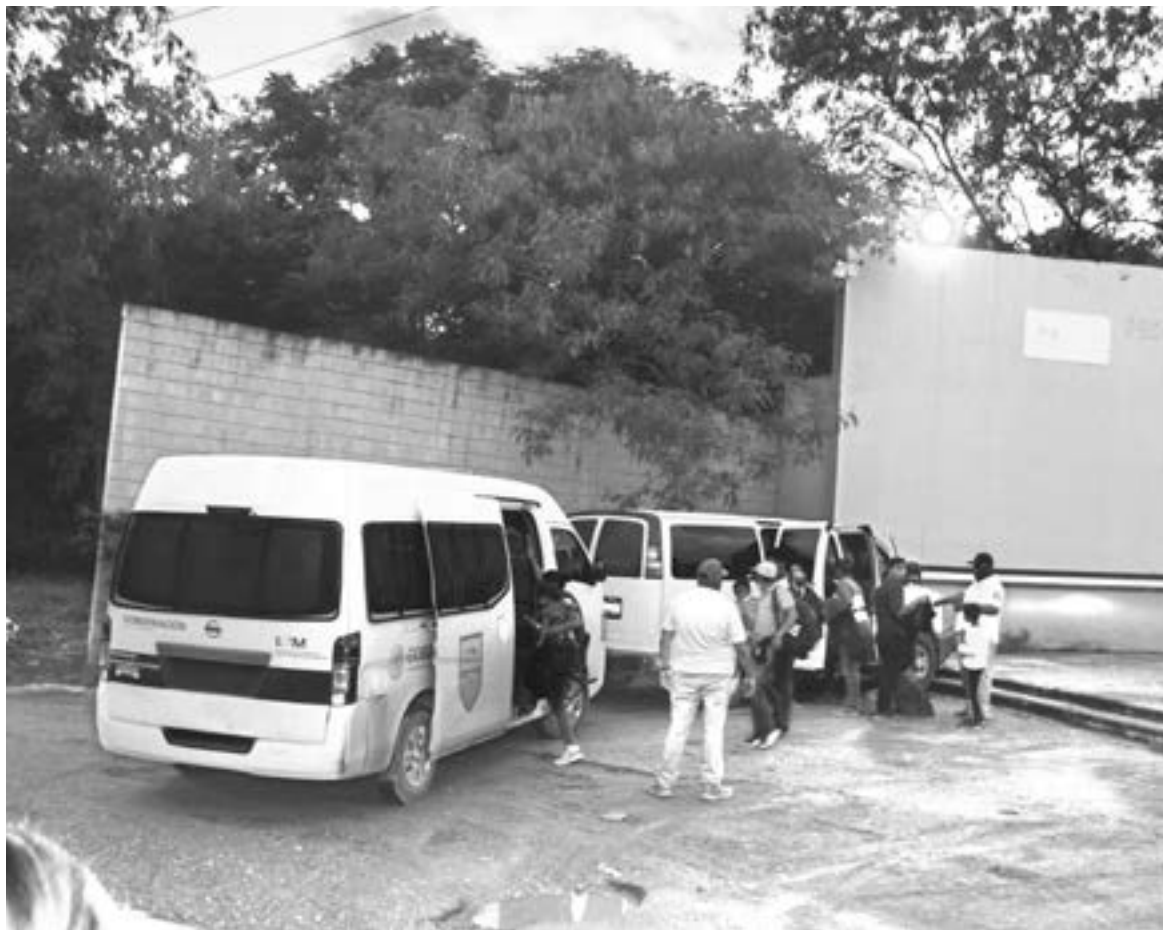
VIAJABAN FAMILIAS en la caravana.

dados a las oficinas de la Fiscalía General de la República (FGR) en Victoria.