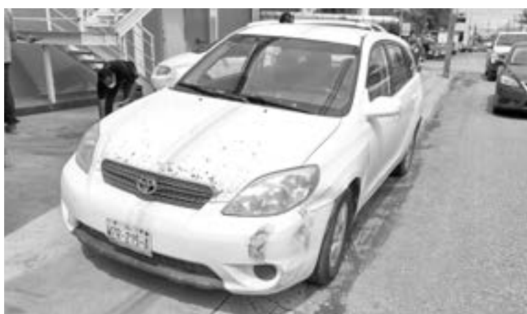
LA VAGONETA que conducía el 'don'.

Cabe mencionar que no fue necesaria la elaboración de un peritaje ya que ambas partes hicieron un acuerdo por medio de una