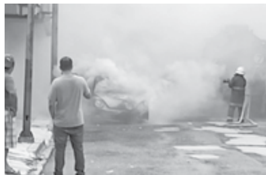
LOS BOMBEROS llegaron para sofocar el fuego y controlar la situación.

LA CONDUCTORA BAJÓ DEL CARRO PARA PONERSE A SALVO MIENTRAS LLAMABA AL NÚMERO DE EMERGENCIAS