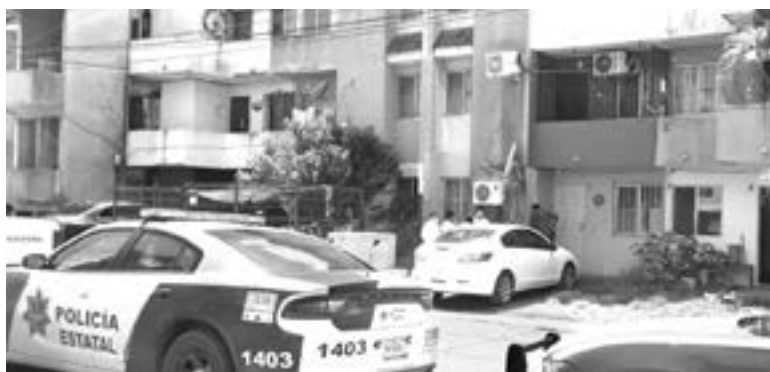
EL INCIDENTE tuvo lugar en el fraccionamiento Esmeralda, ubicado a unos metros de la entrada a Tancol.