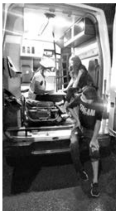
LOS JÓVENES presentaban algunos golpes.