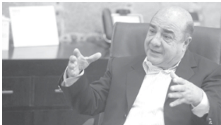
HIJO de Jesús Murillo Karam apareció en los Pandora Papers.

Entre el 21 y el 29 de septiembre pasados, las empresas hidalguenses Concretos San Cayetano y Alvarga Construcciones ganaron contratos para el Parque Ecológico Lago de Texcoco y para el Complejo Cultural Bosque