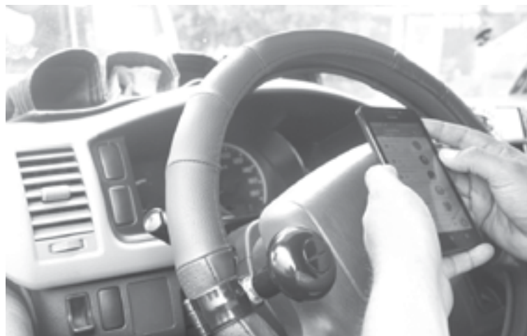
SEIS HORAS duró caída mundial de Instagram, WhatsApp y Facebook.

Las redes del imperio de Mark Zuckerberg sufrieron un apagón que se extendió por seis horas, dejando inaccesible una plataforma