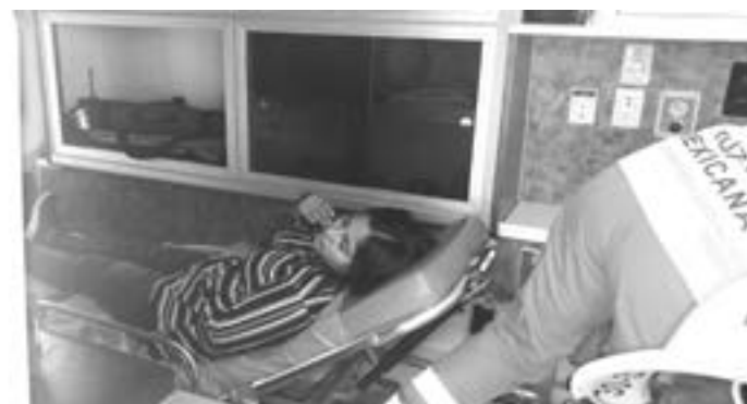
LA CONDUCTORA no sufrió lesiones graves