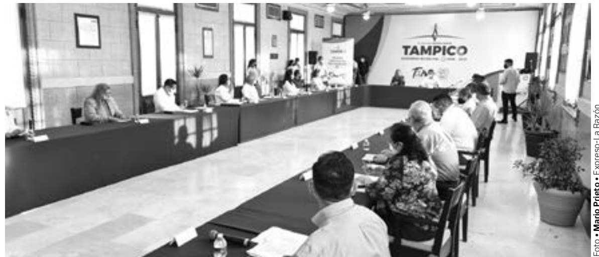
NO ACUDIÓ ni la mitad de regidores el primer día de la semana de trabajo.