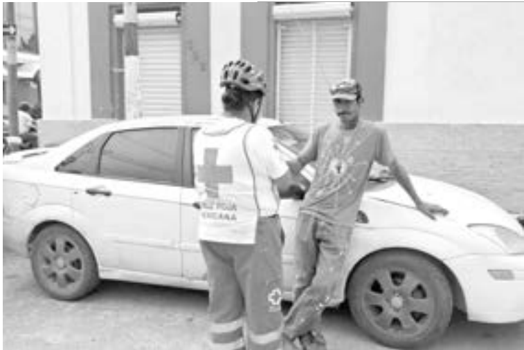
VISIBLEMENTE ASUSTADO se veía el pintor.