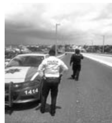
MANTIENE PEA el despliegue de unidades en el Puente Tampico.

personas que llegan a ese lugar con la intención de suicidarse por diferentes motivos.