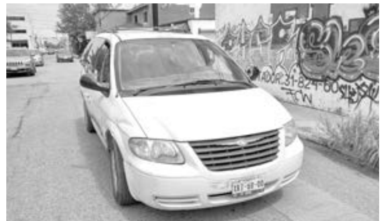
EL VEHÍCULO afectado es una van Chrysler.

persona viro a su derecha con rumbo al sur, pero al no hacer el debido alto, golpeó de forma lateral a una van de la marca