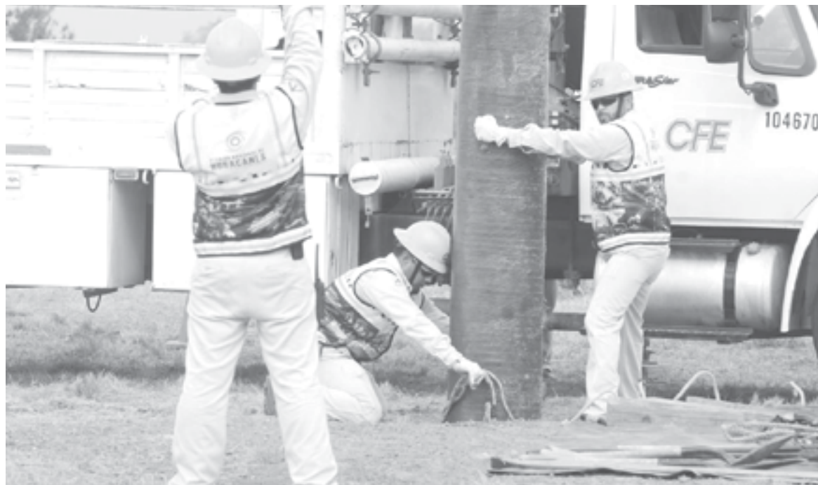
PEGAN ADEUDOS a finanzas de CFE.