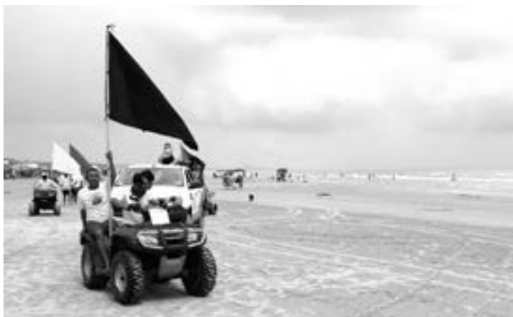
PLAYA CERRADA por fuerte oleaje.

“Se giraron instrucciones para que desde el domingo empezará a instalarse la bandera negra a partir de las cinco de la tarde por el pronóstico de lluvia que pudiera presentarse”.