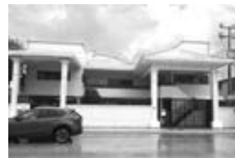
DOS PARTICULARES regresaron a las aulas.