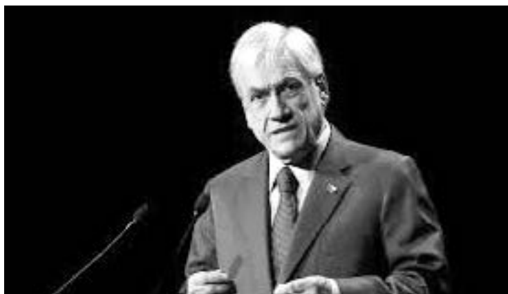
DIRIGENTES DEL MUNDO y empresarios niegan lavado de dinero

Más de dos tercios de las empresas fueron registradas en la británica Is-