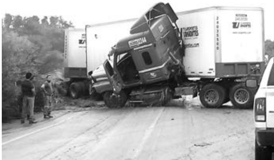
LA PESADA unidad invade los dos carriles generando caos vial.

El percance carretero tuvo lugar alrededor de las 07:45 horas, en la referida vía estatal como