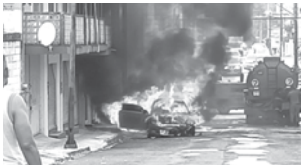
DE LA unidad comenzó a salir humo y luego llamas que consumieron de inmediato el coche.

baron al sitio del percance para asegurar el área procediendo el peritaje correspondiente de los hechos.