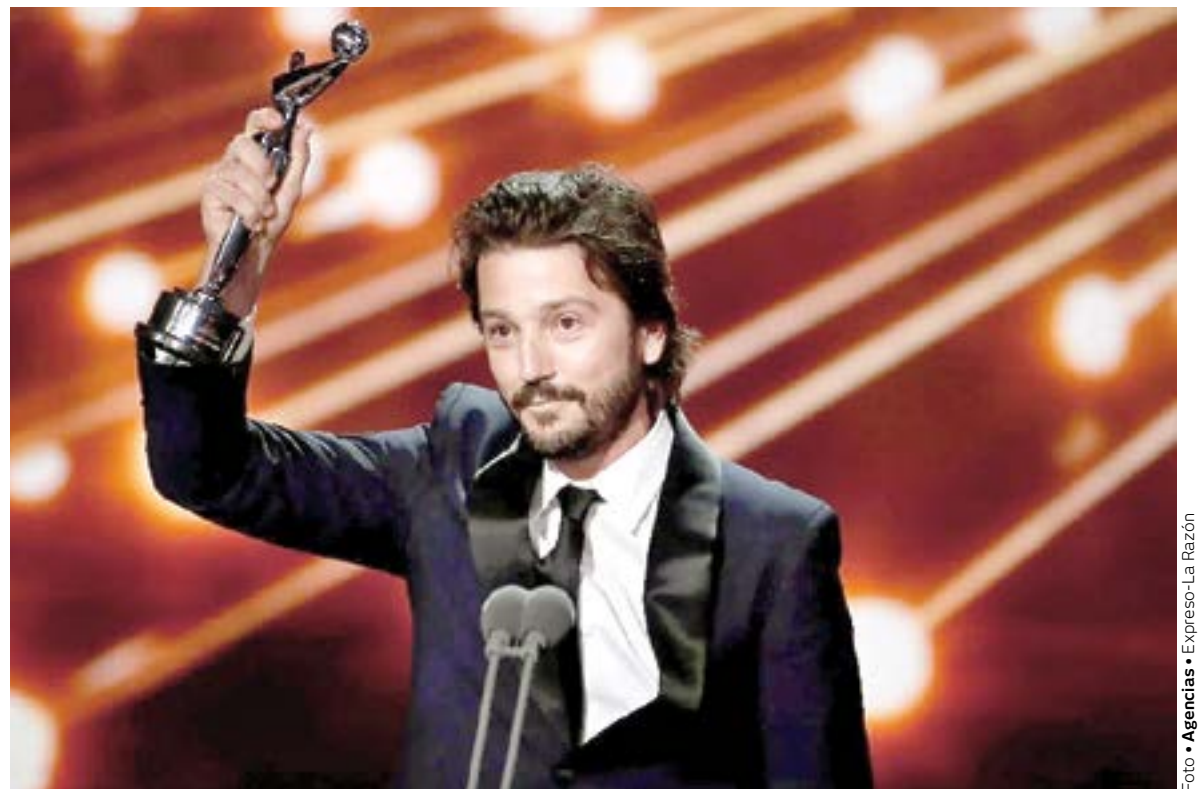
DIEGO LUNA fue galardonado en Madrid.

“Estamos todos muy orgullosos de ti, y suponemos que tu mamá