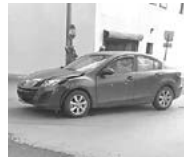
EL COCHE afectado es un Mazda.

En sentido de oriente a poniente se desplazaba el Mazda que era