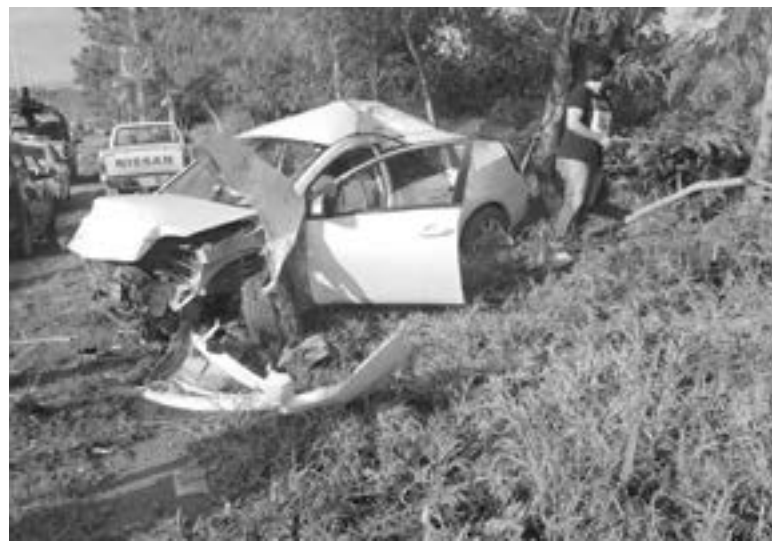
EL COCHE quedó completamente inservible.

Al final, una grúa particular se encargó de llevarse el vehículo hasta los patios de un corralón.