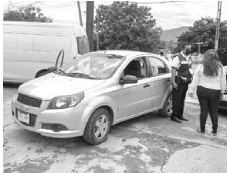
LA CONDUCTORA del Aveo quiso hacer su buena obra del día