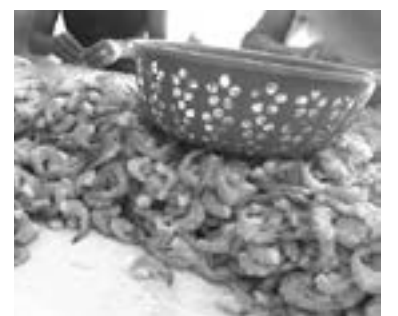
CON LA REACTIVACIÓN de congeladores se reactivan despicadoras.

“El precio de este producto ha estado bajando en los últimos días, el