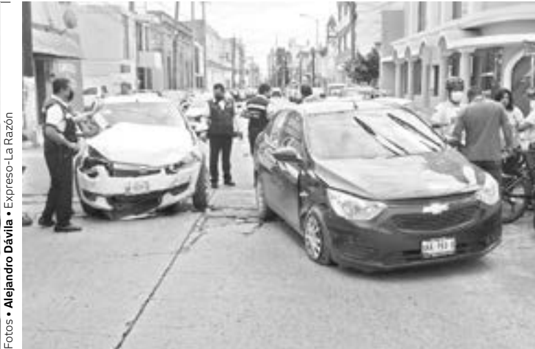
EL CHOQUE ocurrió en el 19 Hidalgo de la zona centro.