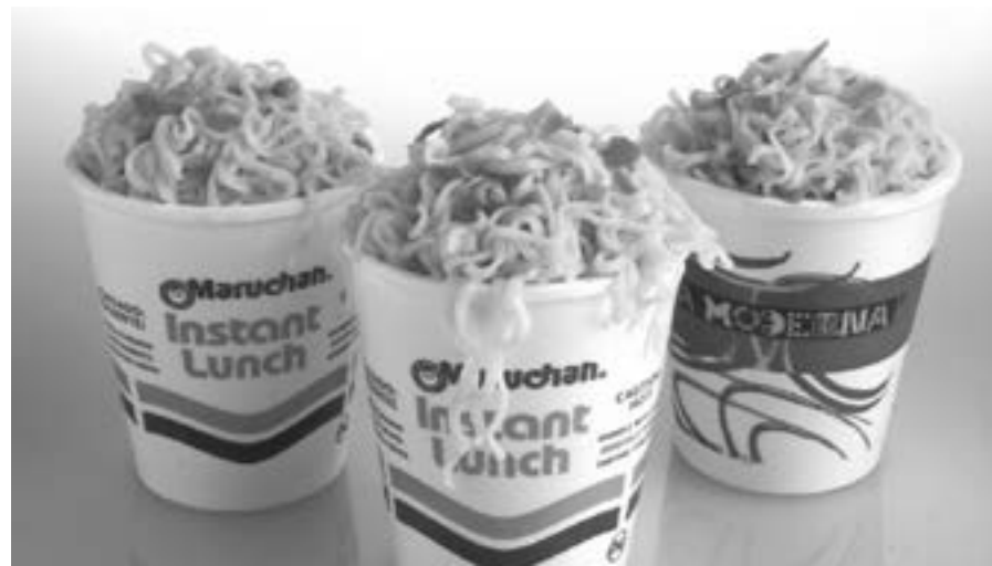
ESTUDIOS SEÑALAN que las sopas instantáneas provocan obesidad en sus consumidores

Sentado en el monte, cubierto su rostro con un paliacate y rodeado por 10 de sus compañeros que sostenían diferentes armas de fuego y una bandera roja, el sujeto leyó las demandas, las primeras de ellas el respeto a las demandas indígenas y no más desvíos de los recursos.