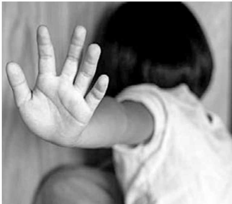
ATIENDEN ALZA en denuncias por maltrato a menores de edad

“El niño sufrió quemadura de segundo grado en el pie derecho, hematomas en ambos ojos, también tiene cicatrices antiguas en