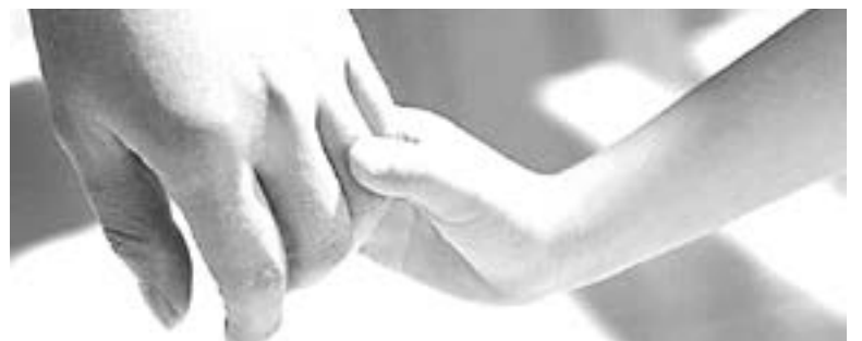
ENTREGA DIF en adopción a 103 menores

proceso de adopciones en Tamaulipas se ha logrado que la documentación y tramitología permita