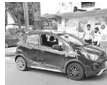
COMO PRESUNTO responsable aparece el conductor del Spark.

DE LA TARDE SE REPORTÓ EL INCIDENTE AL NÚMERO 911