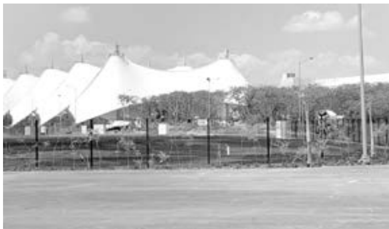
LA FERIA DE TAMPICO se inaugurará el 22 de octubre.

de taquillas, exposición ganadera, teatro al aire libre, y pabellones para cada uno de los municipios de la zona sur del estado.