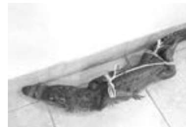
LA CRÍA medía aproximadamente 50 centímetros de largo.