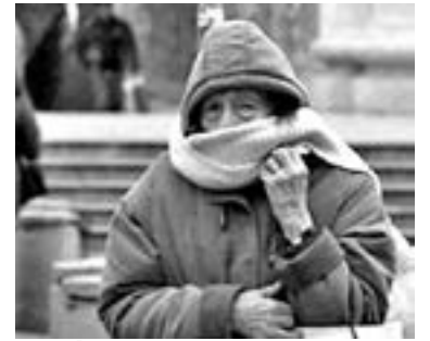
SERÍA EN noviembre, cuando se registren bajas temperaturas extremas

A través del 911 se reciben hasta cuatro llamados por semana de denuncias de maltrato infantil, “al acudir a algunos, resulta que efectivamente eran reales, pero en otros casos se debe a conflicto entre vecinos, pero más vale acudir al lugar, confirmar o descartar, que exista una violencia en contra de niños, niñas y adolescentes”.