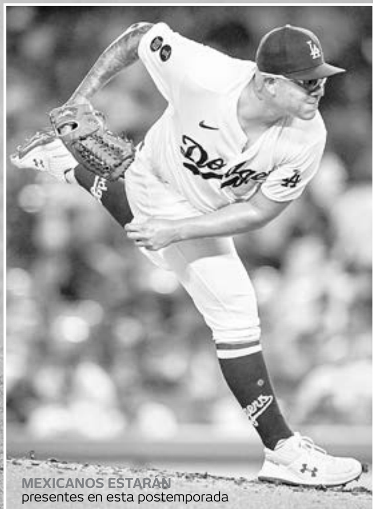
MEXICANOS ESTARÁN presentes en esta postemporada

Aunque es muy probable que este grupo de 5 peloteros vea acción, se podría dar la situación de que alguno de ellos no juegue. Como ejemplo, los Dodgers jugarán en el Wild Card Game y si llegarán a perder ese choque quedarían eliminados, con eso, Julio Urías no tendría oportunidad de jugar en esta postemporada.