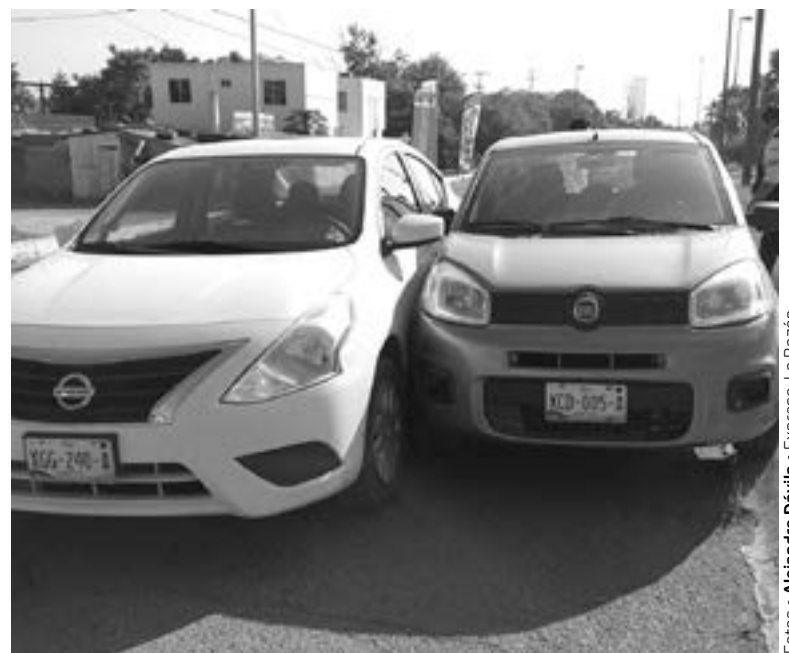
LOS COCHES sufrieron una colisión lateral.