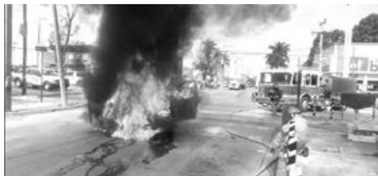
ESTOS SON por falta de mantenimiento.