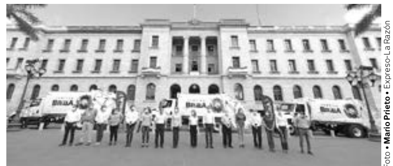
EN EL trienio se destinaron 75 MDP al equipamiento y renovación del parque vehicular.