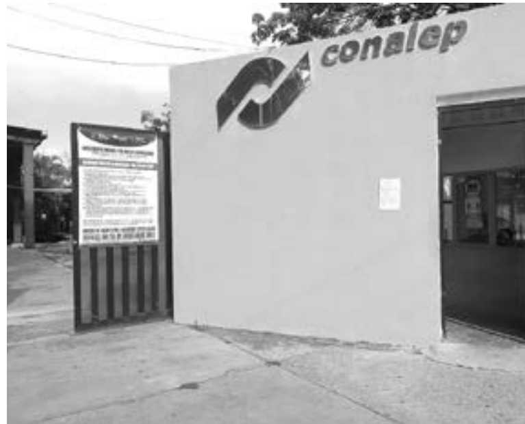
LAS UNIVERSIDADES fueron aprobadas para reiniciar actividades presenciales.

La Universidad Pedagógica Nacional; la Universidad "La Salle";