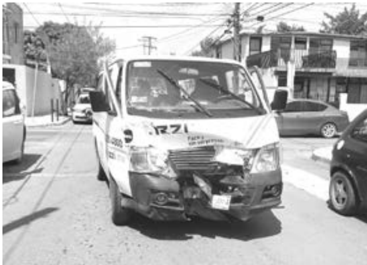
LA UNIDAD responsabilizada es propiedad de una empresa cablera.