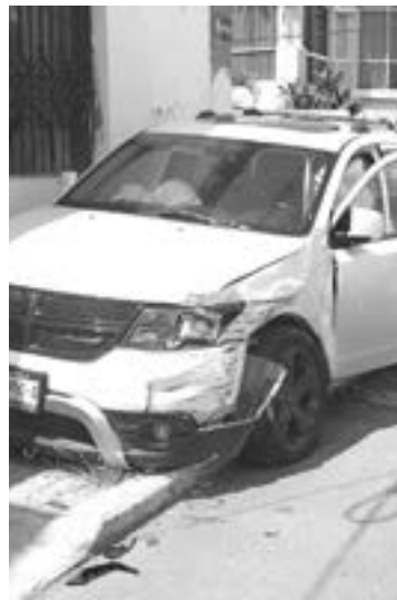
LOS DAÑOS en la camioneta afectada.