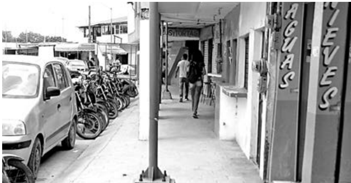
DE FORMA grave se ha disparado el cobro del servicio eléctrico.