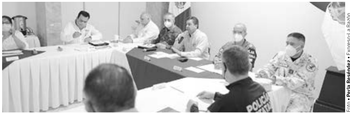
EL GOBERNADOR participó en la reunión donde se analizó la problemática migratoria

De manera extraoficial se sabe que el caso de un paciente de 4 años internado en el citado nosocomio, se originó en su guardería, su maestra lo contagio, señalan familiares del infante.