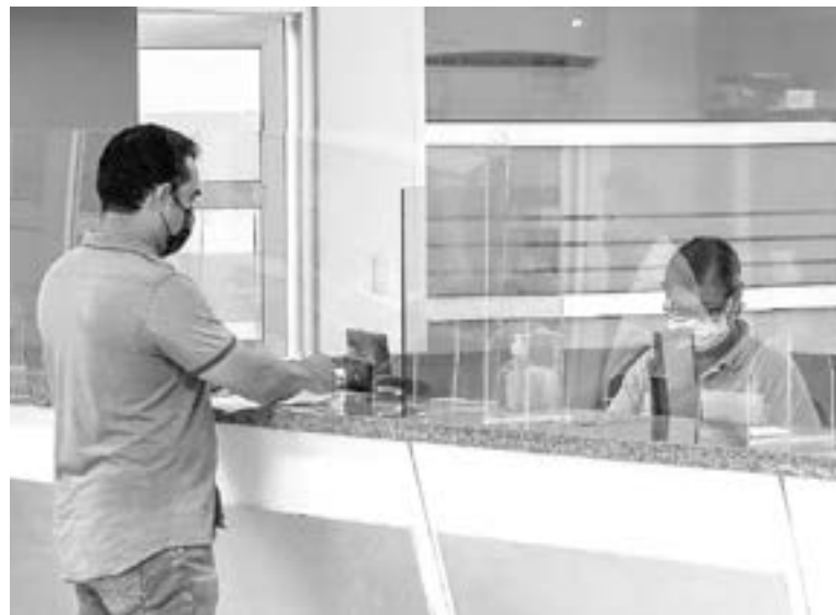
LOS USUARIOS han dejado de pagar las contribuciones.

Los nuevos integrantes del cabildo, que entrarán en funciones el