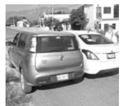
POR FORTUNA no se registraron personas lesionadas.

y analizar la escena, el perito a cargo señaló como aparente responsable, a un hombre que manejaba un vehículo Nissan Versa en sentido de oriente a poniente.