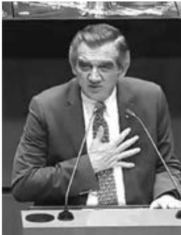
EL SENADOR Américo Villarreal Guerra, al realizar su propuesta.

El senador Américo Villarreal Anaya con especialidad en cardiología, planteó detalladamente ante pleno del senado el gran problema de salud pública que representan para México las enfermedades del corazón, al estar conside-