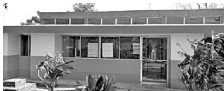
EL ALGUNAS ocasiones las clínicas no tienen ni un antigripal.

Dijo que se trata de instalaciones hechos de manera improvisada y las cuales son frecuentes los cortocircuitos y de ello se derivan los incendios en estos humildes hogares la mayoría de ellos construidos de madera o lámina de cartón.