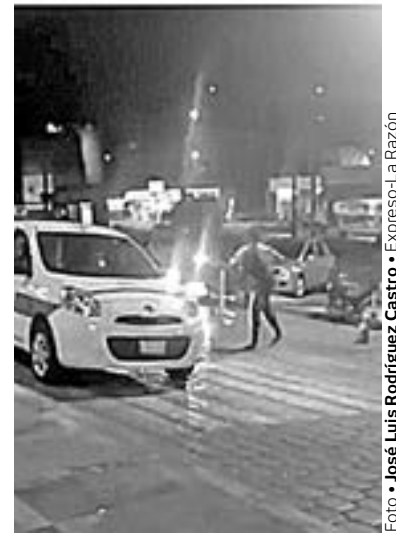
LA MUJER causó graves daños al taxi.