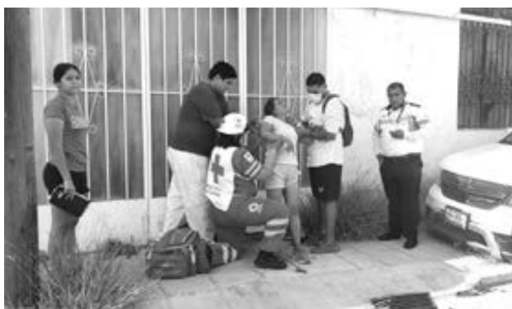
PARAMÉDICOS ATIENDEN a una mujer lesionada.

Fue en el 19 Matamoros, que hizo la omisión y se estrelló en