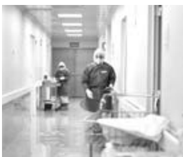
TRES MENORES de edad se encuentran delicados.

Los impactos del Covid-19 siguen afectando a la población ahora cobrando la vida incluso de menores de edad, tan solo esta semana la Secretaría de Salud reportó la muerte de un niño de 3 años, la semana pasada de uno de 16 y en la actualidad hay por lo menos tres casos de pacientes intubados en el hospital infantil Las condiciones de cuidado deben extremarse con el regreso a clases presenciales, el cuidado de los niños debe ser mayor, porque aún no se conoce con exactitud las secuelas que el Covid-19 puede dejar en los meno-