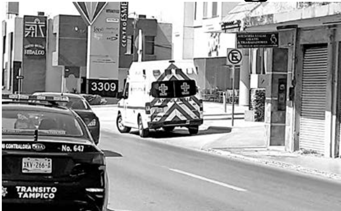
PARAMÉDICOS de la Cruz Roja le prestaron auxilio.

Cuando intentaba cruzar esa avenida, la mujer fue embestida por la unidad, terminando en el suelo.