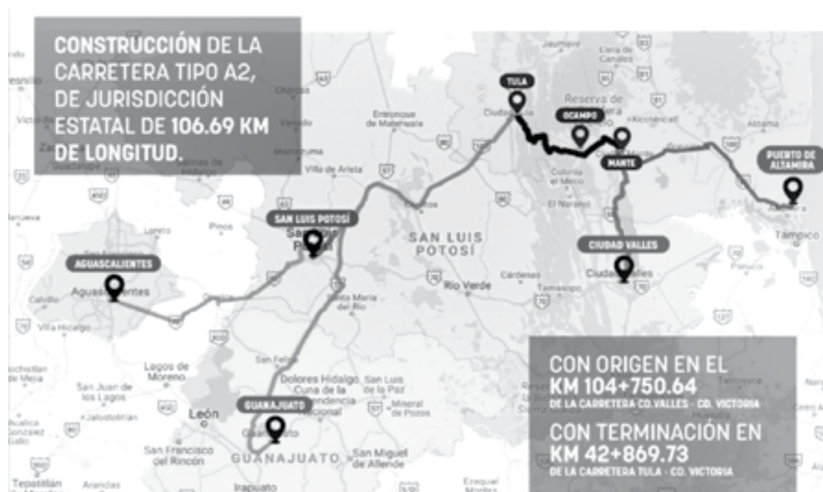
EL MARTES comienzan los trabajos