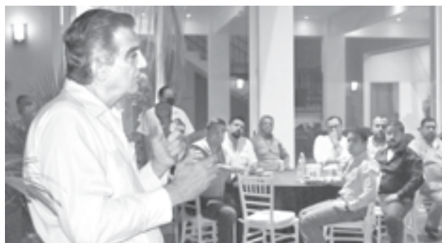
EL SENADOR Américo Villarreal.

"Tenemos importancia a nivel mundial en comercio exterior, y aquí todos vivimos de esa acti-