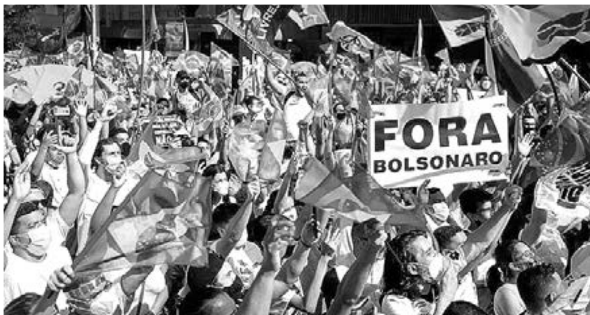
MILES DE mujeres protestan contra Bolsonaro en Brasilia

Las marchas fueron convocadas por grupos sociales de derecha, como el Movimento Brasil Livre (MBL) y Vem Pra Rua (VPR), que impulsaron en 2016 el juicio político de la iz-