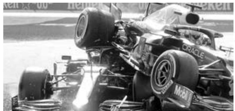
AMBOS CORREDORES perdieron su lugar en el GP.

Ni Verstappen, líder del mundial con 226,5 puntos, ni Hamilton (221,5) sumarán puntos en el Gran Premio de Italia, 14ª prueba de la temporada (de las 22 programadas), aunque el holandés aumenta su ventaja gracias a los dos puntos sumados el sábado tras acabar segundo en la carrera esprint que sirvió para definir la parrilla de salida del GP.