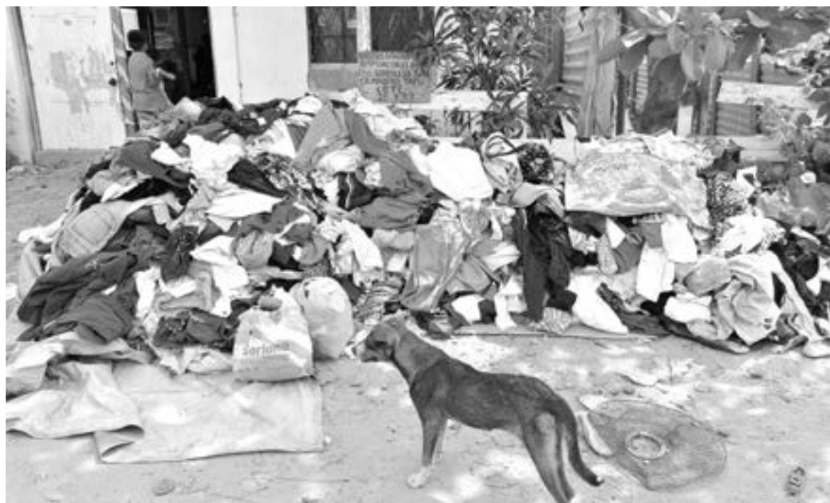
MIRAMÁPOLIS ES la colonia con más perros callejeros.