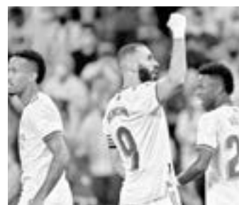
UN GRAN partido fue el disputado.

Santi Mina y del argentino Franco Cervi), pero Benzema igualó las dos veces, Vinicius puso el 3-2, el joven Eduardo Camavinga, en su debut con la camiseta merengue hizo el 4-2 y Benzema cerró la cuenta de penal.