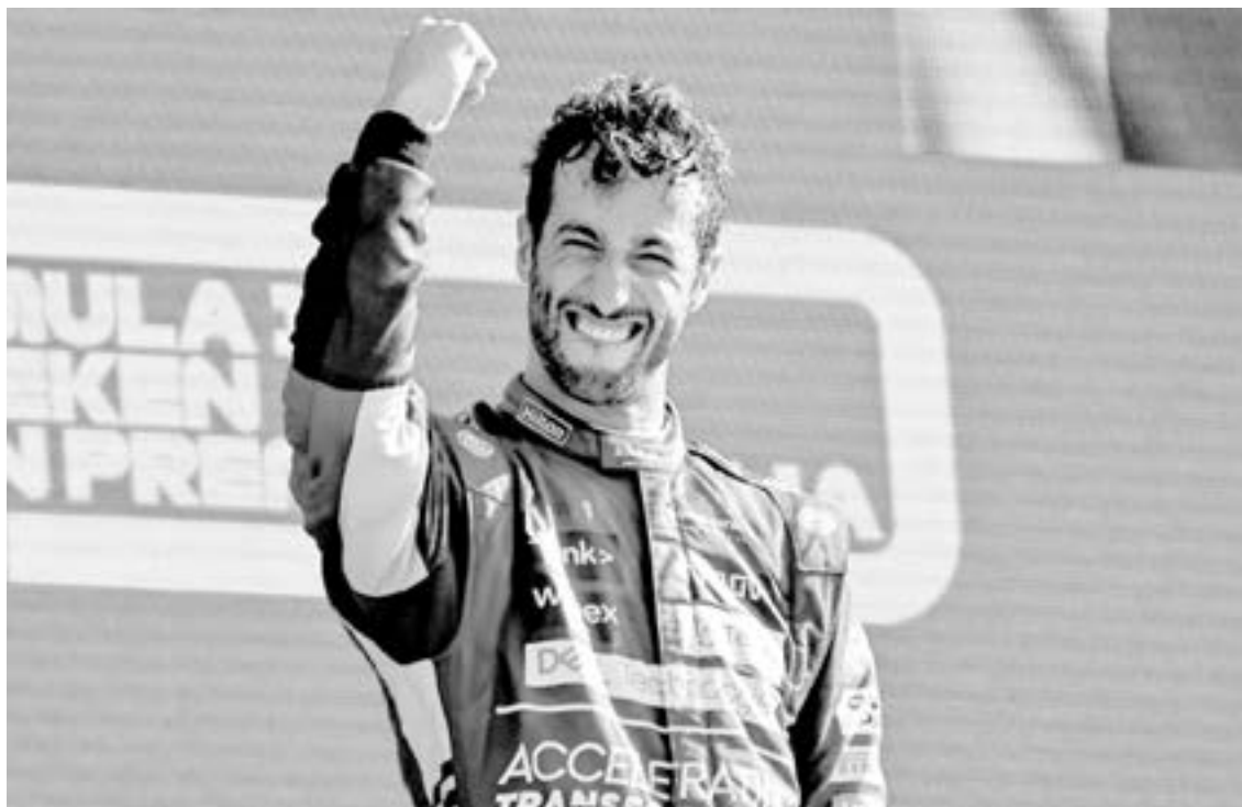
DANIEL RICCIARDO ganó el Gran Premio de Italia.