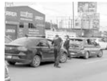
LA COLISIÓN generó caos vehicular en la carretera Tampico-Mante.