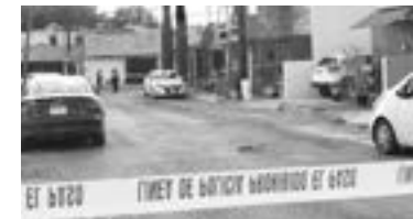
LOS HECHOS se registraron cerca de las 5:45 de la mañana.

Sobre el atacante, sólo se dijo que era uno de los asistentes a la reunión, pero la autoridad no con-