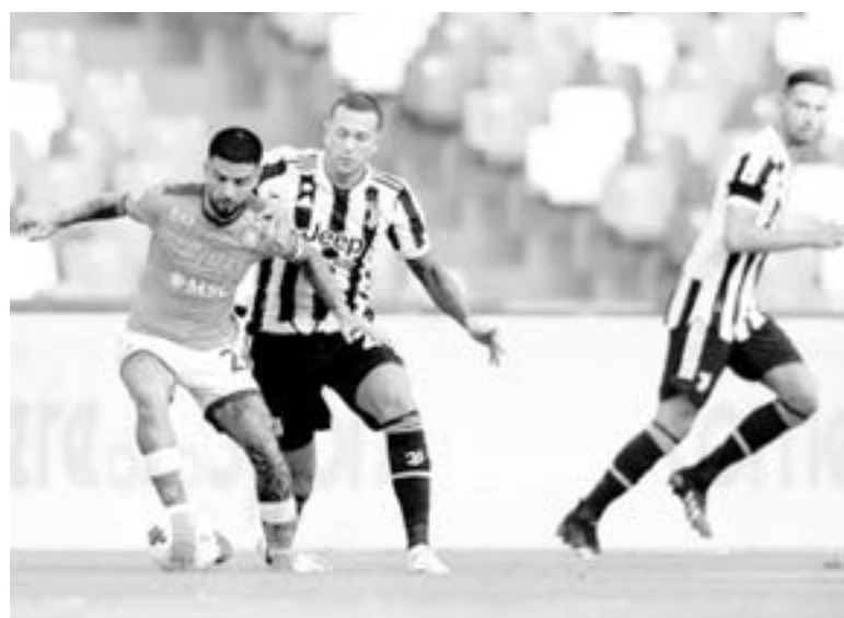
DOS GOLES fueron los regalados por el equipo.

El equipo blanco sigue al frente de la clasificación liguera con diez puntos, empatado con Valencia y Atlético, pero con mejor diferencia de goles.