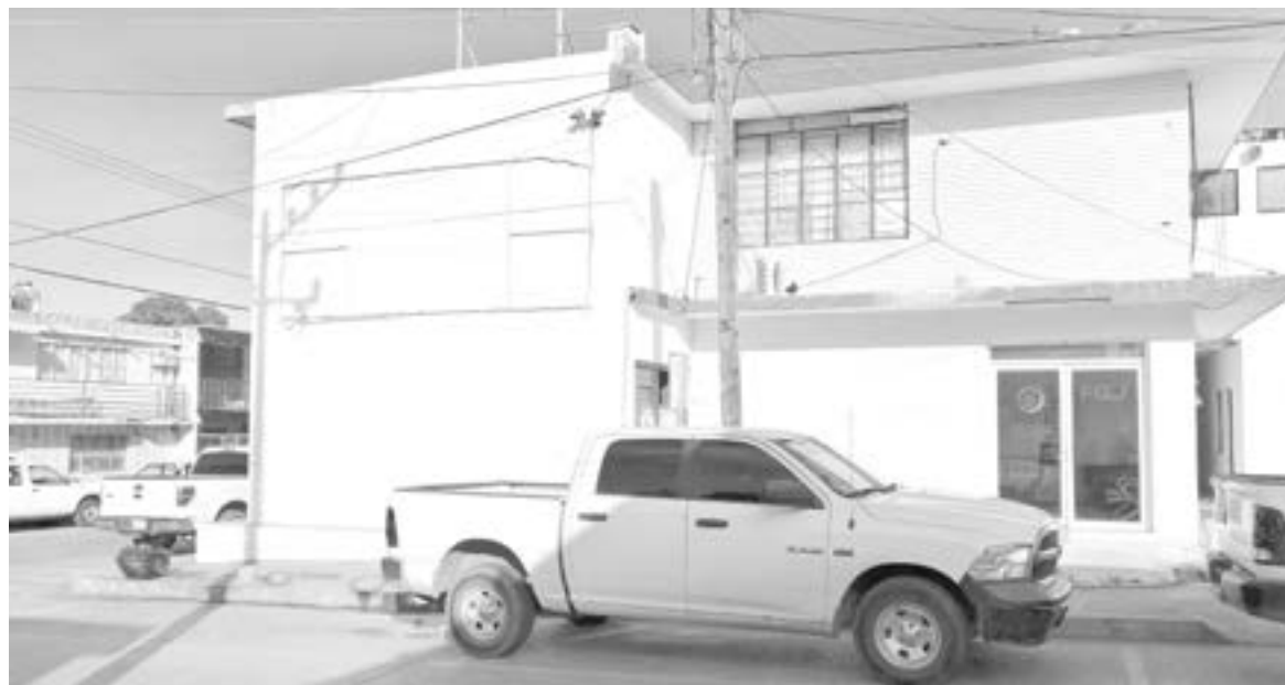
EL MINISTERIO PÚBLICO ha sido cambiado tres veces.

el cambio frecuente de fiscal, “no quiero pensar que se pueda comprar la justicia en nuestro municipio y estado”.