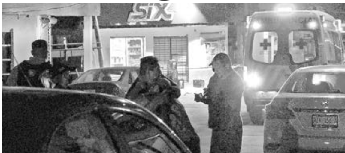
ALREDEDOR de 5 personas perpetraron el multihomicidio.

Las primeras investigaciones determinaron que entre cuatro y cinco personas llegaron al si-