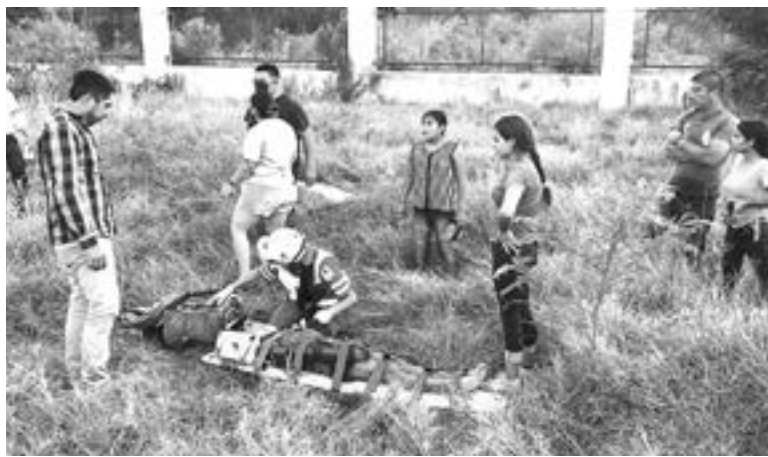
TRES NIÑOS que viajaban en la camioneta sufrieron lesiones.