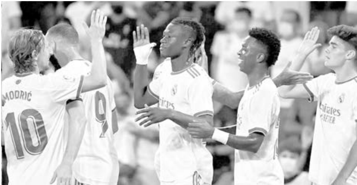
EL EQUIPO sigue como líder empatado a puntos con Valencia y Atlético de Madrid.