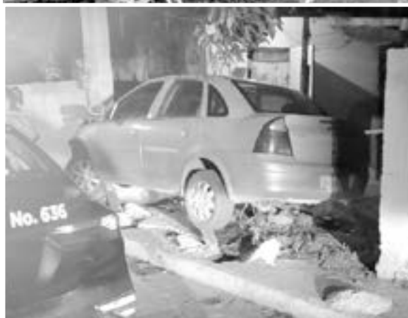
SE IMPACTÓ de lleno con la barda en la Revolución Verde de Tampico.