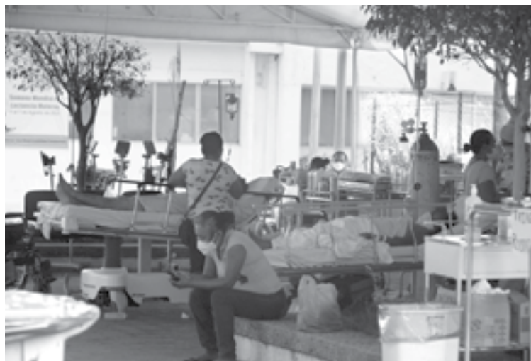
CINCO PACIENTES fueron atendidos en el estacionamiento en una carpa.

Grupo REFORMA publicó que los pacientes atendidos en el es-