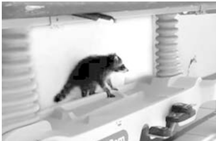
EL ISSSTE insalubre por plagas.

"El tema principal en México es la pandemia que conlleva a salud, es momento de que Andrés Manuel Lopez Obrador acuda a Tampico, así como acude a la Refinería Madero que venga al ISSSTE, que vea la realidad en la que estamos,