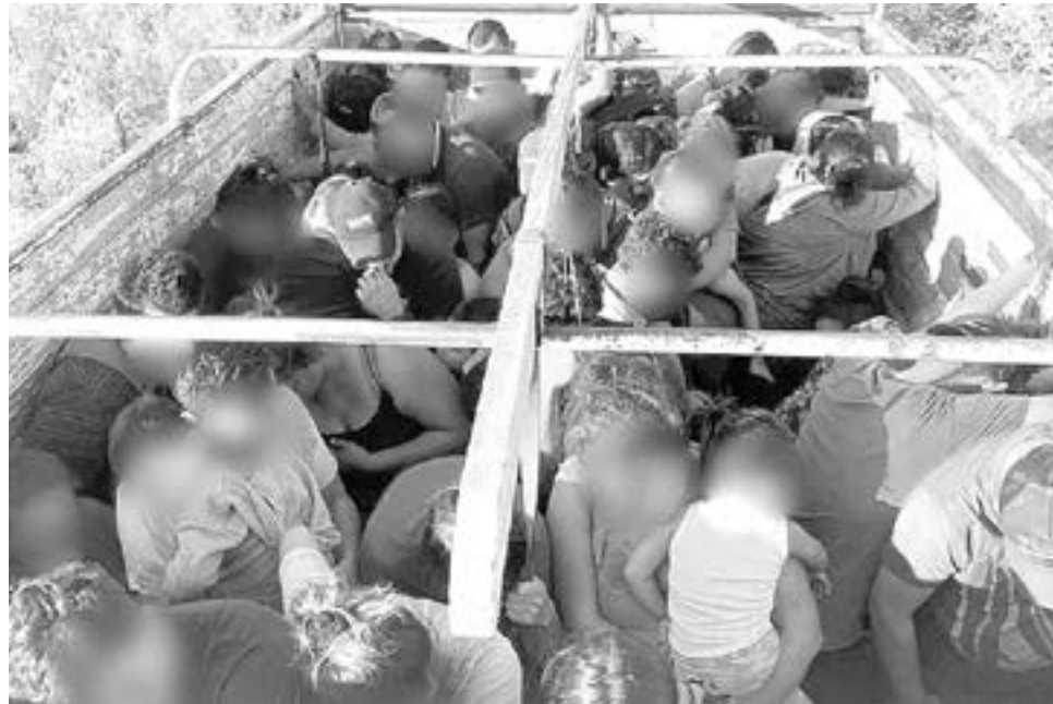
EN NUEVO LEÓN se han incrementado los aseguramientos de migrantes

nios, los migrantes pagan hasta 3 mil 500 dólares, unos 80 mil pesos, para cruzar el país y la frontera con Estados Unidos. A cambio tienen tres oportunidades para hacerlo.