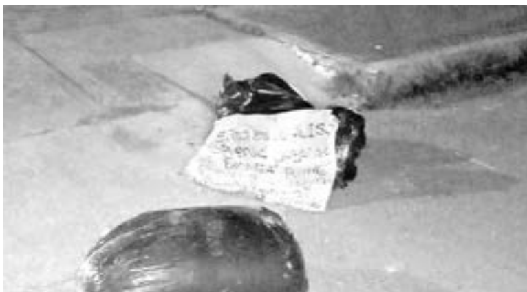
DEJAN TRES bolsas de basura con restos humanos en Jaltenco

Atte. Vecino vigilante”, señala el amago escrito en una cartulina fluorescente.