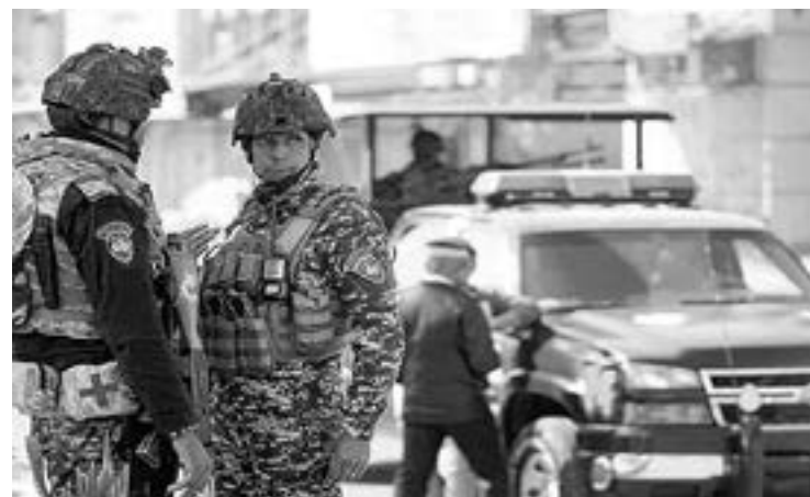
LAS FUERZAS policiales fueron atacadas en el distrito de Daquq

Además, tras el asesinato de un soldado iraquí y el secuestro de un civil en un ataque en la misma provincia de Kirkuk, la semana pasada el Ejército de Irak llevó a cabo una operación para erradicar las células