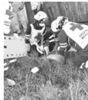
A PESAR de lo fuerte del percarce no se perdieron vidas.