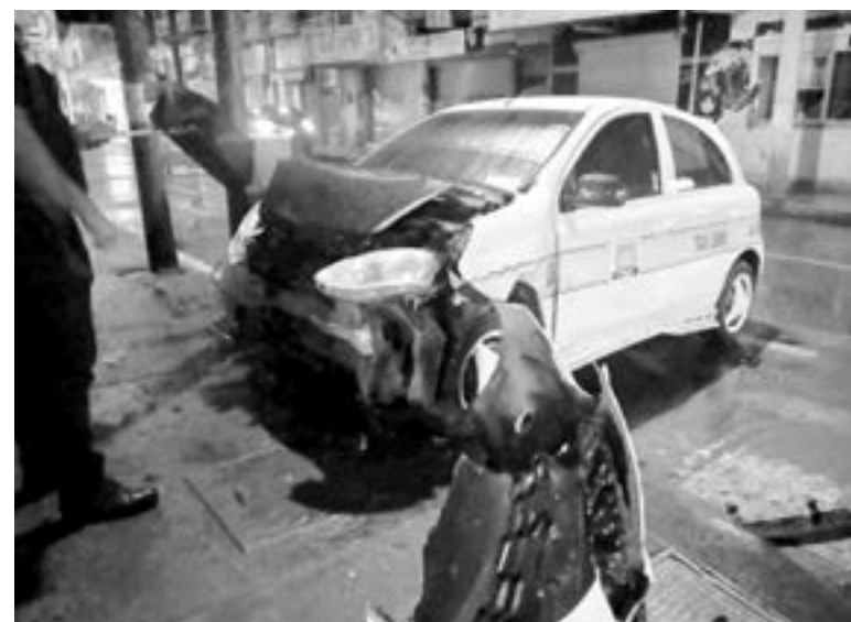
EN EL percance fue derribado un teléfono público.

La primera unidad se desplazaba por la calle Obregón y al momento de arribar a ese cruce, impactó en un costado al otro carro, saliendo proyectado el carro del transporte público hacia un negocio de aguas frescas, quedando con las llantas arriba de la