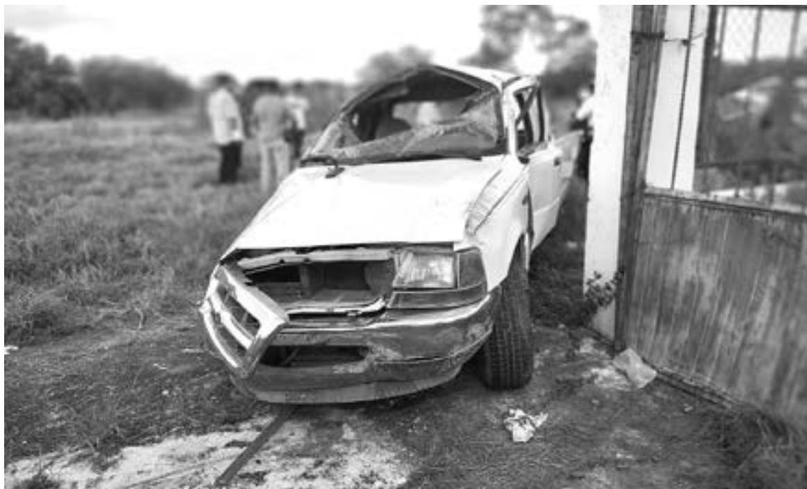
LA CAMIONETA detuvo su trayectoria al chocar con un portón.