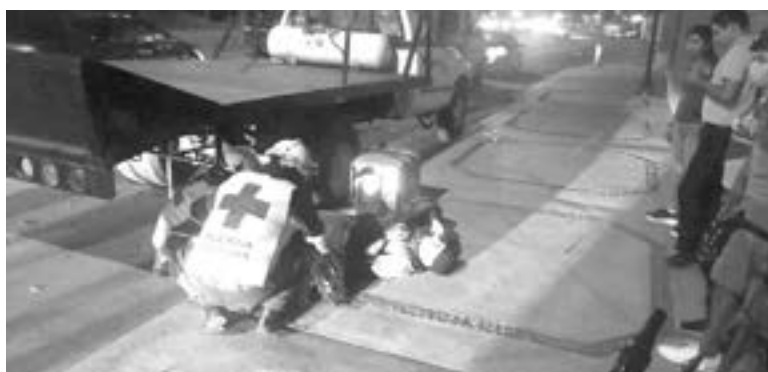
EL REPARTIDOR resultó con probable fractura.

Los elementos de la dirección de tránsito y seguridad vial, informaron que este incidente ocurrió sobre los carriles del bulevar Familia Rotaria, a escasos metros de la Avenida Tenochtitlán.