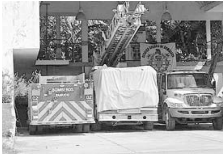
BOMBEROS AFECTADOS por el desorden administrativo en Pánuco.

El colmo de la indolencia y la irresponsabilidad es dejar sin sueldo a un grupo de trabajadores que por la naturaleza de su labor son cruciales, ya que atienden emergencias en la cual quedará expuesta en la vida