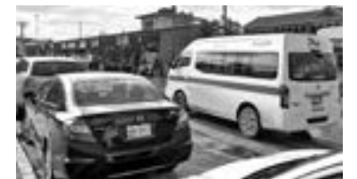
ENTRAN 4 RUTAS al mercado desde el domingo.

Los camiones entrarán por la calle Sor Juana Inés de la Cruz hasta Héroe de Nacozari para salir en la calle Héroes del Cañonero, posteriormente se integran a Isauro Alfaro y salen por la calle Obregón.