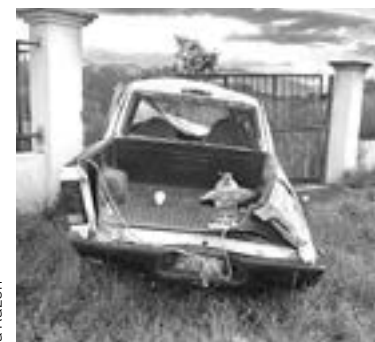
LOS TRIPULANTES salieron expulsados al volcar la pick up.

05 PERSONAS TUVIERON QUE SER LLEVADAS A HOSPITALES