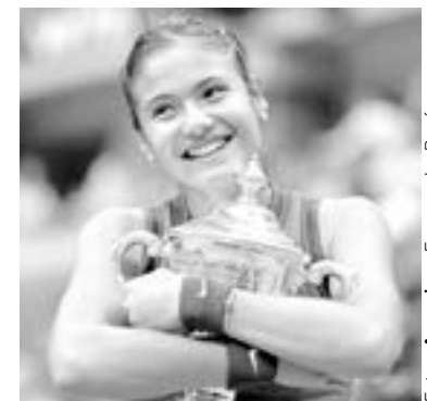
ES LA primera británica en ganar un Grand Slam.

El partido comenzó Raducanu con su saque e hizo el break en el segundo para el 2-0, demostrando que