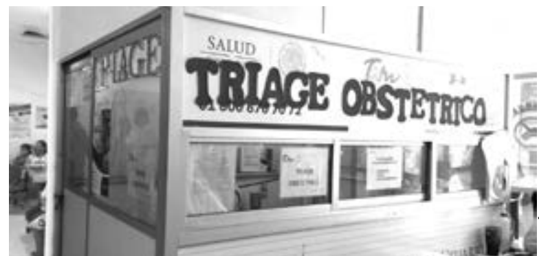
EL PARTO de la mujer migrante fue el pasado viernes

“El niño se encuentra bien, el parto fue la madrugada del viernes. No se les puede negar la atención y hay instrucciones de