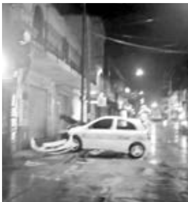
EL TAXI salió proyectado hacia un negocio de aguas frescas.

Protagonizaron el choque un Nissan March habilitado como ta-