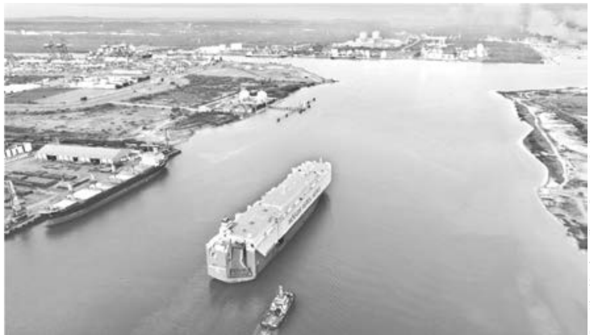
LOS PUERTOS de Tamaulipas obtendrán más de 400 millones de pesos para obras

requiere 32 millones 180 mil pesos, obtendrá apenas 2 millones de pe-