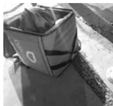
A UN LADO de él quedó su equipo de trabajo.

posible fractura en la pierna izquierda y contusiones en la mayor parte del cuerpo, fue trasladado hasta la sala de urgencias del Seguro Social.