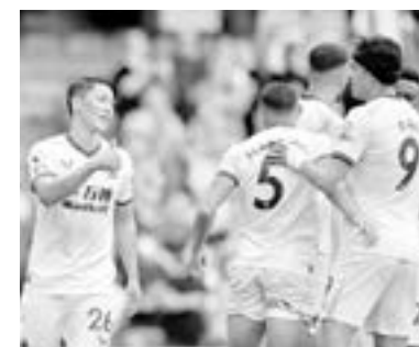
ES LA primera victoria del Wolves la campaña.

Esta es la primera victoria de la campaña para el Wolves, que suma cuatro puntos, mientras que el Watford Xisco se queda decimoquinto con tres unidades dejando claro que busca ser el líder.