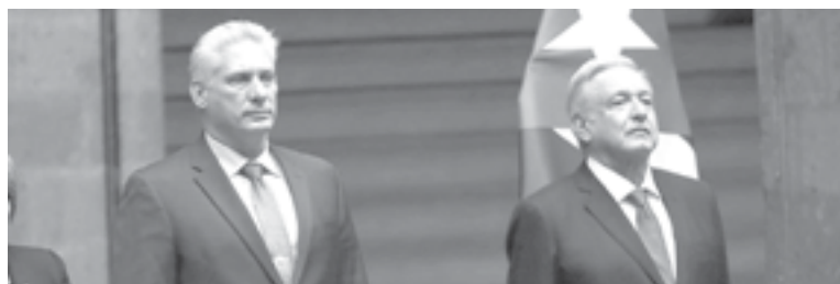
EL ARRIBO de Díaz-Canel se espera para el próximo miércoles.

Esta será la tercera vez que el Presidente de Cuba visite México en esta Administración, luego de participar en la toma de posesión de Andrés Manuel López Obrador en diciembre de 2018 y otra visita en 2019.