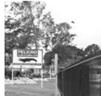
LA COLOCACIÓN de malla ha costado más de un millón de pesos.

Explicó que en el caso de la laguna Nuevo Amanecer, la protección perimetral consta de 520 metros lineales y añadió que se continuará en aproximadamente