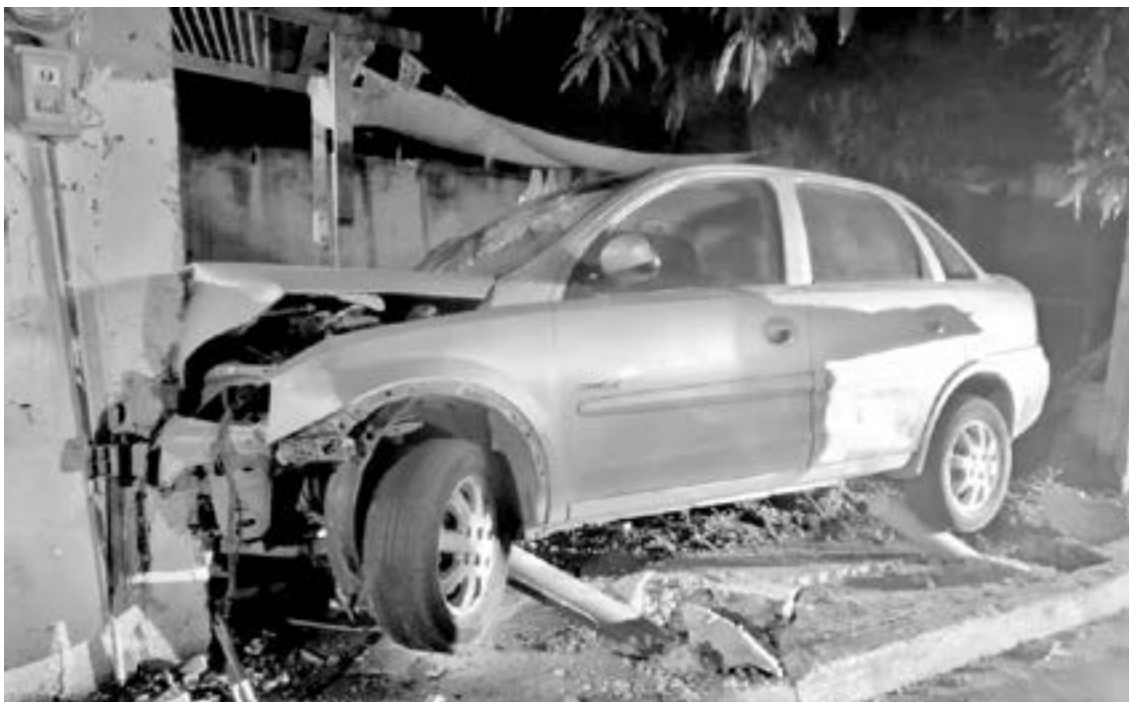
LOS DAÑOS materiales fueron cuantiosos.

Debido a lo anterior, perdió el control del volante y acabó im-