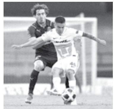
POR MOMENTOS parecía que se anotaría el gol.

El Rebaño tuvo las dos oportunidades más claras del partido y no logró concretarlas, por lo que la crisis de ambos equipos empeoró. Los felinos se mantienen en el fondo de la general