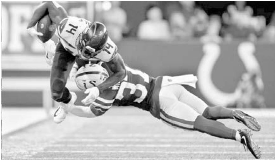
GRANDES JUGADAS se vivieron durante este encuentro.

Wilson estuvo formidable en su primer encuentro con el nuevo coordinador ofensivo Shane Waldron, vulnerando a una de las 10