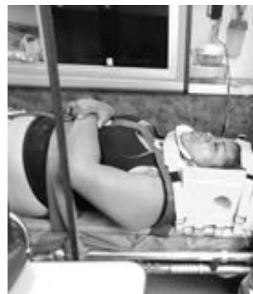
DOS MUJERES también debieron ser hospitalizadas.