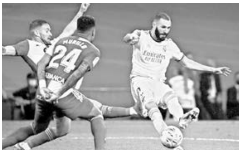
EN GRANDE fue el regreso de los merengues este domingo.

10 PUNTOS SON LOS QUE MANTIENEN AL EQUIPO COMO LÍDER