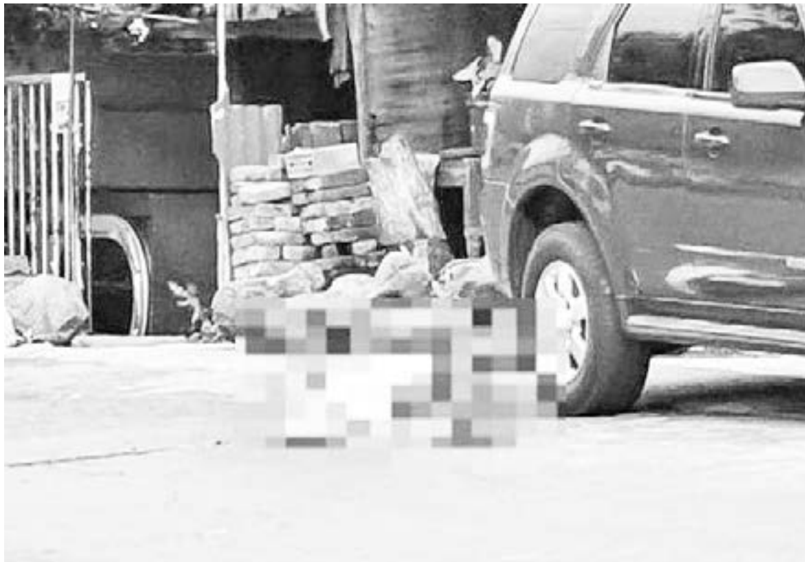
SICARIOS EJECUTAN a balazos al "Oso".