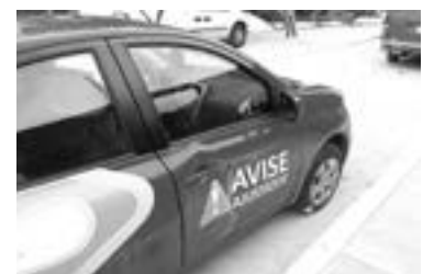
EL CARRO Nissan March resultó dañado del costado izquierdo.