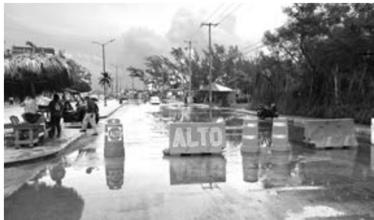
CIERRAN PLAYA MIRAMAR por fuerte oleaje.