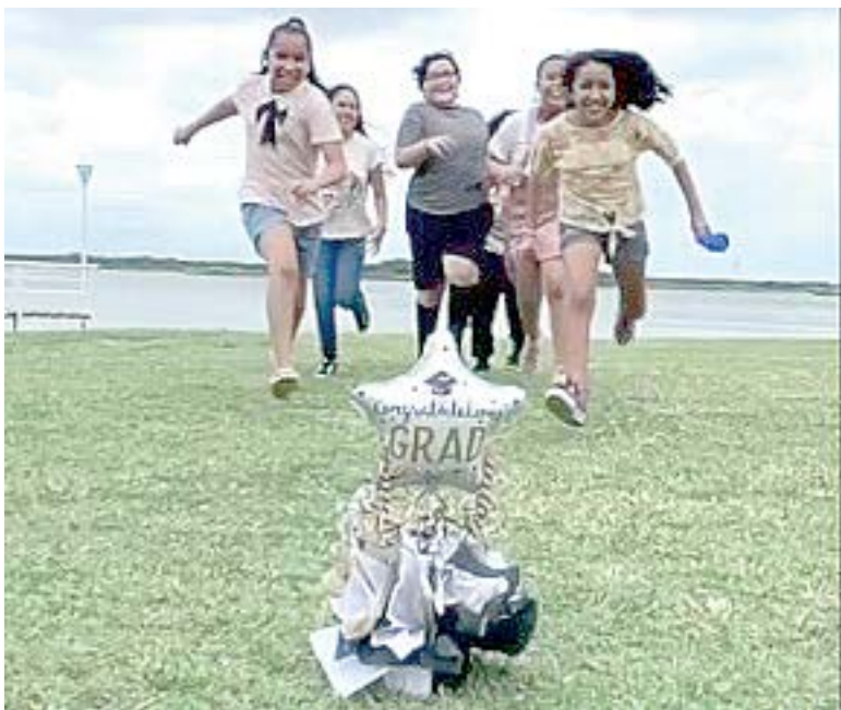
FELICES DE CULMINAR sus estudios de primaria.