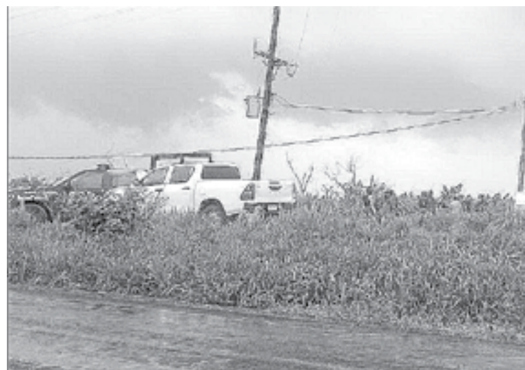
SE CERRÓ el paso en el camino.

El tético hallazgo se registró alrededor de las 13:00 horas en un camino de terracería justo