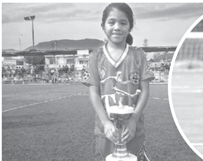
DESDE CHICA ha destacado en el fútbol local.

Así se dio cuenta que el fútbol era para ella, y ya jamás lo abandonó, continuó con sus entrenamientos y partidos, "me ayudaba mucho y hasta la fecha, el haber fogueado con niños, porque no me da miedo entrar fuerte, ahora si hay niñas más grandes que yo, no es problema para