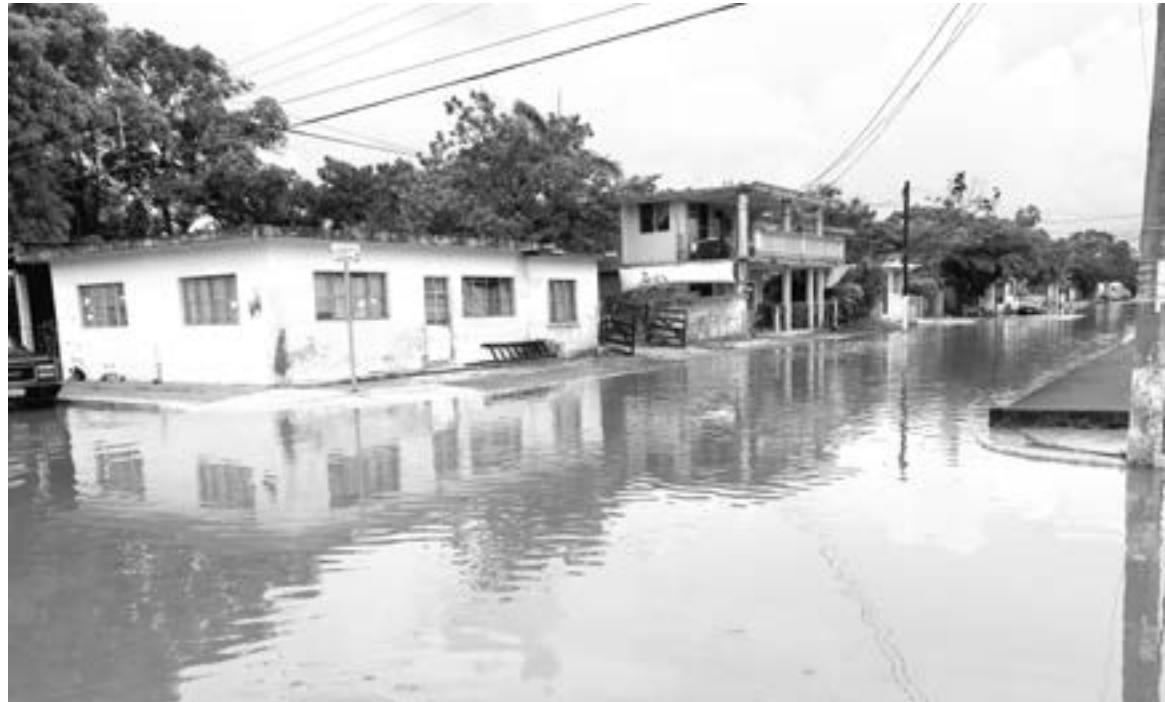
LA COLONIA Hipódromo fue la más afectada por los remanentes de "Grace"