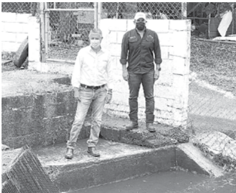
DESTACA ÓPTIMO FUNCIONAMIENTO de la red de canales pluviales.

“Estamos supervisando la operación de los diferentes canales a cielo abierto ubicados en colonias como la Morelos, Vicente Guerrero, Campbell y otras para verificar que todo