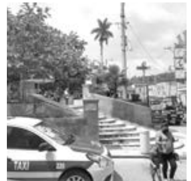
JÓVENES TRABAJADORES fueron extorsionados.

Personal de la Policía Investigadora estuvieron presentes durante el sábado en el lugar.