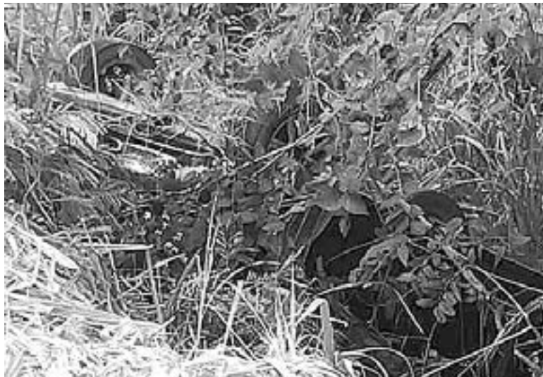
EL VEHÍCULO quedó entre la maleza.

DEBIDO AL EXCESO DE VELOCIDAD EL CHOFER PERDIÓ EL CONTROL DE SU VEHÍCULO POCO ANTES DE ALCANZAR EL ÁREA DEL PUENTE DE MONTE ALTO