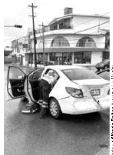
EL COCHE en el que circulaba la lesionada.

de un acuerdo, en tanto que los coches pasaron al corralón municipal.