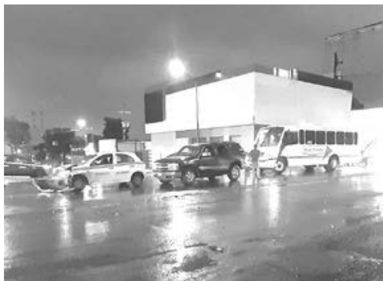
LAS UNIDADES quedaron impactados sobre la avenida Hidalgo.

06:00 OCURRIÓ EL PERCANCE VIAL EN EJERCITO MEXICANO