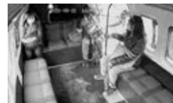
LAS AUTORIDADES no reportaron la detención de los dos asaltantes.

Después, al hacer alto total, subió a la parte trasera de la combi para que los presentes le revisaran una herida en el hombro derecho.