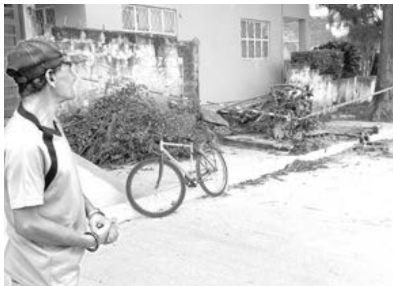
LA BANQUETA quedó invadida por el árbol.

1 NISSAN MARCH SUFRIÓ UN GOLPE EN LA PUERTA IZQUIERDA