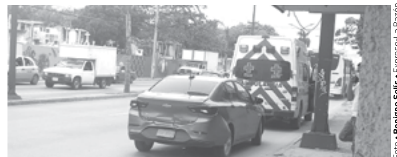
AL LUGAR acudieron paramédicos de la Cruz Roja.

Tres niños que iban en una de las unidades terminaron con algunas molestias por lo que fueron valorados por técnicos en urgencias