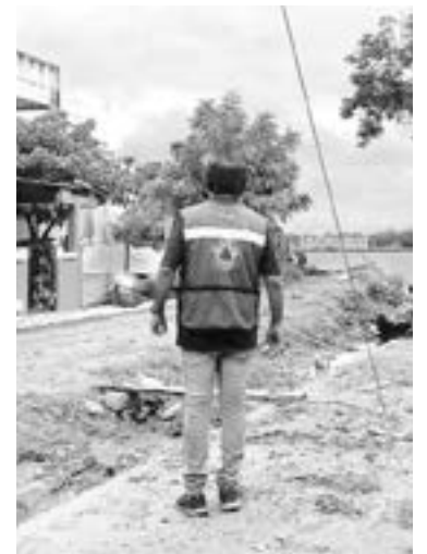
EN LA MORELOS se desbordó un dren pluvial.

Vázquez Jáuregui señaló que el pronóstico de lluvias continuas para este sábado por la noche y mañana domingo aunque ya con menor intensidad y solo lluvias ligeras a moderadas. En Tampico, la lluvia que se