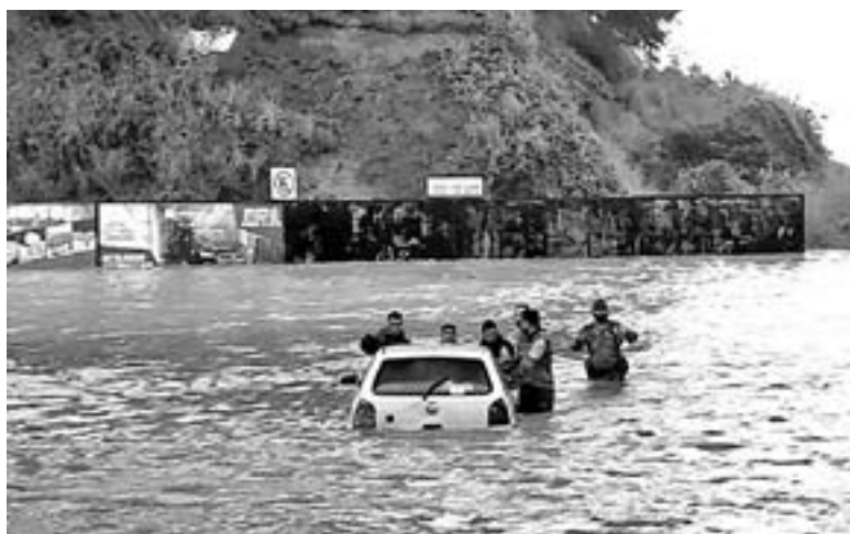
PROVOCA 'GRACE' caos y aislamiento en el norte de Veracruz.