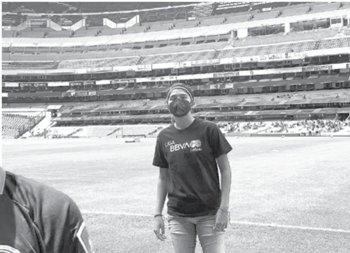
LA VICTORENSE fue llamada a la Selección Mexicana.