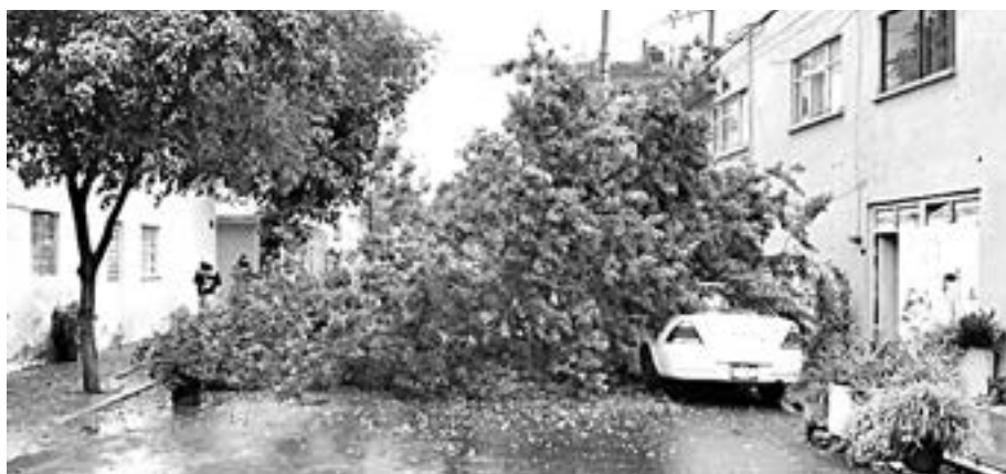
EN LA CIUDAD DE MÉXICO provocó encharcamientos, lluvias y caída de árboles por los fuertes vientos.

A SU PASO POR EL PAÍS, EL METEORO CAUSÓ DECESOS EN VERACRUZ Y PUEBLA, ENTRE ELLOS VARIOS MENORES DE EDAD, ADEMÁS DE CIENTOS DE CASAS DESTRUIDAS, CAÍDA DE ARBOLES Y ANUNCIOS ESPECTACULARES