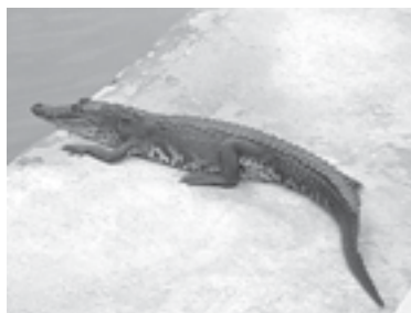
EL PEQUEÑO saurio escapó de los Bomberos.

Vecinos temen que el riesgo sea mayor una vez que el animal aumente de tamaño.