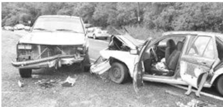
LOS VEHÍCULOS participantes.

fueron un Nissan Tsuru y una camioneta Chevrolet pick up.