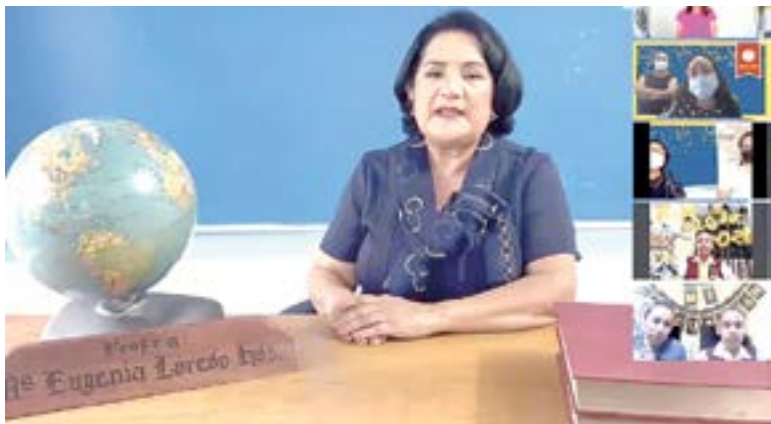
LA DIRECTORA del plantel estuvo presente durante el evento.

no han podido asistir a clases presenciales pero continuaron con sus estudios de manera virtual durante todo el año ya que las maestras los apoyaron durante todo el ciclo escolar.