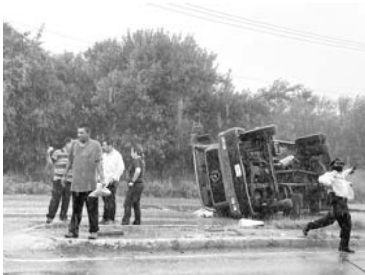
EL CAMIÓN cisterna quedó volcado sobre el lado del copiloto.

Los técnicos en urgencias médicas de la Cruz Roja brindaron los primeros auxilios al operador de un camión Mercedes-Benz y a su acompañante quien dijo haber recibido un 'aventón' por parte de