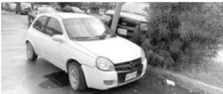
AL CHEVY le tocó su 'laminazo'.

En las investigaciones realizadas por los oficiales se estableció que la trayectoria que llevaba era en sentido de sur a norte sobre los carriles centrales.