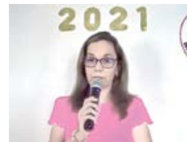
CON GRAN éxito se realizó la graduación de la generación 2021 de manera virtual.