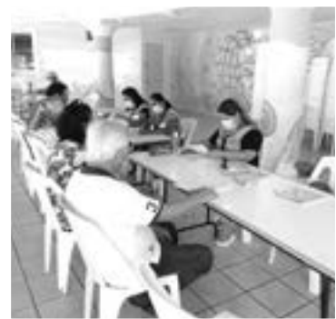
POCA AFLUENCIA fue la registrada durante este sábado.

que no se hayan registrado podrán acudir a los centros integradores que están funcionando en los tres municipios y en Altamira es el que está localizado sobre la calle Vicente Guerrero en la zona centro del