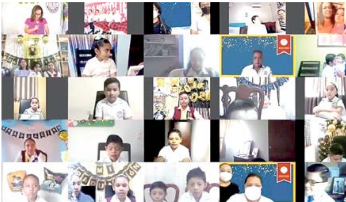
LOS CHICOS estuvieron presentes durante la ceremonia virtual.