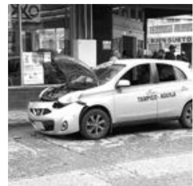
EL VEHÍCULO quedó a espera de una grúa.

Del hecho tomaron conocimiento elementos de Tránsito quienes después lo turnaron al Ministerio Público para que se efectuaran las investigaciones correspondientes.