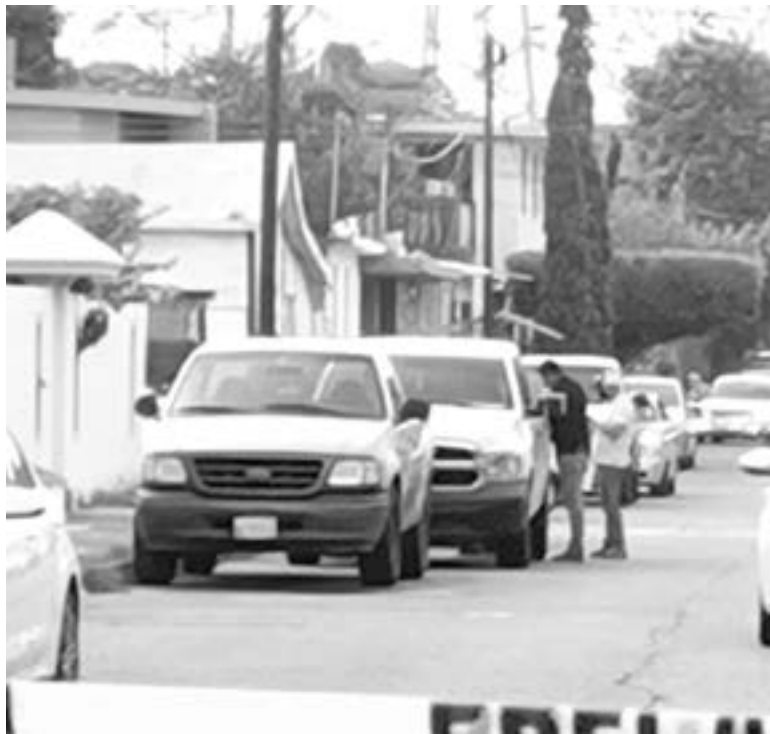
AL LUGAR de los hechos acudieron elementos de la Fiscalía General de Justicia.

El reporte preliminar extraoficial, sostiene que se trata de una