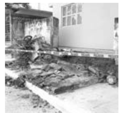
SE ACORDONÓ el área para evitar algún accidente.

Bomberos de Tampico se trasladaron al lugar para acordonar el área, correspondiendo a particulares el retiro de los escombros.