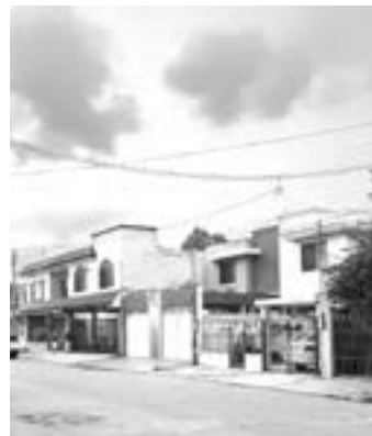
EL HALLAZGO se habría producido durante la tarde del sábado.