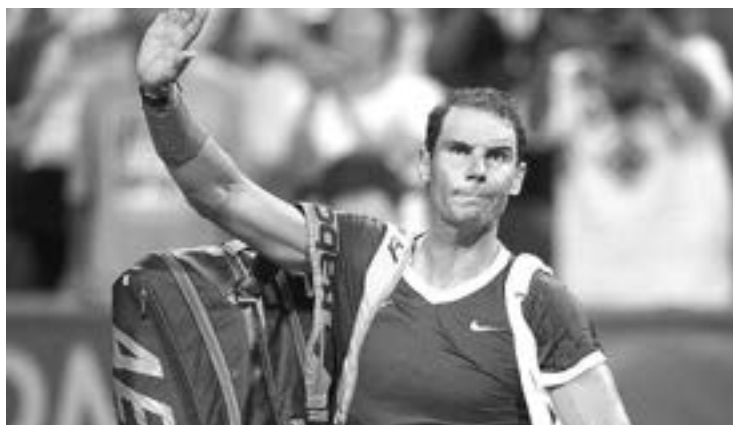
UNA LESIÓN lo obligará a perderse la temporada.

El astro anunció su decisión a través de un video en redes sociales, en el que aludió a una lesión