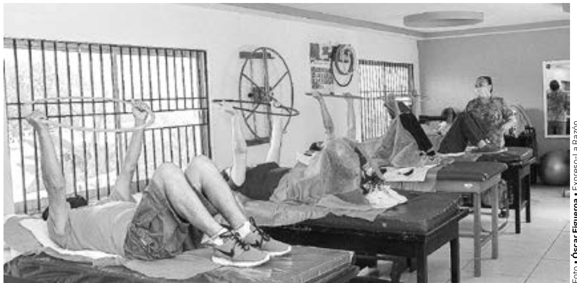
REHABILITACIÓN PULMONAR brindan a personas que tuvieron Covid-19.

mezcales regionales enriquecidos con esencias de plantas aromáticas de la región, tales como venadilla, poleo, yerbanis, laurel de la sierra, oreganillo y otras especias comerciales.