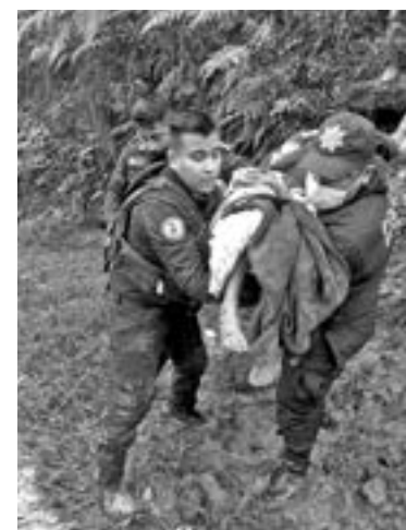
SEPULTA HURACÁN una familia en Xalapa