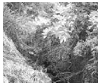
CON AYUDA el conductor pudo salir de la unidad.

barranco, a una distancia de entre 5 a 6 metros.