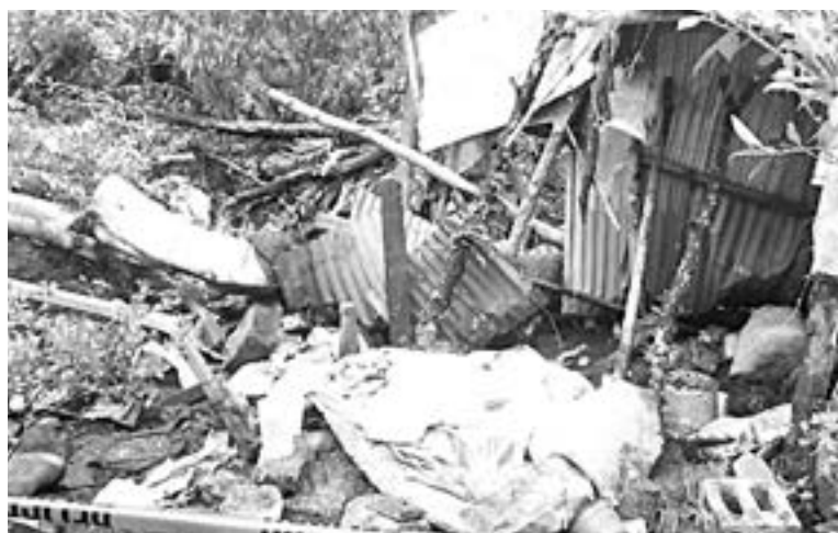
UNA PERSONA murió en el barrio Tepexicotle de Tenango de las Flores, Puebla.