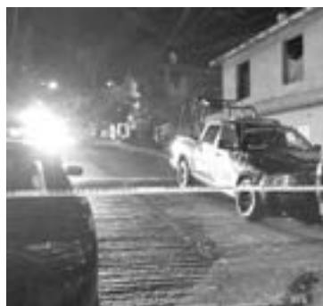
EL ATAQUE fue reportado a las 22:40 horas del viernes

El hombre y la mujer que fueron ejecutados anoche en la Colonia René Álvarez, en el norte de Monterrey, fueron identificados por las autoridades.