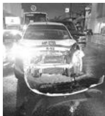
UN CARRO de la ruta Tampico- Altamira estuvo involucrado en la carambola.

El operador, que presuntamente estaba bajo los influjos de bebidas embriagantes, no lo pensó dos veces por lo que bajó del carro para huir del sitio, abandonando su unidad, ingresando a un domicilio cer-