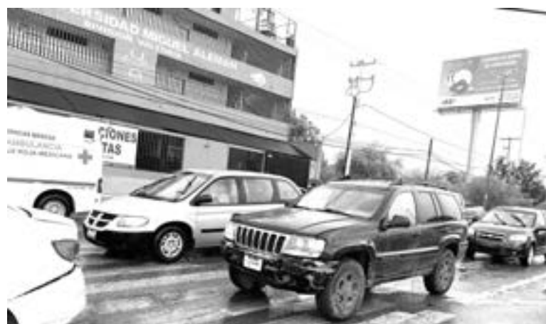
LA GRAND CHEROKEE le aventó la lámina al Aveo.

Debido al modelo del carro los daños materiales se estimaron en