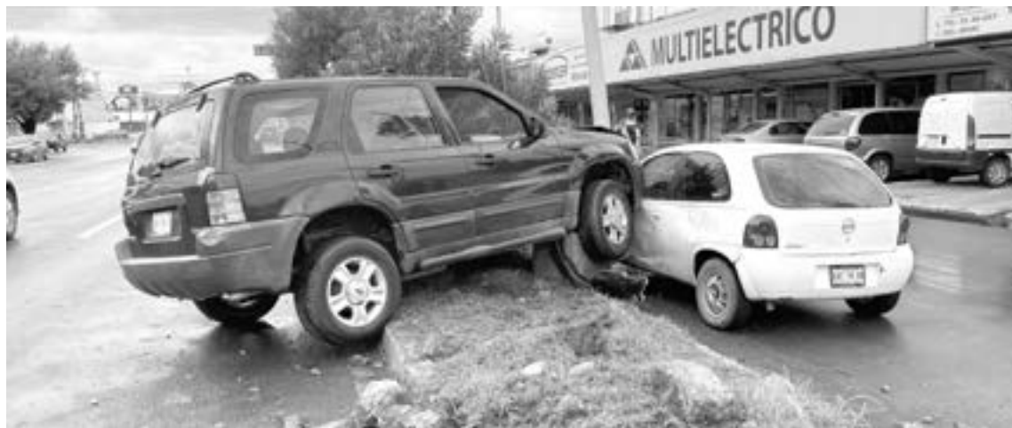
EN ESTA posición quedó la camioneta tras el percance.