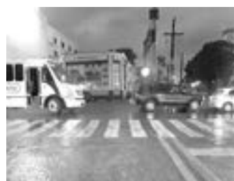
EL TRÁFICO quedó parado en las transitadas arterias.