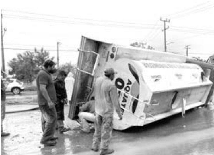
MILAGROSAMENTE NADIE resultó herido.