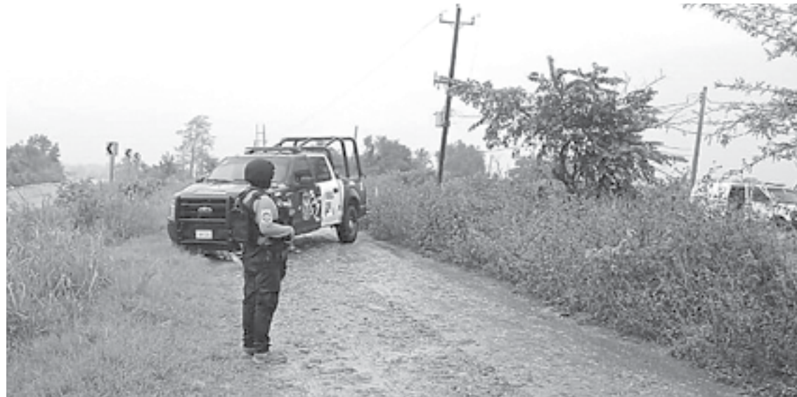
ACUDIERON AL LUGAR elementos de la policía.