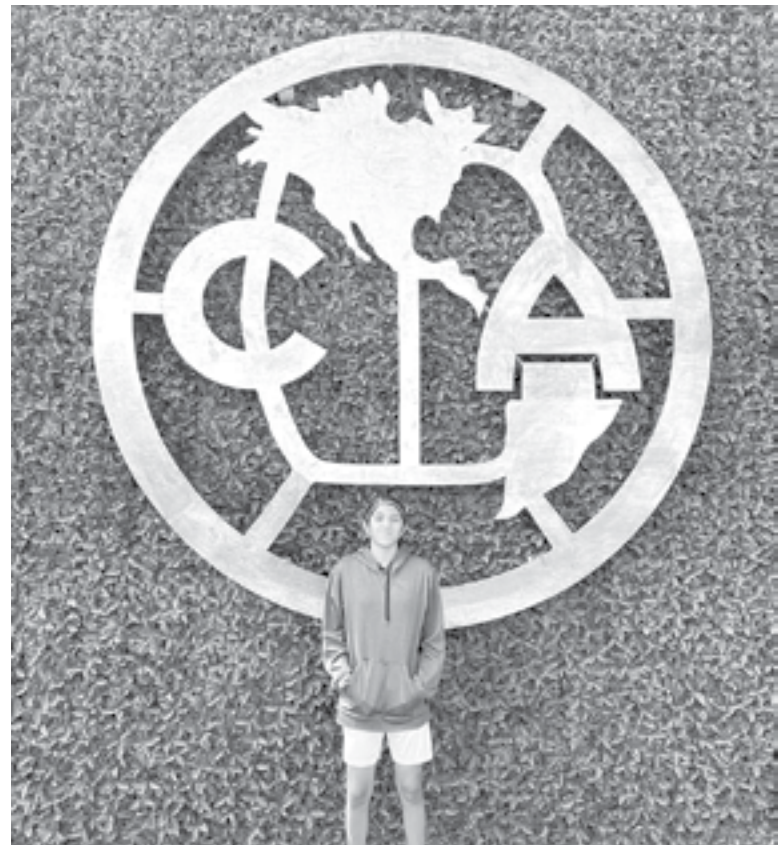
AHORA busca llegar a primera con las Águilas.

Pero eso no fue todo, ya que a raíz de ese torneo, visores de la Se-