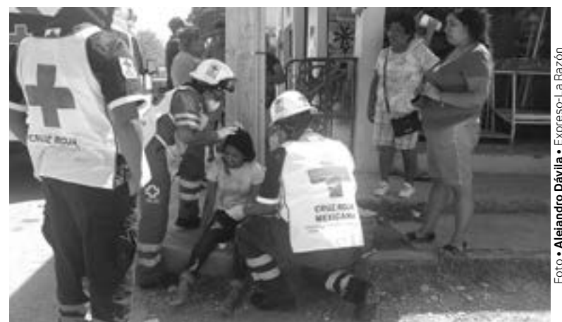
UN COCHE les cerró el paso y tras derrapar cayeron al asfalto.

En base a todas las versiones que recabaron los oficiales de tránsito establecieron que los lesionados viajaban en una motocicleta Italika que hacían desplazar de ponien-