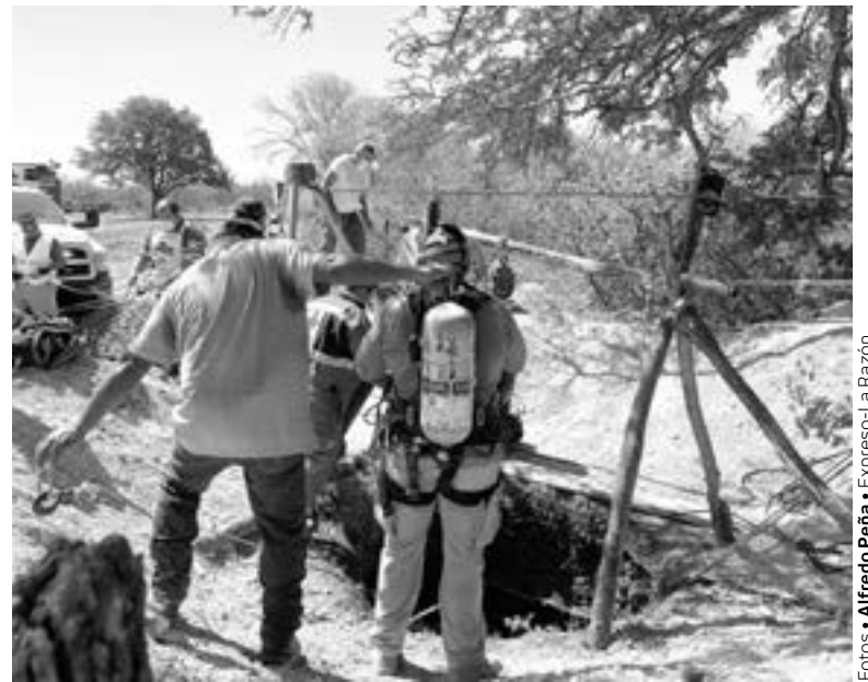
UN OFICIAL en día de descanso se presentó a salvar el día.