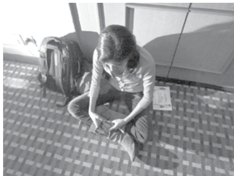
AUMENTAN DELITOS sexuales contra niñas y adolescentes.

SON LAS MÁS PEQUEÑAS, LAS BEBÉS Y MENORES DE HASTA 17 AÑOS, LAS QUE SE HAN LLEVADO LA PEOR PARTE, DURANTE LOS MESES QUE NO HAN ASISTIDO A CLASES