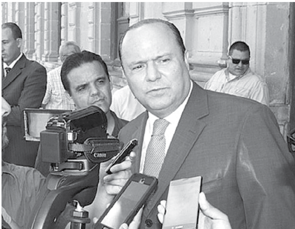
DEMANDA C. Duarte a Corral por 3 mmdp

Lo anterior, por los señalamientos que ha hecho Corral contra su antecesor en los últimos años.