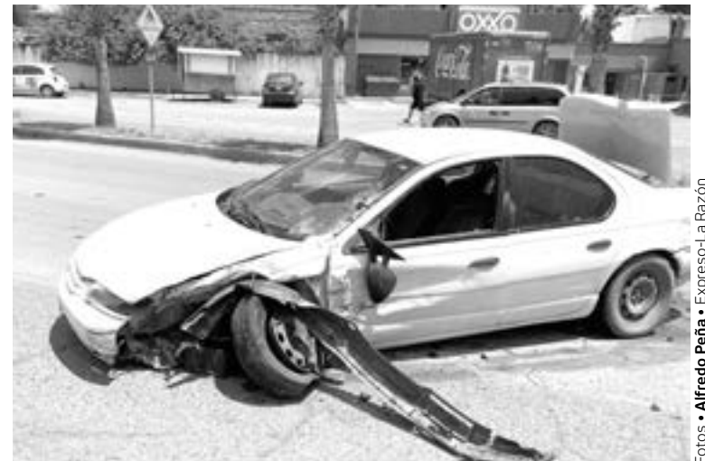
EL STRATUS circulaba correctamente por su carril.