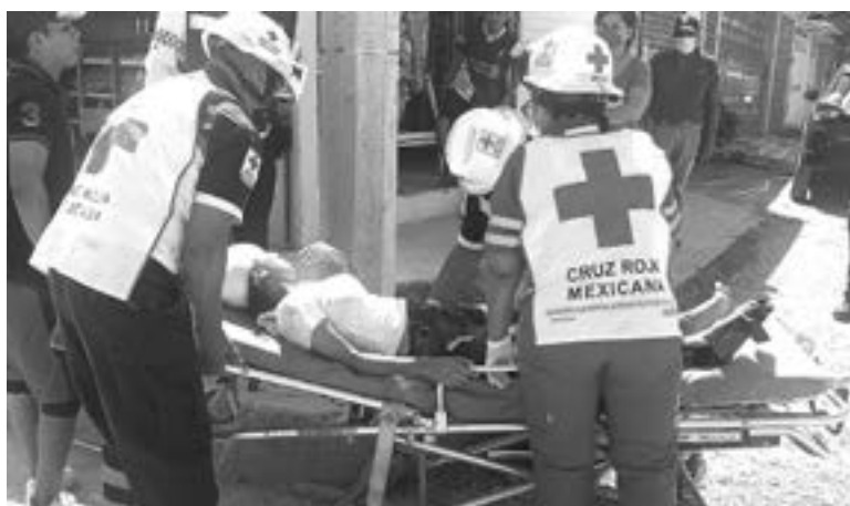
LA JOVEN presentaba heridas serias y fue llevada a un centro médico.

Paramédicos de la Cruz Roja, arribaron al sector para atender a