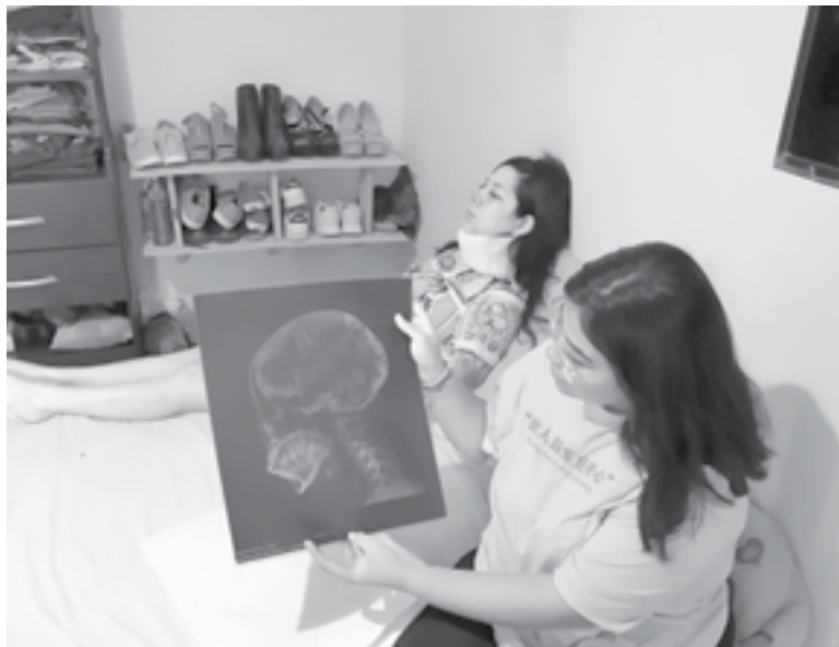
LA MUJER fue agredida por el suplente de regidor de Madero.