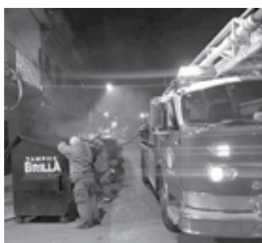
LOS "TRAGAHUMO" atacaron las llamas.

po de Bomberos cuyos elementos se trasladaron al sitio.