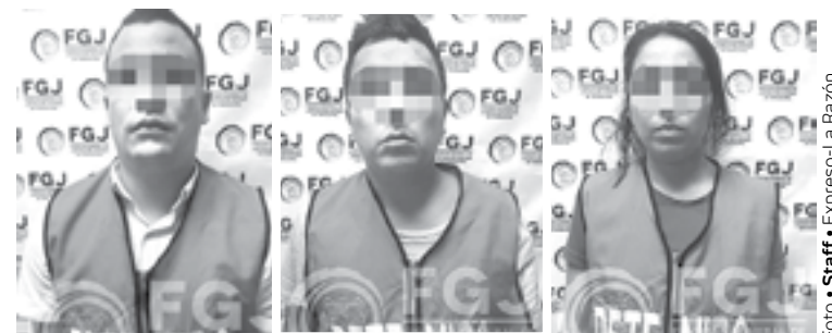
LOS DELINCUENTES fueron presentados este martes.

Asimismo, del desarrollo de las investigaciones se cuentan con datos que hacen posible la participación de los detenidos en diversos hechos relacionados con Robo a casa habitación registrados recientemente en la zona conurbada, por lo que continúan las indagatorias para corroborar su participación y realizar la imputación correspondiente.