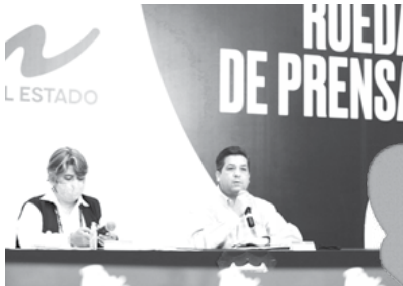
EL GOBERNADOR informó ayer la estrategia para garantizar la seguridad de los niños