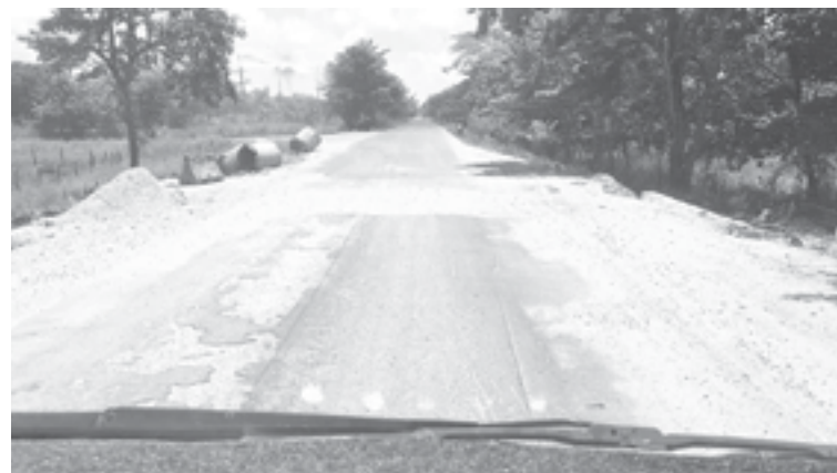
CONSTRUCTORAS ECHARON un “pellejito” de chapopote: lugareños.

Eso era lo bueno de no andar en helicóptero, dijo entonces, según la versión estenográfica. “Si no