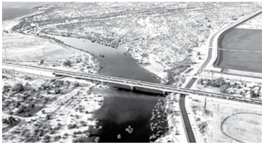
EL VALLE de Mexicali, el más afectado

El contenido de esta columna es responsabilidad exclusiva del columnista y no del periódico que la publica. http://indicadorpolitico.mx indicadorpolitico@gmail.com Canal YouTube: https://t.co/2cCgm1Sjgh