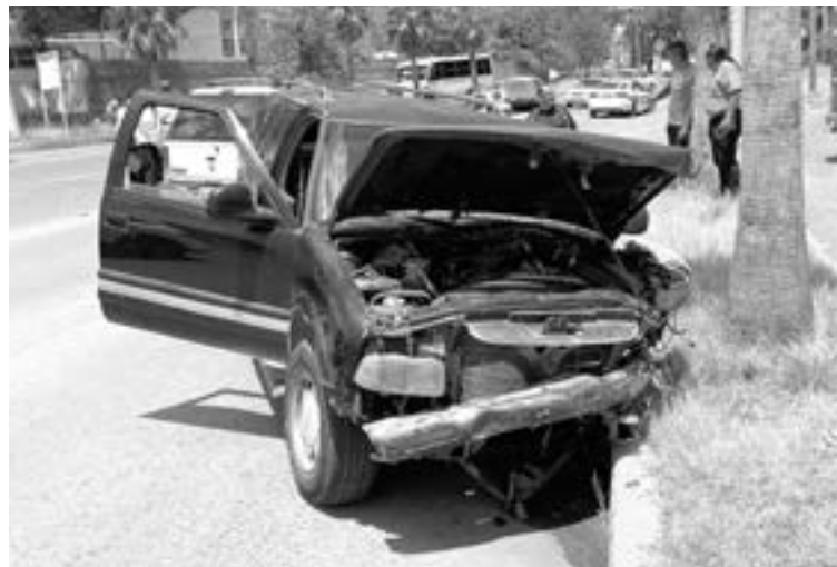
ESTA CAMIONETA fue responsabilizada del choque.