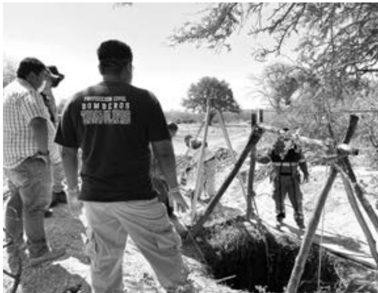
LOS ELEMENTOS de PC no portaban el equipo necesario para realizar la extracción.

LA FALTA DE EQUIPO PARA PODER EXTRAER A DON GUILLERMO DE UNA NORIA PROVOCÓ QUE LAS TAREAS DE RESCATE SE PROLONGARAN VARIAS HORAS, HASTA QUE UN OFICIAL FRANCO ACUDIÓ CON HERRAMIENTAS PROPIAS