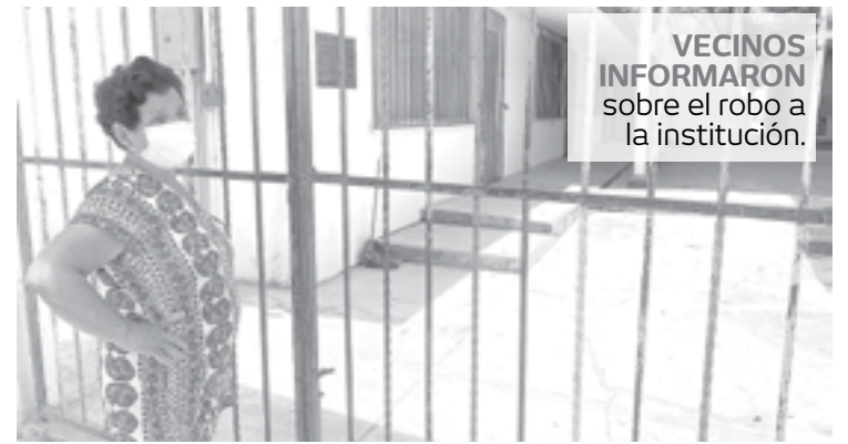
VECINOS INFORMARON sobre el robo a la institución.