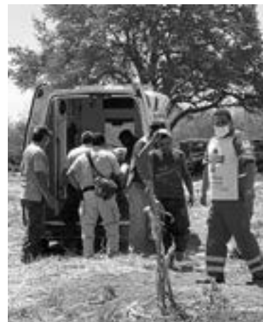
EL HOMBRE fue llevado de urgencia a un centro médico.

el fondo por lo que pidió la ayuda de los cuerpos de socorro.