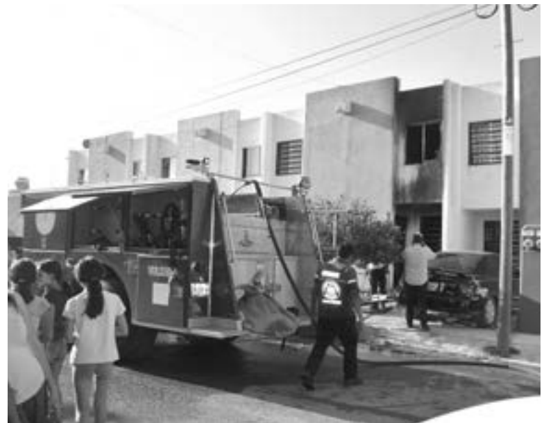
CUERPOS DE AUXILIO atendieron la emergencia.