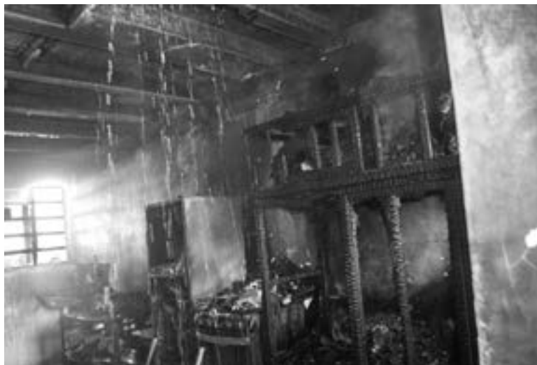
EL FUEGO acaba con la vivienda.