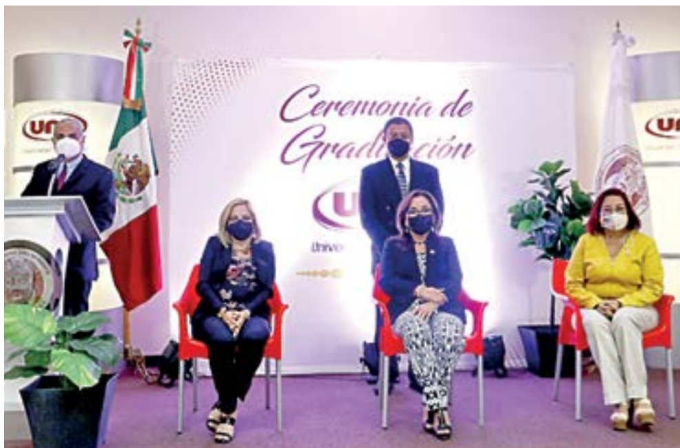
SE REALIZÓ la ceremonia virtual de graduación en la UNE.