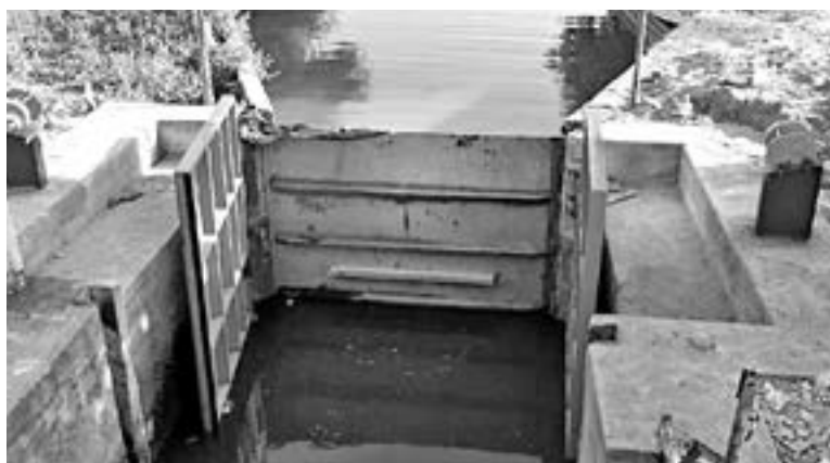
CON ESTO se busca evitar que se fugue el agua dulce y minimizar los estragos de las sequías.

el inicio de estas maniobras que buscan evitar que se fugue el agua dulce y minimizar los estragos que se viven cada año con la sequía, lo que llega a poner en riesgo el abasto de agua en la zona.