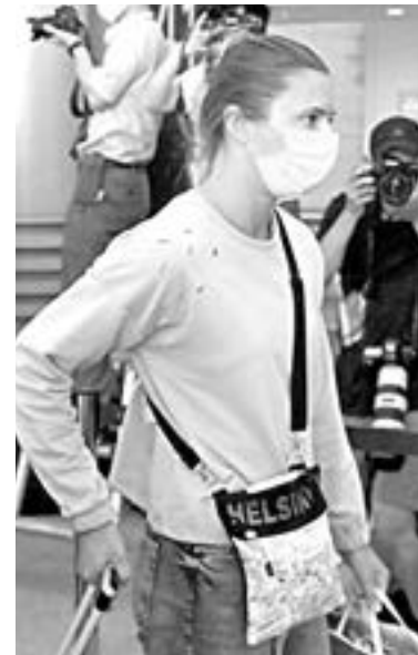
TSIMANOUSKAYA camina por la terminal 1 del aeropuerto japonés de Narita, en las afueras de Tokio, rumbo a Polonia.

La corredora, conocida por haber expresado su apoyo al movimiento popular contra el régimen de Alexandr Lukashenko, competía en los Juegos Olímpicos de Tokio y temía sufrir represalias al regresar a Bielorrusia, según explicó en videos y mensajes difundidos por las redes sociales.