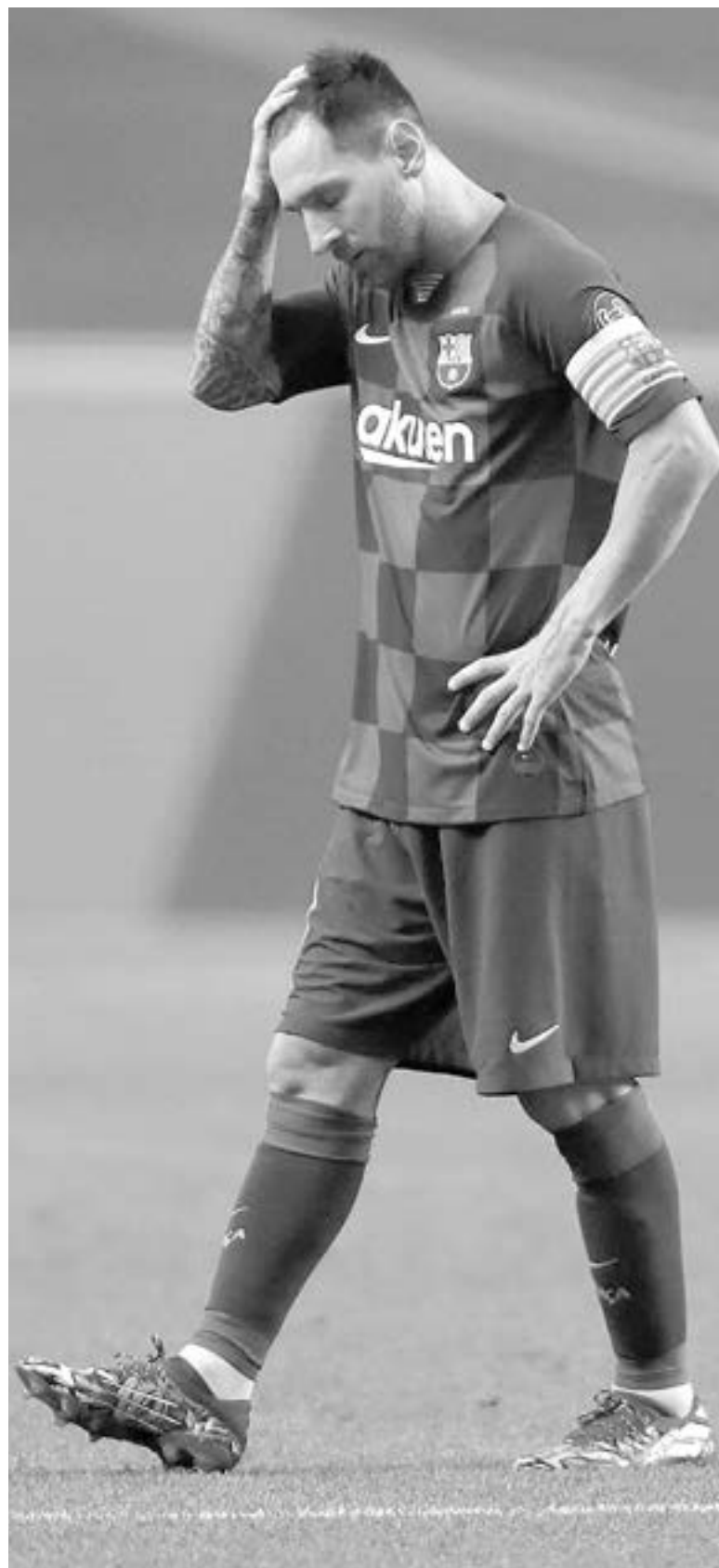
LIONEL MESSI apunta a ser jugador del PSG

Además de la información de SC, el entrenador Mauricio Po-