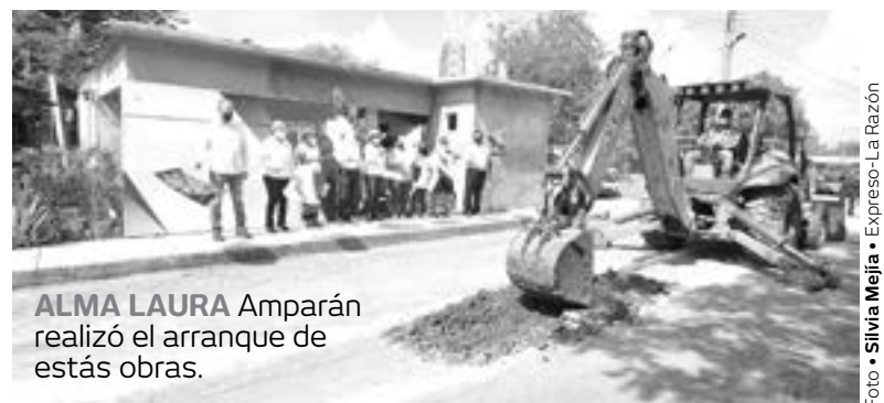
ALMA LAURA Amparán realizó el arranque de estas obras.

Continuando con las acciones que generan bienestar y progreso a Altamira, en Villa Cuauhtémoc se pavimentará a base de concreto hidráulico la calle Tamaulipas en-