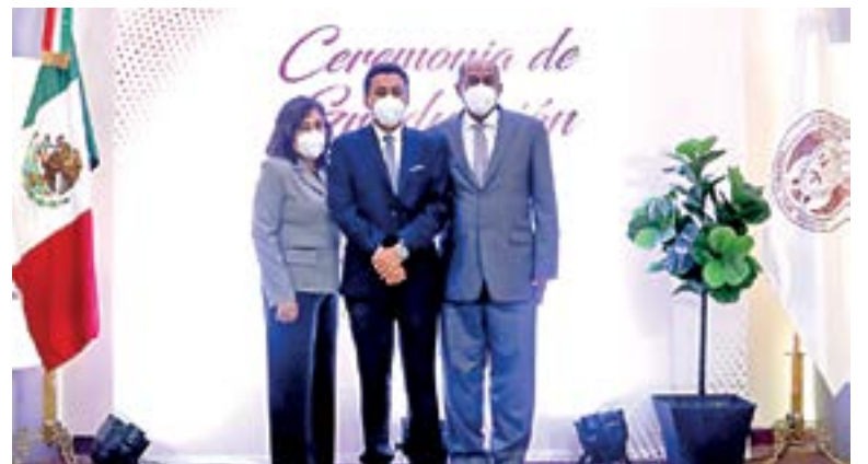
SE ENTREGARON reconocimientos a los mejores promedios.

DEL ÁREA DE PREPARATORIA se graduó la XXV generación.