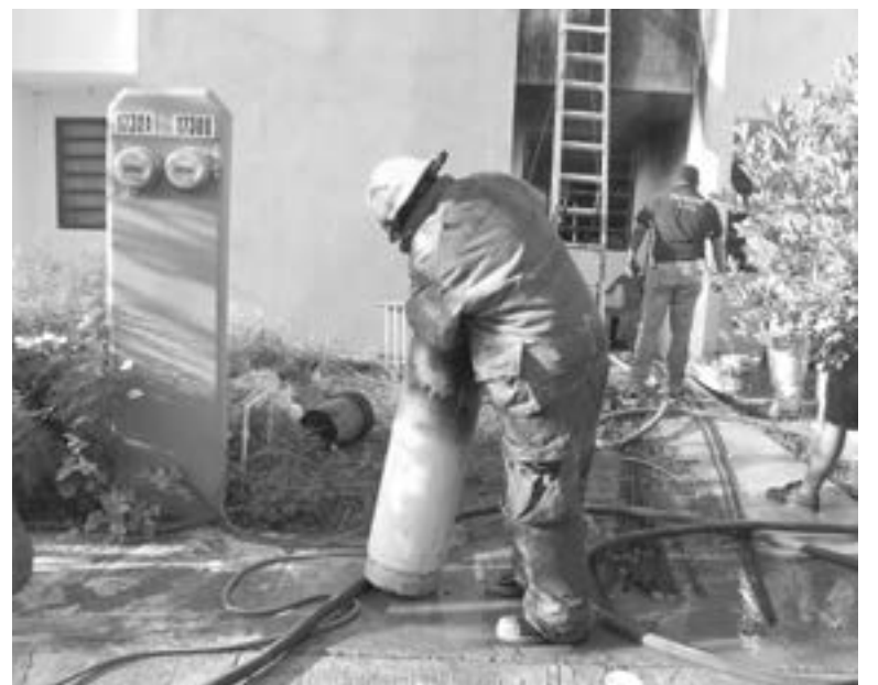
RESGUARDAN BOMBEROS el tanque de gas.