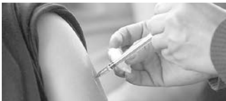
SERÁ LA PRÓXIMA SEMANA cuando se inicie la vacunación de 30 a 39 años.

recuerda que a la Secretaría de Salud le toca resguardarla, y la logística le toca a la área federal, una cuestión que se ha mantenido bajo esa coor-