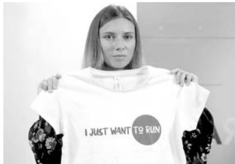
LOS ENTRENADORES fueron sacados de la Villa