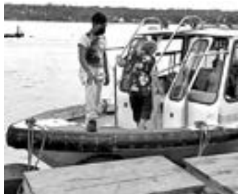
AUNQUE EL AUMENTO fue mínimo si afecta al bolsillo.