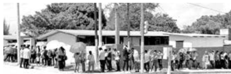
LARGAS FILAS se formaron durante este día.

por lo que se tuvo que considerar esta situación para tomar la decisión de subir el pasaje.