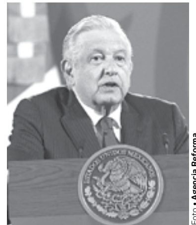
EL PRESIDENTE Andrés Manuel López Obrador