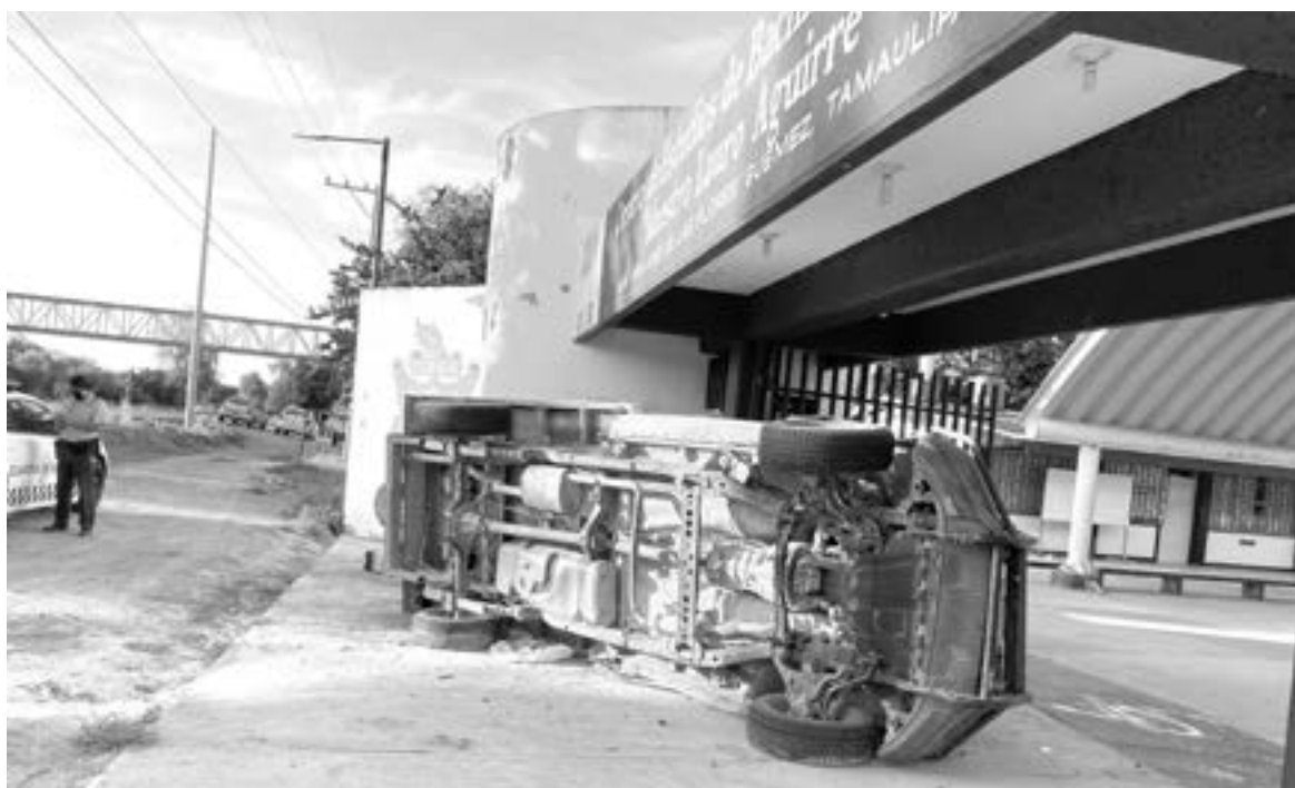
ASÍ QUEDÓ la camioneta luego del percance

El accidente fue reportado a las 18:00 horas en el kilómetro 18 de la carretera Monterrey pero previo