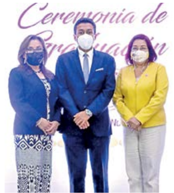
LA RECTORA y la vicerrectora estuvieron presentes en el evento.