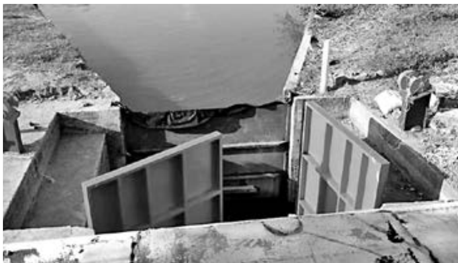
SE REALIZARÁ la primera fase de los trabajos de reparación.

El costo de esta primera fase es de 15 millones de pesos más el valor agregado, por lo que representa un avance importante para