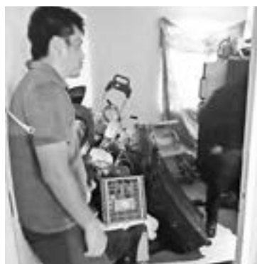
EL ESPOSO de la mujer evitó el fatídico desenlace.

MINUTOS FUERON NECESARIOS PARA CALMAR A LA MUJER