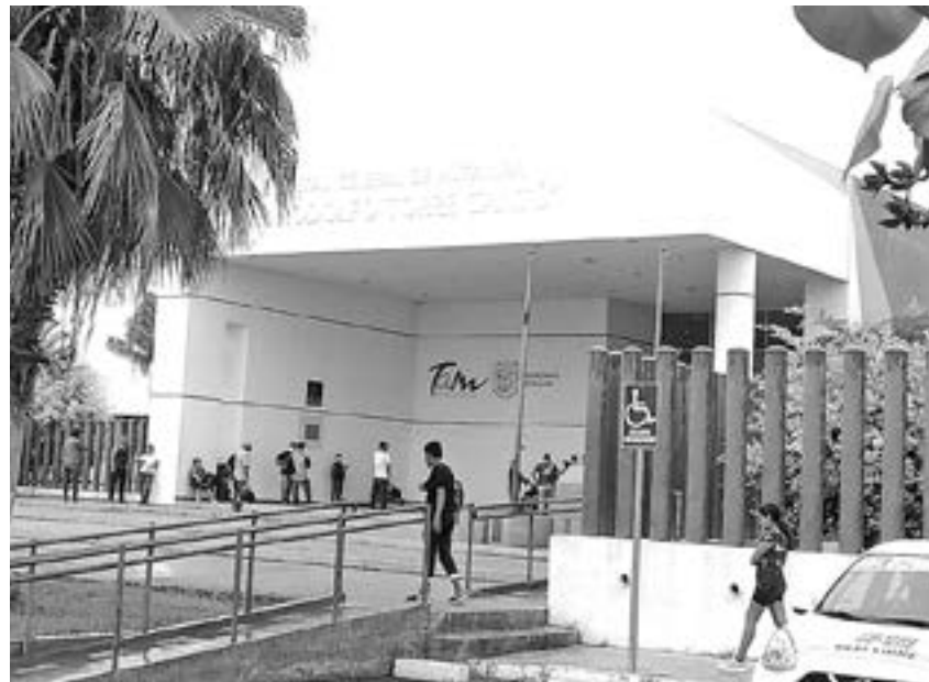
DENUNCIAN PRESUNTA negligencia médica en el Torre Cantú.

El padre afirmó que hay otra madre de familia que le sucedió lo mismo y que a su bebé también le hicieron lavado gástrico, pero ella no quiere darlo a conocer públicamente.