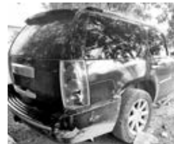
EN ESTA camioneta se desplazaban los civiles armados

Lo asegurado fue puesto a disposición de las autoridades correspondientes.