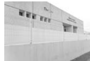
EL TRABAJADOR fue llevado al hospital.