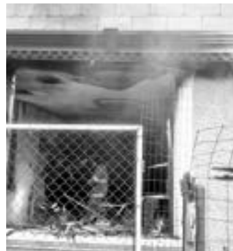
TODOS LOS muebles resultaron quemados.

9:30 HORAS DIO INICIO EL SINIESTRO EN EL DOMICILIO