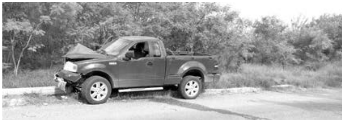
EL ACCIDENTE no dejó personas lesionadas.