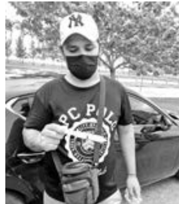
EL PADRE DE FAMILIA dio a conocer los hechos.