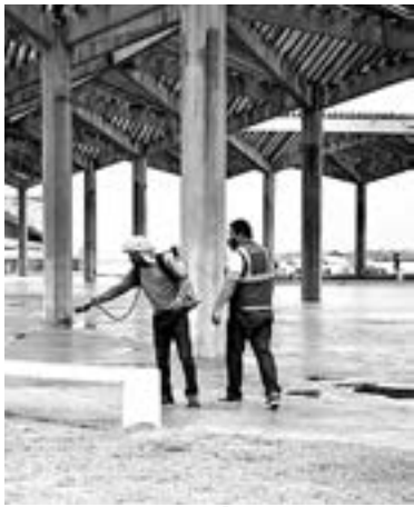
DESINFECTARÁN la playa Miramar.