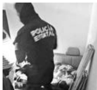
SE DIO aviso a las autoridades quienes tomaron nota de lo ocurrido.

lle San Fernando y San Jacinto, en el Fraccionamiento San Jacinto, en el municipio de Altamira.