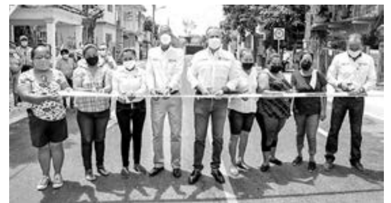
AVANZA PLAN de obra pública.

Esta colonia, cabe destacar, es uno de los sectores donde el Gobierno maderense mitigará al 100% el rezago en pavimentación. “Durante muchos años estuvo muy abandonada esta colonia, pero nos comprometimos con los maderenses y El Polvorín va a quedar pavimentado por completo. En mi gobierno no están solos”, aseguró Oseguera Kernion.