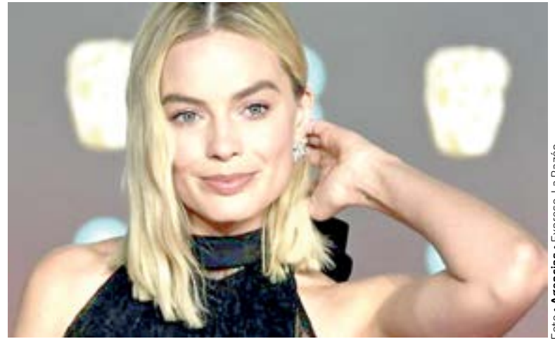
LA ACTRIZ se dijo emocionada de ser parte del proyecto.

Warner Bros. dio total libertad a Gunn para elegir al reparto de su filme, que no funciona como secuela de la cinta de 2016, pero pidió que Robbie estuviera en ella. La nueva versión ha apostado por un tono mucho más cómico.