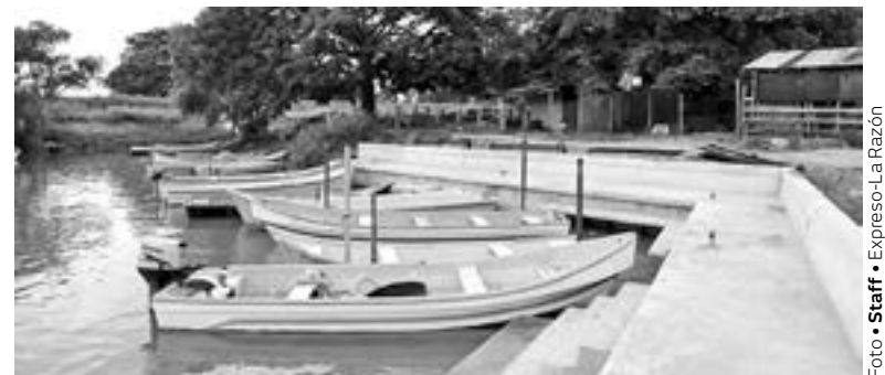
MEJORA LAS CONDICIONES del canal de navegación y atracaderos ubicado en el ex ejido Tancol.

Al efectuar la supervisión de los trabajos, el jefe de la comuna expli-