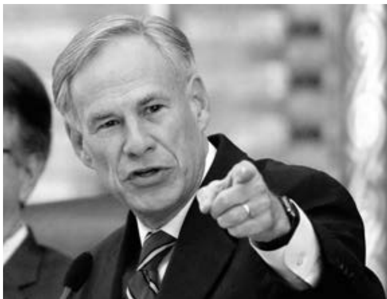
LA VARIABLE DELTA y la tercera ola, los pretextos para detener a más inmigrantes

Las fronteras, sin embargo, no están abiertas, como acusan, y el Gobierno expulsa a la mayoría de migrantes que arresta en la fron-