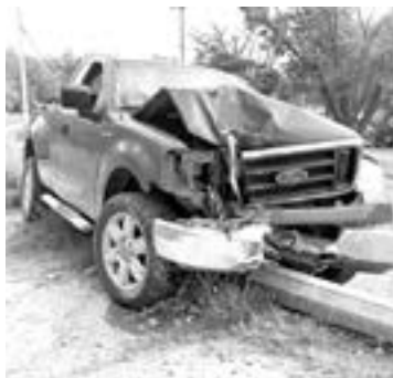
LA TROCA sufrió daños catastróficos

Por su parte, los elementos de la dirección de tránsito, indica-