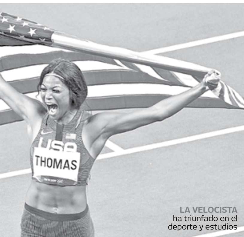
LA VELOCISTA ha triunfado en el deporte y estudios