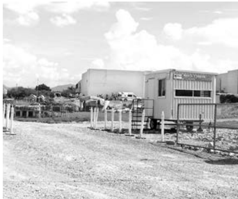
LOS HECHOS ocurrieron en la maquiladora Kemet.

Debido a que era una altura aproximada a los 10 metros, el hombre quedó inconsciente al golpear contra el suelo y fueron sus compañeros quienes llamaron de inmediato al 911.