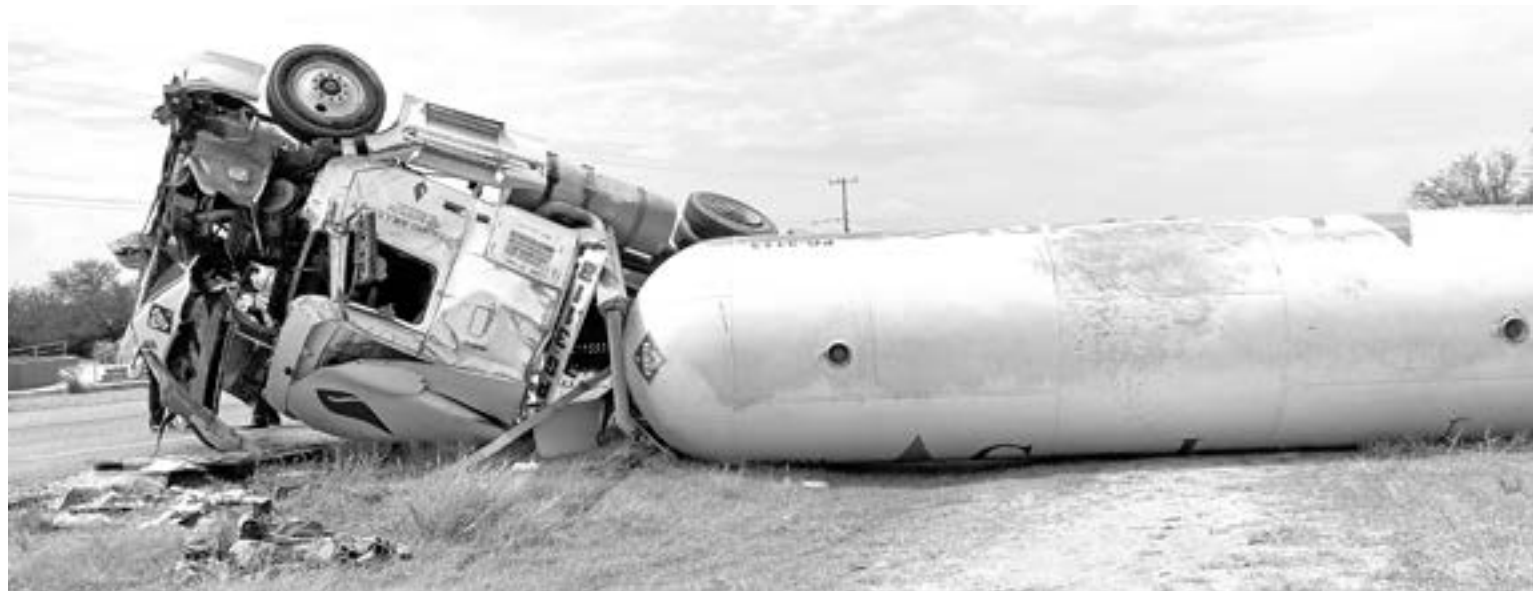
AFORTUNADAMENTE no ocurrió una fuga de gas.