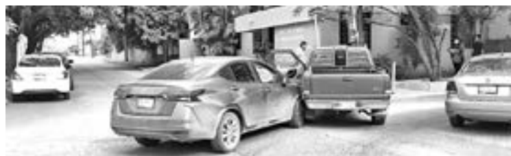
SE ESTIMA que los daños rondan los 30 mil pesos.