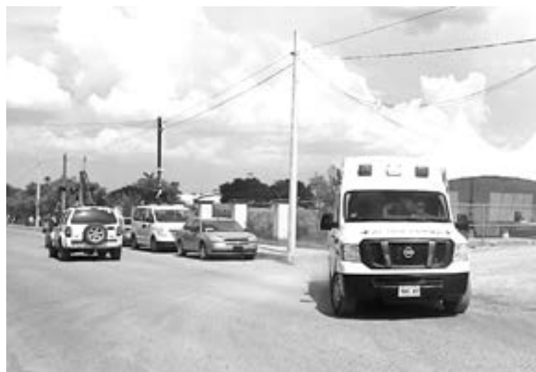
EL OBRERO fue llevado inmediatamente al hospital.