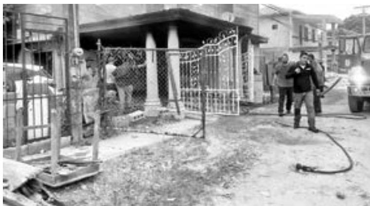
BOMBEROS acudieron al lugar de los hechos.

EL SINIESTRO DIO INICIO EN LA SALA PROPAGANDOSE RÁPIDAMENTE, UNO DE LOS HABITANTES REGISTRÓ UNA QUEMADURA EN EL BRAZO