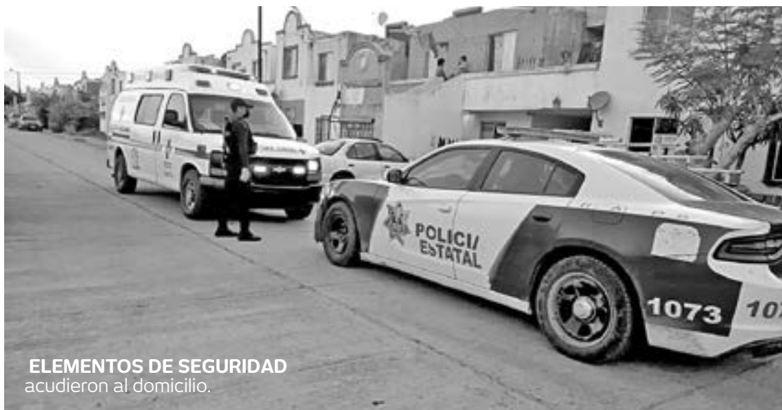
ELEMENTOS DE SEGURIDAD acudieron al domicilio.