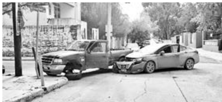
EL PERCANCE fue ocasionado por una omisión de alto.

El incidente por fortuna no dejó personas lesionadas, por lo que no fue necesaria la llegada de los cuerpos de emergencia