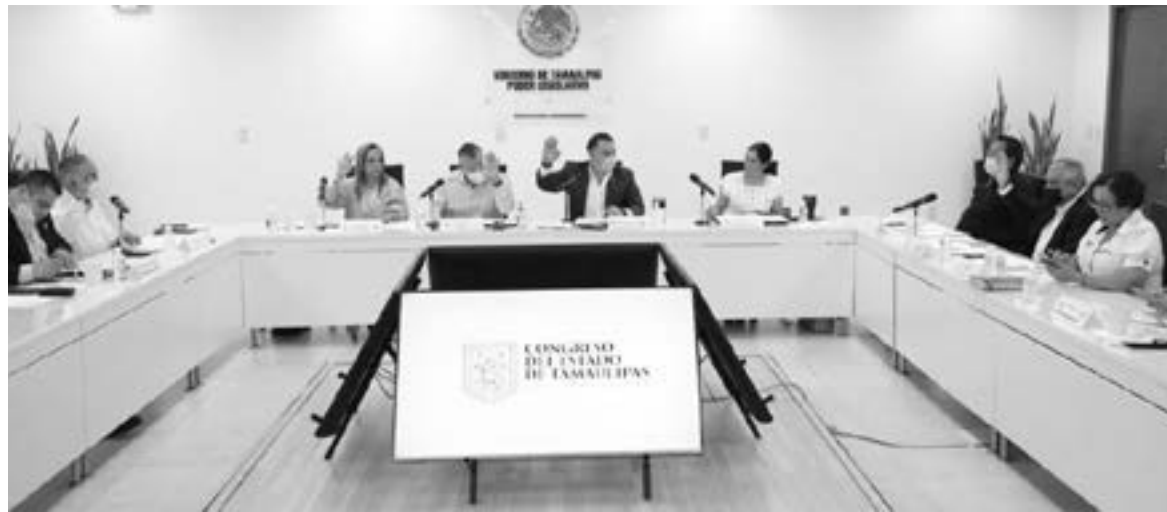
COMISIÓN PERMANENTE apura a la Corte para que se pronuncie sobre las controversias promovidas

PROPONE DIPUTADA reformar la ley, para evitar que legisladores brinquen a otro partido, por el que hayan sido propuestos