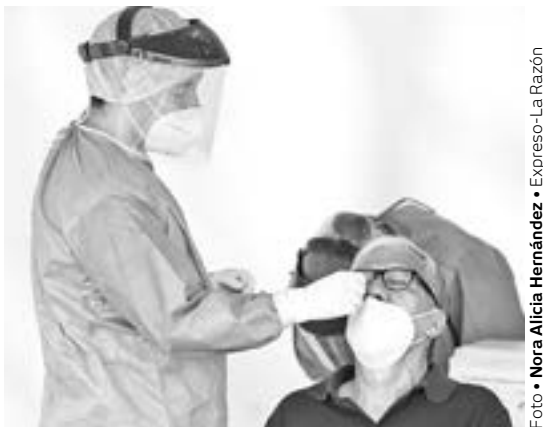
LA TERCERA ola ha disparado los contagios en Tamaulipas.