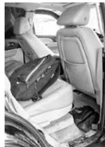
PARTE de lo asegurado.