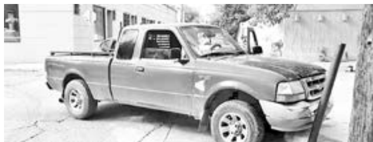
POR FORTUNA no se registraron personas lesionadas.