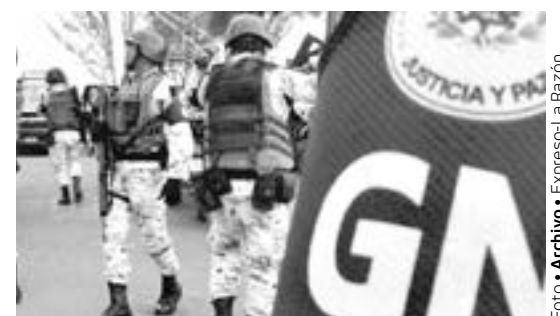
DEMANDAN MÁS presencia de Guardia Nacional, en las carreteras

Agregó que la obra de ampliación de carriles de acceso a la aduana Reynosa-Pharr, que permitirá desfogar el flujo del transporte en ambos sentidos de dicha