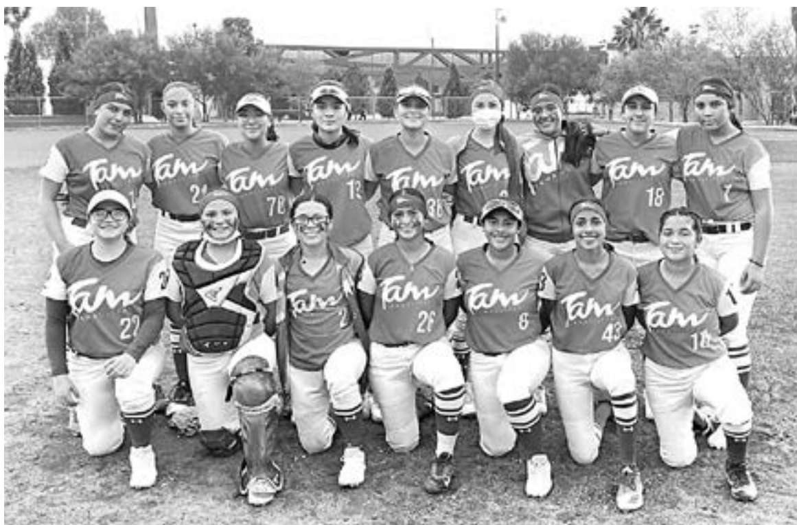
EL EQUIPO FEMENIL estuvo cerca de conseguir la medalla de oro

Las tamaulipecas intentaron desde la caja de bateo producir