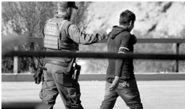
UNA MEDIDA impulsada por activistas

probablemente acogerán con satisfacción la mayor supervisión de una agencia que algunos han criticado por el uso excesivo de la fuerza y el