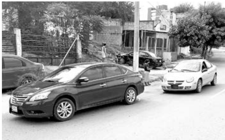
UNO de los curiosos terminó por chocar.

Manejaba una camioneta Ford Lobo color roja que desplazaba