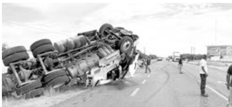
PRESUNTAMENTE el chofer conducía cansado.

En la carretera Matamoros, a la altura del kilómetro 35, justo en la entrada a la presa