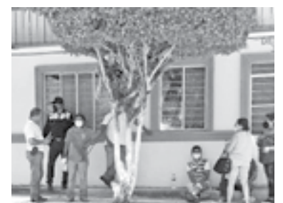
LOS JÓVENES terminaron con heridas abrasivas en brazos y piernas.

zaba por la calle A y luego de llegar a esa intersección, el conductor no respetó un alto marcado por un señalamiento por lo que al continuar su marcha impactó al motorista que iba por la calle 9.