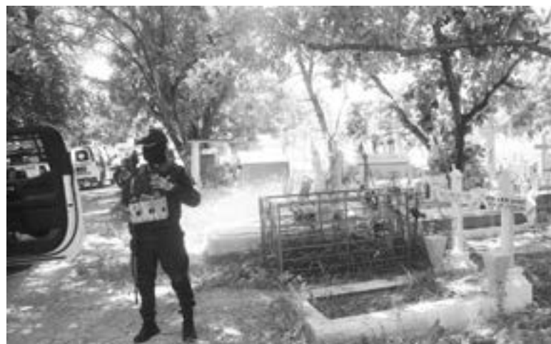
EL LUGAR fue acordonado por la Policía.

Al revisarlo notaron que ya no presentaba signos de vida.