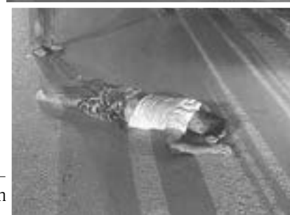
LOS HECHOS ocurrieron en el bulevar Dr. Rodolfo Torre Cantú.