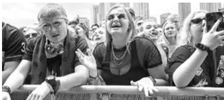
LA NORMALIDAD pese a la vacunas, se ve lejana

La semana pasada, The Washington Post reportó que, según funcionarios fronterizos, la Administración de Biden había detenido sus planes de frenar el Título 42 debido al incremento de cruces fronterizos y de casos de Covid en la frontera.