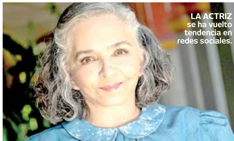
LA ACTRIZ se ha vuelto tendencia en redes sociales.

“A ver... ¿quién me va a cuidar?, si no coordino, ya no funciona, no voy a ser una carga para nadie”, comentó.