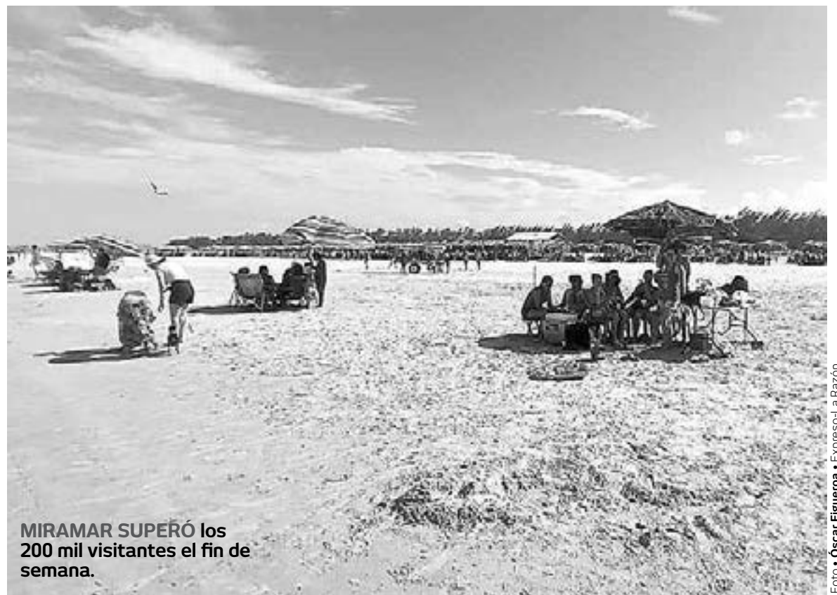
MIRAMAR SUPERÓ los 200 mil visitantes el fin de semana.

“El acumulado que tenemos en lo que va de las vacaciones de verano es de 221 mil visitantes, este fin de se-