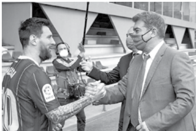
LIONEL MESSI aún no firma contrato con Barcelona

“Estamos en un proceso y sigo viendo muchas posibilidades. Leo quiere continuar en el Barça y tenemos que hacer todo lo posible para así sea” resolvió el presidente azulgrana, afirmando que desde