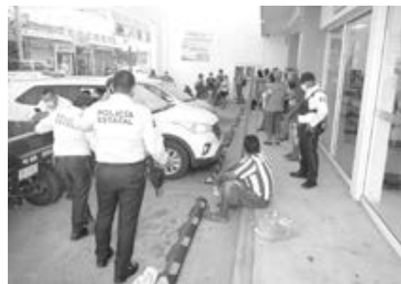
FUE DETENIDO luego de huir con productos de la farmacia

Momentos después, se le trasladó a las instalaciones de la PEA donde quedó recluso en la cárcel.