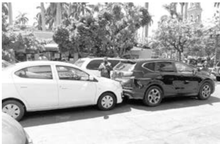
EL AUTO BLANCO terminó con la parte posterior abollada.

Fue el auto de la Nissan el que impactó por detrás al Dodge que a