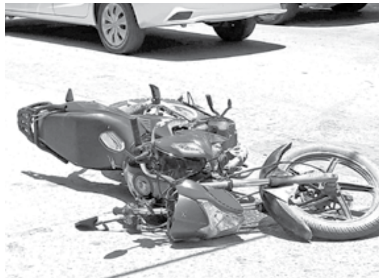
PARAMÉDICOS DE LA CRUZ ROJA valoraron el estado de salud de los lesionados.

AMBOS JÓVENES ACABARON EN EL SUELO CON GOLPES Y HERIDAS EN PIERNAS Y BRAZOS