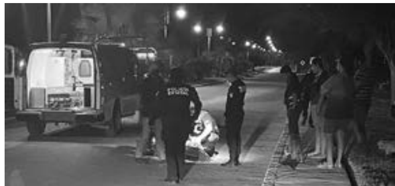
FUE AUXILIADO por paramédicos.

cido fue trasladado a un centro hospitalario para su atención médica.