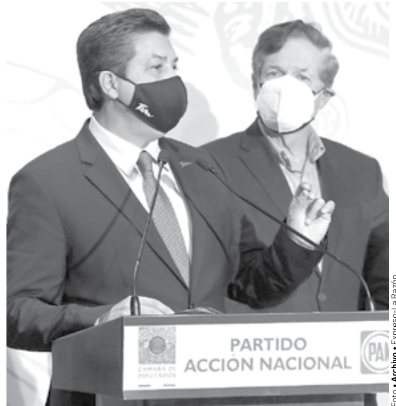
EL GOBERNADOR interpuso un recurso ante la SCJN

Algunas observaciones que los Ministros realizaron a la controversia promovida por el mandatario tamaulipeco, se señala las fechas en que conoció de la demanda y la controversia promovida por el mismo Congreso Local.