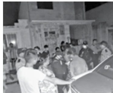
LA SITUACIÓN se salió de control y llegaron a los golpes.