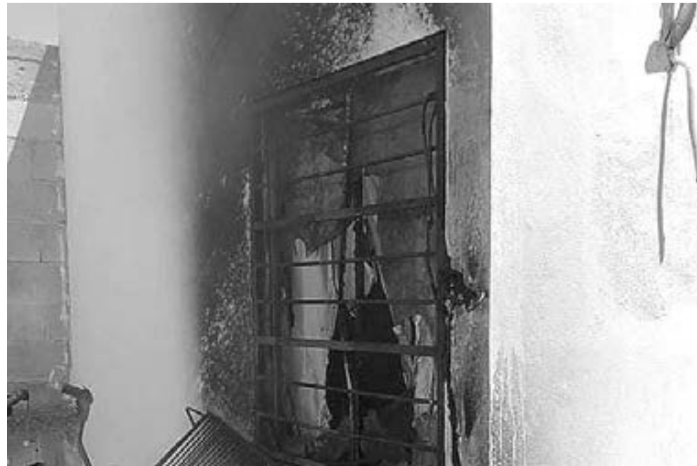
UNA DE LAS BOMBAS entró por una ventana.

LOS COCTELES AL ESTALLAR PROVOCARON QUE LA VIVIENDA SE INCENDIARA: EL FUEGO CONSUMIÓ LOS MUEBLES EN EL INTERIOR