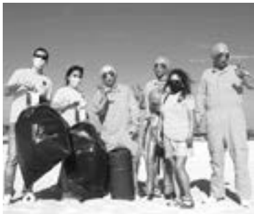
EXTRATERRESTRES RECOGIERON basura en Playa Miramar.