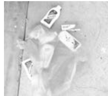
EL PRESUNTO delincuente llevaba artículos de higiene personal.

Por ello, le marcaron el alto para luego solicitar el apoyo de la Policía Estatal.