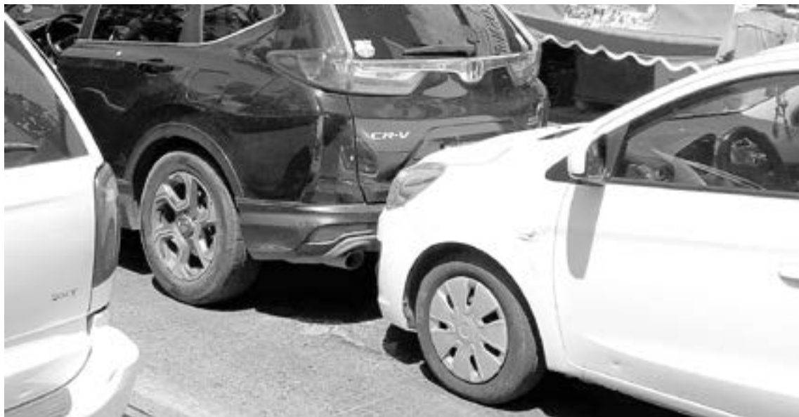
LA CAMIONETA recibió el golpe por detrás.