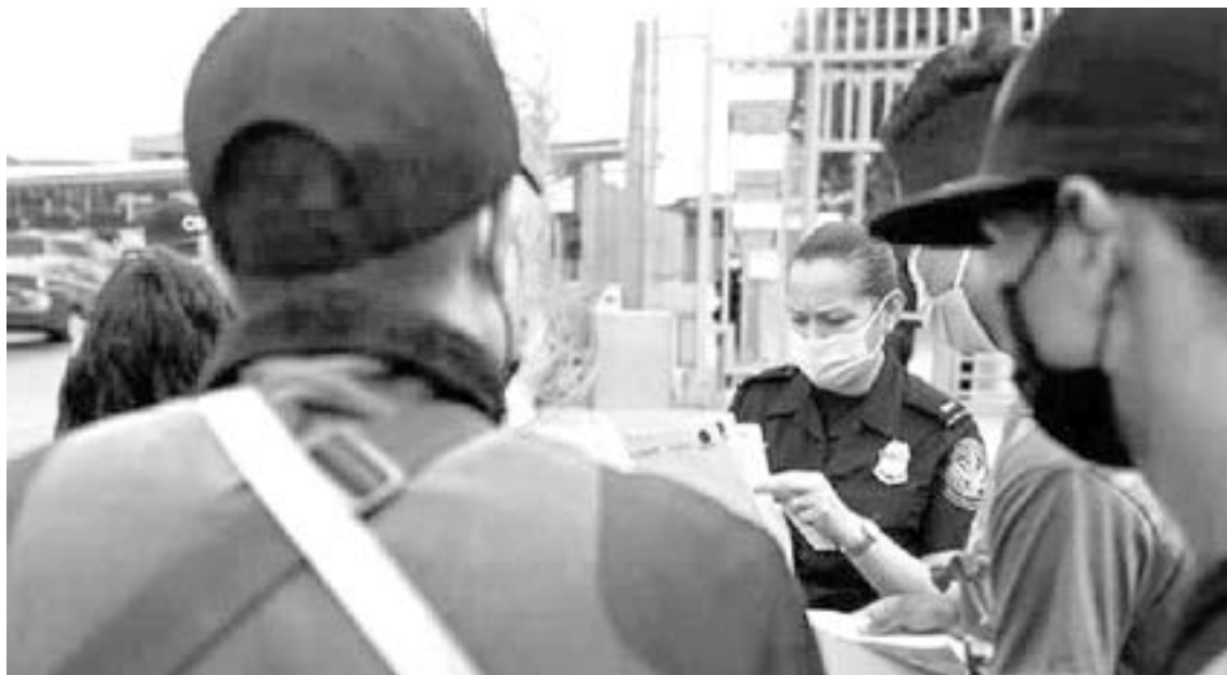
CONTINÚAN LAS EXPULSIONES ilegales en Estados Unidos

"Estamos profundamente decepcionados de que la administración de Biden haya abandonado