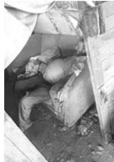
AUTORIDADES darán más de un mes para enviarlo a fosa común.

Sin embargo, el período podría alargarse lo necesario.