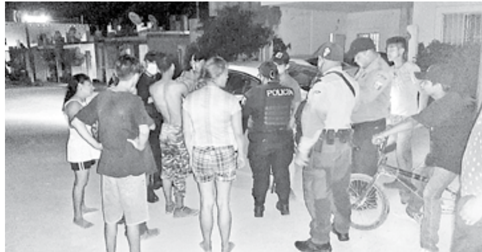
VELADORES Y POLICÍA ESTATAL tuvieron que intervenir para parar la pelea.

Fue necesaria la intervención de veladores así como de la Policía Estatal para calmar los