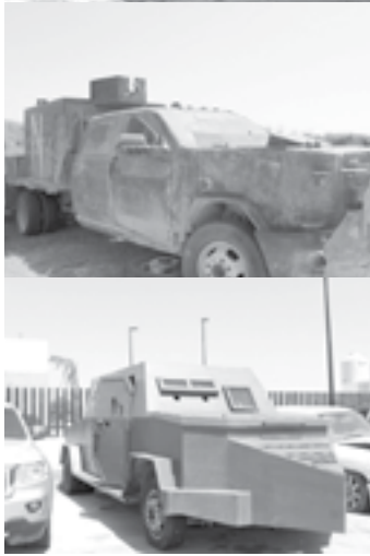
UNIDADES ASEGURADAS en operativos realizados por el GOPES

Este tipo de vehículos de combate recibieron el sobrenombre de monstruos después de un camión de basura blindado que fue encontrado cerca de Camargo en el año 2010. Normalmente cuentan con una cubierta con una placa gruesa de acero, además de contar con una torreta y arlete. Los cárteles también modifican la suspensión y palanca de velocidades, entre otros.