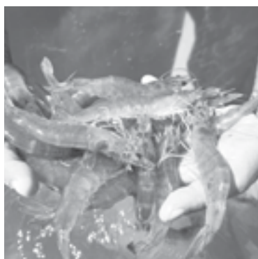
COMERCIANTES compran camarón de granja.