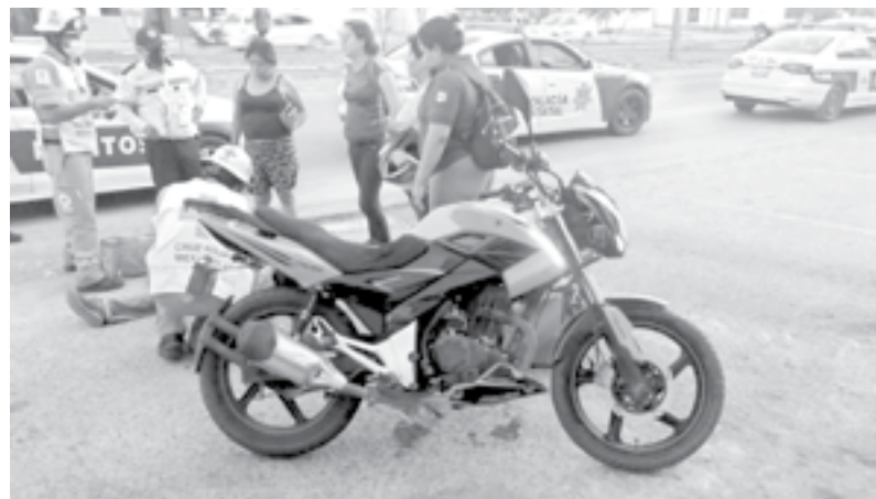
LA MOTO en la que viajaba.

Fue en ese momento que el repartidor se estrelló en el lado derecho del automóvil y luego rodo a la cinta asfáltica donde estuvo tendido hasta la llegada de la ambulancia.