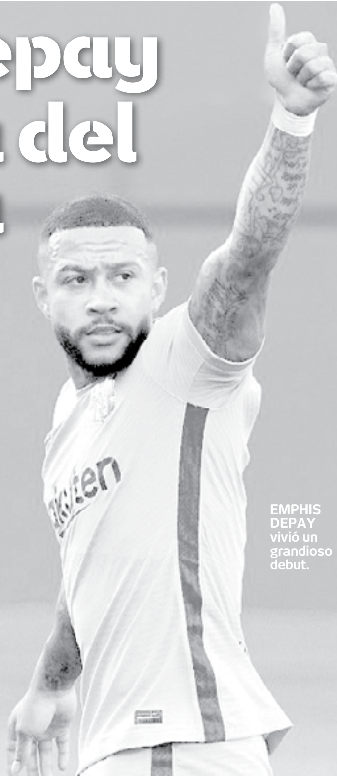
EMPHIS DEPAY vivió un grandioso debut.

Los últimos compases del primer tiempo estuvieron marcados por los cambios,