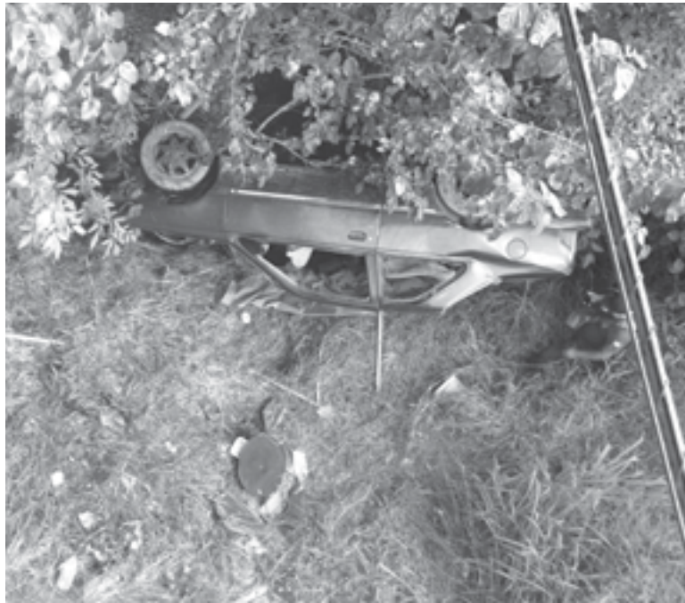
EN EL LECHO del río quedó el auto y abajo, el hombre sin vida.