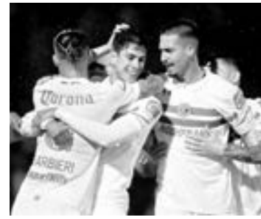
UN TRIUNFO a domicilio fue el que tuvo el Toluca.

"El partido contra el Everton nos sirve mucho. Primero analizamos la prestigiosa invitación que nos sirve para darle participación a los jugadores que no han estado al cien por ciento. Será un partido de gran jerarquía para que el equipo vuelva a estar en la boca de todos como debe estar", finalizó.