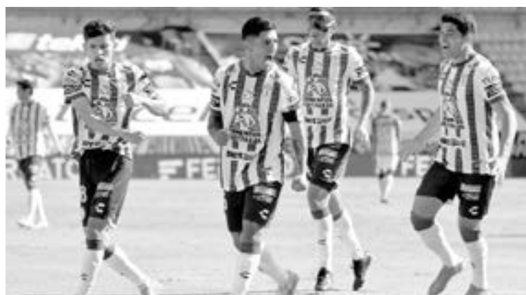
GRAN JUBILO fue el que vivieron los jugadores.

Tanto los Tuzos como "La Fiera" buscaron por diversos medios tomar la ventaja en el encuentro, la imprecisión de ambas delanteras negó el parcial triunfo a sus equi-