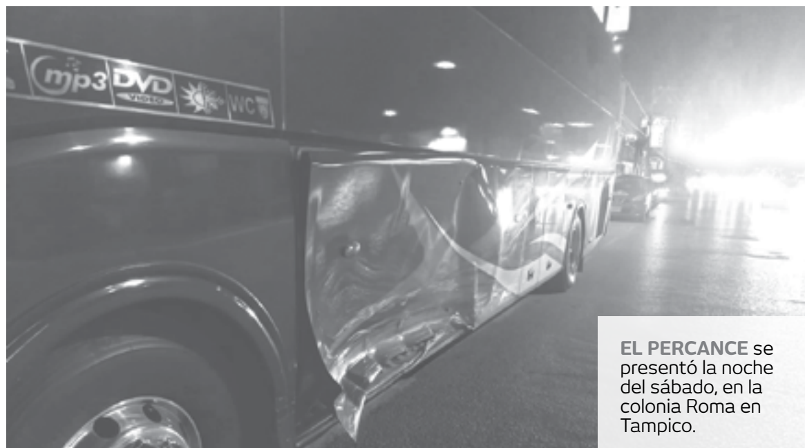
EL PERCANCE se presentó la noche del sábado, en la colonia Roma en Tampico.

El automóvil aparentemente se desplazaba por los carriles de sur a norte y al llegar a ese cruce, dio vuelta a la derecha para intentar incorporarse a los carriles de norte a sur pe-