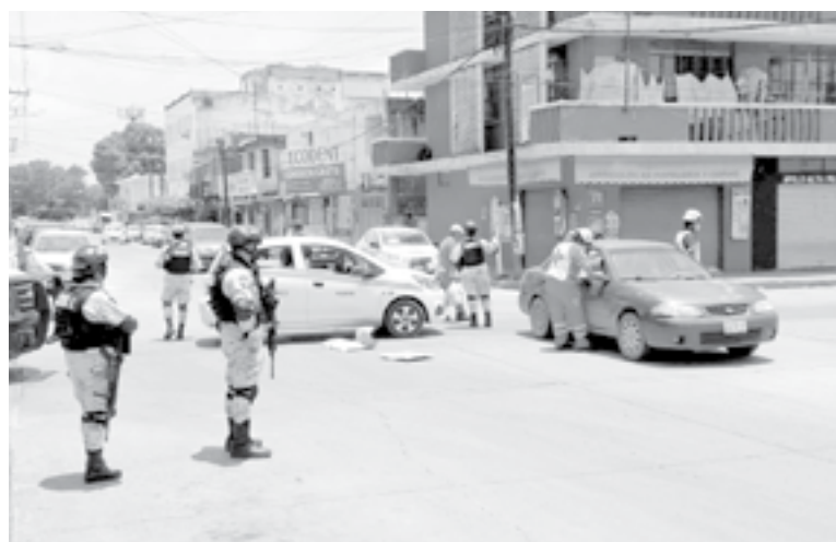
IGNORÓ EL ALTO marcado por un señalamiento.