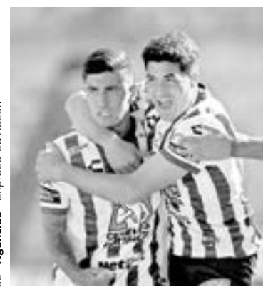
LOGRARON SU primer triunfo en el Apertura 2021.

estratega uruguayo Paulo Pezzolano debutó en la Liga MX a los refuerzos Nicolás Ibáñez, Avilés Hur-