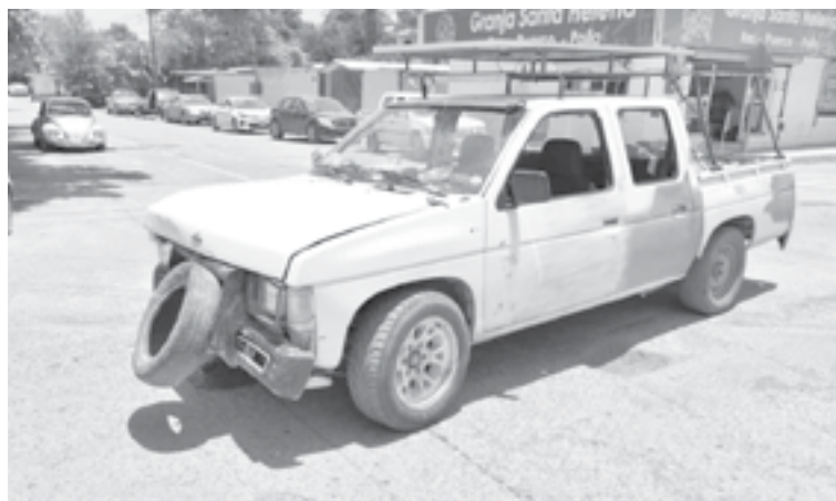
LA LLANTA ayudó a amortiguar el golpe.