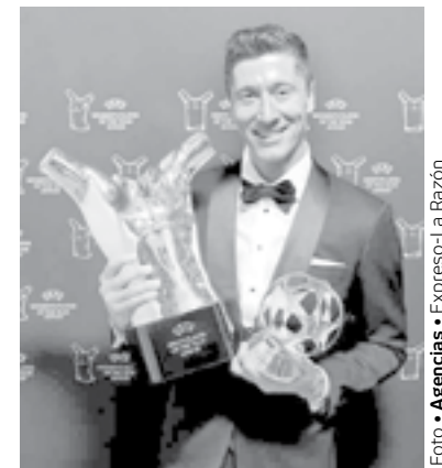
EL DELANTERO del Bayern de Múnich fue premiado.

El polaco marcó 41 goles en 29 partidos de Bundesliga, a pesar de una ausencia de tres semanas en marzo por una lesión en una rodilla.