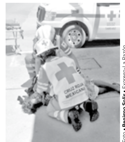
LA MUJER al parecer sufrió un ataque epiléptico.

Se encargaron de la vialidad y de acordonar el área, elementos de Tránsito del municipio porteuño.