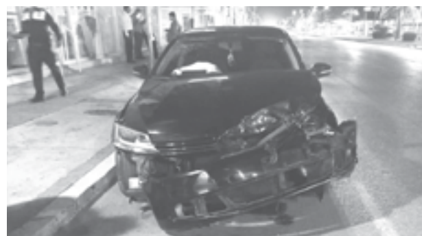
EL JETTA color negro le pegó al bus turístico.

ro al hacerlo se estrelló con fuerza en el costado izquierdo del bus.