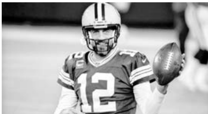
AARON RODGERS pertenece a Green Bay Packers.

El equipo local aprovechó el descontrol del lanzador derrotado Elih Villanueva (0-2) para fabricar su media decena de carreras desde el primer episodio.