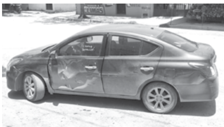
EL VERSA recibió el golpe en de lleno.

Los hechos se registraron minutos antes de las 2 de la tarde, en el 27 Matamoros de la Colonia Héroe de Nacozari. Cabe citar que el accidente no dejó personas lesionadas, por lo que no fue necesaria la pre-