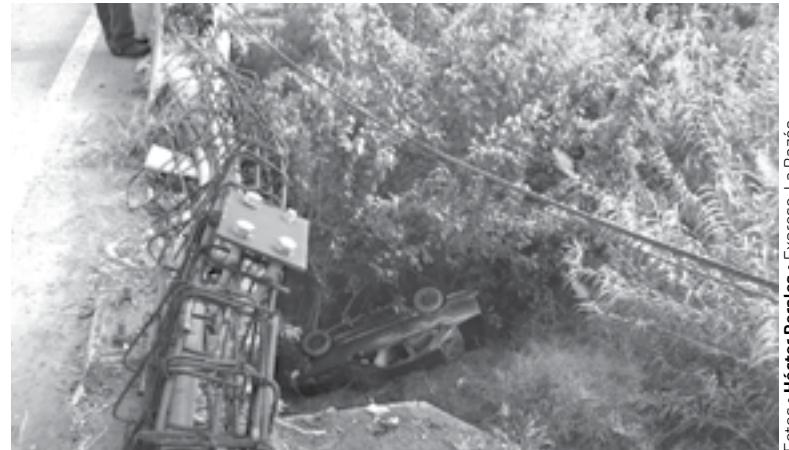
IMPACTÓ en estas varillas y se proyectó al vacío.