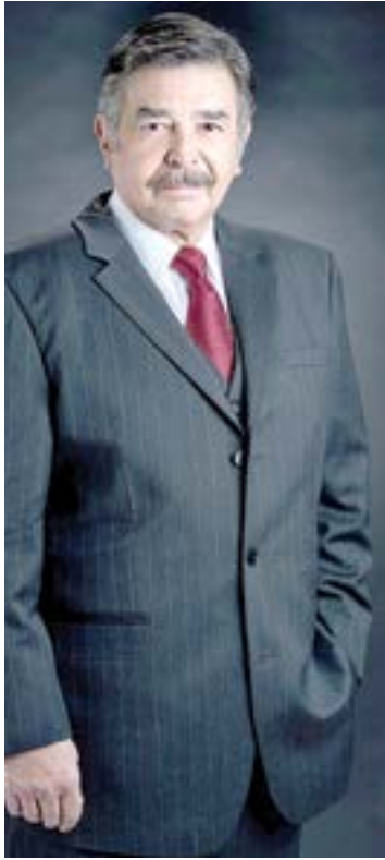
JORGE ORTIZ de Pinedo, productor y comediante.

"La televisión y el progreso son tan veloces que todo lo que yo hice en los años 80 ya se ve viejo, el video (de Dr. Cándido Pérez) es