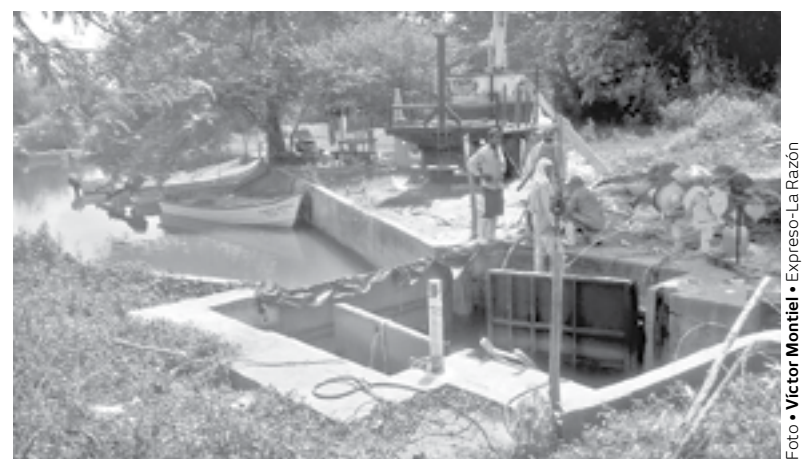
REPARAN OPERACIÓN DE COMPUERTAS y mejoran control del flujo de agua.

Lo anterior dependiendo de las necesidades que haya esto con los aumentos del nivel y el control de los flujos de corriente para no afectar la actividad de los pescadores.