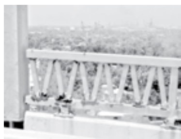
HABRÁ CONSTANTES cierres de carril las siguientes semanas.

Por tal motivo admiten que el panorama se ve complicado ya que la situación de la pandemia ha ido empeorando y han aumentado los contagios tanto en el sur de Tamaulipas como en el norte de Veracruz lo grave es que los costos de renta servicios e insumos siguen al alza y tienen que regresar importantes sacrificios para poder cubrirlos.