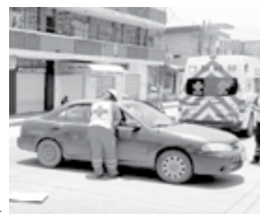
PARAMÉDICOS DE CRUZ ROJA lo atendieron en el interior de un vehículo.

Debido al golpazo, el motorista ya no pudo levantarse por lo que fue auxiliado por varias personas que se pelearon del hecho.