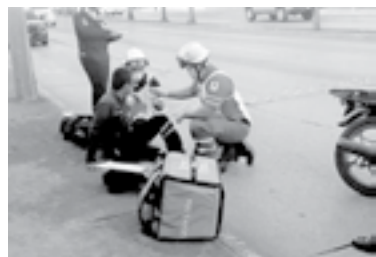
EL MOTORISTA terminó adolorido tras golpearse contra el pavimento.

Por fortuna, no fue necesario su traslado a un hospital ya que las lesiones no eran de gravedad.