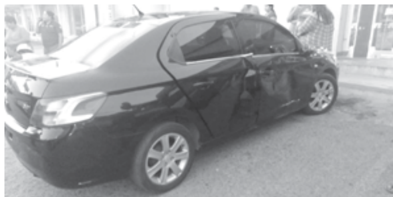
EL VEHÍCULO contra el que chocó.