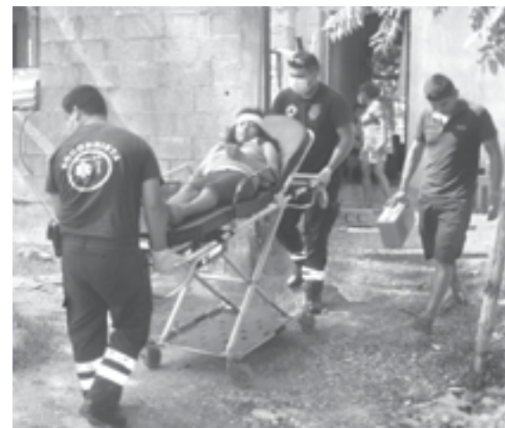
LA TRASLADARON a un hospital.

ta que presentaba una hemorragia pidieron ayuda a los vecinos y estos a su vez hicieron lo mismo al 911.