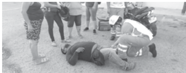
EL MOTOCICLISTA quedó tendido en el pavimento.