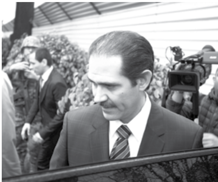
GUILLERMO PADRÉS Elías, ex gobernador de Sonora.

Al no ubicar a Padrés en su domicilio, el SAT notificó por estrados los mandamientos de ejecución, y según el Código Fiscal de la Federación, puede proceder a embargar cuentas bancarias, inmuebles o negociaciones,