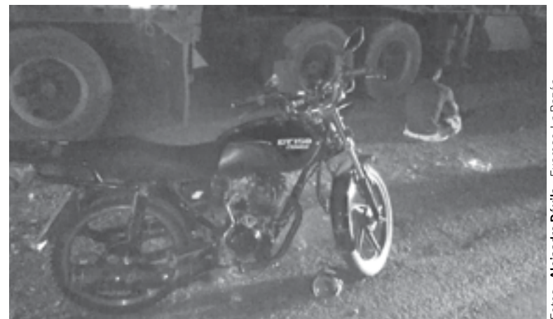
LA MOTO que conducía.

persona explico que venía del Fraccionamiento Marte R. Gómez, donde estuvo viendo un partido de fútbol.