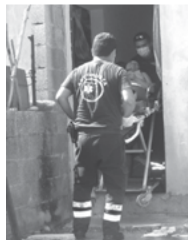
FUE AUXILIADA por los paramédicos de bomberos.

DE ACUERDO CON PARAMÉDICOS LA AFECTADA PRESENTABA UNA HERIDA EN LA CABEZA DE APROXIMADAMENTE DOS CENTÍMETROS Y UNA MÁS EN LA BARBILLA