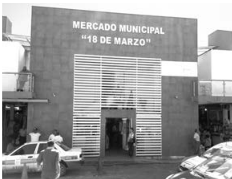
COMERCIANTES SOLICITAN a clientes seguir con los protocolos de salud.

“Los casos se han incrementado, pero no en la gente grande, sino en la joven, tuvimos en la semana de 10 a 12 casos sospechosos, vinieron a la consulta por la sintomatología y los canalizamos al triage respiratorio”.