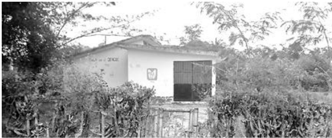
LA FALTA de personal complica la atención médica en el campo.

LA SITUACIÓN ES MÁS CRÍTICA EN LA ZONA FRONTERIZA, DONDE PADECEN POR LA FALTA DE MÉDICOS, LO QUE DEJA SIN SERVICIOS DE SALUD A LOS HABITANTES DEL CAMPO