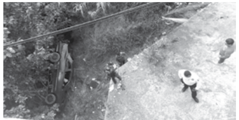
AUTORIDADES constataron el deceso del conductor.

so, elementos estatales de tramos carreteros acordonaron el área y dieron aviso al personal de la unidad general de investigación para que se encarguen de dar fe de los