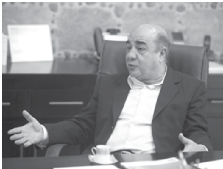
JESÚS MURILLO KARAM, ex Procurador General de la República.