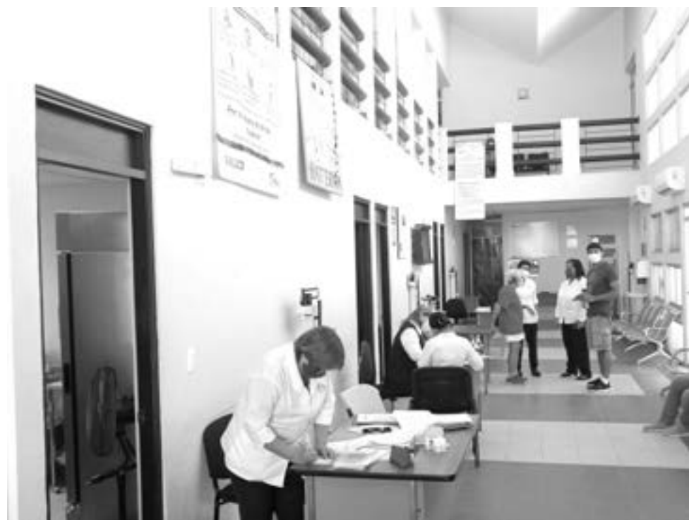
HASTA 12 jóvenes acuden al área triage del Centro de Salud.