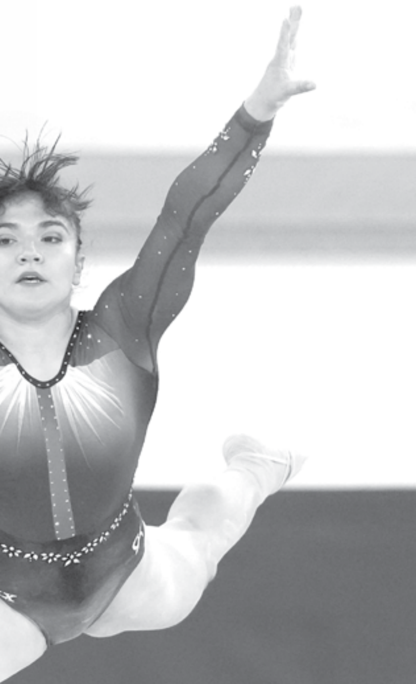
ALEXA asegura que competirá sin presión por las medallas