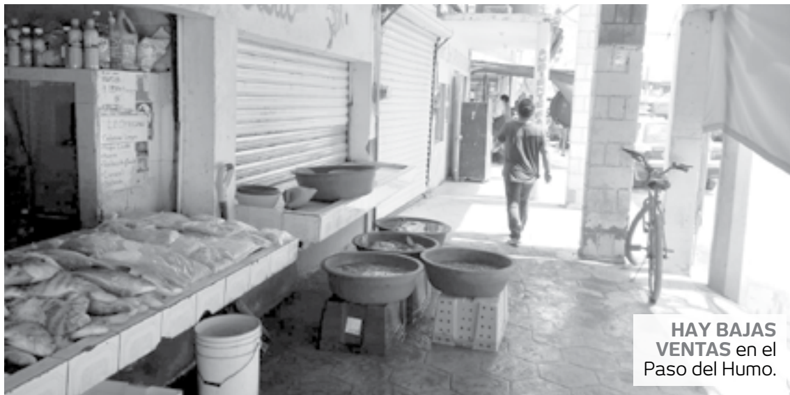
HAY BAJAS VENTAS en el Paso del Humo.