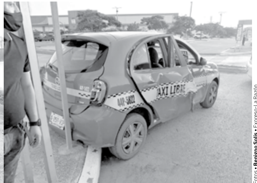
COLISIONARON EN EL SITIO una camioneta Ford F 150 blanca y un Nissan March habilitado como taxi.