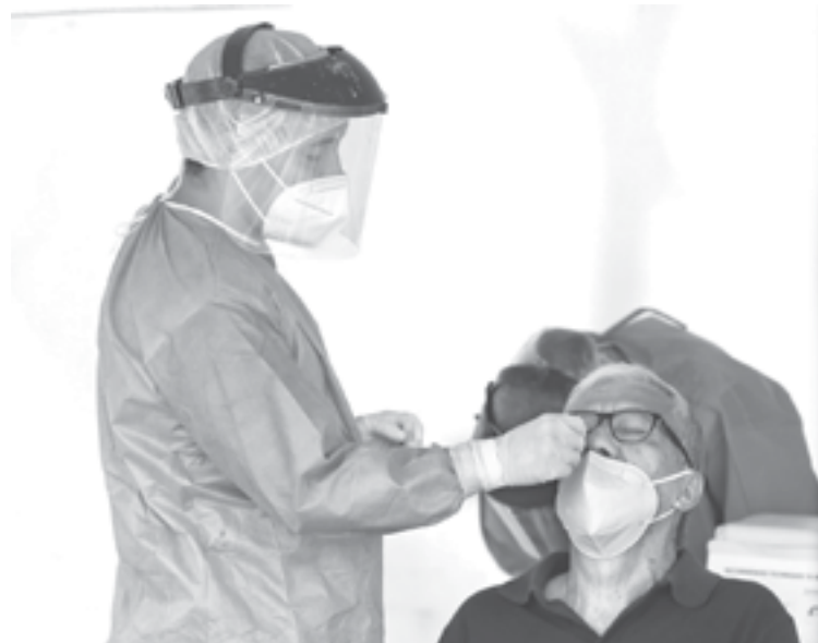
ACAPARA EL SUR casos activos de Covid-19.

Durante la Pandemia, ya suma 303 ciudadanos que perdieron la vida. En el caso de Ciudad Madero, se encuentra en el tercer puesto en casos confirmados en estos últimos días, con 203 pacientes activos.