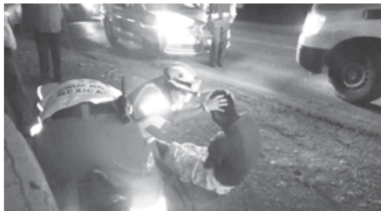
EL MOTOCICLISTA sufrió heridas de consideración al caer de su vehículo

En su intento por esquivar un perro que se atravesó de forma repentina, el conductor de una motocicleta perdió el control de los manubrios y cayó de forma es-