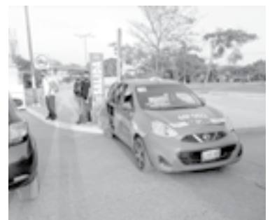
LOS OCUPANTES del taxi bajaron asustados.

El taxi salió proyectado contra la banqueta, quedando trepado sobre la misma.