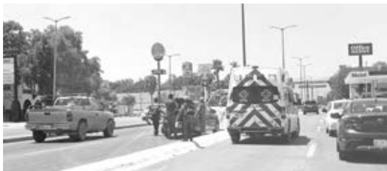
ELEMENTOS de Cruz Roja, atendieron al lesionado.

Un motociclista fue atendido por técnicos en urgencias médicas de la Cruz Roja luego que resultó con golpes en brazos y piernas al sufrir un choque