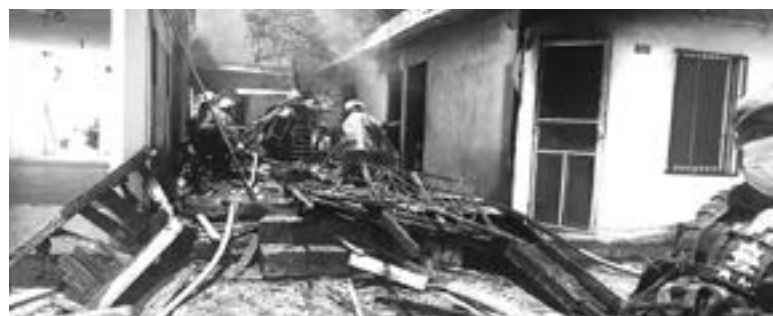
BOMBEROS PIDEN tener precaución ante posibles incendios.

lle Francisco Villa de la colonia José López Portillo en Tampico. La protagonista del percance es una Toyota Avanza que circulaba por la Villa y luego de doblar a la dere-