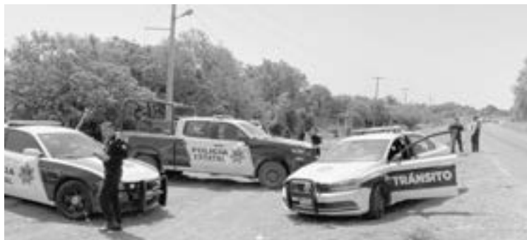
ELEMENTOS POLICÍACOS apoyaron a sus compañeros.

El percance se reportó en el kilómetro nueve de la carretera inter ejidal metros adelante