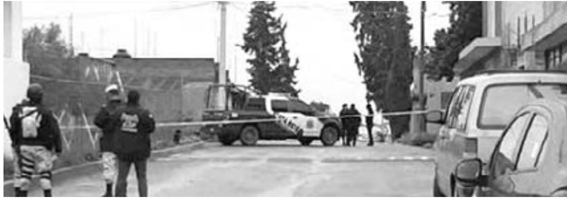
VIVE ZACATECAS jornada de asesinatos; matan a menores.