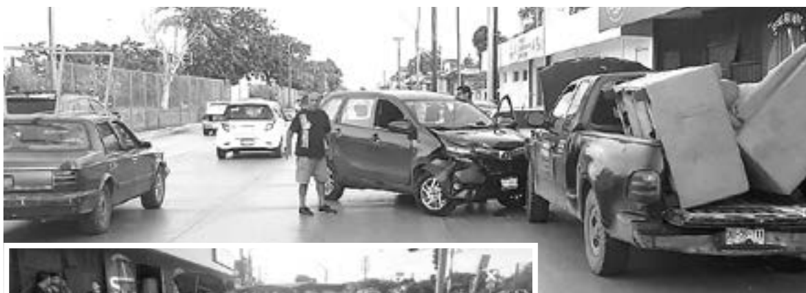
UN FUERTE golpe fue choque fue el registrado en la Avenida Monterrey.