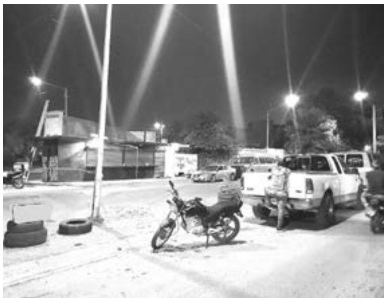
UN SUJETO vestido de negro llegó a pie al negocio y le disparó en tres ocasiones.

La fuente agregó que el dueño del local fue auxiliado por sus empleados y unos familiares lo