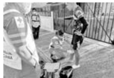
PARAMÉDICOS ATIENDEN al motociclista.

preliminar de Tránsito y Vialidad, el accidente se produjo cuando el conductor de una camioneta, impacta al motociclista.