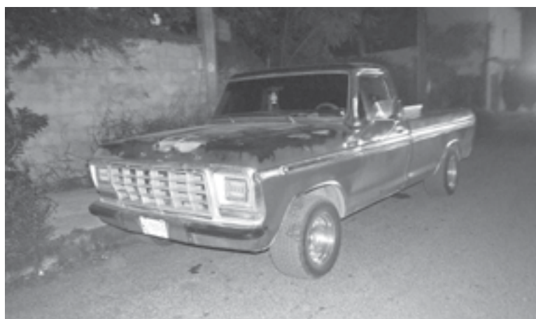
LA CAMIONETA del herido, quedó en el lugar.