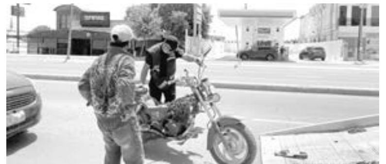
LA MOTO que participó en el percance.

Como presunto responsable aparece el conductor de un vehículo Ford Figo de modelo reciente con placas del estado de Tamaulipas que era conducido por un joven que iba acompañado de su familia.