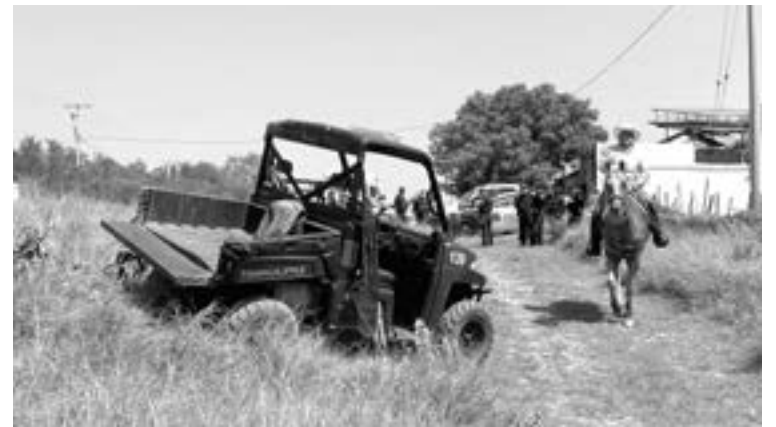
LA MOTO hacer, sufrió una falla en la transmisión.