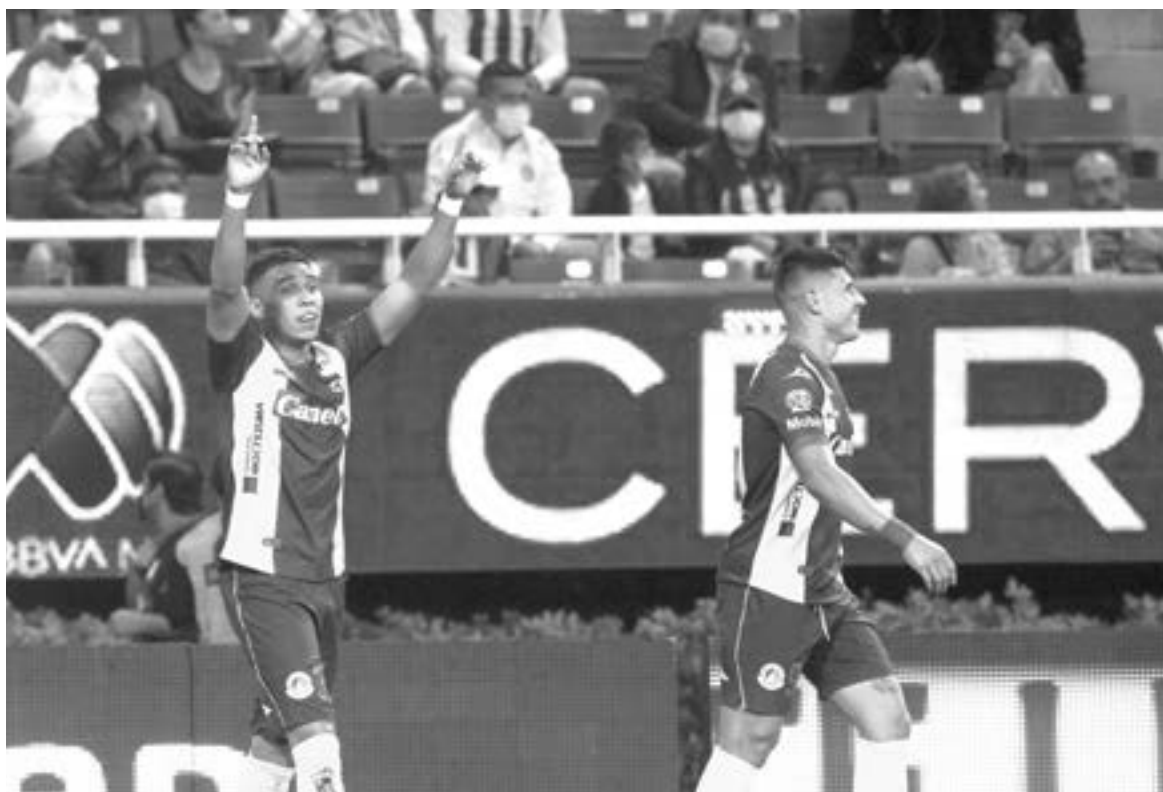
CHIVAS tiene varias bajas sensibles pero no pudo mostrar su fútbol.

En el debut del director técnico uruguayo Marcelo Méndez Russo en el fútbol mexicano, su Atlético de San Luis venció 2-1 a las Chivas del Guadalajara de Víctor Manuel Vucetich, en partido de la primera jornada del torneo Grita México Apertura 2021