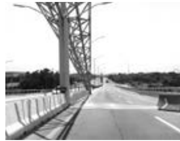
EL PUENTE costó 200 millones de pesos

“Los fines de semana es cuando más se nos complica esa situación y tenemos que enviar a oficiales para que agilicen el flujo de automóviles, tanto de los que entran como de los que salen, ya que la empresa solo abrió un carril y el otro permanece