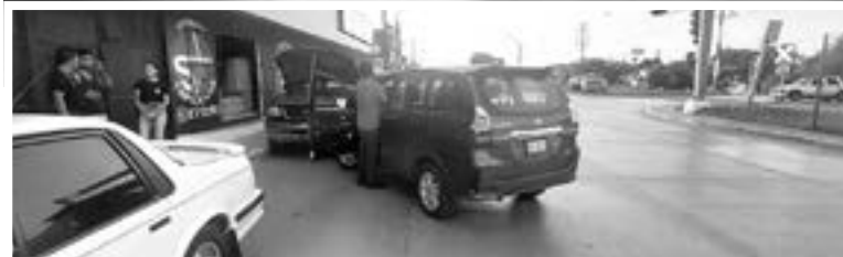
LOS DAÑOS materiales fueron cuantiosos, la operadora salió ileso pero muy asustada por lo sucedido.

les fueron cuantiosos, la operadora salió ileso pero muy asustada por lo sucedido. El hecho vial ocurrió la tarde del viernes en esa transitada arteria esquina con ca-