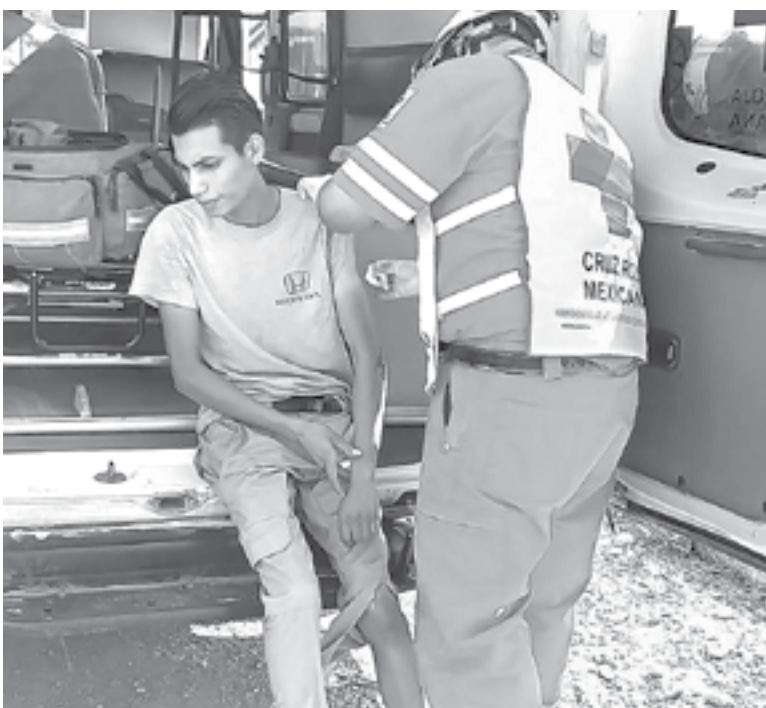
EL MOTOCICLISTA sufrió diversos golpes, luego de derrapar.