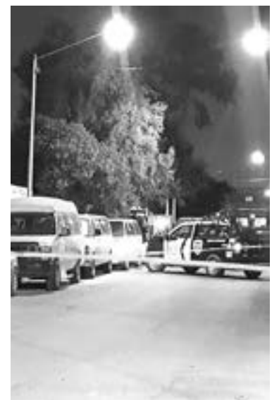
Agencia Estatal de Investigaciones inició la indagación del caso.

El informante agregó que se presumía que una de las líneas de investigación era el cobro de piso al comerciante, aunque no se descartaba un asalto.