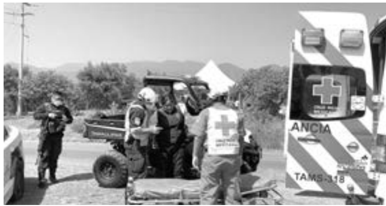
LA OFICIAL fue trasladada al hospital por golpes en un costado.