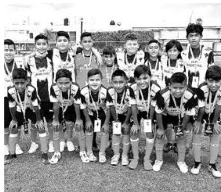
RAYADOS VICTORIA sigue conquistando títulos en diferentes torneos.