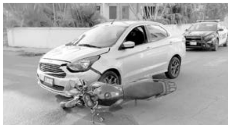
EL ACCIDENTE se registró en la colonia Petrolera.