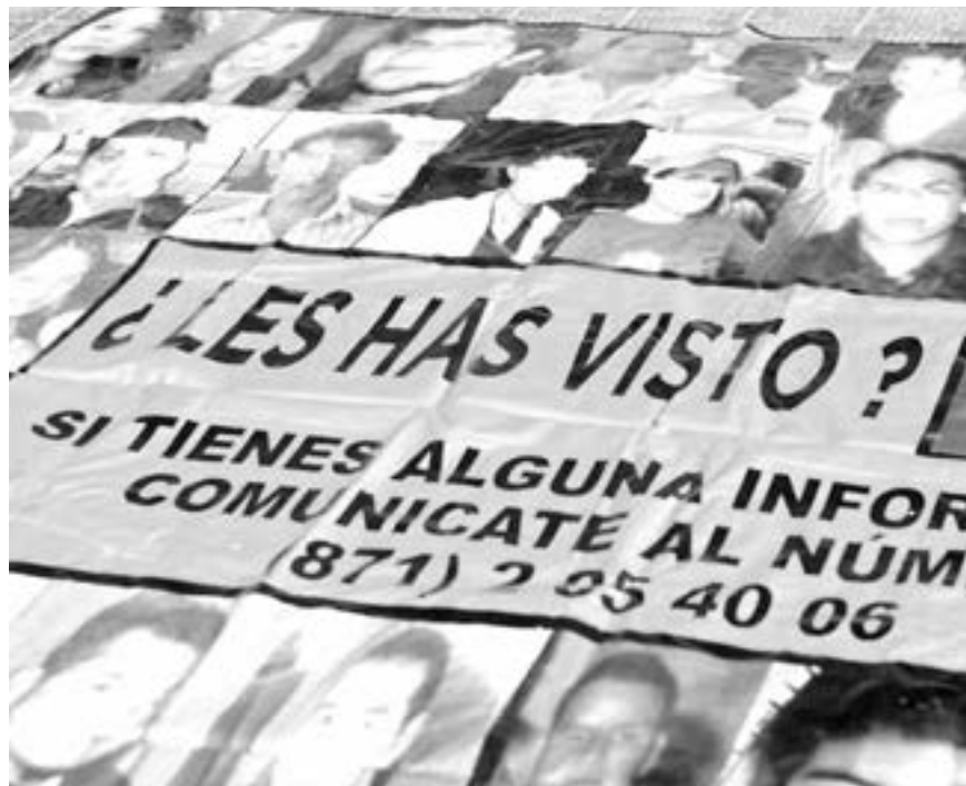
LA SEGOB busca agilizar la búsqueda de menores de edad