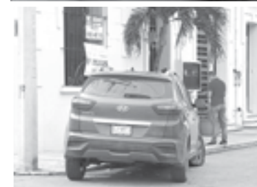
LA CAMIONETA terminó arriba de la banqueta.