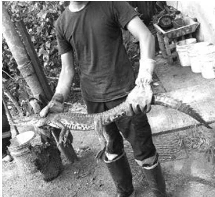
ESTE COCODRILLO estaba en un patio.

“El reporte de la ciudadanía nos señalaba que dentro