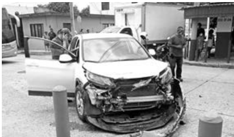
QUEDA DESTROZADA la camioneta responsable