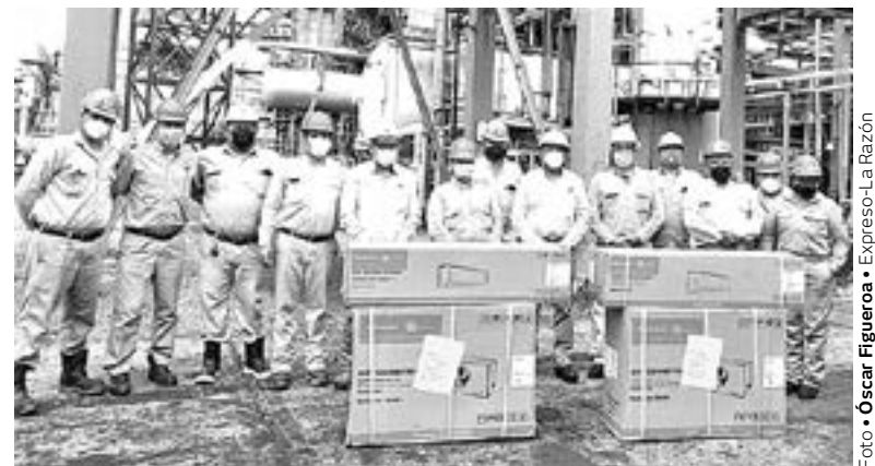
ENTREGARON EQUIPO al personal de la planta Coker.

promiso de seguir con las gestiones de beneficios que se traduzcan en una mayor productividad y mano