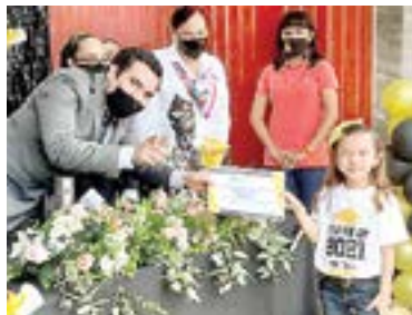
LOS MÁS PEQUEÑITOS de kínder asistieron a la ceremonia de graduación.