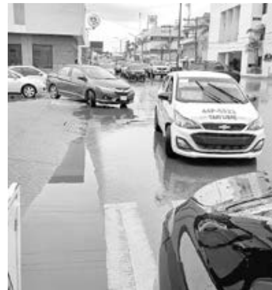
EL CHOQUE fue reportado la mañana del viernes.