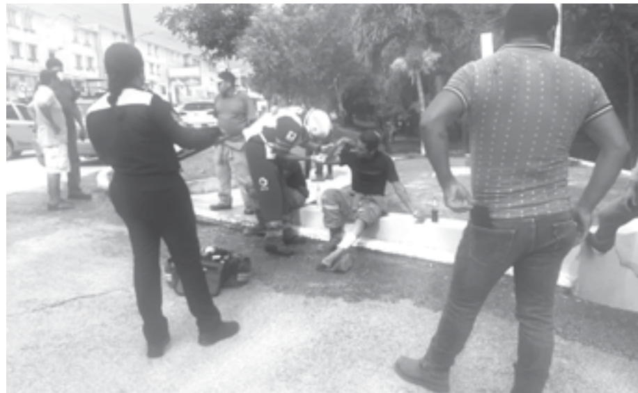
LOS MOTOCICLISTAS sufrieron heridas leves.