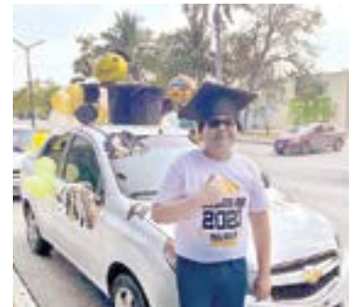
CON AUTOS DECORADOS los alumnos desfilaron en la caravana de graduación.

Alumnos de kinder y primaria del Colegio Malthus asistieron a la caravana de graduación de la generación 2021