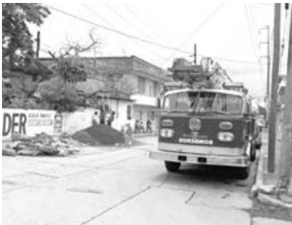
TUVIERON QUE usar motosierras.