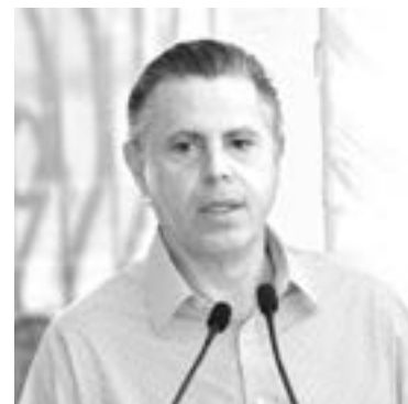
NADER PASÓ del cuarto al primer lugar nacional.

El presidente se ubica por encima de sus homólogos de Saltillo, Ensenada, Ramos Arizpe,