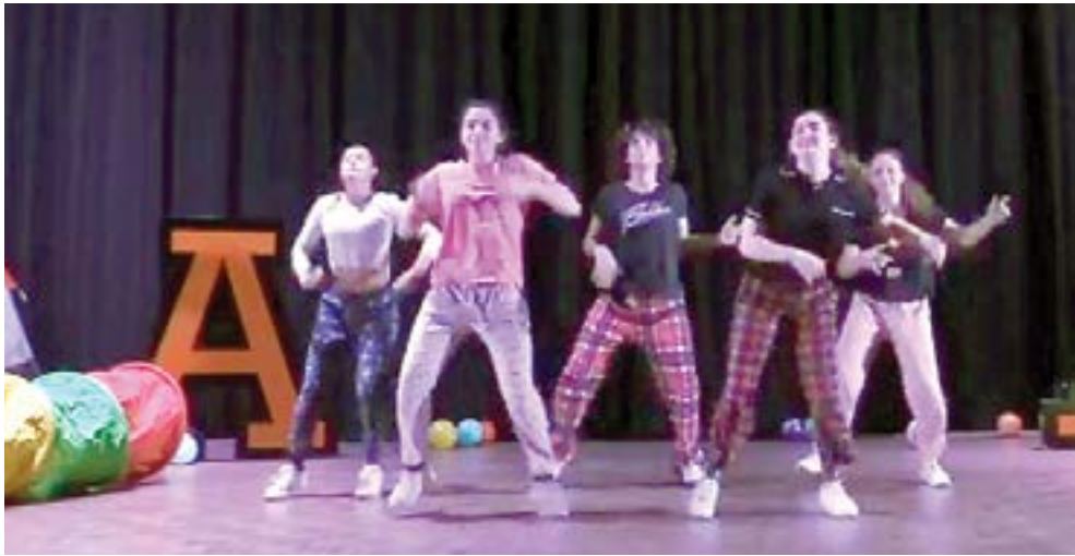
EN LA INAUGURACIÓN se dio inicio con un cuento para los pequeños