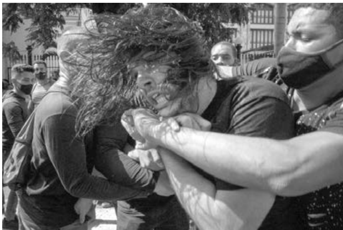
POLICÍAS DE civil detienen a un manifestante en La Habana