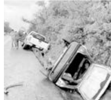
EN LOS últimos años se han reducido las defunciones por accidentes.

Los accidentes son la cuarta causa de muerte en el estado, principalmente los viales seguidos por los accidentes en el hogar, de acuerdo a datos de la Organización