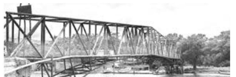
EL PUENTE peatonal será reconstruido en su totalidad

Como se debe de recordar el puente cruza un brazo de agua que