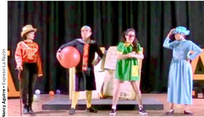
EL CAMPAMENTO de Verano IEST Anáhuac se realizó de manera virtual