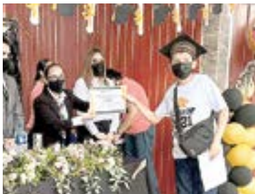
LOS CHICOS recibieron felicitaciones por parte de sus maestros.