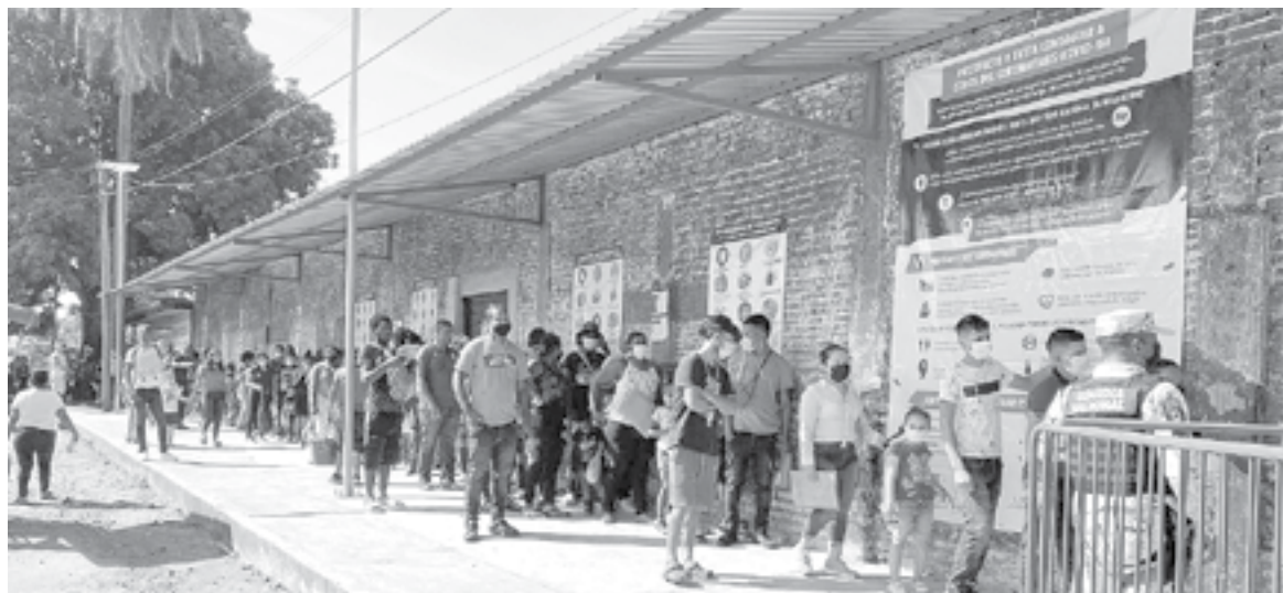
MIGRANTES QUE solicitan asilo en México acudieron ayer a las oficinas de la Comar.