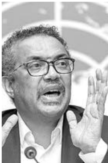
TEDROS ADHANOM, jefe de la OMS

“Esperamos que China apoye esta nueva fase del proceso científico compartiendo todos los datos pertinentes en un espíritu de transparencia. Asimismo esperamos de todos los Estados miembros que apoyen el proceso científico absteniéndose de politizarlo”, dijo el doctor Tedros.