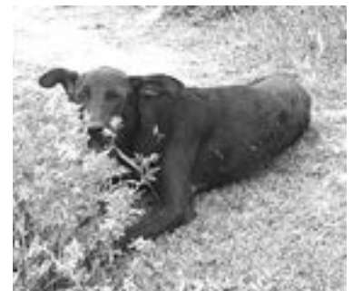
EL PERRO fue arrollado