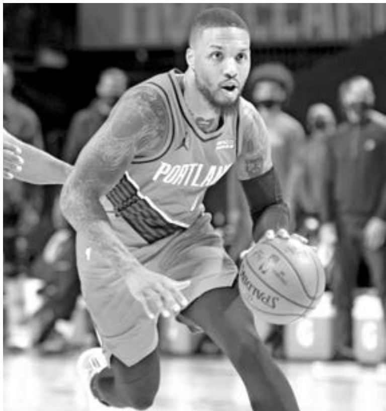
ES PARTE de los mejores jugadores en la historia