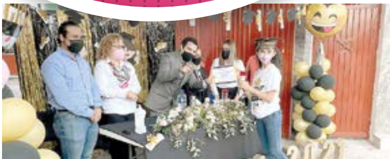
ALUMNOS DE PRIMARIA recibieron sus certificados de culminación de estudios.