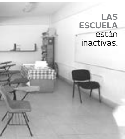
LAS ESCUELAS están inactivas.