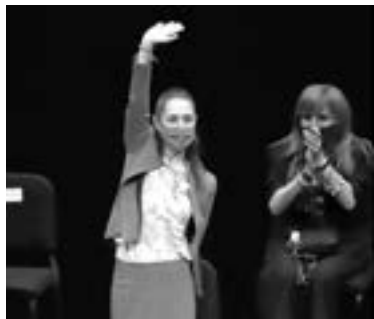
CLAUDIA SHEINBAUM, Jefa de Gobierno

“Como lo hemos dicho, estoy dedicada a ser Jefa de Gobierno, esa es mi tarea el 100 por ciento de mi tiempo y todo el respeto a todos, no tengo ningún problema con nadie, al contrario, mi respeto al senador y a todos por supuesto”, apuntó.