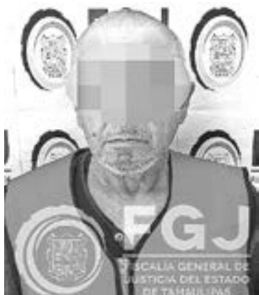
CELSO B, fue sentenciado a 15 años de cárcel

Las pruebas que presentó el fiscal fueron suficientes para demostrar que el individuo cometió el abuso sexual en agravio de un me-