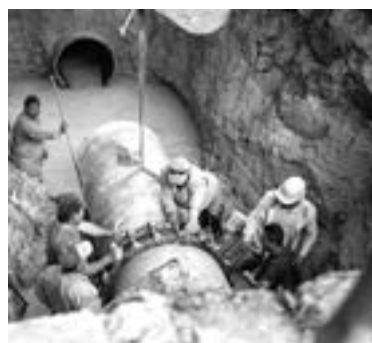
COMAPA ZONA Tam trabaja para restablecer el servicio de agua potable en la zona norte.

Luego de una intensa jornada de más de 24 horas de trabajo ininterrumpido para reparar la tubería de 36 pulgadas, colapsada en calle Divisoria de la colonia Ampliación Niños Héroes en Tampico; fue restablecido el suministro de agua con una cobertura del 60 por ciento en las colonias del norte de Tampico y Ciudad Madero.