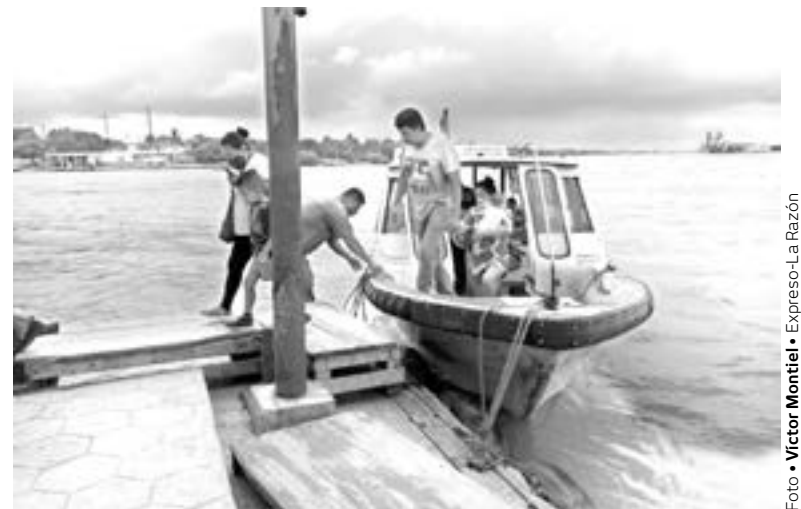
EL COSTO en gasolina ha aumentado a los boteros