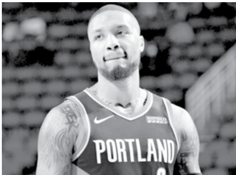
LILLARD HA ganado disfrute tes distinciones

En total, 52 más. Y, por eso, los Blazers que habían sabido ganar con 10 puntos de Lillard no pudieron sacar adelante un partido en el que su base, su estrella, su jugador franquicia, su todo, anotó 55 puntos, repartió 10 asistencias y reventó el récord de triples en una noche de playoffs: 12. La mejor marca hasta ahora eran los 11 de Klay Thompson hace cinco años, en la legendaria remontada de los Warriors en OKC. Después de esos doce y esos once, Lillard tiene también las dos siguientes marcas, diez y nueve.