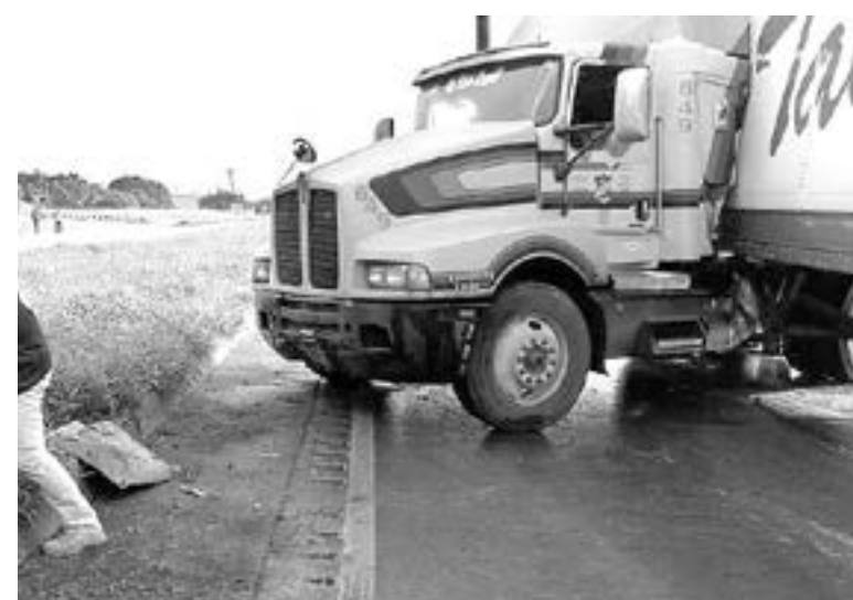
EL PAVIMENTO mojado provoca más accidentes

“Les recomendamos que en temporada de lluvias que serán considerables y van a estar per-