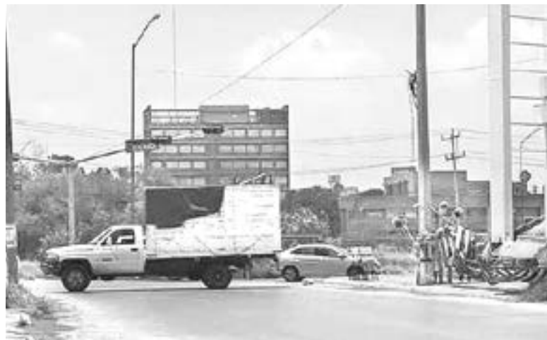
REALIZAN BLOQUEOS y tiran poncha llantas para disuadir a las autoridades que buscan repacturar a líder delincencial