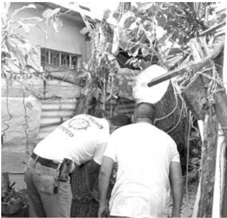
LA VIVIENDA está ubicada en la colonia Nacional de Tampico.

Las labores se prolongaron hasta la noche del viernes.