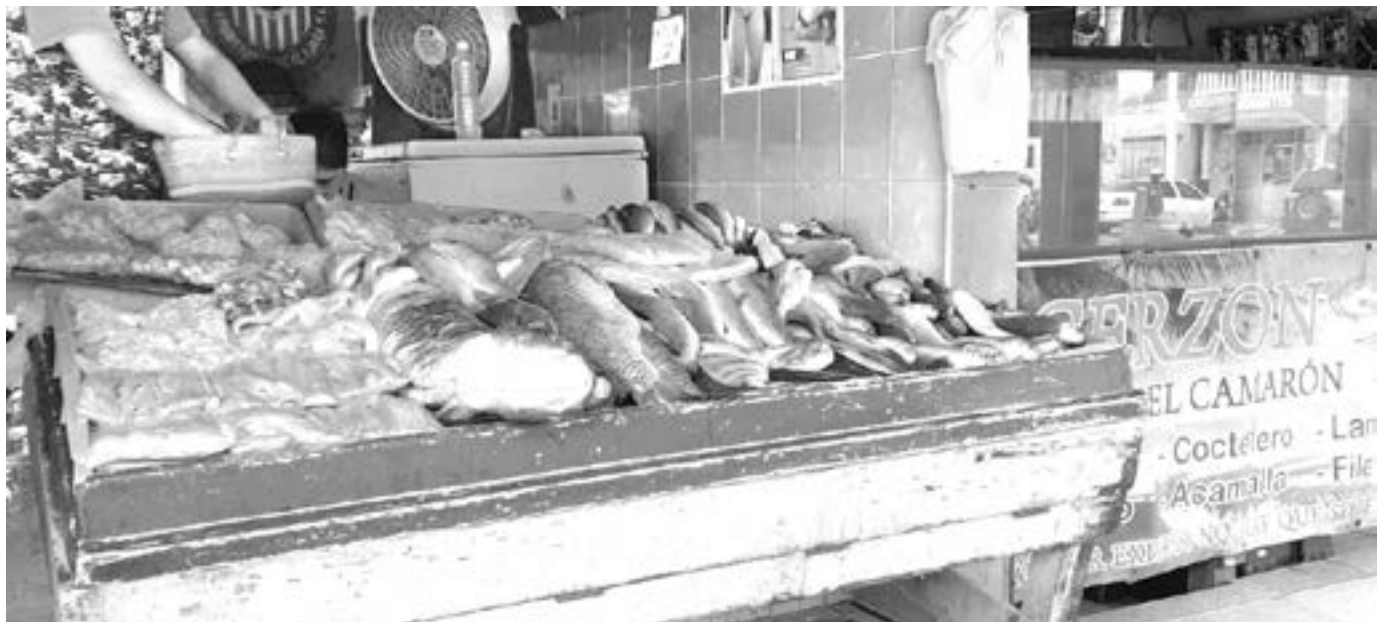
ESPERAN CONTINUAR con buena venta en estas vacaciones

SE RECOMIENDA respetar las fechas y días establecidos.