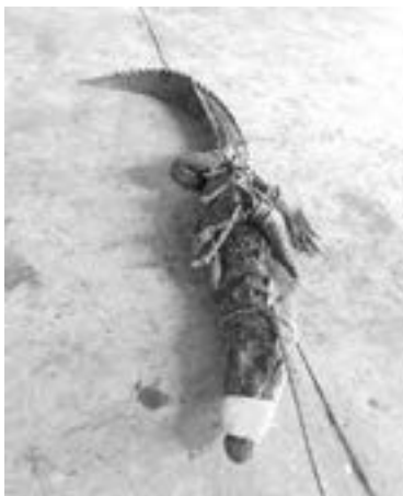
LUEGO DE varios minutos, lograron someterlo.

Un cocodrilo de metro y medio de largo fue capturado la tarde del viernes, cuando deambulaba por el bulevar Adolfo López