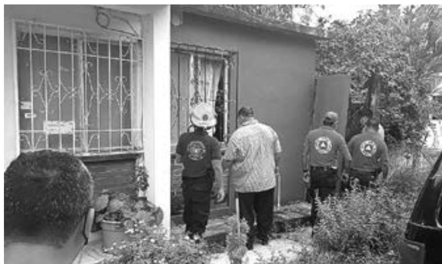
BOMBEROS CONFIRMARON el hallazgo