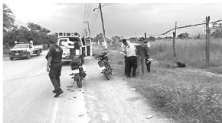
EL HOMBRE resultó con una herida en la ceja izquierda

El afectado manejaba una motocicleta itálica color negro con verde la cual se desplazaba sobre dicha avenida en dirección de norte a sur.