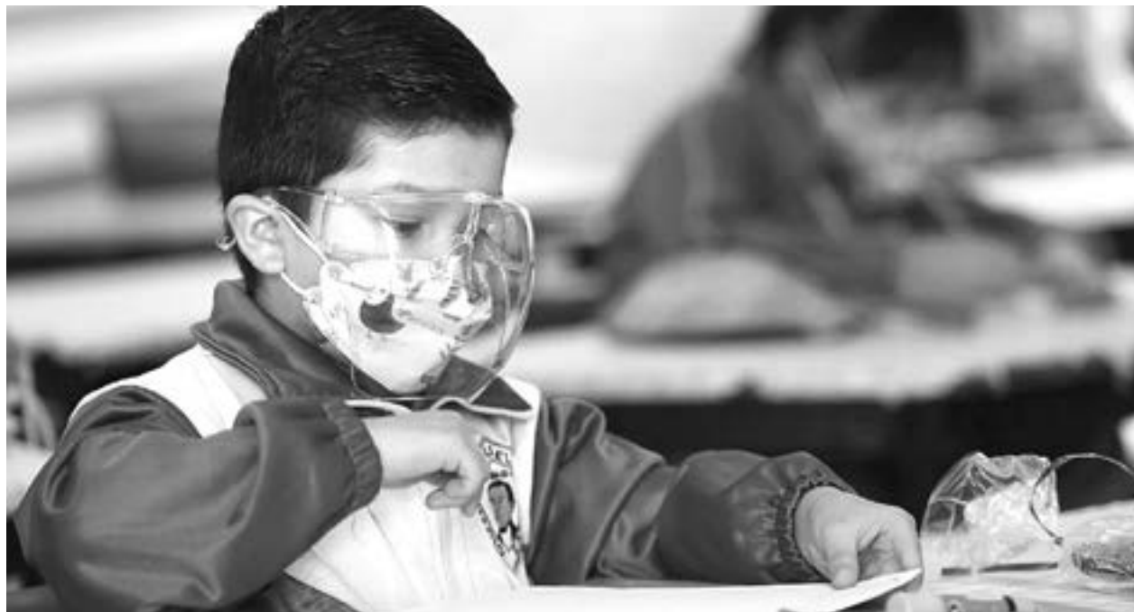
EL CICLO ESCOLAR tendrá diferentes calendarios

ESTADOS QUE RECORTARON EL CALENDARIO ESCOLAR