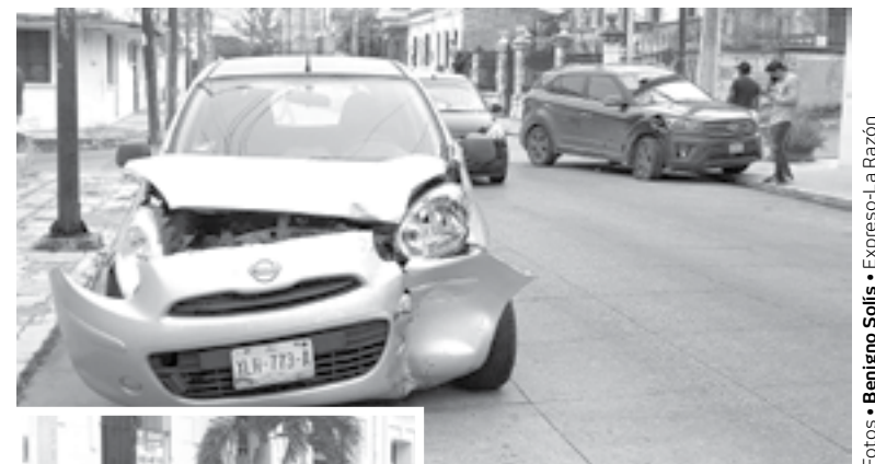
EL MARCH acabó con el frente destrozado.