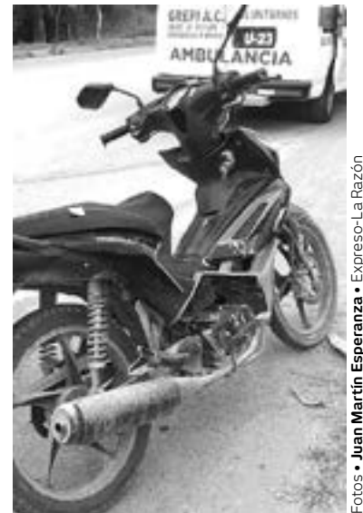
EL CONDUCTOR de la moto resulta herido

Elementos de la Unidad General de Investigación tomaron conocimiento de los hechos mientras que personal del servicio médico forense de hizo cargo del levantamiento del cuerpo y de trasladarlo a una funeraria para la autopista de ley.