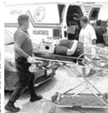
MUJER es trasladada al hospital

Debido al fuerte golpe la mujer que viajaba en el asiento del copiloto del Sentra, resultó con una posible lesión en la cervicales, sien-