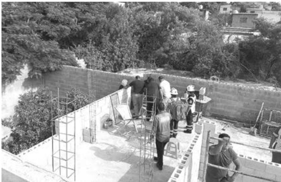
ATIENDEN AL lesionado en El Segundo piso de la propiedad

Afortunadamente fue demandado por lo que la policía de inmediato lo capturó y procedió a dejarlo a disposición de autoridades quienes terminaron por imponer la condena.