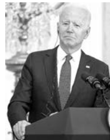
JOE BIDEN habló sobre los peligros de la desinformación antes de dejar la Casa Blanca este viernes

La Casa Blanca cree que la desinformación sobre vacunas, mascarillas y medidas de distanciamiento social está socavando los esfuerzos de las autoridades para hacer frente a la pandemia y está poniendo vidas en riesgo.