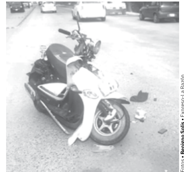
LA MOTO impactó contra el Chevy.