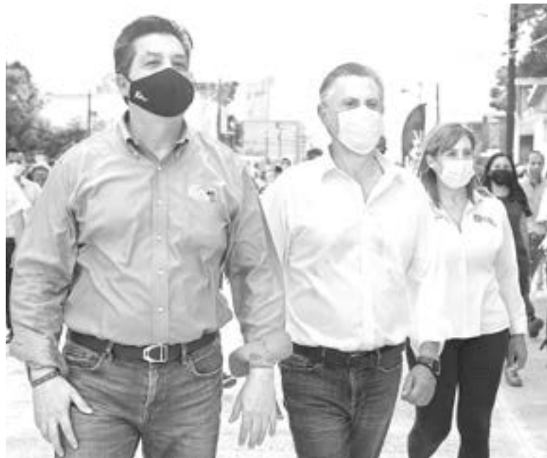
EL GOBERNADOR y el Alcalde recorrieron la Borreguera.