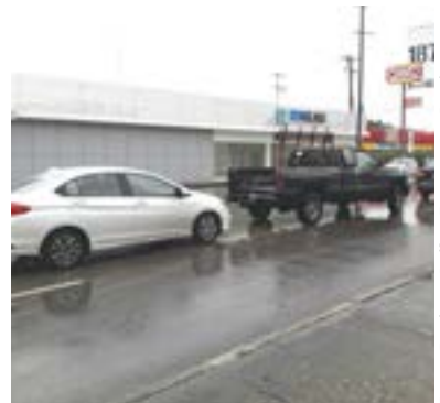
PERITOS VIALES intervinieron para deslindar responsabilidades.

Peritos viales intervinieron para deslindar responsabilidades, moviendo las unidades del sitio para no entorpecer la vialidad.