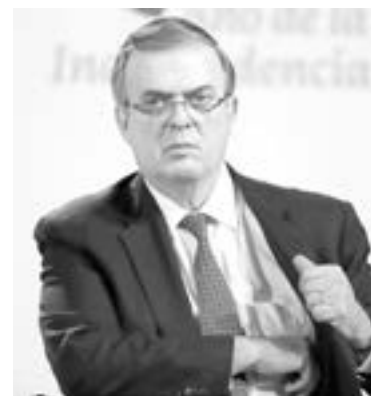
MARCELO EBRARD, canciller mexicano

“Esa es la posición de México, todavía en enero de este año se votó aquí en la Asamblea de las Naciones Unidas que debía levantarse ese bloqueo por 184 países, es un consenso