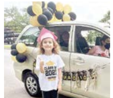
COLORIDOS se mostraron los vehículos en los cuales desfilaron los alumnos en la caravana.

Felices de volver a ver a sus compañeros de salón luego de un año de contingencia sanitaria los graduados pudieron despedirse de sus amigos así como de sus queridos profesores que los apoyaron en todo momento durante las clases virtuales.