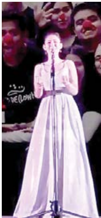
EL IEST dio inicio a su campamento de verano virtual con un gran es

Las clases serán impartidas a niños de 3 a 14 años por me-