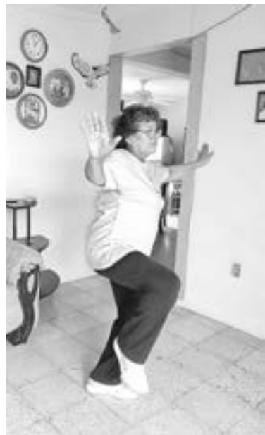
VIRTUALES las actividades de los adultos mayores.