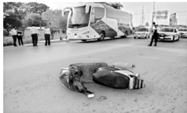
LA MOTONETA se estrelló en un costado del bus.