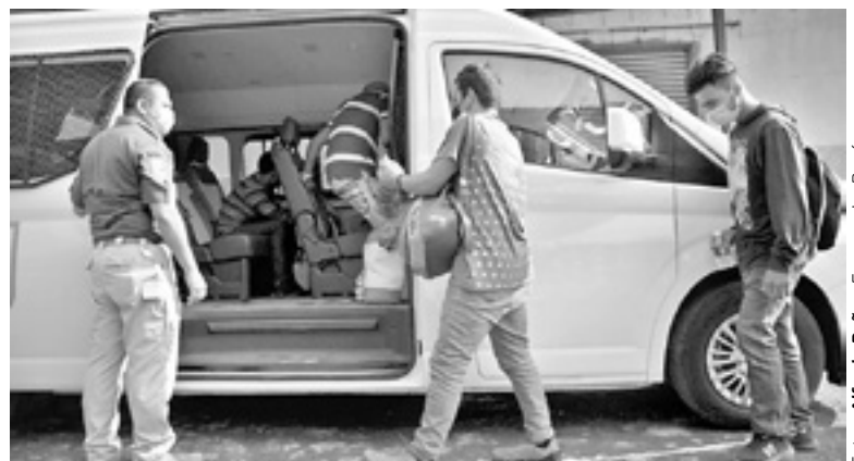
LOS OFICIALES procedieron a retener a los centroamericanos.

Los oficiales procedieron a retener a los centroamericanos para ponerlos a disposición del Instituto Nacional de Migración y sean ellos quienes analicen el estatus de cada uno de ellos.