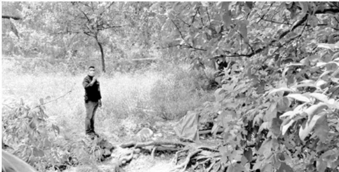
EL JOVEN se ahogó al caer al agua totalmente intoxicado.