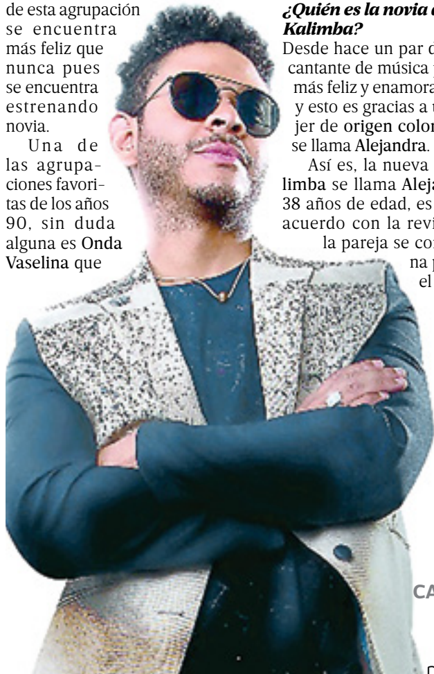
EL CANTANTE encontró el amor en plena pandemia.

Una de las agrupaciones favoritas de los años 90, sin duda alguna es Onda Vaselina que