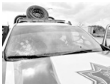
IMPACTOS de bala en una patrulla de la policía estatal.

para la Construcción de la Paz en Tamaulipas se confirmó que los cierres de la carretera a Nuevo Laredo por la tarde y a la altura de Díaz Ordaz y Valadeces.