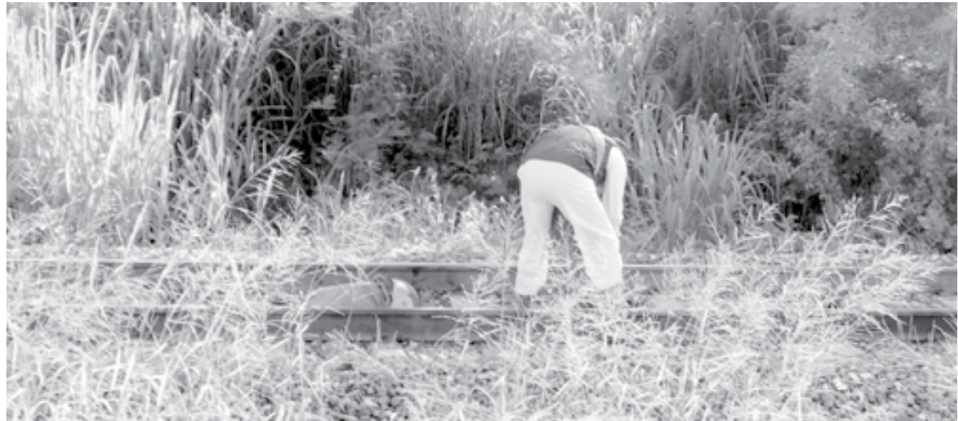
CUANDO LOS CUERPOS de emergencia llegaron, ya no tenía signos vitales.