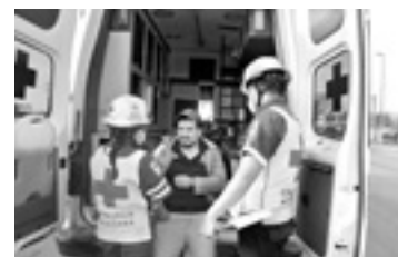
EL HERIDO tuvo que ser llevado a un hospital.

alrededor de 55 años de edad que se doía del brazo izquierdo además de pierna del mismo lado. Luego de ser valorado se ordenó su traslado al hospital.