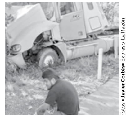
SE SALIÓ del camino en el tramo Cuauhtémoc- Santa Gertrudis.

Se desplazaba en dirección al norte del estado sobre la carretera Tampico-Mante, se salió de la carpeta asfáltica, generando que la mercancía se saliera de su aseguramiento y se desplazaran en dirección a la cabina de la unidad pesada. Los hechos sucedieron a las 11 de la mañana, en el kilómetro 56 del ca-