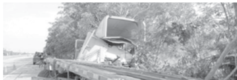
EL TRAILERO terminó asustado tras sufrir la volcadura.

Hace un mes aproximadamente, un matrimonio de San Luis Potosí falleció en un choque en dicho cruce, la hija de 5 años fue la única sobreviviente.