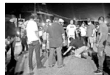
PRESENTABA SANGRADO en la cabeza y laceraciones en el cuerpo.

Un testigo informó de manera extraoficial que el peatón no aten-