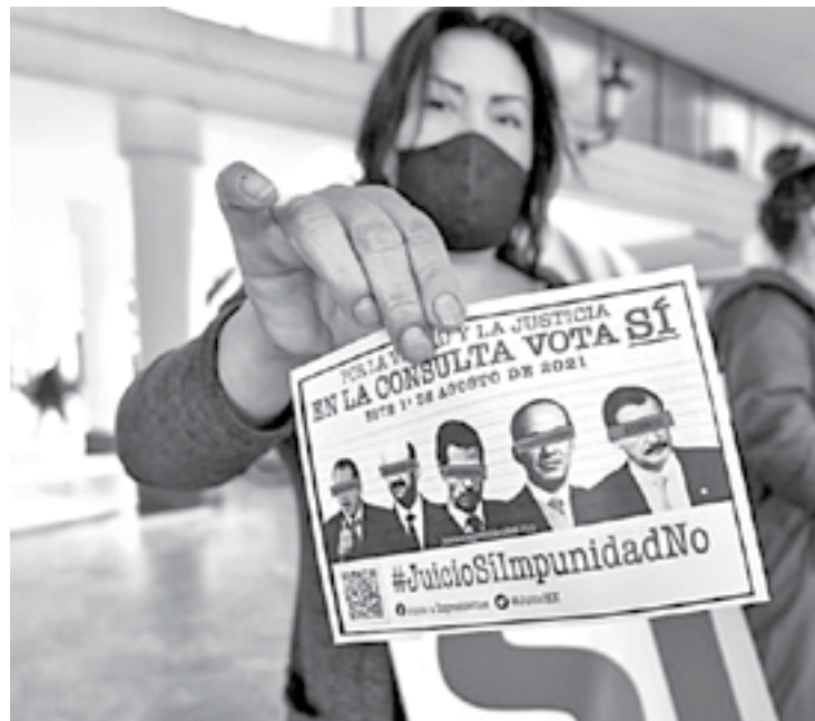
LA CONSULTA POPULAR se realizará el 1 de agosto.