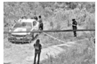
EL ÁREA fue acordonada por la policía.

Otro jovencito que también merodea la zona con frecuencia, fue quien lo encontró flotando en el agua y lo llevó a la orilla para des-