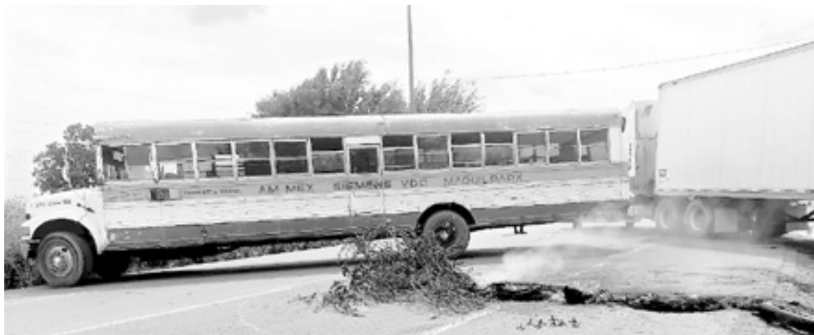
LOS CAMIONES atravesados en la carretera de Díaz Ordaz.