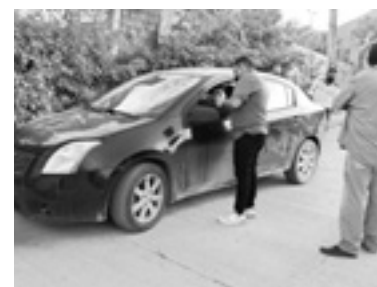
LA CONDUCTORA del Sentra omitió el alto.