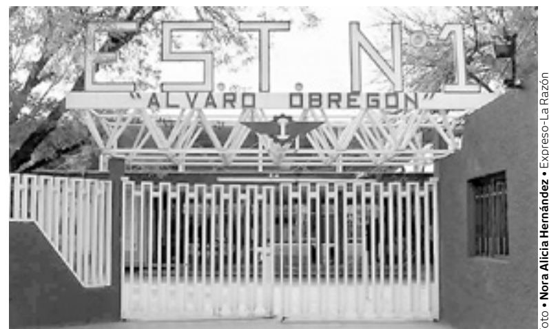
DENUNCIAN COBRO de mil 700 pesos en la técnica No 1 Álvaro Obregón

En ese sentido las denuncias que han llegado a EXPRESO, señalan que las condiciones económicas de las familias en particular en la capital de Tamaulipas no son como para estar pagando esas cantidades como si la escuela fuera un colegio privado.