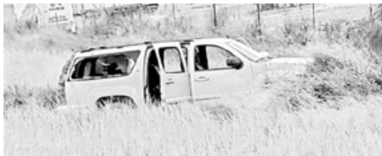
DELINCUENTES abandonan una Suburban y escapan a pie.

Los delincuentes atravesaron camiones y quemaron llan-