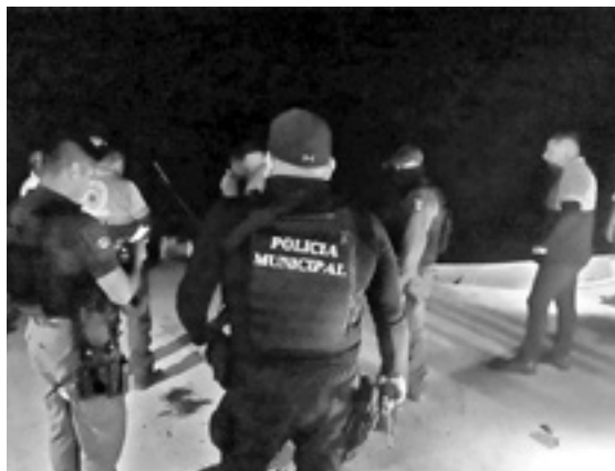
UN PESCADOR que regresaba de su labor encontró el cuerpo flotando.

personal de la Policía Ministerial y Elementos de la Unidad de Servicios Periciales, se presentaron en el sitio para dar fe del deceso, ordenando el traslado del cuerpo al anfiteatro para los fines de