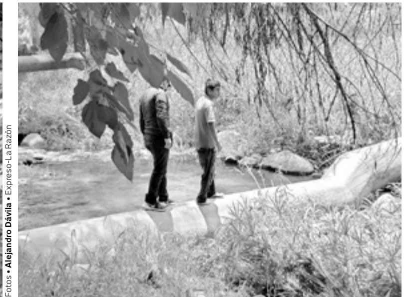
SU COMPAÑERO de 'chemo' lo halló y lo sacó del agua.