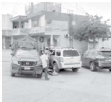
EL CHOQUE se registró en Avenida Monterrey

En este sector anteriormente una persona había sido embestida por el tren, pues se encontraba recolectando leña.