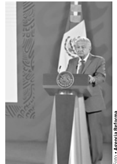
GOBERNADORES ELECTOS se reunieron con el presidente López Obrador

“No se llegó a ese nivel de detalle, pero el esfuerzo de las acciones podría implicar una mayor estado de fuerza, dependerá del proceso de reclutamiento que está conduciendo la Guardia Nacional”, respondió.