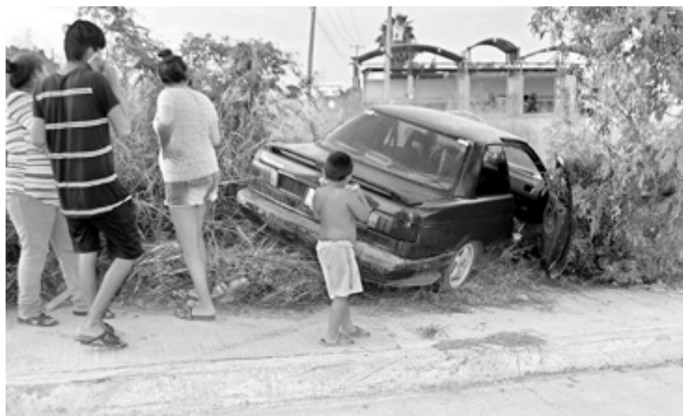
EL TSURU se fue a 'encaramar' a un predio enmontado.

La familia viajaba en un vehículo Nissan tipo Tsuru en sentido de poniente a oriente por el bule-