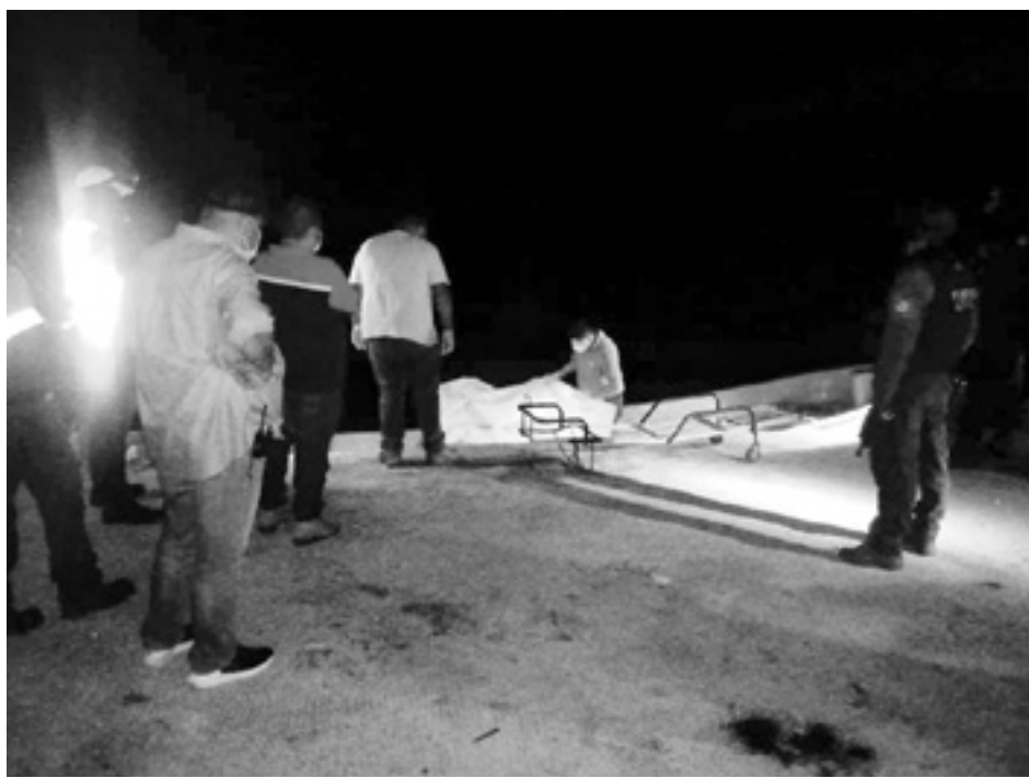
EL MAR devolvió el cuerpo de la pequeña en El Chachalaco.

Posteriormente cerca de las 05:00 horas de la madrugada que