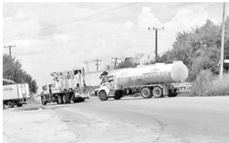
EN MUNICIPIOS conurbados de Reynosa hubo bloqueos.

DELINCUENTES ATRAVESARON CAMIONES Y QUEMABAN LLANTAS MIENTRAS QUE LAS REDES SOCIALES DIERON CUENTA QUE EN EL POBLADO DE VENECIA ARROJABAN PONCHALLANTAS