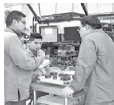
AUMENTAN LOS EMPLEOS en la entidad.

La estabilidad laboral, las diferentes ventajas competitivas que ofrece la entidad, así como diversos factores positivos, colocan a Tamaulipas dentro de los primeros 10 estado del país, en generación de empleo registrada ante el Instituto Mexicano del Seguro Social (IMSS).