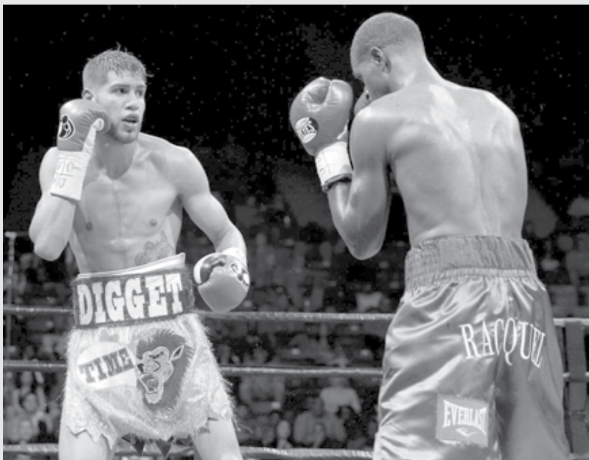
ACTUALMENTE LUCHA por llevar una vida normal

En el noveno round, Williams logró algo que ningún peleador había podido hacer: tumbar