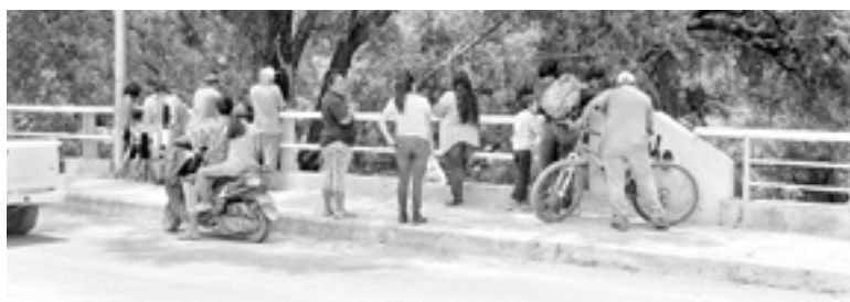
LA GENTE del barrio acudió al lugar.

UNA PERSONA CONOCIDA EN EL BARRIO POR SU ADICCIÓN A LOS SOLVENTES CAE INTOXICADO Y BOCA ABAJO EN LAS ESCASAS AGUAS DEL RIO Y MUERE POR INMERSIÓN