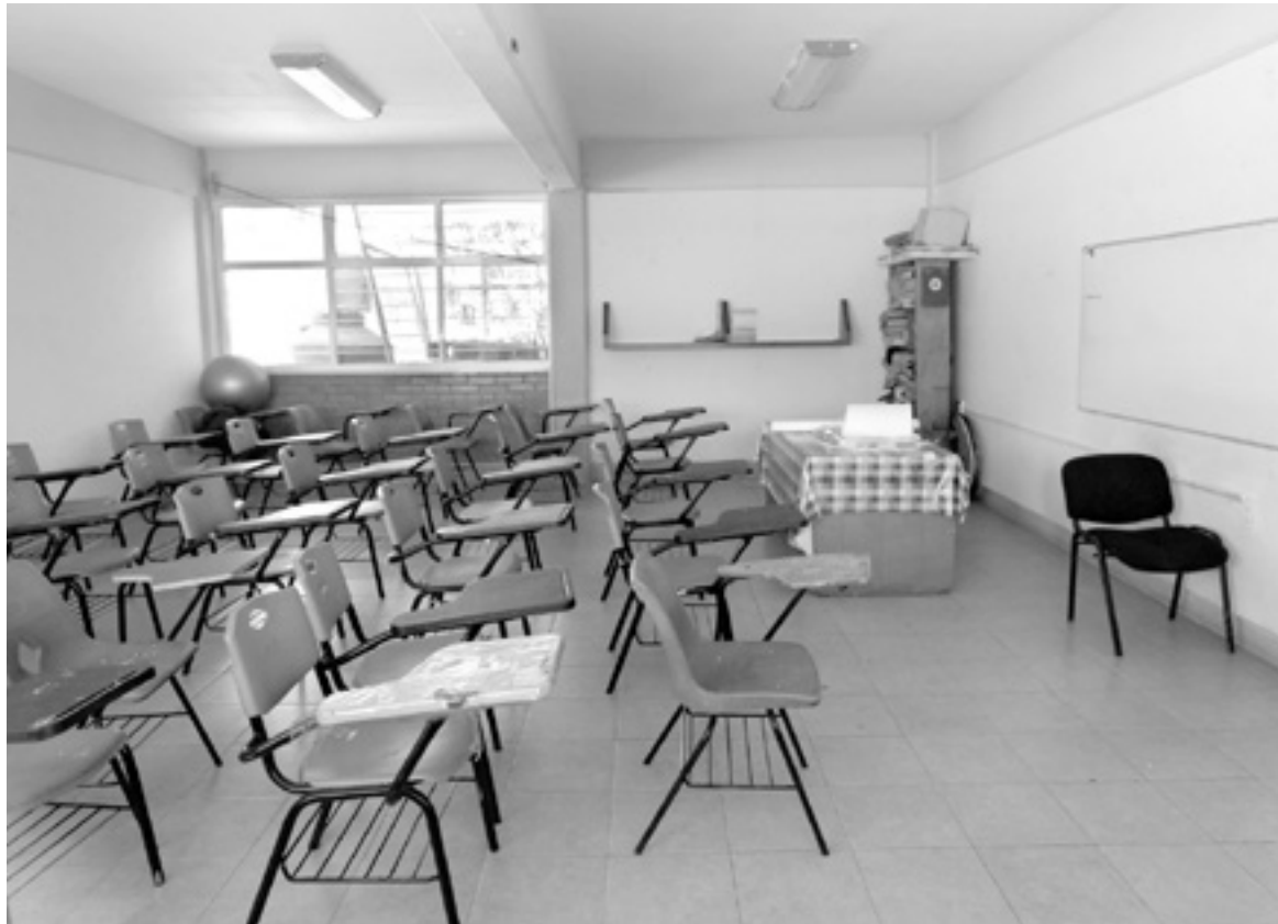
LAS ESCUELAS necesitan intervención para el regreso a clases.