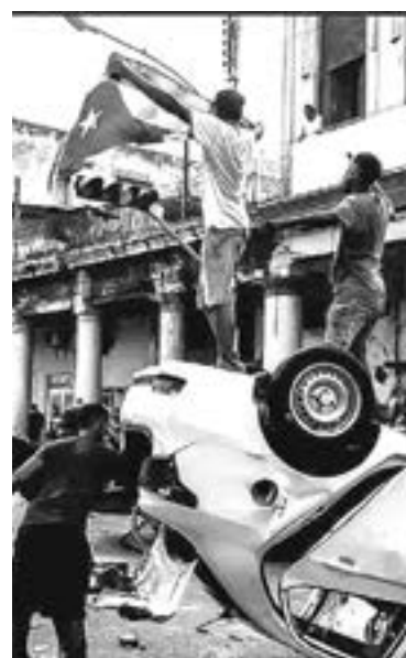
SORPRENDENTES IMÁGENES de la isla circulan en las redes

Esta es la protesta antigubernamental más grande que se registra en la isla desde el llamado "maleconazo", cuando en agosto de 1994,