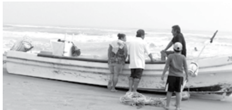
EN TRAGEDIA termina tarde de diversión de una familia.

P ueblo Viejo.- La tarde de diversión de los integrantes de una fami-