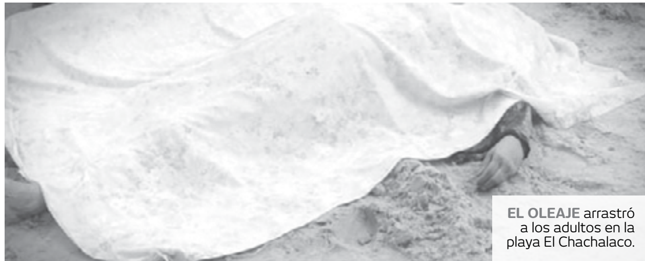
EL OLEAJE arrastró a los adultos en la playa El Chachalaco.