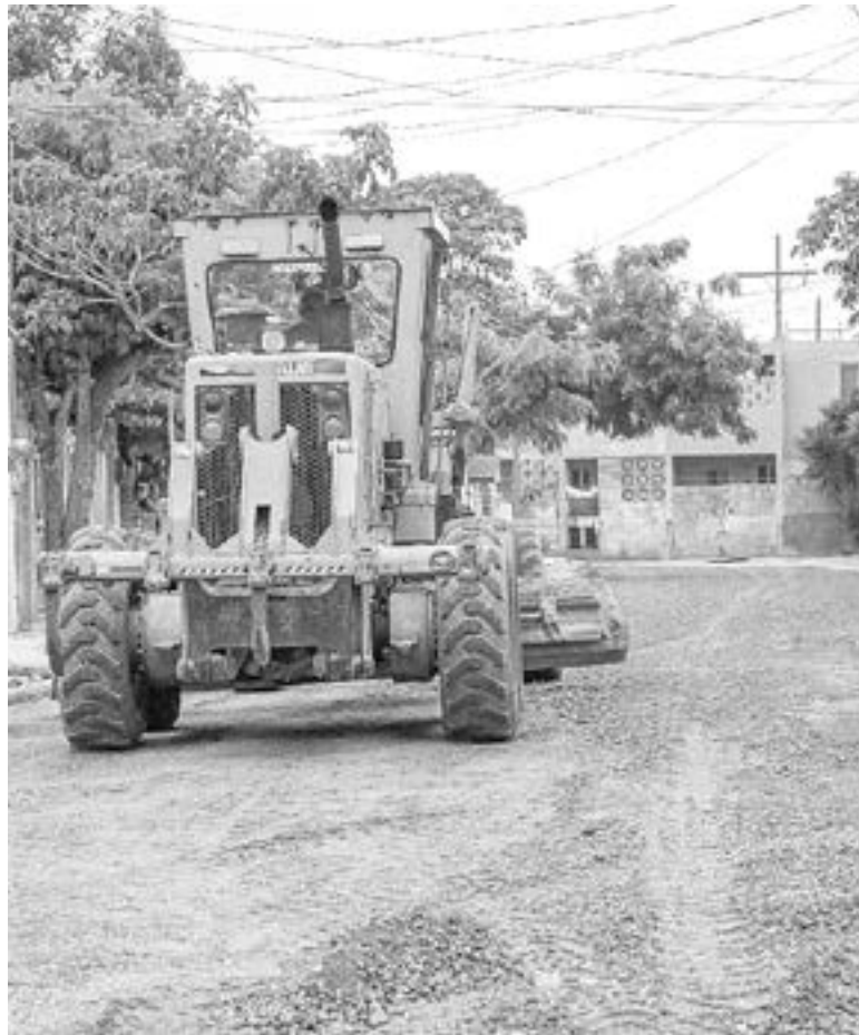
LA REACTIVACIÓN de obras iniciaría hasta el 2022.

MÁS DE MIL 500 OBREROS DE CIUDAD MADERO HAN ESTADO DESEMPLEADOS DURANTE LOS QUE VA DEL 2021 Y LAS CONSTRUCCIONES PODRÍAN CONTINUARSE HASTA EL 2022