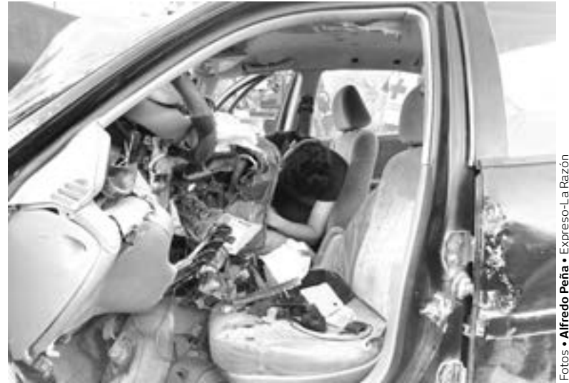
DENTRO del coche quedó sin vida el copiloto.