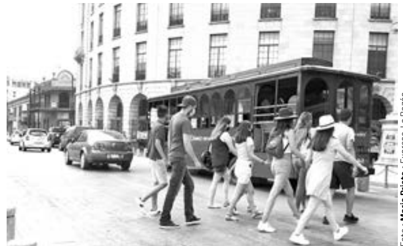
DESDE ESTE FIN DE SEMANA se elevó la llegada de turistas a Tampico

"Deseamos que no esté afectando, por lo que tienen notificación; Semarnat, Agencia de Seguridad, Energía y Ambiente, que es la que tiene que ver con el tema de hidrocarburos, nosotros hacemos lo que corresponde al Estado", dijo.