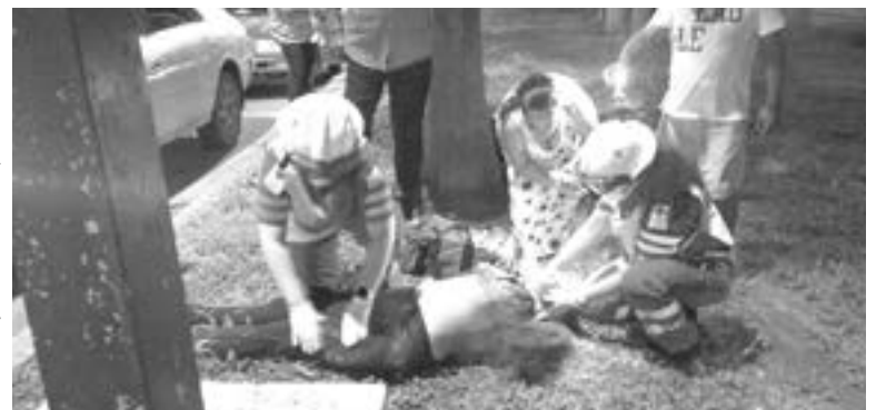
LA MUJER presentaba diversas lesiones.

Luego de valorarla, los elementos determinaron llevarla hasta la sala de urgencias de la