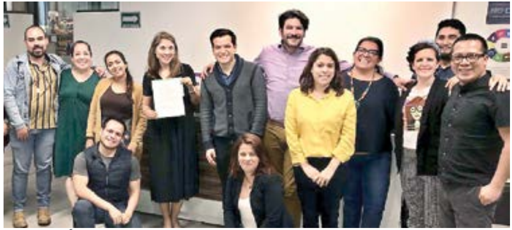
FUNDACIÓN FLEISHMAN promueve la formación y educación de niñas, niños y jóvenes de la zona conurbada.

tancia impartidas por 8 profesionales de la educación de Enseña por México, quienes los capacitan en Desarrollo Humano, Matemáticas, Lengua Extranjera, Ciencias, Literatura y Tecnología.