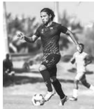
EL CONJUNTO continuará su preparación en Guadalajara

El cotejo se desarrolló en 4 periodos con duración de 30 minutos cada uno y resultó ser un gran ensayo para la escuadra celeste, ya que tuvo la oportunidad de medir sus fuerzas ante el más reciente subcampeón de la Liga BBVA MX e ir afinando detalles rumbo a su