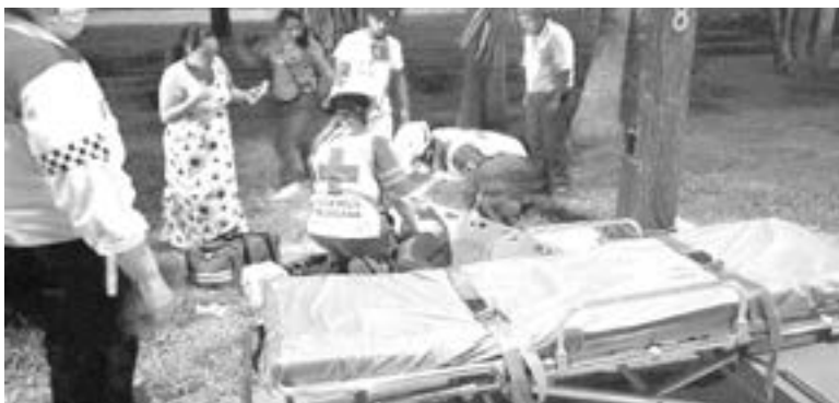
FUE LLEVADA a la sala de urgencias de la clínica del IMSS.

Con lesiones en diversas partes del cuerpo resultó una