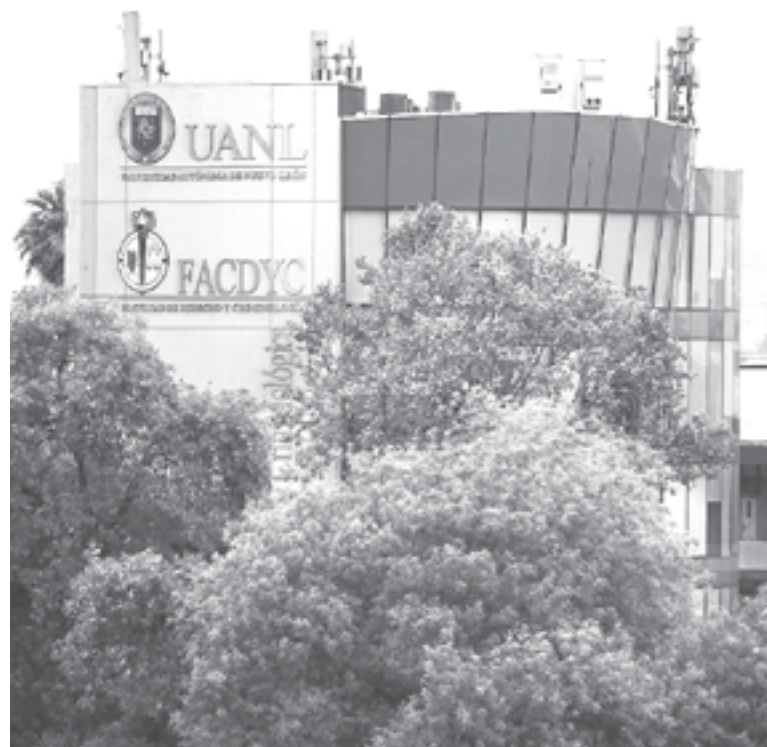
EMPRESAS IRREGULARES cobraron millonada del dinero universitario.

De acuerdo con documentos y reportes a los que tuvo acceso Grupo REFORMA, la contratación de estas compañías ha sido una