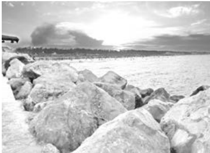
PLAYAS están limpias

En tanto que en estados como Quintana Roo existe este problema, las playas tamaulipecas como: Miramar, Tesoro, Barra del Tordo, La Pesca y Bagdad, están libre de este tipo de algas invasoras. "Esas algas han afectando mu-