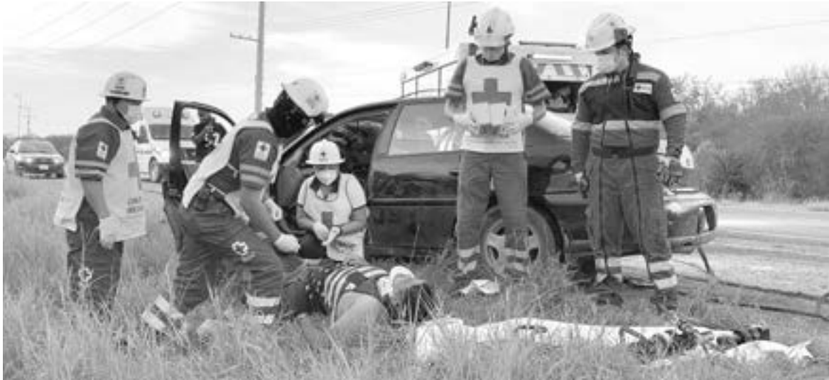
RESCATISTAS extraen el cuerpo del conductor herido.