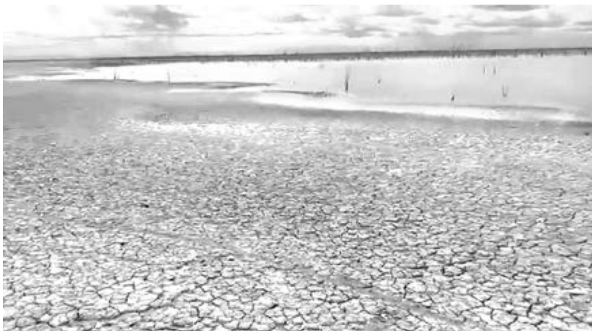
LAS PRESAS siguen en niveles bajos.

Por otra parte, la presa Marte R. Gómez ubicada en el municipio de Camargo, pasó del 87 por ciento a un 92 por ciento en los últimos 21