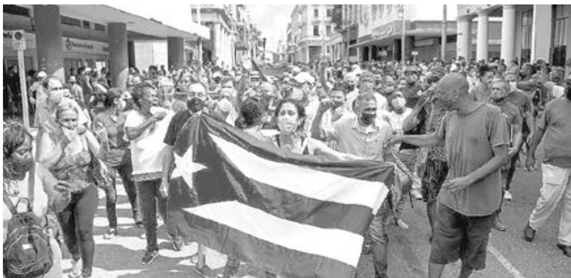
LOS MANIFESTANTES toman las calles de La Habana al grito de "libertad"

En San Antonio hay una fuerte presencia policial y la gente se ha quejado de que se han registrado