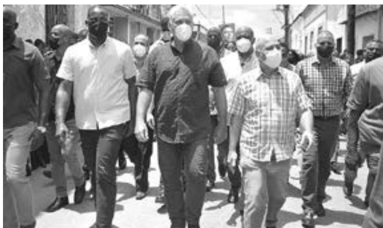
EL PRESIDENTE cubano, Miguel Díaz-Canel se presentó en las calles

actos de violencia contra los manifestantes pacíficos, según relataron vecinos de San Antonio desplazados a esa localidad de la provincia Artemisa, situada unos 37 kilómetros al oeste de La Habana.