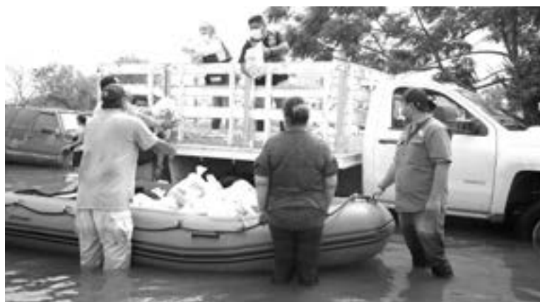
APOYAN A familias damnificadas en Matamoros por instrucciones del Gobernador.