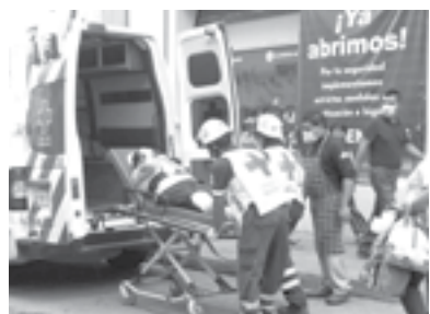
LA MUJER resbaló por una de las escaleras.

Los técnicos en urgencias médicas de la Cruz Roja ingresaron una camilla al negocio para poder llevarla hasta la ambulancia. Posteriormente, fue trasladada a un hospital de la zona donde quedó internada.