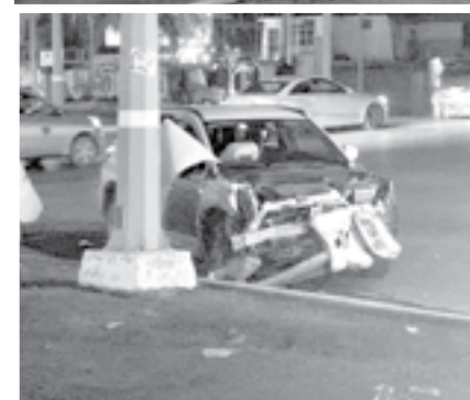
EL CONDUCTOR se impactó y provocó una persecución.