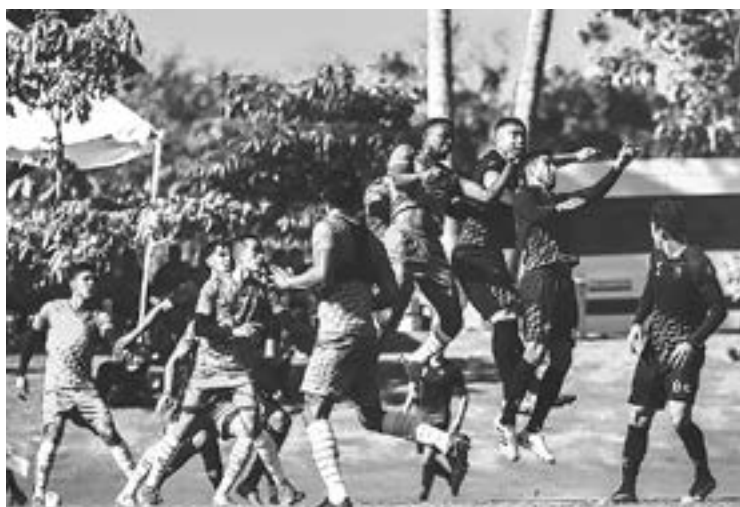
EL PARTIDO fue a 4 tiempos de 30 minutos cada uno

El conjunto porteño se trasladará a la ciudad de Guadalajara, Jalisco, donde continuará con su preparación rumbo al inicio de la Temporada 2021/2022 de la Liga BBVA Expansión MX.