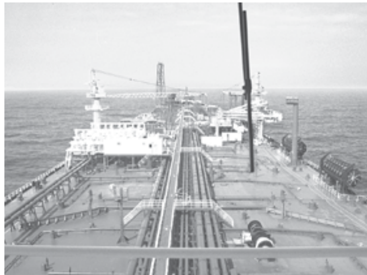
PARTICULARES no podrán importar combustibles.

Sin embargo, el cambio no aplica ni a Pemex ni a CFE, que podrán importar y exportar desde distintos puntos.