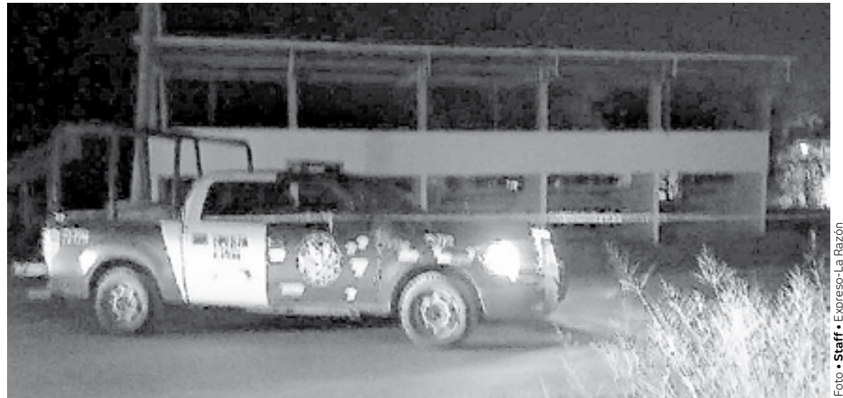
SE PRESUME que el hombre murió asfixiado.

Lo anterior generó intensa movilización de cuerpos de seguridad al punto se trasladaron elementos de Fuerza Civil, Policía Municipal y Guardia