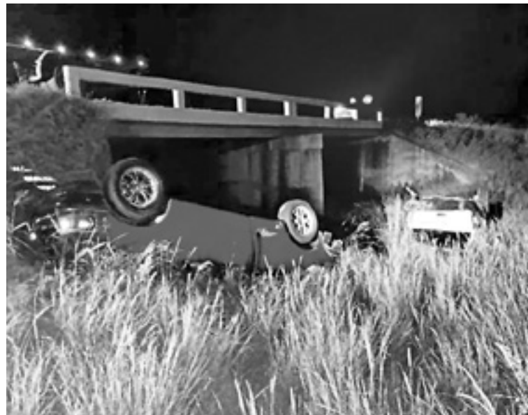
EL ACCIDENTE ocurrió a pocos kilómetros de San Fernando.