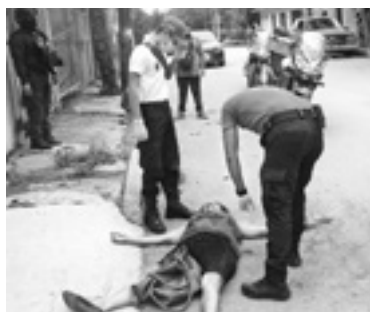
LA MUJER recibe los primeros auxilios.

mentos del grupo motorizado Delta de la Policía estatal quienes confirmaron que se trataba de