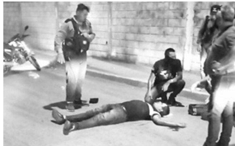
EL MOTOCICLISTA se golpeó contra el pavimento.

Los agentes viales tomaron conocimiento del choque momentos después.