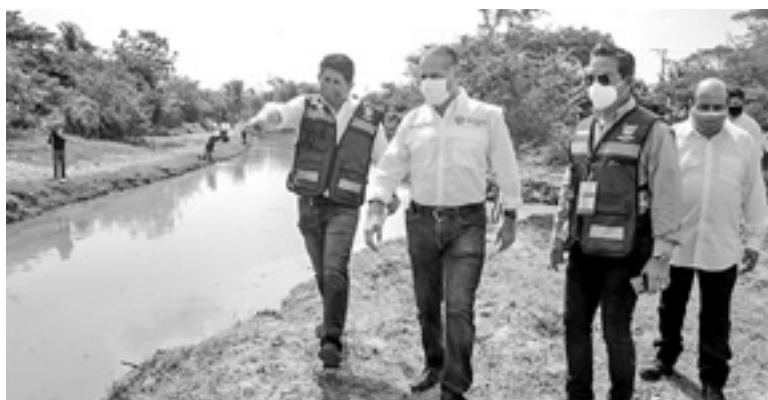
EL ALCALDE supervisó los trabajos.

“Trabajamos permanentemente en la limpieza de toda la infraestructura pluvial que tenemos en Ciudad Madero, y hemos acelerando el paso para estar listos ante la