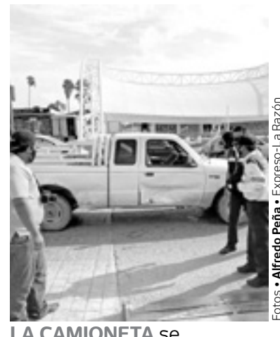
LA CAMIONETA se desplazaba de sur a norte por el 17