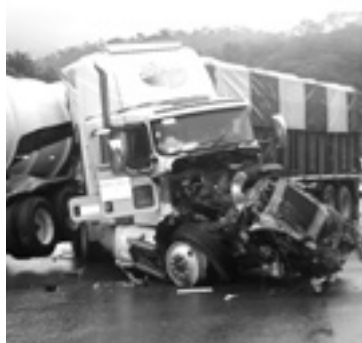
EL FUERTE percance no tuvo 'saldo rojo'.