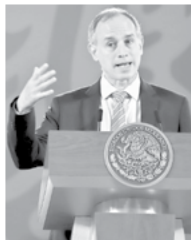
HUGO LÓPEZ Gatell, subsecretario de Salud.

La titular de la SST reveló que en Tamaulipas se ha comprobado