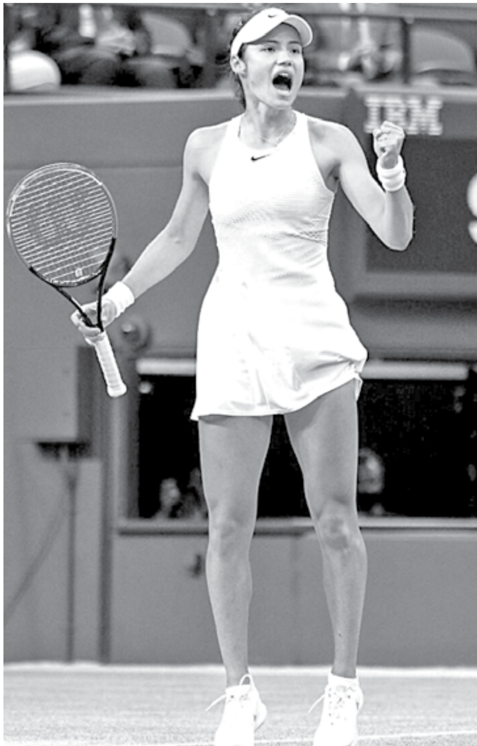
CON 18 AÑOS todo mundo la ha volteado a mirar

“Estaba tan contenta de poder golpear con ella y ver lo intensa que era. Definitivamente hizo que al-