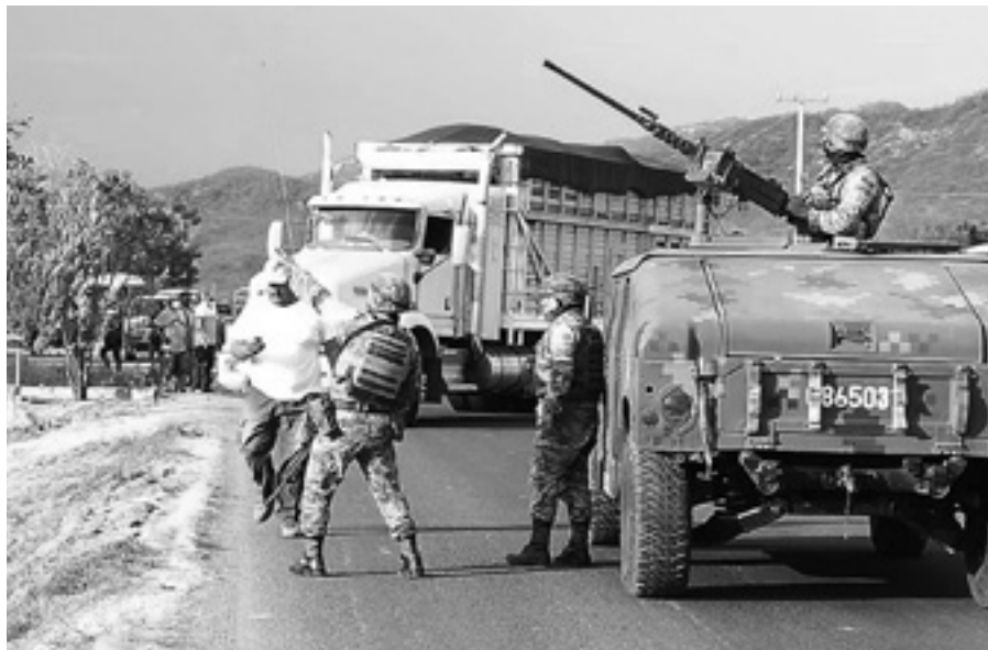
UNA ZONA CONTROLADA en su totalidad por la DO

Luego de horas de reunión entre habitantes de al menos siete comunidades con autoridades federales y estatales, los militares se