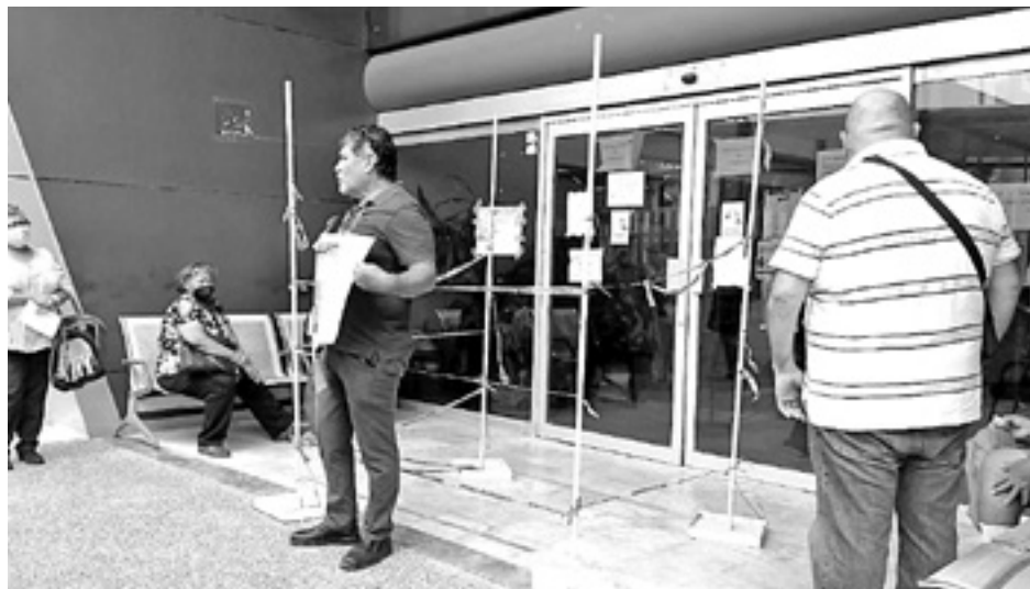
EL DOCTOR está en protesta por el desabasto de medicamentos en el ISSSTE.

el suficiente surtimiento de medicamentos, ya parte están violando el primer punto de darle nosotros, lo que nosotros consideremos adecuado para su padecimiento”, expuso.