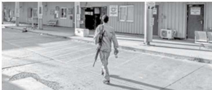
UNA DE LAS GUERRAS más largas en la historia de Estados Unidos

septiembre, el vigésimo aniversario del ataque terrorista de Al Qaeda a EU que provocó la invasión de Afganistán.