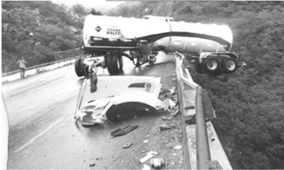
EL CILINDRO quedó con los ejes traseros al aire.