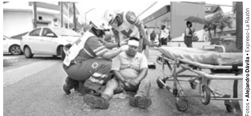
EL EMPLEADO sufrió severos golpes y fue hospitalizado.