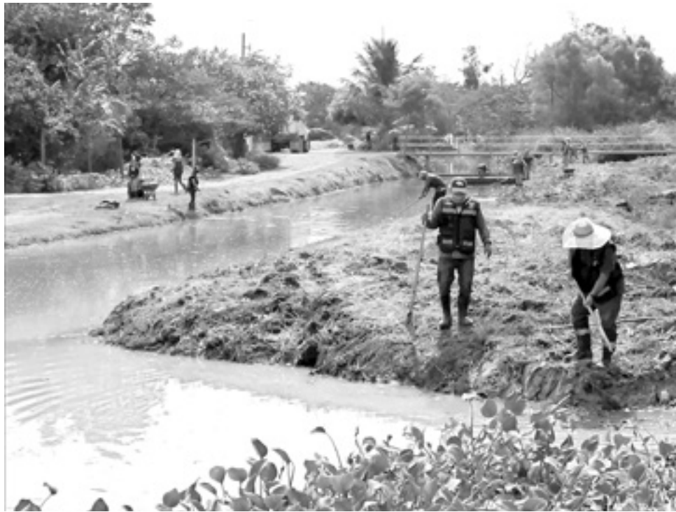
HAY PRESENCIA de cocodrilos en los canales de Madero.

Puntualizó que no es trabajo de Servicios Públicos realizar capturas, sino que envían un informe a protección civil y que tome las me-