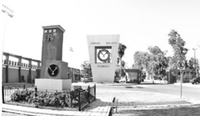
LA UAT rechazó los presuntos desvíos financieros.

“La Universidad como entidad pública, mantiene una política de transparencia y rendición de cuen-