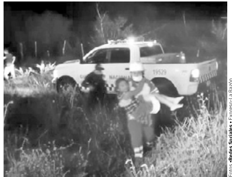
CUATRO NIÑOS sufrieron lesiones en este percance.