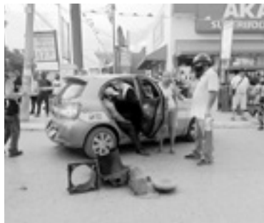
ALGUNOS de los lesionados viajaban en el taxi.

05 PERSONAS LESIONADAS, 2 DE ELLAS DE GRAVEDAD