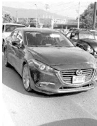
EL AUTOMÓVIL circulaba por Carrera Torres.

En cuanto a los daños que estos se valorizaron en los 25 mil pesos.