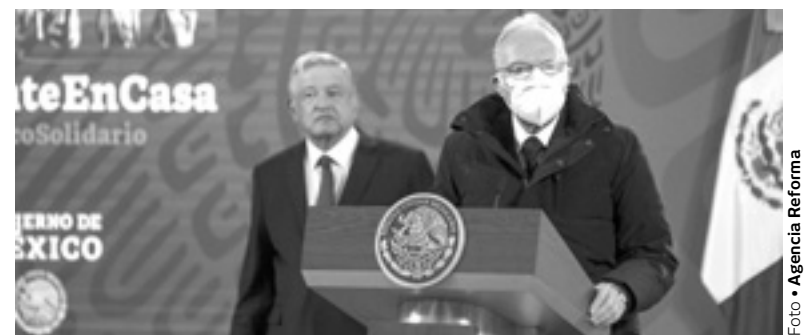
UNA 'REFORMA' retrógrada en todos los sentidos

El punto más relevante de la demanda, que la Corte podría tardar más de un año en resolver, es que la ley permite a la FGR colaborar o no con los diversos sistemas y mecanismos nacionales en varios temas de protección a los de-