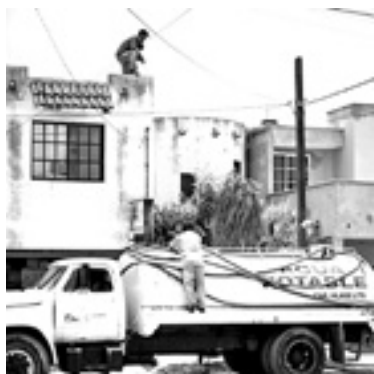
COMAPA REALIZA el abastecimiento de agua.