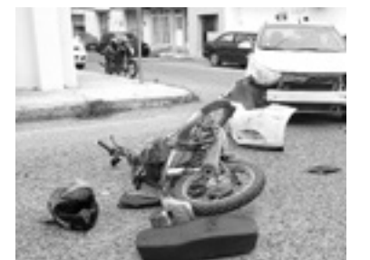
EL CONDUCTOR del coche no hizo el alto obligatorio.

Un elemento motorizado de la dirección de tránsito fue el primero en llegar hasta ese cruce, confirmando la presencia de una persona