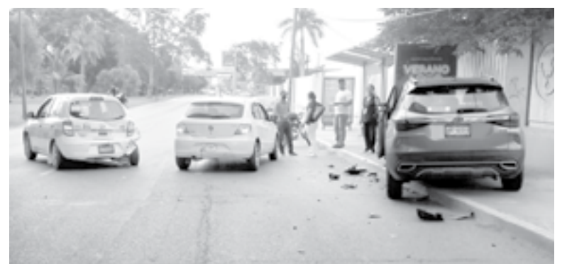
POR EL impacto, el Kia quedó arriba e la banqueteta.