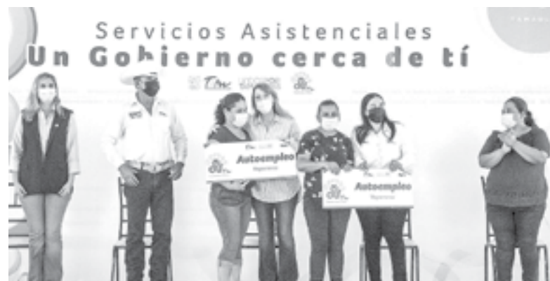
LLEVAN BENEFICIOS de un gobierno Cerca de Ti a San Carlos

San Carlos, Tamaulipas.- El Gobierno del Estado y el DIF Tamaulipas llevaron este martes a las familias de San Carlos más de 40 servicios institucionales gratuitos con la brigada Un Gobierno Cerca de Ti, con el objetivo de que los habitantes de las zonas rurales alejadas a la capital del estado encuentren el apoyo que necesitan para gestionar apoyos o realizar trámites que mejoren sus condiciones de vida.