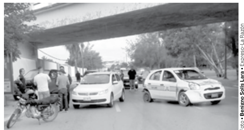
LOS DAÑOS materiales fueron cuantiosos.

La Kia acabó trepándose a la banqueteta mientras que las otras dos unidades quedaron estáticas sobre la vialidad con fuertes daños.