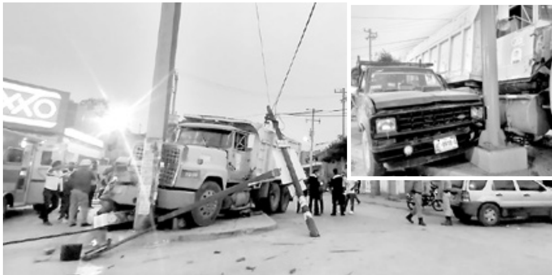
EL CAMIÓN se impactó con un poste de videocámaras y a 6 vehículos.