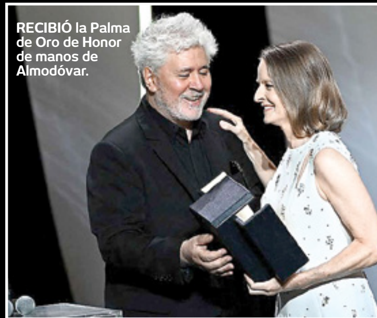
RECIBIÓ la Palma de Oro de Honor de manos de Almodóvar.