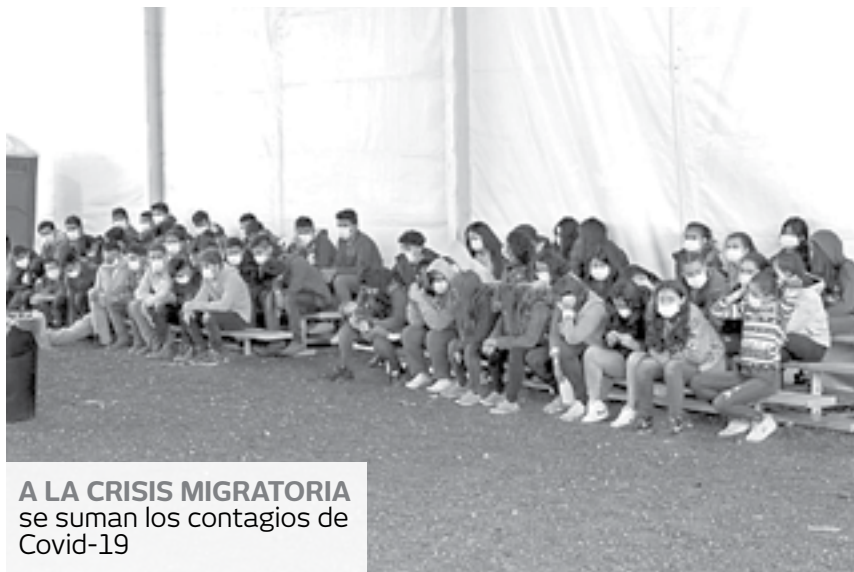
A LA CRISIS MIGRATORIA se suman los contagios de Covid-19

En los últimos meses, la cantidad de migrantes detenidos casi se ha duplicado a medida que crecieron las detenciones en la frontera, según el Servicio de Inmigración y