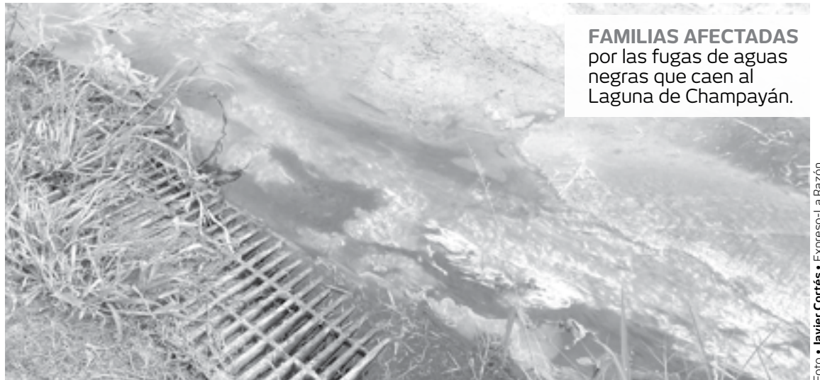
FAMILIAS AFECTADAS por las fugas de aguas negras que caen al Laguna de Champayán.

A través de ese sistema, se suministrará el servicio de energía eléctrica desde la subestación de distribución hasta los usuarios finales que cuenten con su respectivo medidor.