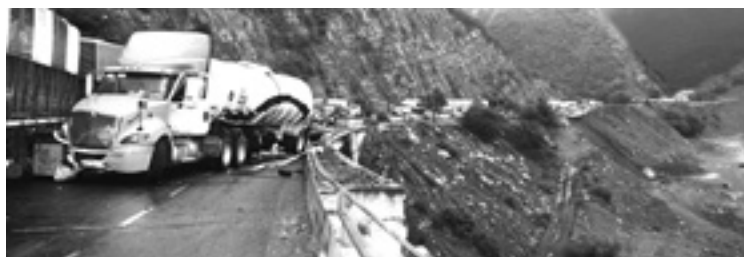
LARGAS FILAS se formaron tras el cierre de la carretera.

El reporte del accidente fue realizado a las 18:00 horas a la altura del kilómetro 10 en una curva cuyo puente atraviesa un profundo cañón. El cilindro de uno de los trailers que estuvo a punto de caer al abismo es de la marca International propiedad de la empresa "Transbalco S.A de CV" con matriz