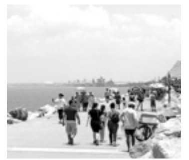
MADERO MANTENDRÁ abierta Playa Miramar.

Al supervisar los trabajos de limpieza en el canal pluvial de la colonia Luna Luna, reconoció que siempre habrá temor del virus, pero que la única manera de en-