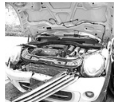
LOS DAÑOS materiales fueron cuantiosos.

los salieron proyectados contra un poste, quedando severamente dañados de la parte frontal.