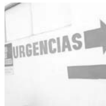
LA MUJER ingresó el estado crítico al hospital Civil.

al sitio para tomar conocimiento del hecho y encargarse de la vialidad ya que solamente quedó habilitado un carril en dirección norte a sur.