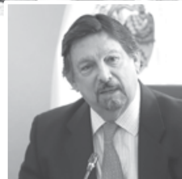
EL GREMIO liderado por Napoleón Gómez Urrutia tomó las instalaciones.