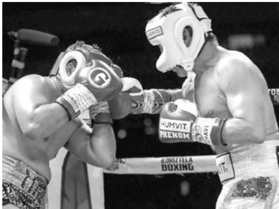
CHÁVEZ SE DESPIDIÓ del pugilismo con este encuentro.