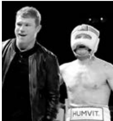
CHÁVEZ ESTUVO acompañado por 'Canelo'.

Chávez quiso despojarse de la careta para el último round, pero su rival se negó. Julio volvió a poner-