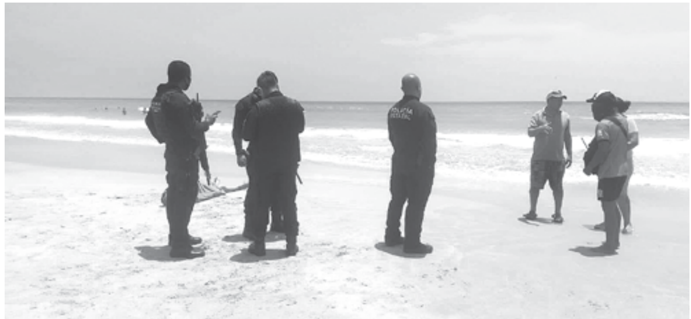
ADULTO PIERDE LA VIDA en aguas de Miramar; familia lo perdió de vista.