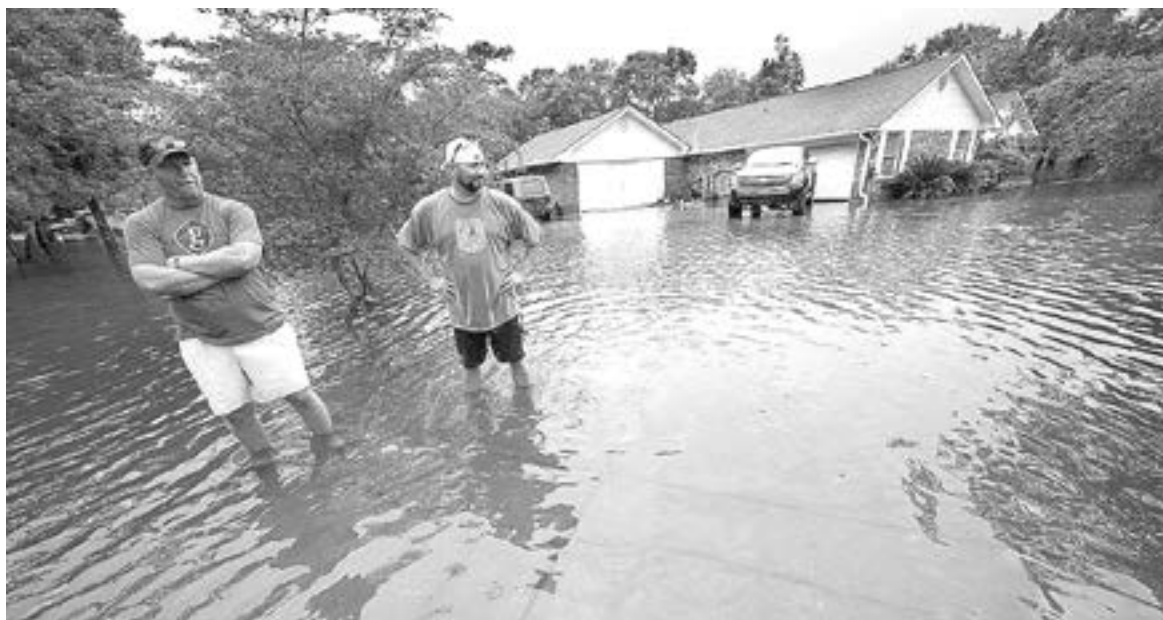
LA TORMENTA 'CLAUDETTE' dejó una estela de muertes y daños

DIEZ PERSONAS, DE LAS CUALES NUEVE ERAN NIÑOS, FALLECIERON EN UN ACCIDENTE DE CARRETERA MIENTRAS QUE UN PADRE Y SU HIJO PEQUEÑO PERECIERON POR LA CAÍDA DE UN ÁRBOL SOBRE SU VIVIENDA