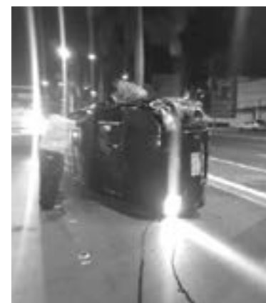
EL OPERADOR perdió el control del volante.

Al circular de sur a norte, el operador perdió el control del volante en ese punto para luego volcar, quedando la camioneta sobre el costado derecho.