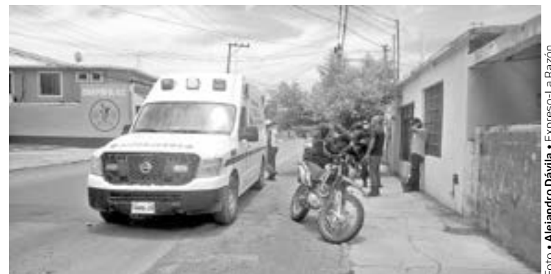
EL LESIONADO conducía una motocicleta Italika tipo cross.

Vecinos del sector fueron los que llamaron al 911 y pidieron el arribo de una ambulancia.