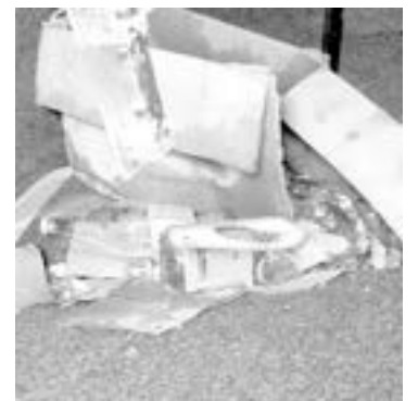
EN EL INTERIOR del auto hallaron cervezas.

Es posible que el estado inconveniente del conductor, lo llevara a declinar hacia carriles contrarios hasta chocar contra un trai-