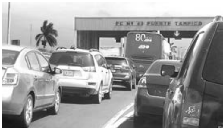
LAS FILAS para cruzar de ambos lados eran enormes.