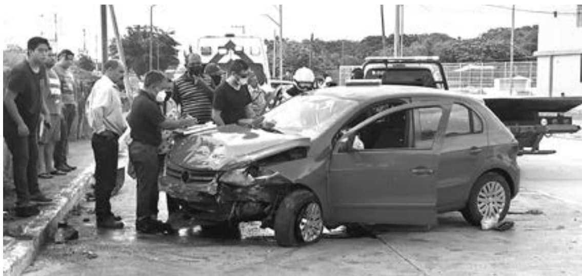
LAS LESIONADAS fueron atendidas por paramédicos de la Cruz Roja.

Presuntamente, el primer vehículo se desplazaba a exceso de velocidad sobre la avenida Monterrey por lo que al llegar a ese punto im-