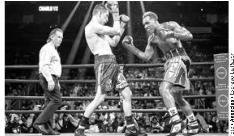
EL MEXICANO ofreció una gran pelea pero no logró ganar.