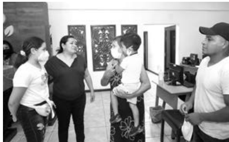
LA MUJER fue entregada a su familia por el Sistema DIF.