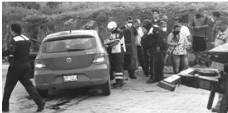
EL EXCESO de velocidad fue la causa principal del accidente.

Técnicos en urgencias médicas de la Cruz Roja arribaron al lugar