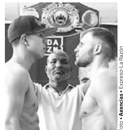
DESPUÉS DE ocho meses el tijuaneño volvió al ring.

Este encuentro va a ser la primera transmisión de Ring Side por Heraldo Radio (98.5 FM), bajo la conducción de Eduardo Camarena, Alfredo Ruiz y Jorge Milhe, en punto de las 20:30 horas, el tijuaneño Munguía (36-0, 29 KO's) es el