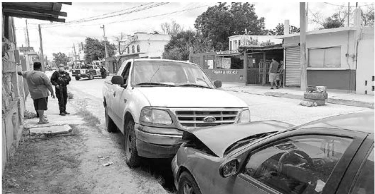
LOS ATAQUES del domingo.