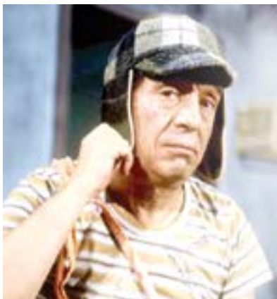
DISNEY no ha mostrado interés por el Chavo.

“Algo que es único de él en términos artísticos y particularmente en cuanto a cómics es que es la única persona que dibujó una tira cómica de Peanuts. Muchos caricaturistas, conforme envejecen se van retirando y alguien más toma el trabajo, pero Charles nunca hizo eso, cada tira fue 100% su pluma, mente y corazón. Es una de las razones por las que sigue resonando en las personas, es muy personal”.