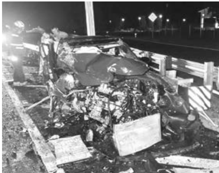
EL COCHE quedó literalmente 'triturado'.