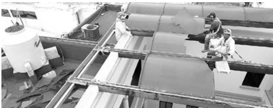
EL EDIFICIO del DIF Tampico se está rehabilitando.