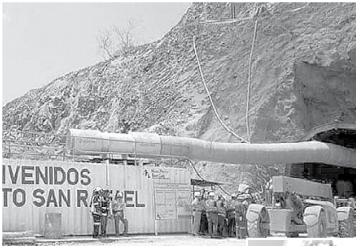
LA MINERA se encuentra en Cosalá, Sinaloa.

150 MDD EN PÉRDIDAS REPORTADAS DESDE HACE AÑO A LA FECHA