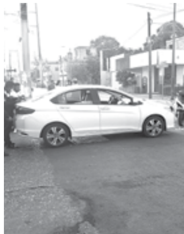
EL AUTO que impactó al motociclista.

Del hecho, tomaron conocimiento elementos de Tránsito y Vialidad para deslindar responsabilidades.