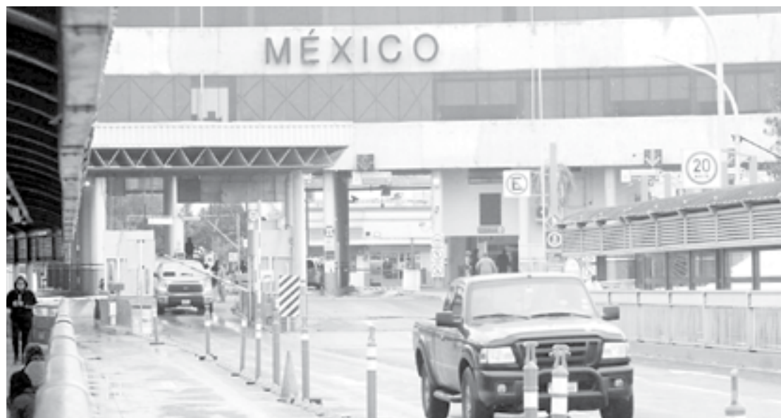
LA FRONTERA seguirá "cerrada".