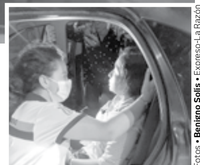
JOVENCITA RESULTÓ lesionada en un choque por alcance.

En el choque intervino a los pocos minutos Tránsito local.