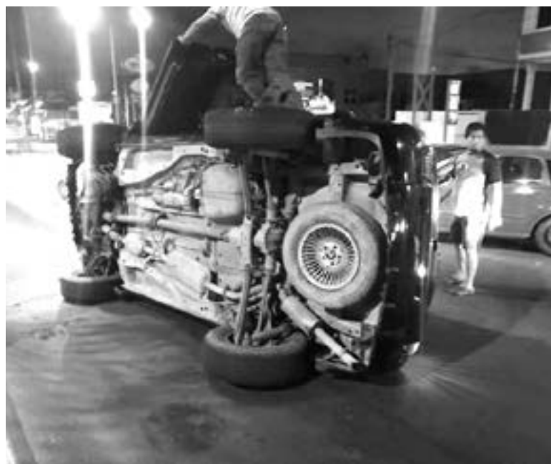
LA VOLCADURA se registró en la colonia Lomas de Rosales.

La mujer de entre 35 a 40 años de edad, permanece bajo el cuidado de un equipo de especialistas.