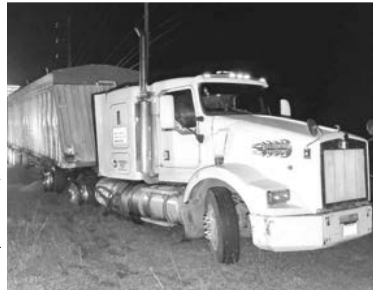
CHOCARON CONTRA este trailer.