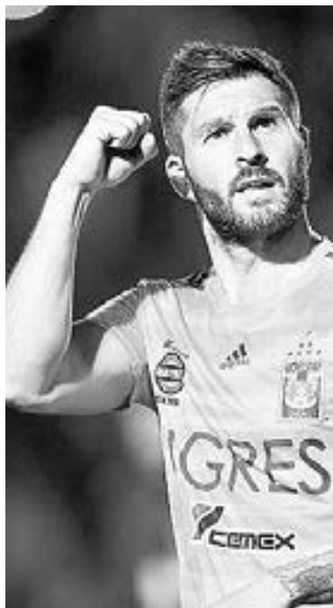
ANDRÉ-PIERRE GIGNAC irá a los Olímpicos.

Para los Juegos, el reglamento autoriza solamente tres jugadores de más de 24 años por cada equipo. El atacante André-Pierre Gignac (35 años) formará parte del equipo