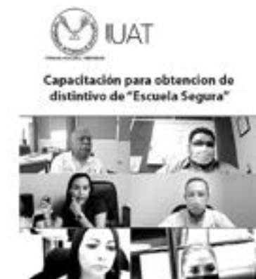
SE ORGANIZÓ un curso virtual.