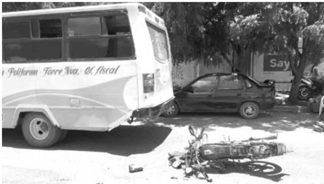
EL MICROBÚS se detuvo para bajar pasaje

De inmediato llamó al 911 y pidió ayuda para el repartidor, quien por suerte no presentaba lesiones de gravedad.