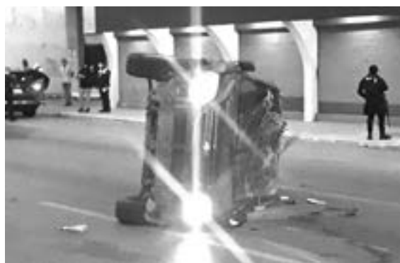
EL HECHO movilizó a los diferentes cuerpos de emergencia

La camioneta se desplazaba de norte a sur por esa vialidad y a la altura de El Mejor Pan terminó volcada. La unidad quedó volcada sobre uno de sus costados. El hecho movilizó a los diferentes cuerpos de emergencia y generó severo congestionamiento vehicular.