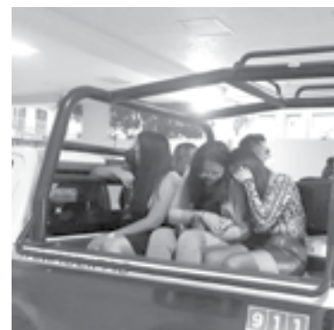
LOS PRESUNTOS estafadores manifestaron que no eran empleados de alguna institución bancaria.