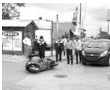
EL JOVEN permaneció en el piso esperando ser atendido.