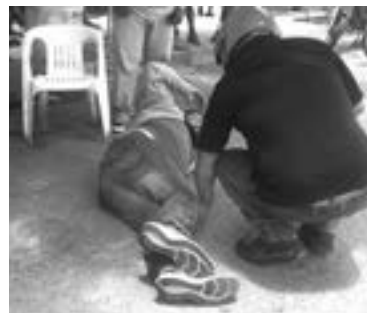
EL MOTOCICLISTA quedó tirado en el suelo y con un fuerte dolor en la pierna

Comentó el chofer de este colectivo, que esperaba a que la última persona descendiera, cuando de pronto vino el golpe que dejó en el piso al motociclista.