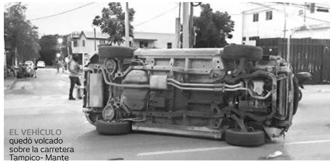
EL VEHÍCULO quedó volcado sobre la carretera Tampico- Mante

La circulación vial se vio afectada por espacio de varias horas.