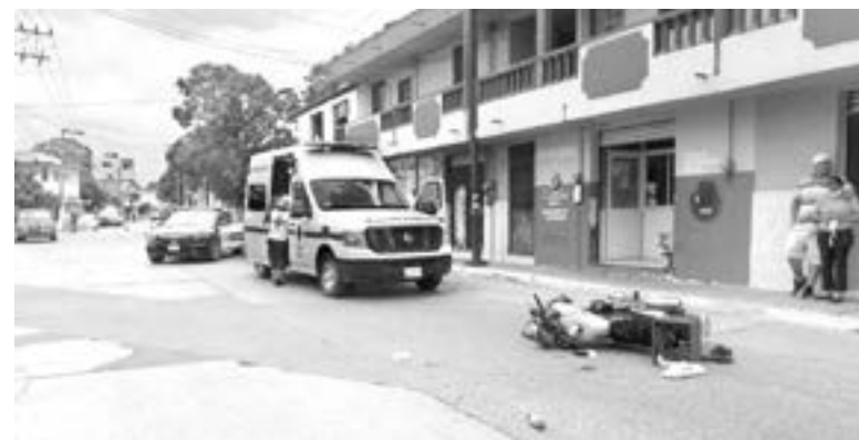
LA MOTOCICLETA quedó tirada en el asfalto.

El operador del vehículo de dos ruedas terminó con fractura en la pierna izquierda, siendo atendido por técnicos en urgencias médicas de la Cruz Roja y trasladado a un hospital.