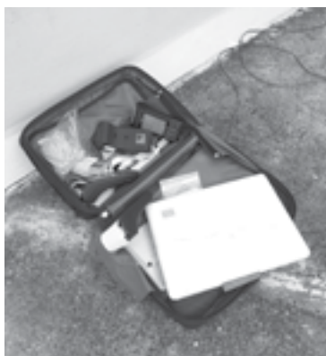
ALGUNAS DE las herramientas con las cuales cometían sus atracos.