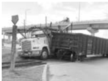
LA MOLE de acero arrastró al camión unos cuantos metros.