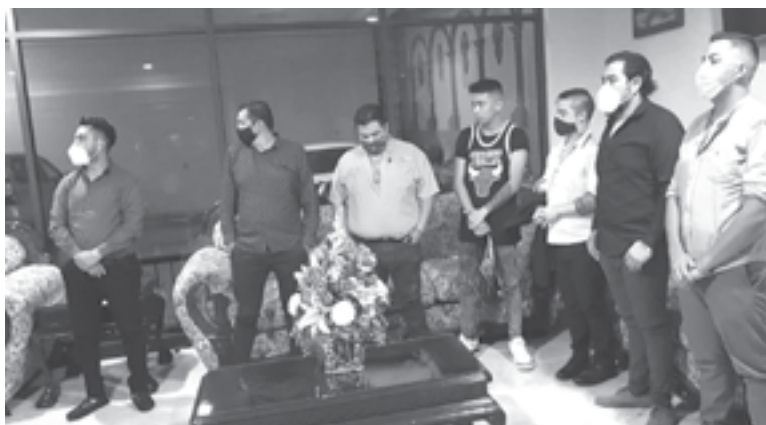
LA BANDA de clonadores es originaria de la Ciudad de México.

Debido a lo anterior, fueron llevadas a las oficinas de la Fiscalía General de Justicia del Estado de Tamaulipas en la zona quedando a disposición de la autoridad competente.