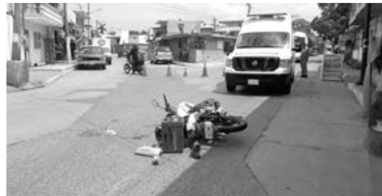
LA CALLE fue cerrada al tráfico.

Al lugar acudieron peritos viales para tomar conocimiento del hecho y así deslindar responsabi-