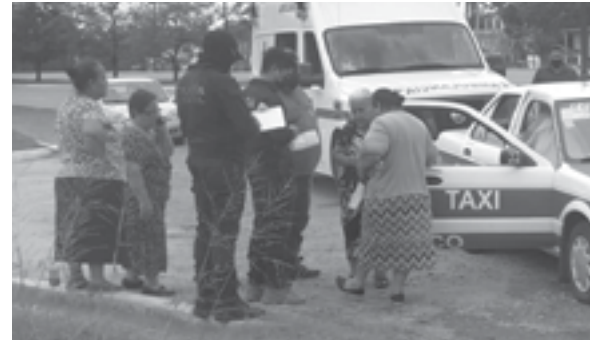
FAMILIARES DEL occiso acudieron a identificar su cuerpo.