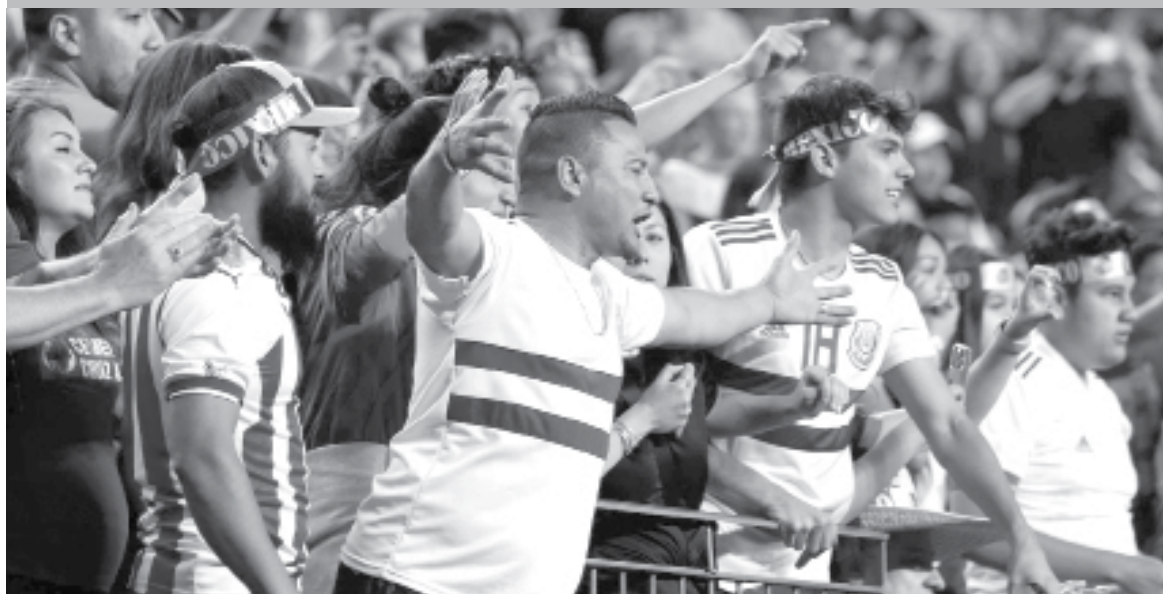
LA SELECCION Mexicana tendría muy graves consecuencias a causa de aficionados

rá sancionada por la FIFA, ahí es donde está el riesgo".