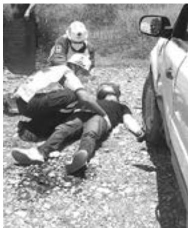
EL MOTOCICLISTA se llevó un fuerte golpe

Se desplazaba de sur a norte sobre el carril izquierdo del Eje Vial y poco después de pasar por Conrado Castillo, rebotó contra el lado izquierdo de una Ford Escape.