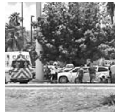
UNA DETENCIÓN fue a la altura del Hotel iStay

Tránsito local apoyó también para tomar conocimiento sobre los