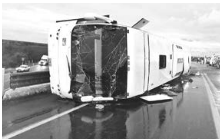
EL ACCIDENTE vial se registro en el tramo Manuel González.

Un grupo de indocumentados que resultaron mal heridos tras la volcadura del autobús en el distribui-