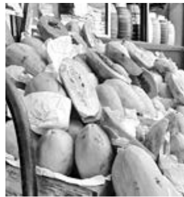
LAS FRUTAS y verduras se echan a perder fácilmente.

“Estamos viendo que los compañeros tengan sus negocios como debe de ser, usando el tapete sanitizante, que tengan el gel, que chequen la temperatura y por supuesto que estén sanitizando sus establecimientos de forma continua”.