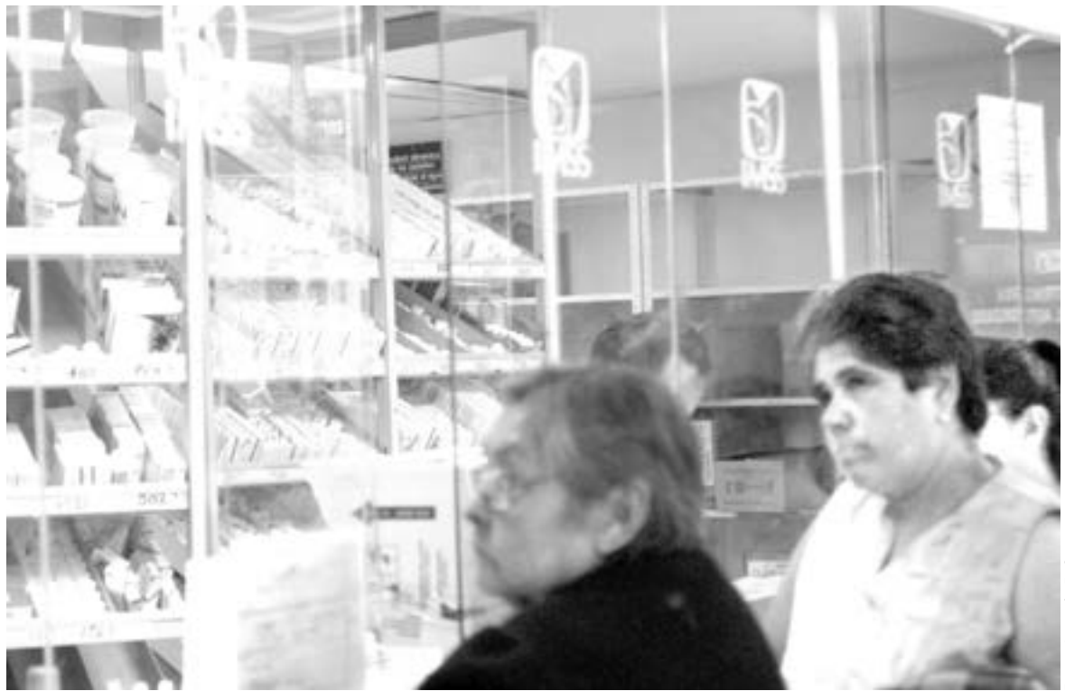
LIGIAN DEUDA de Ssa con caída en gasto

PREGUNTA LÓPEZ Obrador '¿Quién era Presidente cuando se hizo L-12?'