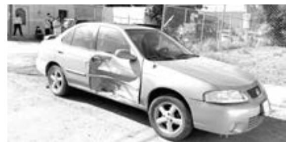
EL COCHE afectado.

vieron en el suelo, pidieron el apoyo de los socorristas por medio de llamadas al 911.