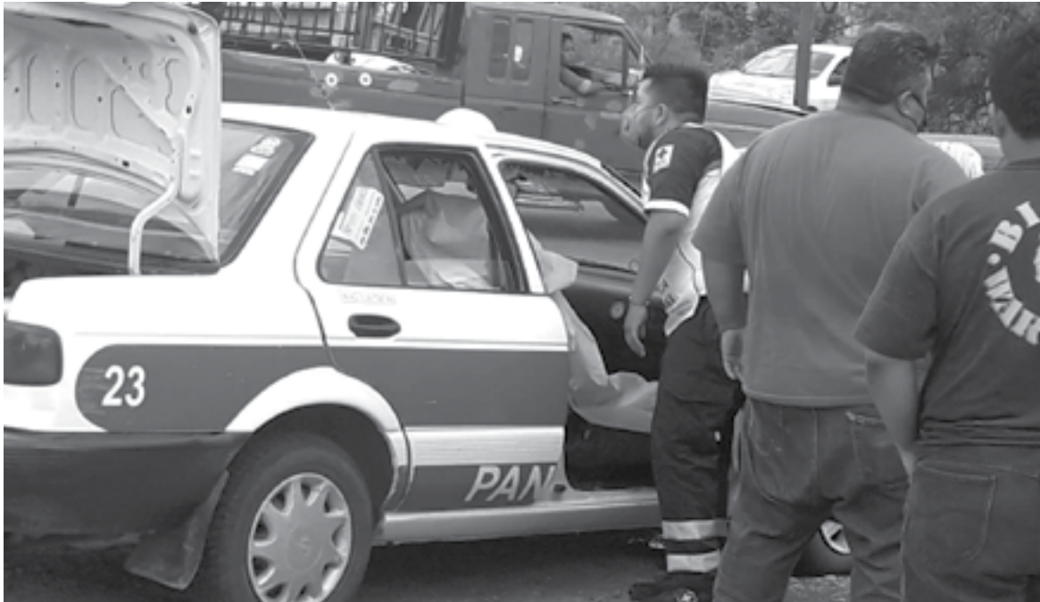
EL HOMBRE quedó tendido en el asiento del copiloto.