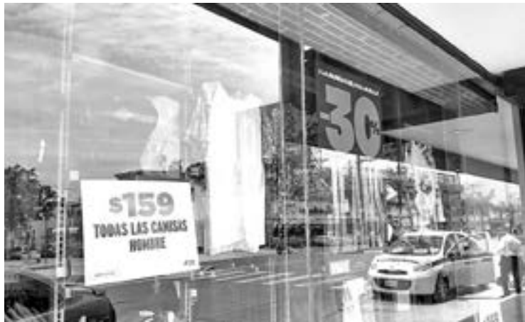
CONFÍAN COMERCIOS un repunte en sus ventas.