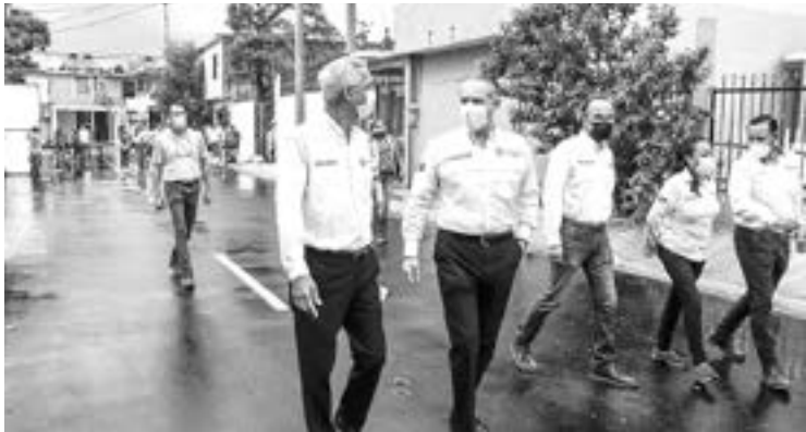
CONTINÚAN LAS obras en Ciudad Madero.

Luego de hacer el cortón de listón en ambas calles, el Presidente Municipal escuchó a las familias respetando la sana distancia y refrendó su compromiso de seguir trabajando arduamente para acelerar el desarrollo del municipio maderense.