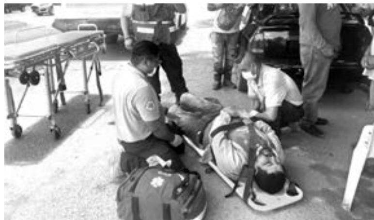
EL MOTOCICLISTA sufrió una fuerte lesión en una pierna