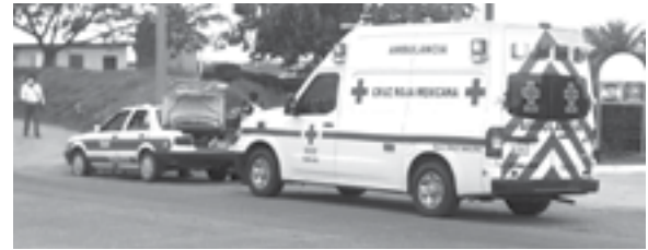
CRUZ ROJA asistió a brindar los primeros auxilios pero ya el hombre había muerto.