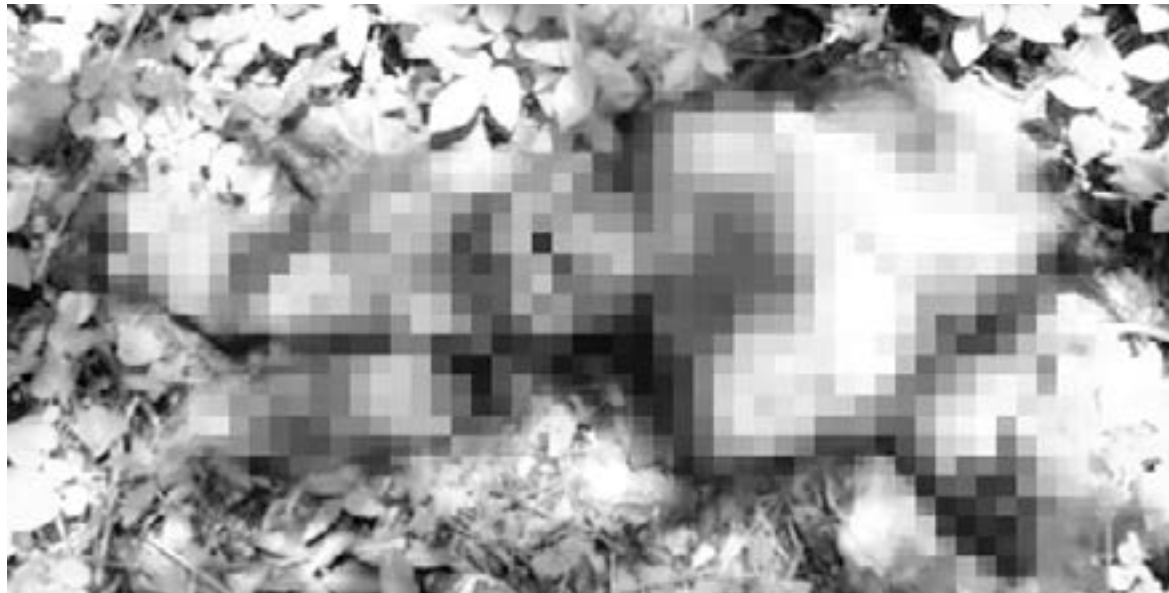
EL CUERPO fue localizado al realizar labores de limpieza

Los tétricos hechos se presentaron cuando trabajadores efectuaban limpieza en la carretera y encontraron restos humanos, en los límites entre Tampico Alto y Pueblo Viejo, esto en el tramo carretero km 185 con 700.