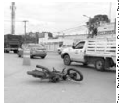
EL JOVEN fue trasladado para recibir atención médica.