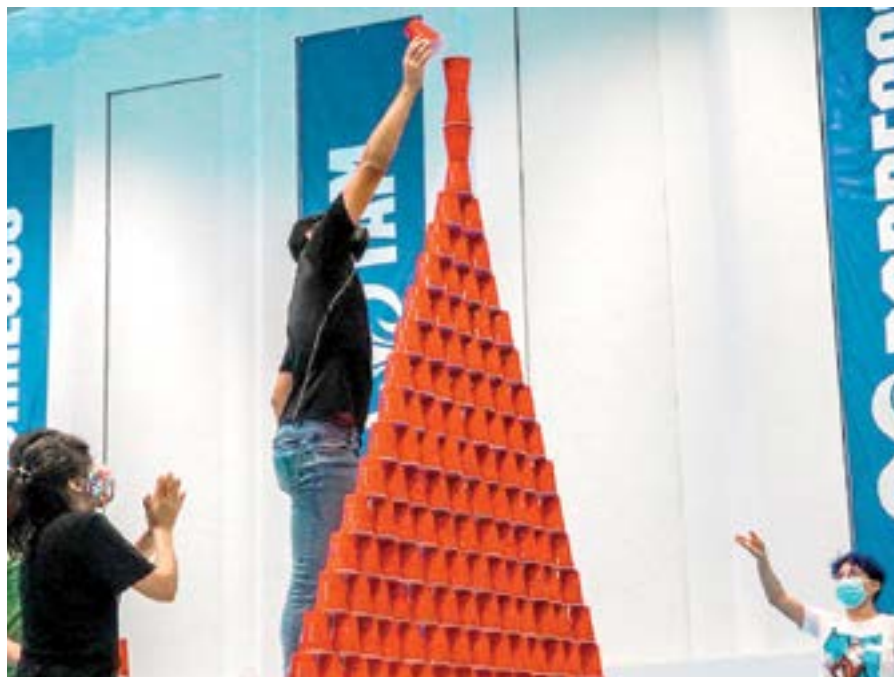
VARIAS ACTIVIDADES voluntarias de integración realizaron en el Tec de Monterrey.

pandemia del Covid 19 que los tuvo que separar de sus actividades escolares.