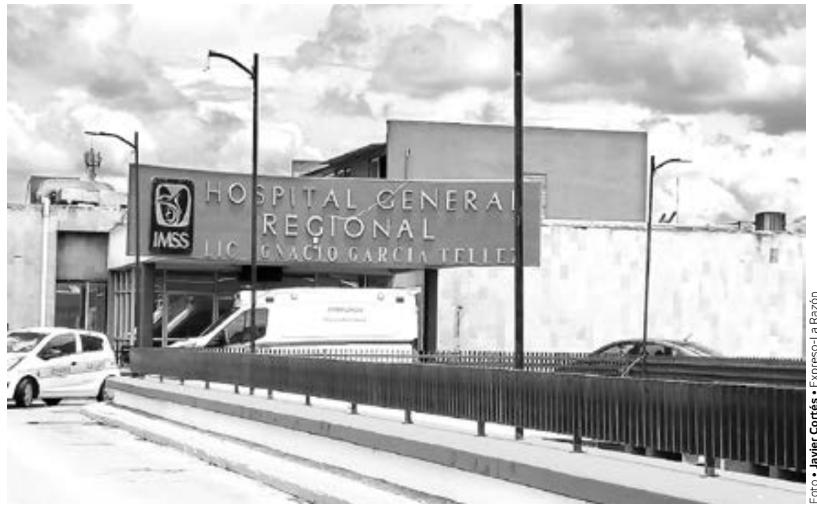
EL IMSS lamentó la situación.