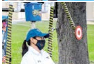
LOS CHICOS del Tec disfrutaron de un divertido día al aire libre.

pandemia del Covid 19 que los tuvo que separar de sus actividades escolares.