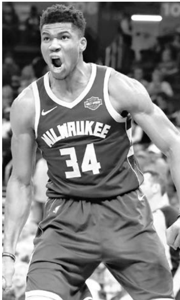
EL GRIEGO sufrió mucho con su familia previo a su llegada a Estados Unidos

Giannis junto a sus padres sobrevivían como vendedores ambulantes, hoy él es una estrella de NBA con un contrato millonario pero con la misma humildad