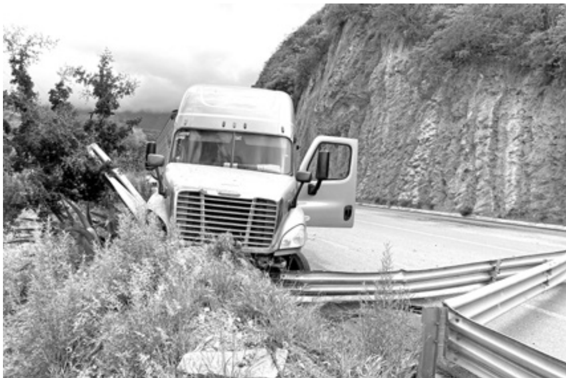
EL TRAILER se fue a estrellar contra el talúd de la sierra.

El chofer del camión explicó que debido a la lluvia que caía en esos momentos determinó seguir la marcha por la orilla de