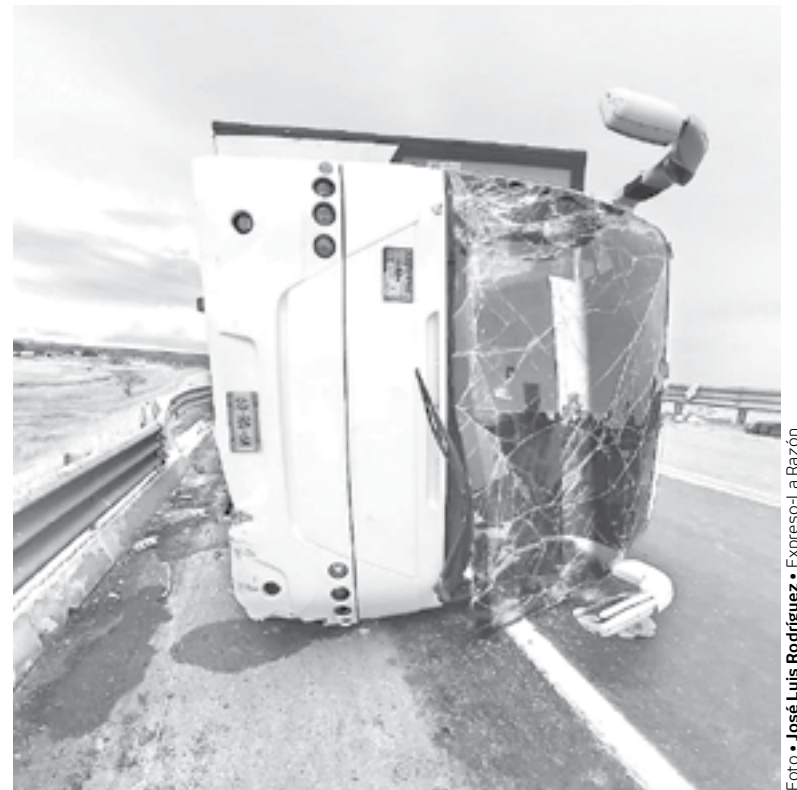
LA MITAD de los pasajeros resultó con diversas lesiones.

Los datos aportados, advierten que fueron trasladados 21 adultos y