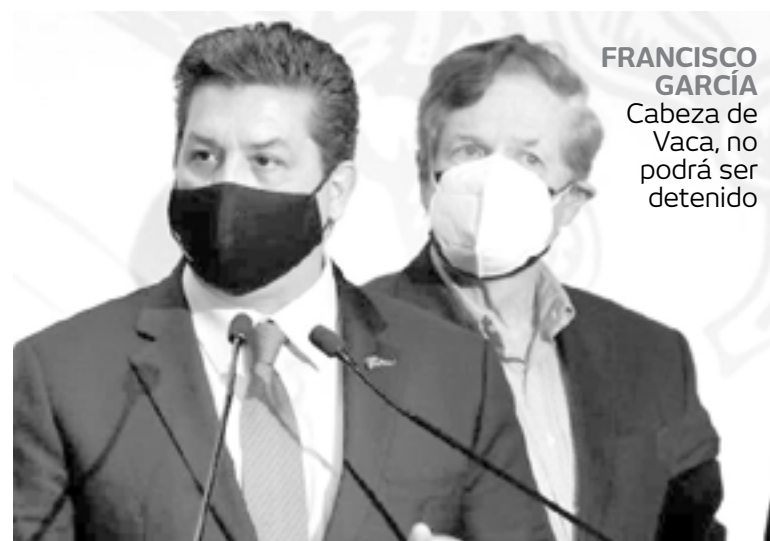
FRANCISCO GARCÍA Cabeza de Vaca, no podrá ser detenido

Este jueves 17 de junio, el Primer Tribunal Colegiado del Décimo Noveno Circuito declaró sin mate-