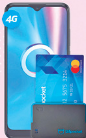
ALCATEL | 5030A 1SE 64GB más Billpocket A: $2,999 1