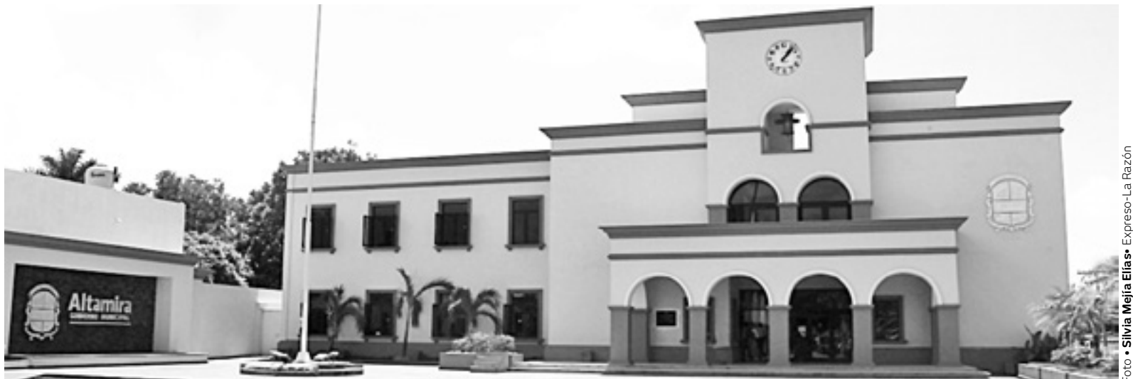
LOS TRABAJADORES deberán volver a sus labores.

El funcionario señaló que en todo momento el municipio de Altamira ha cumplido con es-