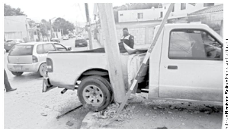
POR FORTUNA no hubo lesionados en el choque.

Del hecho tomaron conocimiento elementos de Tránsito para deslindar responsabilidades.