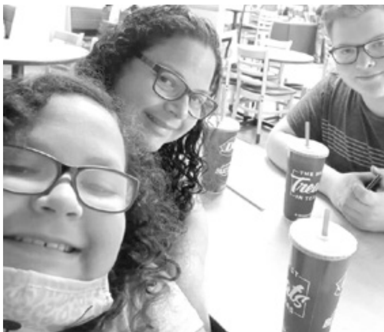
SE TRATA de una mujer y sus dos menores hijos.