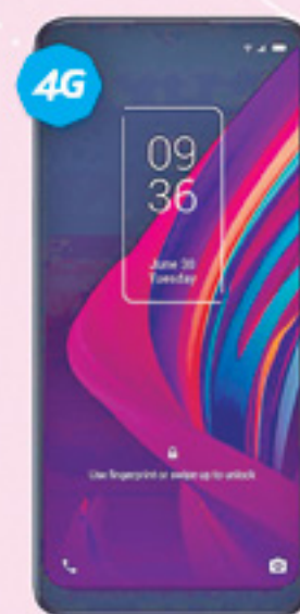
TCL | 10 SE 128 GB A: $4,889 1