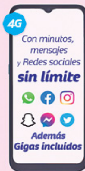
MOTOROLA | Moto E7 A: $3,699 1