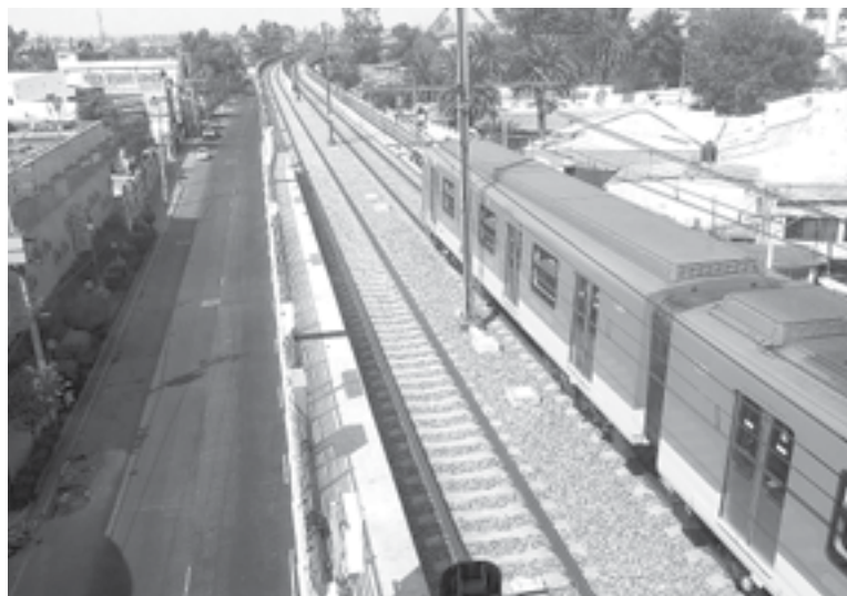
VIADUCTO ELEVADO de Línea 12 será difícil de volver a utilizar.

Ebrard enfatizó que lo que presentó la Jefa de Gobierno de la Ciudad de México, Claudia Sheinbaum, sobre la tragedia del Metro fue un dictamen preliminar, y reiteró su postura difundida el miércoles referente a que la construcción de la Línea Dorada del Metro fue una