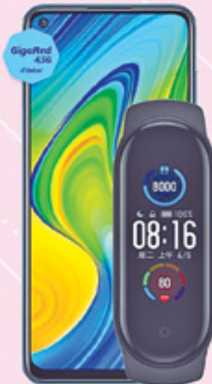
XIAOMI | Redmi Note 9 + Mi Band 5 A: $6,139 1