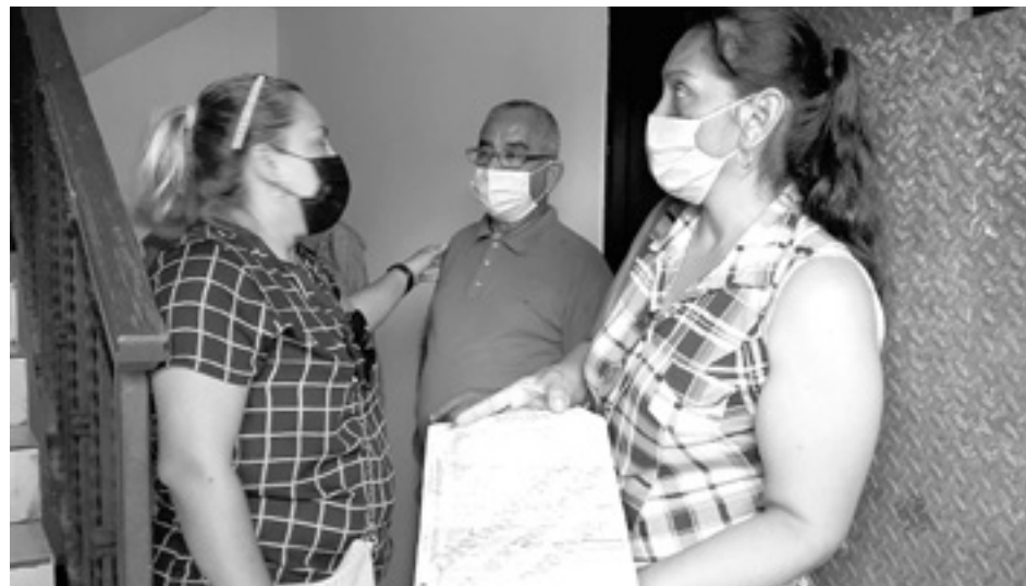
FAMILIARES DEL OCCISO exigen una aclaración de lo ocurrido.