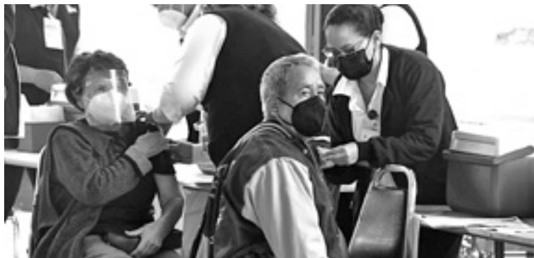
DEBERÁN TENER completo su esquema de vacunación anticovid.

EL MUNICIPIO SEÑALÓ QUE SE ANALIZARÁN LOS CASOS