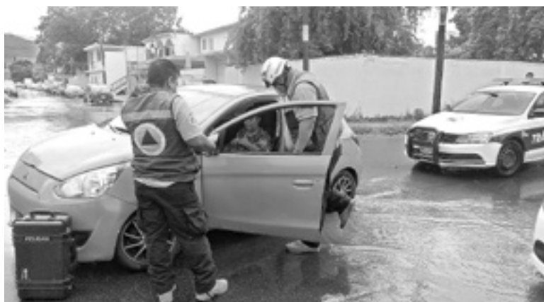
LA MUJER resultó con múltiples golpes.

Quienes también se dieron cita en la zona, fueron los elementos de Protección Civil del Estado