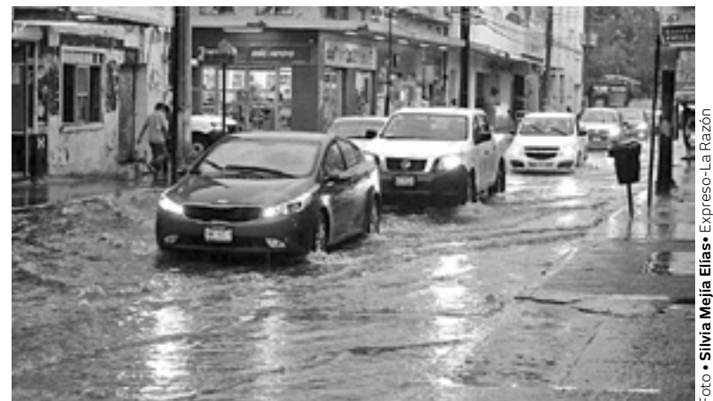
UNA INTENSA lluvia es la que se espera para el día de hoy.

L luvias y tormentas eléctricas son los que se pronostican para las próximas horas en la zona sur de Tamaulipas debido al sistema de baja presión que se espera se intensifique gradualmente a la par de qué se dirige hacia las cosas de Es-