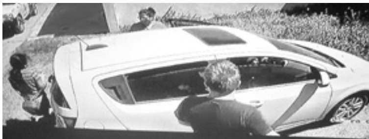
SALIERON de Laredo hacia Nuevo León y en el retorno desaparecieron.