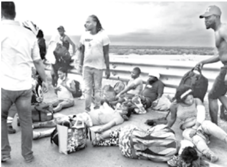
EL CAMIÓN volcó en el tramo Manuel-González.