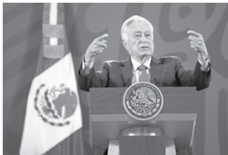
MANUEL BARTLETT DÍAZ, director general de la CFE.