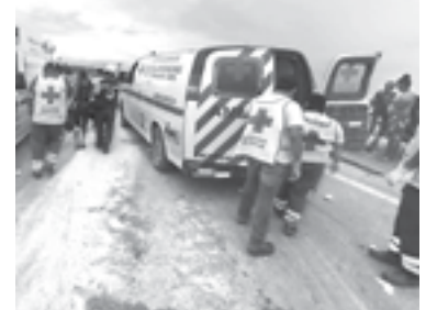
LA UNIDAD volcada venía desde la zona sur del país.

Los socorristas informaron que los heridos, presentaron lesiones menores, pero que requerían asistencia de los especialistas del área de urgencias.