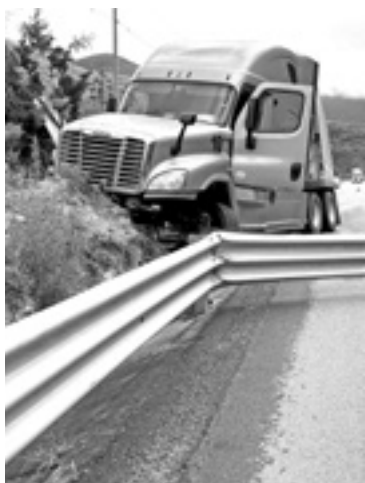
ARRANCÓ 20 metros de la contención de acero.

la carpeta asfáltica para evitar los encharcamientos.