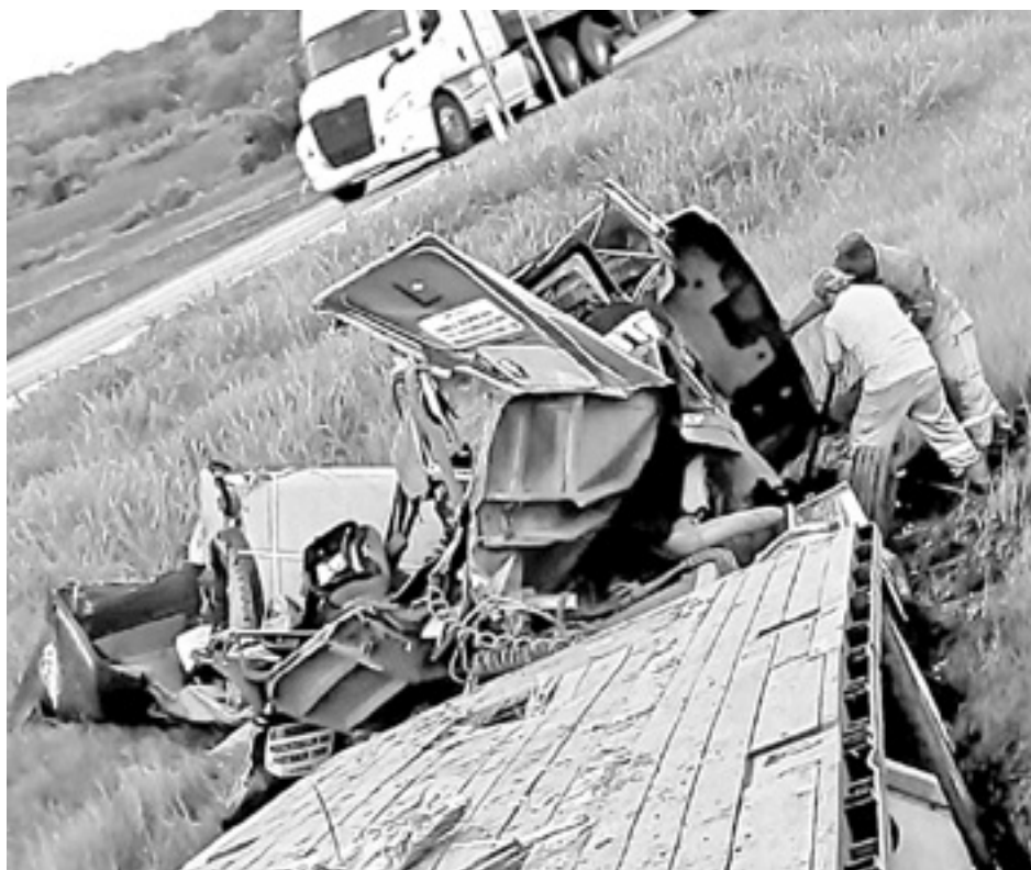
LOS ROLLOS de material se desprendieron de la caja del tráiler.

metal los cuales se desprendieron de la plataforma y pasaron por encima de la cabina en cuyo interior estaba el chofer de esta unidad quien quedó lesionado.