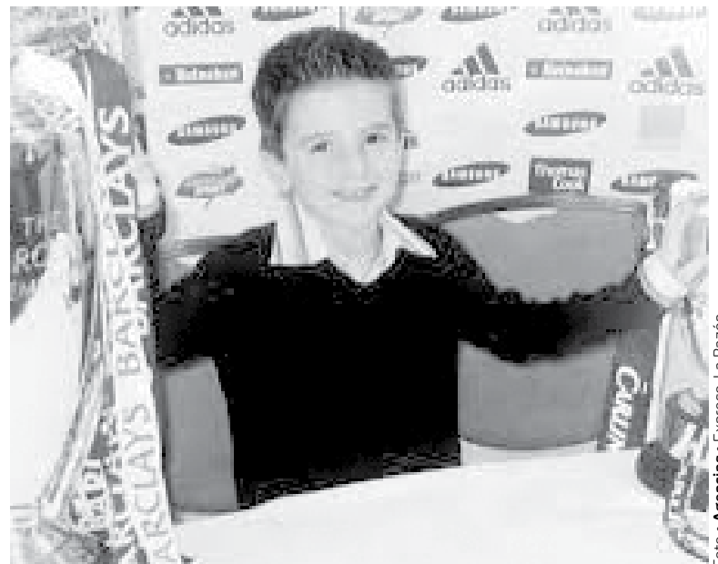
DESDE PEQUEÑO ha sido aficionado y jugador