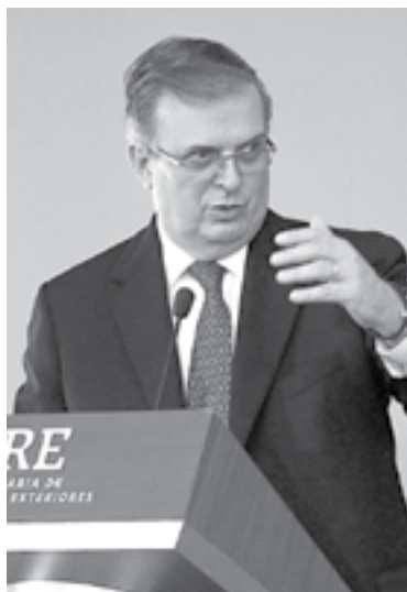
"FALTA MUCHO para el 2024" afirma Marcelo Ebrard.

"Yo me estoy concentrando en mi trabajo, para mí ese tema es un tema que está muy lejos todavía y habrá que ver cómo sucede. No me anima o no es lo que guía mis tareas,