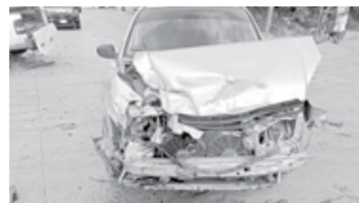
EL COCHE presentaba fuertes afectaciones en la parte de enfrente.