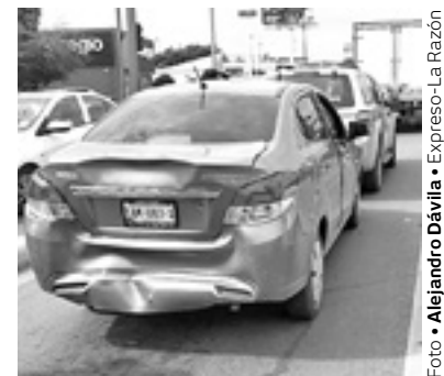
EL COCHE afectado presentaba severos daños en la carrocería.

Los daños materiales fueron de consideración ya que la contención causó daño a la cabina.