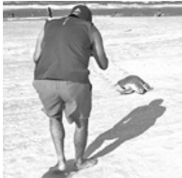
LOS TURISTAS disfrutaron de este momento.

UN ESPECTÁCULO DE LA NATURALEZA SE VOLVIÓ LA LLEGADA DE ESTOS GALÁPAGOS, LOS TURISTAS NO PERDIERON OPORTUNIDAD DE GRABAR EL MOMENTO