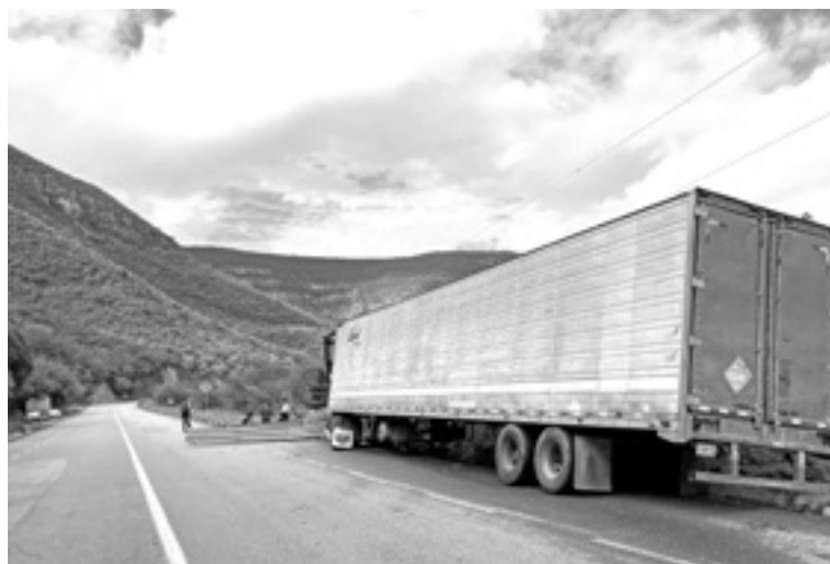
LLEVABA UNA carga de 18 toneladas de brócoli.

Al llegar a una curva la caja cayó al canaleta del dren pluvial lo que provocó que la cabi-