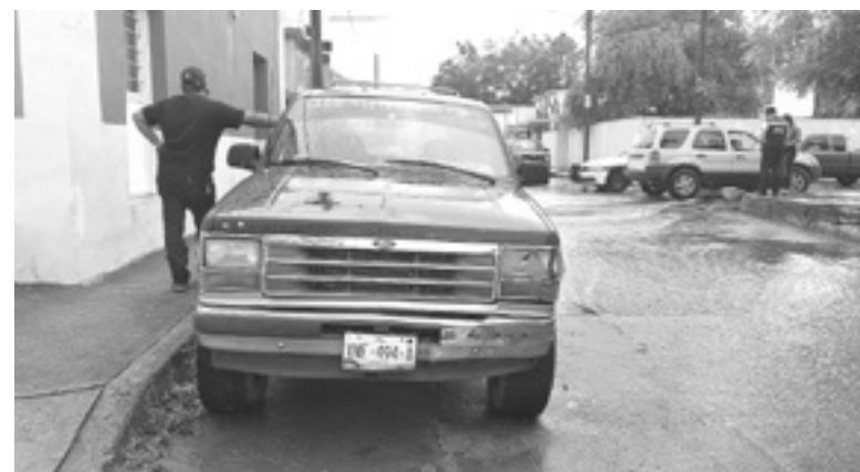
LA CAMIONETA responsabilizada.

Los de vialidad explicaron que esta fémina, era la conductora de un coche Mitsubishi el cual guiaba con preferencia de paso en sen-