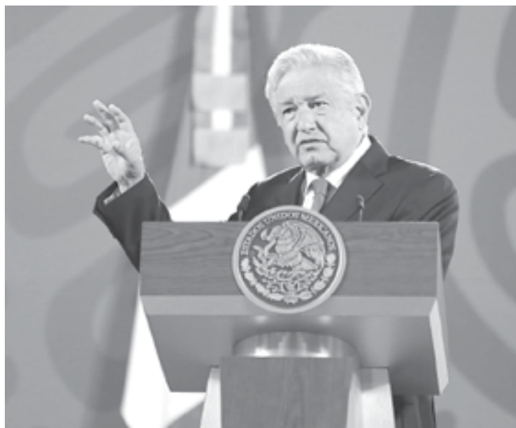
HIDROELÉCTRICAS RESOLVIERON el problema: AMLO.

“Claro que no (habrá apagones), al contrario. Las hidroeléctricas de Chiapas generaron la energía necesaria para enviar energía...por eso se resolvió el problema en 5 días,