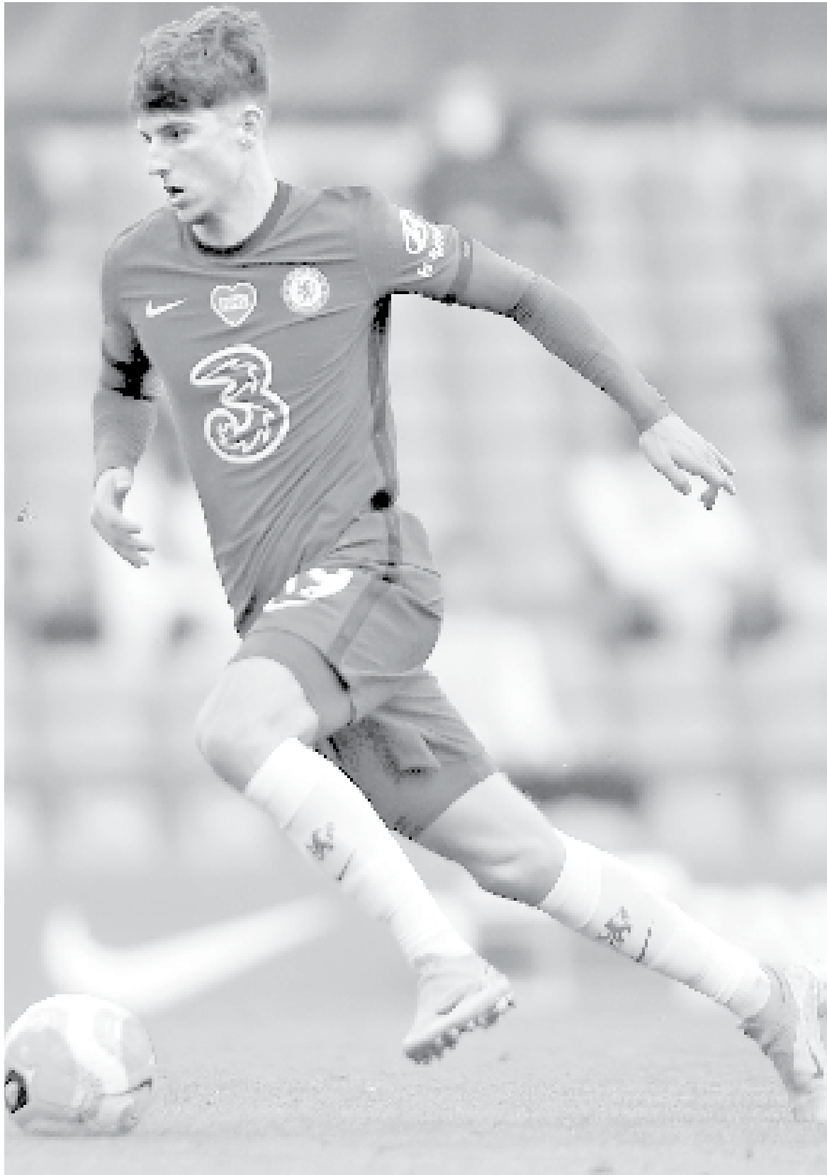
MASON MOUNT es uno de los mejores jugadores de Europa

ante el Aston Villa), pero la regularidad fue algo que lo catapultó en confianza: jugó 38 partidos y anotó, nuevamente, 9 goles.