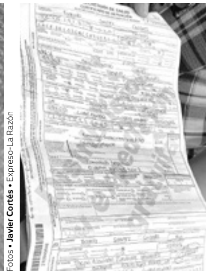
ACTA DE DEFUNCIÓN.