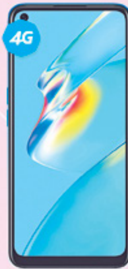
OPPO | A54 A: $6,499 1