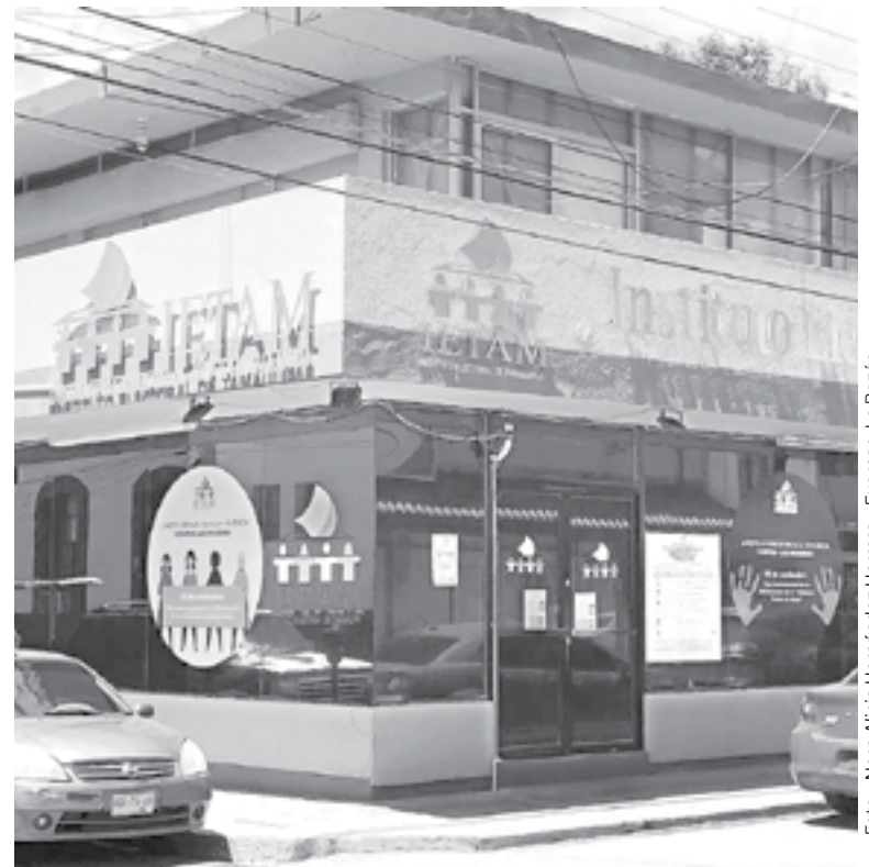
CAE ALUD de impugnaciones al IETAM