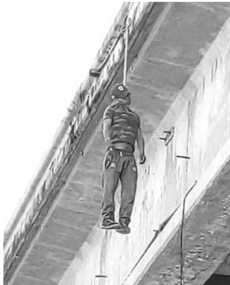
EL HOMBRE ató su garganta a una sogá y se precipitó al vacío.

Justo cuando ocurría esta situación un moto taxi lesionó a su pasajero debido a que se distrajo cuando le llamó la atención la presencia de las autoridades que