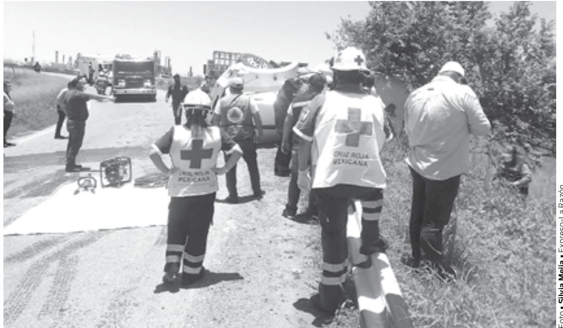
LE GANÓ EL PESO y la unidad se ladeó sobre su izquierda.