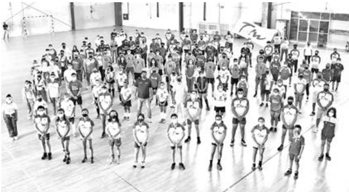
MÁS DE 400 DEPORTISTAS de Tamaulipas esperan acudir a diferentes competencia

"No queremos que se retrasen mucho y menos que se cancelen, porque sí existe la posibilidad, por