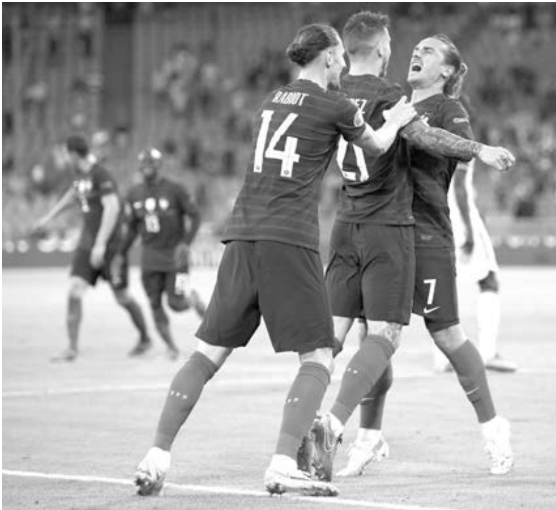
FRANCIA LOGRÓ triunfo importante en primera jornada