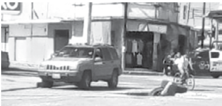
PERPETRÓ ROBO en tienda de conveniencia

Cabe destacar que los testigos de los hechos, aseguraron que el ahora detenido un masculino, efectuó el atraco utilizando un arma de fuego.