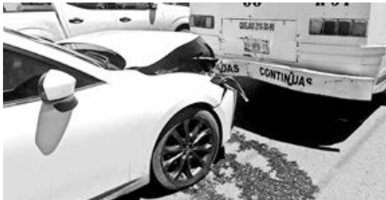
LOS LESIONADOS fueron llevados a un hospital por parte de Cruz Roja.