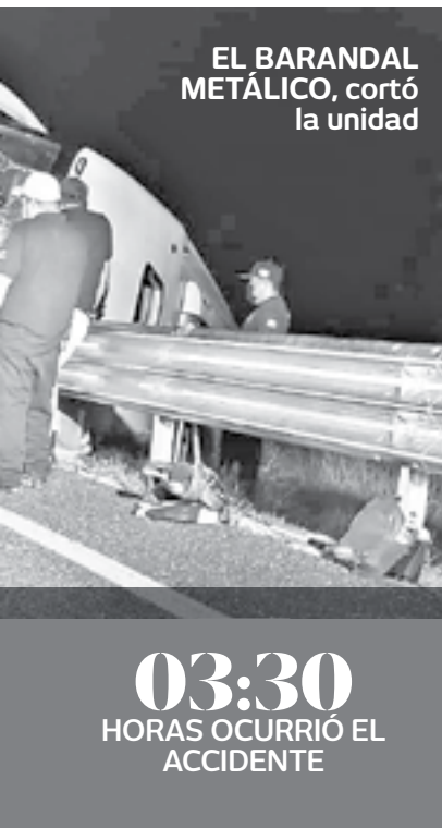
EL BARANDAL METÁLICO, cortó la unidad