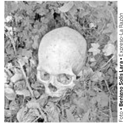
FUE ENCONTRADO en matorrales de la colonia Emiliano Zapata.