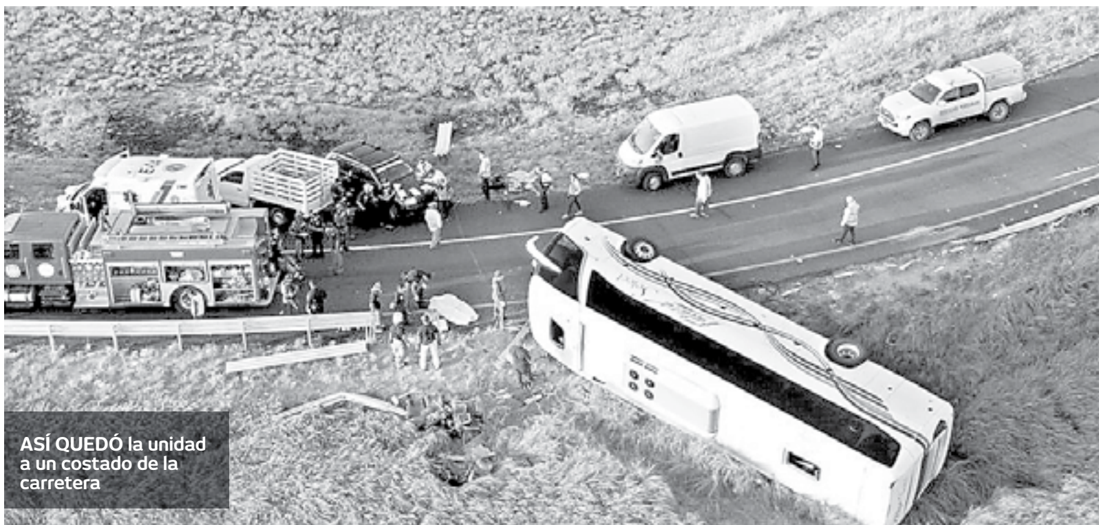
ASÍ QUEDÓ la unidad a un costado de la carretera