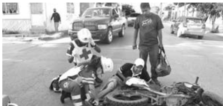
EL MOTOCICLISTA sufrió probable fractura en una pierna.

El accidente se registró en el cruce de la carretera Interejidal y