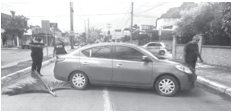
CUANTIOSOS DAÑOS MATERIALES dejó el choque en la colonia Armora.

Peritos viales tomaron conocimiento del hecho para deslindar responsabilidades.