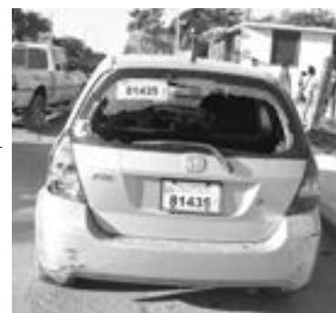
EL CRISTAL trasero se hizo añicos.

tos y la gente al percatarse de la severa lesión determinó esperar el arribo de los cuerpos de socorro.