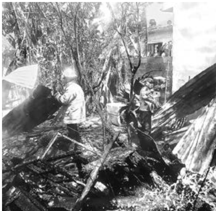
SOLO CENIZA y láminas tiznadas quedaron en el lugar.