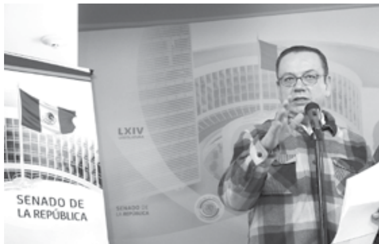
GERMAN MARTÍNEZ, senador morenista.

"Porque quiere quedar bien con Dios y con el diablo, pero eso no se puede, por eso está metido en una ratonera, en un problema del que no va a salir bien librado el Poder Judicial. Para mí, el Presidente del Poder Judicial debe estar defen-