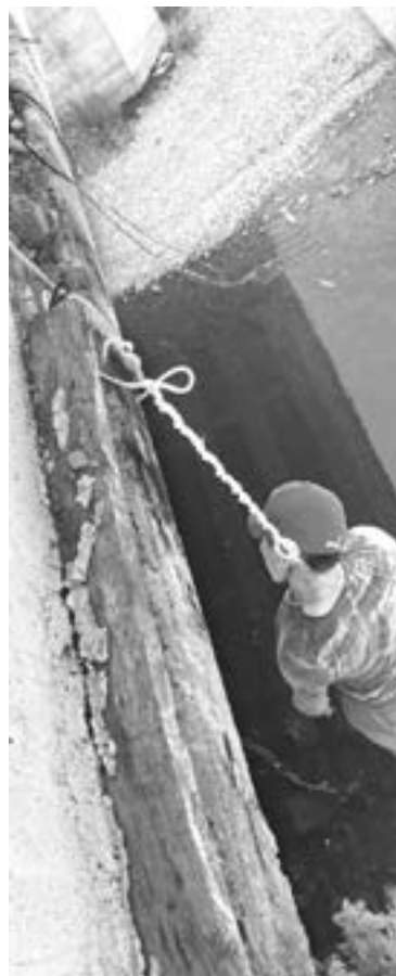
LOS HABITANTES del área conocen al occiso como 'el chaparro'.