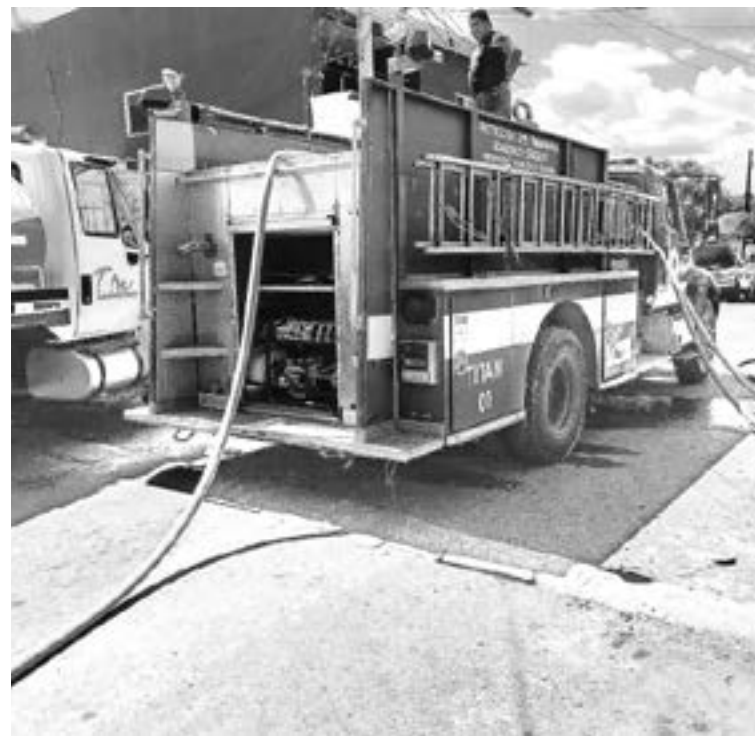
LOS BOMBEROS acudieron a sofocar las llamaradas.