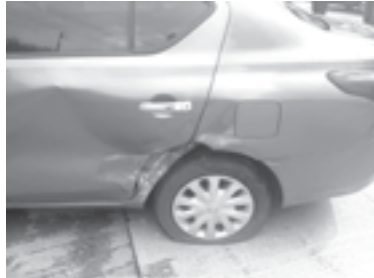
EL PERCANCE se registró ayer en la colonia Armora.

Peritos viales tomaron conocimiento del hecho para deslindar responsabilidades.