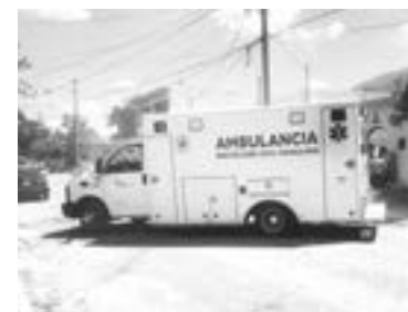
LOS HABITANTES del domicilio resultaron ilesos.

El fuego aparentemente se ocasionó por un cartón vacío para huevos que la familia estaba que-