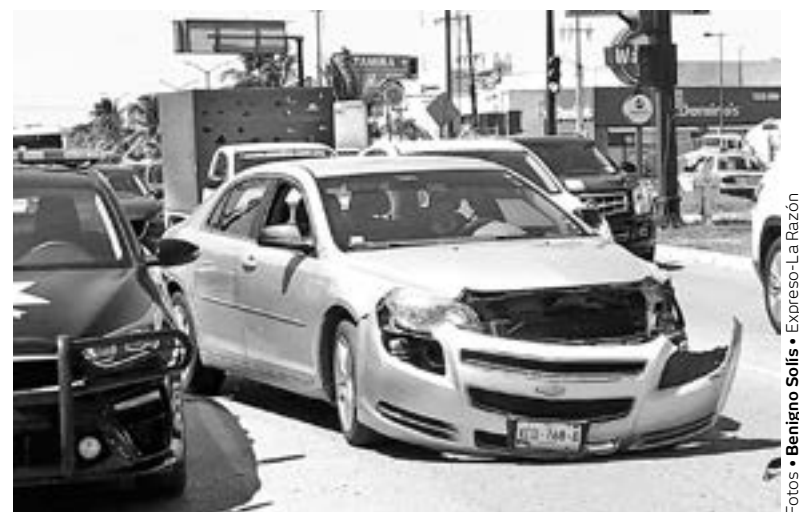
LA CONDUCTORA se asustó del fuerte impacto.

Las unidades involucradas son un Chevrolet Malibu color gris y una camioneta Ford con caja propiedad de la empresa MN.