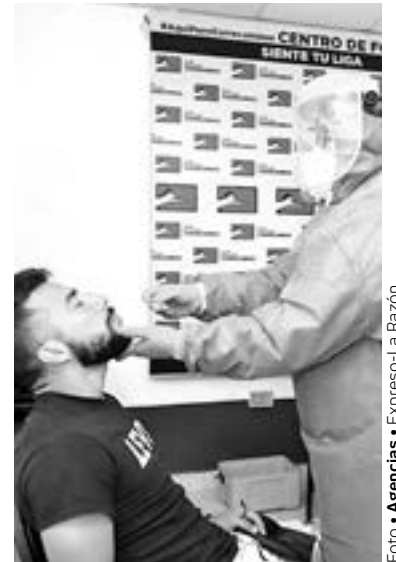
EL EQUIPO de Victoria ya empezó formalmente con la pretemporada

Estados, a que el gobierno federal apoye, háganlo por el bien de nuestros atletas", finalizó