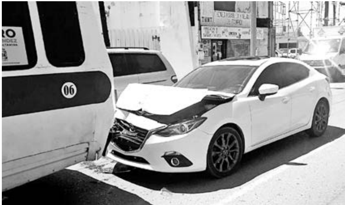
EL ACCIDENTE sobrevino cuando el micro invadió el carril contrario.

Se dio a conocer que el micro invadió el carril contrario para luego regresar al suyo y justo en ese