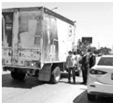
EL CHOQUE fue con una camioneta que hace entregas de materiales.