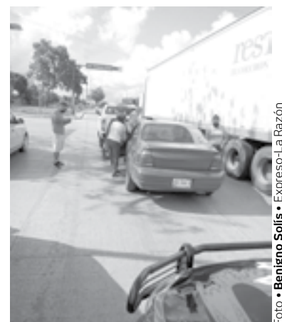
EL PERCANCE se registró en el cruce de Germinal.