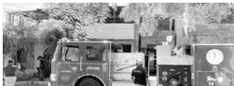
LOS HABITANTES de la casa solo sufrieron una crisis nerviosa.

Aunque sufrieron una crisis nerviosa las personas no tuvieron daño alguno en su físico.