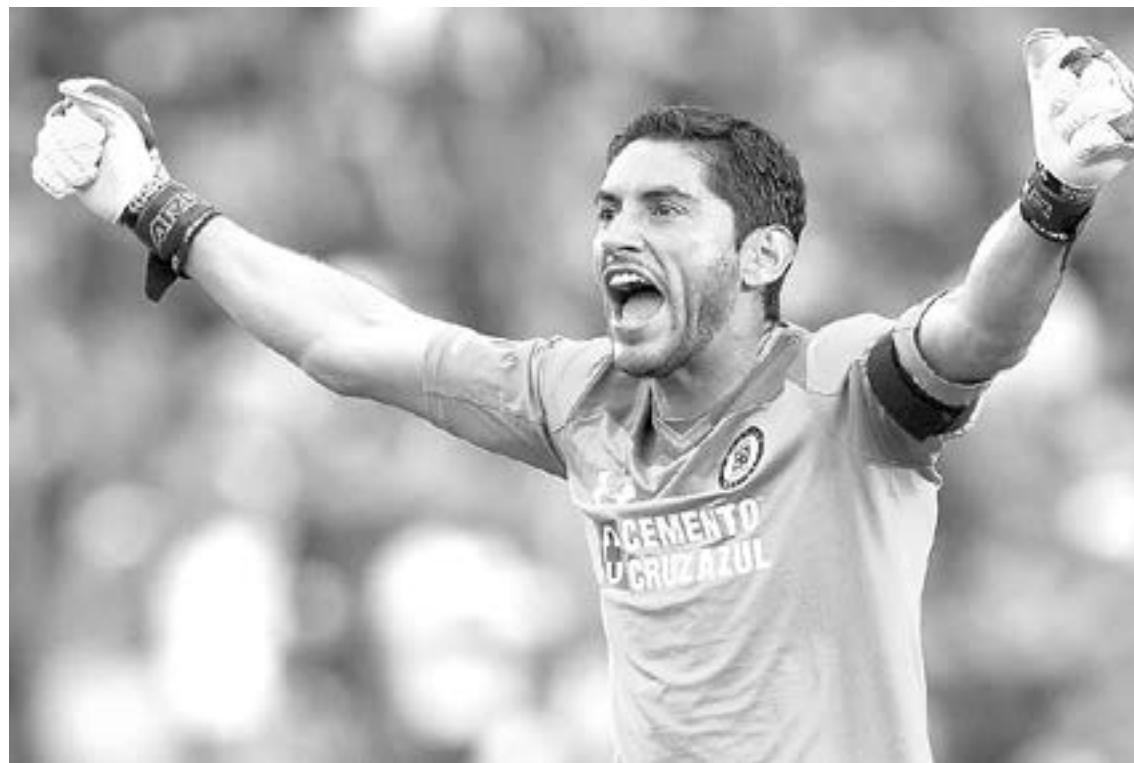
JOSÉ DE Jesús Corona pieza clave del triunfo del Cruz Azul.