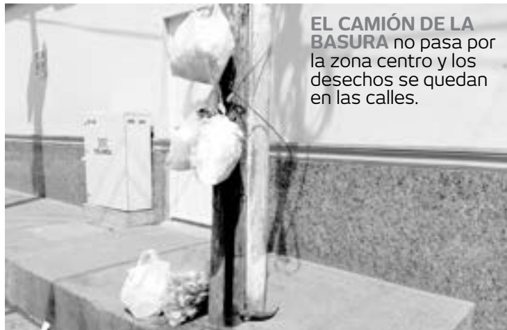
EL CAMIÓN DE LA BASURA no pasa por la zona centro y los desechos se quedan en las calles.

Indicó que en este sentido la responsabilidad de muchos temas que se atribuyen o se exigen a las