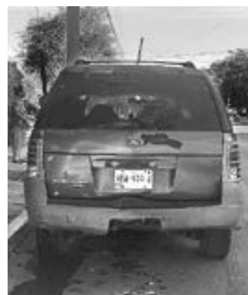
LE DIO duro al poste y a una Ford Explorer.

Fue después de pasar la calle Coahuila, que comenzó a decli-