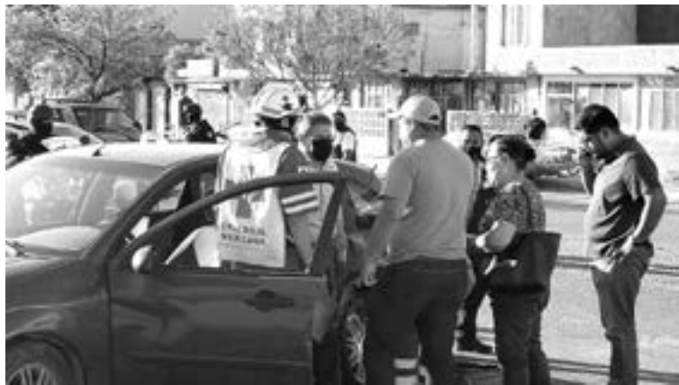
AL PARECER el 'don' se incorporó al flujo vehicular sin precaución.