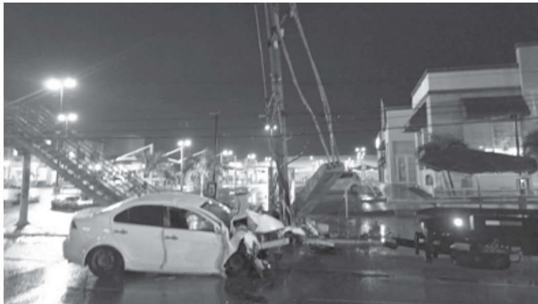
EL RESPONSABLE dejó el vehículo abandonado en el lugar del accidente.