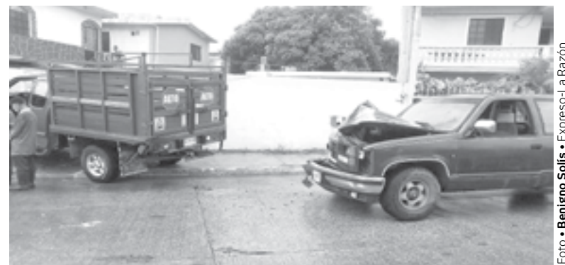
EL CONDUCTOR de la camioneta Chevrolet fue el responsable del accidente.

La primera unidad se desplazaba a exceso de velocidad por la Tamaulipas sobre pavimento mojado y sin la precaución respectiva por lo que al llegar a ese punto, el conductor perdió el control del volante para después impactar por detrás a la otra camioneta que