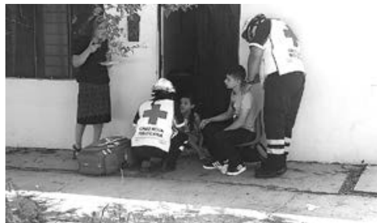
LA MUJER y sus hijos fueron auxiliados por los paramédicos.

Agregó que justo a la altura de la secundaria, redujo la velocidad para pasar sobre un tope.