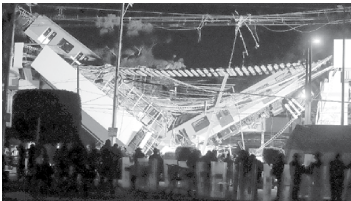
COLAPSO en la Línea 12 fue por prisa del gobierno de Ebrard y trabajos de mala calidad: NYT.

Este medio estadounidense tomó cientos de fotografías de la zona céntrica, casi a la altura de la estación de