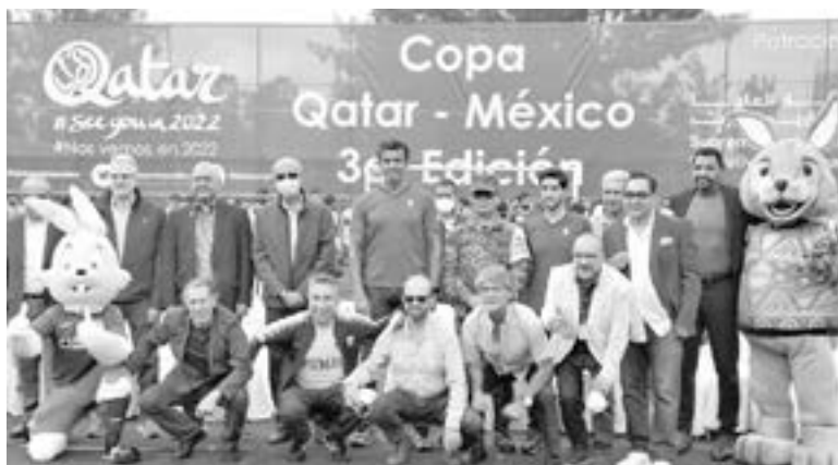
TERCERA EDICIÓN de la Copa Qatar.