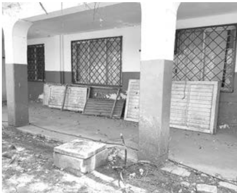
A ALGUNAS escuelas les urge mantenimiento

las dos escuelas que en el municipio de Méndez, fueron aprobadas para esta fase piloto, donde destacó que se trata de un regreso presencial, que se lleva a cabo de manera gradual, responsable, voluntario y