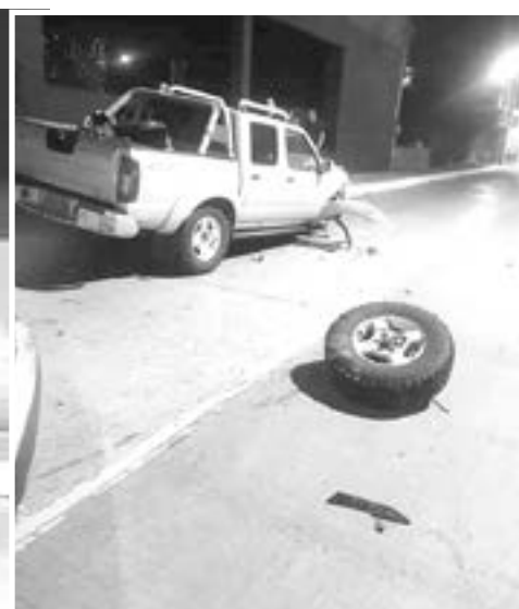
PARTICIPARON EN el percance una camioneta Frontier y una camioneta Peugeot.