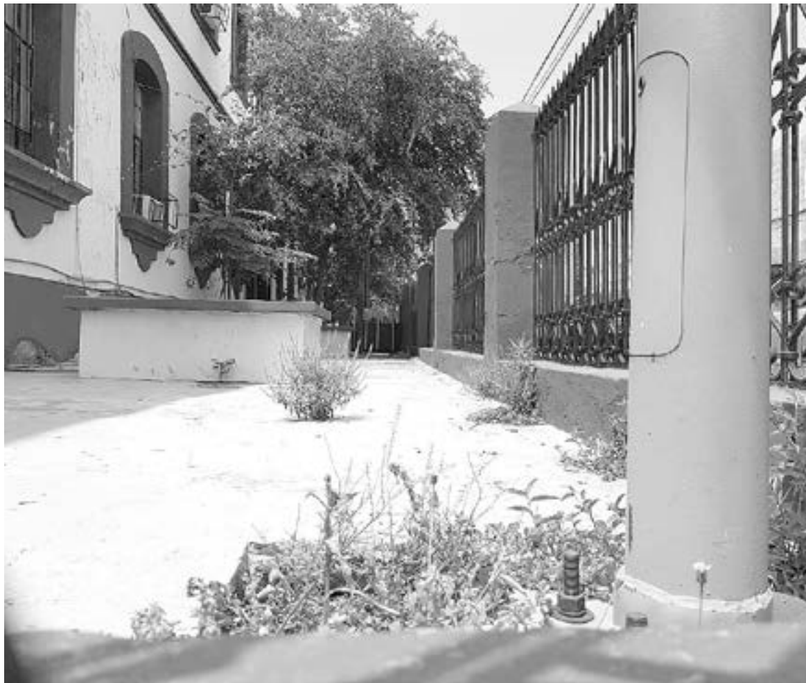
LAS ESCUELAS tienen que ser puestas a punto para el regreso de los alumnos.