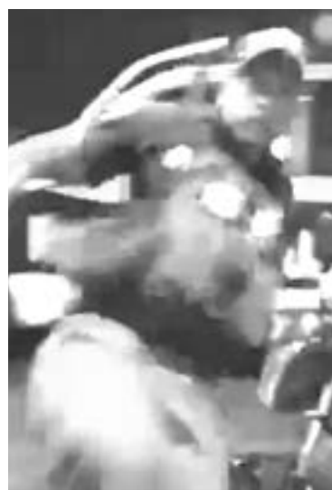
FUE CAPTADO en video el momento en que el policía le da una patada a un comerciante.

La evidencia es tal que justo en este video, se aprecia que uno de los oficiales le da una patada al ofendido; provocando que la imagen se distorsione tras la violenta reacción del uniformado que mancha con estos actos violentos su historial como malogrado defensor