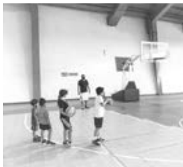
FUERON REANUDADAS las actividades deportivas.