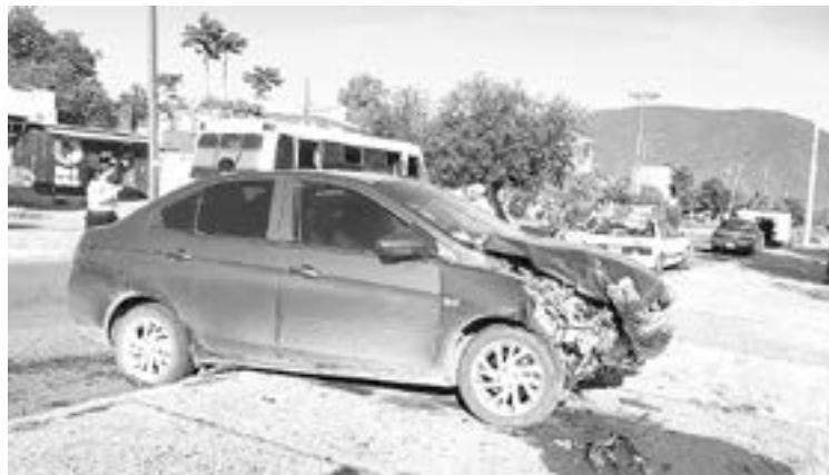
EL ANCIANO señaló que la otra unidad circulaba a exceso de velocidad.