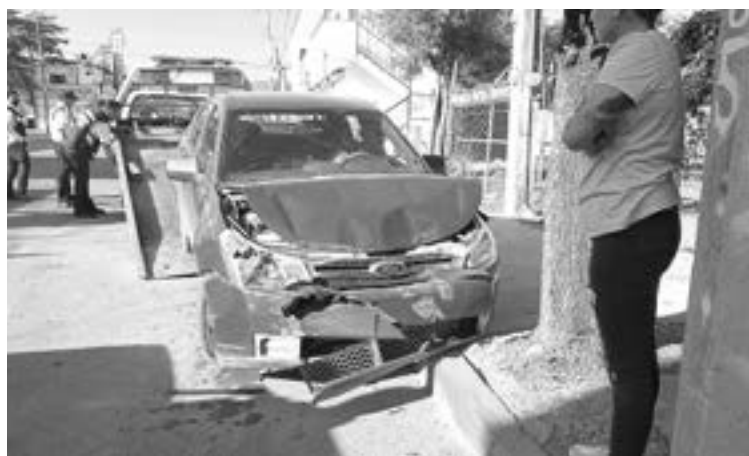
EL COCHE del joven quedó muy deteriorado.

Conducir develado le resultó muy costoso a un jovencito, quien tras una dormitada, estrelló su carro contra un poste de concreto y una camioneta estaciona-