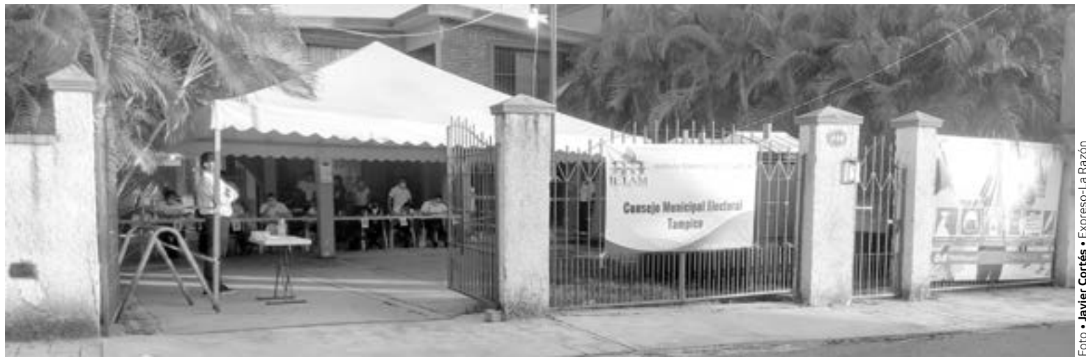
EL IETAM estará abierto hasta la media noche.

DEBIDO A la sequía han reducido el trabajo en el rastro.