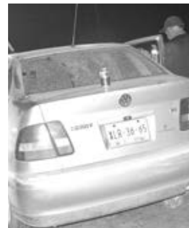
EN EL LUGAR hallaron botes de cheve