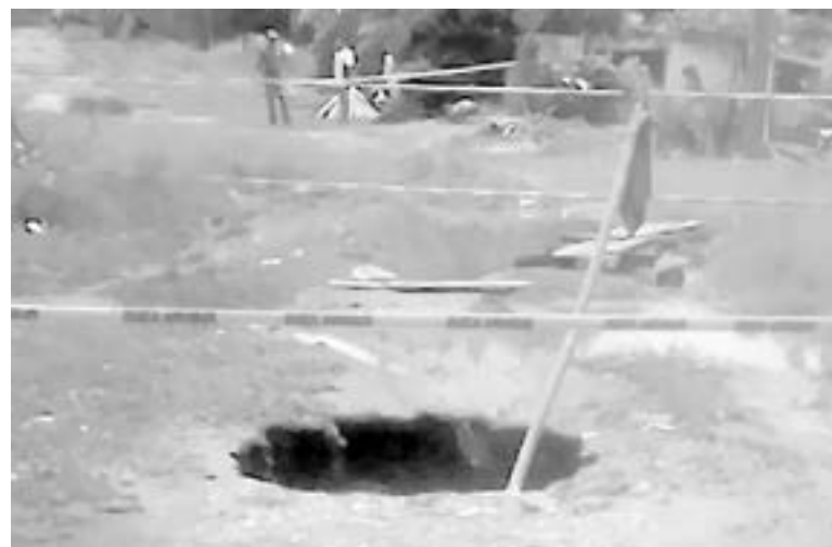
VECINOS DIERON aviso a Protección Civil sobre el socavón que se produjo en la zona.