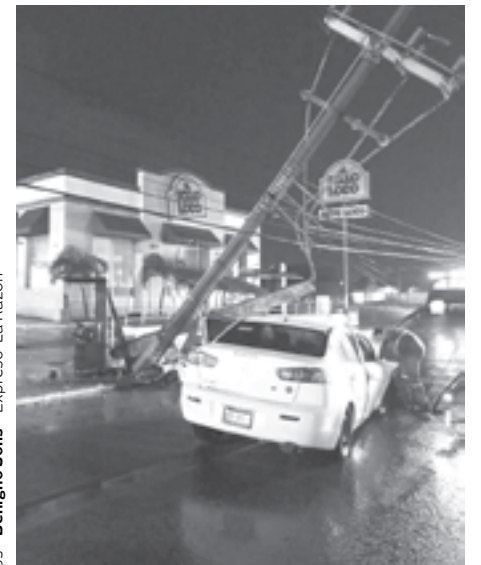
EL POSTE corría el riesgo de venirse abajo.