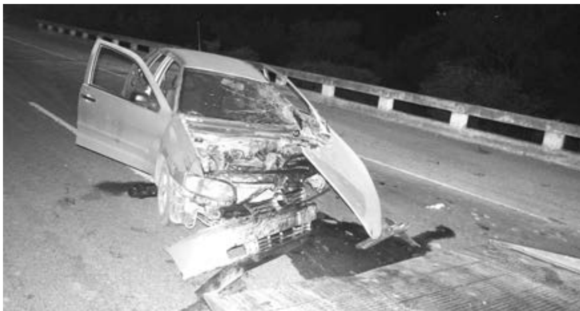
EL COCHE fue considerado pérdida total.

Personal de tránsito local recibió un llamado en el que avisaba de un fuerte encontronazo, por lo que se trasladaron al sitio pero una vez que llegaron encontraron el vehículo abandonado.