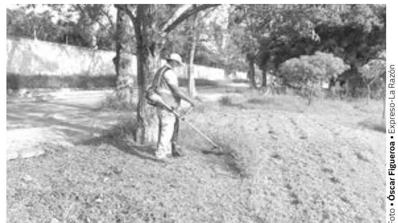
CON PLAZAS dignas brindan mayor bienestar en Ciudad Madero.

Cabe mencionar que los trabajos son realizados a través de la coordinación de áreas como Parques y Jardines, Canales, Control y Mantenimiento así como Maquinaria Especial, de la Dirección de Servicios Públicos.