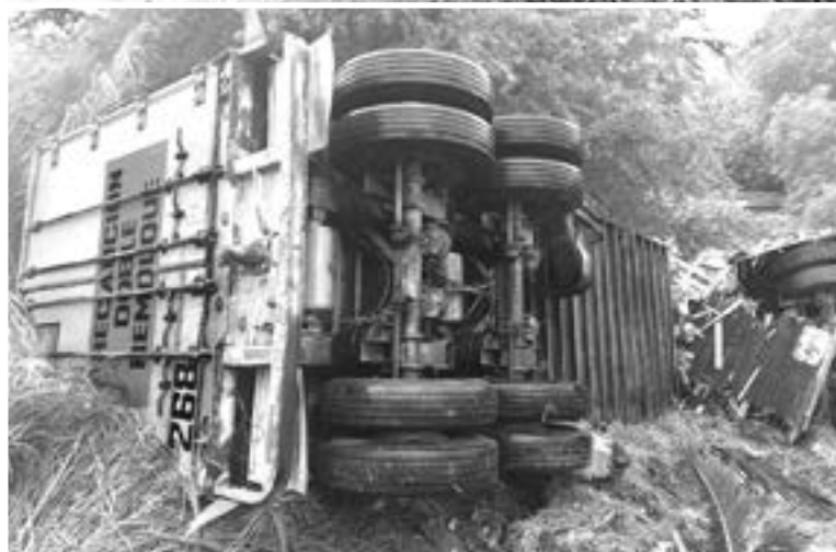
TRAILERO DE apenas 20 años, vive para contarlo, caja se desprende y despedaza.