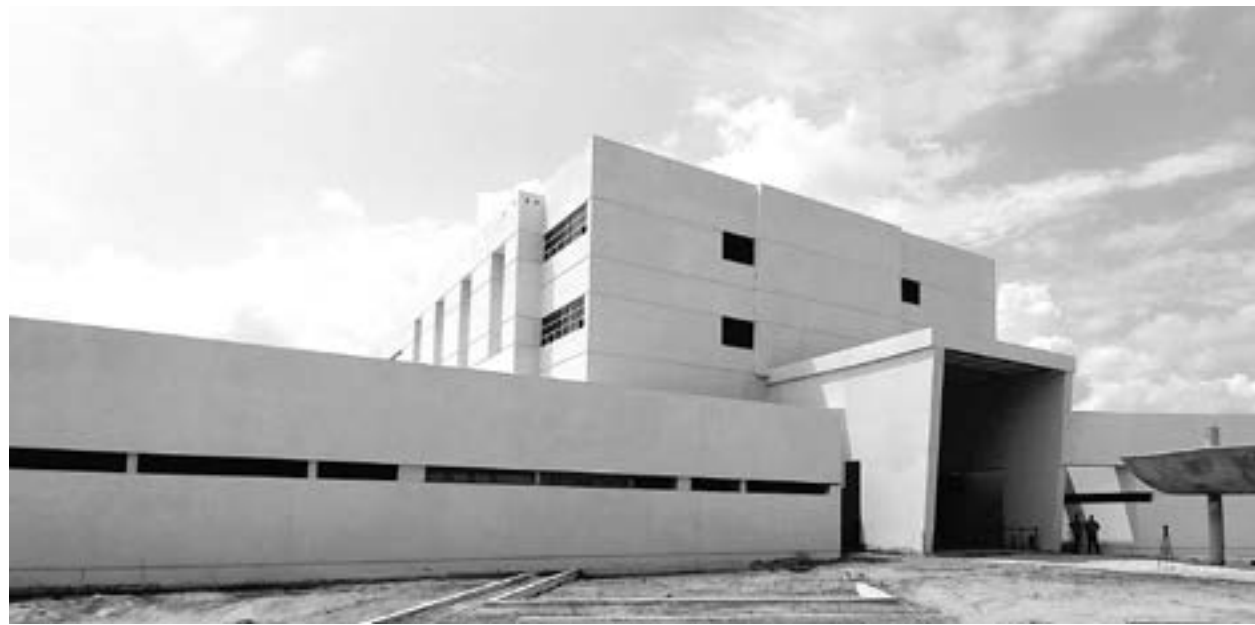
SE REACTIVA la construcción del Hospital General en Madero.