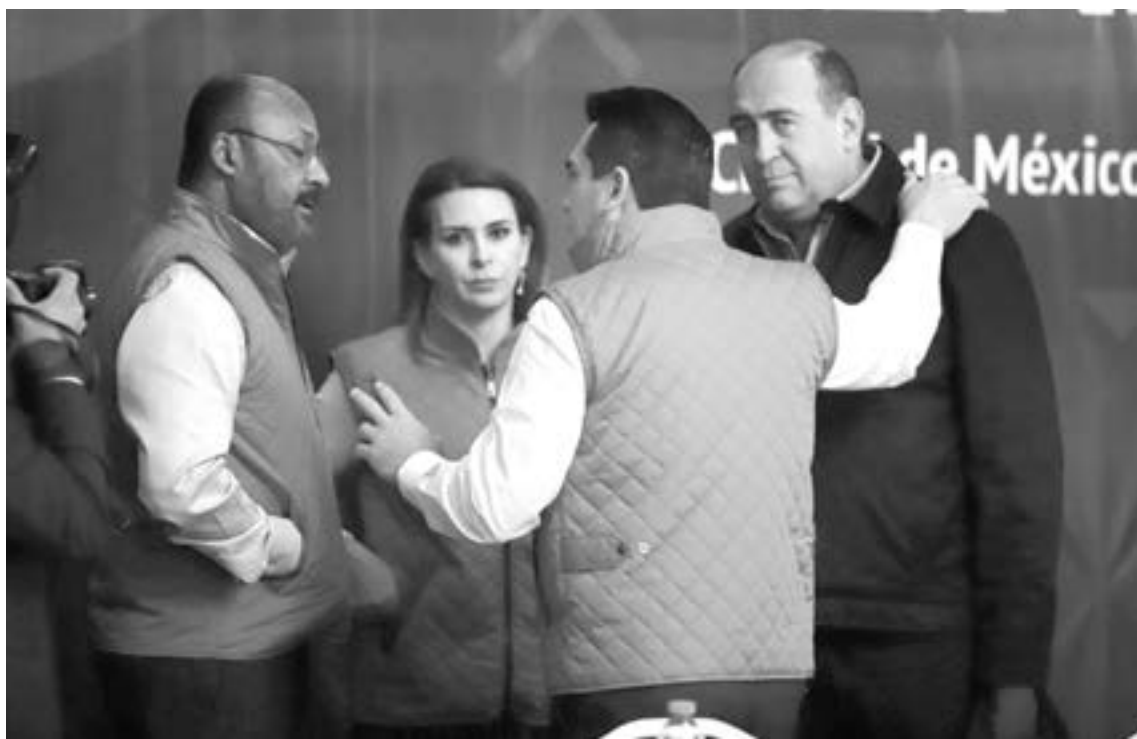
LOS PARTIDOS POLÍTICOS reconocieron al INE