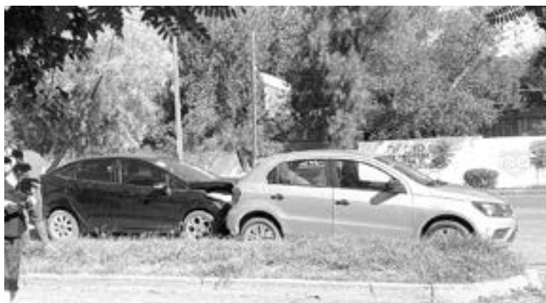
ANTES DE HUIR, la unidad responsable pudo ser fotografiada.

Los técnicos en urgencias médicas llegaron en la ambulancia