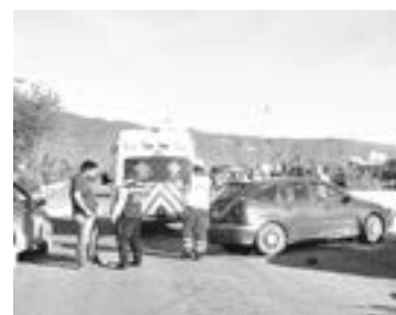
LOS COCHES quedaron muy cerca de la orilla.

principio, se encontraba estacionado en el acotamiento que esta pegado al Río San Marcos.