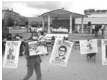
EN PACHUCA promueven la consulta ciudadana

A su vez, en el centro de la Ciudad de México, un grupo de jóvenes expuso a los visitantes las