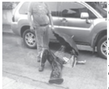
EL JOVEN se lesionó el brazo al golpearse en el suelo.

El operador del vehículo de dos ruedas acabó en el suelo, lastimándose la pierna izquierda.