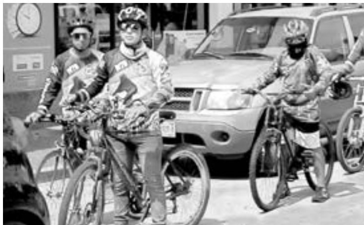
ARMAN RODADA a beneficio de Cruz Ámbar.

INTEGRANTES DEL CLUB CICLISTA RODADA 27 ENCABEZARON EL EVENTO PARA RECAUDAR RECURSOS PARA UNA AMBULANCIA