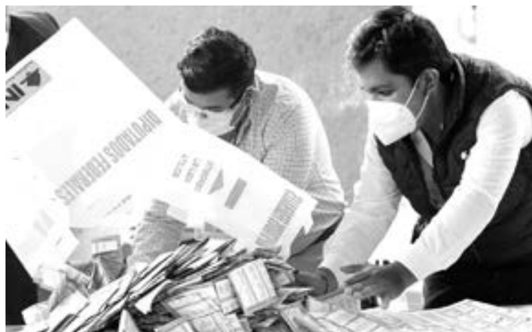
YA SE REALIZÓ el cómputo final

Una vez finalizado el cómputo de las elecciones federales, el consejero presidente del INE, Lorenzo Córdova, aseguró que el proceso electoral de este año demostró que el pluralismo político en México es dinámico y vigoroso.