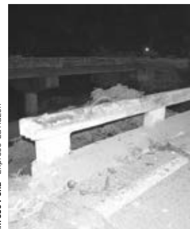
CONTRA la contención del puente se estrelló.