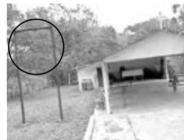
DESDE EL pasado jueves fue robada la emblemática campana.