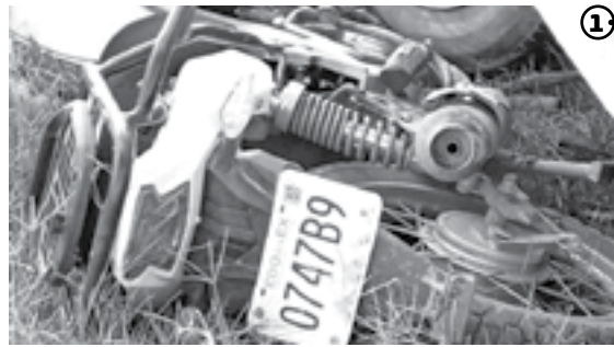
LA MOTOCICLETA quedó debajo de la camioneta.