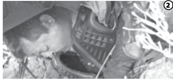
EL HOMBRE murió debido a las graves lesiones sufridas.