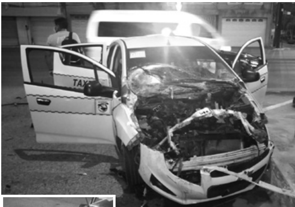
EL TAXI quedó completamente destrozado tras el impacto.

El percance ocurrió la mañana del viernes en el cruce de esa vialidad con la calle México de la colonia Guadalupe en donde el trá-