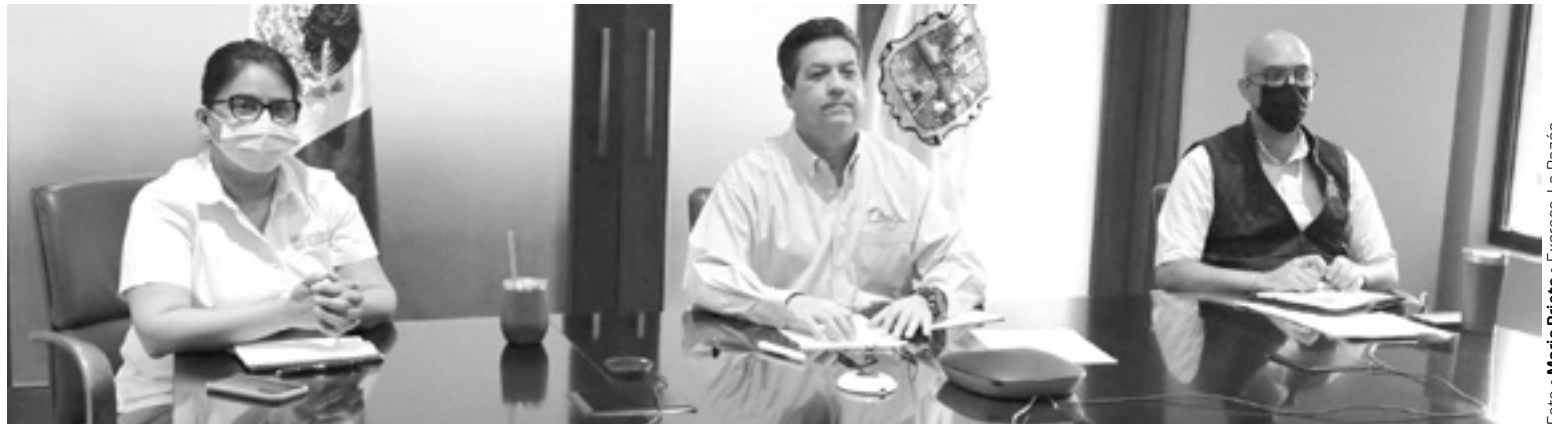
EL GOBERNADOR participó a distancia en reunión de Mesa de Seguridad de Tampico.