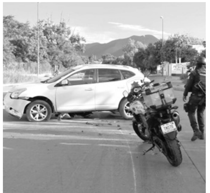
LA CAMIONETA que participó en el accidente quedó atravesada sobre la vialidad

Cuando circulaba de oriente a poniente el policía trató de cruzar el Eje Vial que va en