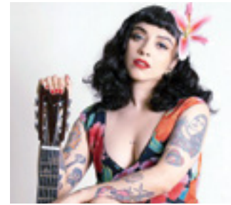
LA CANTANTE realizó un mini documental.

Durante la pandemia mundial, la cantautora chilena y una pequeña parte de su equipo, se internaron en la Sierra Norte de Oaxaca para grabar "Se va la vida", uno de los temas más conmovedores.