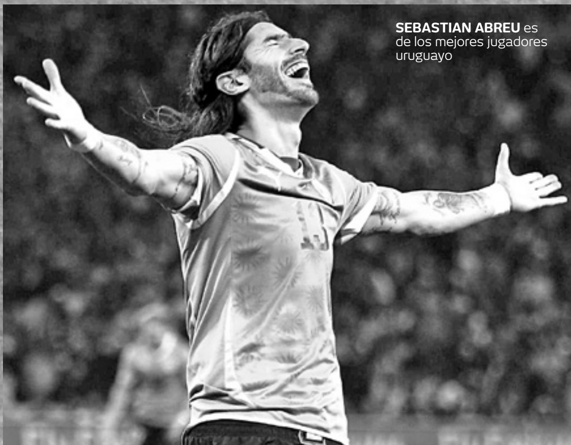
SEBASTIAN ABREU es de los mejores jugadores uruguayo

Y es que cada año, o cada seis meses o cada semana se cree que ahora sí llegó el final, que Abreu ya cuelga los guayos, pero es que sus guayos no deben ser de quitar, debe