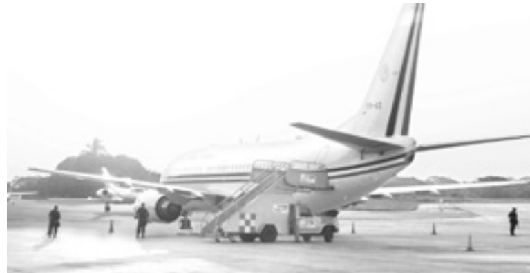
EL AVIÓN fue vendido ayer.