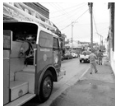
AL LUGAR asistieron elementos de bomberos.

Poco faltó para que se presentara un fuerte accidente en esa arteria, entre las calles Sor Juana Inés