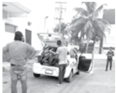
ELEMENTOS DE Tránsito descubrieron a los hombres sustrayendo fierro del inmueble.