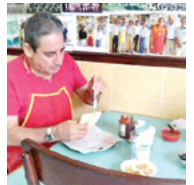
DREAM TORTAS del Zurdo Fernández.