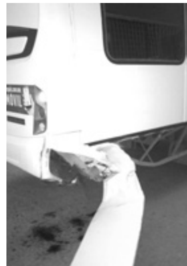
EL AUTOBÚS recibió el impacto por el lado derecho.

Los lesionados viajaban en el taxi y recibieron atención por paramédicos de la Cruz Roja.