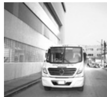
EL ACCIDENTE se registró por la mañana en la colonia Guadalupe.

xi resultaron lesionadas por lo que fueron atendidas por técnicos en urgencias médicas de la Cruz Roja de Tampico.