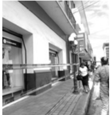
PROTECCIÓN CIVIL acordonó el área afectada.

El concreto se estuvo desprendiendo durante la mañana de este viernes provocando un riesgo latente entre los peatones, por fortuna no se registraron personas lesionadas ante esta situación.