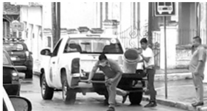
ELEMENTOS DE BOMBEROS colocaron arena sobre el aceite para acabar con el riesgo.

El derrame estaba frente a las instalaciones de la Policía Estatal. Tras concluir esa labor, los vulcanos retornaron a su base.