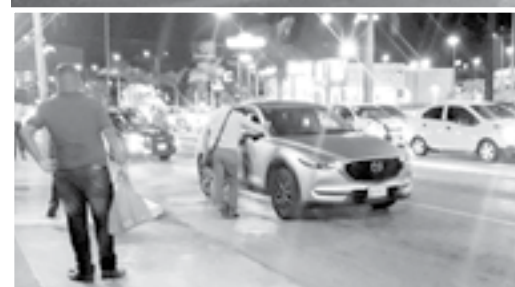
LA POLICÍA investigadora acudió al lugar.