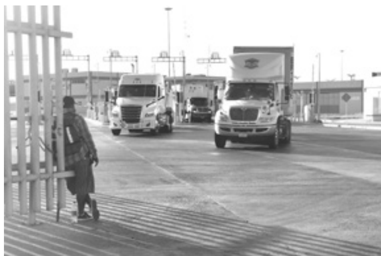
ASEGURAN QUE se mantiene el contrabando en las aduanas