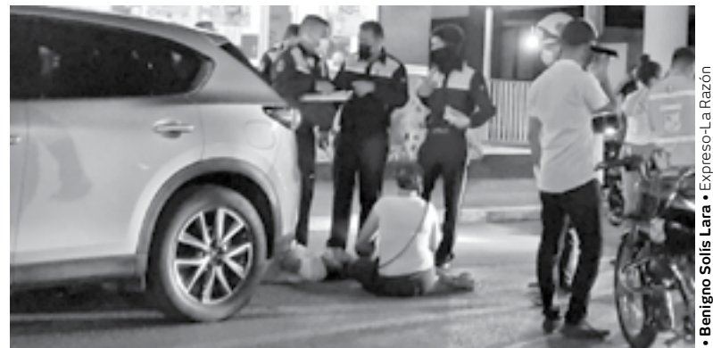
TIRADA EN el suelo quedó la mujer.

Posteriormente, arribó una ambulancia que la trasladó al hospital Carlos Canseco. Más tarde, tomaron conocimiento del hecho elementos de la Policía Investigadora.