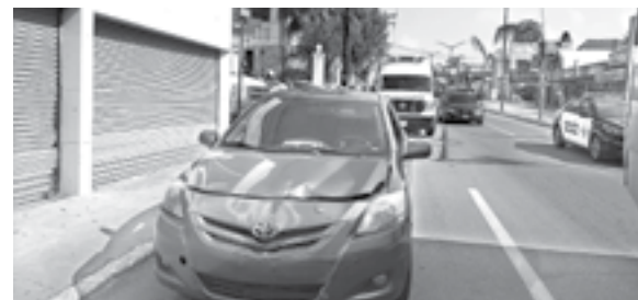
EL PERCANCE se registró en la colonia Altavista.