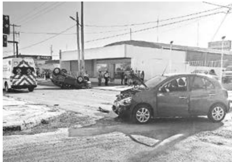
EL FUERTE PERCANCE ocurrió por la mañana.

Ambas unidades fueron declaradas como pérdida total por lo que la cifra de los daños se elevó de manera exponencial.