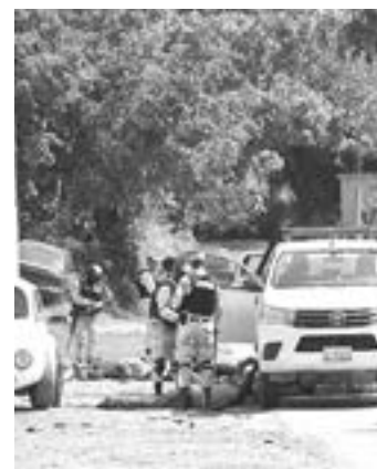
NO PUDIERON ESCAPAR y fueron sometidos.

La gente estaba asombrada de la escena que se efectuó para la detención de estos sujetos, quienes todo indica que, si habían incitado la violencia en las diferentes colonias y casillas, lo que no se pudo dar a conocer es para que partido estaban trabajando, las unidades fueron remolcadas al mesón federal.