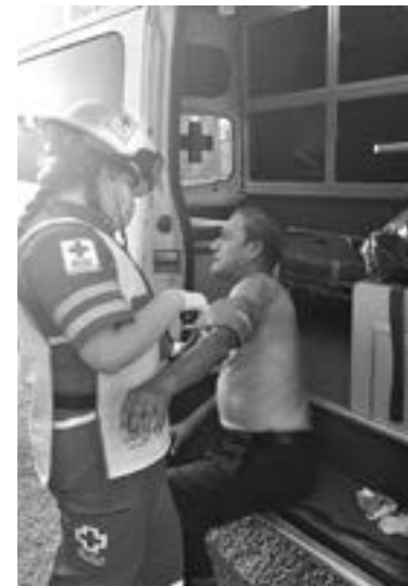
EL DUEÑO de la casa sufrió quemaduras en la espalda.

EL ESTALLIDO INTERRUPIÓ EL FESTEJO FAMILIAR DE LOS HABITANTES DE LA CASA, AMBOS CILINDROS FUERON HALLADOS EN LA CALLE TRAS EL INCIDENTE