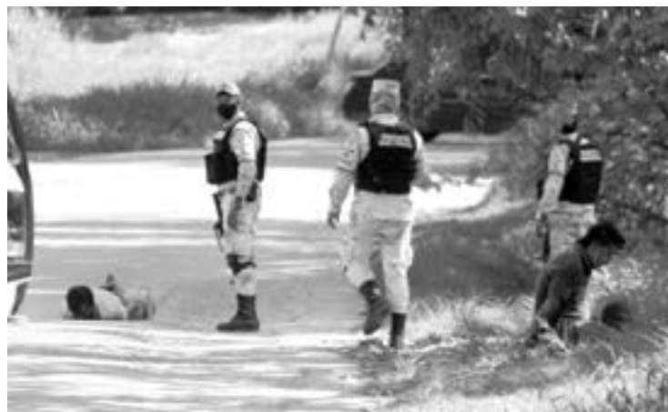
LA GUARDIA NACIONAL Y FUERZA CIVIL lograron someter a los sujetos que habían interrumpido la tranquilidad en Tantoyuca.

Un helicóptero sobrevolaba sobre el perímetro que se encontraba bloqueado por la Fuerza Civil y las fuerzas castrenses, la circula-