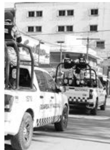
LA GUARDIA Nacional realizó recorridos por las casillas.

Poco antes del mediodía, el candidato a la Diputación Local, Mon-