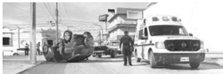
LA CAMIONETA terminó volcada con las llantas al aire.