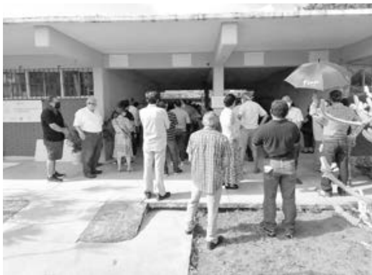
LARGAS FILAS se registraron en la mayoría de las casillas.

Las expectativas de votación fueron estimadas entre un 75 a 80%, lo que se traduce en poco más de 200 mil sufragios. Cifra histórica para elecciones intermedias, es decir, que no se eligió Presidente de la República.