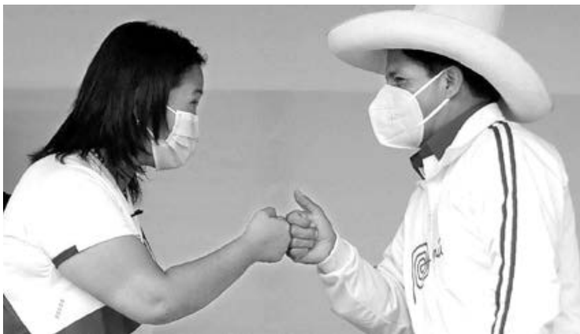
DERECHA E izquierda se disputan el futuro de Perú

Ambos candidatos prometen vacunar contra el nuevo coronavirus a toda la población y son conservadores en temas sociales. Se oponen al aborto y al matrimonio entre personas del mismo sexo. El