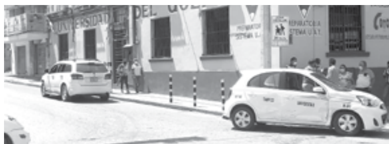
EL ENCONTRONAZO tuvo lugar en calles del primer cuadro de la zona centro de Tampico

Una Dodge Journey blanca y un Nissan March de la ruta Tampico Universidad colisionaron en ese cruce. Presuntamente, el operador del vehículo del transporte público no hizo el alto correspondiente al llegar a esa intersección por lo que al seguir circulando fue impactado