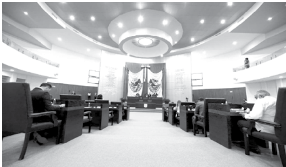
HABRÁ UNA RECOMPOSICIÓN del Congreso

El resto de los partidos políticos no obtienen ningún triunfo electoral, por lo que deberán esperar el cómputo oficial de la autoridad electoral para determinar cuántos diputados alcanzan por el principio de mayoría relativa, en particular el PRI que se mantiene en el tercer lugar de las preferencias electorales en Tamaulipas, aunque con muy pocos votos.