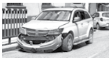
AL PARECER la camioneta llevó la peor parte.

en el costado derecho por la otra unidad.