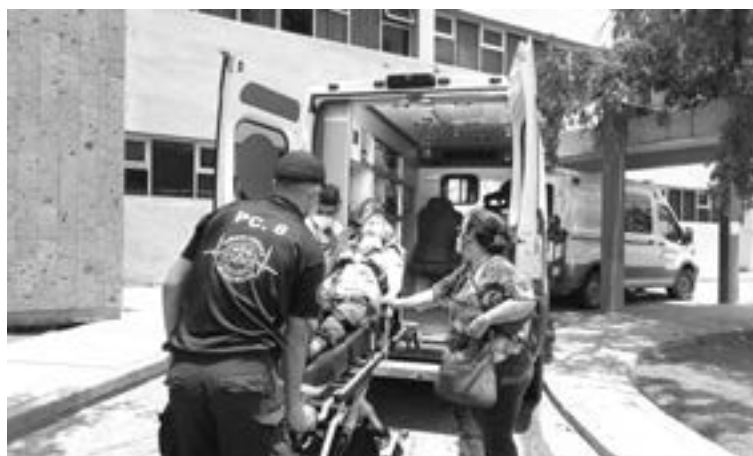
LA MUJER presentaba múltiples heridas de arma blanca.

Fue estabilizada por los paramédicos y se le trasladó al Hospital