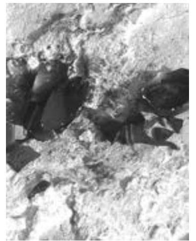
LAS BOMBAS molotov que arrojaron.

El sitio se ubica a un costado de la carretera Pánuco-Canoas.