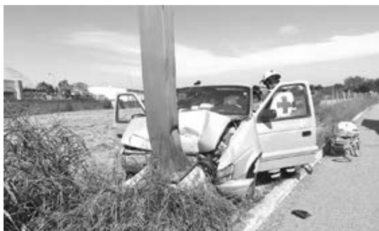
LA CAMIONETA chocó en seco contra el poste del alumbrado público

Los agentes de la dirección de tránsito y seguridad vial, informaron que este choque contra obje-