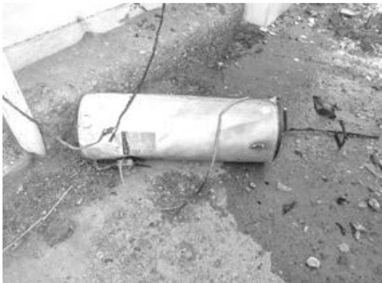
EL BOILER fue a dar a la calle tras el estallido.