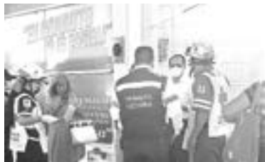
POR FORTUNA los involucrados resultaron ilesos.

A la par de estas labores, el perito aen turno realizó las investigaciones