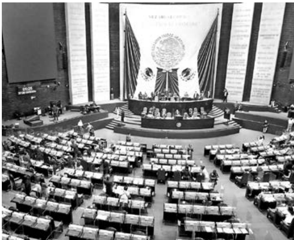
MORENA logrará en la Cámara de Diputados mayoría simple, pero no calificada.

Morena habría perdido la mayoría calificada para hacer reformas constitucionales. Incluso para lo-