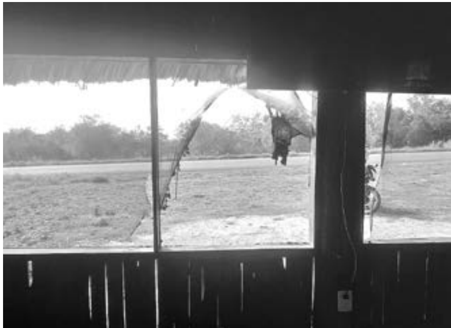
EL RESTAURANTE Los Tres Mosqueteros fue víctima de grupos de choque.

Los aspirantes a regidurías por el partido Morena Lic. Ruth Vanesa