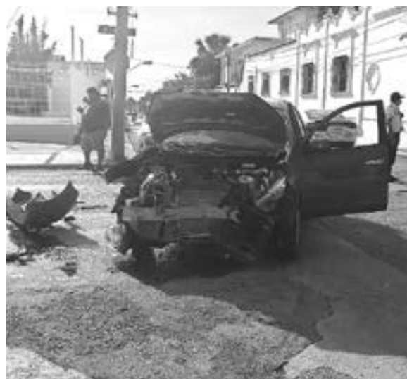
EL MARCH fue responsabilizado del golpe.