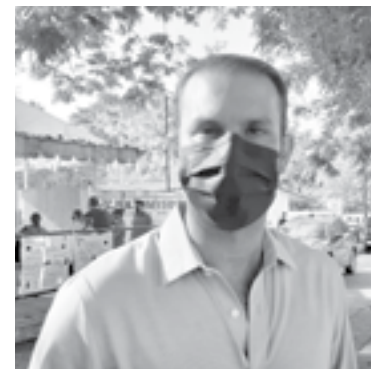
MON MARÓN tenía ventaja en el distrito 21 zona norte de Tampico.