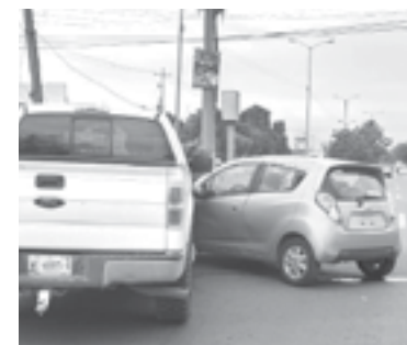
LOS VEHÍCULOS no tuvieron que ser llevados al corralón.

3 DE LA TARDE SE REPORTÓ EL INCIDENTE AL NÚMERO 911