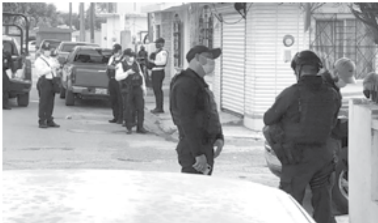
POLICÍAS ESTATALES y elementos de Protección Civil acudieron al lugar.

De acuerdo a las primeras versiones la menor llamó al 911 llegando policías estatales y ele-