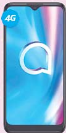
ALCATEL | 5030A 15E 64GB A: $2,999 1