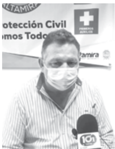
REPORTAN quema de cartón al interior de una bodega d Iberdrola.

Reiteró que todas las empresas del corredor industrial tienen uni-