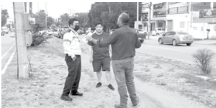
AL FINAL ambos involucrados lograron llegar a un arreglo.