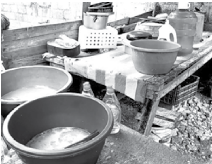
POBLADORES HA recurrido a comprar agua embotellada.

Al respecto él conocido líder social de este sector, agregó que se deben retomar programas para desazolvar las lagunas y con ello aprovechar las tres precipitacio-