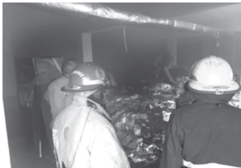
LOS BOMBEROS lograron controlar rápidamente el fuego.

Sobre las causas que provocaron el incendio, los "tragahumo" no descartan que alguna persona ingresara para fumar, ocasionando el siniestro.