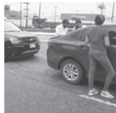
NO ALCANZÓ a frenar por lo mojado de la carpeta asfáltica.