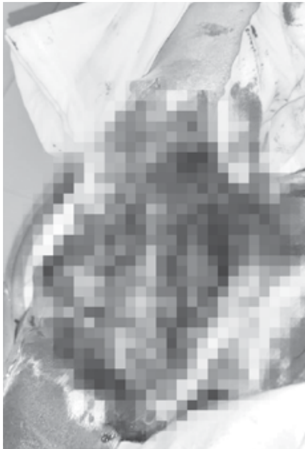
EL BRAZO le quedó hecho un guiñapo.