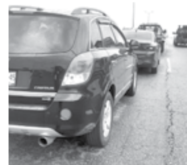
EL ACCIDENTE fue turnado al Ministerio Público.