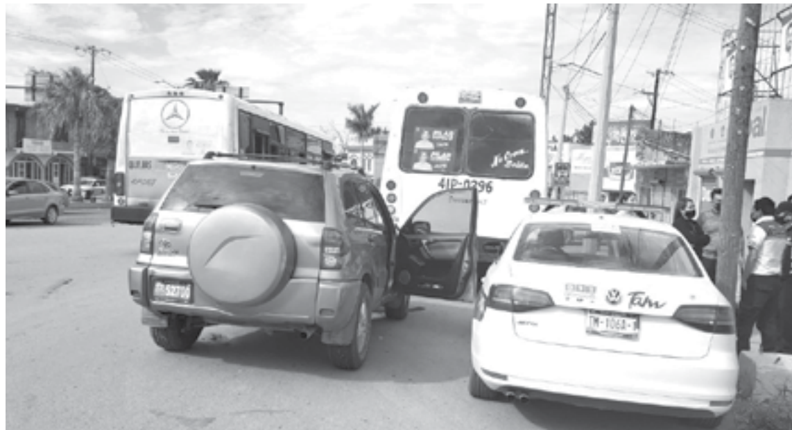
EL CHOFER del micro no reclamó daños.

UN BREVE DESCUIDO DE UNA DAMA AL VOLANTE PROVOCÓ QUE SE ESTRELLARA ATRÁS DE UN MICRO EN EL CRUCE DE EJE VIAL Y CALZADA LUIS CABALLERO