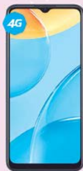
OPPO | A15 A: $4,139 1