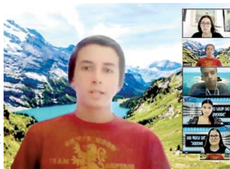
ARRANCO LA semana de la Francofonía en el Columbia.