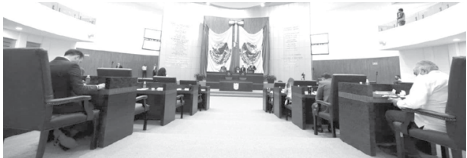
EL CONGRESO tiene en la mira a los alcaldes de Matamoros y Reynosa