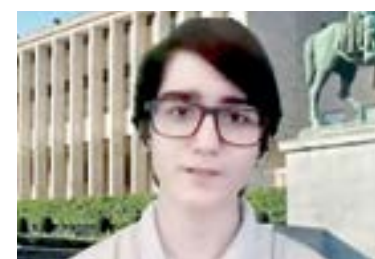
LOS ALUMNOS de 7º, 8º y 9º. Realizaron un viaje virtual.

do así el interés y reconocimiento de sus compañeros y maestro. Este evento se llevó a cabo de manera virtual interactuando con sus compañeros y maestros quienes mostraron el interés por los diferentes países.