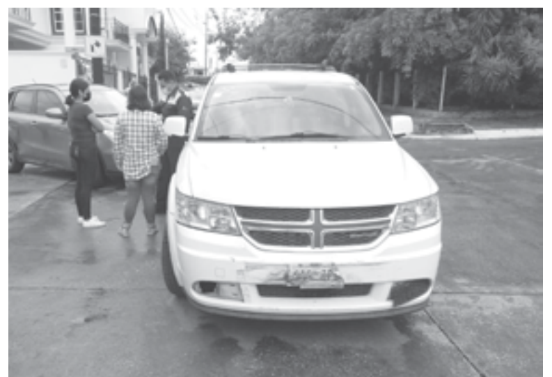
PESE AL GOLPE , no hubo personas lesionadas.

Era el neumático que dejó encadenado a una reja. Muy molesto por lo ocurrido, optó por retirarse, dejando la llanta encadenada en ese lugar.