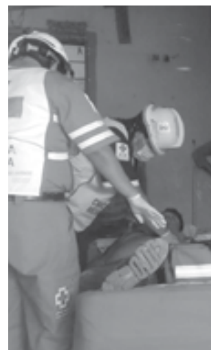
EL HOMBRE fue atendido dentro de su propia casa.

Debido a que el incidente fue cerca de su casa, sus conocidos decidieron llevarlo ahí para que esperara los cuerpos de emergencia.