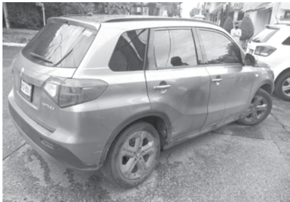
LA SUZUKI llegó a impactarse con la camioneta blanca.