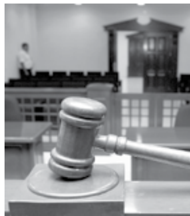
MERMAN A las escuelas privadas, medios para obtener más recursos

“Los muebles, inmuebles e instalaciones destinados a la prestación del servicio de educación de los planteles privados no constituyen, ni integran, parte del patrimonio del SEN, pues su patrimonio se rige de conformidad con el marco normativo aplicable a la propiedad privada”, dice la sentencia, elaborada por el Ministro Juan Luis González Alcántara.