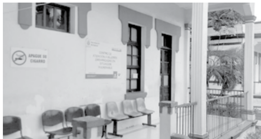
CONSTERNACIÓN Y drama en la colonia Chimalpopoca.

Al sitio de hechos arribaron elementos de la unidad de servicios periciales para tomar conocimiento del descenso ordenando posteriormente el traslado del cuerpo de la pequeña al anfiteatro local para los fines de la necropsia.