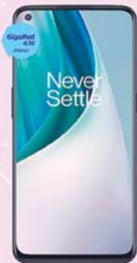
ONEPLUS | Nord N100 A: $4,889 1