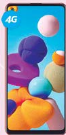
SAMSUNG | Galaxy A21S A: $5,639 1