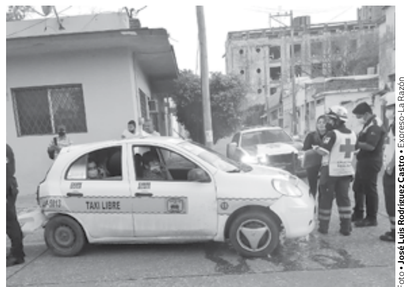
EL ACCIDENTE habría sido ocasionado por una invasión de carril.

En el accidente se vieron involucrados, un vehículo de pasajeros y un automóvil particu-