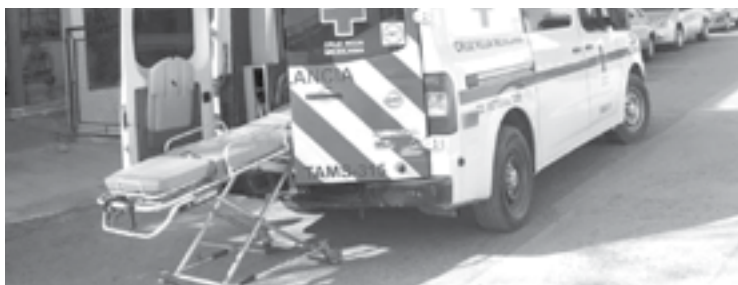
PARAMÉDICOS PROCEDIERON a trasladar al herido a un hospital.