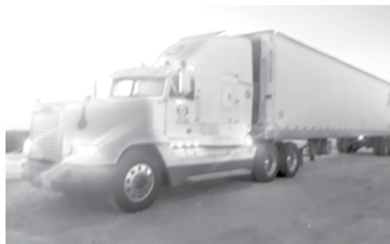
EL GOLPE fue por alcance.

Personal de protección civil acudió al sitio a brindar los auxilios así como también a los elementos de la Guardia Nacional en tramos carreteros.