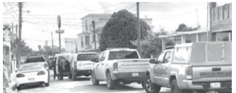
EL HECHO consternó a los matamorenses y sacudió a las redes sociales.

problemas desde hace tiempo, ella según se supo, trabaja en el Instituto Mexicano del Seguro Social.