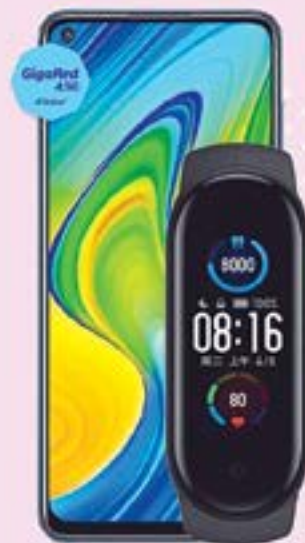
XIAOMI | Redmi Note 9 + Mi Band 5 A: $5,999 1 Consulta equipos participantes

Telcel la mejor Red con la mayor Cobertura