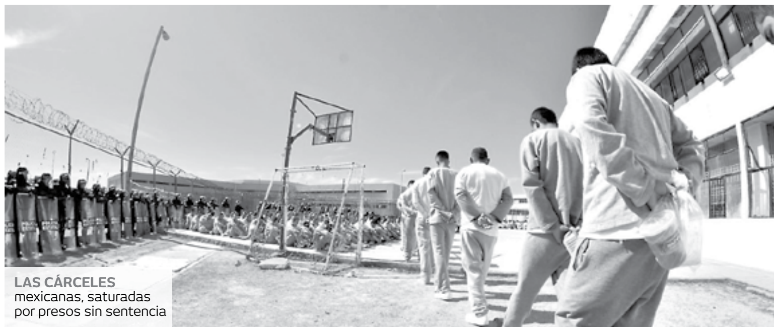
LAS CÁRCELES mexicanas, saturadas por presos sin sentencia