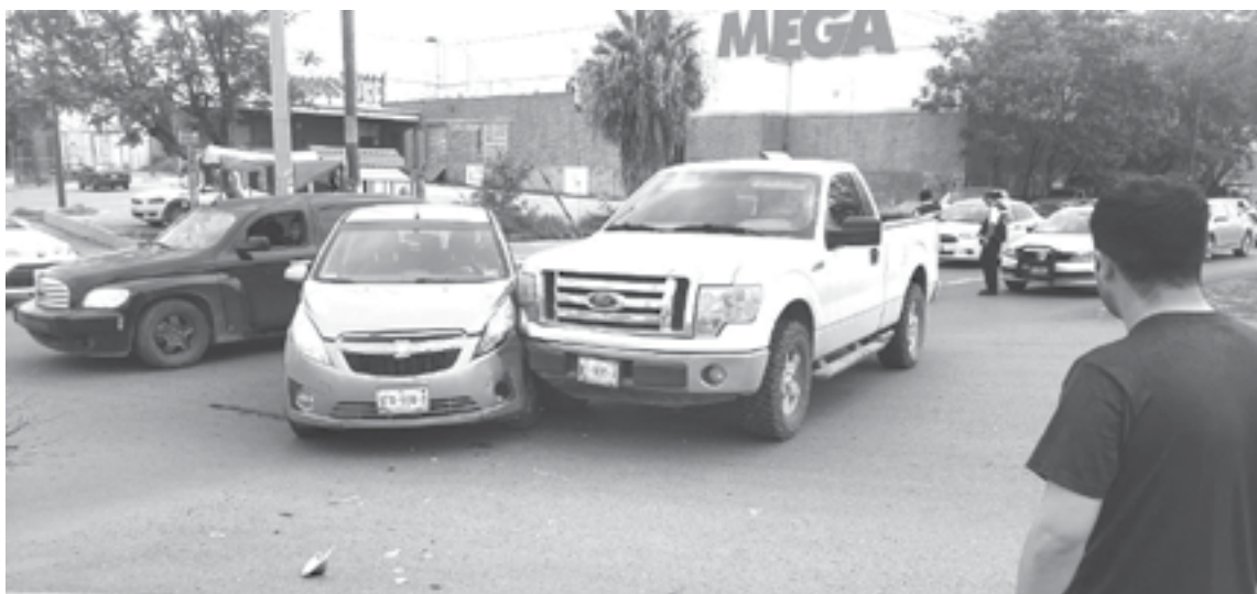
EL PERCANCE ocurrió a un costado de la extinta tienda La Mega.

Explicó el joven de aproximadamente 25 años que venía