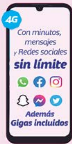
TCL | 20E 64GB A: $3,999 1