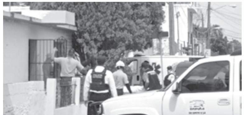
UNO de los cuerpos de los menores es sacado del domicilio.