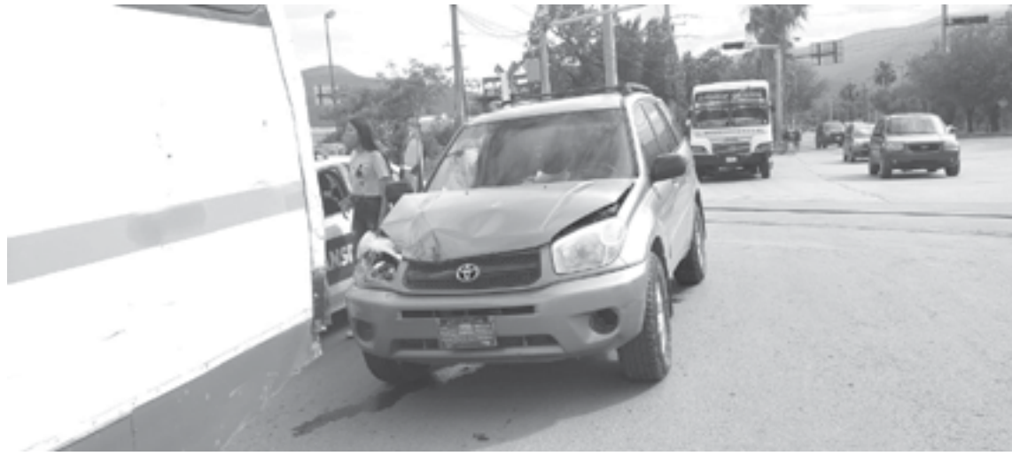
LA CAMIONETA sufrió daños en la parte frontal.