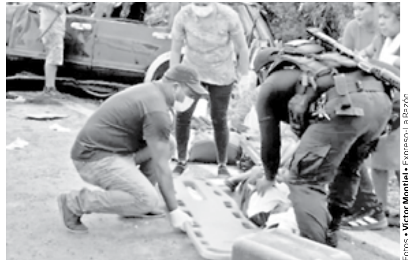
ELEMENTOS DE PERICIALES acudieron al lugar del accidente.

Posteriormente personal de la unidad de servicios periciales arribaría a tomar conocimiento del deceso ordenando el levantamiento del cuerpo de la desichada mujer.