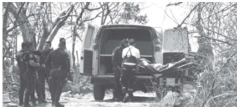
JORNADA DE violencia deja saldo de siete personas muertas.