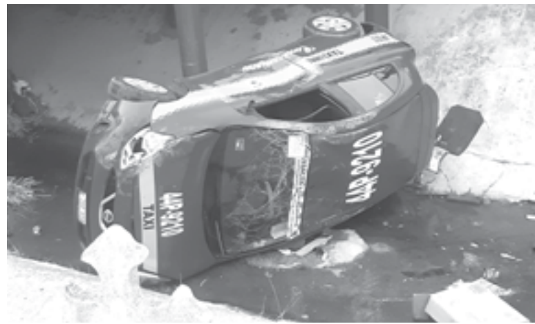
EL TAXI quedó tirado en el canal a cielo abierto.

Borreguera). El automóvil de pasajeros se desplazaba de norte a sur a través de la avenida.