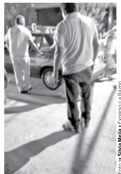
VECINOS DEL SECTOR decidieron llevarlo a la Cruz Roja.

Finalmente fueron los propios vecinos quienes los trasladaron a la