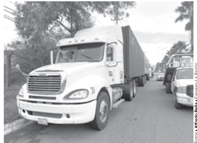
PRIMERO PEGÓ contra la caja de un trailer estacionado.