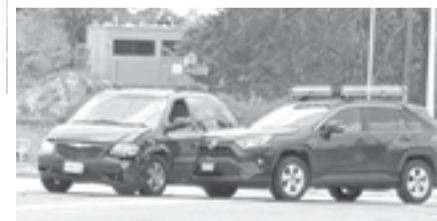
LAS CAMIONETAS quedaron a mitad de calle.