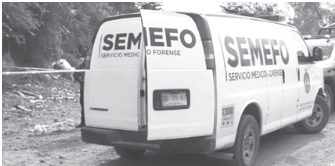
EL CUERPO de la occisa fue hallado en avanzado estado de putrefacción.

LA ANCIANITA HABÍA SIDO REPORTADA COMO DESAPARECIDA DESDE EL 18 DE MAYO, CUANDO SALIÓ EN BUSCA DE SU MASCOTA Y YA NO LA VOLVIERON A VER