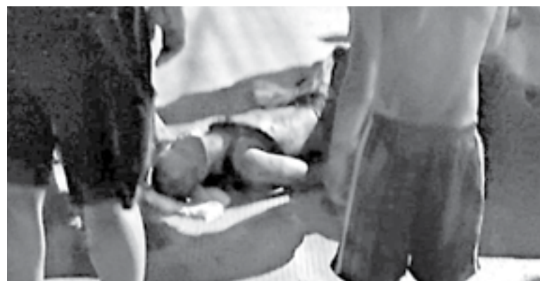
EL HOMBRE intentó huir pero solo logró escapar dos cuadas.

Un habitante de la colonia Unidos Avanzamos, cansado de los robos que sufría en su domicilio decidió hacer justicia por mano propia e hirió a un asaltante que por enésima oca-