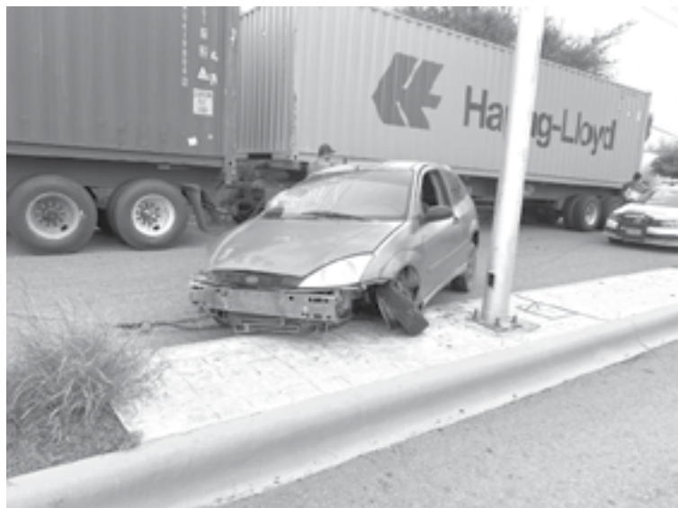
EL COCHE terminó estrellándose contra una luminaria.