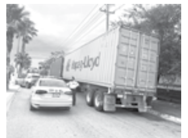
OCURRIÓ SOBRE la avenida José Sulaimán.

El vehículo que manejaban es un Ford Focus con placas de ONAPAFFA y circulaba en sentido de sur a norte por la lateral del libramiento José Sulaimán.