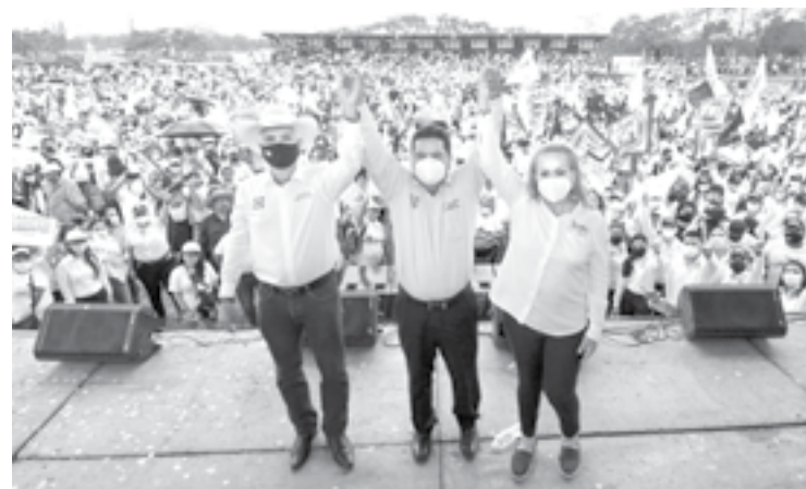
UN GRAN CIERRE de campaña fue el que se vivió este sábado

LA CANDIDATA DEL PAN A LA DIPUTACIÓN LOCAL POR EL DISTRITO 18 RECIBIÓ TOTAL RESPALDO EN EL MUNICIPIO DE ALDAMA