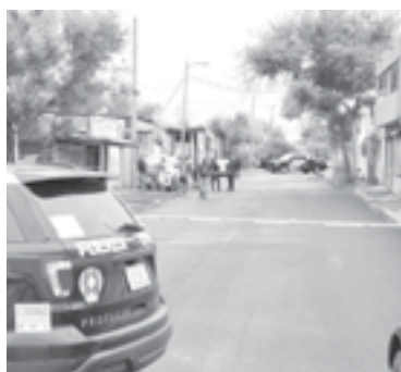
BUSCA EVITAR que huya conductor y muere.

pareja se bajaron para ver los daños, pero el responsable aceleró, golpeando a la mujer.