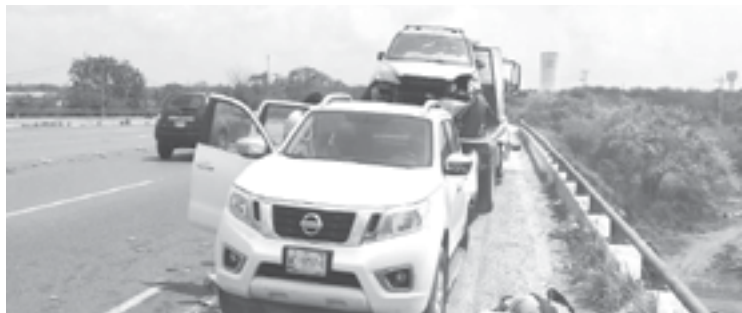
SOLO DAÑOS materiales fueron los causados.