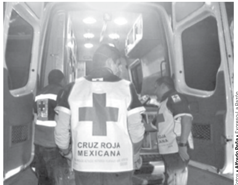
EL HOMBRE fue llevado de urgencia a un hospital de Tula, Tamaulipas.

Por ello ante la lejanía de un hospital de San Luis optó por trasladarse a Tula donde la policía tuvo conocimiento y esta dará parte a el estado vecino.