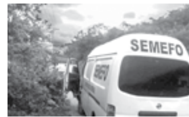
SE DESCONOCE la identidad de la persona desmembrada.

Una vez realizada la diligencia, el cadáver fue llevado al Semefo para continuar con las investigaciones.