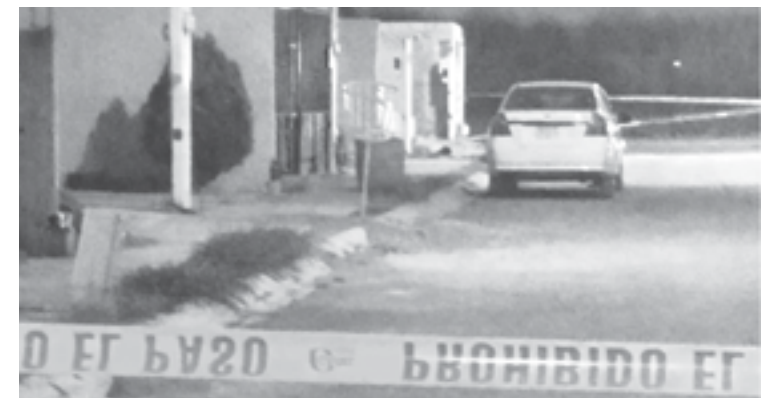
VECINOS ASEGURARON escuchar varias detonaciones seguidas.

EL DOBLE ASESINATO OCURRIÓ EN UNA ZONA RESIDENCIAL DEL MUNICIPIO DE JUÁREZ