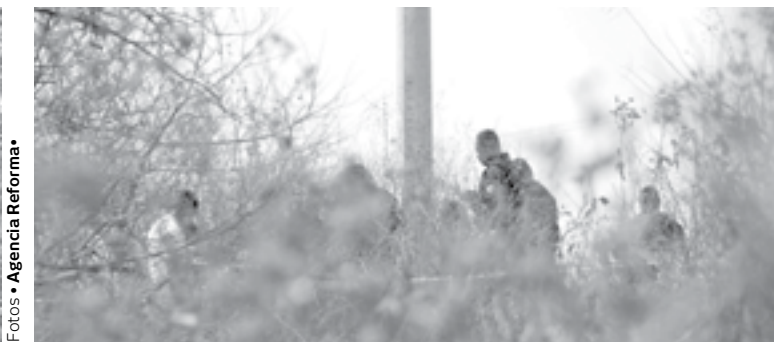
LOS HOMICIDIOS se registraron entre la tarde del viernes y la mañana del sábado.