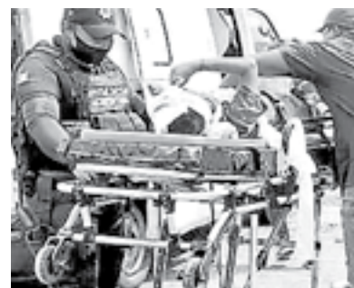
TRIPULANTES de la camioneta resultaron heridos.